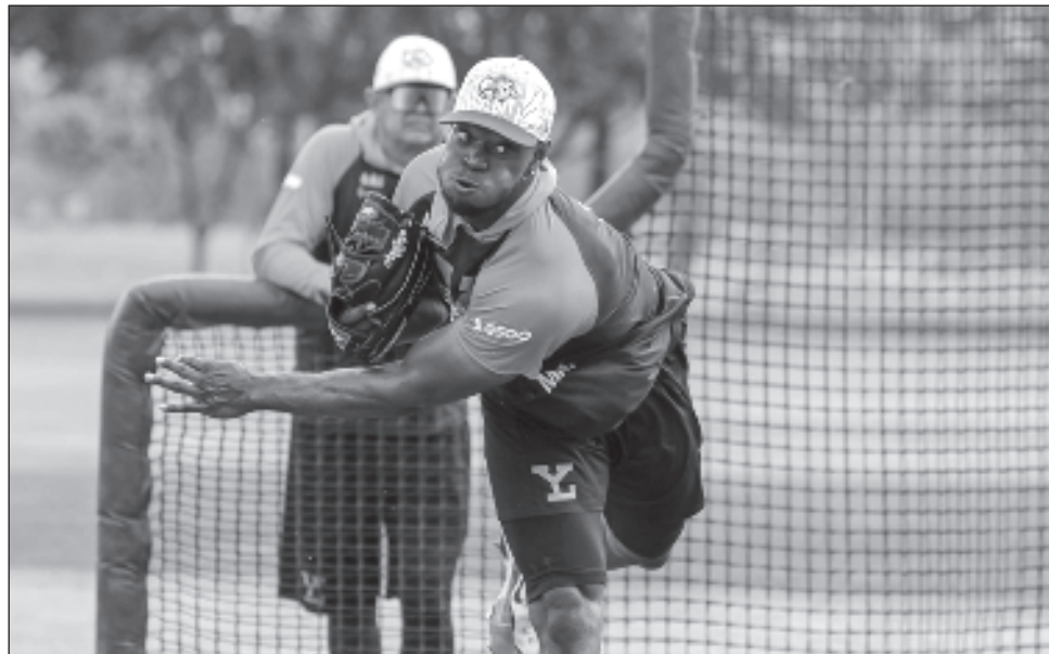
▲ CD Pelham impresionó durante un "live bp" el martes en la Universidad Modelo.

El ex "big leaguer" Héctor Velázquez, quien desde el arranque del minicampamento estaba prácticamente listo luego de lidiar con problemas físicos el año pasado, abrirá por los rugidores. La Modelo enviará a la loma a un refuerzo, el zurdo