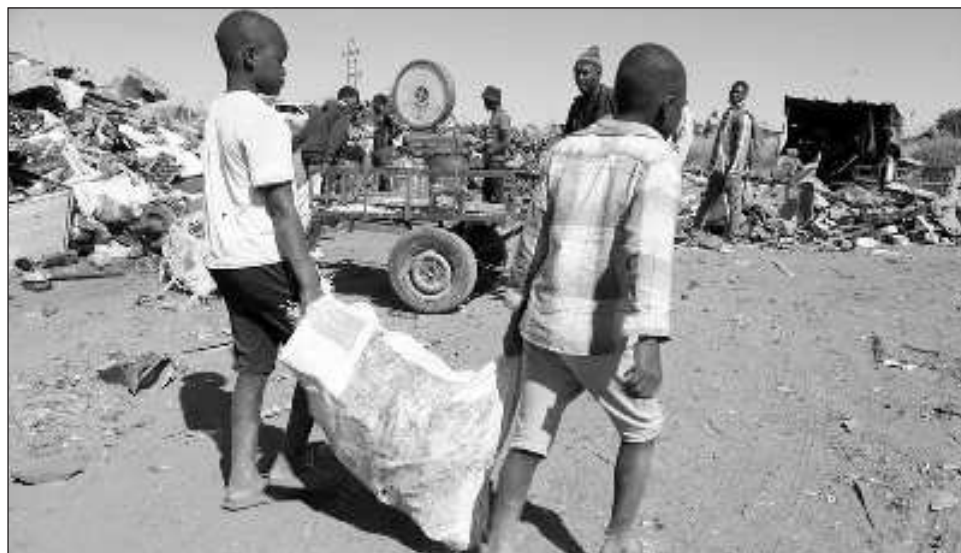
▲ La OIT define el trabajo forzoso como un trabajo impuesto contra la voluntad del empleado y exigido bajo castigo o amenaza; puede ocurrir durante la contratación, en las condiciones de vida asociadas al empleo o al obligar a alguien a quedarse cuando quiere marcharse.

Los datos de 2021, el año más reciente cubierto en el detallado estudio internacional, suponían un incremento de 37 por ciento, o 64 mil millones de dólares, en comparación con la estimación previa de una década antes, según la Organización Internacional del Trabajo. Eso se debe tanto a que hay más personas explotadas como a que cada víctima genera más dinero, según la OIT.