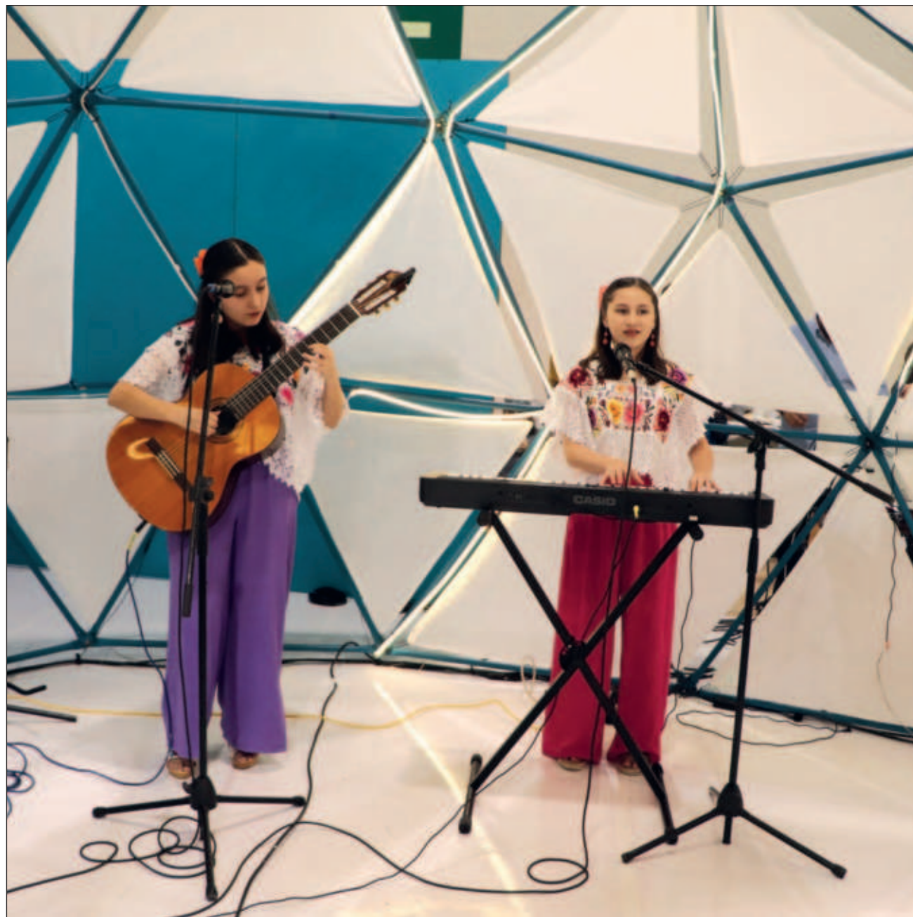
▲ "Es necesario seguir proponiendo eventos, abrir nuevos espacios para que los artistas promuevan su trabajo de trova tradicional y contemporánea, es importante crear escuelas para que no se muera la tradición", opinan las talentosas jóvenes.