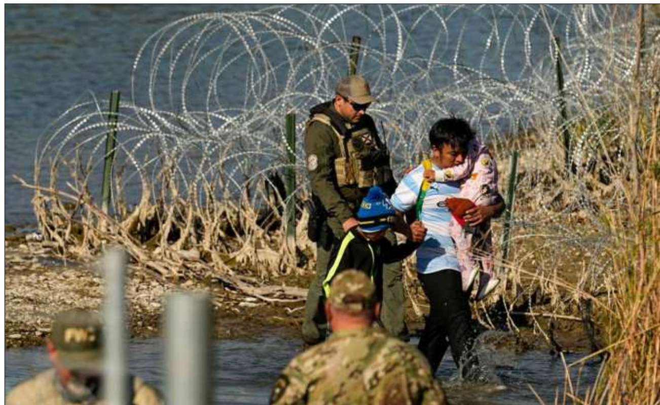
▲ El ex canciller mexicano, Marcelo Ebrard Casaubón, puntualizó que la decisión tomada por la Suprema Corte estadounidense "es el mayor retroceso en materia de derechos humanos en los Estados Unidos en lo que va del siglo".

El ex canciller de México, Marcelo Ebrard, criticó esta tarde la decisión de la Suprema Corte