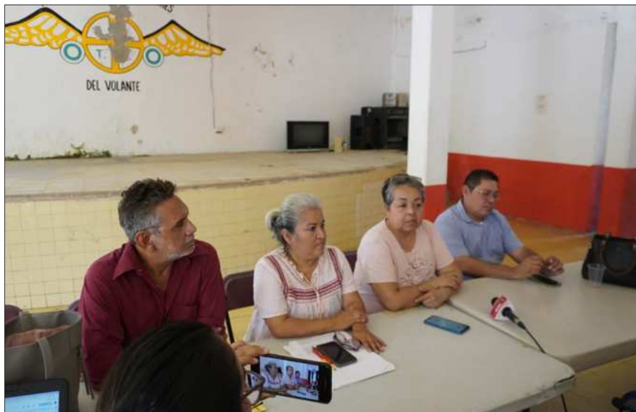
▲ Los miembros del frente destacaron que desde el cambio de administración, en el IET les exigieron cambiar la tonalidad del rojo en los taxis, pasando algunas de rojo vivo a tono vino, como los colores institucionales de Morena.

Aseguraron que en algunos trámites que ellos hacen les piden respaldar al partido en el poder, y que desde ahora han comenzado a presionar con el tema de la publicidad de los candidatos, pidiéndoles rechazar a los aspirantes de partidos contrarios a Mo-