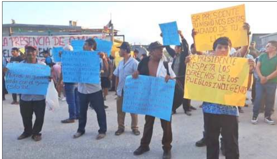
▲ Más de 600 ejidatarios inconformes inhabilitaron este martes el acceso al banco de materiales y las obras del proyecto ferroviario que se ubica camino a la comunidad de Chumpón, en el municipio Felipe Carrillo Puerto. Foto captura de pantalla

Tras ello, se acordó paralizar protestas hasta el 2 de marzo, siendo este el plazo dado por la autoridad para