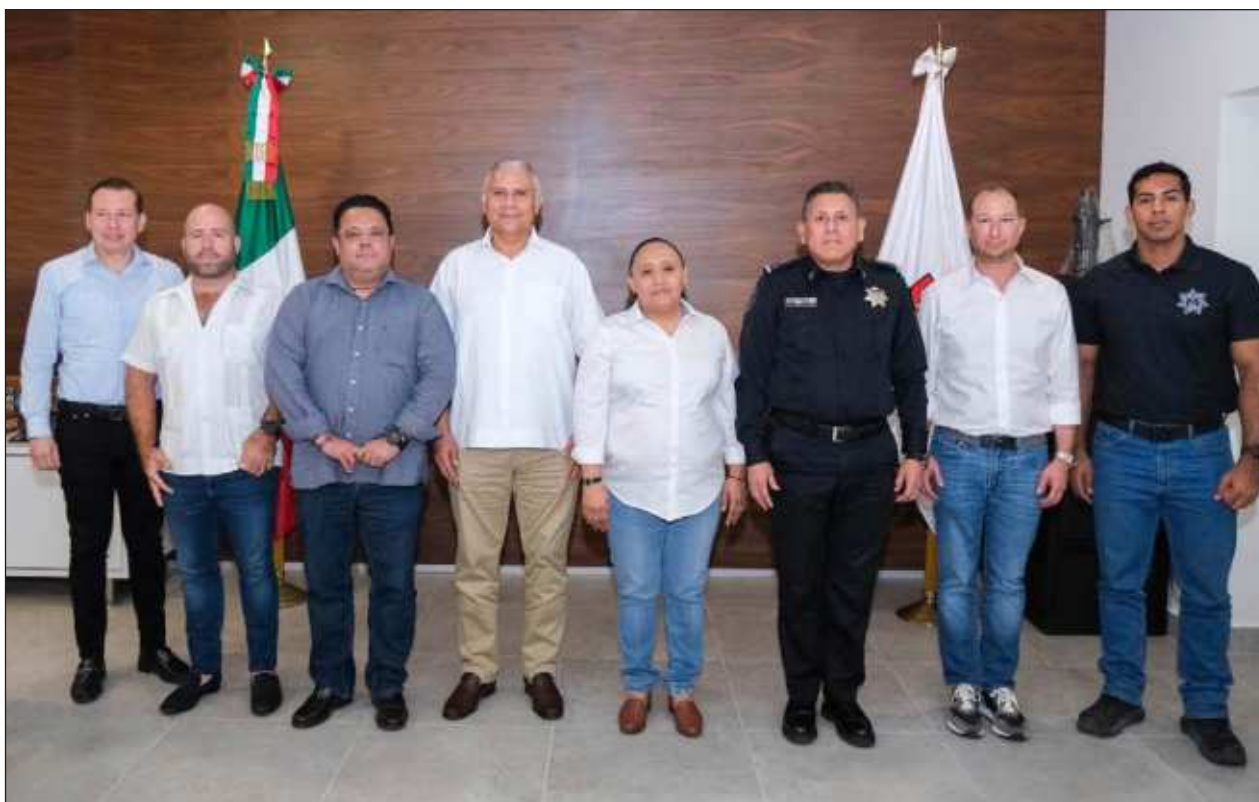
▲ Organizaciones como la Coparmex exigieron medidas para recuperar la seguridad local.

Morena, el Verde Ecológico, Partido del Trabajo, el de la Revolución Democrática, Más Apoyo Social y el Revolucionario Institucional no dieron a conocer a sus aspirantes a una diputación plurinomial al cierre de edición.