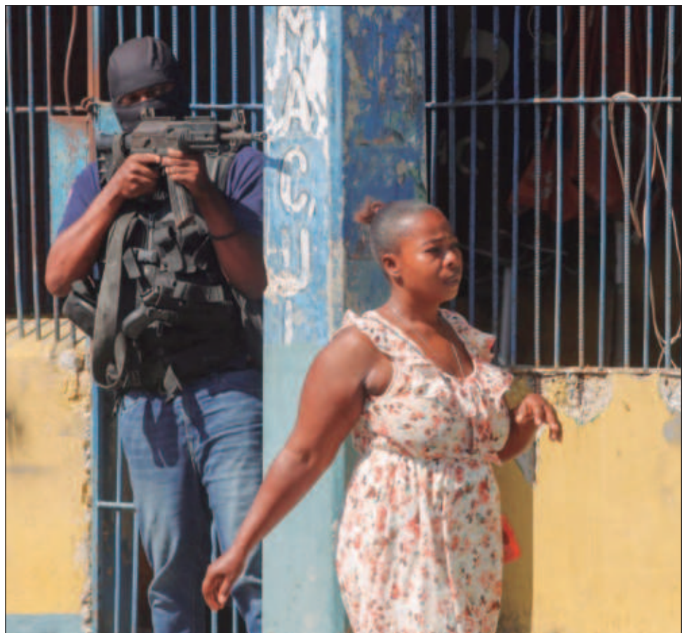
▲ Grupos armados iniciaron los ataques a la capital Puerto Príncipe mientras el primer ministro se encontraba en un viaje oficial en Kenia para pedir apoyo.

Henry, quien no ha podido regresar a Haití desde un viaje oficial al extranjero debido a que la constante violencia de pandillas mantiene cerrado el principal aeropuerto internacional del país, ha prometido renunciar una vez que se cree el consejo de transición. Él se encontraba en un viaje oficial en Kenia para presionar por el despliegue de una fuerza policiaca y respaldada por la ONU iniciaron los ataques.