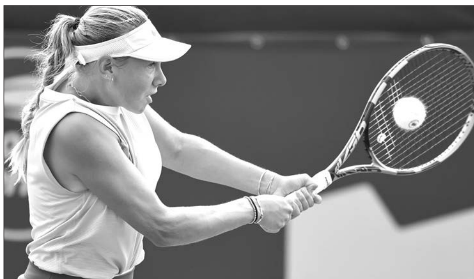
▲ Amanda Anisimova, quien conquistó el Mundial Juvenil Yucatán hace seis años, se instaló en la tercera ronda del Abierto de Australia, luego de vencer a Belinda Bencic, la jugadora 22 en la siembra.

Osaka ganó el Abierto de Australia el año pasado, su cuarto cetro del "Grand Slam", pero después se retiró de Roland Garros y no asistió a Wimbledon para tomarse un descanso por salud mental. Después fue eliminada al principio del Abierto de Estados Unidos.