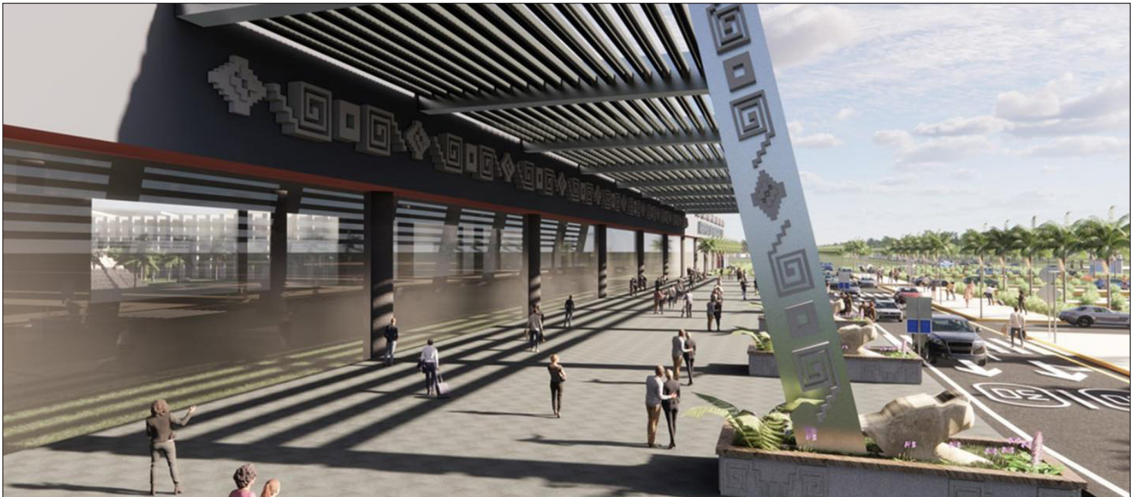
▲ La construcción, a cargo de la Sedena, iniciará una vez que termine la edificación de la terminal aérea de Santa Lucía, en la capital del país.