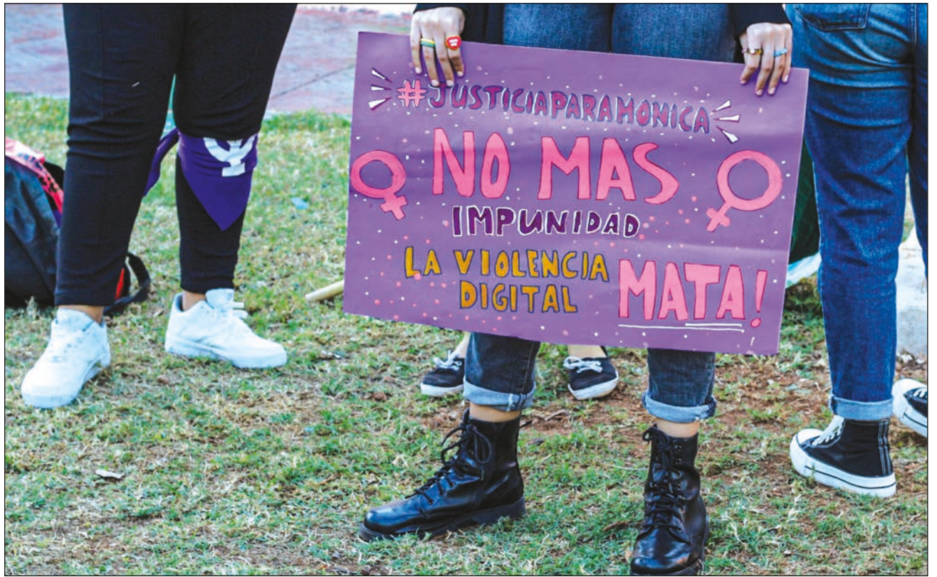
▲ Tu k'iinil jo'oljeake', ya'abach ko'olelo'ob tu much'ajubáajo'ob ti' chíik'ulal ts'a'aban tu noj kaajil Jo', ti'al u k'áatiko'ob ka ch'éenek u loobilta'al ko'olel ti' kúuchilo'ob je'el bix Internet.

Ba'ale' loobilaj ku beeta'al ti'e', k'ucha'an tak ti' u láak'tsiló'obi, "ma' tán u ts'o'okol ba'ax ku beeta'al ti',