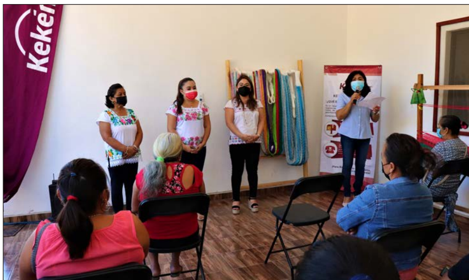
▲ Además del taller de urdido, Kekén promueve en diversas comunidades capacitaciones gratuitas relacionadas con la producción de miel de abeja melipona.

Con la puesta en marcha de este esquema, la empresa con más de 7 mil colaboradores en la entidad alcanzó la activación de 30 grupos beneficiados en temas de desarrollo productivo local