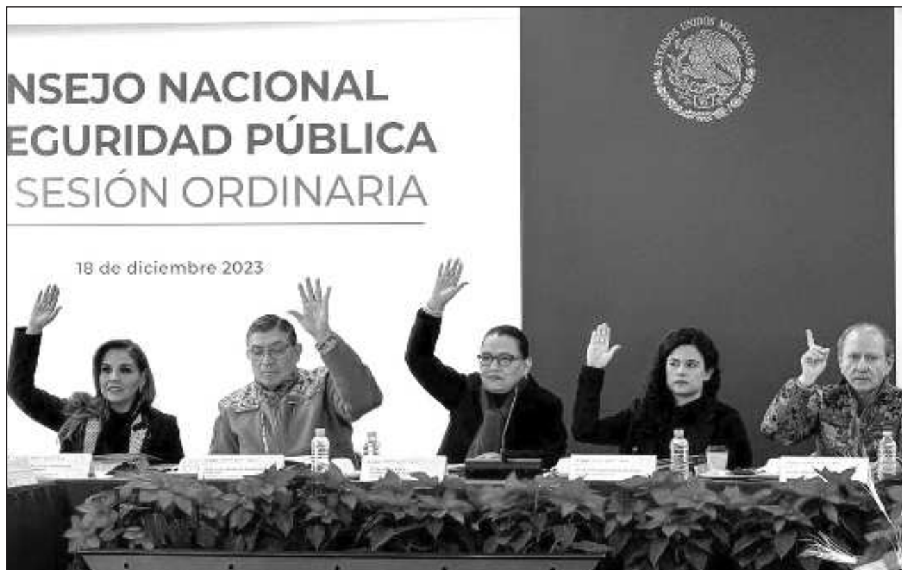
▲ Durante la XLIX Sesión Ordinaria del consejo de Seguridad Pública, en Palacio Nacional, la gobernadora Mara Lezama reiteró la importancia de atender los orígenes de la violencia y criminalidad.

Durante este marco la gobernadora destacó que en Quintana Roo a través del Nuevo Acuerdo por el Bienestar y Desarrollo de Quintana Roo se trabaja de la mano de los ciudadanos en la construcción de la