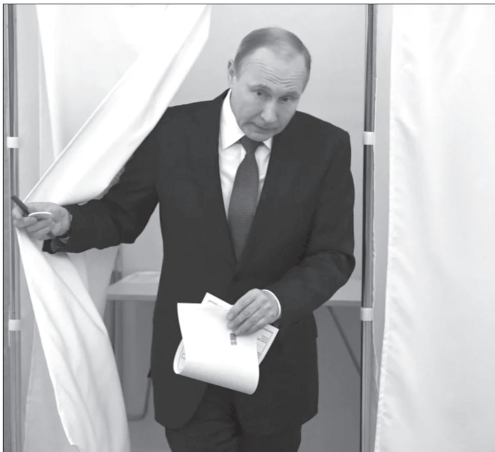
▲ De acuerdo con las encuestas oficiales de los últimos días, 80 por ciento de los rusos aprueba la gestión de Vladímir Putin, que dirige este país desde el año 2000.

La oposición al Kremlin considera que las elecciones serán un referéndum sobre la actual guerra, en la que Rusia no ha logrado los objetivos que se marcó en febrero de 2022 y habría sufrido, según Occidente, más de 300 mil bajas, entre muertos y heridos.