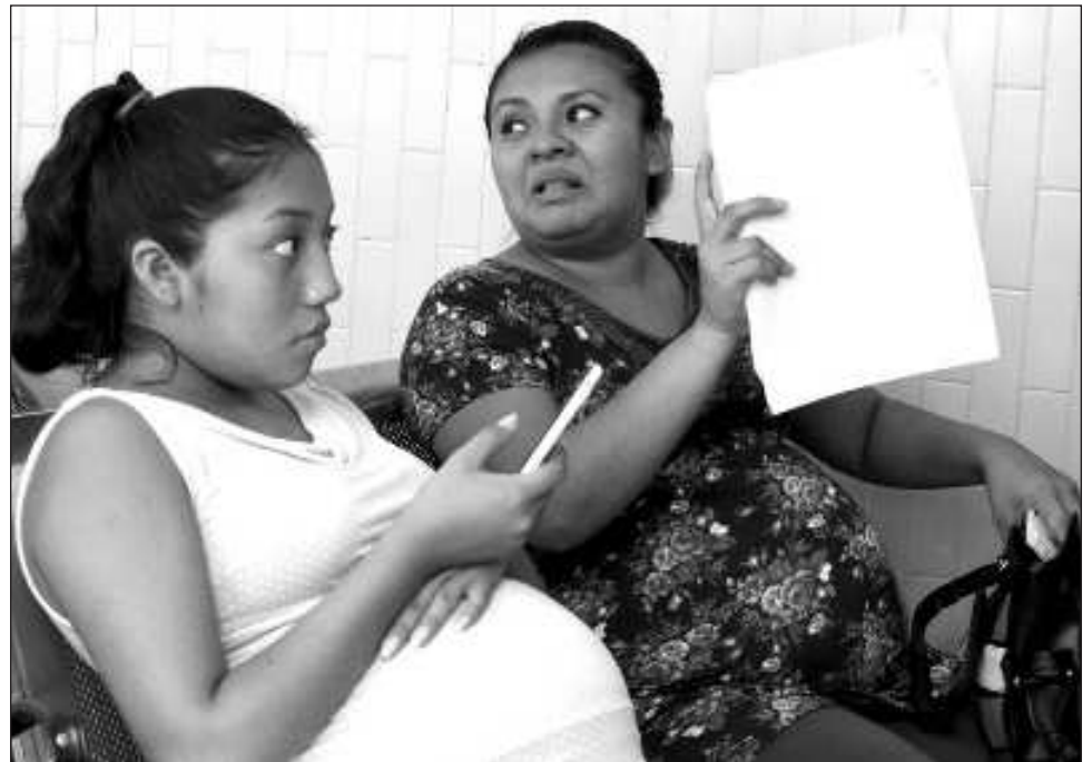
▲ Las autoridades campechanas han ejecutado 99 metas de trabajo para la erradicación del embarazo infantil y la disminución del embarazo en adolescentes.

En la sesión ordinaria y ante 33 enlaces institucionales del ámbito estatal y federal, el Instituto de la Mujer del Estado de Campeche quien funge como secretaria técnica del GEPEA, presentó las Acciones del Fondo para el Bienestar y el Avance de las Mujeres (FOBAM) 2023, en el que se destaca la ejecu-