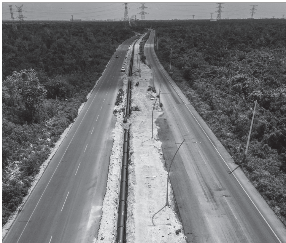
▲ Cada vez son más los países que recurren a esquemas de asociación público-privada para garantizar servicios como el agua potable.

En el caso de Aguakan la transparencia es doble, pues existe un contrato de concesión que se audita y vigila, con montos definidos para reinversión que se cumplen y, en el caso de Solidaridad, incluso se superan. Además, por ser empresa que cotiza en la Bolsa Mexicana de Valores, de manera periódica se dan a conocer los ingresos, que a su vez sirven para mejorar y ampliar el servicio de agua potable.