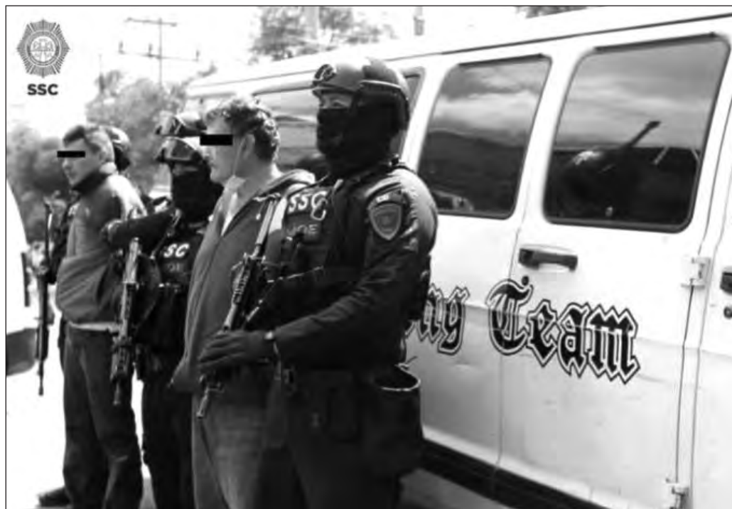
▲ La mañana de este sábado fueron detenidos dos sujetos que, de acuerdo con cámaras de vigilancia, participaron en la descarga de las bolsas con los medicamentos robados.

El día 7 de este mes, la empresa Novag Infancia notificó a la Comisión Federal para la Protección contra Riesgos Sanitarios (Cofepris) que le fueron robados 37 mil 967 medicamentos utilizados para el tratamiento del cáncer en niños. La madrugada del viernes 16, un ciudadano denunció que varios sujetos a bordo de una camioneta color blanco dejaron bolsas de basura sobre la banqueta en calles de la colonia Trabajadores, en la alcaldía Azcapotzalco. Al inspeccionar las 27 bolsas abandonadas, elementos de la Secretaría de Seguridad Ciudadana (SSC) de la Ciudad de México y paramédicos del Escuadrón de Rescate y Urgencias Médicas (ERUM) descubrieron que contenían cajas de Fluorouracilo y Ciclofosfamida, dos de los fármacos sustraídos a Novag. Por la tarde, se confirmó que en las bolsas había 8 mil 144 cajas con cinco tipos de fármacos, y que sus números de lote coincidían con los reportados por robo nueve días antes.