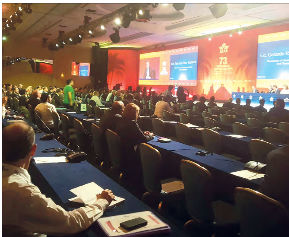
▲ La pandemia de COVID-19 ha representado un reto tecnológico para la realización de eventos.