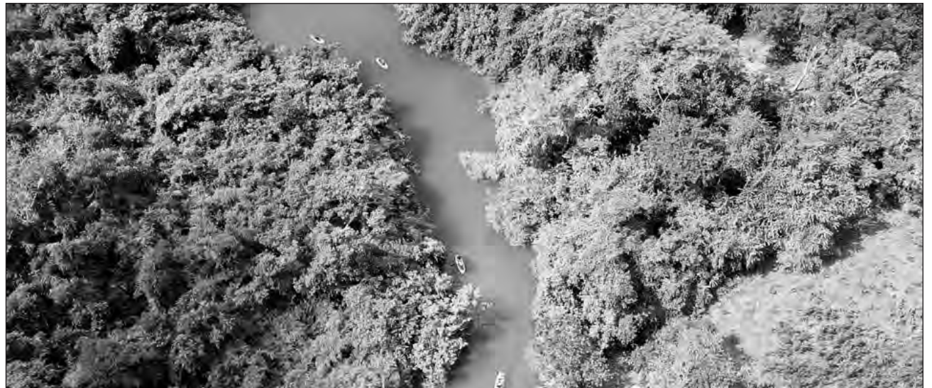
▲ La dirección municipal de turismo busca “darle un empujón” a la ruta de balnearios de la Ribera del Río Hondo.

Dijo que la nueva normalidad obliga a las autoridades a trabajar en promoción digital, por lo que han hecho videos de Mahahual, Xul-Ha, Huay Pix y Chetumal en coordinación