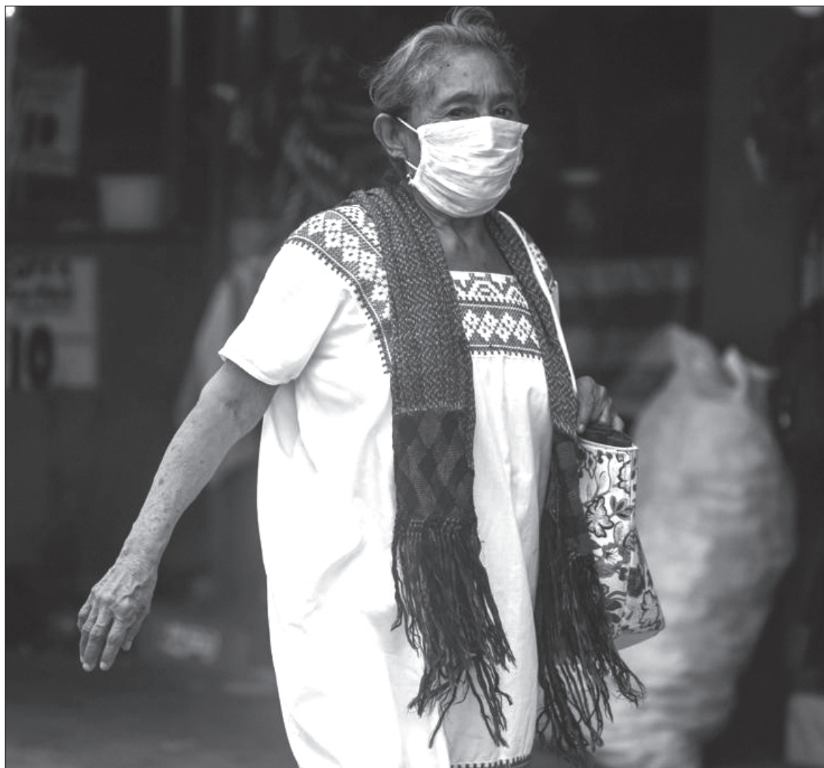
▲ Si deseamos generar una política que garantice la seguridad alimentaria en la entidad, es menester fortalecer las cadenas de distribución de los productos yucatecos hacia los mercados nacionales, internacionales, y durante la pandemia, principalmente hacia los locales.

La participación de Yucatán en las actividades económicas por sector en el PIB se distribuye como sigue: 3.8 primarias, 26.8 secundarias y 69.4 terciarias. Aunque es notorio el rezago del sector primario, la aportación de la entidad al volumen nacional destaca