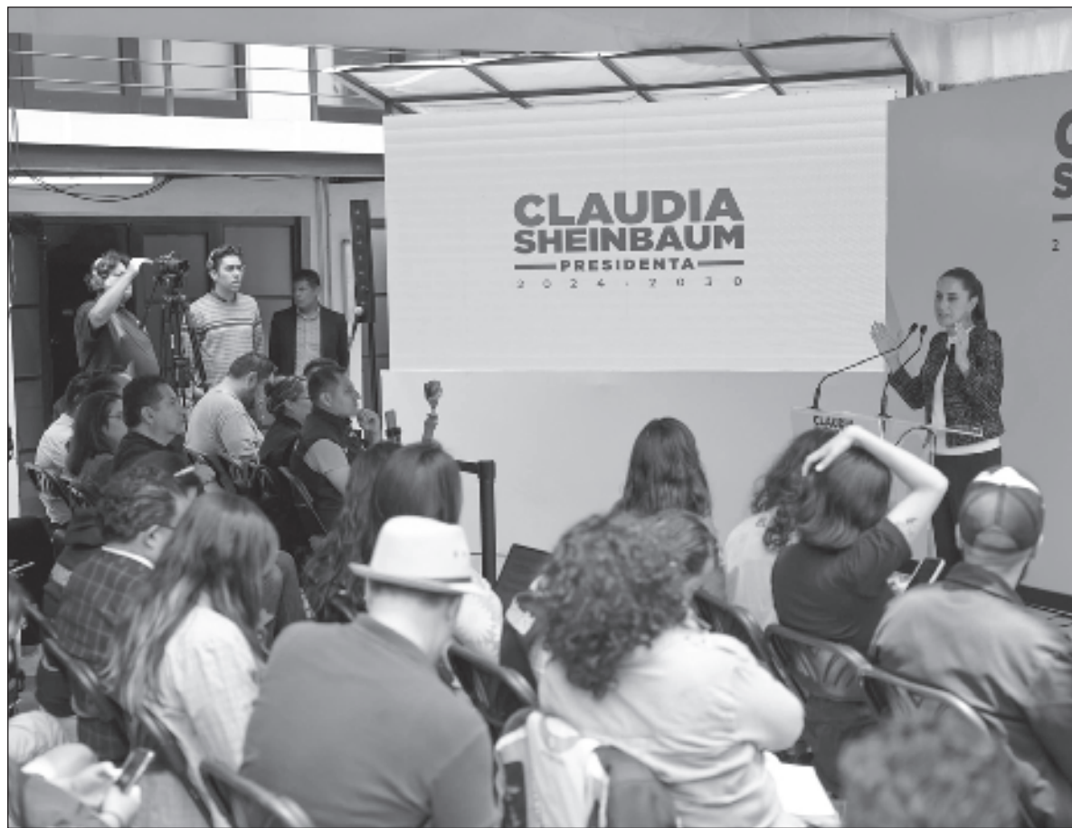
▲ “Sheinbaum, ayer (martes), en conferencia de prensa: ‘Hay esta idea de que, a mí me da risa, la verdad: primero, de que va a continuar él; todos sabemos que él se retira de la vida pública y va a tener las tareas que él ha decidido, que es escribir este libro, que también si lo ven, pues es una tarea política hasta cierto punto’”.

PODEROSO JEFE POLICIACO que fue durante todo el sexenio de Calderón (quien dice nunca haberse enterado de lo que realizaba su virtual vicepresidente de recaudaciones y ejecuciones), García Luna ha hecho que uno de sus abogados enviara a diversos periodistas un texto escrito de puño y letra, con pretensiones de exculpación propia pero, sobre todo, con el mensaje de clara intención mediática de