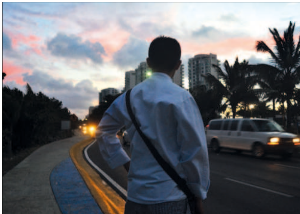
▲ De acuerdo con el Centro de Integración Juvenil de Cancún, hasta 70% de los trabajadores no atiende su salud mental, principalmente por falta de tiempo.

“A través de las pláticas (como las que ofrece el CIJ en