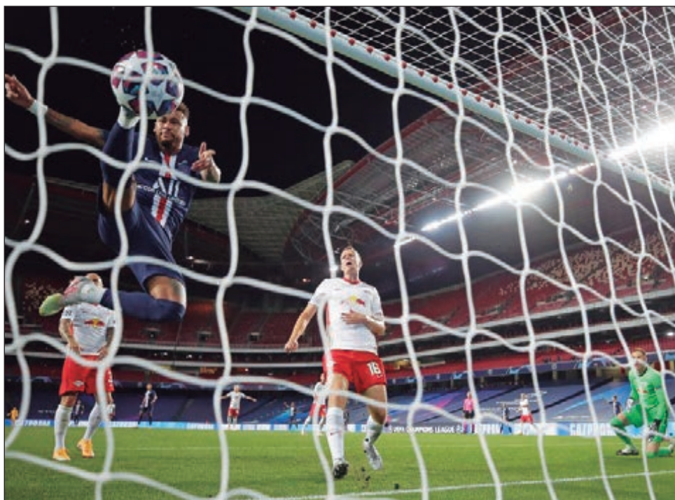
▲ El brasileño Neymar, del París Saint-Germain, se estira en busca de un balón que su compañero Juan Bernat envió a las redes, en la semifinal de ayer.

Dominante en Francia desde hace tiempo, el PSG tenía la mira puesta en otros objetivos. La meta principal de sus dueños qataríes ha