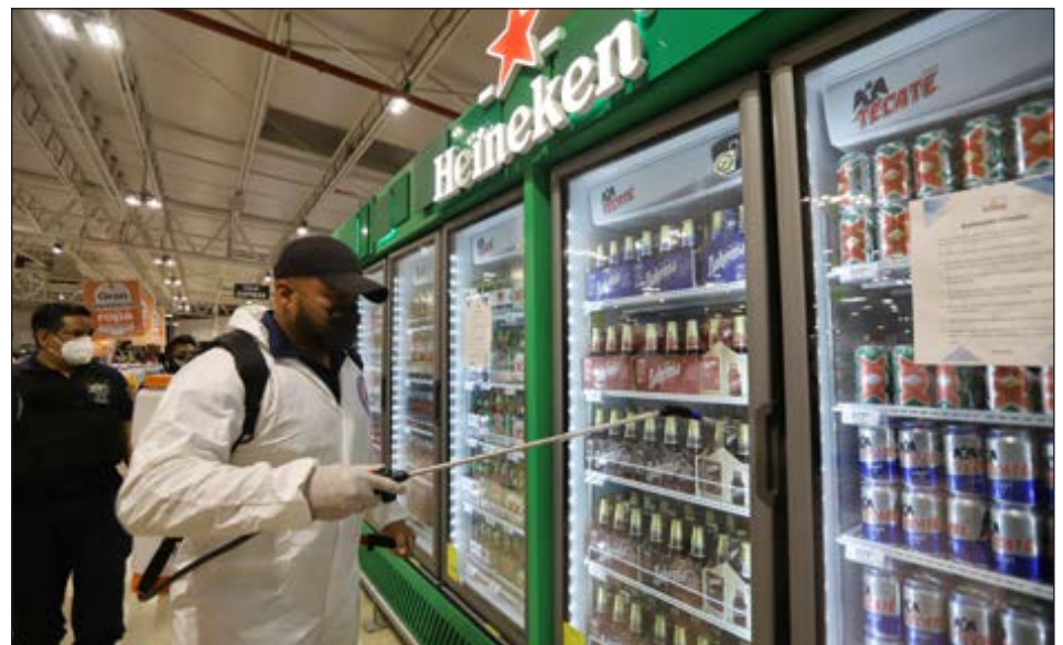
Playa del Carmen, 2020