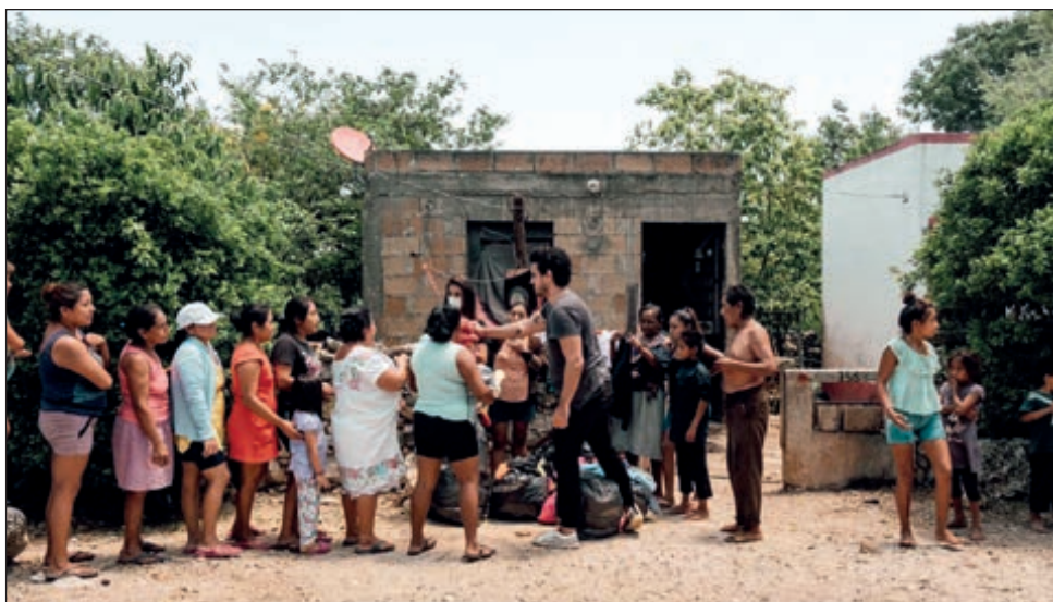
▲ Los integrantes de Proyecto Causa han donado ropa, alimentos y víveres en más de 10 comunidades del interior del estado.