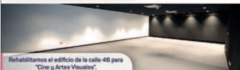
Rehabilitamos el edificio de la calle 46 para "Cine y Artes Visuales".