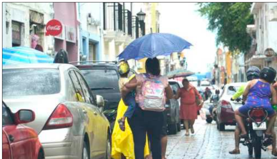
▲ Las dependencias que continuaron con sus labores fueron las dedicadas a la atención de Protección Civil, Seguridad Pública, Fiscalía General del Estado y Salud.

En el Poder Legislativo, lo único que el Congreso del Estado sesionó fue respecto con a la ley de Revocación de mandato en la entidad;