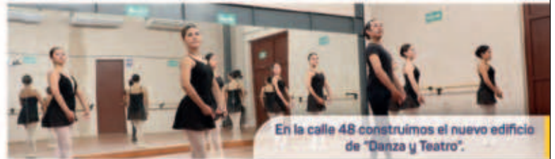
En la calle 48 construimos el nuevo edificio de "Danza y Teatro".