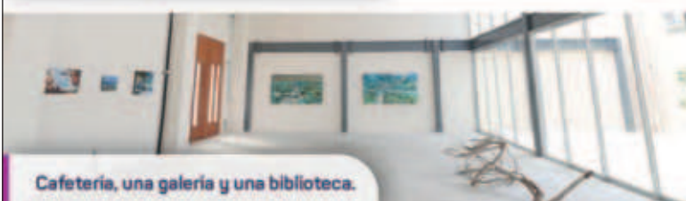
Cafetería, una galería y una biblioteca.