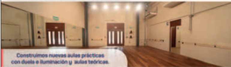
Construimos nuevas aulas prácticas con duela e iluminación y aulas teóricas.