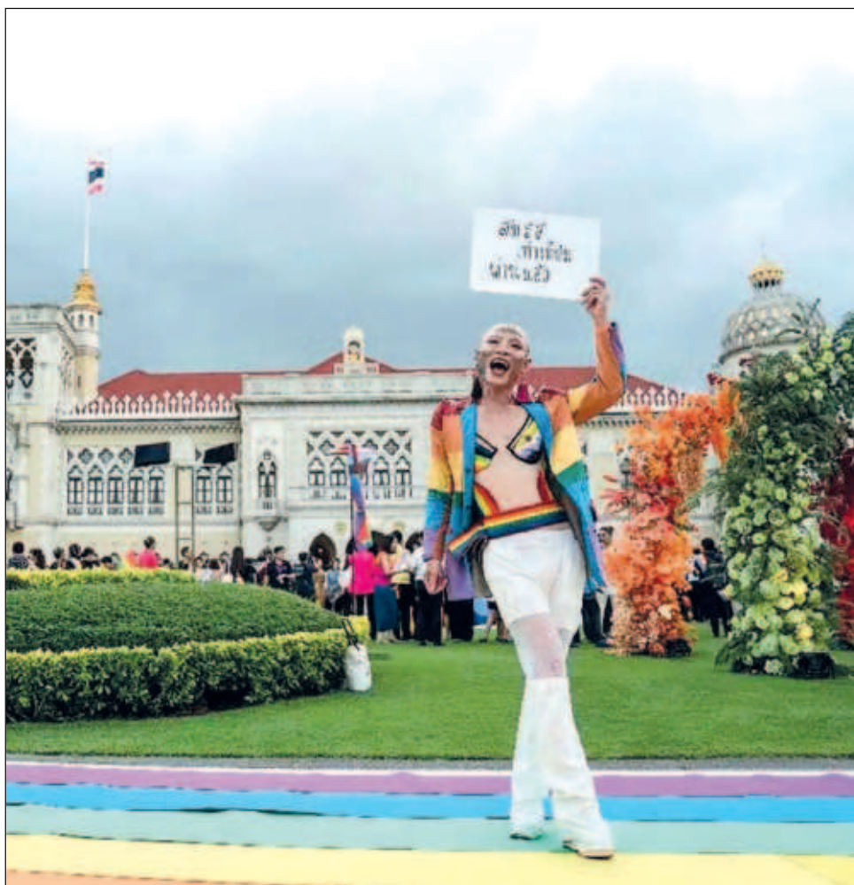
▲ Tras la aprobación de la ley, los activistas de la comunidad LGBTTTI+ esperan que sea posible celebrar los primeros matrimonios igualitarios en el reino en octubre.

Además, le otorga a las parejas homosexuales los mismos derechos que a las heterosexuales en materia de adopción y herencia.