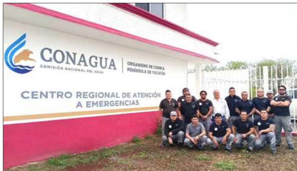
▲ El equipo del Centro Regional de Atención de Emergencias se turna para tener una cobertura 24/7, principalmente durante la época de ciclones tropicales.

“La coordinación con los órganos de Protección Civil es