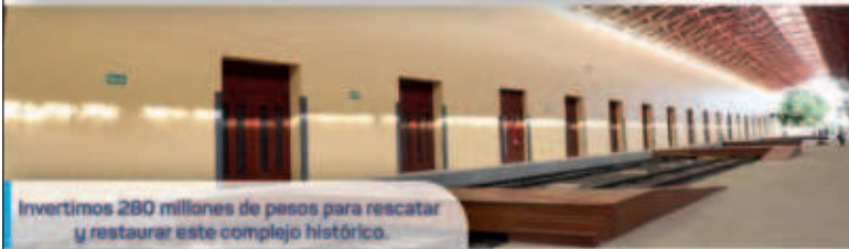
Invertimos 260 millones de pesos para rescatar y restaurar este complejo histórico.