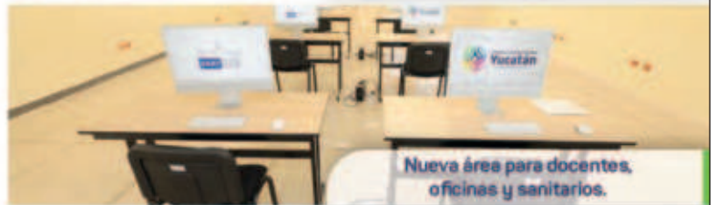
Nueva áreas para docentes, oficinas y sanitarios.