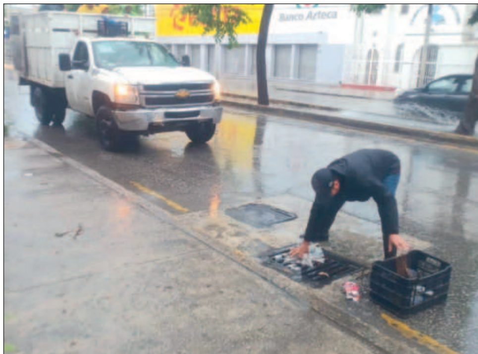
▲ Las afectaciones por el potencial ciclón tropical número uno, en el Golfo de México, alcanzaron los municipios de Benito Juárez, Solidaridad e Isla Mujeres.

Mientras que en Playa del Carmen se reportan caída de árboles, desprendimiento de láminas de zinc que servían como techos de viviendas y encharcamien-