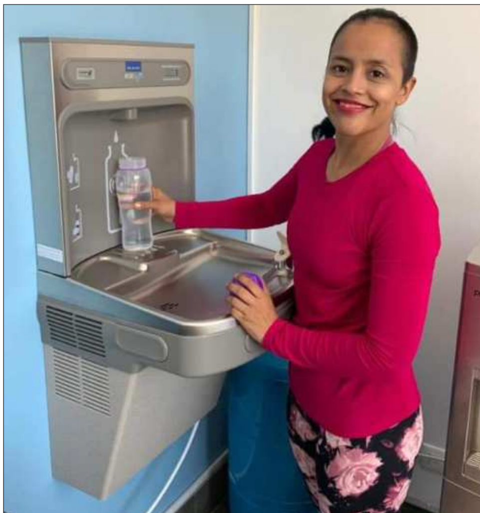
▲ Con más de 15 años en el mercado, además de 30 franquicias, Cancún se convierte en la número 35. Es una empresa nacional que se dedica a la purificación del agua y que, básicamente, se encarga de generar el agua purificada en el lugar donde se consume.

“Iremos poco a poco tratando de convencer a los hoteles, a los usuarios, a las residencias, en donde hay un ahorro económico, partamos de ahí y segundo, pues creo que es bien importante