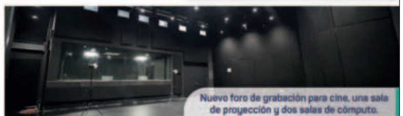
Nuevo foro de grabación para cine, una sala de proyección y dos salas de cómputo.