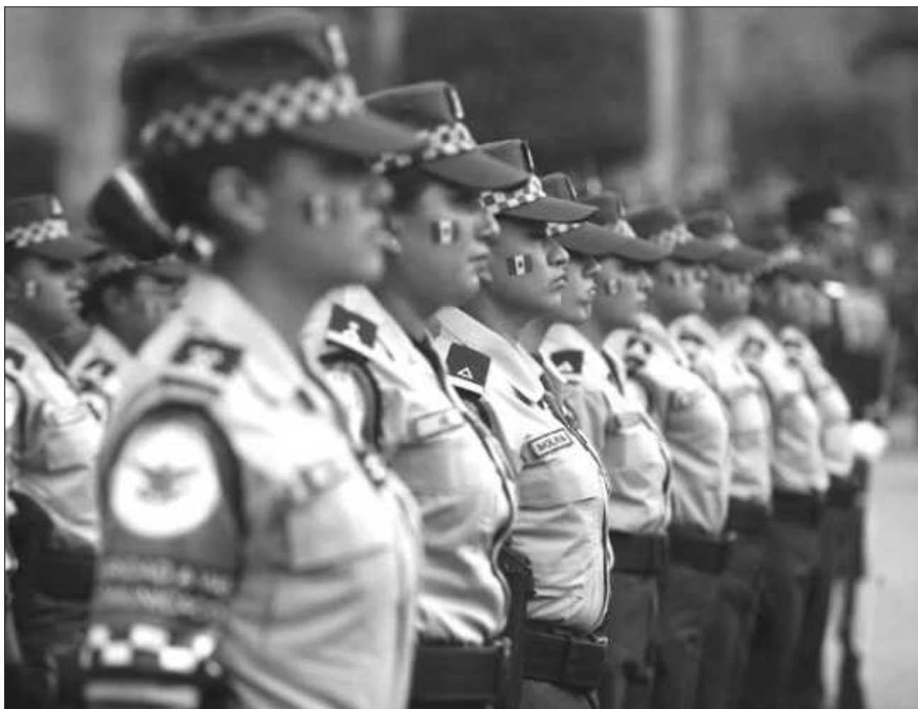
▲ Ante pregunta al respecto durante la conferencia de prensa diaria, el mandatario respondió: “Veo a Claudia (Sheinbaum) muy fuerte, pero además (las fuerzas armadas) son muy leales, disciplinados, tanto en la Marina como en la Defensa”.