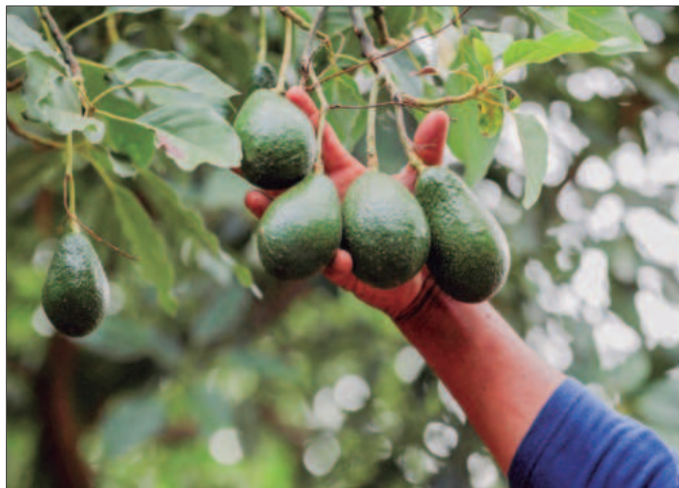
▲ El embajador de Estados Unidos, Ken Salazar, confirmó este martes de la suspensión que se mantendrá hasta que se hayan resuelto los problemas de seguridad.

Afirmó que esta pausa no afecta a otros estados mexicanos, donde continúan las inspecciones del APHIS, ya que esta acción no bloquea todas las exportaciones de aguacates o mangos a Estados Unidos, ni detiene los