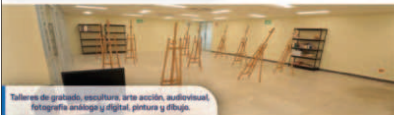
Talleres de grabado, escultura, arte acción, audiovisual, fotografía analógica y digital, pintura y dibujo.