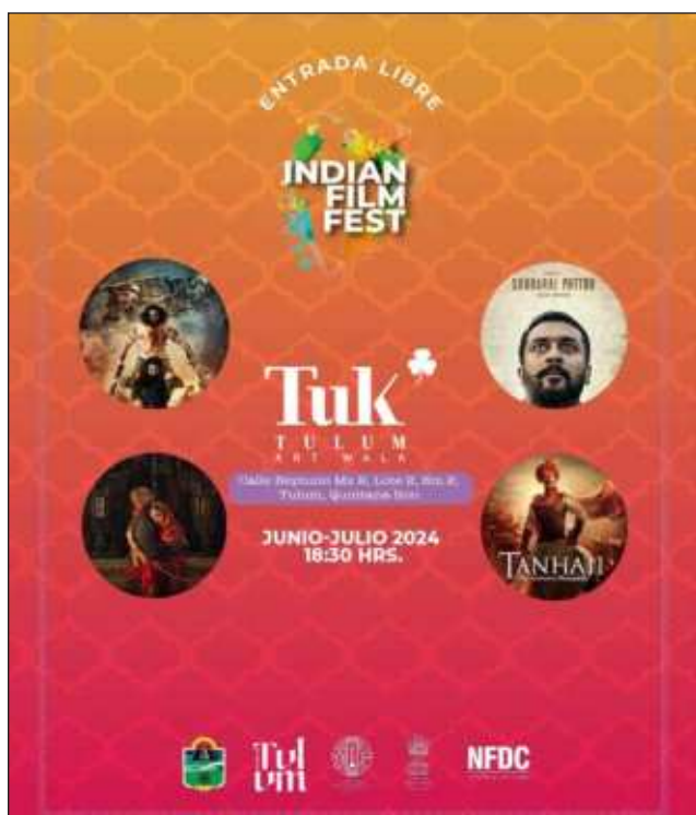
▲ Las cintas seleccionadas son RRR , Soorai Pottru , Bajirao Mastani y Tanhaji: The Unsung Warrior . Foto cartel promocional

El festival cinematográfico se llevará a cabo en la plaza Tuk, municipio de Tulum