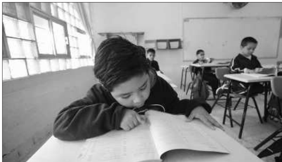
▲ En el caso de los estudiantes mexicanos, obtuvieron más de 4.5 puntos más de lo esperado en el pensamiento creativo, una gran ventaja de rendimiento relativo.

Si bien los resultados revelan que los sistemas educativos que obtuvieron puntuaciones altas en pensamiento creativo "casi siem-