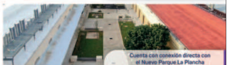
Cuenta con conexión directa con el Nuevo Parque La Plancha