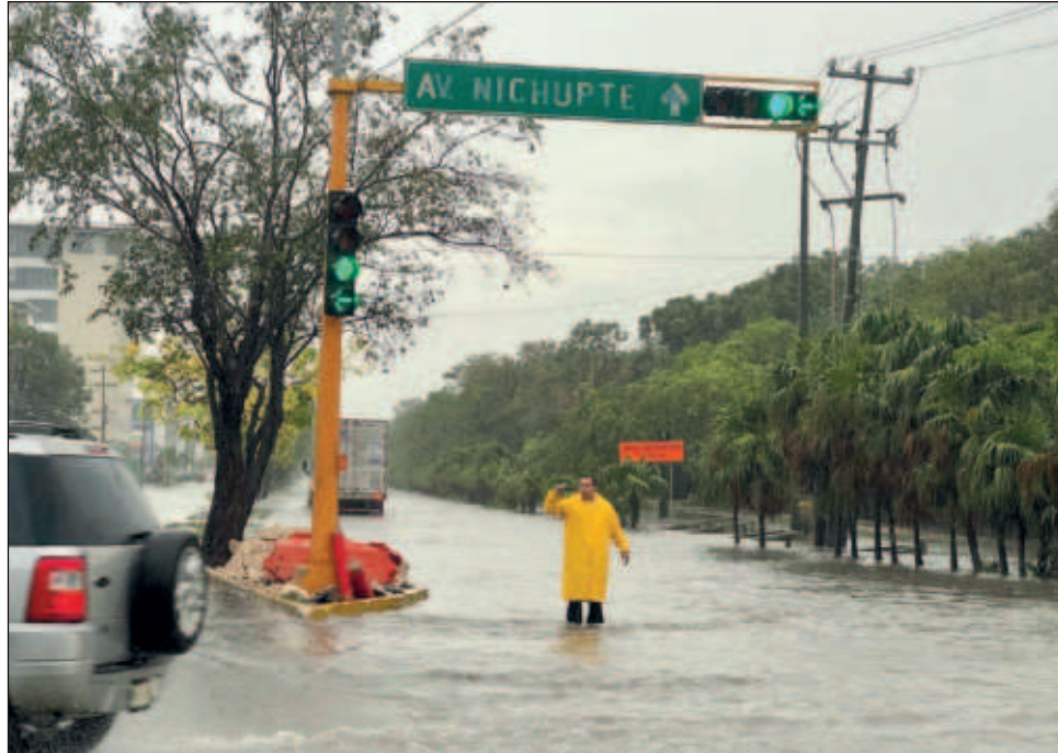
▲ El clima también ha ocasionado fallas en algunos semáforos, por lo que elementos de tránsito se encuentran en varios puntos para controlar la movilidad y evitar accidentes. Sin embargo, también han registrado algunos vehículos varados que no alcanzaron a superar grades encharcamientos.

El clima también ha provocado fallas en algunos semáforos, por lo que ele-