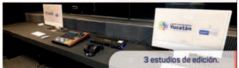
3 estudios de edición.