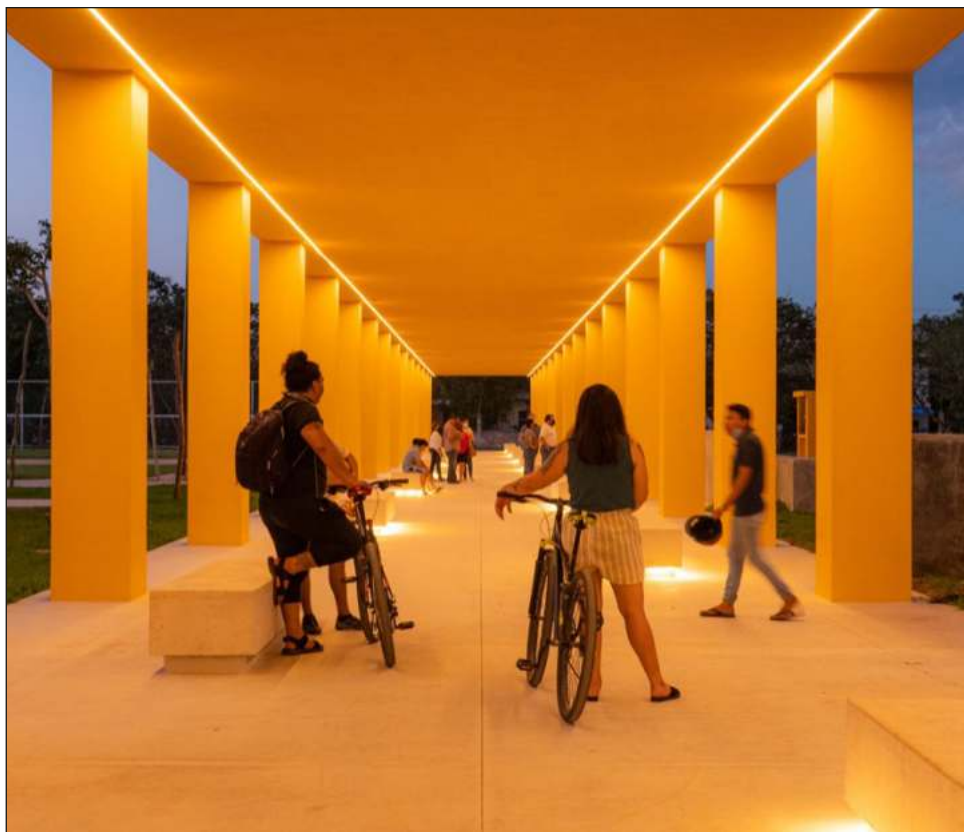
▲ Entre obras desarrolladas por la Sedatu entre 2019 y 2021 se cuenta la renovación del andador que lleva a la zona arqueológica de Kinich Kakmó.

Cabe señalar que a través del PMU, entre 2019 y 2021 se realizaron en Izamal más de mil 213 acciones de construcción, ampliación o mejoramiento de viviendas ubicadas en colonias marginadas en las que se invirtieron más de 63 mdp.