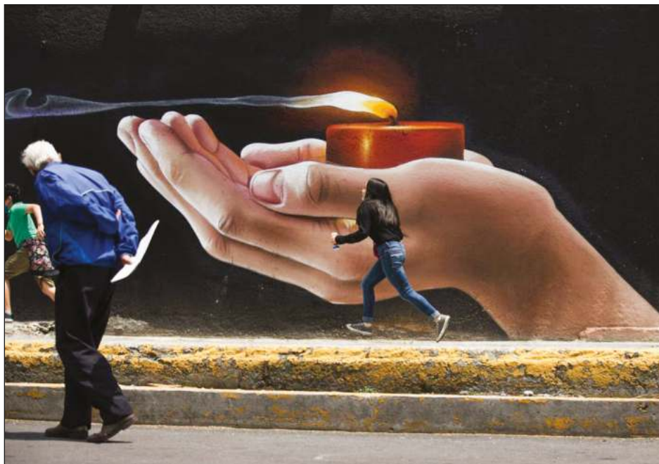
▲ Los países deben seguir los pasos del virus a través de un sistema de exámenes que permita determinar casos nuevos. En últimos meses, niveles de testeo han caído.

Del mismo modo, hay pasos hacia la creación de un tratado internacional de preparación ante pandemias o mecanismo equivalente, y para cambiar las regulaciones internacionales de salud con el fin de dar más autonomía a la OMS en caso de emergencia, pero no se espera que se apruebe todo ello antes de 2024.