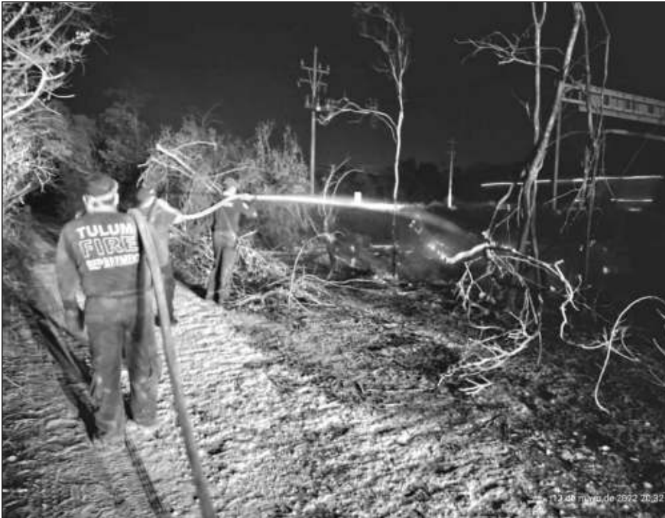
▲ Los incendios nombrados Jabalí, que se encuentra por Macario Gómez, y Maritez son los dos más riesgosos por la cercanía a la mancha urbana.