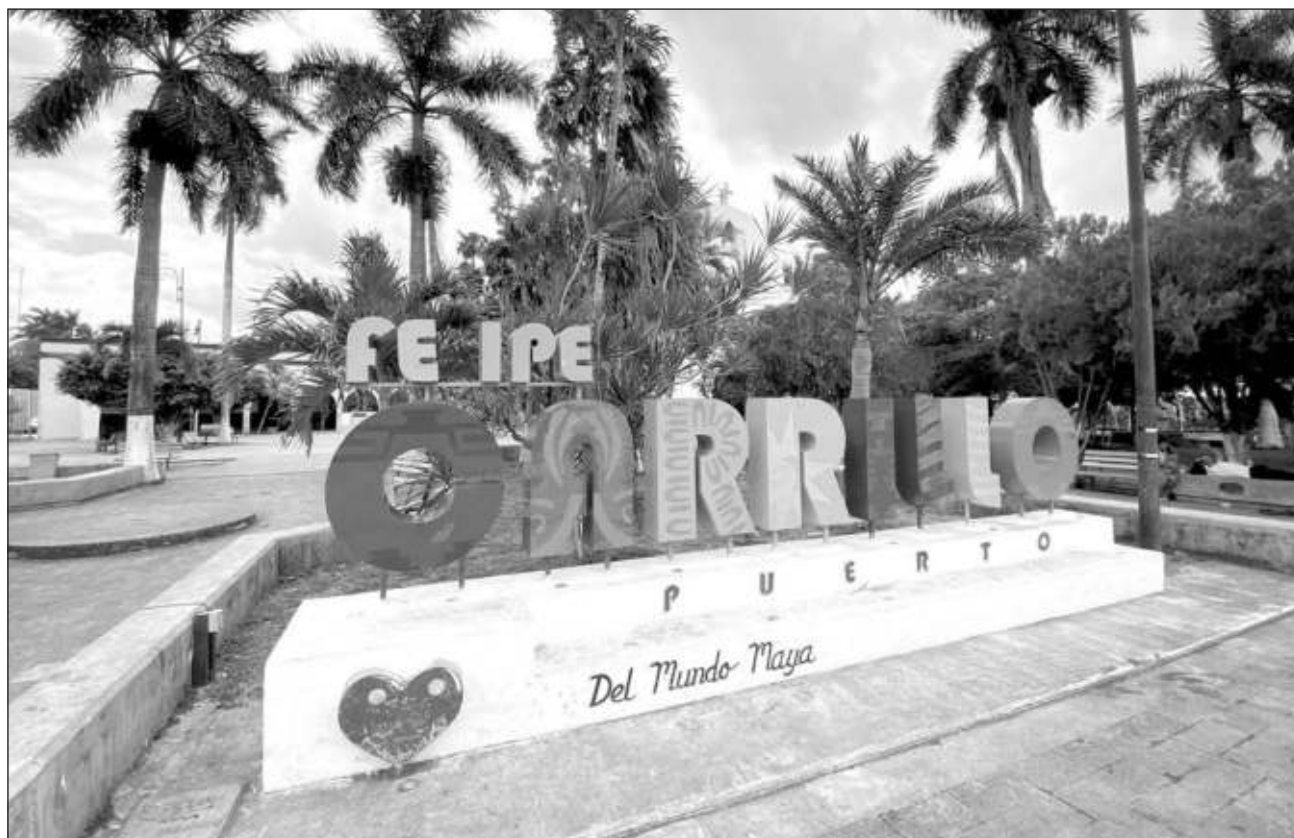
▲ San Silverio y Yalchén cuentan con 2 mil habitantes entre ambos y están ubicados a más de 80 kilómetros de la cabecera municipal de Felipe Carrillo Puerto; entre los dos tienen una superficie territorial de 180 hectáreas.

Sobre las repercusiones de este hecho, mencionó que causaría cambios en el pre-