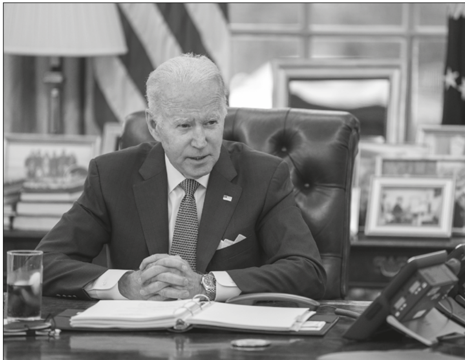
▲ El presidente de Estados Unidos, Joe Biden, tendrá que evaluar la invitación de todos los líderes del hemisferio a la IX Cumbre de las Américas. Foto captura de pantalla

Un tópico más fue el diálogo en torno al plan de acción de salud para la región. Esto, dijo Ebrard, para evitar que el continente se vea afectado con crisis sanitarias como la pandemia de Covid-19.