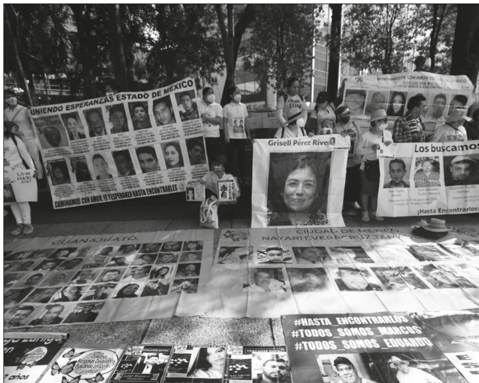
▲ El Presidente anticipó que la próxima semana acudirá el subsecretario de Derechos Humanos, Alejandro Encinas, a presentar un informe sobre desapariciones.

En respuesta a varias preguntas respecto a que el número de desaparecidos supera 100 mil personas, indicó que su gobierno se ha dedicado a buscar fosas clandestinas, pero también pidió “no olvidar que hubo una