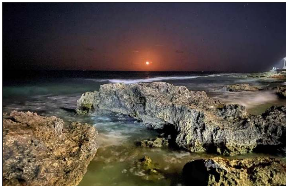
▲ El secretario general de la ONU, Antonio Guterres, advirtió que el mundo se acerca cada vez más a una “catástrofe climática” a raíz de un “sistema energético mundial que está roto”.

El informe confirma que los últimos siete años (2015-2021) han sido los siete años