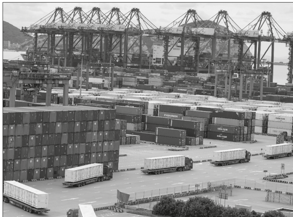
▲ El pronóstico de mediados de 2022 del Departamento de Asuntos Económicos y Sociales de la ONU dijo que la reducción en las perspectivas de crecimiento es de base amplia.

El informe llamado Situación y perspectivas de la economía mundial advirtió también que incluso el