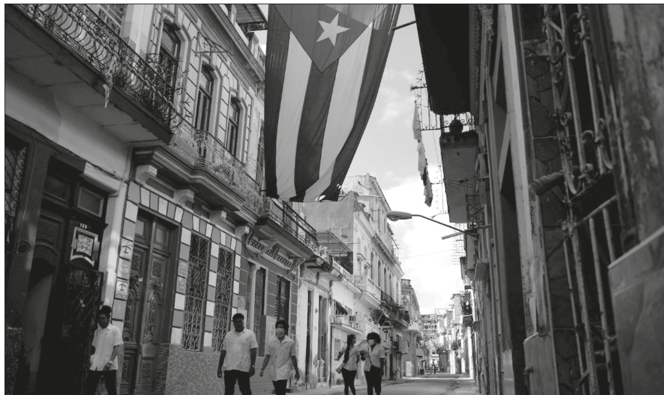
▲ De acuerdo con Carlos Fernández de Cossío, “aspectos esenciales del bloqueo” de Washington, como la inclusión de Cuba en la lista de los países terroristas, tienen un gran impacto práctico entre las sanciones que se aplican al país.

El gobierno de Biden anunció el lunes las primeras iniciativas desde que asumió en dirección a un acer-