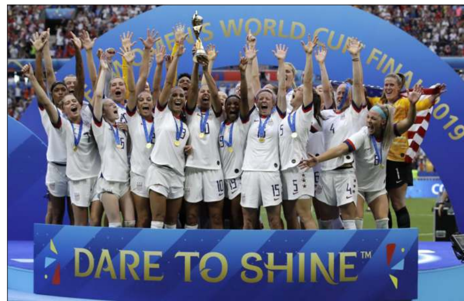
▲ La selección estadounidense conquistó el mundial hace tres años en Francia.

Los acuerdos son el fruto de años de protestas de las integrantes del laureado seleccionado femenino. Con sus estrellas Alex Morgan y Megan Rapinoe a la cabeza, la lucha por la igualdad salarial fue más intensa durante la marcha a la conquista del título en el mundial de 2019. El clamor por el pago equi-