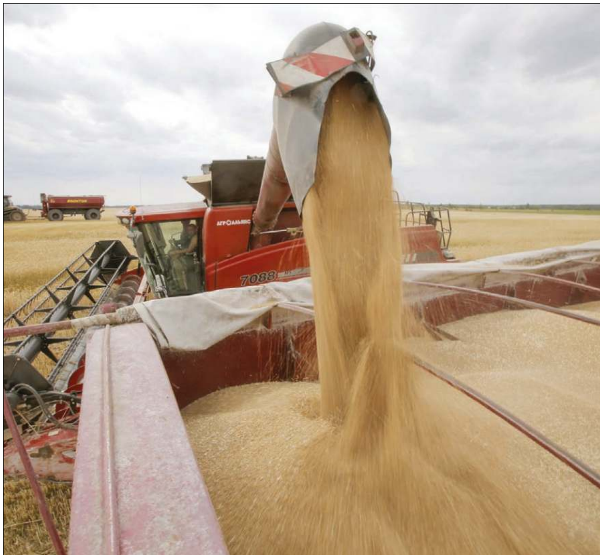
▲ “Rusia y Ucrania son conocidos como el granero de Europa : 29 por ciento del trigo que se consume a nivel global proviene de ambos países, así como 19 por ciento del maíz y 60 por ciento de aceite de girasol”.

RUSIA Y UCRANIA son conocidos como “el granero de Europa”, pero su aportación impacta al mundo porque además tienen muchos derivados. El 29 por ciento del trigo que se consume a nivel global proviene de ambos países, así como 19 por ciento del maíz y el 60 por ciento de aceite de girasol del planeta. Rusia además de gas y petróleo, es uno de los mayores proveedores mundiales de metales indispensables en la industria automotriz, la eléctrica y la de los