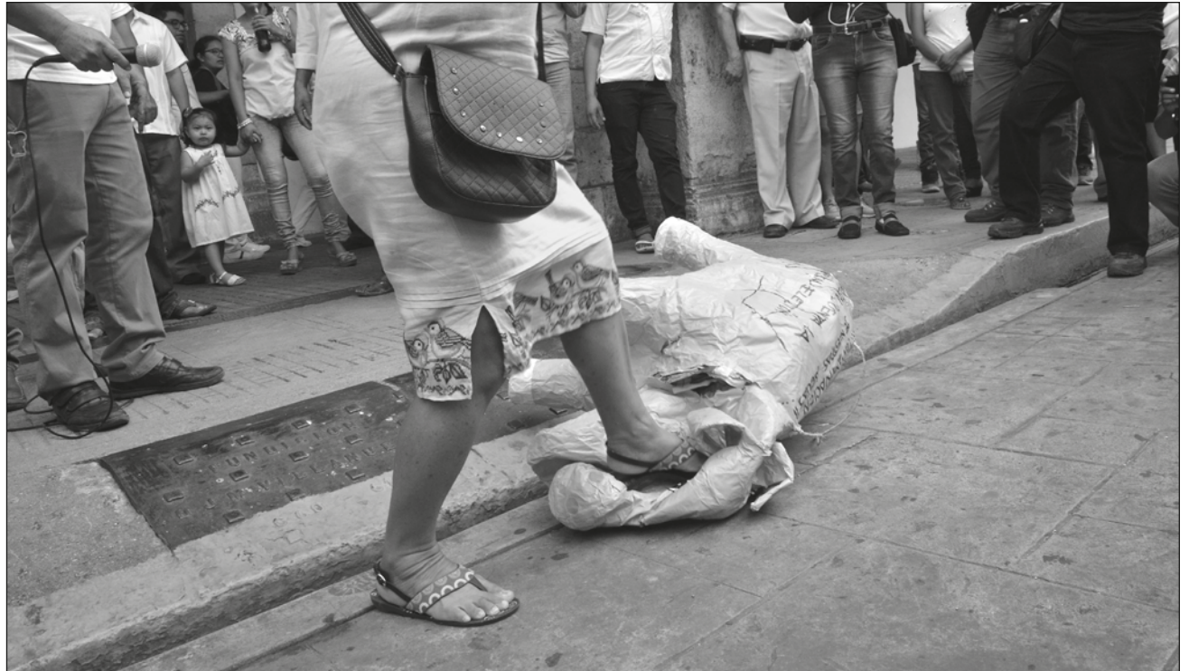
▲ Verificarán el adecuado funcionamiento de la granja y, de no cumplir los requisitos, será clausurada.

Dicho antecedente se corroboró en un informe