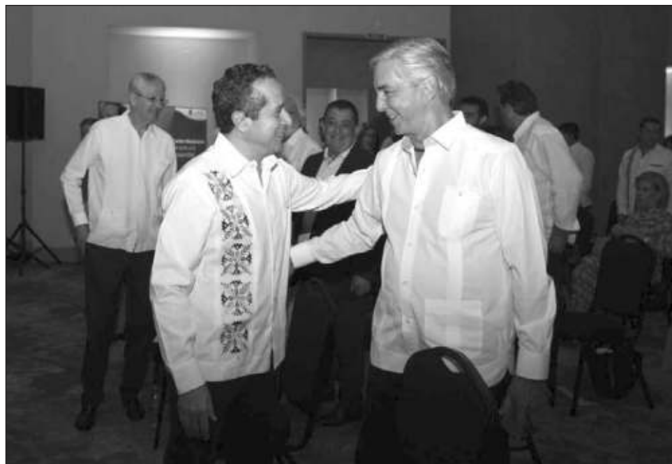
▲ El gobernador Carlos Joaquín inauguró el Foro de Turismo Caribe Mexicano, del éxito a la prosperidad que llevó a cabo la agencia internacional de noticias EFE.

Ante el interés de la agencia internacional de noticias EFE, que ha calificado al Caribe Mexicano como un ejemplo de éxito