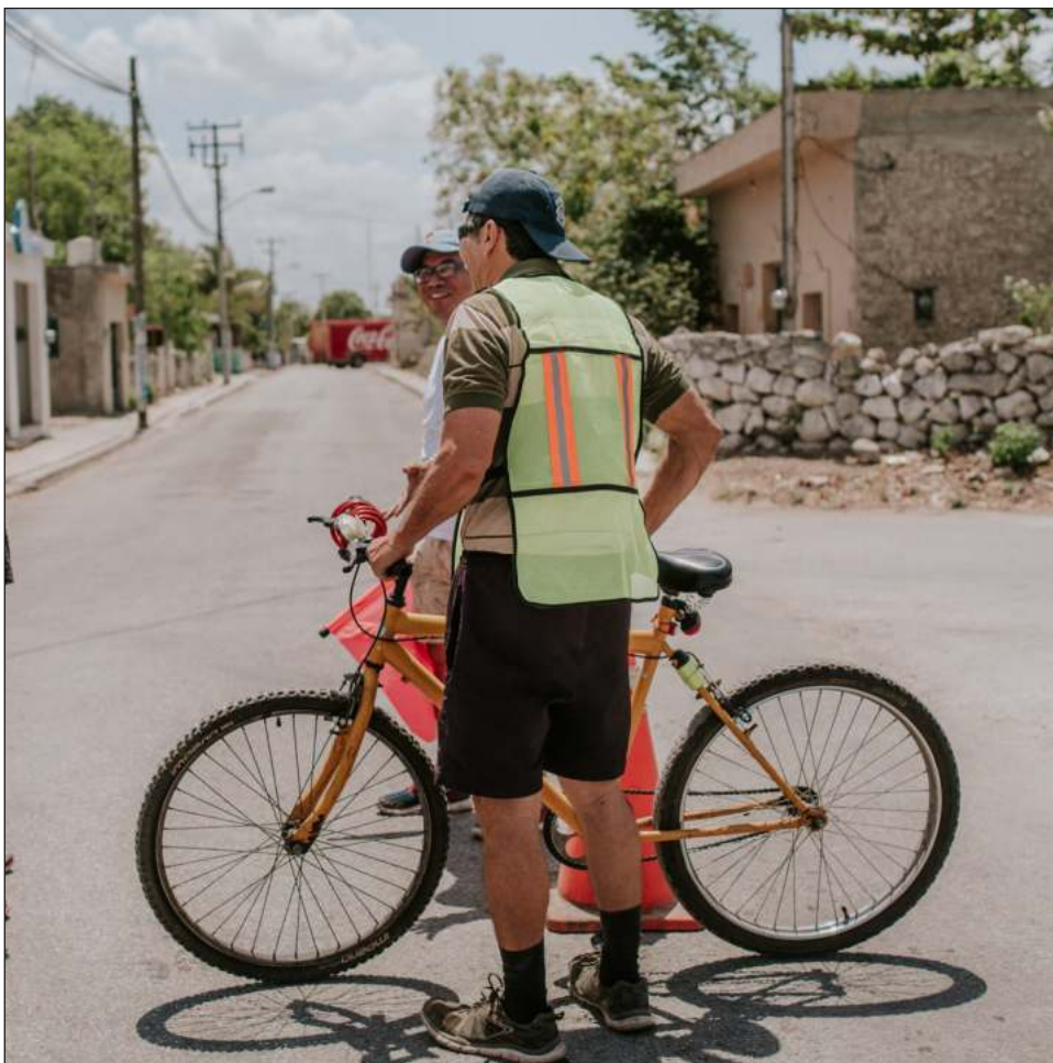
▲ La actualización legislativa deberá priorizar también al ciclista según la pirámide de movilidad, y garantizar la accesibilidad universal de todas las personas.