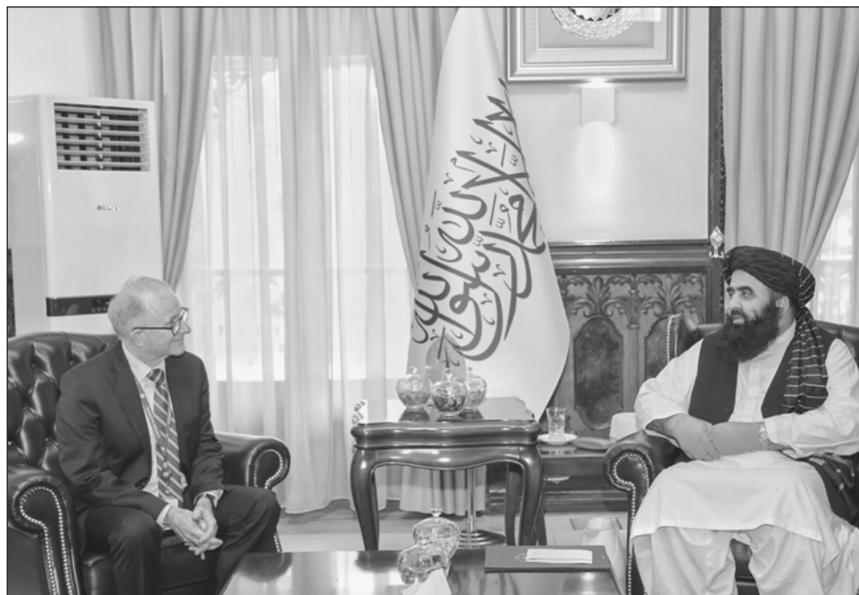
▲ Durante su primera visita al país, el relator especial de Naciones Unidas, Richard Bennett, se reunió con el ministro de asuntos exteriores talibán, Amir Khan Muttaqi.

“Muttaqi pidió a Richard que presente un informe auténtico que esté basado en hechos, no en los medios de comunicación, los círculos sesgados y las figuras de la oposición que viven en el extranjero”, anunció este miércoles en las redes sociales el portavoz del Ministerio de Exteriores afgano,