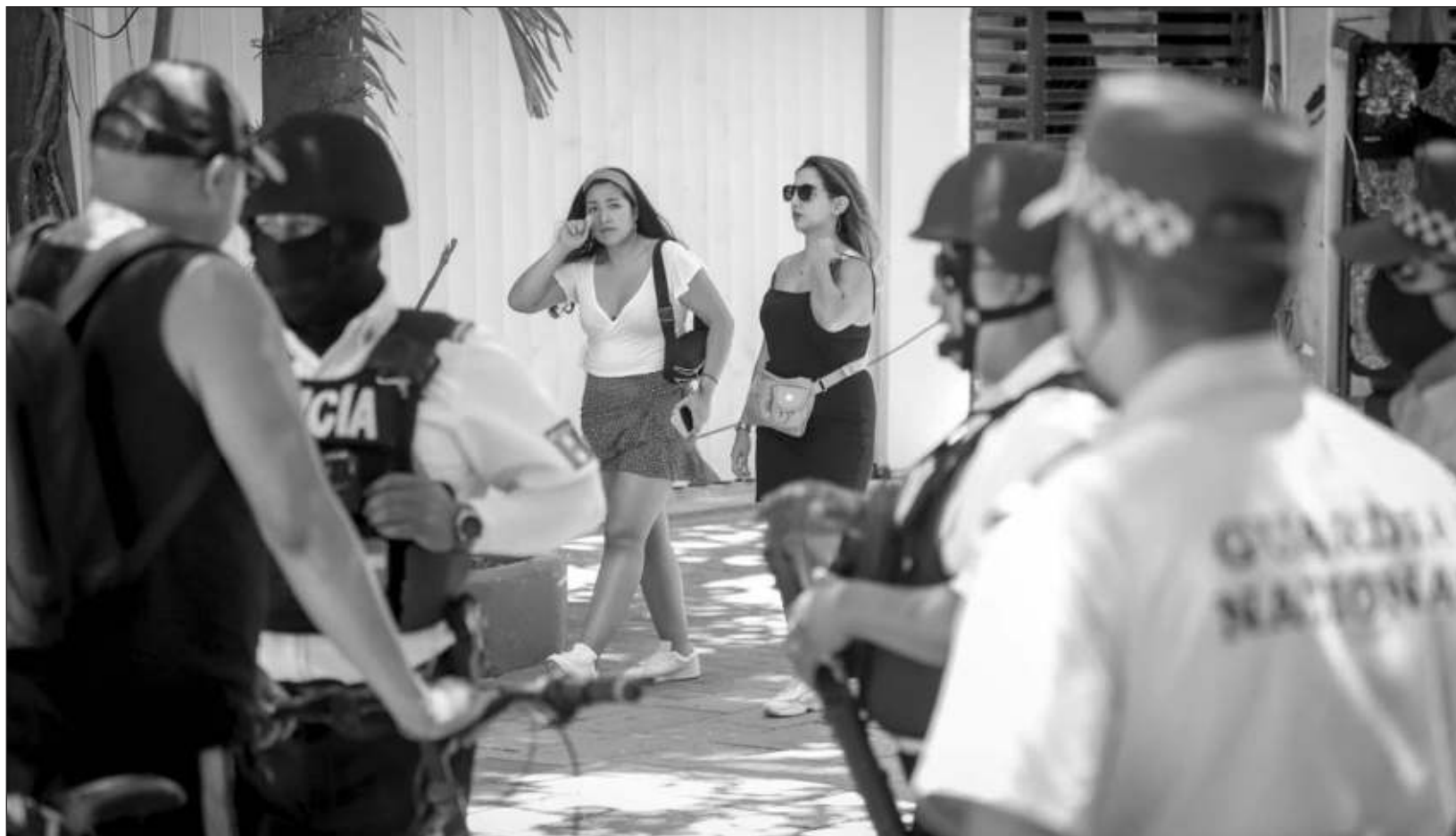
▲ De 275 órdenes de aprehensión solicitadas en 2017, se incrementó a 641 en 2021, lo que representa un aumento de 133.1 por ciento.