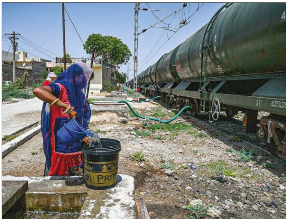
▲ El tren ha llevado agua a Pali en el pasado, pero las autoridades ferroviarias indicaron que la escasez del líquido ya era crítica en abril.

"Deberíamos seguir el ejemplo de Turquía", declaró Milanovic. "Turquía pone un precio muy alto a su estatus de la OTAN".