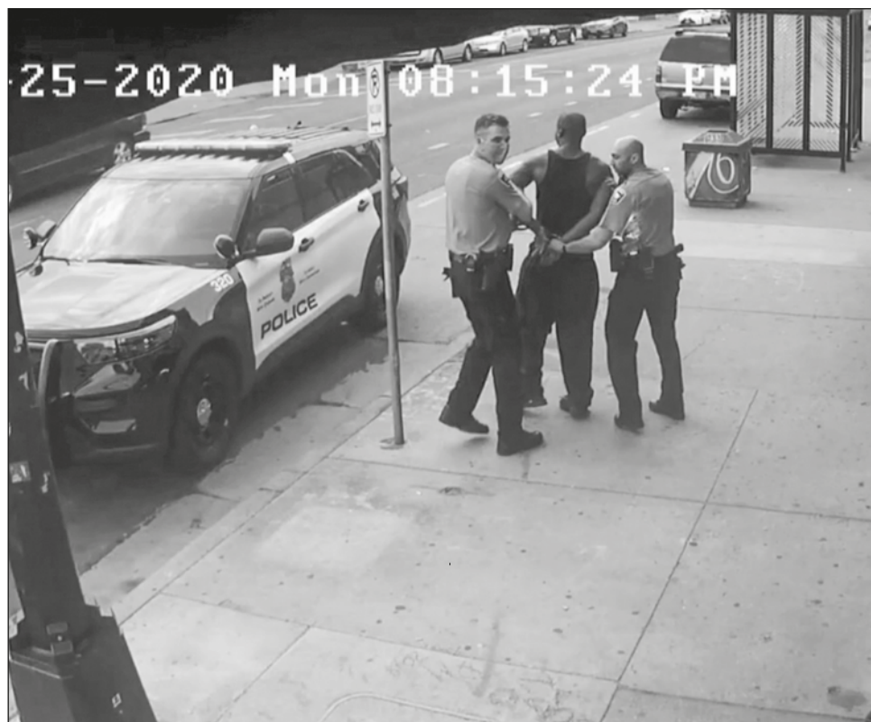
▲ Thomas Lane fue condenado en febrero por violar los derechos civiles de Floyd.

En su lugar, el miércoles se declaró culpable de ayuda y complicidad en homicidio involuntario en segundo grado, dijo el portavoz de la corte.