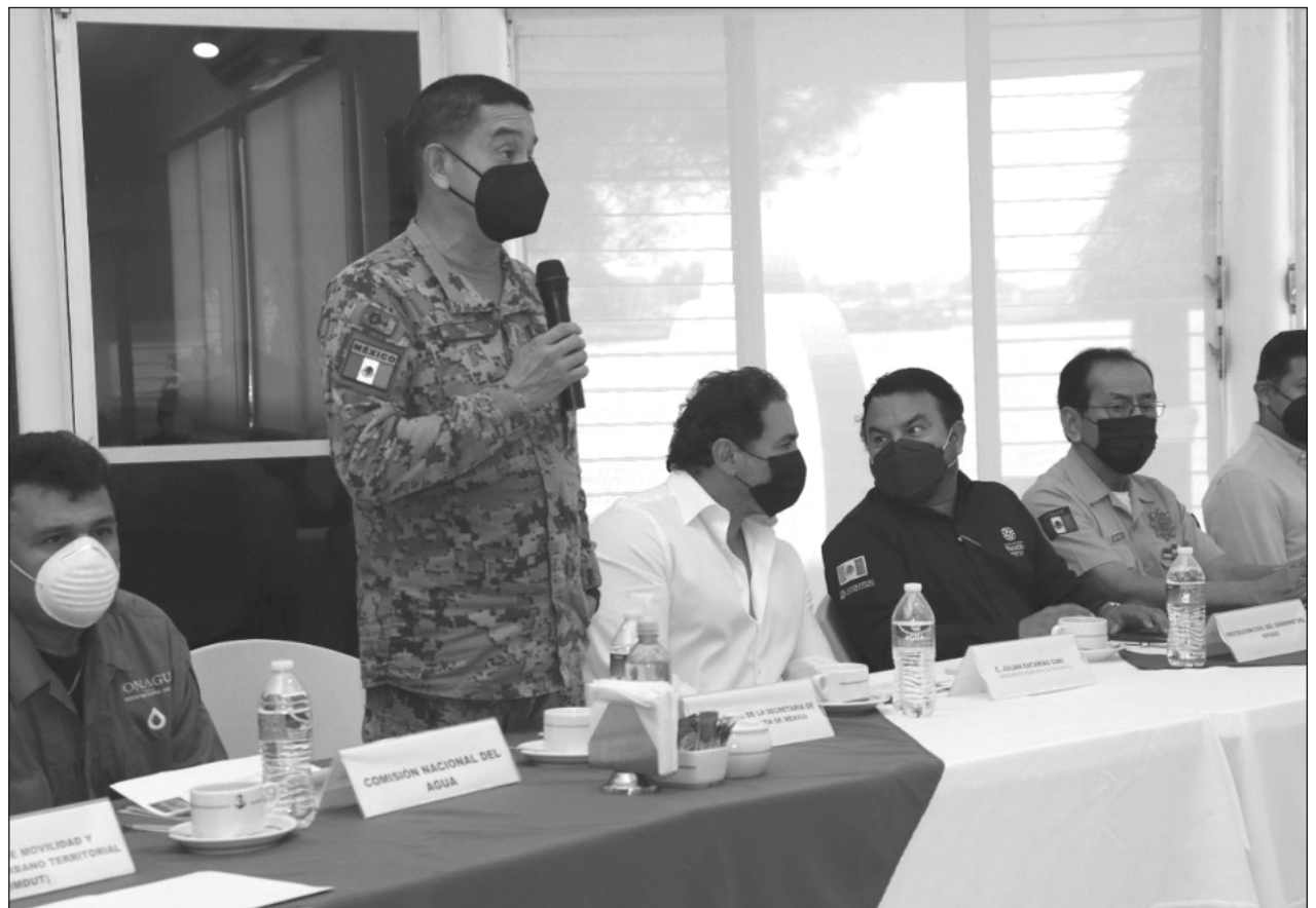
▲ En las reuniones de preparación participan autoridades de los tres niveles de gobierno.

Dicho organismo tiene como objetivo fortalecer la coordinación entre las fuerzas operativas locales, para orientar acciones de prevención, auxilio y recuperación, ante situaciones de emergencia o desastre.