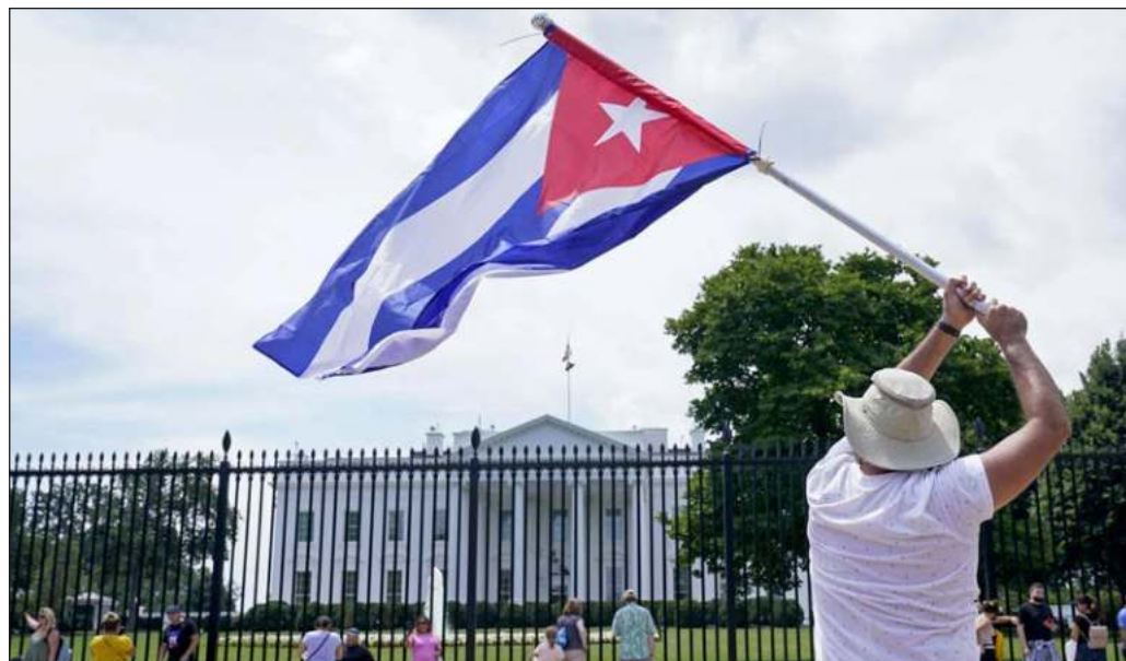
▲ A pesar de que los gestos de Biden a Cuba y a Venezuela obedecen a lógicas distintas, es imposible no ver la coincidencia entre el creciente rechazo a las políticas arbitrarias de Washington en el continente.

A la vista de esos hechos, es deseable que los países ubicados en el sur de Estados Unidos intensifiquen su exigencia de que la superpotencia abandone su política excluyente e ilegal, acepte convivir y dialogar con gobiernos de orientaciones distintas y abandone de una vez por todas su pretensión de dictar a otros países las formas en las que deben gobernarse.