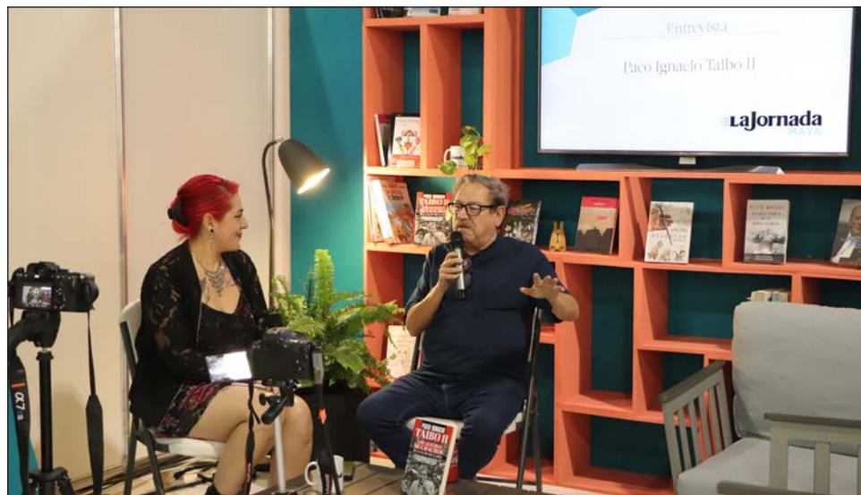
▲ “El pasado es de todos”, resume el escritor de izquierda al decir que las historias plasmadas en su libro pertenecen no sólo a su generación sino a todas las venideras que saben que la lucha sigue.

Invitamos a las y los lectores de este rotativo a ver la en-