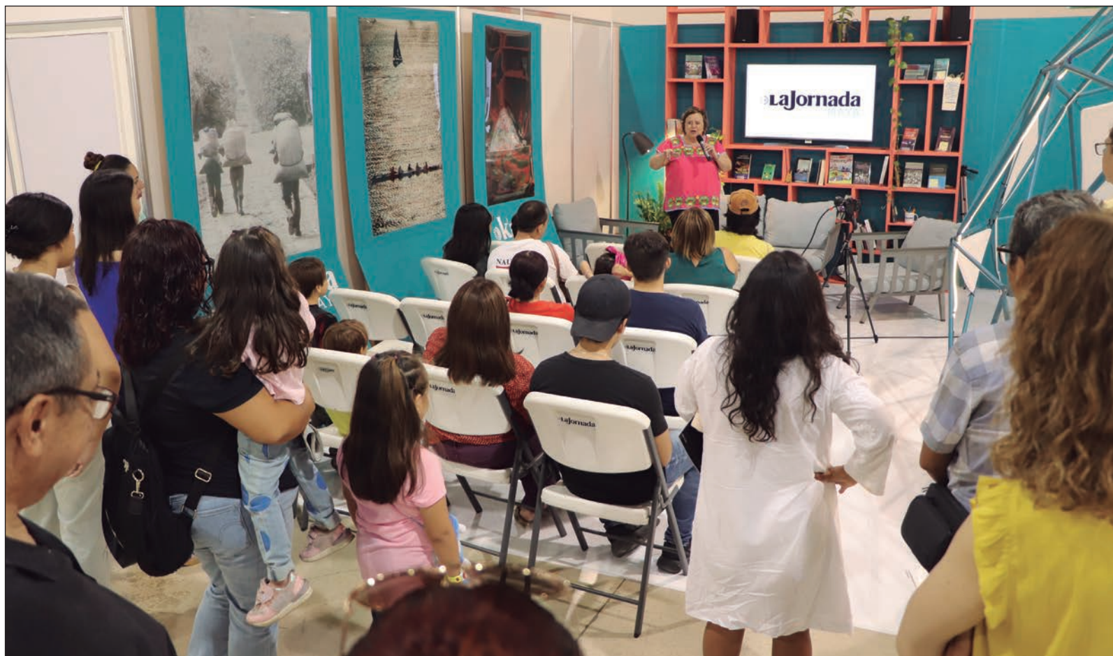
▲ “A veces me pregunto por las consecuencias que surgen de las competencias en las que nos sumergimos conforme nos hacemos mayores y pareciera que nos dedicamos a coleccionar reconocimientos y doctorados, y la presión por el escalafón alcanzado y el pánico a perderlo nos maniata”.