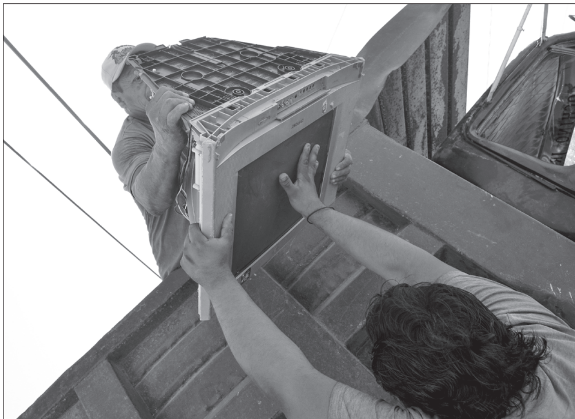
▲ El objetivo es que los estudiantes tengan la oportunidad de unirse a los esfuerzos liderados por investigadores, el municipio y los residentes para construir resiliencia urbana, a partir de la naturaleza.

LA INVESTIGACIÓN TRANSDISCIPLINARIA da un giro al análisis de las problemáticas socioambientales al poner al frente a los actores sociales, en este caso la participación de la ciudadanía y trabajar de manera conjunta alternativas y propuesta. En otras palabras, reconoce y apremia la participación de actores, académicos y no académicos, de autoridades, pero también de organizaciones no gubernamentales, grupos