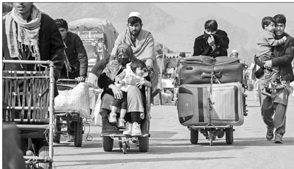
▲ El portavoz talibán, Enayatullah Khwarizmi, señaló que “las fuerzas de defensa y seguridad del país están preparadas para responder a cualquier acción agresiva y defenderán su integridad territorial a toda costa”.

Afganistán “condena con firmeza estos ataques” y denuncia la “violación de la soberanía” del país, prosiguió el vocero, añadiendo que “pueden