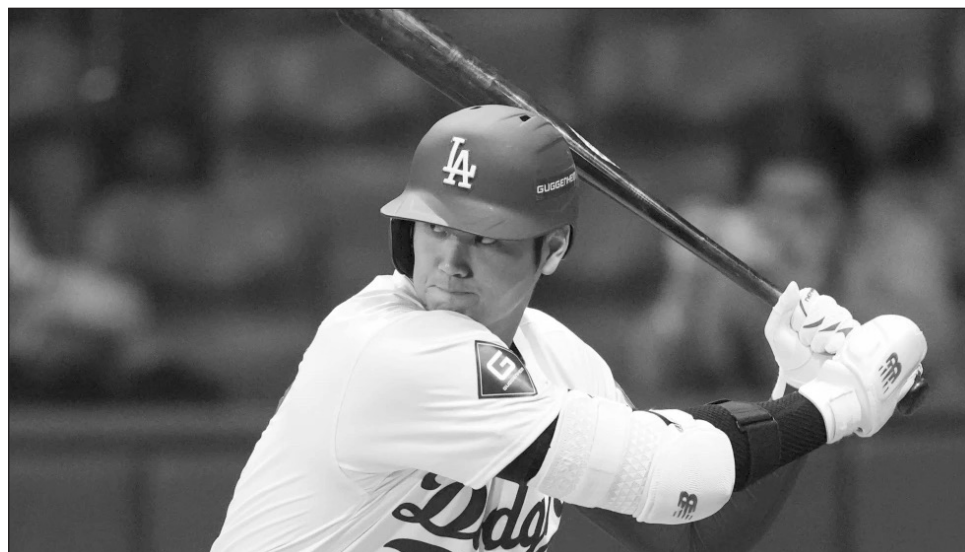
▲ Shohei Ohtani y los Dodgers pondrán en marcha la temporada regular de las Ligas Mayores ante los Padres en Corea del Sur. Se esperan buenos encuentros entre los acérrimos rivales de división.

Ohtani y los Dodgers inician la fase regular el miércoles en Seúl con una serie de dos juegos ante los Padres de San Diego, los primeros