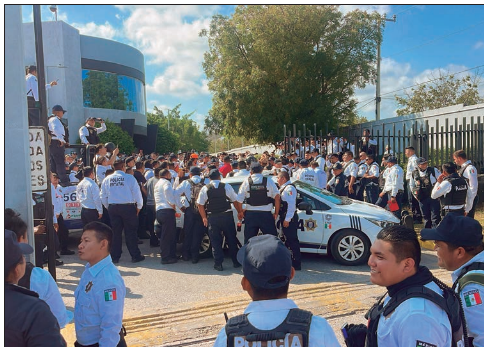
▲ Al menos 500 elementos de la Secretaría de Protección y Seguridad Ciudadana, casi la mitad del cuerpo policial, tomaron las instalaciones de la dependencia.