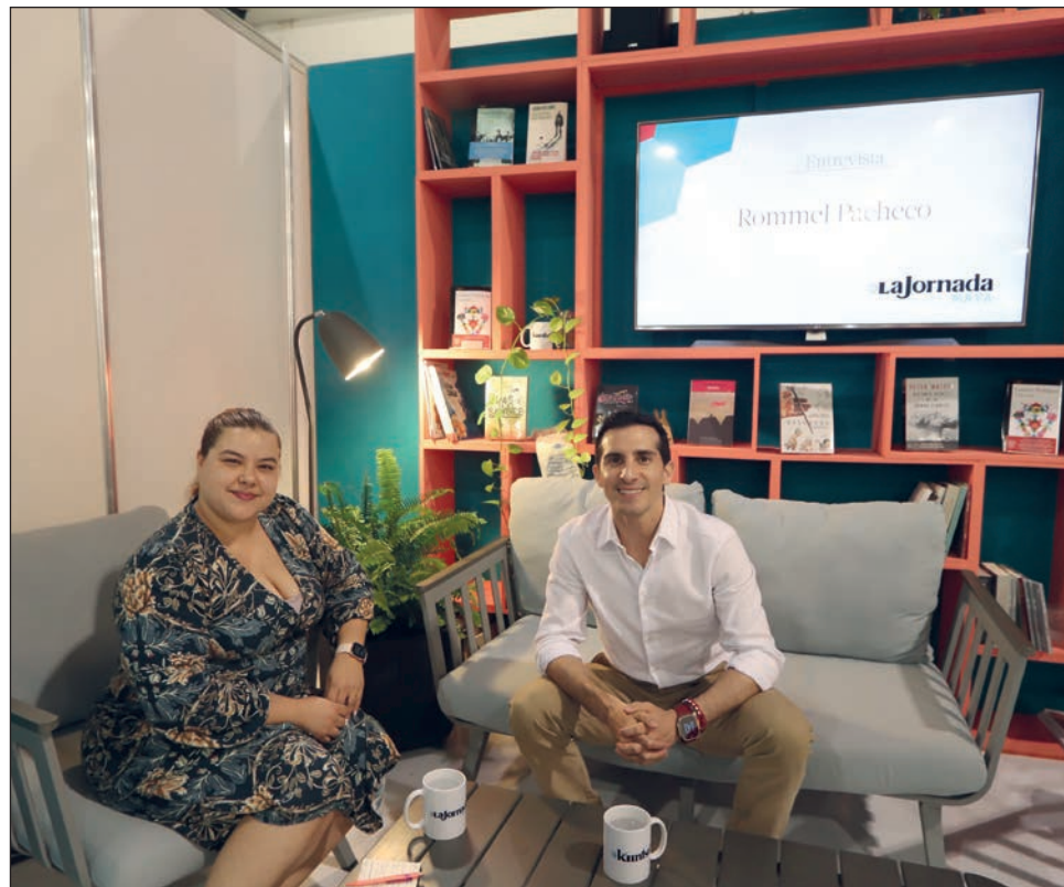
▲ El también diputado federal recordó que en 2015 se celebró en el Complejo Deportivo Kukulcán u, que fue una de las competencias que más disfrutó al encontrarse en casa.

Con entusiasmo, el también diputado federal recordó que en 2015 se celebró en el Complejo Deportivo Kukulcán una serie mundial de clavados, que fue una de las competencias que más disfrutó al encontrarse en casa.