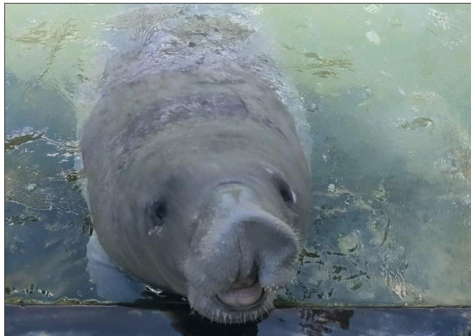
▲ Mediante la necropsia correspondiente se detectó que el manatí Pompeyo sufría de una infección interna aguda, siendo esa la causa de su fallecimiento.

Al acudir personal especializado, confirmó que se trataba del manatí Pompeyo, logrando identificarlo por sus características físicas, marcaje con cinturón y el rastreador que portaba. En su cuerpo no se encontra-