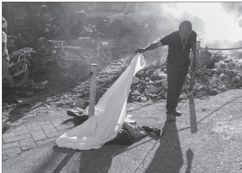
▲ Pronto empezó a formarse una multitud alrededor de las víctimas; uno de los hombres estaba boca arriba, rodeado por un mazo de cartas desparramadas, otro estaba boca abajo.

Pronto empezó a formarse una multitud alrededor de las víctimas. Uno de los hombres estaba boca arriba, rodeado por un mazo de cartas desparramadas. Otro estaba boca abajo dentro de un camión que sirve de taxi, lo que en Haití llaman tap-tap . Una mujer se desmayó y tuvo que ser asistida por otros, al enterarse de que uno de los muertos era familiar suyo.