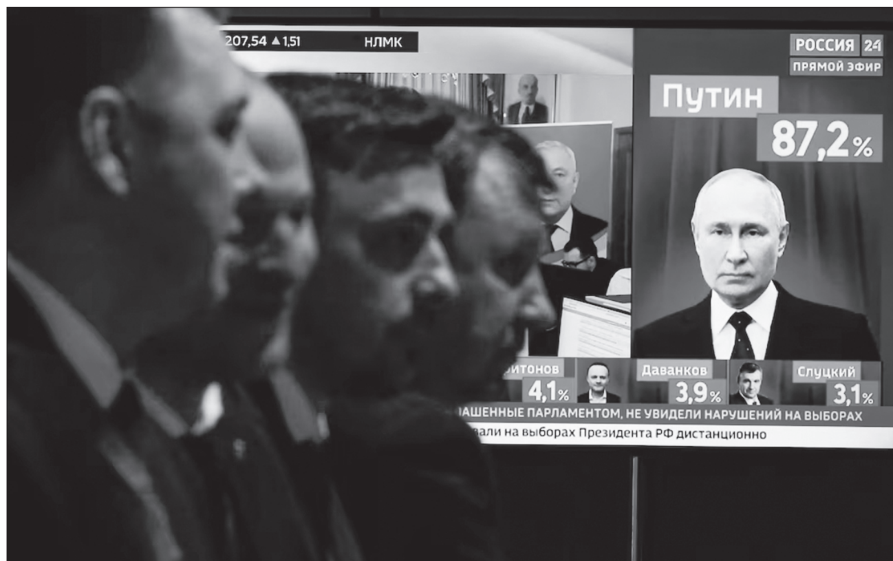
▲ Vladimir Putin, de 71 años, fue reelegido para un quinto mandato, en unos comicios de tres días sin un candidato opositor con opciones reales y que también se realizaron en zonas ucranianas que están ocupadas por militares rusos.

“Mano a mano saldremos adelante”, dijo Putin.