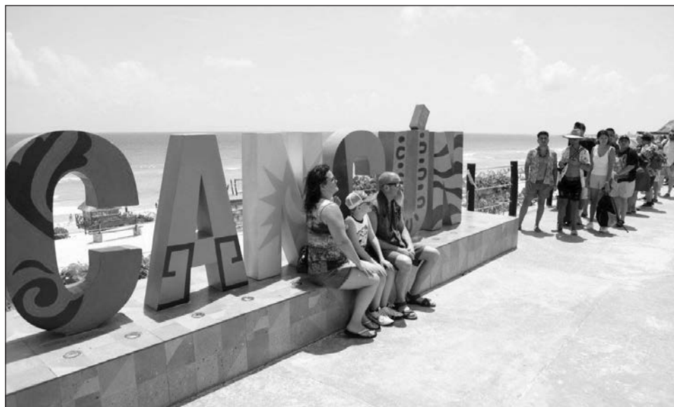
▲ La llegada de turistas de Estados Unidos fue de un millón 186 mil, con un incremento de 2.9% más, respecto al mismo mes de 2023; y un incremento de 45.1% respecto a 2019.

"Por lo anterior, Cancún se mantiene como el destino turístico más importante de México y Latinoamérica, superando cada año los récords en captación de turistas", destacan los datos.