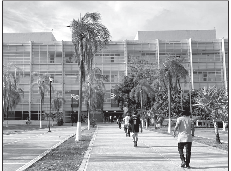
▲ Este nosocomio se encuentra ubicado en la recién remodelada avenida Politécnico, entre calle Tepich y Kinik, manzana 1, lote 1, Región 509, de Cancún.

Ofrece no sólo medicina de urgencias, sino 45 servicios de especialidad, de las cuales 19 son únicas en el estado como: oncología