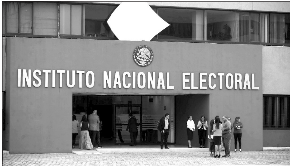
▲ En este grupo de estados, Baja California, Chiapas, Coahuila, Durango, Puebla, Nayarit y Yucatán la votación del PT y PRD oscila entre 2 y 2.7 por ciento, cifra que los coloca al borde de su desaparición, amén de que en los últimos tiempos destaca su falta de proyecto.

Aunque oficialmente, de acuerdo con el reporte del Instituto Nacional Electoral sobre su militancia efectiva, el PRD reporta que cuenta con 999 mil 249 miembros, los resultados electorales en los últimos comicios locales de gobernador, alcaldes y diputados reflejan que hay entidades donde el partido es prácticamente inexistente.