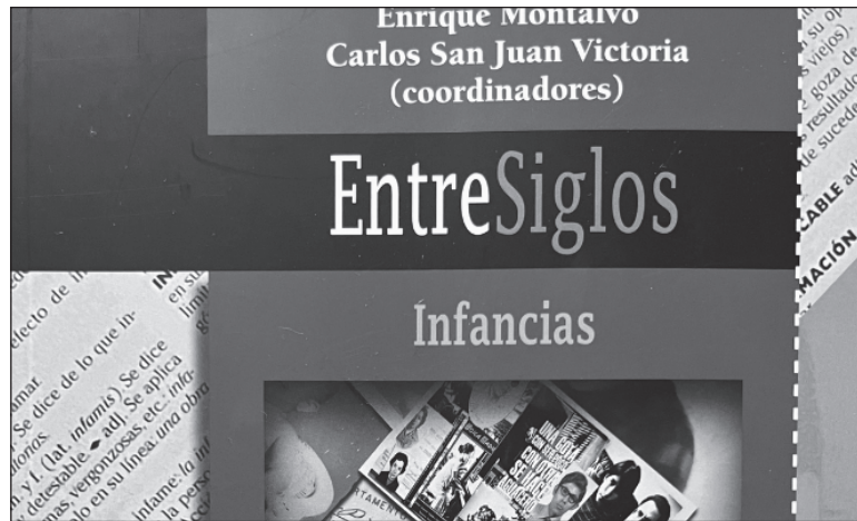
▲ “Nuestras vivencias se volvían parte de un proceso mayor y éste era afectado, inevitablemente, por nuestra subjetividad”. Foto fragmento de la portada

NOS ENCONTRAMOS FRENTE a la oportunidad de ver el mundo