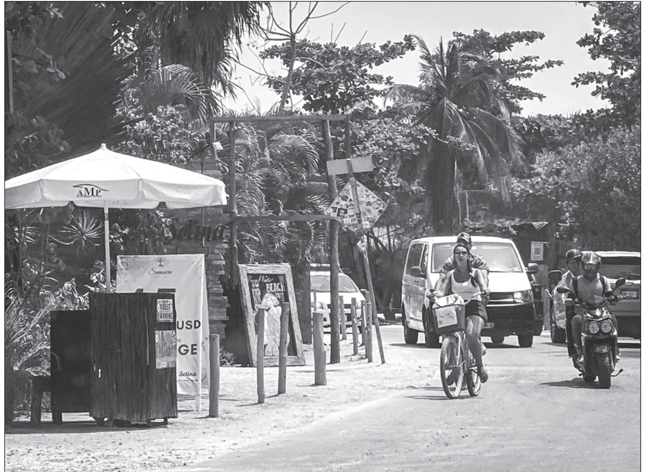
▲ La Mesa Ciudadana de Seguridad y Justicia de Quintana Roo indicó a través de un comunicado su "extrema preocupación" por los acontecimientos, los cuales "han derivado en opacar tan bello destino turístico".

Al respecto, la Mesa Ciudadana de Seguridad y Justicia de Quintana Roo declaró mediante un comunicado su "extrema preocupación" por los acontecimientos, los cuales "han derivado en opacar tan bello destino turístico". Se dijeron en total disposición de sumarse a la demanda del Consejo Hotelero del Caribe