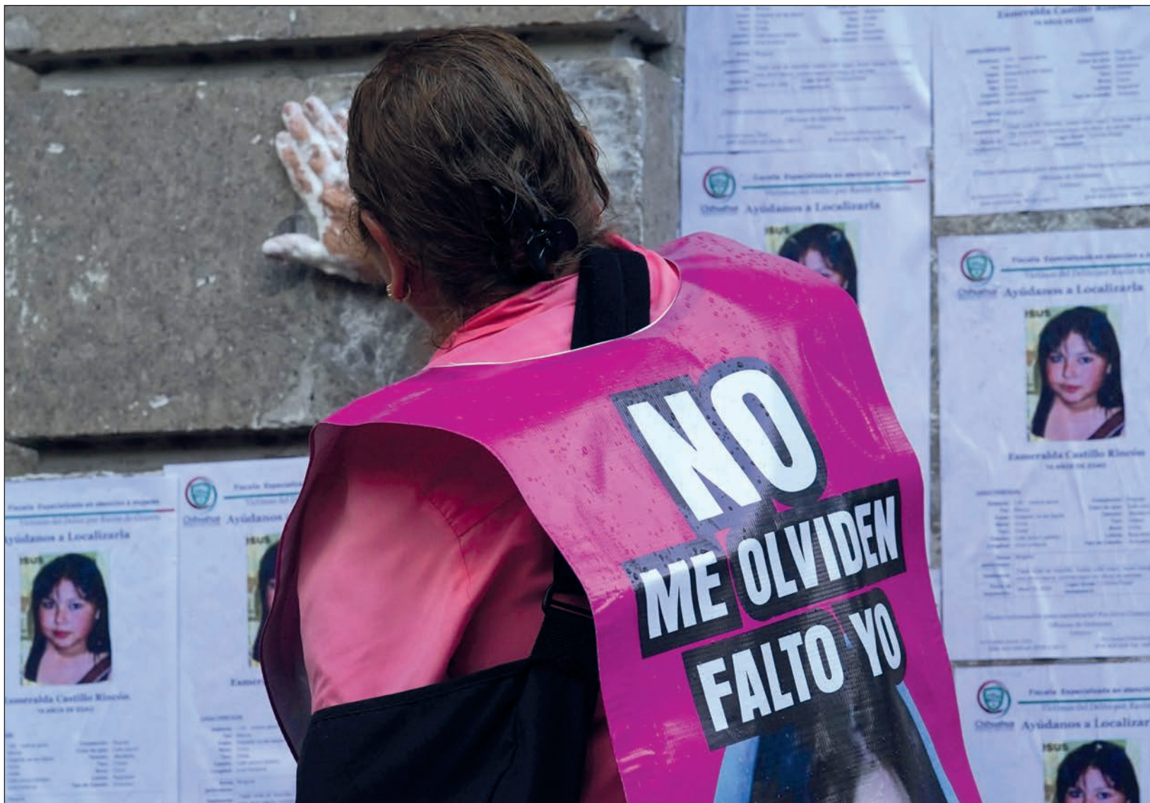
▲ Se han realizado cinco jornadas de búsqueda en todo el territorio nacional desde mayo del año pasado hasta enero de 2024 con un total de mil 559 equipos conformados por cuatro mil 967 personas que llegaron a más de 111 mil casas, según reporta la Secretaría de Gobernación.

Actualmente llevan a cabo la sexta jornada que empezó el 7 de marzo y terminará el 25 del mismo mes recorriendo 31 mil domicilios; en el caso de Campeche y Yucatán es un equipo para cada estado y en el caso de Quintana Roo son 13 equipos compuestos por 19 elementos.