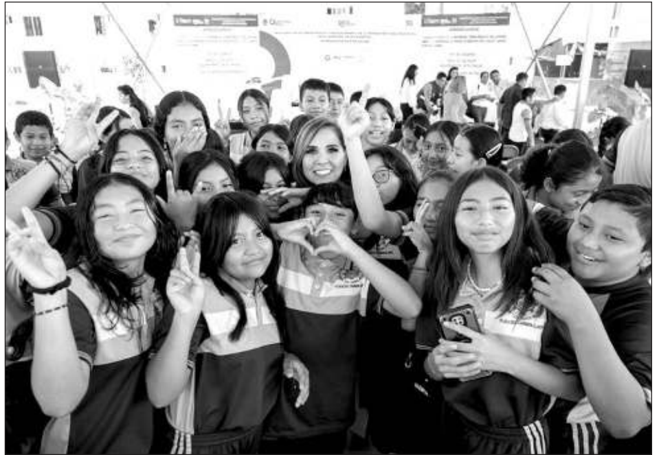
▲ Las obras para el fortalecimiento de la infraestructura educativa en Solidaridad beneficiarán a 14 mil 500 estudiantes de educación básica, media superior y superior.

Mara Lezama explicó que cuando se combate la corrupción el dinero alcanza para más, y estas inversiones históricas son posibles porque este gobierno cierra las grietas por donde se fugaba el dinero del pueblo e iban a parar