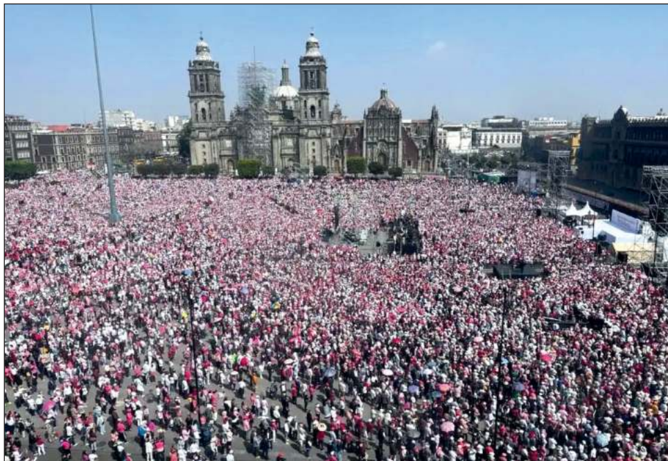
▲ El ex consejero electoral defendió desde su intervención -la única que hubo en el acto- que no acudieron para apoyar a ninguna candidatura, "no estamos aquí para criticar a ningún gobierno"; aunque las alusiones contra el gobierno federal fueron evidentes.

En su mensaje, que duró 30 minutos, Córdoba recalcó de manera constante el desarrollo de los órganos electorales y sostuvo que con ello, se ha construido "una escalera cada vez más firme" para que quien tuviera los votos pudiera acceder al primer piso, al tiempo que