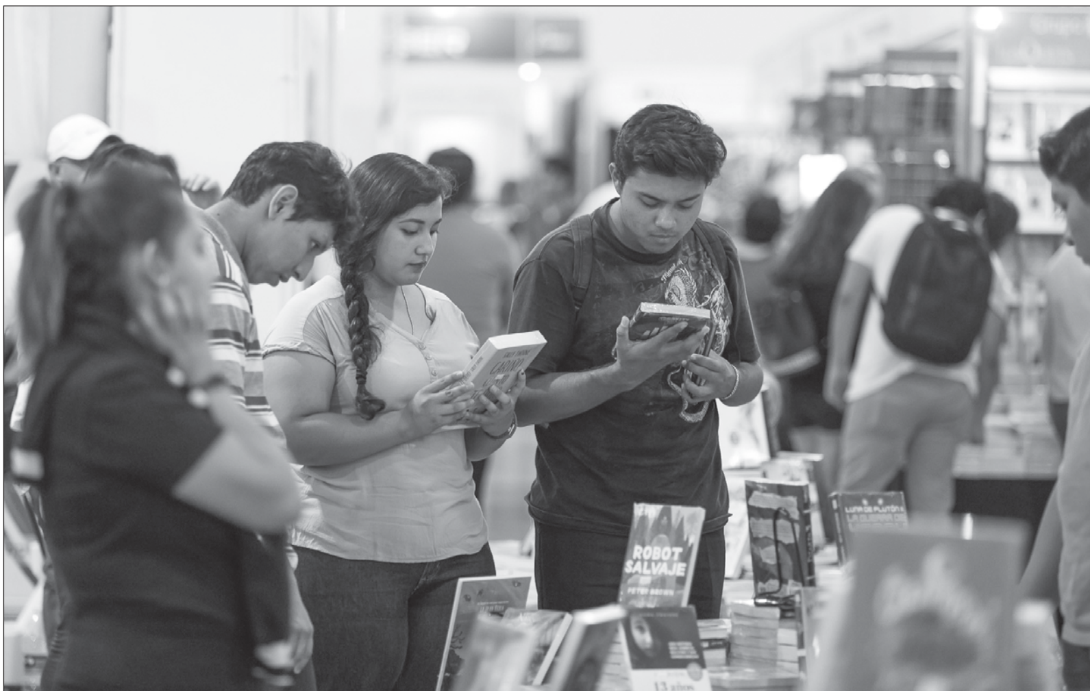
▲ “Toca motivar al público a hacer el cochinito , en especial a los chiquitos, dándole valor al libro como tesoro por conseguir”.