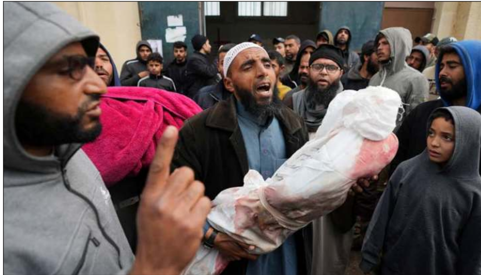
▲ Cerca de 1,4 millones de palestinos malviven en esta localidad fronteriza con Egipto, la mayoría desplazados de otras partes del enclave, bombardeado y asediado por Israel.

La comunidad internacional advirtió en los últimos días de las consecuencias humanas que tendría un operación en Rafah. Netanyahu, sin embargo, insistió el sábado que no entrar en la localidad implicaría “perder la guerra” contra Hamas, considerado