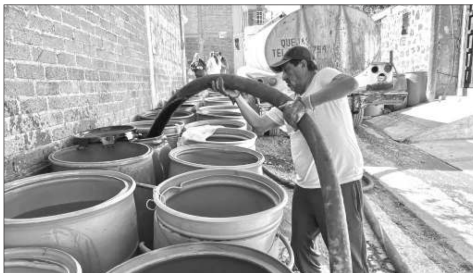
▲ La presidenta de la Cámara de Diputados señaló que “es necesario avanzar en la aprobación de la Ley General de Aguas en México, dejando atrás criterios político-electorales, así como otras iniciativas que van en el mismo sentido. La población no busca culpas, sino soluciones”.

En el contexto de la sequía y la crisis hídrica en México, la legislatura dijo que aun cuando se trata de un asunto de seguridad nacional, en la