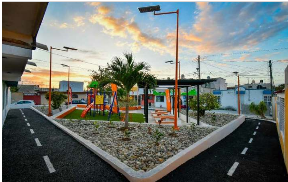
▲ El área de juego infantil consta de un espacio con un juego múltiple, área de picnic con techumbre a base de estructura metálica y cubierta de policarbonato, así como tres mesas.

“Estamos muy contentos de darle resultados a los vecinos de Palmas III, una unidad donde las familias son muy unidas y con esta obra pretendemos fomentar la sana convivencia, pero ahora les toca cuidar lo que con mucho esfuerzo se construyó, que estén atentos para que nadie vandalice este espacio que es de ustedes”, exhortó.