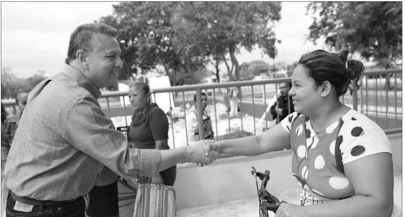
▲ "Nuestro compromiso (...) es crear las condiciones necesarias para que las familias cuenten con más y mejores oportunidades de crecimiento": alcalde.

Para mayor información sobre los cursos que se ofertan en cada sede, además de las inscripciones, puede consultarse la página www.merida.gob.mx/centrosdecapacitacion