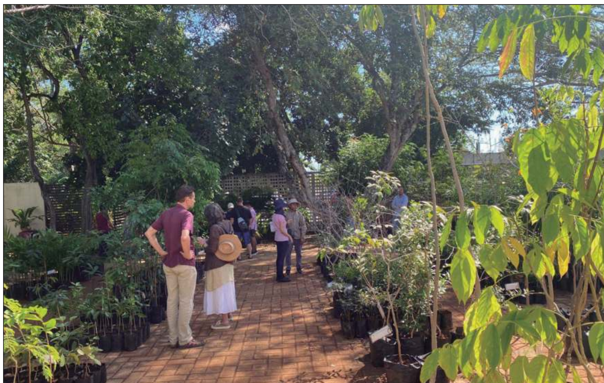
▲ "Fundado en 1983, el Roger Orellana ya cumplió cuatro décadas durante las cuales ha generado veinte colecciones vegetales que albergan 700 especies nativas de la península, en una superficie de 2.5 hectáreas".

EN MÉXICO, MUCHOS de los jardines botánicos -o etnobotánicos-, han surgido por iniciativa de instituciones científicas que