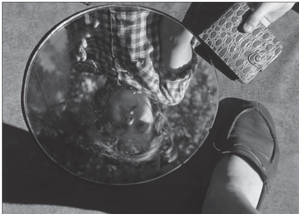
▲ La protagonista de la exposición tuvo una vida silenciada, era invisible, sin identidad, y, dada su profesión, carecía de hogar: su habitación era su propia fotografía.