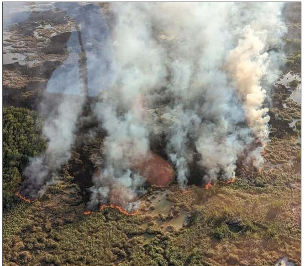
▲ Para atender el incendio, la Secretaría de Marina desplegó un helicóptero con un helibalde que tiene una capacidad para transportar 2 mil 500 litros de agua por cada carga.

Por lo anterior, tras realizar un sobrevuelo de reconocimiento en el área afectada, se dio inicio con el combate al incendio mediante cinco descargas con helibalde en los puntos con mayor afectación, vertiendo un total de 12 mil 500 litros de agua; acciones que continuarán hasta su total extinción, señala la dependencia.