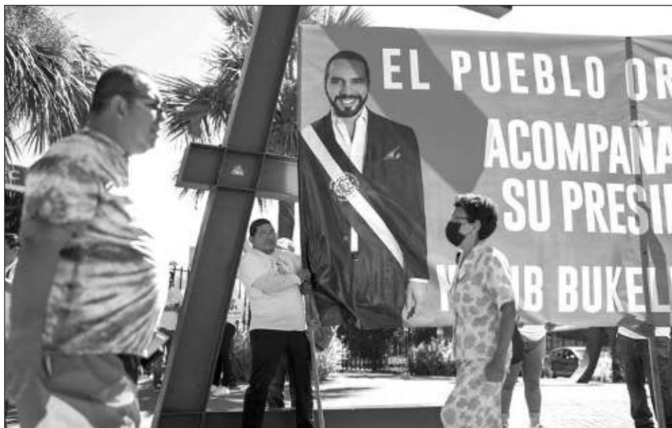
▲ El presidente salvadoreño, que goza de una alta popularidad, basó su campaña en el combate a las temibles pandillas e hizo que el Poder Judicial habilitara su reelección pese a estar prohibido.

En el año y medio que lleva el presidente de Colombia se ha reunido cuatro veces con su homólogo venezolano y delegaciones de alto nivel de ambos países van y vienen entre Caracas y Bogotá, donde se reabrieron hace más de un año las embajadas.