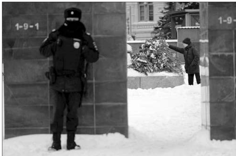
▲ El repliegue en Kiev otorga a Moscú su primer avance territorial de calado desde mayo de 2023.

La noticia se extendió por todo el mundo y muchos mandatarios culpan de su muerte a Putin y su gobierno. Poco después de salir de un servicio religioso, el presidente estadounidense Joe Biden reiteró el sábado ante los periodistas su postura de que Putin era, en