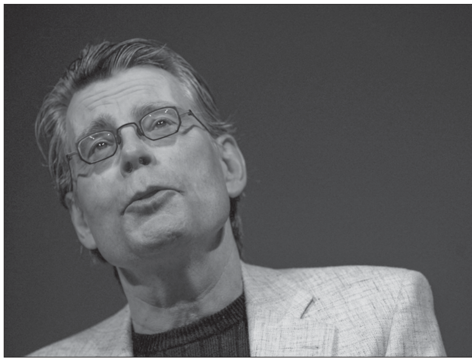
▲ Stephen King es uno de los autores con más seguidores en el mundo.

Ésta es sólo una de las muchas anécdotas que forman parte de la vida de King, que además se entremezclan con su obra literaria y fantástica, en la que evoca imágenes y secuencias de terror que lo han erigido como el máximo exponente en este género. Todas esas historias ahora son parte de la que se consi-