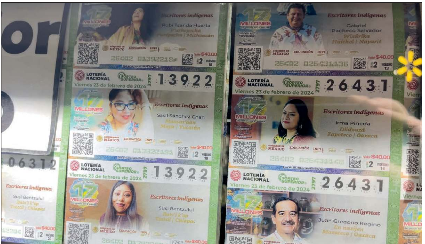
▲ Kláak', Sasil Sáncheze', yéeya'ab, ichil uláak' ajt'síbo'ob ichil u jejeláasil máasewal t'aano'obe', ti'al u chíikbesa'al ichil u ju'unil u yúuchul bultaak'in ku beeta'al tumen u noj lu'umil México. Oochel jusaeri

Editora de K'iintsil, imagen de la Lotería Nacional