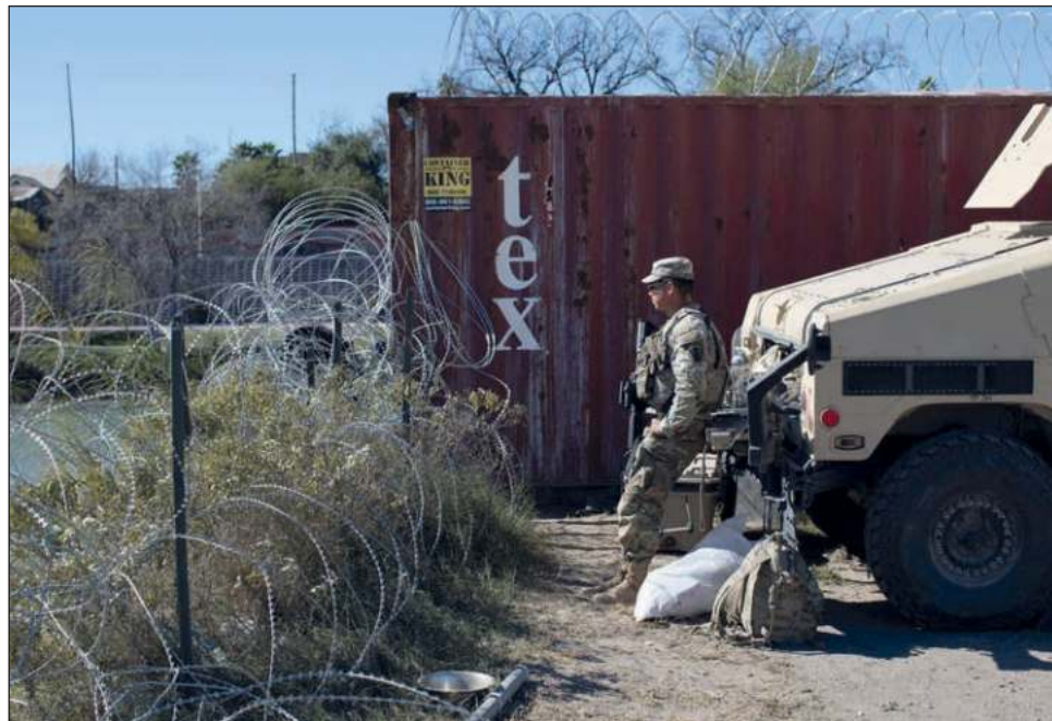
▲ El gobernador de Texas, Greg Abbott, señaló que "no es México el que controla la frontera. Son los cárteles los que la controlan", por lo que es necesaria la presencia de sus tropas.

El gobernador dijo que el cruce de migrantes en Texas disminuye gracias a sus medidas y descartó que haya un mayor control del lado mexicano. "No es México el que controla la frontera. Son los cárteles los que la controlan", aseguró.