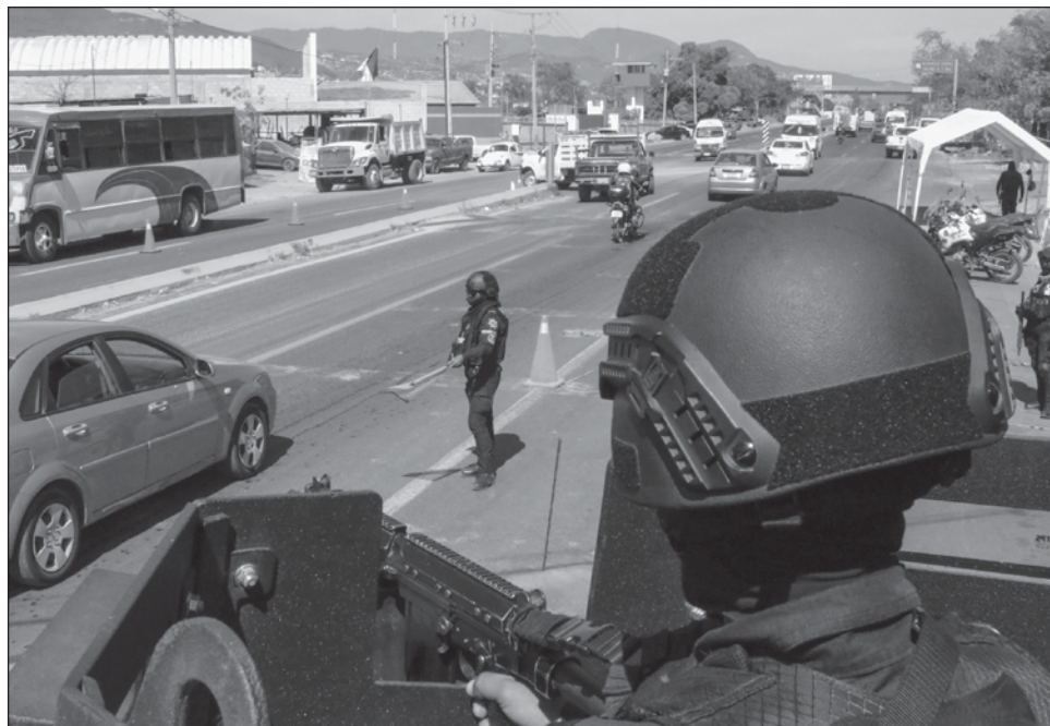
▲ Los Estados, a través de política pública, policías y sistema judicial, se han vuelto incapaces de disuadir los crímenes y de ahí vienen los delitos altamente predatorios como la extorsión, el secuestro y los homicidios por control territorial, asegura Bergman.

“En el contexto latinoamericano, la relativa mejora general de los ingresos alimentó involuntariamente la criminalidad (...) Ahí radica la paradoja latinoamericana”, sostiene el autor en El negocio del crimen . En entrevista con La Jornada refiere que una mayor demanda interna