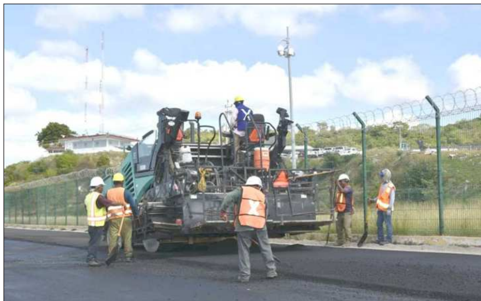
▲ La resolución de la Suprema Corte revierte las modificaciones aprobadas y restablece la obligación de pagar los permisos correspondientes ante los ayuntamientos.