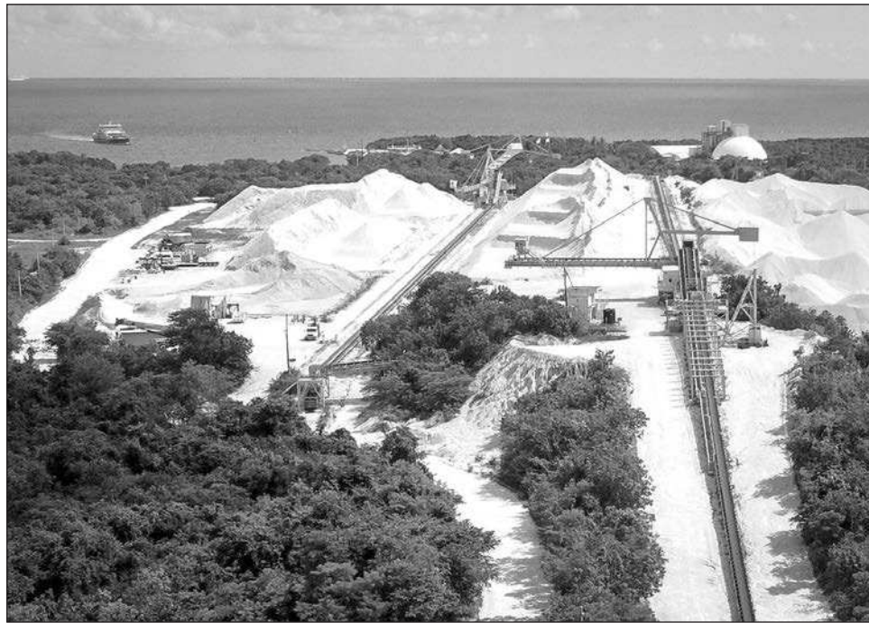
▲ Guajardo advirtió que la fortaleza turística puede verse comprometida si se debilita la confianza de los inversionistas internacionales, como cuando surgen disputas legales de alto perfil.

Al analizar las perspectivas económicas y turísticas del país, en un contexto internacional marcado por la