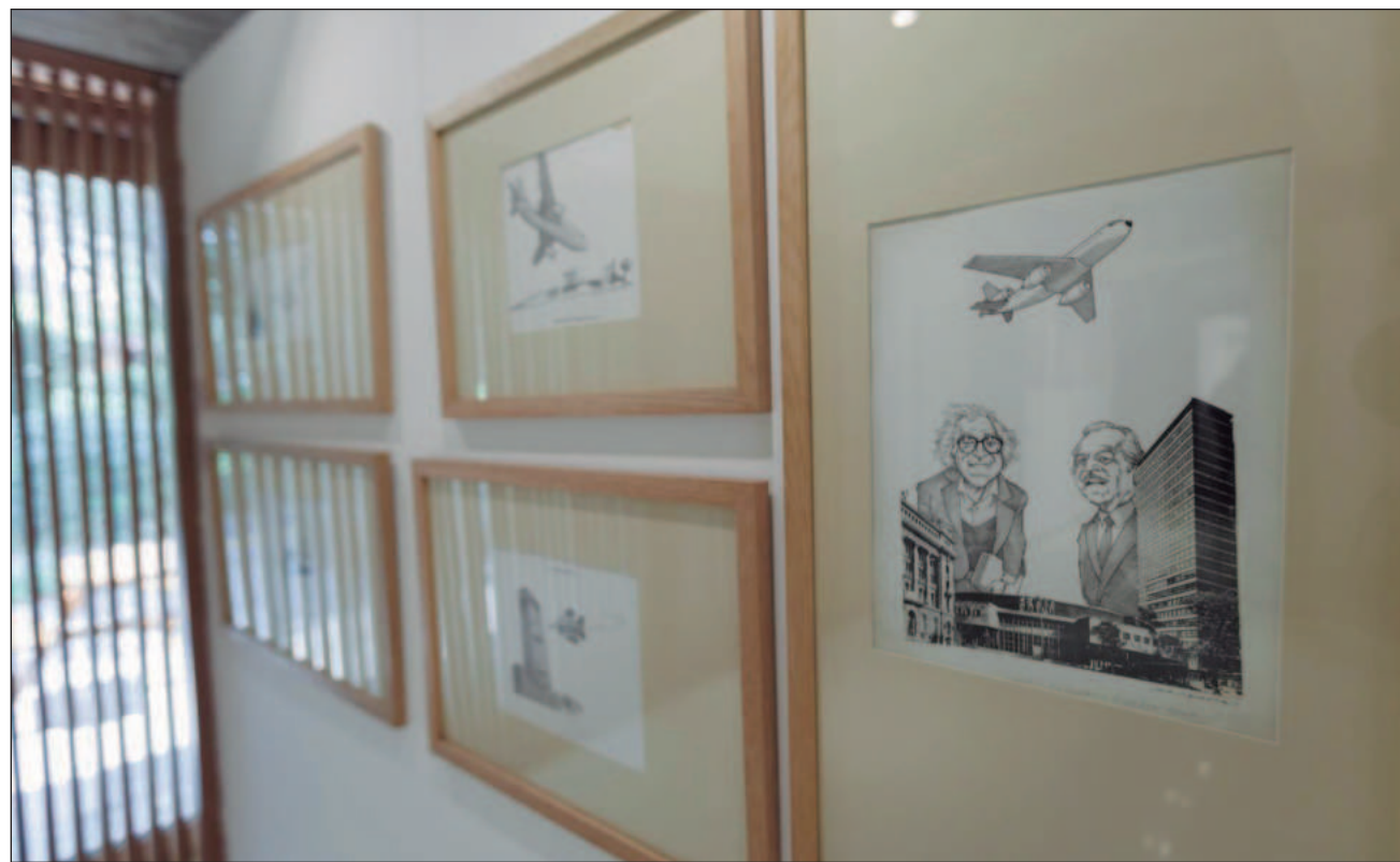
▲ Antonio Helguera fue un artista que entendió la caricatura “como una herramienta muy poderosa para cuestionar al poder, desnudar contradicciones y recordarnos que la democracia también se defiende desde el lápiz y el papel”.