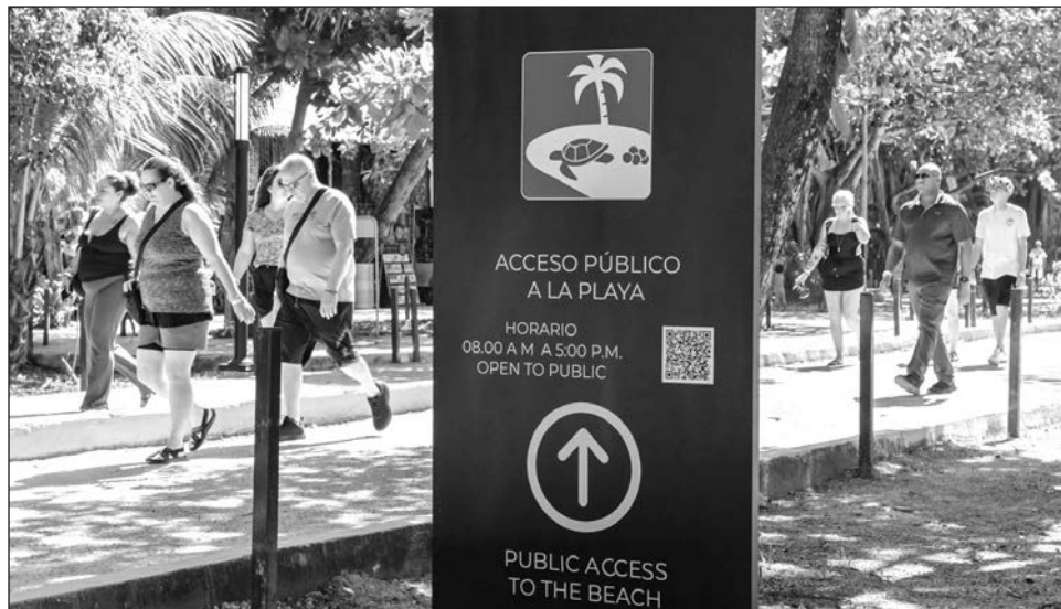
▲ Q. Roo cuenta con un esquema de promoción, a través del Consejo de Promoción Turística del estado, que es considerado un ejemplo a nivel nacional por su eficiencia y resultados.

"Diría yo que fue una temporada invernal exitosa, por supuesto empezamos enero con algunos retos, arribos tempranos de sargazo y bueno, eso nos pone a prueba para redoblar esfuerzos para el comienzo de este año", indicó el también