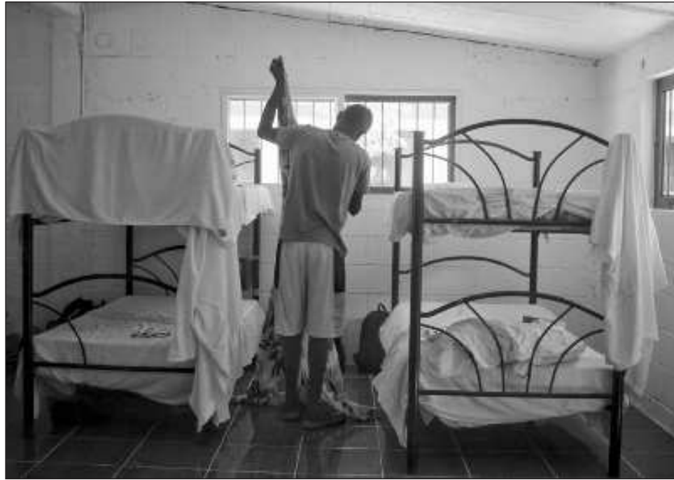
▲ En CISVAC han notado que muchas de las personas que llegan a Quintana Roo ya no lo hacen con la intención de irse al norte, sino de quedarse a vivir en el Caribe Mexicano.

“Este año se incrementó (la cifra de migrantes) casi 23 por ciento comparado con el año pasado, muchísimo, de hecho donde más hemos tenido son las solicitudes de asilo por refugio humani-