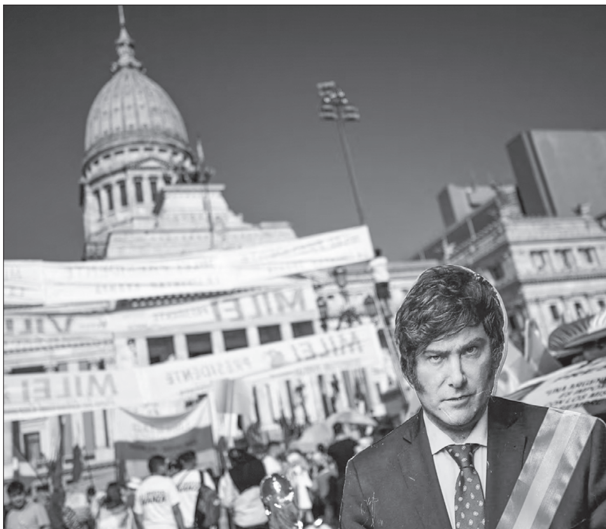
▲ “La historia contemporánea de Latinoamérica nos ha mostrado que la progresividad de los derechos humanos no es un criterio aplicable y del todo cierto en el vaivén político de nuestros países”.

POSICIONAMIENTOS COMO EL anterior, también se manifiestan en las calles, produciendo enfrentamientos entre grupos que reivindican los derechos y los que están cercanos a la forma de pensamiento de los grupos en el gobierno. Esto afecta al movimiento feminista argentino porque en los últimos años ha incidido en la transformación de leyes sobre los derechos sexuales y reproductivos, sobre la identidad, acceso a la justicia, bienestar social, cuidados