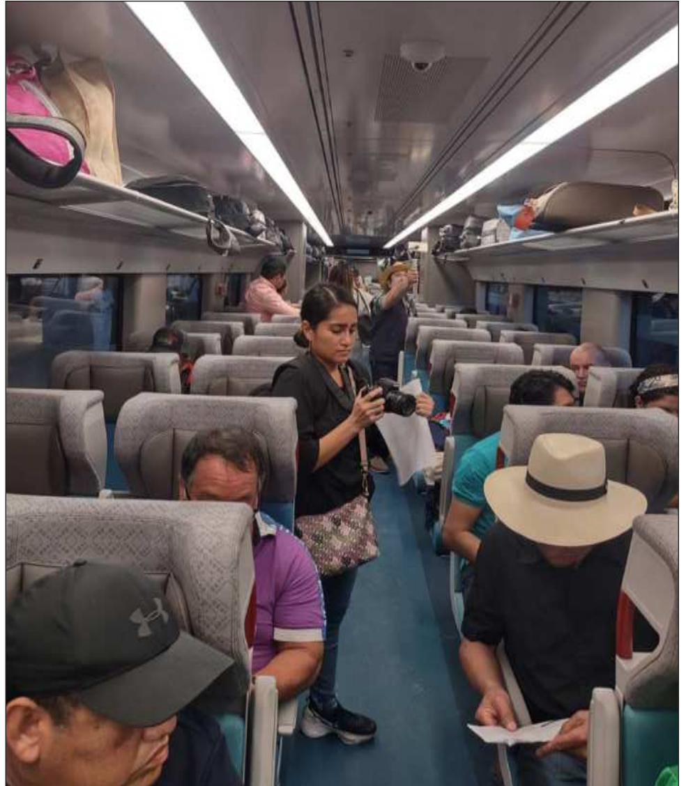
▲ Los pasajeros se decían contentos, orgullosos de que ahora, como no se imaginaban antes, hay un trayecto que circulará por toda la península de Yucatán.

El recorrido valió la pena, decían entre porras los primeros viajeros, muchos de ellos con hambre,