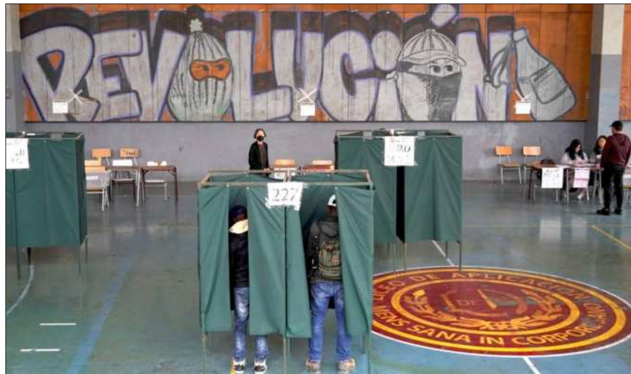
▲ Más de 15 millones de chilenos estaban habilitados para pronunciarse “a favor” o “en contra” de la segunda iniciativa constitucional que iba a sustituir la redactada durante la dictadura, la cual se votó en menos de dos años tras el estallido social de 2019.

Mientras que la derecha tradicional y la ultradere-