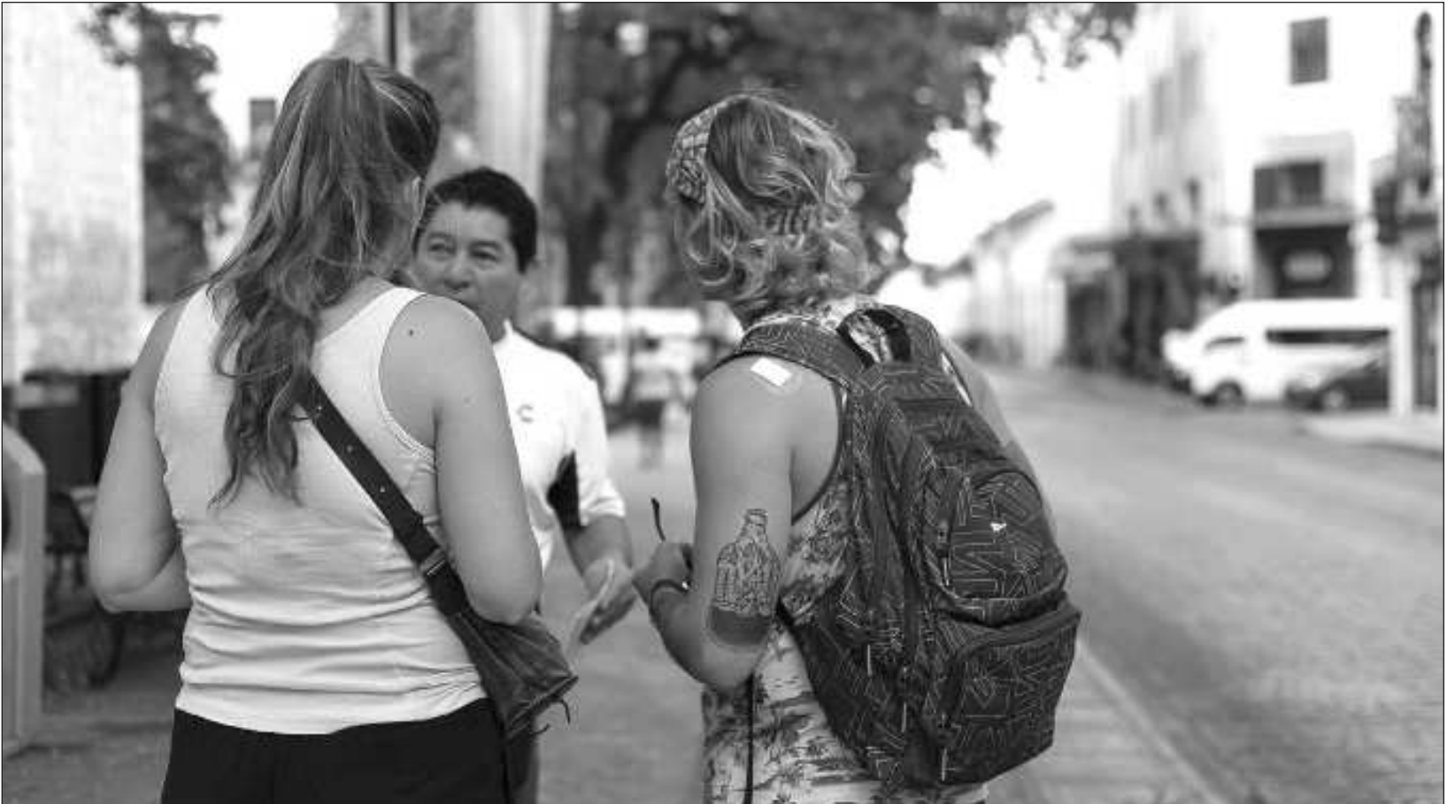
▲ La iniciativa tiene como objetivo crear un espacio de reflexión y diálogo en torno a la experiencia migratoria, centrándose en la perspectiva juvenil.