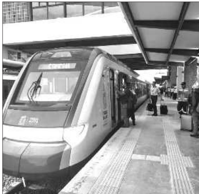
▲ En lo que se hacen los ajustes de sensores electrónicos, o se amplían las vías para permitir el cruce de convoyes y evitar colisiones, se experimentarán retrasos.

En cuanto al precio de los primeros viajes, debe señalarse que el Tren Maya no cuenta por el momento con una plataforma propia para la venta de boletos, y mientras estos se ofrezcan a través de un servicio privado, su adquisición implicará el pago de una comisión. Como han comprobado quienes adquirieron un viaje en taquilla, éste es más económico que mediante un intermediario.