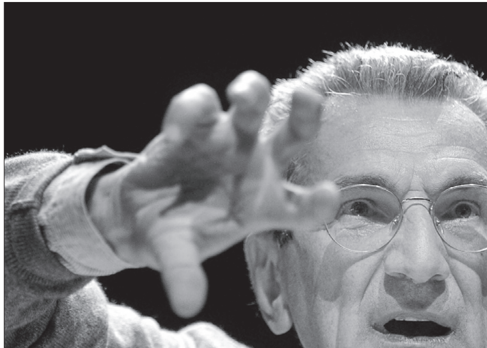
▲ En 1979 Toni Negri fue detenido, acusado de fomentar la insurrección contra las instituciones y del asesinato de Aldo Moro, ex primer ministro italiano y líder de la Democracia Cristiana.