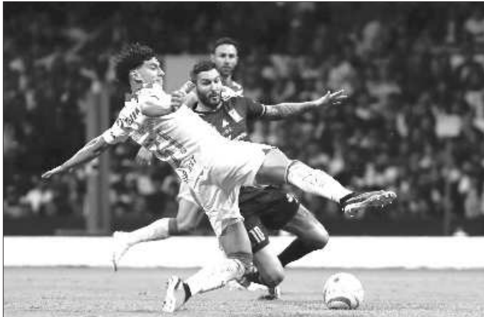
▲ América se convirtió en campeón del fútbol mexicano tras vencer a los Tigres, que no pudieron defender su corona. Las Águilas liquidaron a los regiomontanos en los tiempos extra.

Diego Valdés produjo una pequeña colección de instantes luminosos en la