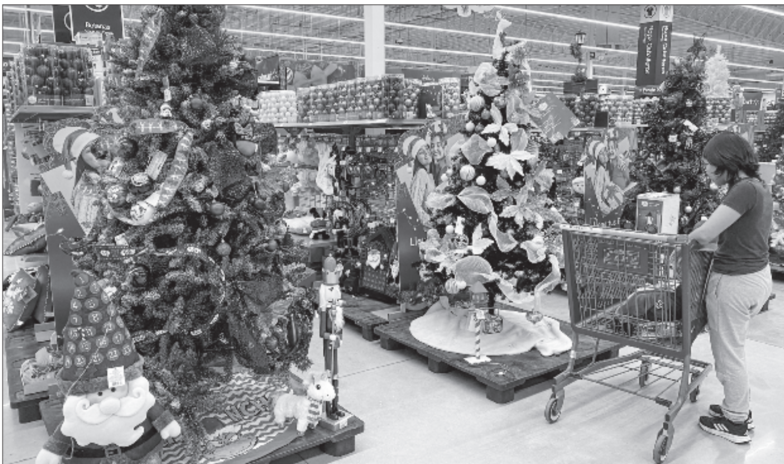
▲ "Me duele que la palabra Navidad haya sido secuestrada por la mercadotecnia que desapareció los nacimientos, porque no venden y en su lugar transformaron al obispo Nicolás de Bari, luego llamado San Nicolás, que dejaba regalos en los zapatos que los niños ponían afuera de sus casas, en un abuelo vestido de rojo".