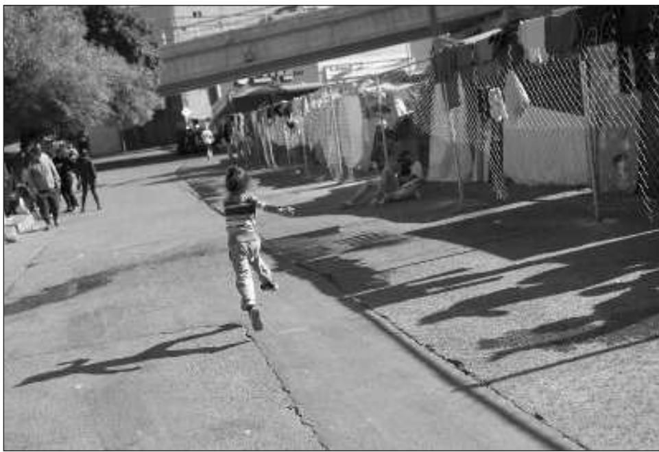
▲ Las autoridades migratorias deben informar los motivos para no retornar a niñas, niños y adolescente; si recibieron alguna documentación, iniciaron su proceso en la Comisión Mexicana de Ayuda a Refugiados, tuvieron refugio u otro proceso de protección complementaria.

“Al analizar el caso, la ponencia a cargo del Comisionado Presidente del INAI determinó que la respuesta solo atendía parcialmente la solicitud de acceso a la información, pues los vínculos electrónicos proporcionados únicamente contienen da-