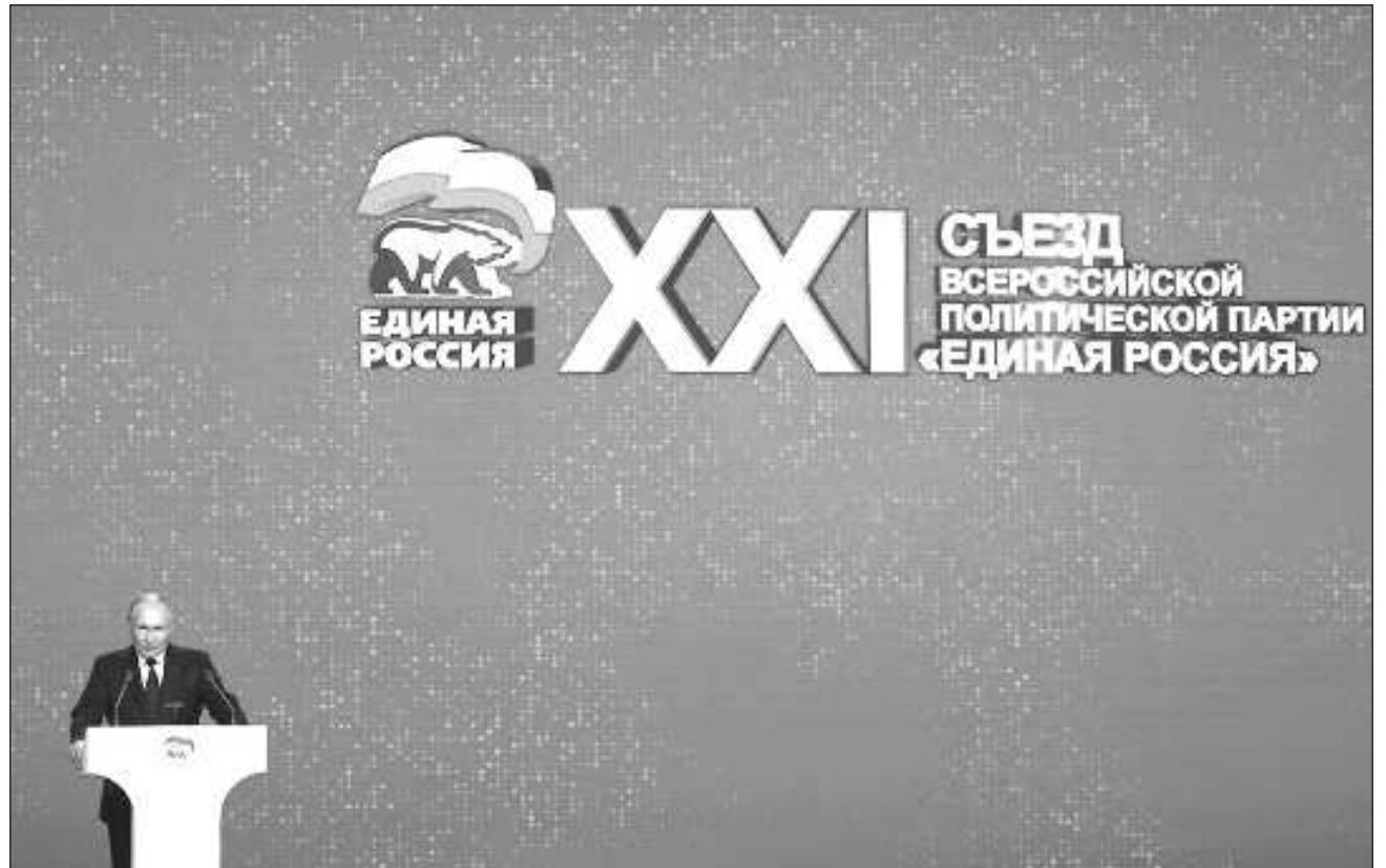
▲ Si Vladimir Putin es reelegido como presidente, una opción probable en un sistema en el que la oposición es casi inexistente, podría permanecer en el Kremlin hasta 2030: todos sus opositores están en la cárcel o en el exilio.

Putin, de 71 años, ha dicho que hará de la “soberanía” uno de los objetivos clave de su quinto mandato en el Kremlin.