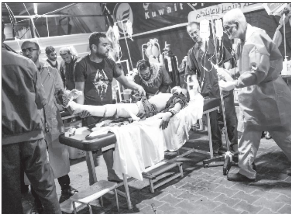
▲ El equipo de la Organización Mundial de la Salud que visitó el centro médico reportó que vio cientos de heridos y que cada minuto llegaban nuevos pacientes.

Los quirófanos ya no funcionan por falta de oxígeno y los empleados de la OMS indicaron que el hospital “necesita ser sometido a una reanimación”.