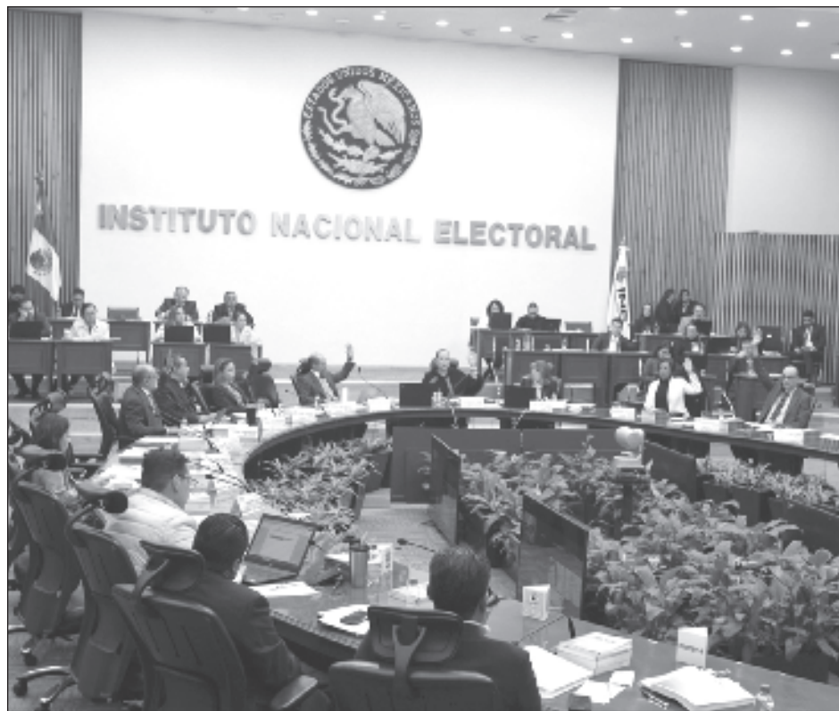
▲ La promoción se llevará a cabo en redes y plataformas digitales; en radio y televisión en México y en el exterior; contacto directo con la ciudadanía y canales disponibles de la Red Consular.

La población objetivo en la que se enfocarán las acciones de los Programas Específicos de Trabajo, en