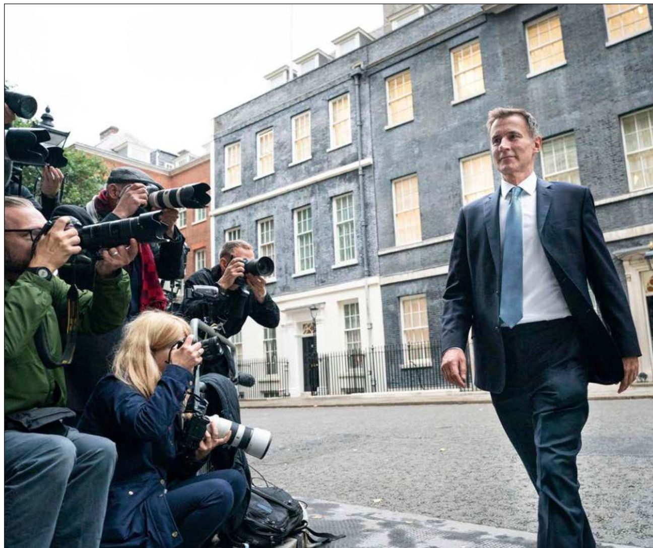
▲ El nuevo secretario del Tesoro, Jeremy Hunt, anunció que el plan que presentó la primera ministra británica, Liz Truss, de reducir un punto porcentual el impuesto sobre los ingresos, no se aplicará a partir de 2023, como estaba planeado.

De Schutter también señaló la urgencia de mejorar el aislamiento térmico de los hogares de cara al inminente invierno en el hemisferio norte, donde podría haber una gran carestía de gas como consecuencia indirecta de la guerra de Ucrania.