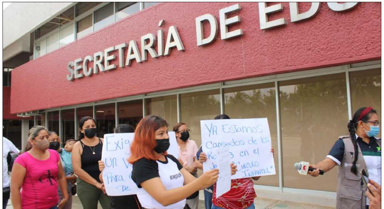
▲ La comunidad del jardín de niños Círculo Infantil reclamó que van 19 robos a la escuela sólo en este 2022.

El jardín de niños Círculo Infantil está ubicado en una de las zonas más conflicti-