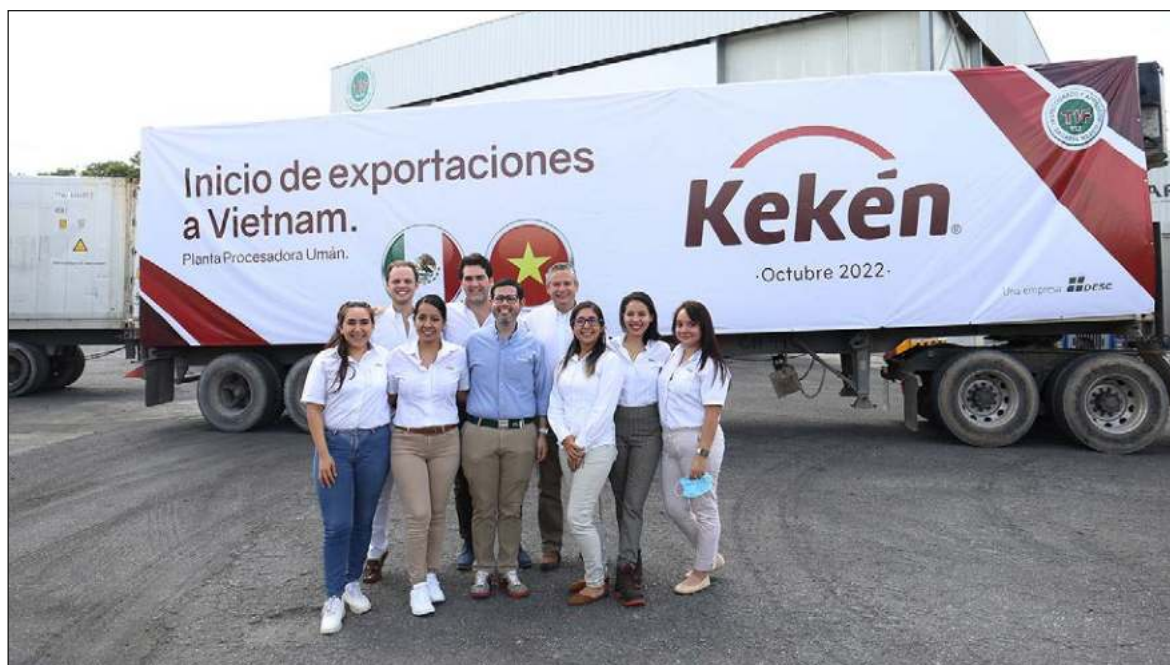
▲ La exportación pactada con Vietnam es de 110 toneladas de carne durante el mes de octubre, de las cuales ha partido ya una quinta parte. Con esto, Kekén tiene presencia en 12 países.