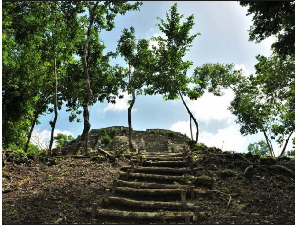
▲ Además de Ichkabal, la proyección es trabajar de manera paralela en otras zonas como El Meco y todos los espacios de este tipo para Quintana Roo, señaló Mara Lezama.

Además de Ichkabal, la idea es trabajar de manera paralela en otras zonas como El Meco y todos los espacios de este tipo para Quintana Roo. Sin duda alguna, compartió Mara Lezama, la llegada del Tren Maya permitirá detonar el potencial de Tulum, Cobá, así como todas las comunidades cercanas tanto del proyecto como de alguna zona arqueológica.