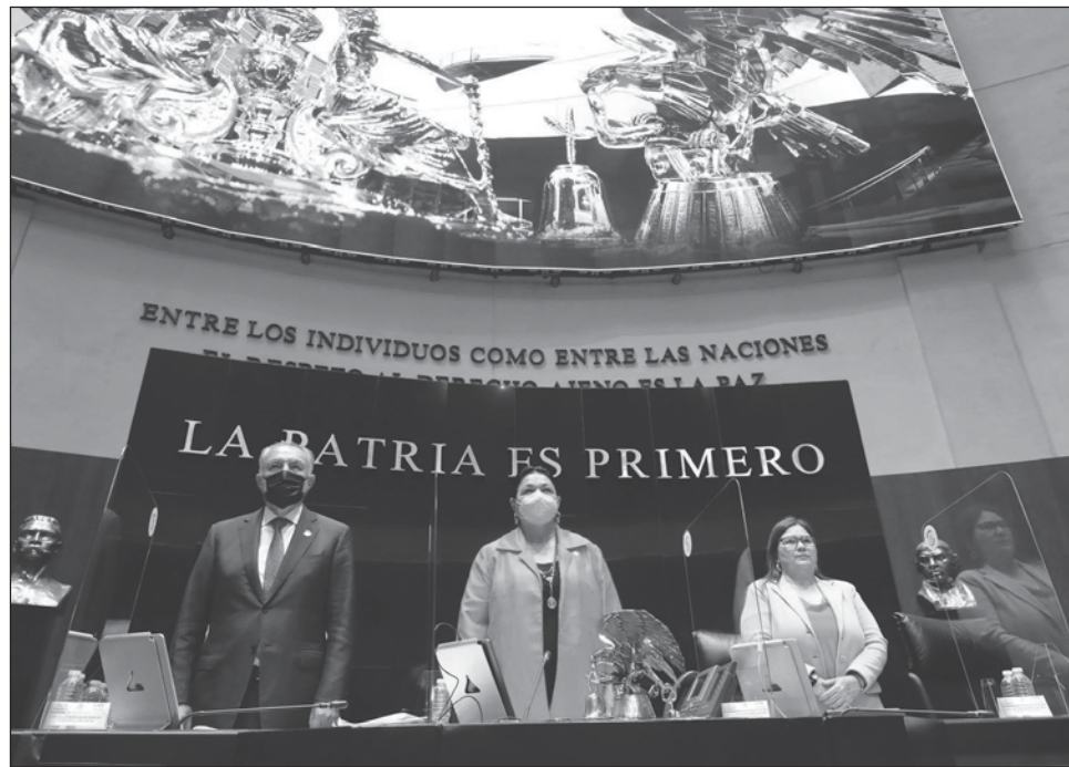
▲ Dulce María Sauri Riancho, ex presidente del PRI, reconoció que “faltan muchísimas cosas por transformar para llegar a una verdadera igualdad”.

“Uno de los temas recurrentes que han emergido a raíz de la llegada de las mujeres, es el tema de la violencia política en razón de género, que se da tanto para tratar de impedir la candidatura, pero también para impedir el ejercicio del cargo para el cual han sido electas”.