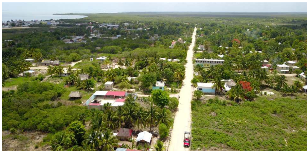
▲ Se destinará la superficie de 74.05 metros cuadrados de zona federal marítimo terrestre ubicada en el bulevar costero de Chiquilá; mientras que en Holbox se cedieron 103.41 metros cuadrados en la zona ubicada en la avenida Caleta.

La siguiente publicación específica: "se destina al servicio de CFE Distribución, empresa productiva subsidiaria de Comisión Federal de Electricidad, la superficie de 103.41 metros cuadrados de zona federal marítimo terrestre del estero, ubicada