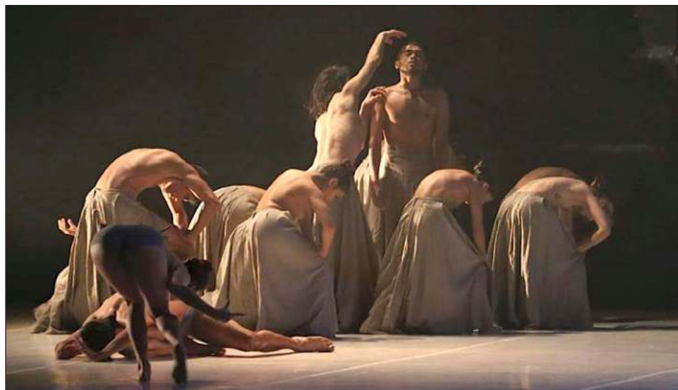
▲ En la obra, que se presenta en la edición 50 del Cervantino el 20 y 21 de octubre a las 21 horas en el Teatro Juárez de Guanajuato, se escucha la voz en off de Mario Lavista explicando aspectos interesantes de su vida y su interés por la música religiosa y contemporánea.