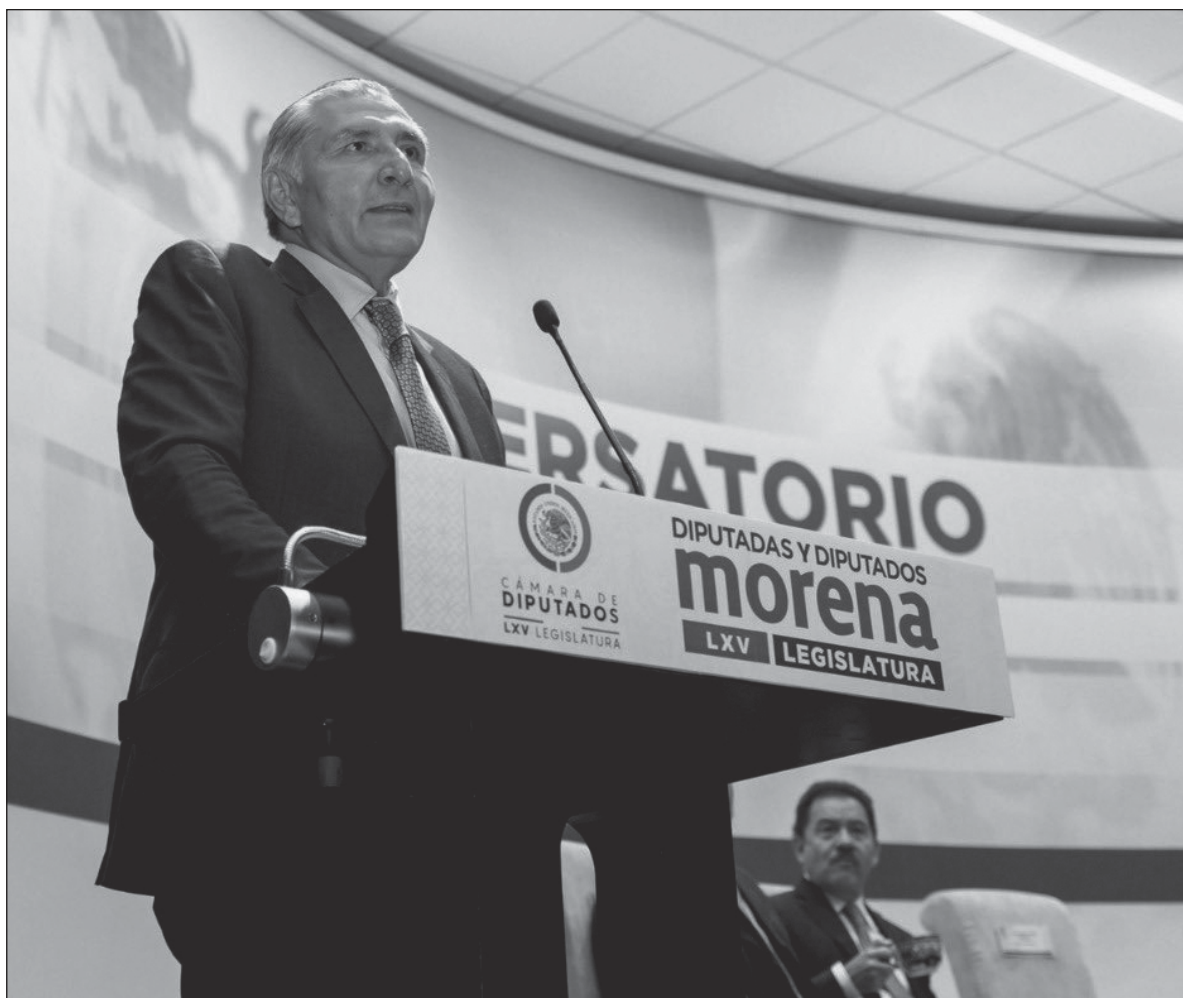
▲ Adán Augusto López Hernández, anunció en días pasados que se trabó un acuerdo con el PRI que va más allá del punto de la Guardia Nacional y la continuidad militar en ella.

LA INICIATIVA PRESIDENCIAL , que fue redactada por Pablo Gómez, director de la Unidad de Inteligencia Financiera