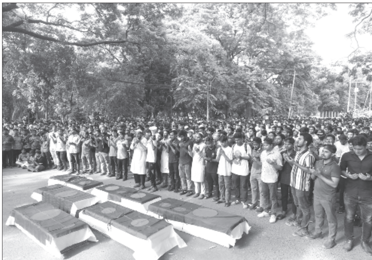
▲ Las movilizaciones exigen desde hace dos semanas al gobierno que ponga fin a la reserva de 30% de las ofertas de trabajo públicas para descendientes de los combatientes de la guerra de liberación del entonces Pakistán en 1971.

Biden abordó el avión presidencial y les dijo a los reporteros que viajaban con él que “me siento bien”. El mandatario no utilizaba mascarilla en su trayecto hacia el avión presidencial. Había estado previamente en el restaurante Original Lindo Michoacan de Las Vegas.