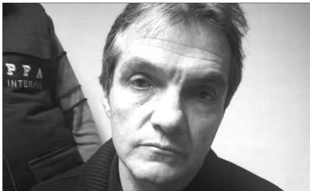
▲ Son esos actos recurrentes, contrarios a la justicia y en los que es inevitable sospechar corrupción, los que han situado al Poder Judicial en la cima de su desprestigio.