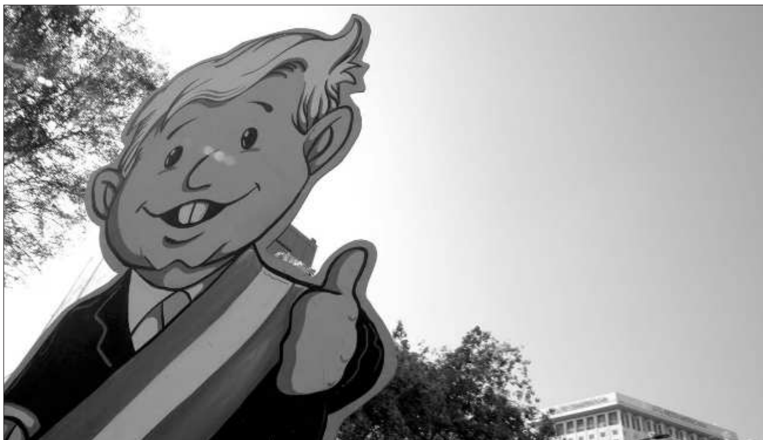
▲ “Morena ha tenido un rápido crecimiento desde su nacimiento a partir de 2011 cuando Andrés Manuel López Obrador, con miras en las elecciones presidenciales de 2012 lo creó como asociación civil para ‘impulsar la democracia y la defensa de la soberanía de México’”.