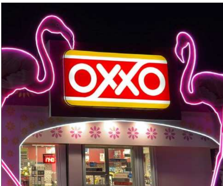
▲ Se instalaron 45 mil terminales en Oxxos para que los clientes cuya tarjeta cuente con la tecnología contactless puedan hacer sus pagos con solo acercar el plástico.

La Cepal calcula que el año pasado el incumplimiento tributario –la evasión y elusión– representó alrededor de 6.7 por ciento del PIB; y a ello se suman las renuncias –esquemas con los cuales las oficinas fiscales renuncian a cobrar todo lo que podrían recaudar– que en promedio equivalen a 3.7 por ciento del PIB.