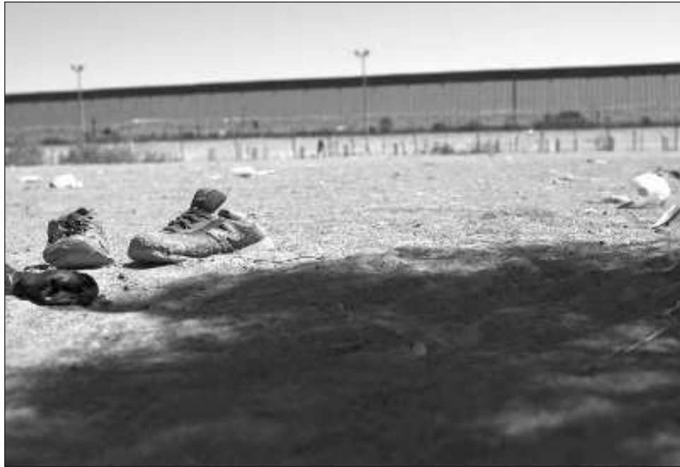
▲ López Obrador llamó a las autoridades de la nación vecina y a miembros del Partido Republicano a emprender una revisión a fondo de la crisis que enfrenta su país, en particular los altos consumos de drogas sintéticas entre jóvenes, antes que responsabilizar a la migración de las problemáticas.

día de actividades de la Convención Nacional Republicana —que la víspera ungió a Donald Trump como su candidato presidencial—, diversos perso-