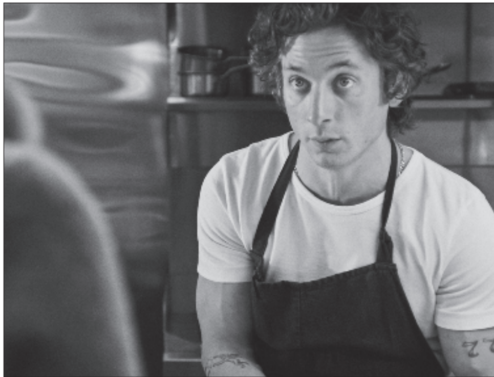
▲ Shogun aprovechó al máximo la ausencia de Succession , The White Lotus y The Last of Us para dominar en drama y darle a FX el tipo de año fuerte a menudo reservado para HBO.

También fue impulsado por una gran cantidad de nominaciones de actores invitados, incluidos Jamie Lee Curtis y Olivia Colman, dos