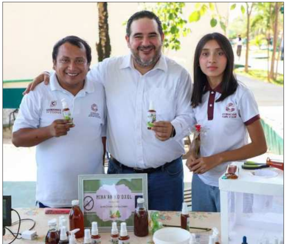
▲ El objetivo de Lombrifex 3.0 es proporcionar soluciones sostenibles y amigables con el medio ambiente a través del uso de lombrices para el tratamiento y mejora de suelos agrícolas.

“Queremos seguir impulsando el desarrollo y crecimiento de las empresas, además de fomentar las agroindustrias, por ahora, en las ramas de miel, chocolate, queso y café”.