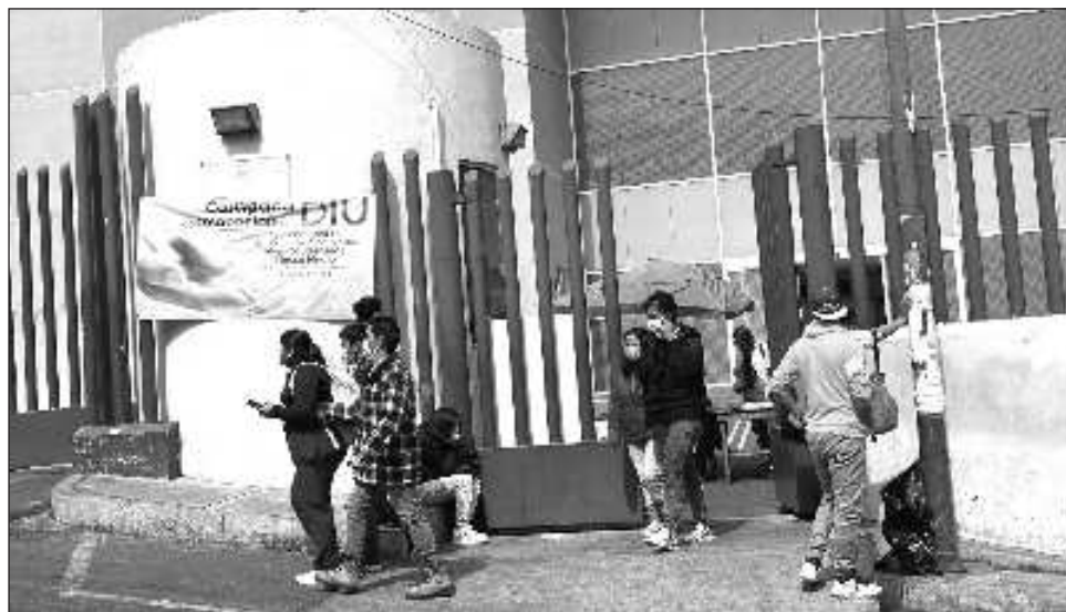
▲ El especialista puntualizó que aunque se registra el ingreso al país de nuevas subvariantes del coronavirus, hasta ahora no tienen la capacidad de provocar cuadros graves de la enfermedad.

El resto de institutos y nosocomios trabajan con normalidad en la atención de los pacientes en las respectivas especialidades, afirmó el también titular de la Comisión Coordinadora de los Institutos Nacionales de Salud y Hospitales de Alta Especialidad y recordó que desde su aparición en el mundo, la transmisión del coronavirus se ha incrementado en verano e invierno.