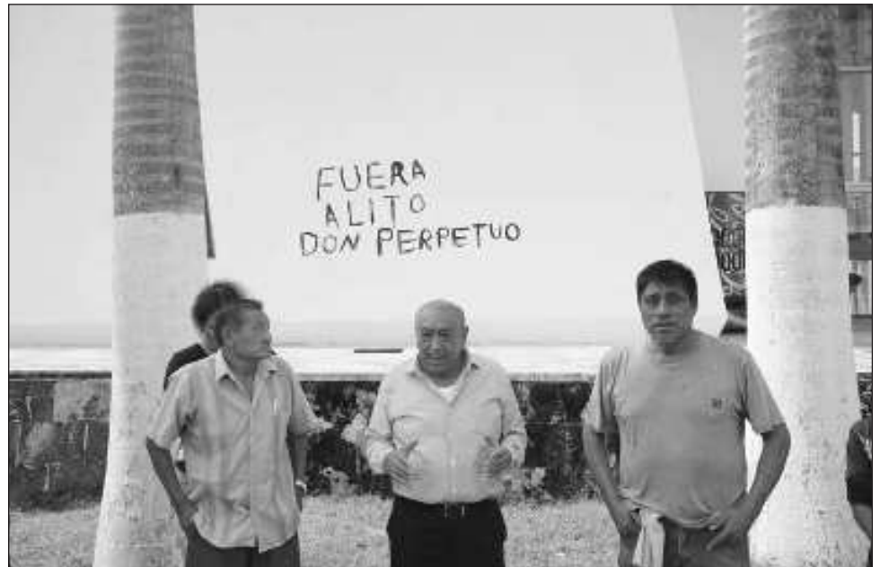
▲ Uno de los integrantes de Grupo Resurgimiento fue detenido por elementos de la Policía Estatal tras rayar una de las paredes del inmueble con el lema "Fuera Alito, don Perpetuo".

El veterano priista nuevamente arremetió contra el ex gobernador de Campeche y dijo "desde su llegada a la gubernatura del estado se vislumbraba el mal momento del tricolor , y cuando comenzó su plan para hacerse de la dirigencia nacional, sa-