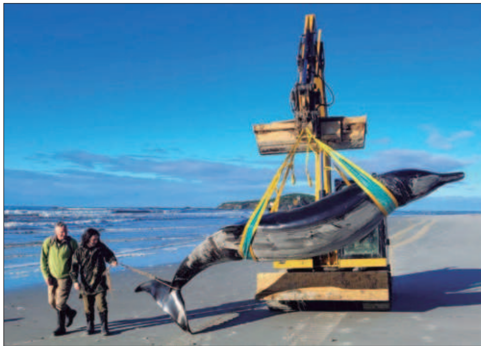
▲ Desde el siglo XIX sólo se han documentado otras seis ballenas de esa especie en todo el mundo, por lo que los científicos saben "muy poco; prácticamente, nada sobre ellas".

Si se confirma que el cetáceo es un ejemplar de la esquiva ballena picuda de Bahamonde, sería el primero encontrado en un es-