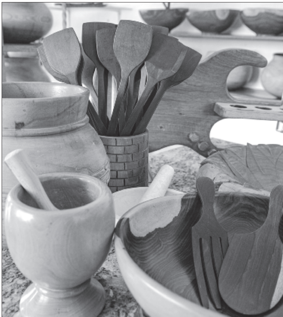
▲ En la edición 23 de la Feria Artesanal Tunich participarán 140 artesanos de piedra y madera y alrededor de 20 cocineros y cocineras tradicionales.

Se espera una derrama económica de más de 6 millones de pesos para superar la cifra de la edición pasada.