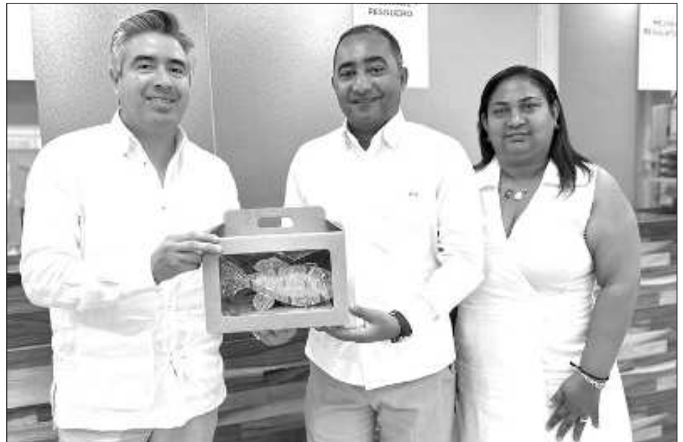
▲ Como parte de la visita, la delegación dominicana visualizó las estrategias de marketing digital turístico implementadas por la administración de Diego Castañón Trejo, conoció la operatividad del CITAEM y recorrió las instalaciones del aeropuerto internacional.

“Yo entiendo que sí, que lo podemos lograr, venimos hoy a visitar el aeropuerto, ver las condiciones y luego poner (en contacto) tanto a la dirección del aeropuerto de Punta Cana como a la dirección del aeropuerto de Tulum y que puedan ambos aeropuertos decir si se puede hacer y nosotros motivar a las líneas aéreas que ya tene-