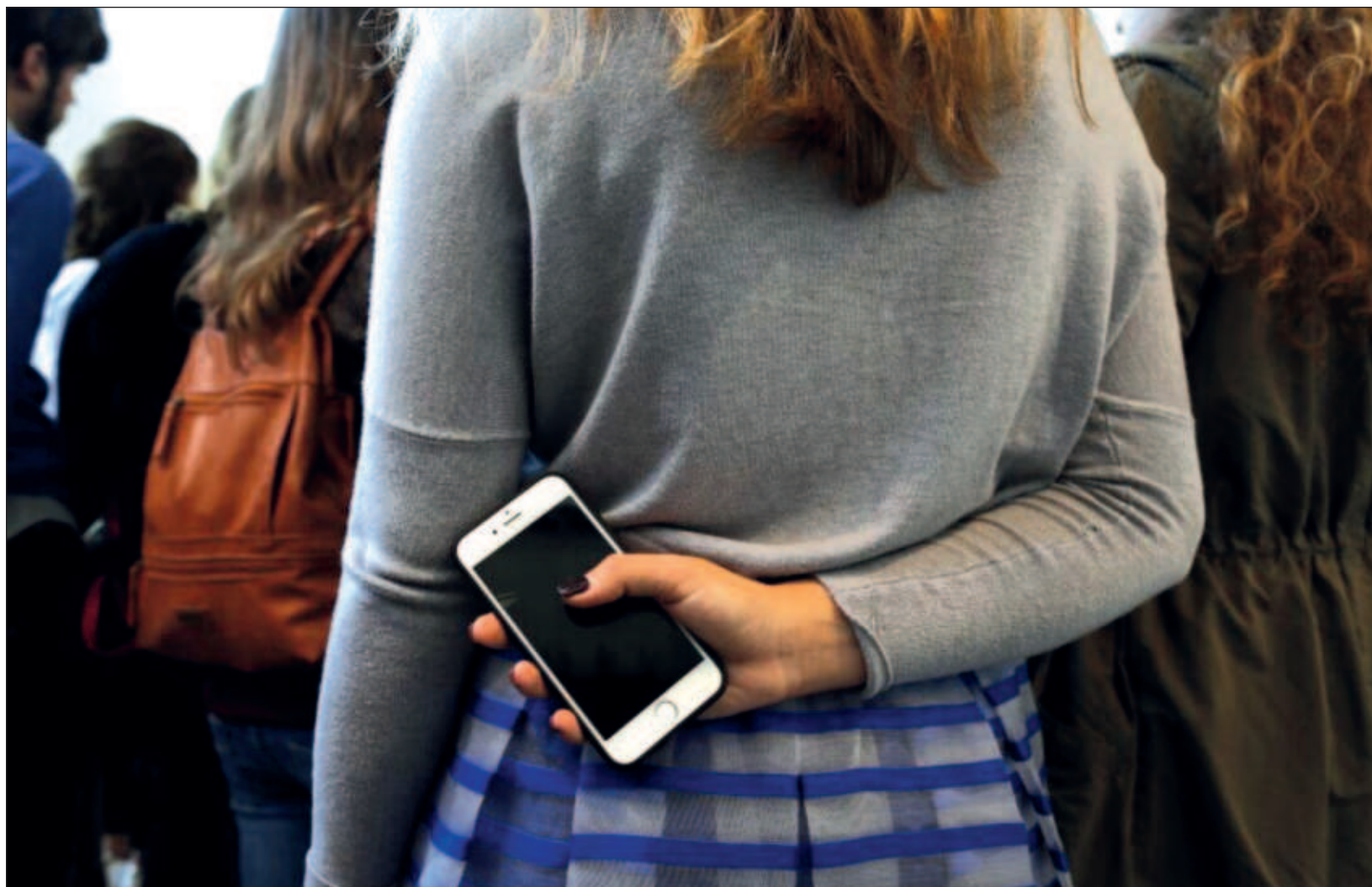
▲ La Encuesta Nacional sobre Disponibilidad y Uso de las Tecnologías de la Información en los Hogares 2023 estimó que la población de 12 años y más fue de 106.7 millones de personas. De ese total, entre marzo y agosto de 2023, 87.9 millones de personas utilizaron internet en cualquier dispositivo.

La Encuesta Nacional sobre Disponibilidad y Uso de las Tecnologías de la Información en los Hogares (ENDUTIH) 2023 estimó que la población de 12 años y más fue de 106.7 millones de personas. De ese total, entre marzo y agosto de 2023, 87.9 millones de personas utilizaron internet en cualquier dispositivo: 46.7 millones fueron mujeres y 41.2 millones, hombres.