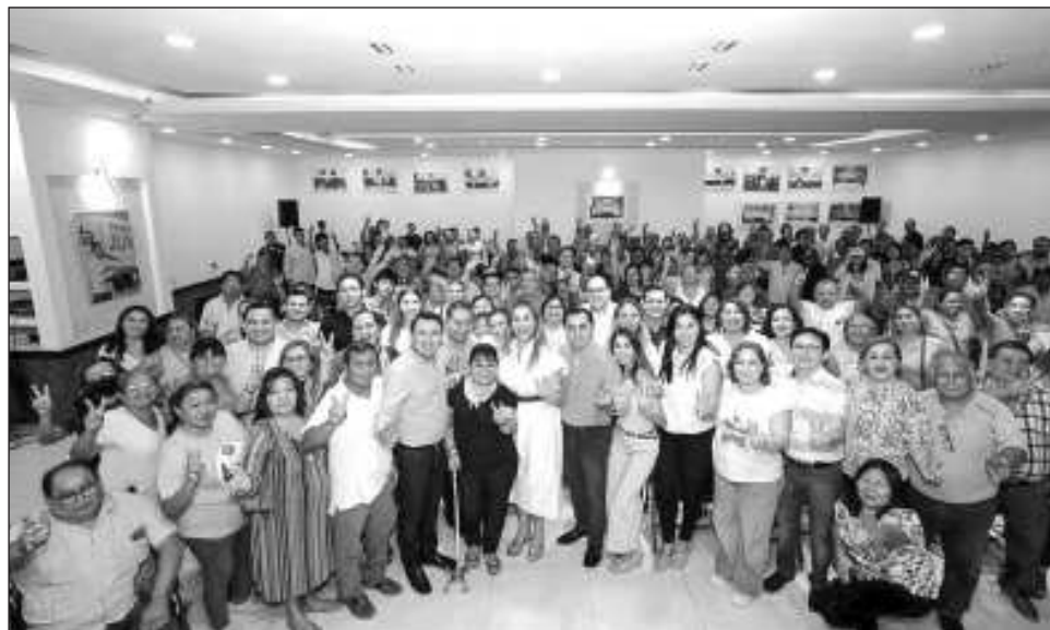
▲ En reunión con la estructura panista pidió reflejar el sentir ciudadano.

La alcaldesa electa agregó que a lo largo de la historia de Yucatán los panistas siempre han mantenido la unidad, y ahora no será diferente. Destacó que Mérida siempre ha contado