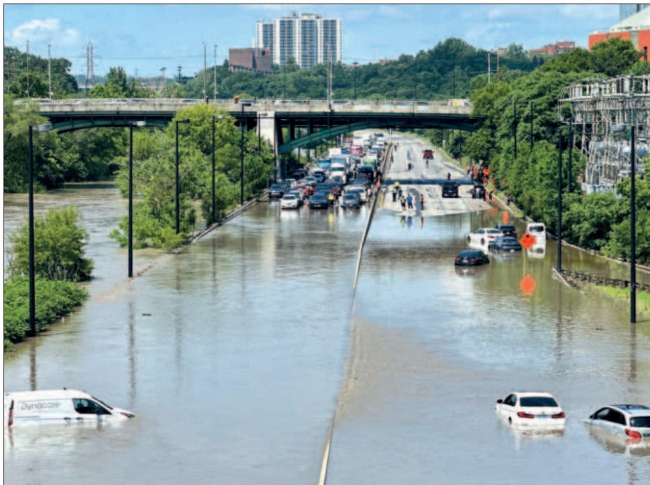
▲ La nueva oleada de fuertes tormentas dejando a conductores varados en los alrededores de Toronto.

Ciudades en todo el norte del estado de Nueva York realizaban labores de limpieza luego de que una tor-