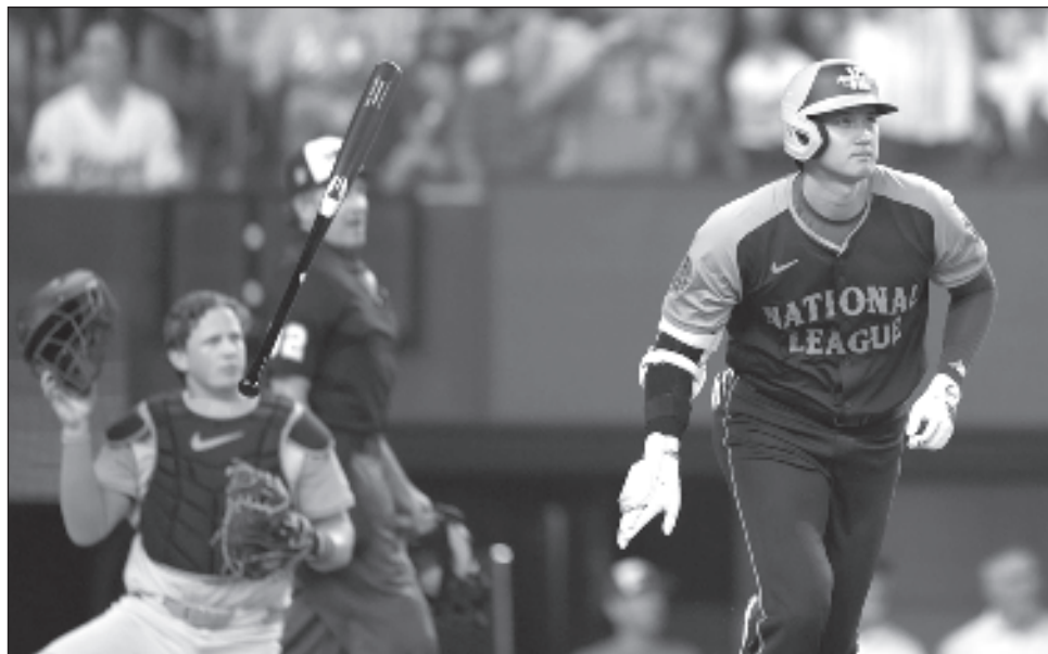
▲ El jonrón de Shohei Ohtani fue parte de una destacada semana estelar para los Dodgers.

Durán se cercioró de darle al Joven Circuito su victoria 48 en la historia del clásico de media temporada. El Viejo Circuito suma 44 triunfos. "Fue un momento surrealista. Simplemente agradezco el estar aquí", dijo Durán, uno de