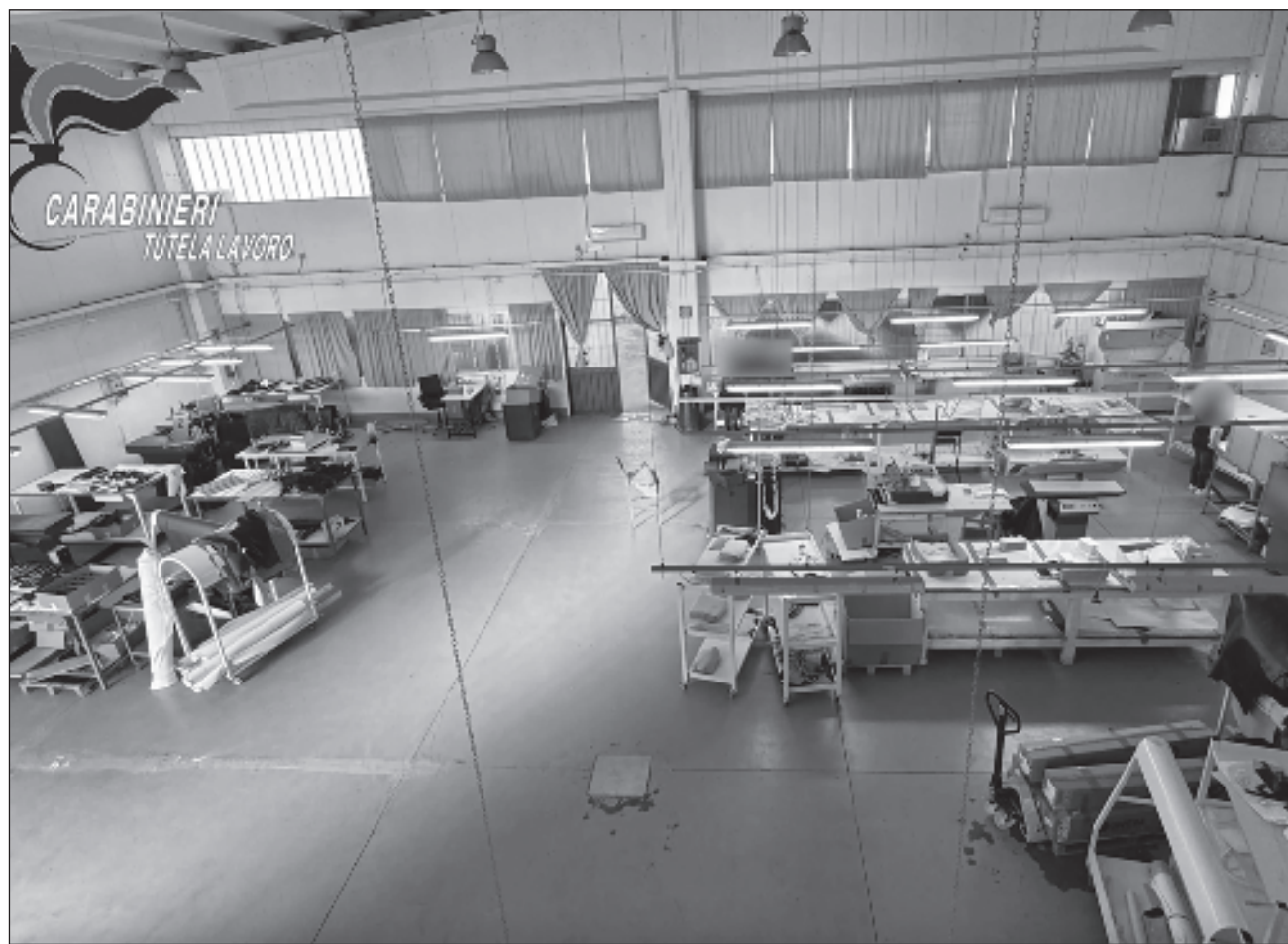
▲ Armani y Dior “habrían hecho hincapié en lo artesanal y la excelencia de la mano de obra”, pero “en contra de tales afirmaciones, se abastecían en talleres y fábricas con trabajadores que percibían salarios inadecuados”.

En su página web, la AGCM reveló que “ha iniciado una investigación contra determinadas sociedades del Grupo Armani (Giorgio Armani S.p.A. y G.A. Operations S.p.A.) y del Grupo Dior (Christian Dior Couture S.A., Christian Dior Italia S.r.l. y Ma-