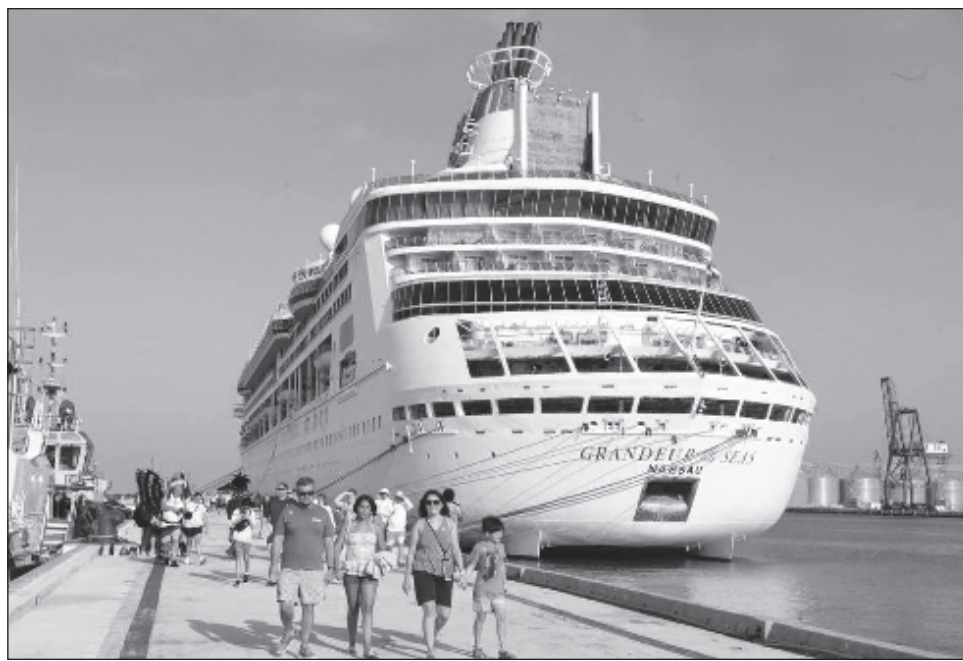
▲ Procedente de Tampa, Florida, la embarcación Grandeur of the Seas arribó en puerto Progreso a las 6:53 horas y tras bajar sus paseantes a conocer lo que la entidad y su gente ofrecen, continuará su itinerario de cinco días y se dirigirá hacia Cozumel, Quintana Roo.

En la bienvenida, se realizó el intercambio de placas conmemorativas por este primer arribo entre representantes de la nave y del gobierno de Yucatán, así como con autoridades del puerto de Progreso.