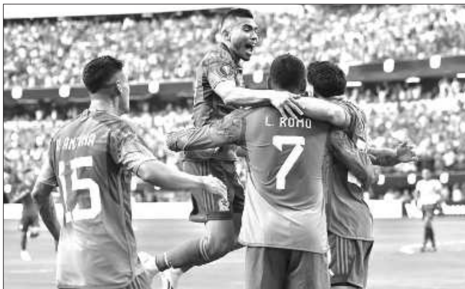
▲ Javier Aguirre llegaría por tercera vez a apagar el fuego en el Tricolor.

Lo primero será hacer oficial la llegada de Javier Aguirre para un tercer mandato al frente del "Tri", luego de dirigir en las Copas del Mundo de Corea y Japón 2002 y Sudáfrica 2010, en las que alcanzó los octavos de final. ESPN reportó el miécoles que sólo faltan detalles para cerrar el acuerdo.