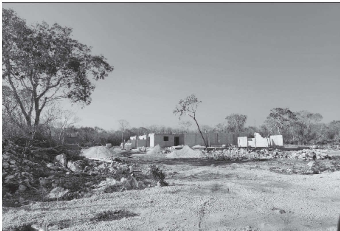
▲ "Cientos de compradores nacionales e internacionales (...) denuncian que dicha empresa en la que se encuentran involucrados en su fundación políticos yucatecos, presuntamente comete un fraude inmobiliario por más de 500 millones de pesos al incumplir con la entrega de cientos de terrenos y casas".