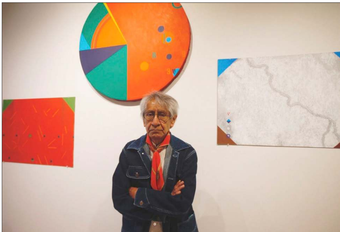
▲ El pintor y grabador también es activista del movimiento estudiantil del 68 e integrante del Grupo Mira.

La muestra, integrada por 54 pinturas, realizadas con diferentes técnicas y sobre diversos soportes, así como documentos, forma parte de un programa de la GJMV que consiste en dar seguimiento a artistas que trabajan desde los años 60, homenajear su producción y situarlos en un México que ya no existe, expresa Alfredo Matus, director de la galería. En el contexto del arte mexicano no tenemos esta historia continua, asegura.