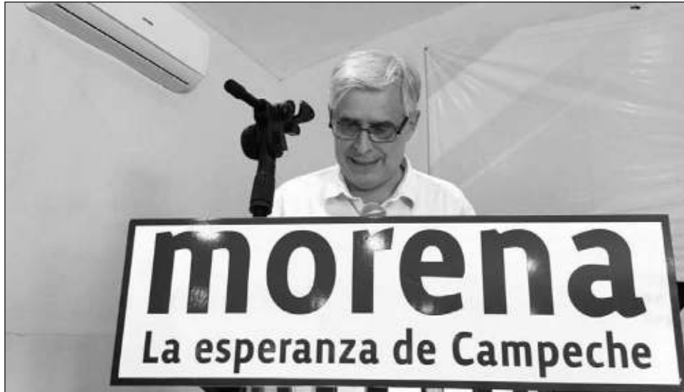
▲ El caricaturista de La Jornada aseguró que el personaje más dibujado en los últimos meses ha sido Alejandro Moreno Cárdenas, por sus audios y ocurrencias en el PRI.

Respecto al tema de los desvíos de partidos políticos en campañas electorales y que el Instituto Nacional Electoral (INE) no ha castigado a nadie, pero inició una persecución de personajes