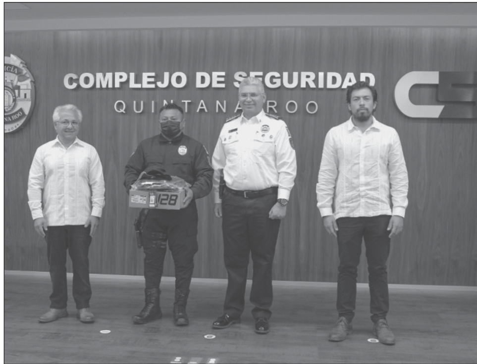
▲ Los uniformes entregados son para proporcionarles a las y los oficiales, un instrumento más para desarrollar en mejores condiciones su labor.

Es por ello que los uniformes que se entregaron el pasado 14 de julio, en las