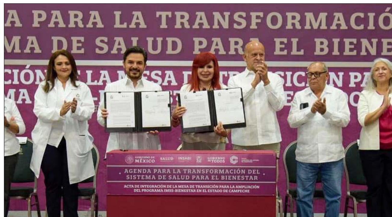
▲ El director general del IMSS, Zoé Robledo, resaltó que la intención del Plan de Salud para el Bienestar es integrar un sistema que por muchos años estuvo fragmentado, a fin de garantizar la gratuidad de los servicios.

Zoé Robledo enfatizó es necesario trabajar de manera conjunta y en equipo, con mesas de trabajo para informar a gobernantes, a quienes representan personal, a cámaras empresariales e instituciones educativas, en qué consiste IMSS-BIENESTAR y su experiencia de más de 43 años en la atención de personas sin segu-