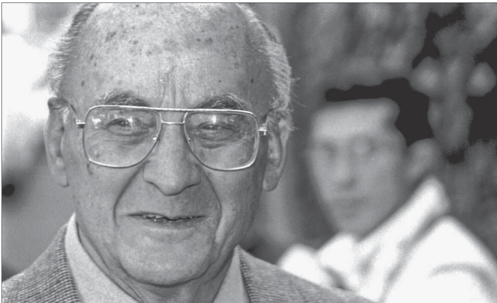
▲ "El personaje que yo conocí, era un hombre curioso, inteligente, juguetón, visionario, casado con una gran mujer".