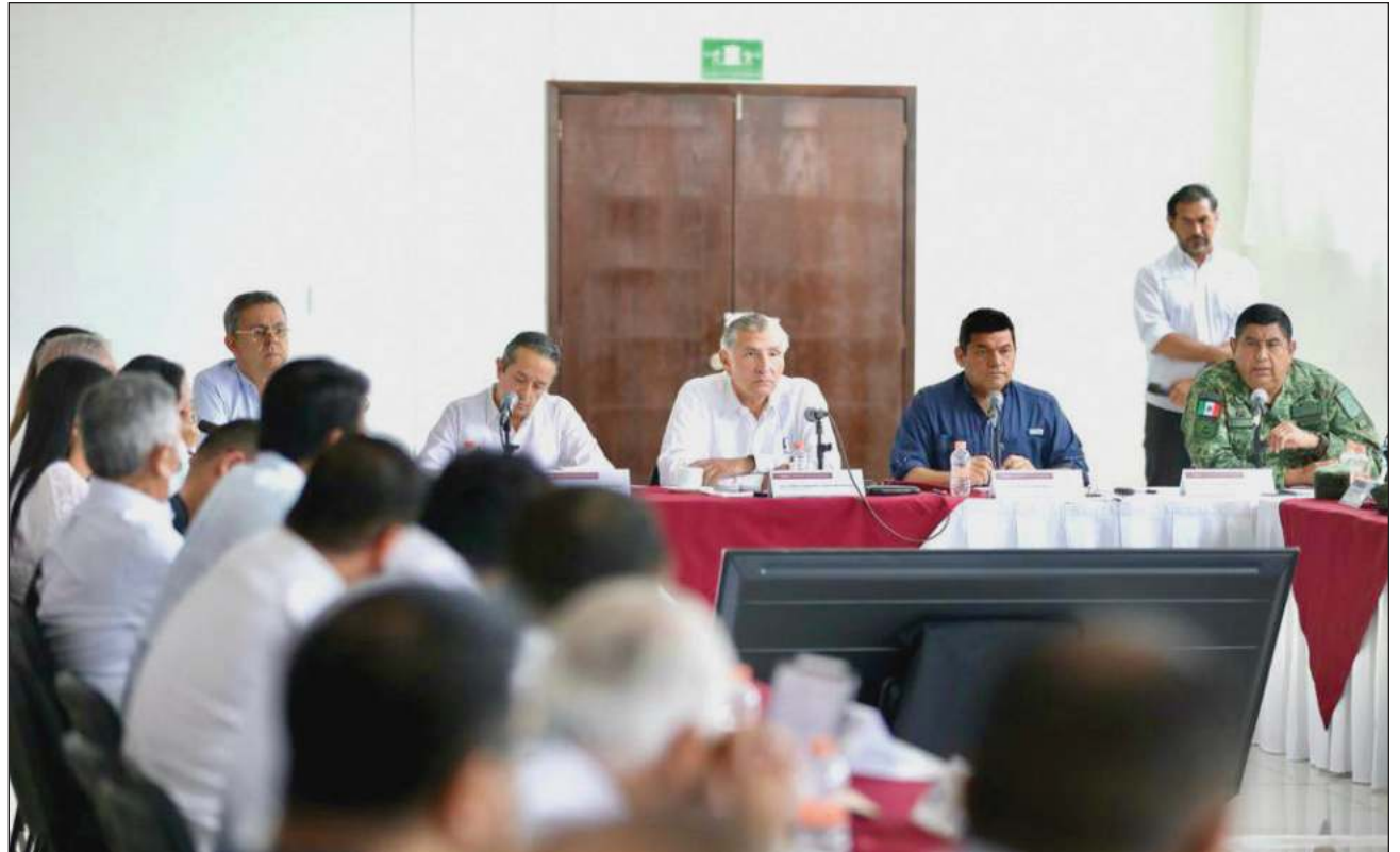
▲ En la presentación compartida se pueden ver detalles del tramo 5 Sur, el cual fue dividido en tres subtramos y asignado a diferentes constructoras, dejando de lado a Grupo México, concesionario inicial.

En la presentación compartida se pueden ver detalles