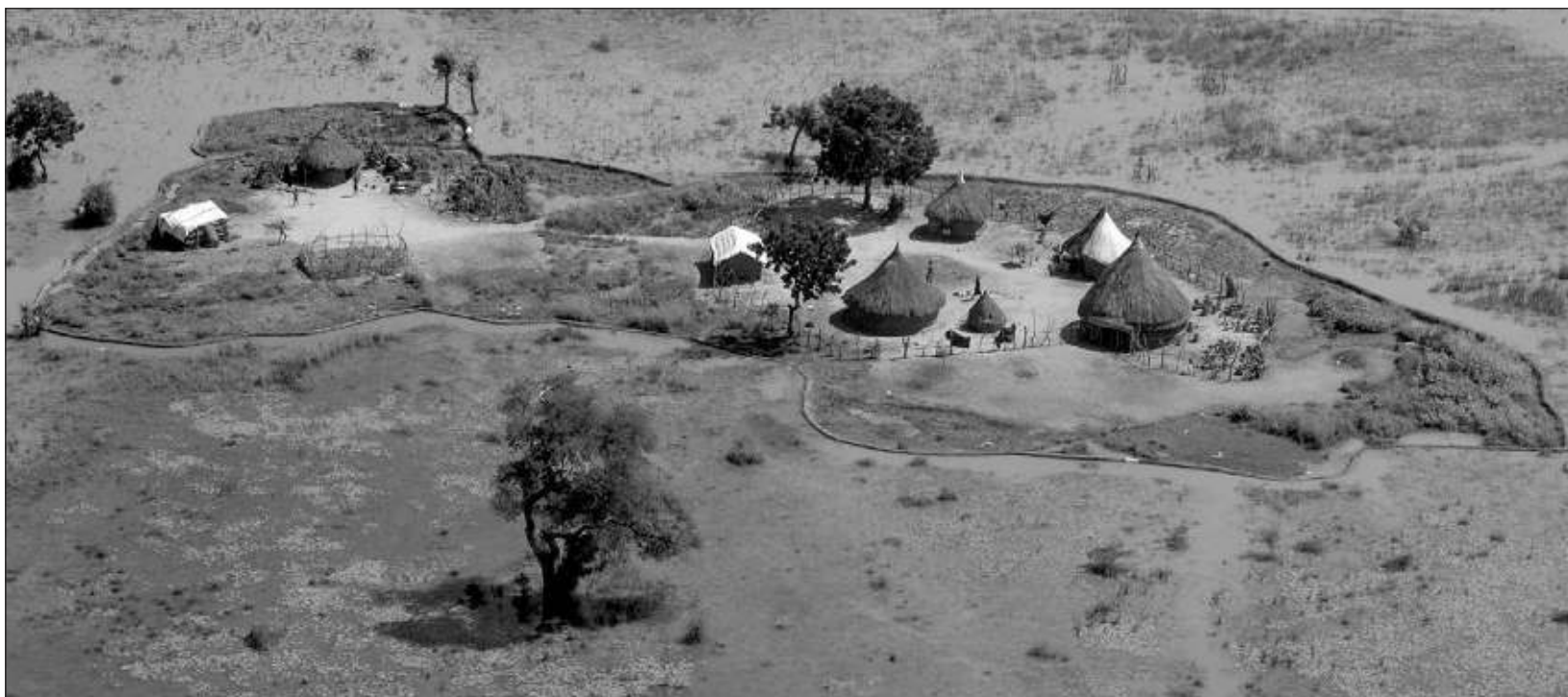
▲ Las inundaciones han dejado aislados a los habitantes de Sudán. La Acnur y otras entidades están tratando de llevar ayuda humanitaria a las comunidades.