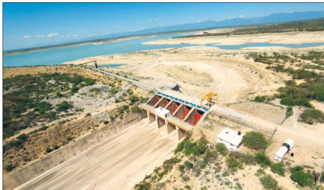
▲ El incidente entre SADM y agricultores neoleonese demuestra que la crisis de abasto de agua en la entidad norteña está muy lejos de una solución real, pese al optimismo del gobierno de Samuel García.

En el fondo, se trata de decidir entre la continuidad de un modelo económico que pone las ganancias privadas como fin último y prioridad absoluta, o la construcción de un nuevo paradigma que privilegie el uso racional de los recursos finitos y anteponga la vida humana a cualquier otra consideración. De no tomarse medidas audaces y reales para dejar atrás la insostenible lógica neoliberal, episodios como el suscitado antier en Allende pasarán a conformar la cotidianidad en todo el país y en el mundo.