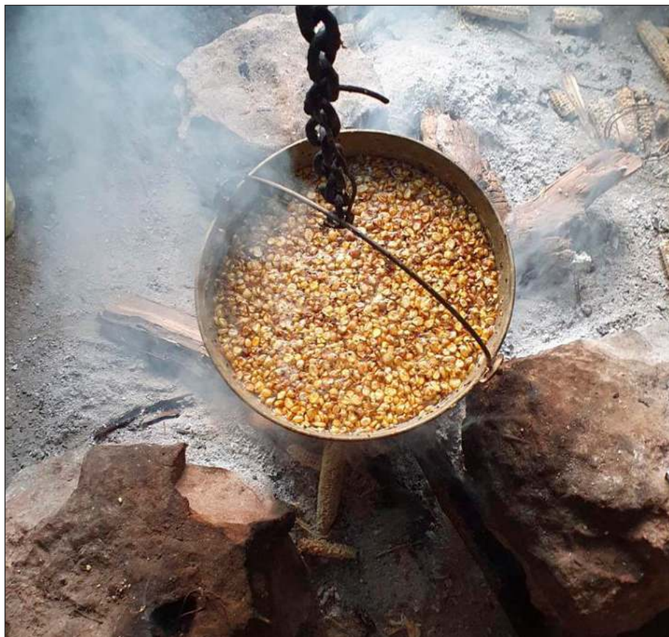
▲ La nixtamalización es un proceso tradicional de preparación del maíz en el que los granos secos se cuecen y se sumergen en una solución alcalina, generalmente de agua y cal alimentaria.

Como parte de los eventos gastronómicos que ha realizado la organización para está el primer Festival del Salbut, que se hizo el pasado junio en la ciudad de Mérida; así como el segundo Festival del Helado Yucatán, y el Festival de la Torta en Campeche. Entre los eventos en puerta, está el Dharma Fest, un evento de comida vegetariana y vegana que se realizará en el Teatro Minerva, en la ciudad de Chetumal, el próximo 16 y 17 de julio. Así como el Chetumal Fest, el 23 y 24 de julio en la Explanada de la Bandera, y el Festival del Helado en Campeche, el sábado 30 de julio.