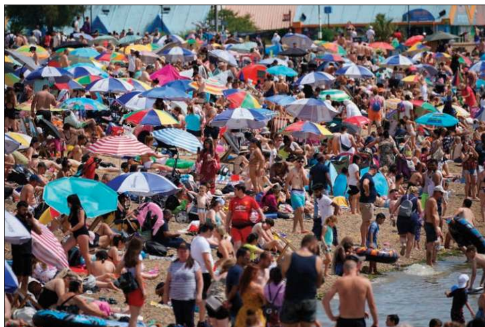
▲ En Inglaterra, el Colegio de Paramédicos advirtió que se ha querido minimizar la ola de calor, indicando que "no es un bonito día de sol en que puedas ponerte crema solar".

Las llamas obligaron a evacuar a algo más de 3 mil personas, pero 2 mil pudieron regresar a sus hogares.