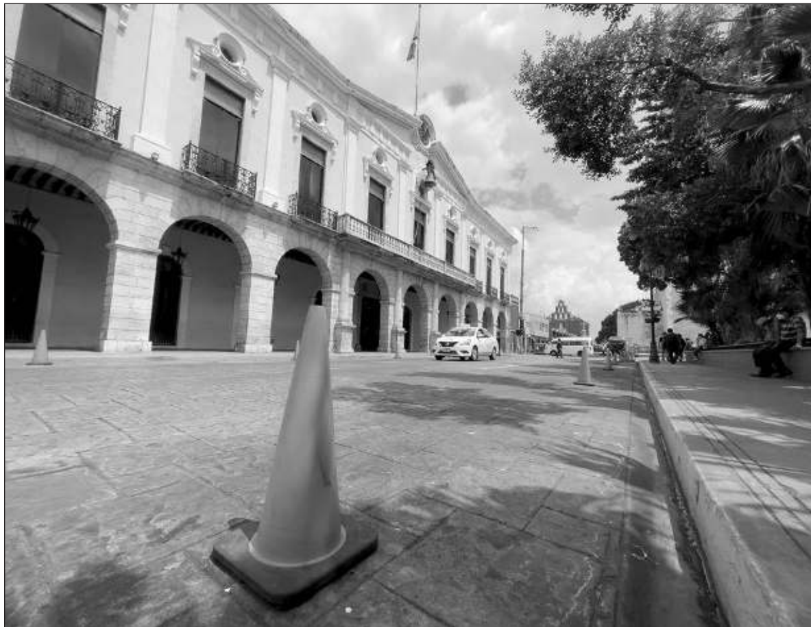
▲ "Por aquí brinca uno, por allá otro. El 2024 se ve con ansiedad como si ya fuera mañana, y todo queda sometido al imperativo de ser el unguido, de ser el 'rostreado', sobre todo en esta época en que con ponerse una camiseta color guinda se da una transformación mágica que borra pasados dudosos, por decir lo menos, y corruptelas. Total, nadie investiga".