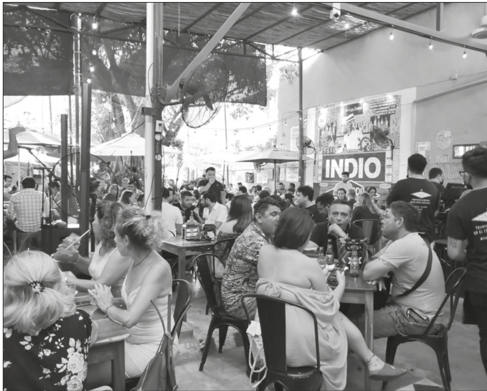
▲ La Negrita es una referencia del ambiente meridano para el turismo.

Además, sienten que es un lugar seguro para sus visitas, en donde pueden enfiestarse o tener una convivencia más tranquila y al mismo tiempo disfrutar con la música en vivo del lugar que suele variar mucho en géneros.