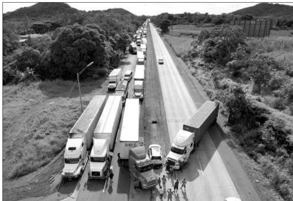
▲ El acuerdo es por tres meses renovables y también contempla seguir negociando reducciones en la canasta básica y en medicinas, esto frente a un escenario inflacionario de 4 a 2 por ciento.

En Chiriquí se producen la mayoría de los alimentos frescos de Panamá, y el cierre de la provincia complicaba el abastecimiento en el país. El acuerdo es por tres meses renovables y también contempla seguir negociando reducciones en la canasta básica y en medicinas.