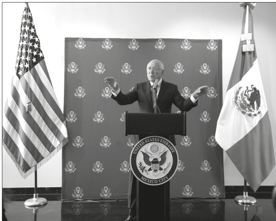
▲ Las declaraciones del embajador ocurrieron luego de que fuentes de alto nivel de inteligencia estadounidense aseguraron que la DEA participó en el operativo.

El diputado panista Santiago Creel Miranda reconoció al gobierno de López Obrador y a la Secretaría de Marina. “Ojalá este sea el inicio de un trabajo de inteligencia que disminuya el crimen organizado nacional y transnacional”.