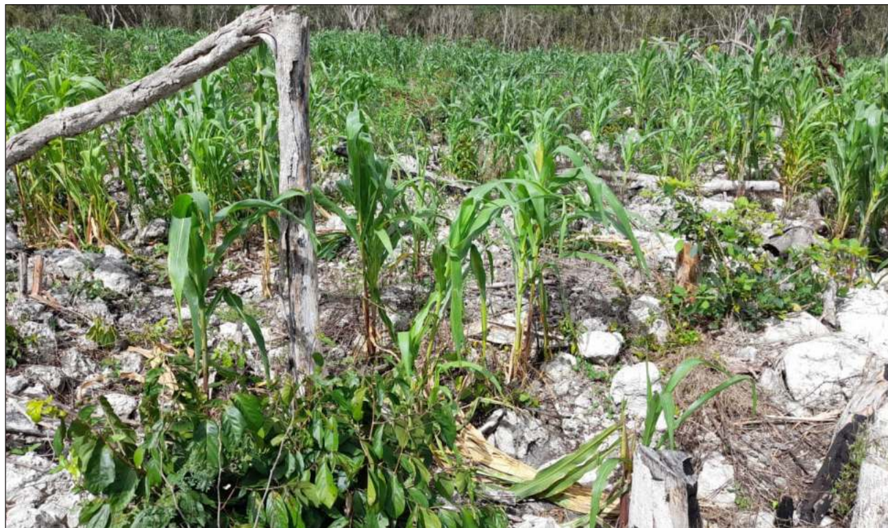
▲ Por la falta de lluvias, los cultivos se están secando en Cobá y en Chanchen Palmar, según sus comisarios.

"Hace poco que fui y vi muchos gusanitos que se van comiendo las puntitas hasta el tallo de las plantas, pero también por el sol y la falta de lluvia podemos perder hasta un 70 por ciento de la siembra", acotó.