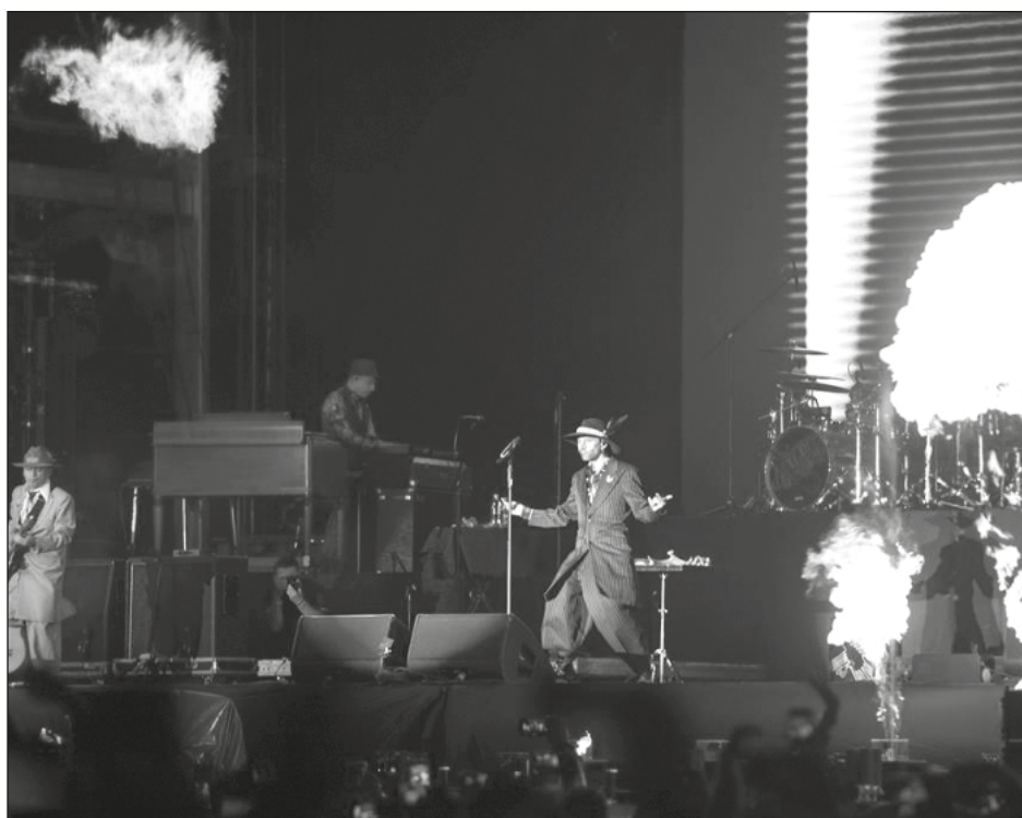
▲ En el concierto, que reunió a 110 mil asistentes, la banda llamó a la gente a reconectarse con la naturaleza, celebró la afromexicanidad y destacó la lucha de las mujeres.

La voz del Fluvio, el acordeonista, es la del actor de doblaje mexicano Gabriel Chávez, conocido por su participación en series animadas como Los Simpsons , ¡Oye, Arnold! o Daria además de Los Expedientes Secretos X , entre otras. Saturno escribió el filme con la idea de contar con su voz desde el principio, incluso lo soñaba, pero aunque lo contactó en 2011 nunca recibió respuesta hasta que, pasando los años, fue protagonista de su cortometraje La sagrada solución (México, 2015).