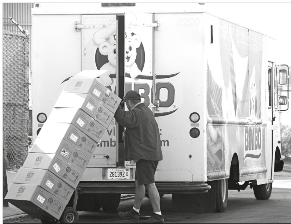
▲ El pan de caja blanco está incluido en el Paquete Contra la Inflación y la Carestía, plan creado por el gobierno del presidente Andrés Manuel López Obrador.

De acuerdo con el listado que distribuyó la empresa