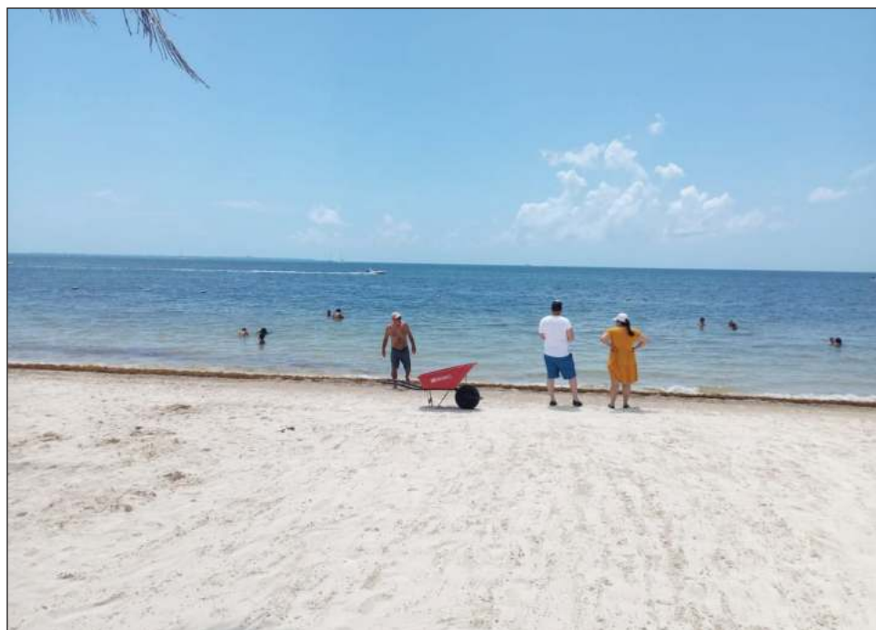
▲ Las mejoras que se han hecho, como el pintado de fachadas coloridas hace un par de años, que se suman a otros proyectos de reconstrucción, han tenido como objetivo darle realce a la zona y que sea atractiva para los visitantes.

Precisamente las mejoras que se han hecho, como el pintado de fachadas coloridas hace un par de años, que se suman a otros proyectos de