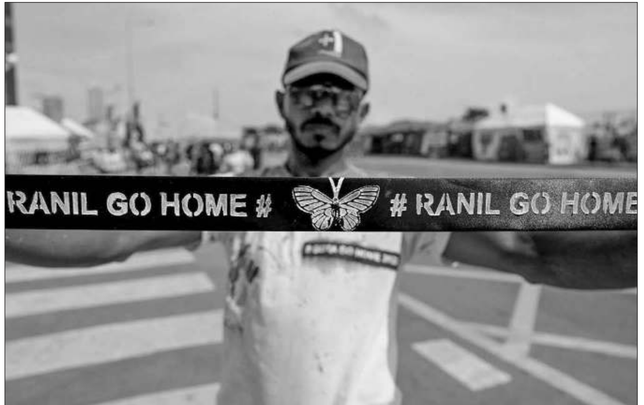
▲ La campaña para exigir la renuncia de Rajapaksa, bautizada Aragalaya (lucha) y organizada en las redes sociales, inició el 9 de abril, cuando decenas de miles de manifestantes de todo el país comenzaron a acampar frente a su oficina.

El 9 de julio, los manifestantes tomaron por asalto el palacio de Rajapaksa, que huyó a Singapur, desde donde anunció oficialmente su dimisión el viernes. El parlamento elegirá al nuevo