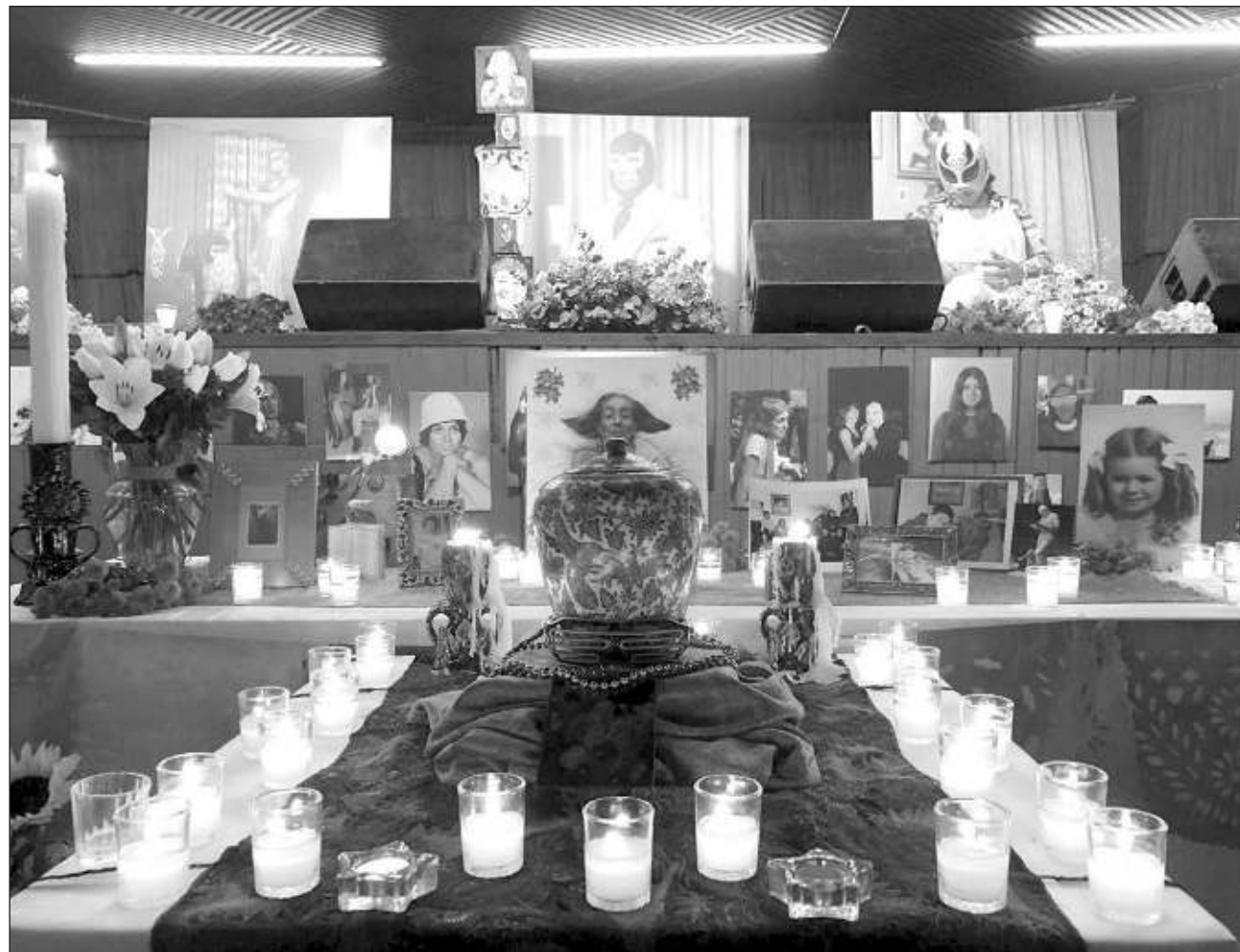
▲ La nave del edificio, habituada a funcionar como pista de baile, fue transformada de manera temporal en una galería en la que se montó una exposición que dio cuenta del apasionamiento de la creadora por la lucha libre.

En breve entrevista, la funcionaria recordó que apenas hace una semana el gobierno federal efectuó un homenaje en vida a la fotógrafa, en cuyo contexto se le entregó la Medalla Bellas