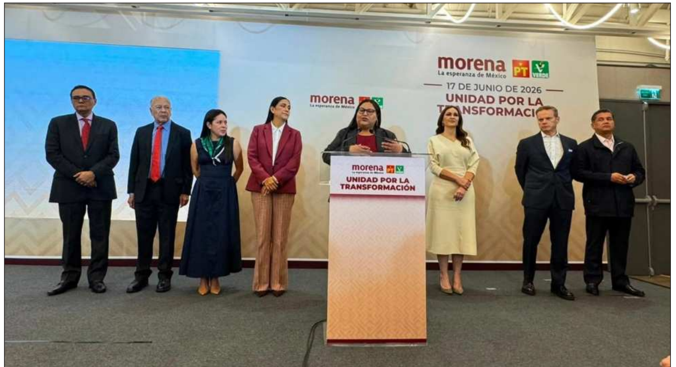
▲ La líder nacional morenista sostuvo que hay una imperiosa necesidad de seguir transformando, de defender los logros de la 4T y la soberanía del país; los líderes partidistas adelantaron que la encuesta final debe incluir máximo seis perfiles.

Los interesados podrán anotarse hasta el 27 de junio, excepto el día 24 porque juega el tricolor