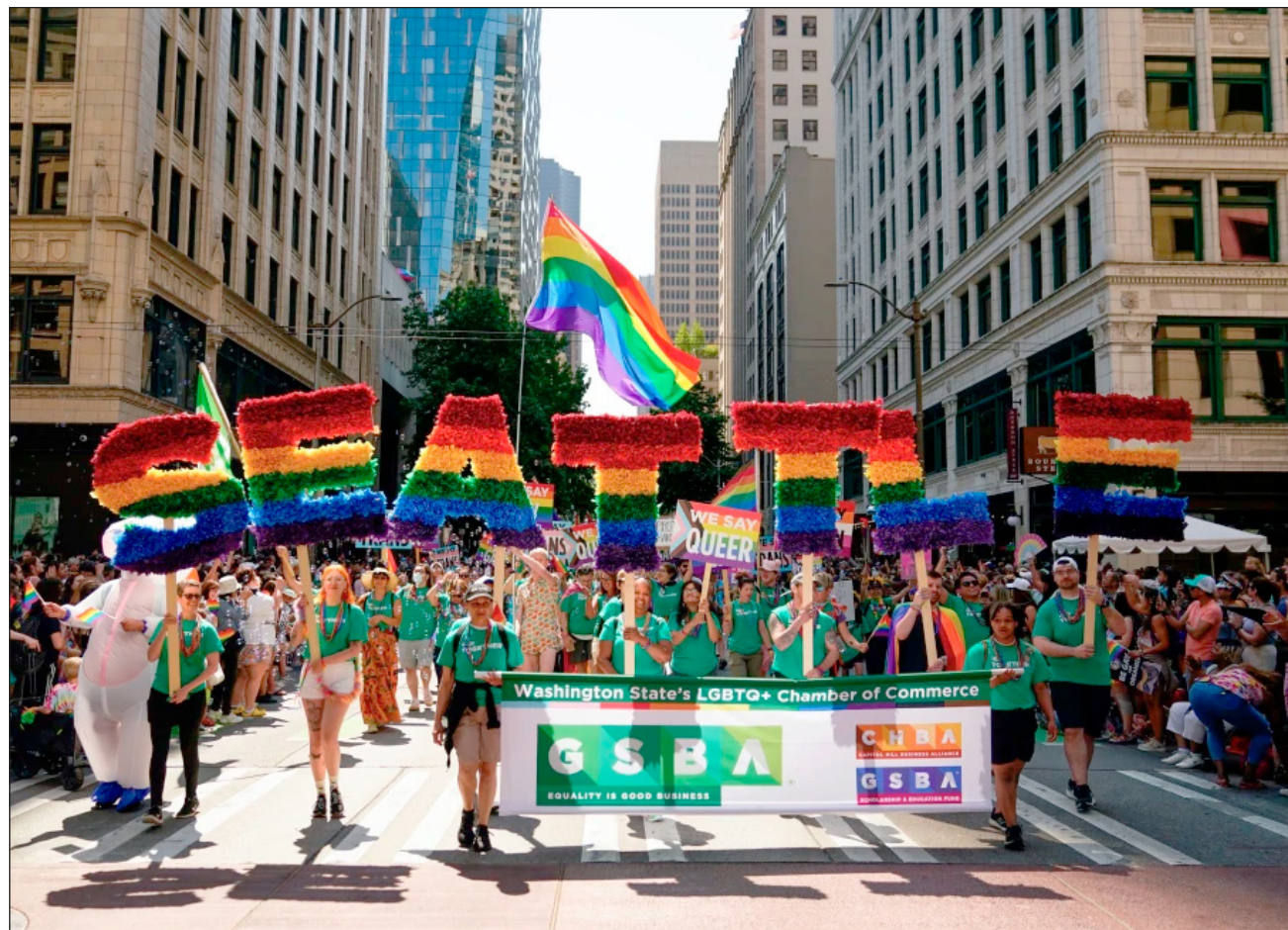
▲ En Irán, las relaciones entre personas del mismo sexo son ilegales, mientras que Egipto ha detenido y procesado a gays y lesbianas basándose en vagas leyes de indecencia, y ha reprimido cualquier expresión pública del Orgullo.

Ambos países presentaron quejas ante la FIFA en diciembre. La federación de fútbol de Egipto afirmó que