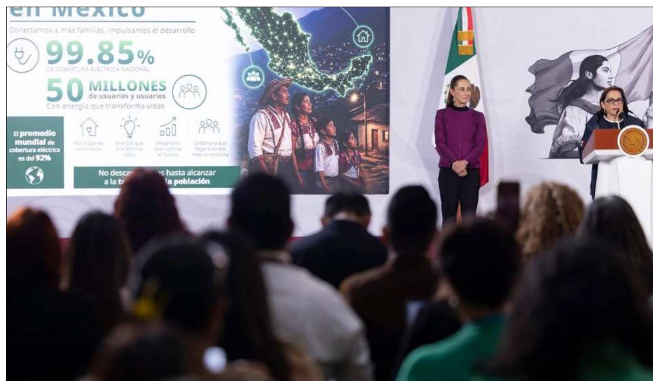
▲ La presidenta Claudia Sheinbaum Pardo sostuvo que el plan trata de una acción de justicia energética.

La directora general de la Comisión Federal de Electricidad (CFE), Emilia Esther Calleja Alor, detalló que actualmente la cobertura eléctrica nacional es de 99.85 por ciento y que aún quedan pendientes de electrificar 8 mil 247 lo-