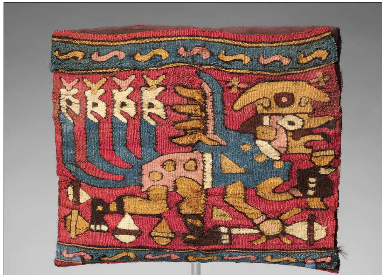
▲ La exposición que se presenta en Nueva York nace de un intercambio entre curadoras del museo expertas en las artes y cultura europea y latinoamericana, donde descubren y crean un diálogo entre estos mundos.