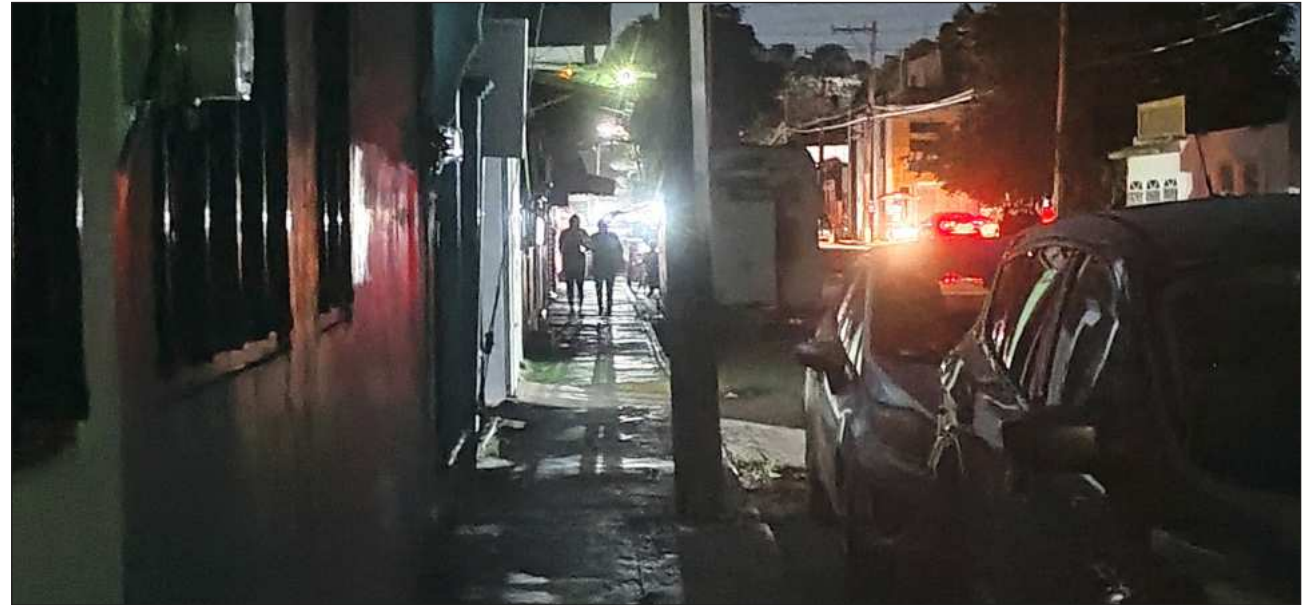
▲ La causa que lleva a que este problema se incremente en esta temporada de calor es que no existe la planeación de mantenimiento preventivo a las líneas de conducción y a los transformadores.

Tan sólo en lo que va del presente año, se han registrado ocho bloqueos a calles, avenidas y a la carretera federal 180, en distintos tramos, acusando el mal servicio que brinda la CFE en el suministro de energía, generando frecuentes fallas e interrup-