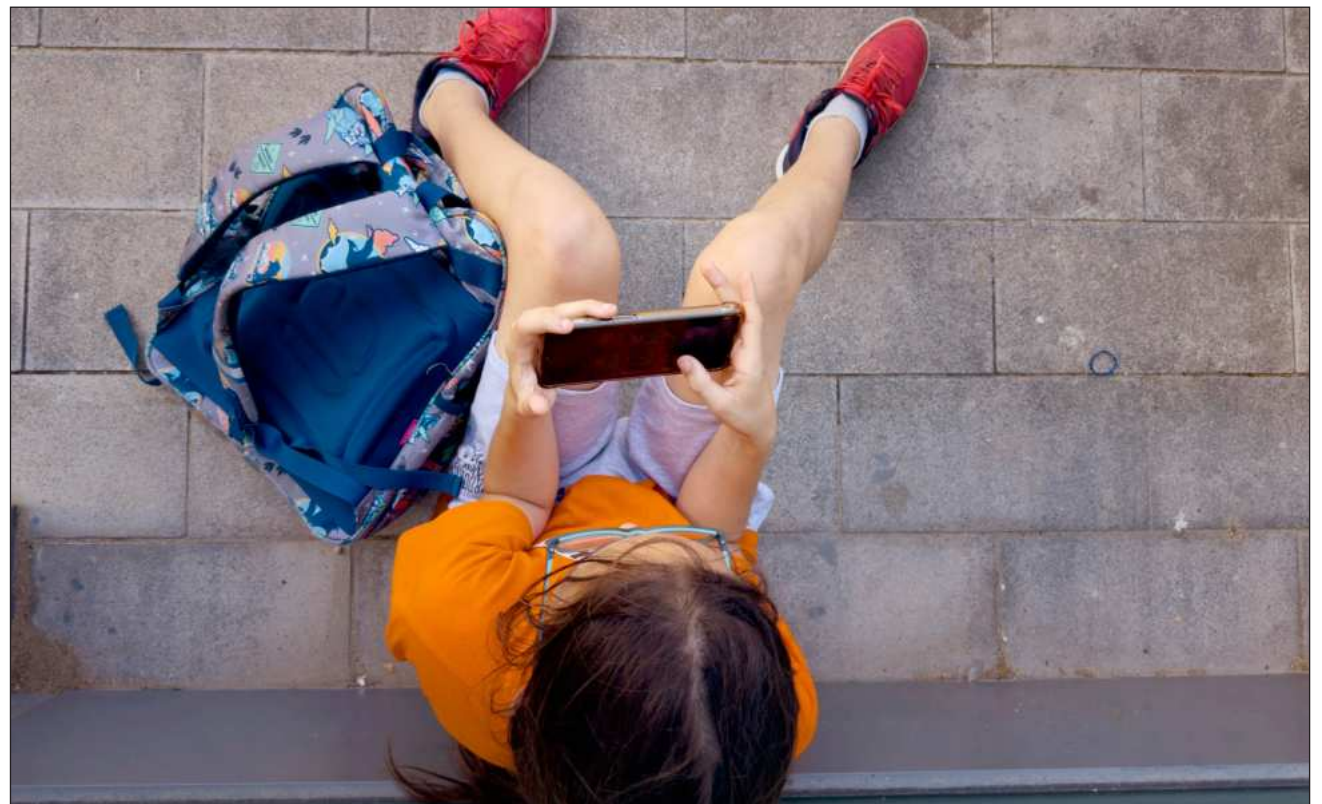
▲ La jefa del Ejecutivo argumentó que el país registra un elevado índice de horas de consumo digital entre la infancia y la juventud, lo cual impacta directamente en los procesos de socialización, así como en el bienestar general.

Tras revelar que encuestas muestran un respaldo mayoritario de los padres para prohibir celulares en primarias, la mandataria advirtió que el apego digital y los algoritmos están relacionados con severos cuadros de adicción, ansiedad y pérdida de sueño en la niñez y la juventud.