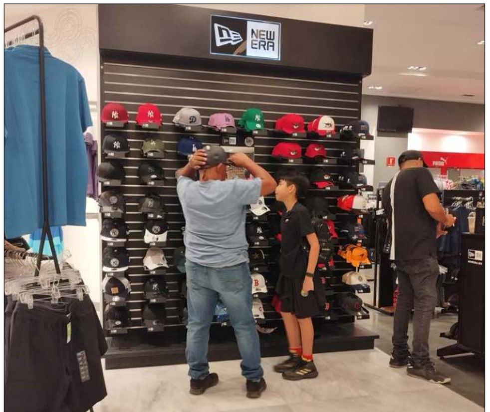
▲ Tras los festejos por el Día del Padre, los comerciantes aseguran que registran un aumento en sus ventas de hasta 60 por ciento, afirmó el presidente de la Cámara Nacional de Comercio,

Servicios y Turismo (Canaco-Servytur) de Carmen, Carlos Arjona. Explicó que la celebración cayó en quincena y la población contó con recursos para regalos.