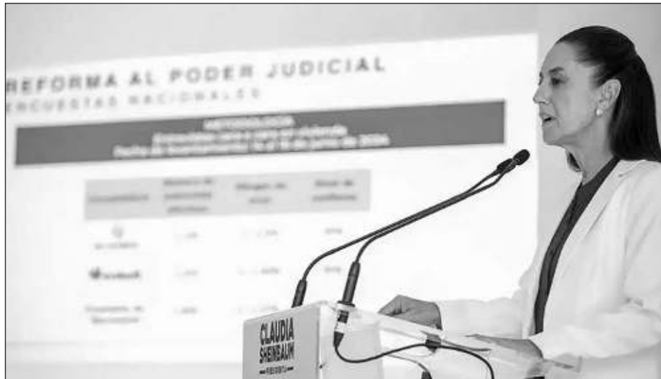
▲ Las empresas contratadas por el partido guinda fueron Enkoll y De las Heras, además de un ejercicio democrático más aplicado por la encuestadora de Morena.

En tanto, 14 por ciento respondió a De las Heras que “no”