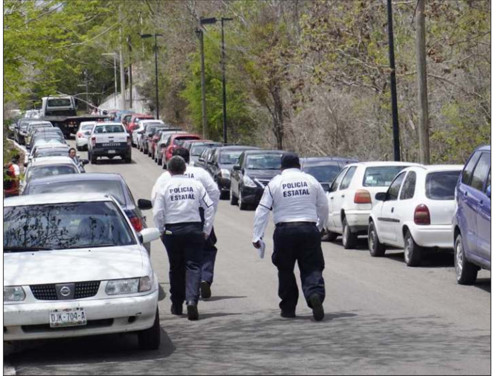
▲ Debido a las condiciones, algunos elementos han desistido de la protesta.