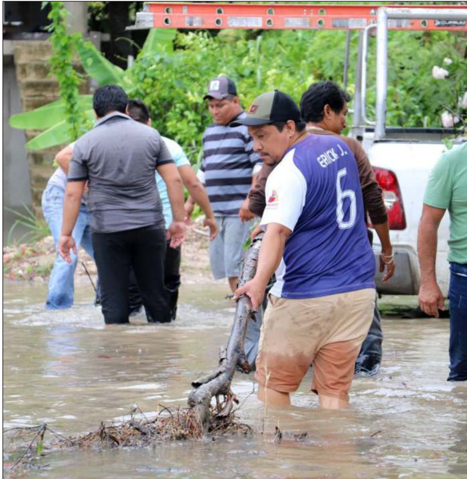
▲ Personal de Bomberos, Protección Civil, Servicios Públicos y otras áreas municipales, trabajan de manera coordinada en la limpieza de calles y alcantarillas.