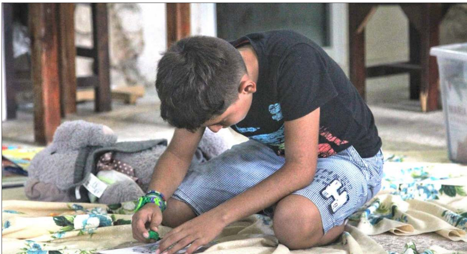
▲ El evento, organizado por Ciudad Mayakoba, el Museo Universum de la UNAM y el Centro Cultural de España en México, ofrecerá actividades como talleres de dibujo y creatividad literaria, sensorama sobre la selva maya, observación de estrellas y planetas, cuentacuentos, feria de libros y mucho más.