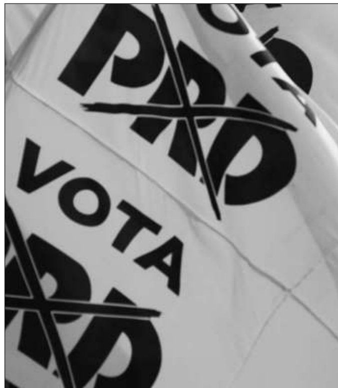
▲ Después de 35 años, el ciclo concluyó y por buscar alianzas con aquellos a quienes combatió algún día, acabó olvidándose de las luchas de la izquierda que estuvieron en su origen.

El PRD fue el primer instituto político que enfrentó al PRIAN, término que fue acuñado por Manú Dornbierer para denunciar la colaboración informal entre los partidos Acción Nacional y Revolucionario Institucional, que terminaba por desconocer triunfos a los del sol azteca en entidades donde tenía presencia fuerte, como Michoacán en 1992, pero también Guerrero, Tabasco, Campeche; no fue sino hasta 1997 que el propio Cuauhtémoc