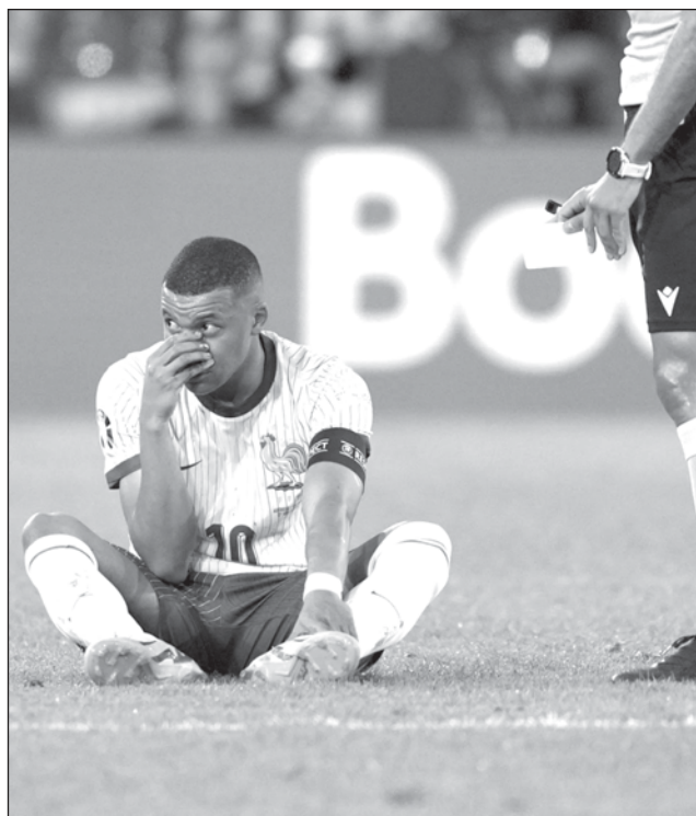
▲ Kylian Mbappé, con la nariz sangrando al ser amonestado en el partido contra Austria.

La noche de la estrella finalizó con un durísimo golpe al intentar rematar de cabeza en la recta final. El choque fue con un hombro del austriaco Kevin Danso. Sangró el goleador de manera abundante y no pudo seguir, siendo sustituido en el minuto 90. Diagnóstico, fractura en la nariz. Al menos, según indicó el presidente de la Federación Francesa de Fútbol (FFF), Philippe Diallo, "no hay que operar". Pero el nuevo astro del Real Madrid tendrá que usar una máscara para protegerse la cara y está en duda para jugar el próximo viernes contra Países Bajos.