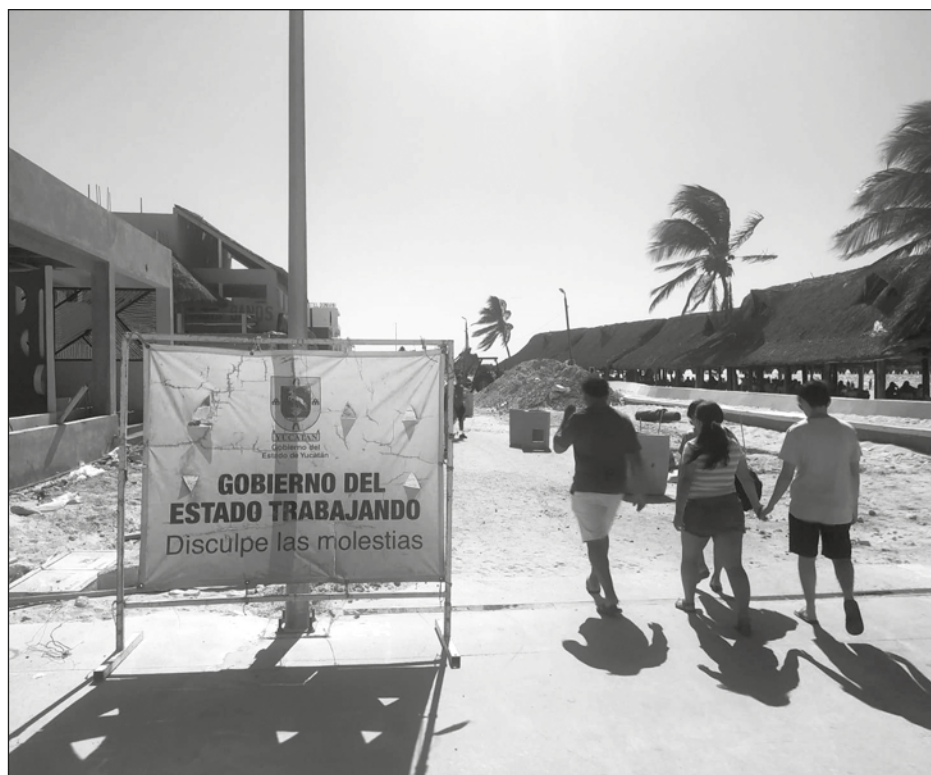
▲ Durante el periodo de Semana Santa, Progreso recibió más de un millón de visitantes, lo que indica la recuperación económica del municipio.

Cuestionado sobre el costo, el alcalde aclaró que, al incluir el costo de la entrada a la Ley de Ingresos, no pueden contemplarse promociones.