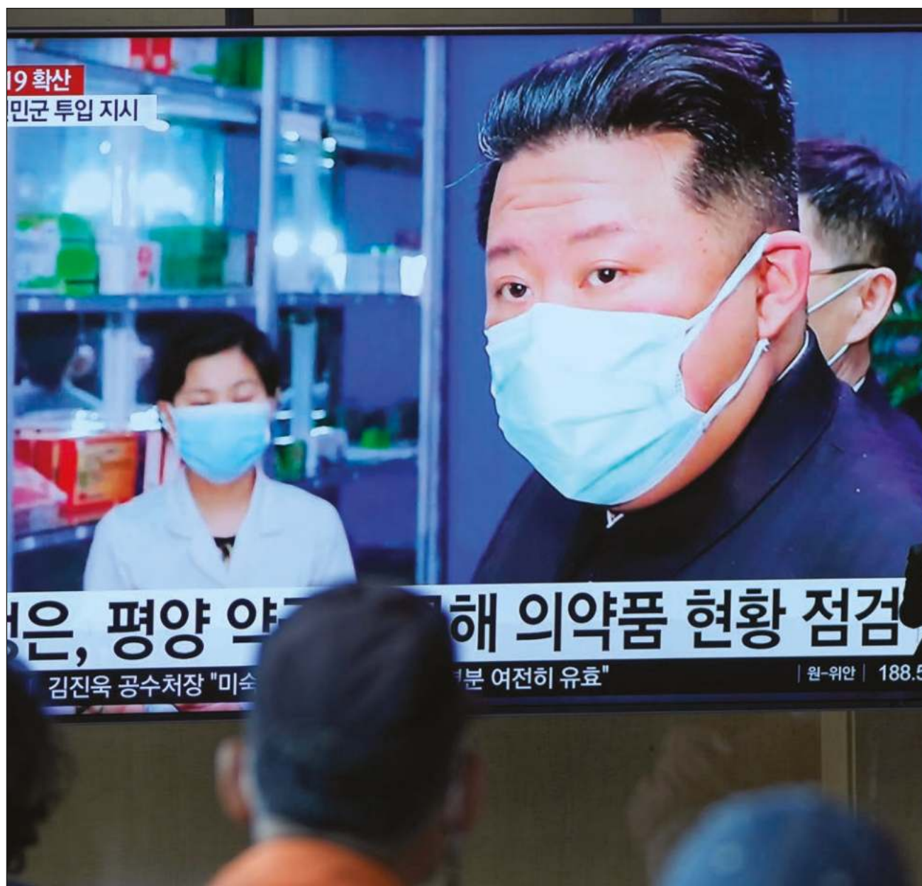
▲ La OMS expresó su preocupación por el hecho de que no ha habido ninguna campaña de vacunación contra el coronavirus entre la población norcoreana y otros Estados como el país africano de Eritrea.

La prensa estatal norcoreana informó este martes de seis nuevas muertes por Covid en el país, que suma ya 56 fallecidos, mientras más de 663 mil personas están en tratamiento.