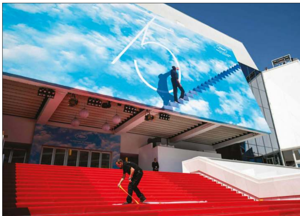
▲ Este martes se inauguró la edición 75 del Festival de Cine de Cannes, con la proyección de la comedia de zombies Final Cut, del director Michel Hazanavicius.

"Este año, todos querían venir a Cannes", dijo Thierry Frémaux, director artís-