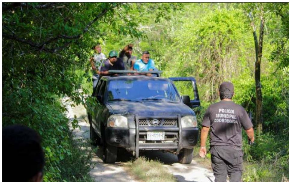
▲ La búsqueda del individuo conocido como El Chicote duró más de 20 horas e incluyó montes, ranchos y vehículos en el municipio de Huhí; participaron policías y voluntarios.

Se trataría del segundo feminicidio ocurrido en el estado en lo que va de 2022.