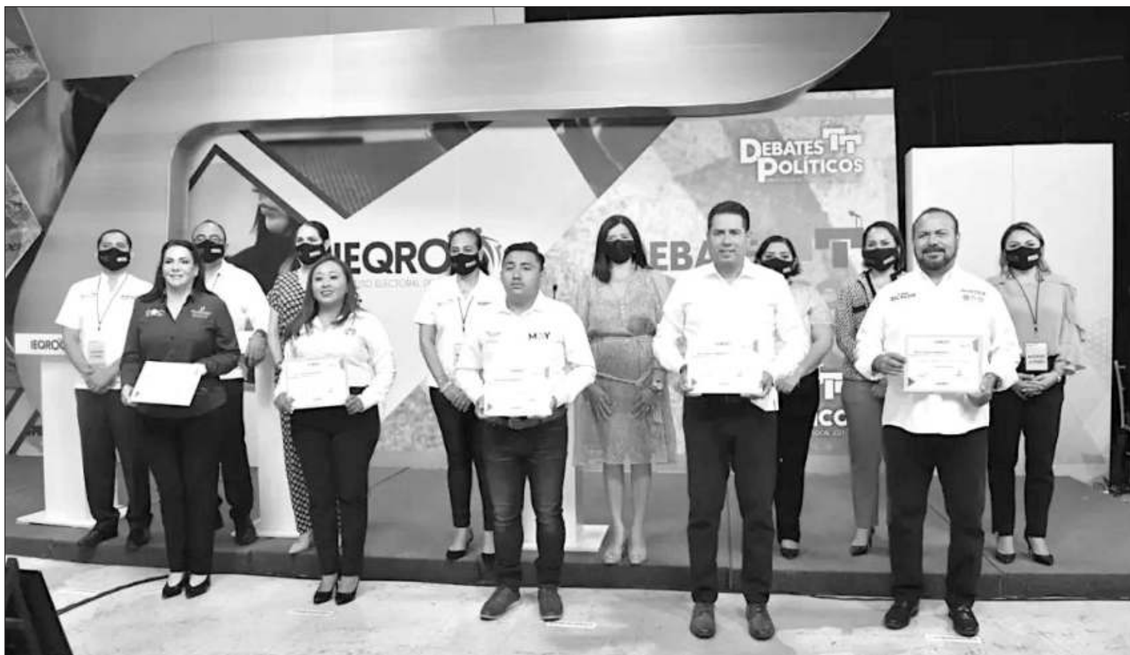
▲ Participaron en este ejercicio los candidatos de los distritos 1, 7 y 14, quienes expusieron sus propuestas para mejorar la situación en los municipios.