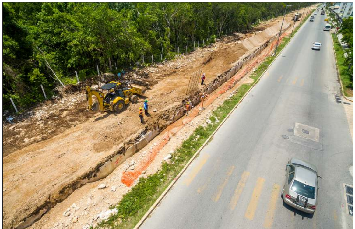
▲ Entre las obras está incluida la renovación de redes hidráulicas en Puerto Aventuras y Sector Tanque 7.

Por otra parte, para eficientar el funcionamiento del servicio de alcantarillado, se realizará la reubicación de uno de los principales colectores en la ciudad; asimismo se llevará a cabo la sustitución de redes de drenaje y atarjeas, entre otras ampliaciones. Con una inversión de más de 28 millones de pesos, esta infraestructura en drenaje permitirá una adecuada recolección de las aguas residuales con más de 9 obras en esta materia.