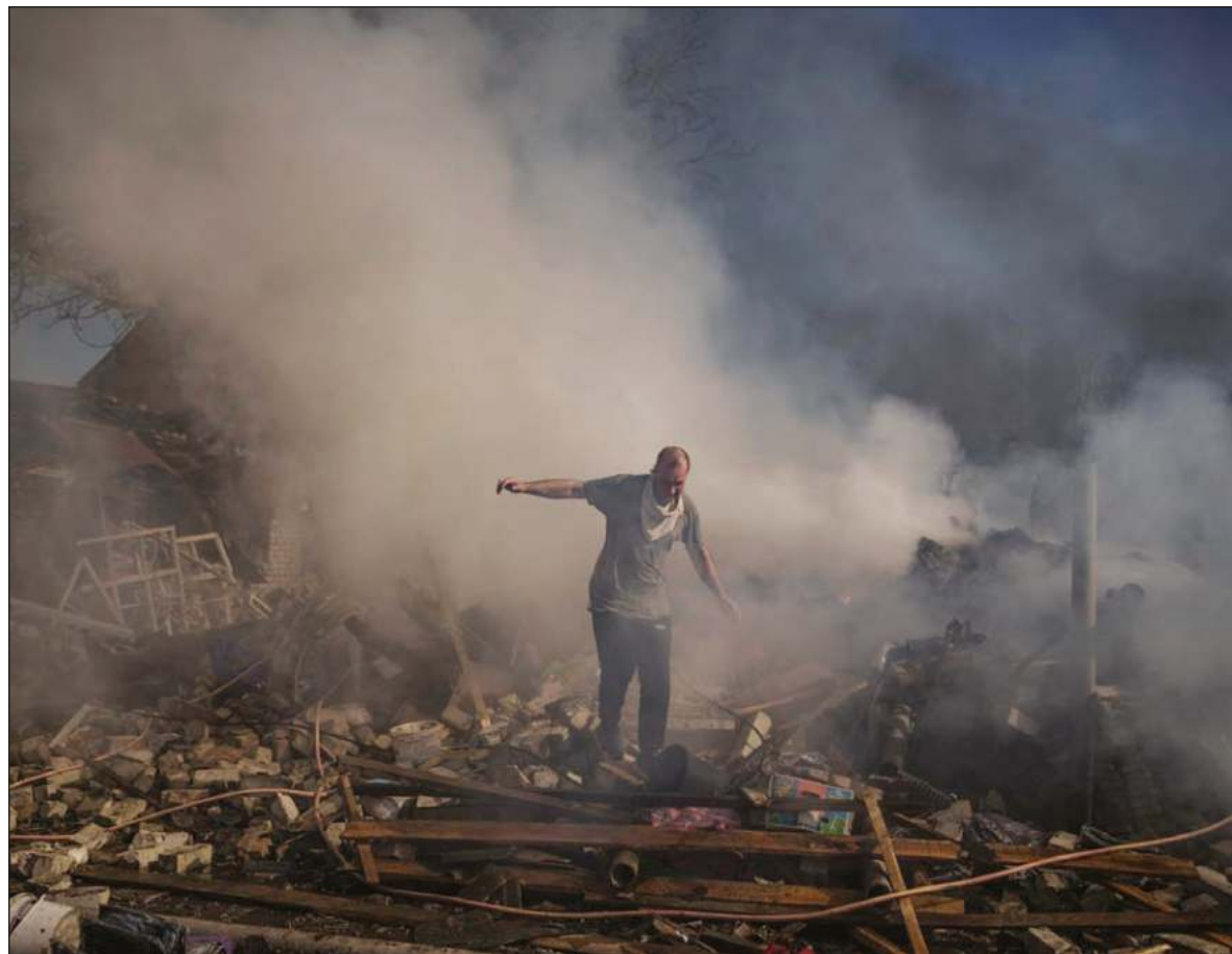
▲ "If we can't change the world, we can at least take action to change how it affects us and not let it bring us down".

their lives are out of control, and this can be scary.