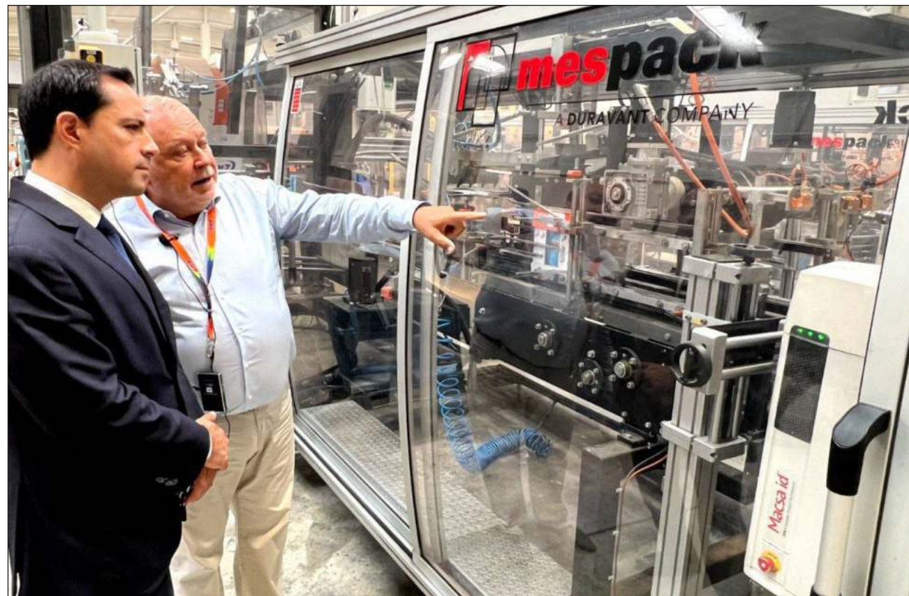
▲ De gira por Europa, el gobernador yucateco también visitó la compañía KH7, dedicada a la fabricación y comercialización de productos de limpieza para el hogar y el sector industrial.

El funcionario hizo hincapié en las condiciones de conectividad terrestre, aérea y marítima, que permitan la importación y exportación de productos hacia distintos destinos. Desde el Puerto de Altura de Progreso, dijo, se puede llegar a los Estados Unidos en menos de 48 horas, a Asia entre 45 y 60 días y a Europa en 22.