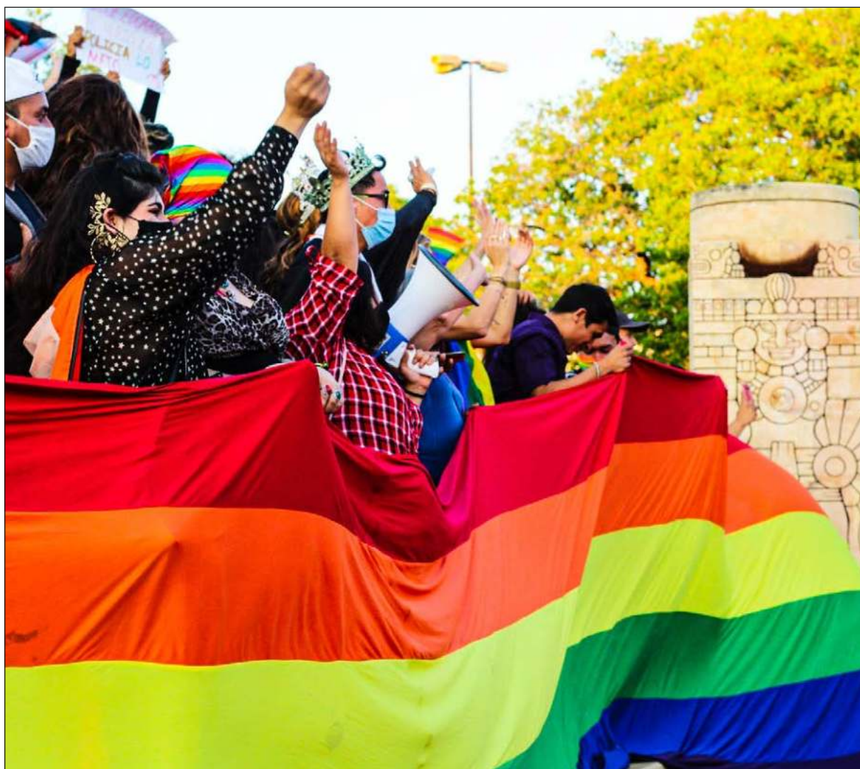
Comunidad LGBT+ pide reconocimiento de derechos en el Día contra la Homofobia, Bifobia y Transfobia.