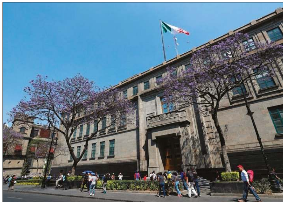
▲ Para la ministra Margarita Ríos Farjat, la figura de los “superdelegados” no distribuye competencias ni trastoca los pilares del artículo 124 Constitucional.

La medida fue tomada para eliminar las 2 mil 300 delegaciones que las secretarías y diversas entidades del gobierno federal tenían, para concentrar sus facultades en solo un delegado por estado, figura a la que se conoce como “superdelegados”.