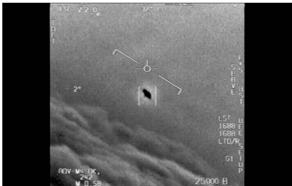
▲ El objetivo de la audiencia, según varios legisladores, era acabar con los estigmas sobre este tema para que los militares informen a sus superiores cuando se encuentren con un ovni.

El presidente del subcomité, el demócrata André Carson, que representa un