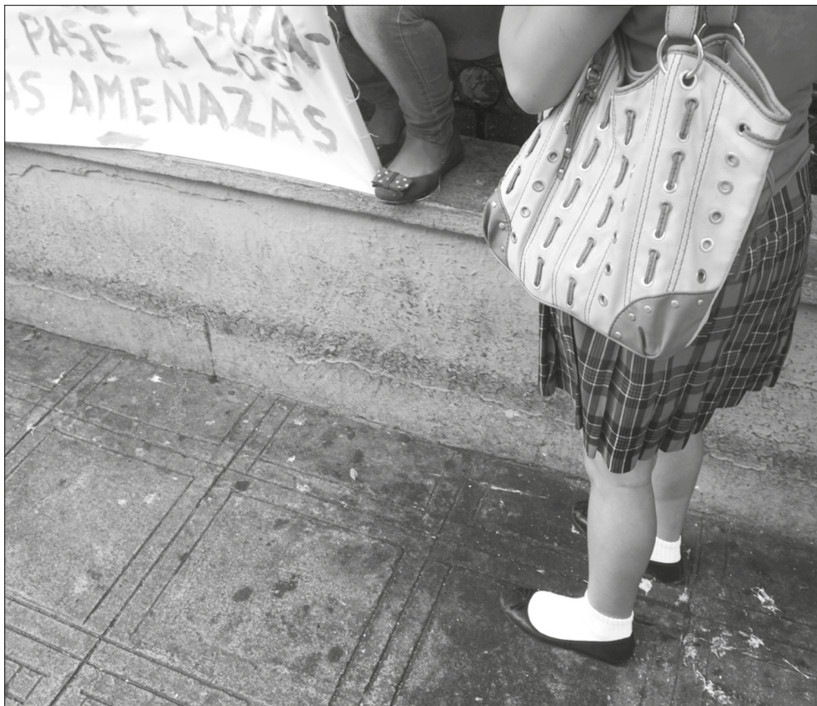
▲ “Que una niña o niño, o una o un joven sufra bullying no es culpa de la escuela ni es culpa de los padres. Pero, al mismo tiempo, es responsabilidad de la escuela y de los padres”.

Esa fortaleza sólo puede recargarse en casa, casi por ósmosis,