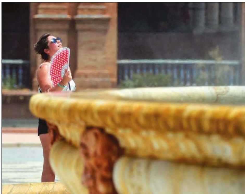
▲ Cada ola de calor en el mundo en la actualidad es más fuerte y tiene más probabilidades de ocurrir debido al cambio climático causado por los seres humanos.

Estos derechos humanos en el país han vivido un fuerte retroceso desde el regreso al poder de los talibanes, sobre todo en el caso de las mujeres, que han visto cómo los fundamentalistas incumplían sucesivamente sus promesas y les iban imponiendo más restricciones.