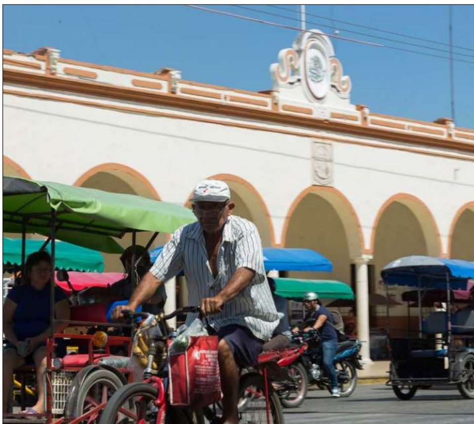
▲ Las anomalías presentadas ante la Fiscalía General del estado son resultado del proceso la entrega-recepción, informó el alcalde.

En dichas reuniones, continuó, cada integrante de las planillas opinó y recabó información que fue entregada a la ASEY y actualmente están en espera de la entrega de resultados. “Iremos poco a poco, no se trata de una cacería; sino de que el municipio de Umán tenga un nuevo renacer”.