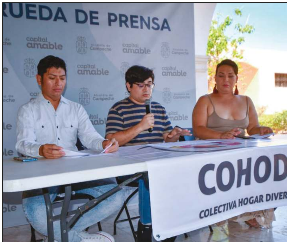
Activistas destacaron que en la entidad no han encontrado indicios de Ecosigs , tampoco relatos de ex pacientes, pero es necesario adelantarse a los hechos.

También reconoció que dichas legislaciones en estados como Baja California Ciudad de México, Yucatán incluso, y otras entidades, van desde uno hasta cinco años de cárcel para que le comprueben realizar estas prácticas de reconversión, así como sanciones económicas desde los 200 hasta los 500 días de salario, pero en Campeche aún