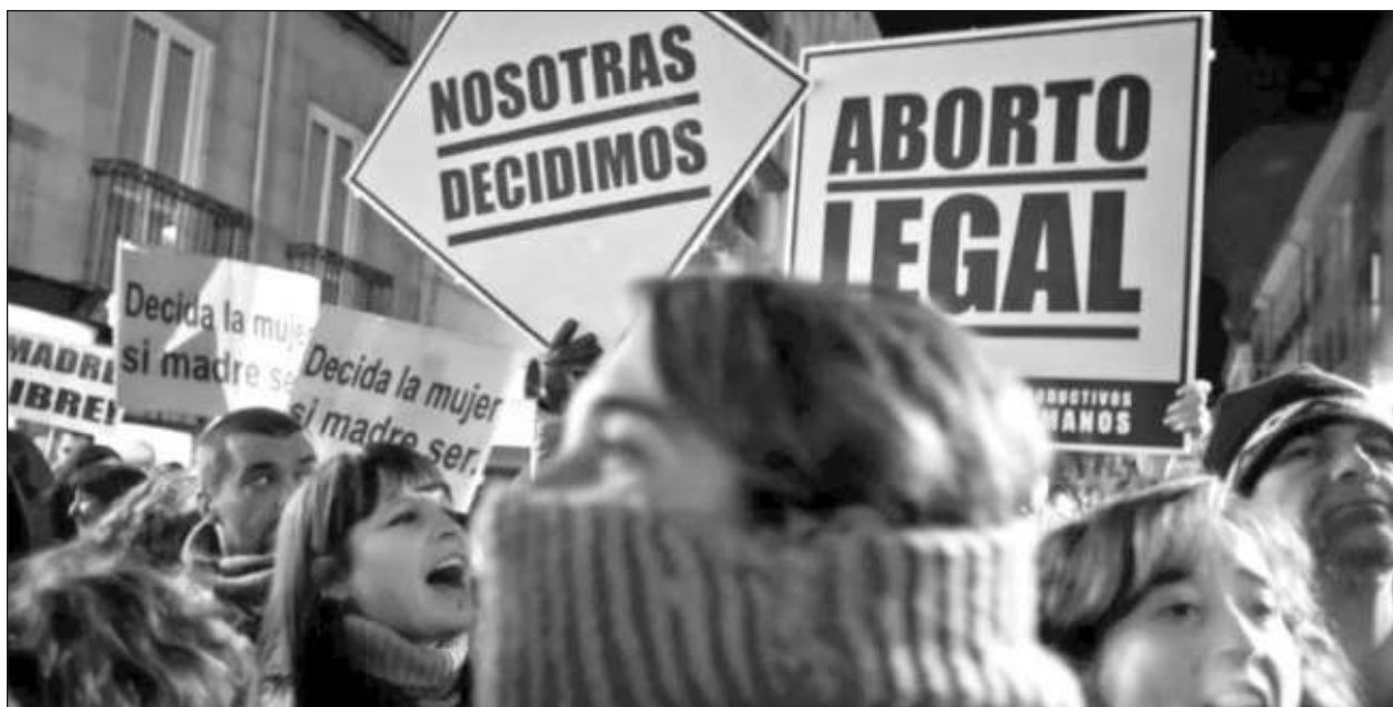
▲ Las medidas forman parte de un paquete de propuestas que se enviarán al Congreso para su debate; no queda claro si la fuerza impulsora de la iniciativa (Unidas Podemos) tiene suficiente apoyo para lograr la aprobación, que se prevé dure meses.

Decenas de venezolanos, incluido el fiscal general del país y el jefe del sistema penitenciario, y más de 140 entidades, entre ellas el Banco Central de Venezuela, seguirán sancionadas.