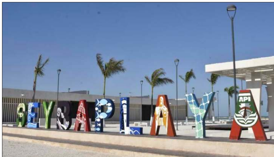
▲ El ayuntamiento argumenta que el usufructo de tierras donde están la bomba de agua y el relleno sanitario, no está contemplado en la Ley de Egresos.

“El seybanos es bocón, tonto, pero más que todo, noble, y precisamente por ese defecto de nobleza, cuando llegaba el momento de cambiar de comisariado, siempre discutíamos el cobro por la renta y usufructo de los espacios de la bomba y del basurero municipal, y como sabíamos con conocimiento de causa que nunca llegaron los recursos a la antes junta municipal, siempre decidimos no cobrar, y ahora que ya somos municipio y hay recursos propios,