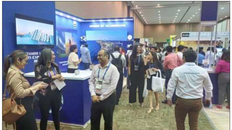
▲ Se contemplan acciones para mejorar la infraestructura, lo cual permitirá el acceso de embarcaciones de mayor calado, que sería de beneficio para la generación de empleos en la localidad.

Expuso que se complementan acciones, para mejorar la infraestructura portuaria de Isla de Carmen, con las cuales, permitirá el acceso de embarcaciones de mayor calado, lo que será de gran beneficio para el desarrollo