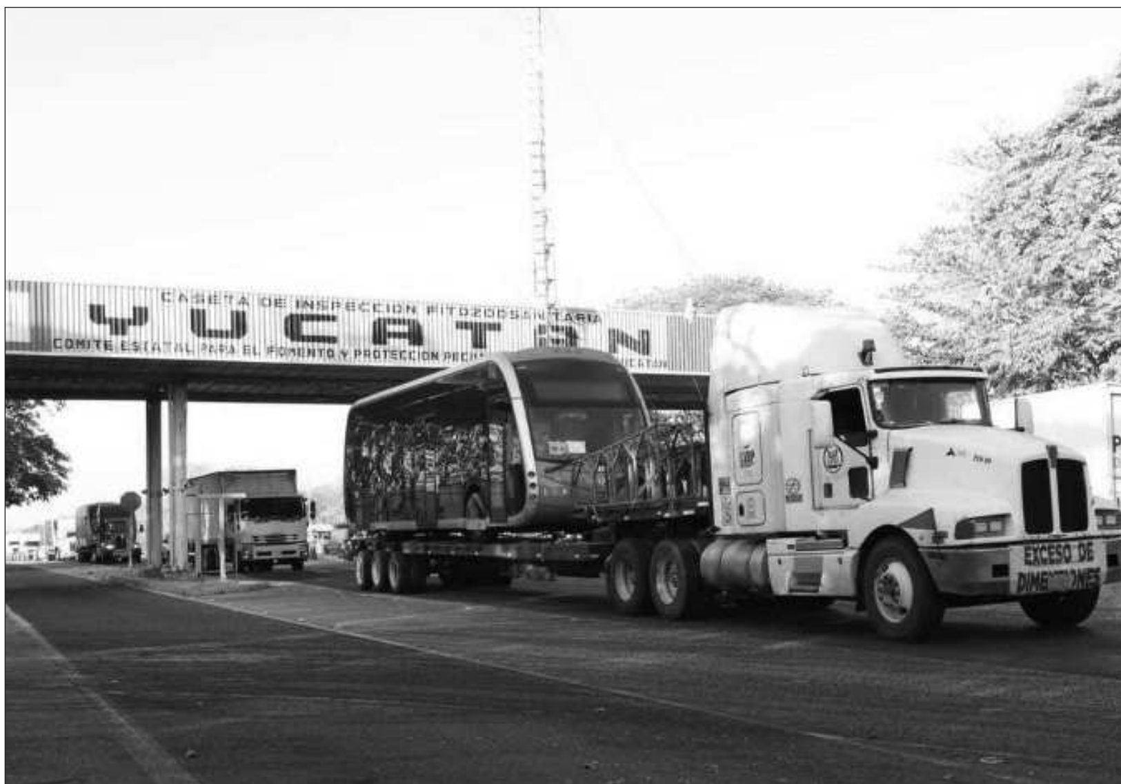
▲ Provenientes de España, las unidades fueron trasladadas vía barco hasta llegar a territorio mexicano y arribaron por tierra a la entidad.

Las cinco rutas que conforman el Ie-tram son: Paseo 60-La Plancha-Teya y Mejorada-La Plancha-Kanasín, que ya funcionan; La Plancha-Facultad de Ingeniería y La Plancha-Umán y La Plancha-Poxilá, que entrarán en funcionamiento próximamente.