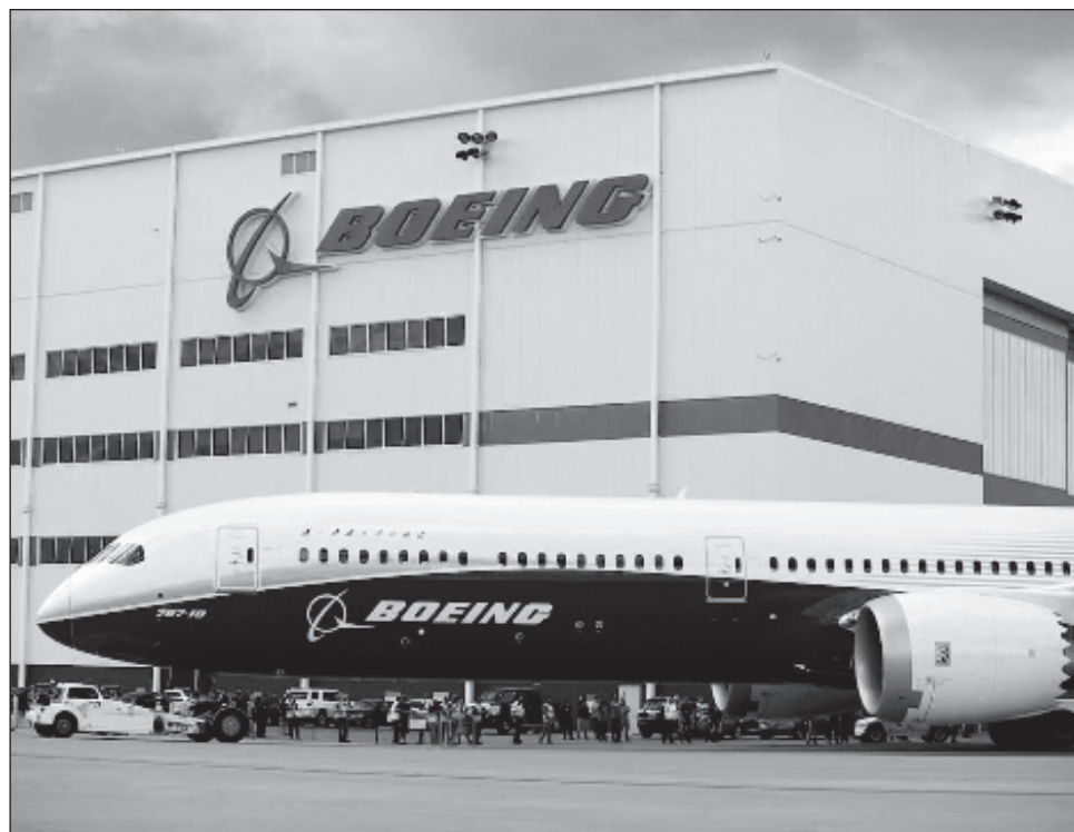
▲ De acuerdo con el grupo, “Boeing comprende la importancia de las responsabilidades de la comisión en términos de supervisión y cooperamos con esta investigación”.