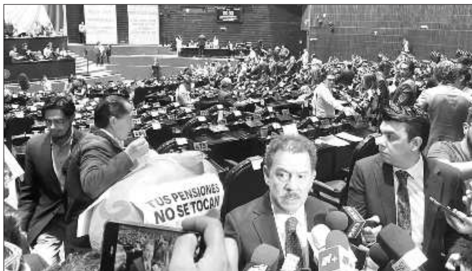
▲ El retraso en la discusión de la reforma para constituir un fondo de pensiones también presionará los tiempos de la Cámara, porque tiene que enviar el proyecto al Senado el mismo lunes.

Después de un receso de hora y media, y tras el acuerdo de bancadas, la presidenta de la Mesa Directiva, Marcela Guerra (PRI) reanudó la sesión sólo para levantarla y citar el lunes.