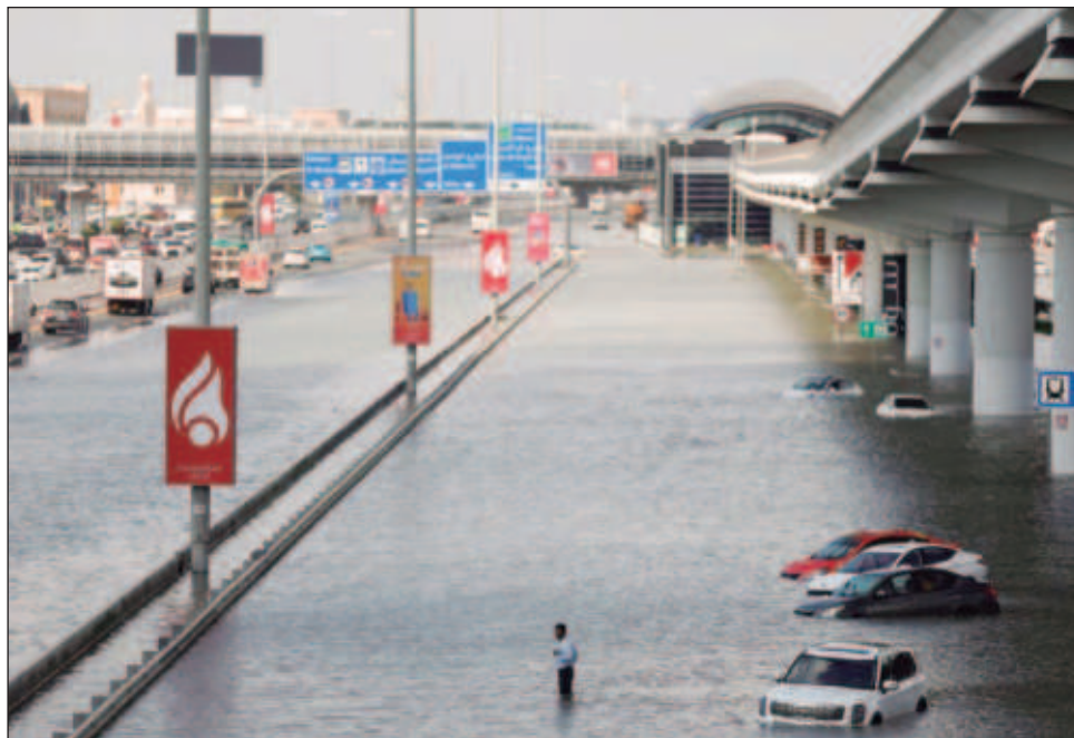
▲ Los 254 milímetros de lluvias, equivalentes a las precipitaciones que reciben Emiratos Árabes Unidos en dos años, generaron un atasco monumental en las autopistas.

La climatóloga Friederike Otto, especialista en evaluar el papel del cambio climático en fenómenos meteorológicos extremos, indicó a la AFP que es "muy probable" que el calentamiento global empeorara las condiciones de la tormenta.