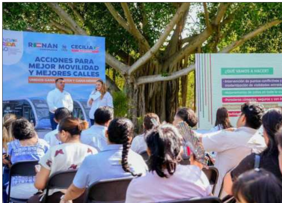
▲ El Plan de Acciones en Movilidad e Infraestructura Vial, contemplado en la Agenda Mérida 2050, consiste en la intervención e inversión en infraestructura de movilidad y hacer una reingeniería vial en ciertas zonas de la ciudad.

Incluye la modernización de paraderos más cómodos y funcionales con internet, intervención y creación de más ciclovías y potenciar el programa "En Bici", de igual forma se invertirá en la construcción de aceras adecuadas e inclusivas que