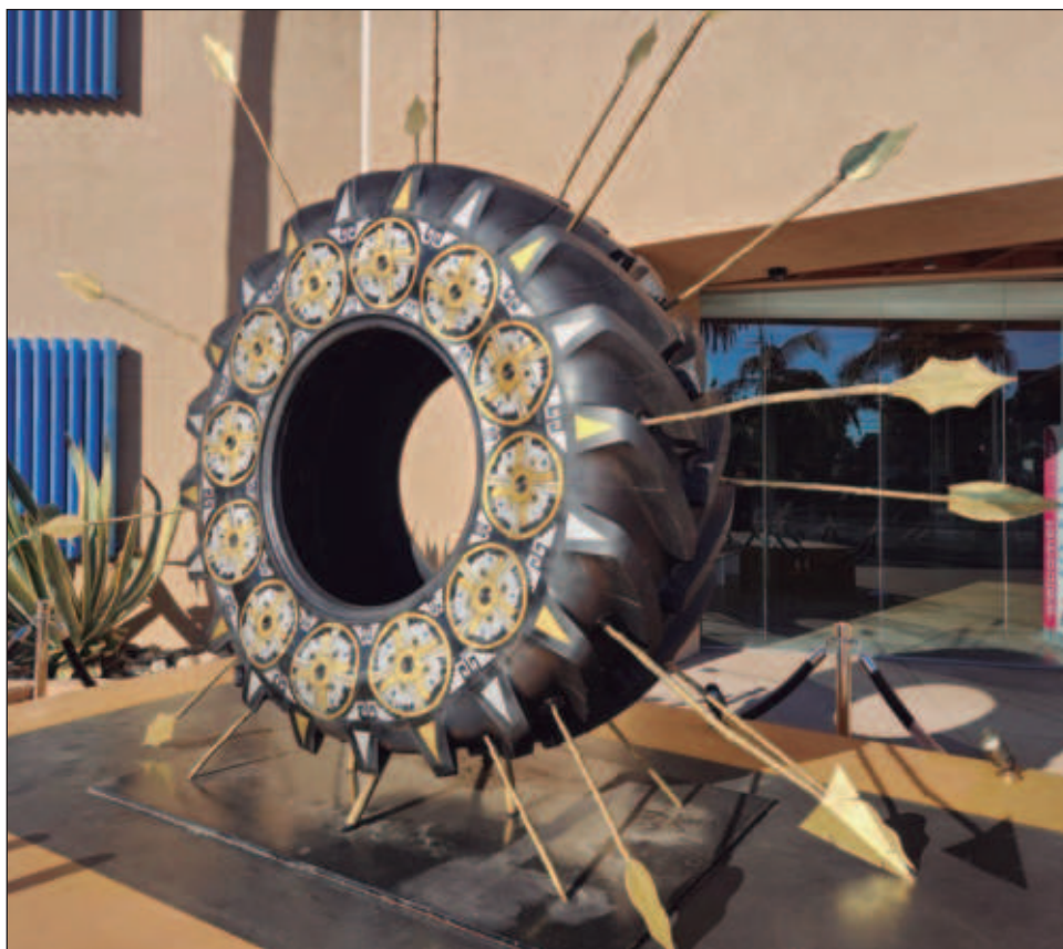
▲ Es una muestra de fuerte impacto visual que expone seis instalaciones de sitio específico, realizadas por la artista este año.

La artista pretende visibilizar la migración con una trayectoria nacional e internacional. Espera que su obra conduzca a una reflexión más lenta y profunda sobre la marca que nos dejan las fronteras, cuestionándonos hasta dónde estamos heridos por las separaciones.