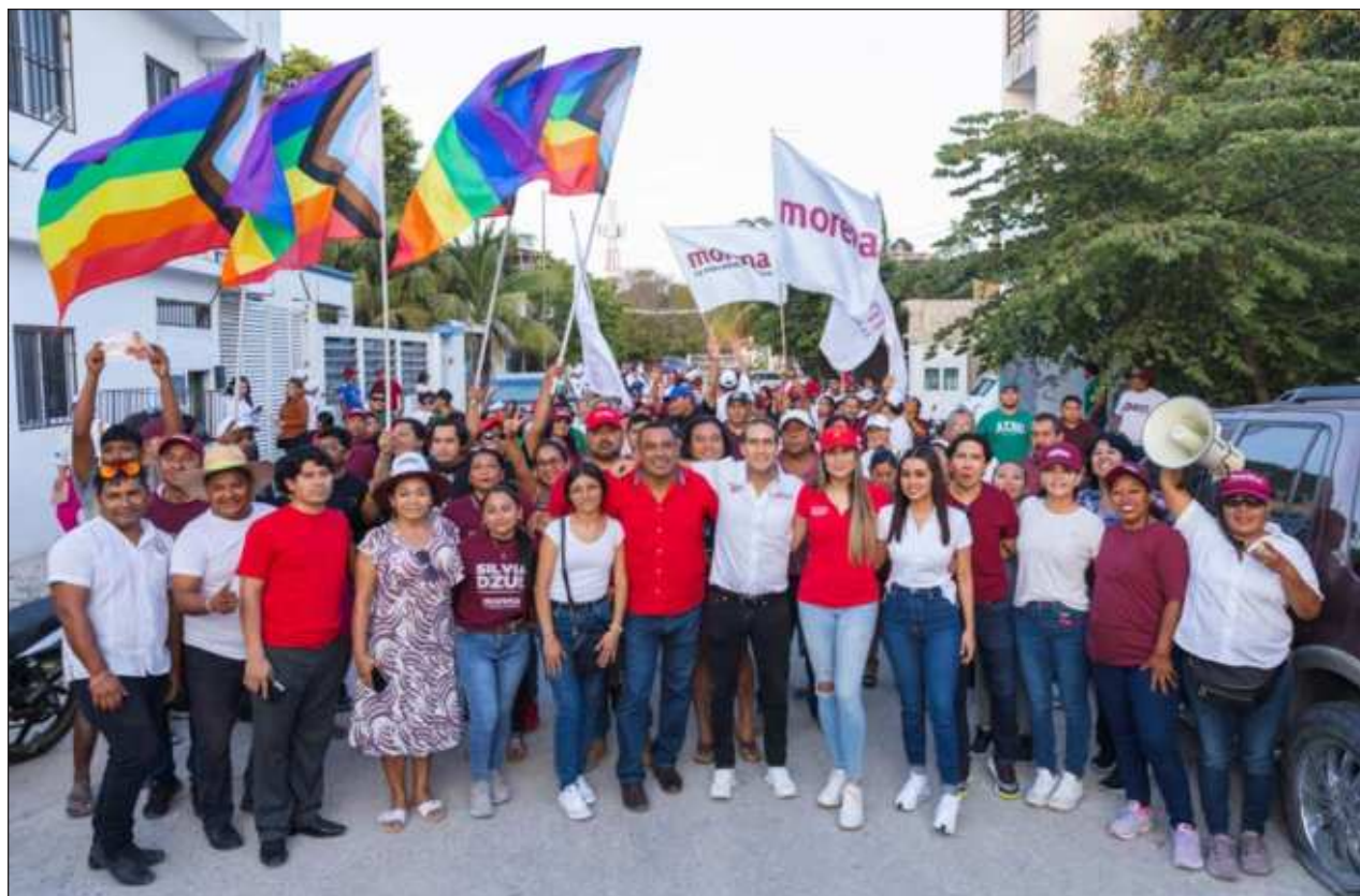
▲ En su segundo día de campaña, el candidato a alcalde de Tulum visitó a las familias de la colonia Tumben Kah y se reunió con ingenieros y arquitectos, a quienes presentó sus compromisos de favorecerle el voto el 2 de junio.