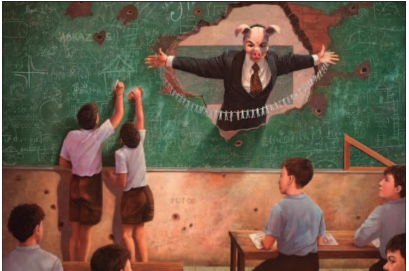
▲ “Descubrí la verdadera esencia de los habitantes del reino de Yuppieland. Entonces releí la Rebelión de la granja y todo me hizo sentido. A lo largo de 13 años, el cerdo tomó todo el protagonismo en mi obra por ese personaje de George Orwell”, puntualizó.

“En ese momento descubrí la verdadera esencia de los habitantes del reino de Yuppieland. Entonces releí la Rebelión de la granja y todo me hizo sentido. A lo largo de 13 años, el cerdo tomó todo el protagonismo en mi obra por ese personaje de George Orwell. En este mundo distópico que he creado las enseñanzas deben ser un tanto como fábulas, y claro, las enseñanzas infantiles siempre las dan los animales, así que en este reino las enseñanzas son distópicas”.