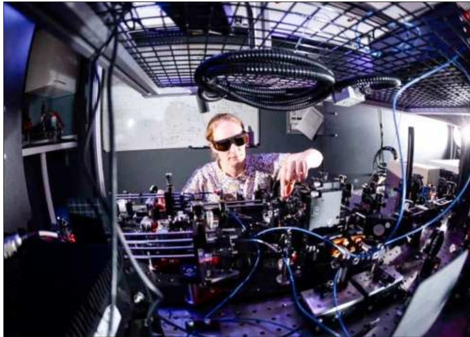
▲ Los repetidores clásicos no se pueden utilizar con información cuántica, ya que cualquier intento de leer y copiarla la destruiría.

Con el fin de hacer lo anterior, se requiere un medio para almacenar la información cuántica y recuperarla nuevamente: es decir, un dispositivo de memoria cuántica. En primer lugar, éste debe ha-