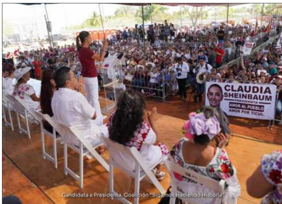
▲ Sheinbaum participó en el Encuentro con Mujeres Rurales realizado en el municipio de Ticul, desde donde anunció un programa especial de vivienda.

Shienbaum llamó a la ciudadanía a confiar en el proyecto de Díaz Mena y pidió que Yucatán deje entrar a la Cuarta Transformación.