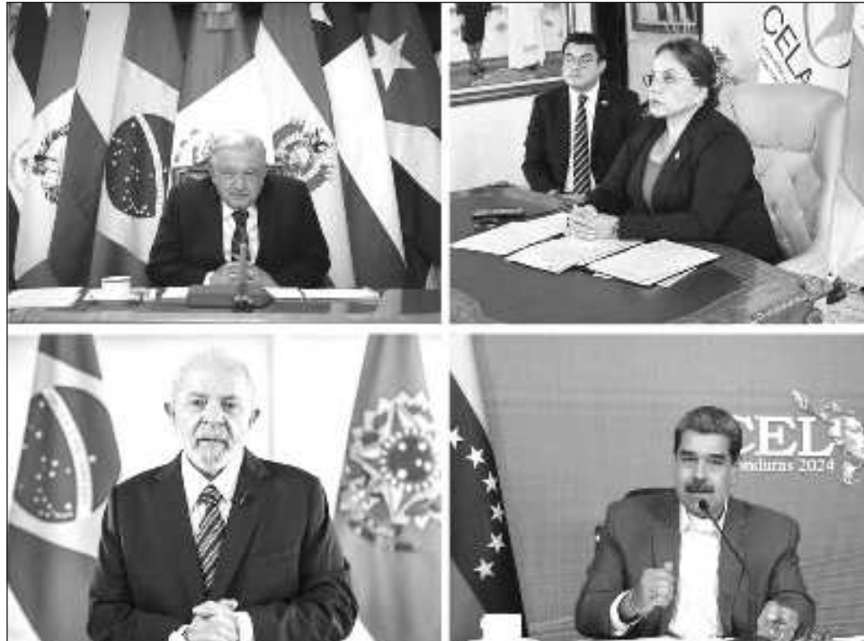
▲ Los presidentes de Brasil, Cuba, Colombia, Venezuela, Bolivia, Guatemala, y Guyana en representación de los países que integran la Comunidad del Caribe (Caricom), manifestaron su apoyo a México.

En su conferencia de prensa diaria en Palacio Nacional, destacó que los miembros de la Celac han expresado sus apoyos a los derechos de México y en contra de la violación del derecho internacional cometida por Ecuador con el asalto a la embajada mexicana en Quito y la detención a su interior del ex presidente ecuatoriano Jorge Glas.