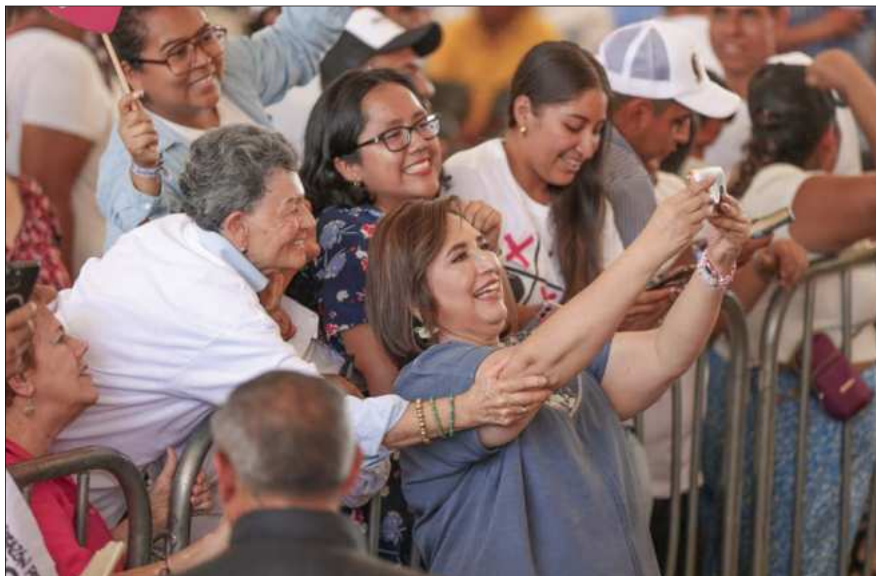
▲ Xóchitl Gálvez resaltó su “respaldo a la ministra, no hay un tema político; yo ando en campaña, ella está en lo suyo. Yo no la he visitado, no la he visto y si Zaldívar tiene pruebas que presente lo que quiera presentar”.

La magistrada respondió que al día de hoy se actualizan dos causales, relacionado con igual número de expedientes penales: en 2021 se ordenó orden de aprehensión por delitos de delincuencia organizada como operaciones con recursos de procedencia ilícita.