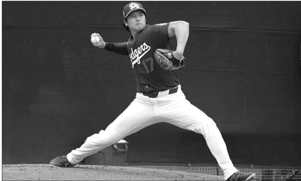
▲ Shohei Ohtani, durante un entrenamiento de los Dodgers en Phoenix, Arizona.

El viernes pasado, apenas 105 días después de que los Dodgers se convirtieron en los primeros campeones consecutivos de las Grandes Ligas en un cuarto de siglo, tras vencer a los Azulejos de Toronto en un emocionante séptimo duelo, Ohtani, Yoshinobu Yamamoto y el resto de los lanzadores y receptores del equipo realizaron su primer entrenamiento de primavera en Camelback Ranch.