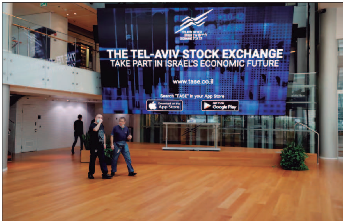
▲ “El Boicot, la Desinversión y las Sanciones, se están ejecutando en contra del Estado de Israel, pero siguen siendo insuficientes, por lo que deberán multiplicarse para evidenciar el repudio internacional al genocidio cometido contra el pueblo palestino”.

El Boicot, la Desinversión y las Sanciones (BDS), se están ejecutando en contra del Estado sionista de Israel, pero siguen siendo insuficientes, por lo que deberán multiplicarse para evidenciar el repudio internacional al genocidio cometido en contra del pueblo palestino y aumentar su costo.