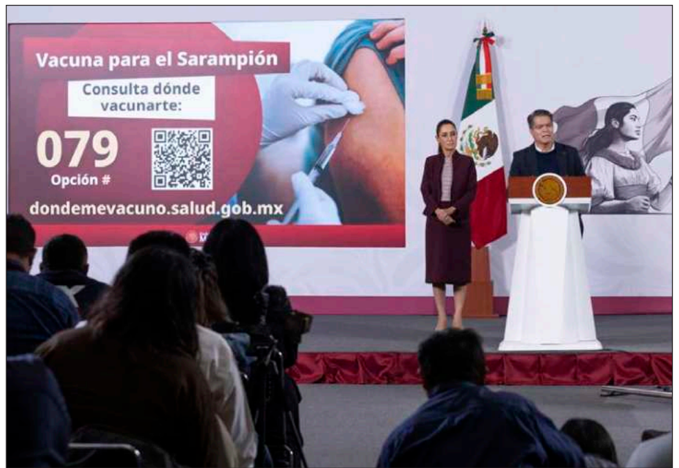
▲ En conferencia mañanera , Sheinbaum señaló que “incluso estamos comprando más vacunas para que no haya ningún problema, a la Organización Panamericana de la Salud, son alrededor de 15 millones de vacunas más para poder tener suficientes”.

La Jefa del Ejecutivo Federal puntualizó que en un año sólo hay 9 mil 400 casos de sarampión. Ante esto, reiteró el llamado a que se vacunen los grupos prioritarios: niñas y niños de entre 6 meses de edad y 12 años, que no ha recibido vacuna o cuya primera dosis fuera hace más de 6 meses; así como personas de 13 a 49 años no vacunadas o con esquema incompleto que viven en 11 entidades