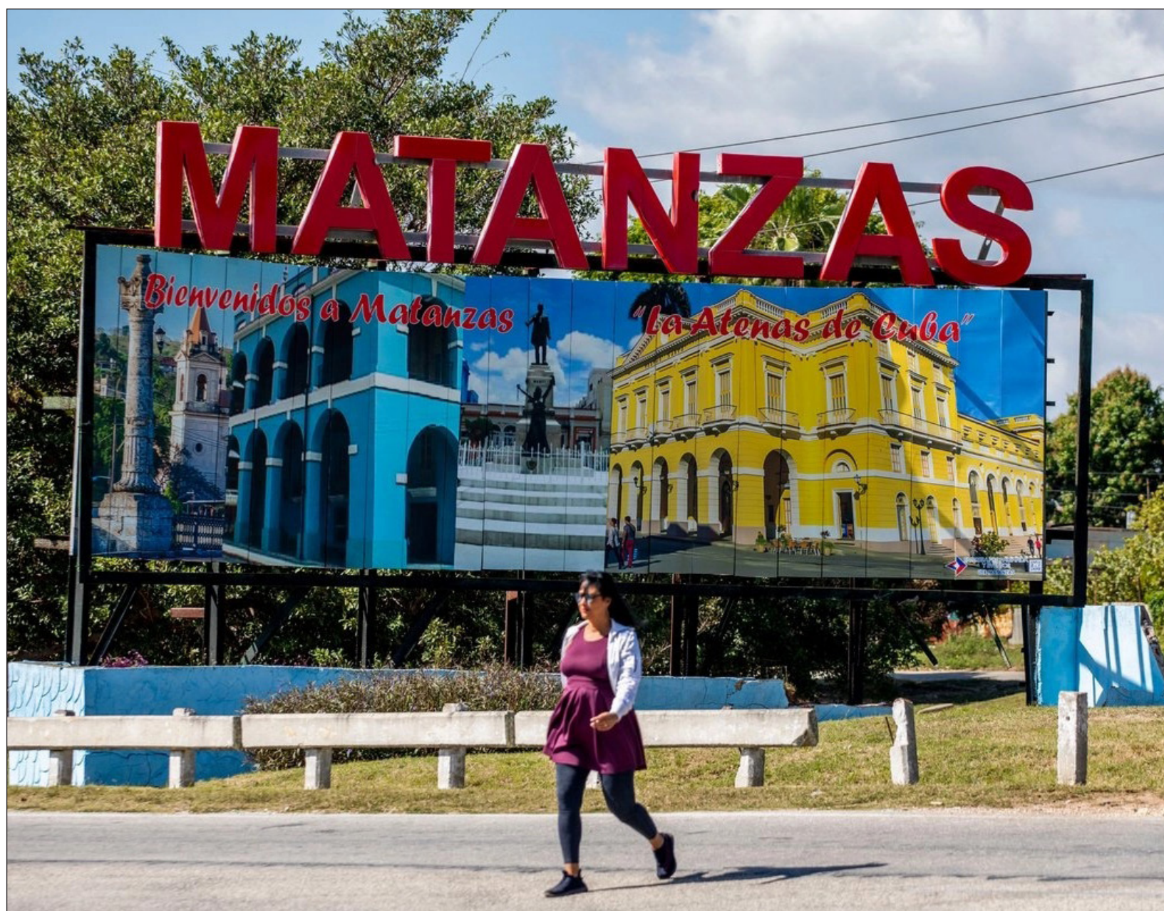
▲ El Ministerio del Comercio Interior cubano aseveró que la operación para recibir y distribuir los productos “se está realizando con la mayor celeridad”, por lo que llegarán de manera paulatina a los territorios; “se beneficiará a personas de las provincias de Artemisa, La Habana, Mayabeque y el municipio especial Isla de la Juventud”.

El Ministerio del Comercio Interior cubano aseveró que la operación para recibir y distribuir los productos “se está realizando con la mayor celeridad”, por lo que llegarán de manera paulatina a los territorios señalados.