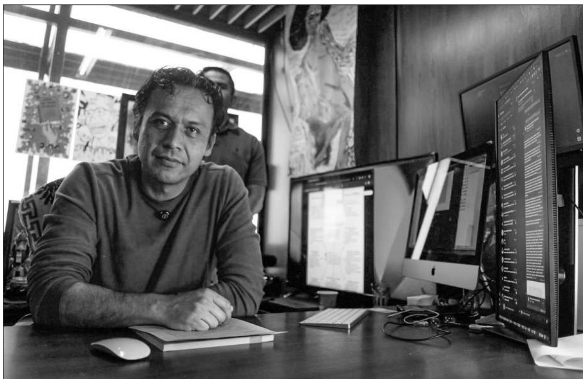
▲ “La herencia histórica es perversa. El modelo de Vasconcelos, profundo en su origen, termina viciándose. El libro de texto gratuito, que nació como unidad nacional, derivó en un instrumento de posicionamiento ideológico”.