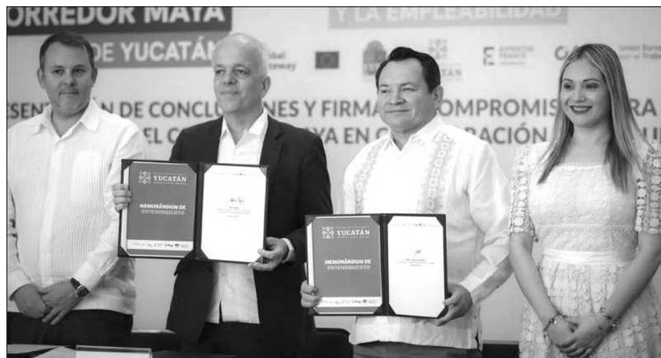
▲ El gobernador señaló que Yucatán se encuentra en un momento estratégico y que el Corredor Maya abre oportunidades de inversión, comercio y turismo; este dinamismo debe acompañarse de capacitación técnica y mecanismos que faciliten la transición a la formalidad.

Al dirigir su mensaje, el gobernador señaló que Yucatán se encuentra en un momento estratégico y que el Corredor Maya abre oportunidades de inversión, comercio y turismo; este dinamismo debe acompañarse de capaci-