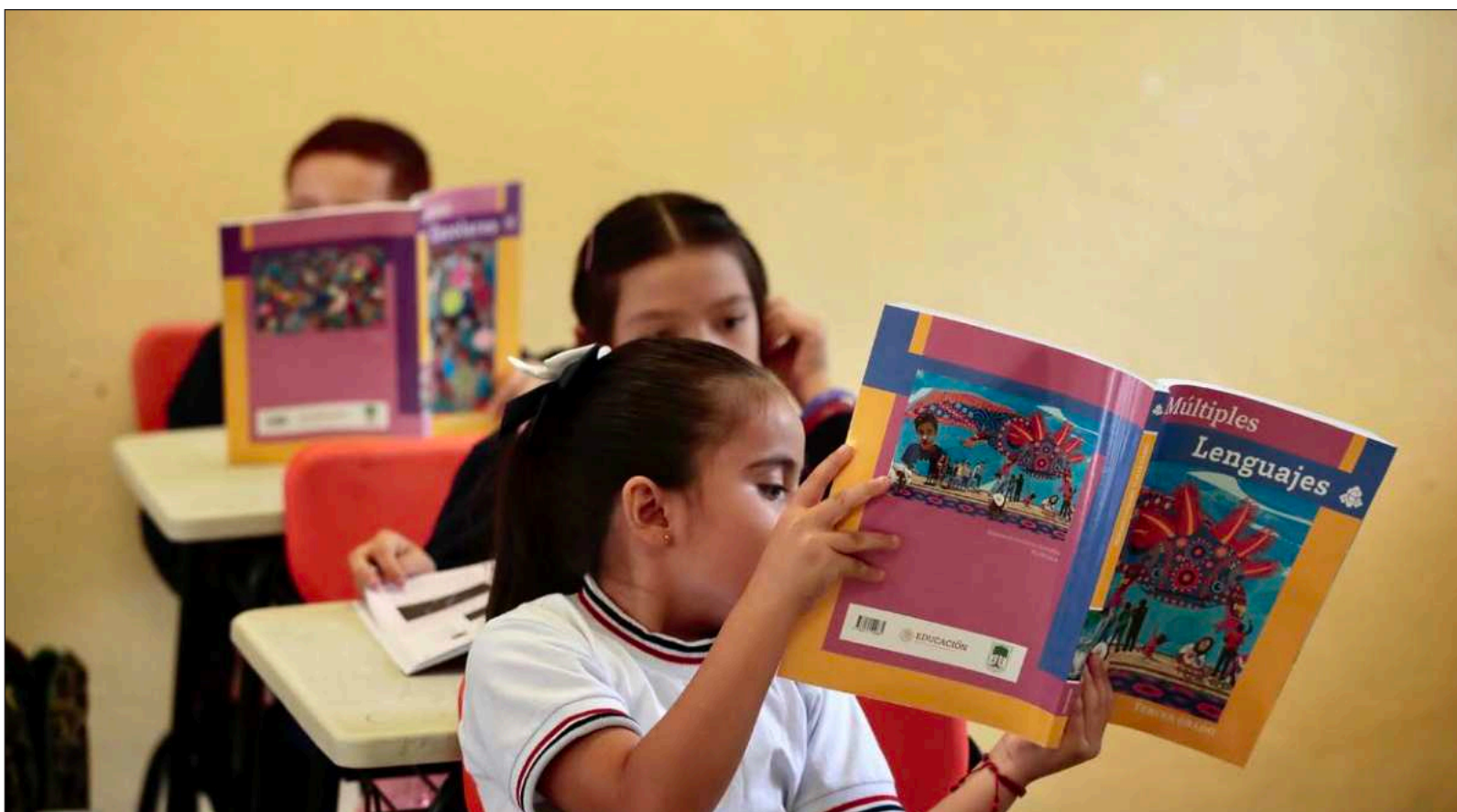
▲ "Sheinbaum ha garantizado que los gratuitos libros de texto seguirán intocados, salvo por el agregado de figuras femeninas históricas".