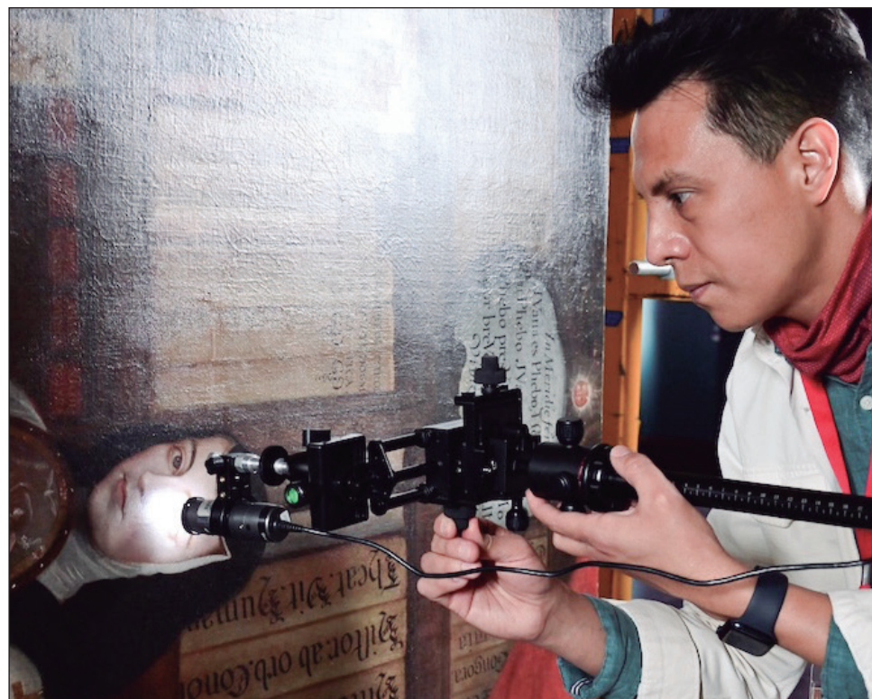
▲ Aspecto de los análisis al retrato de Sor Juana Inés de la Cruz elaborado por Miguel Cabrera en 1750, y detalles de la misma pintura. Éste forma parte de la colección del Museo Nacional de Historia en el Castillo de Chapultepec.

El óleo de Miguel Cabrera—quien en 1751 inspeccionó el ayate con la imagen de la Virgen de Guadalupe y realizó tres copias un año después, una de las cuales fue enviada a Roma para el papa Benedicto XII— fue sometido a técnicas no invasivas, a fin de conocer los