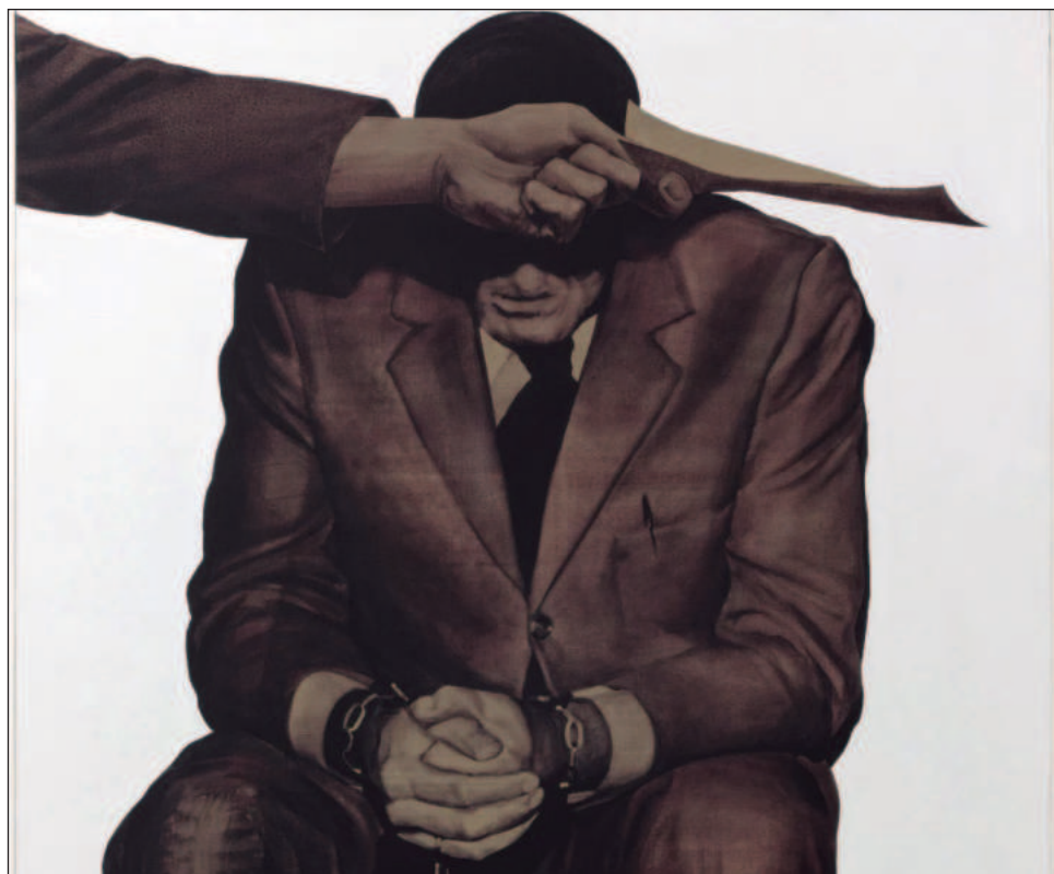
▲ La ampliación consiste en una introducción y tres itinerarios; se parte de la transición a la democracia en España para después abordar temas como el feminismo, el lesbianismo, el auge del sida, la llegada de la heroína y los atentados del 11S en EU.