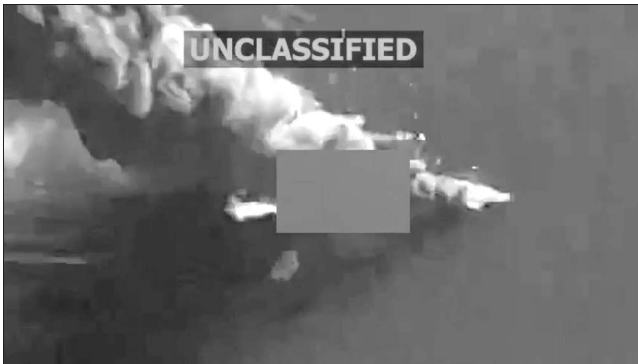
▲ Desde que Estados Unidos comenzó su campaña en septiembre, han fallecido al menos 140 personas.

Estados Unidos inició su campaña contra esas presuntas narcolanchas en septiembre, y desde entonces han muerto al menos 140 personas en cerca de cuarenta ataques.