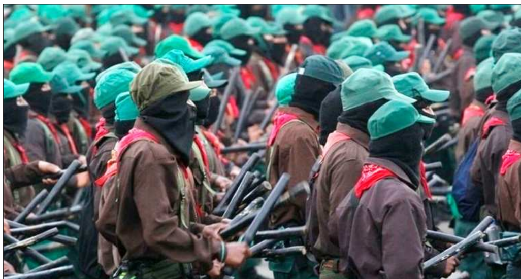
▲ Volver a escuchar a Chiapas es urgente si de verdad se quiere un México más justo.

La desilusión puede conducir a la decepción profunda, a la apatía generalizada, que termina por cuestionar si existen motivos válidos para ejercer la ciudadanía a través del voto. Ese espíritu es el que suele guiar las transformaciones, por lo que volver a escuchar a Chiapas es urgente si de verdad se quiere un México más justo.