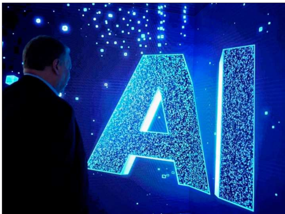
▲ Más de 52% de los países analizados en un ejercicio comparativo emplean la IA en análisis de riesgo, y 49 por ciento la usa para detectar evasión y fraude fiscal.

A su vez, para el uso y gobernanza de la IA en el ám-