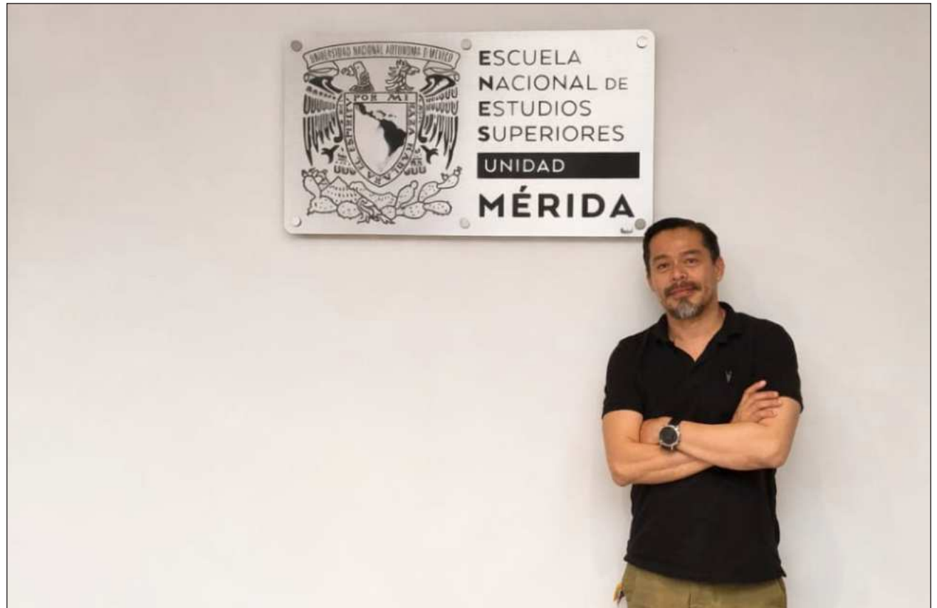
▲ El investigador poblano es oceanólogo por la Universidad Autónoma de Baja California, obtuvo el grado de maestro en Ciencias con especialidad en Biología Marina por el Cinvestav, Unidad Mérida, y el grado de doctor en Ecosistemas por la Université de Montpellier.