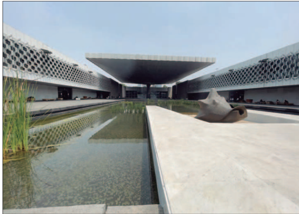
▲ En la programación se incluyen propuestas escénicas, narraciones orales, charlas, presentaciones editoriales, cursos y actividades para infancias.

La Unidad de Culturas Vivas, Patrimonio Inmaterial e Interculturalidad presentará el libro infantil español-totonaco Chatin Maktinaj Kgosni: Un pequeño volador , que narra las vivencias de un niño en el pueblo de San Pedro, Puebla, donde la vida cotidiana y el