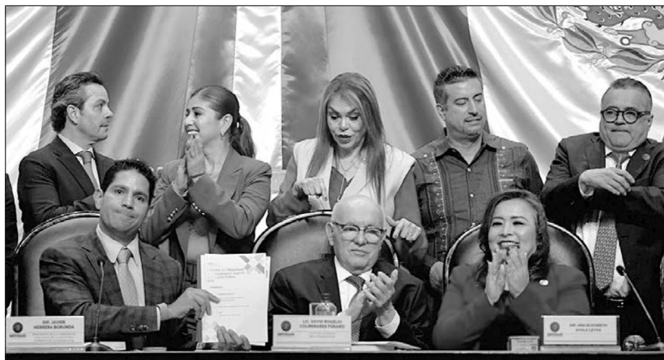
▲ De los 188 informes correspondientes a entes del gobierno federal, se reportaron más de 5 mil millones de pesos pendientes de aclaración por parte del Poder Judicial.

Colmenares, de 74 años de edad, presentó este martes, en el Salón Verde de la Cámara de Diputados, la Tercera Entrega de los Informes Individuales de Auditoría y el Informe General Ejecutivo de la Cuenta Pública 2024, la