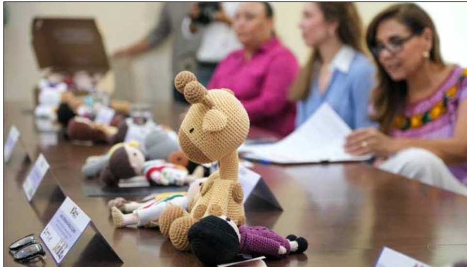
▲ El año pasado la gobernadora Mara Lezama anunció una colaboración con la asociación X Justicia, en coordinación con el Poder Judicial del Estado y la Defensoría Pública Federal, para revisar los expedientes de las mujeres privadas de la libertad en la entidad.

"Estamos capacitando a las mujeres privadas de la libertad para el tema de creación de productos de crochet y ellas son un vínculo para poder vender este producto".