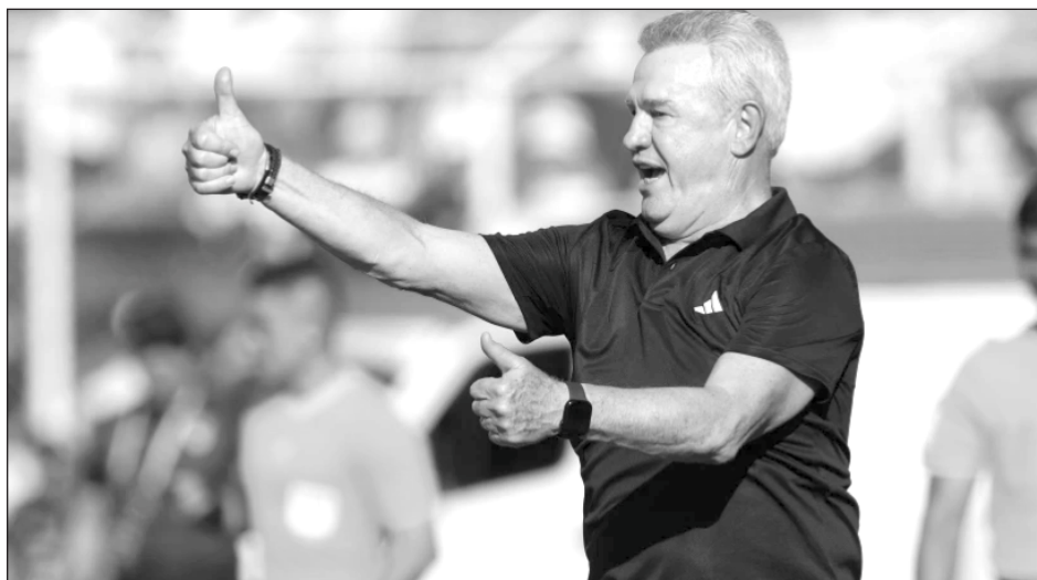
▲ El equipo de Javier Aguirre cerrará su preparación para la copa del mundo con partidos ante Ghana, Australia y Serbia. La selección debutará en el torneo el 11 de junio frente a Sudáfrica en el Azteca.

"Son los rivales idóneos para ayudar en la preparación de la selección rumbo a su participación en la copa del mundo", dijo Ivar Sisniega, presidente de la Federación Mexicana de Fútbol.