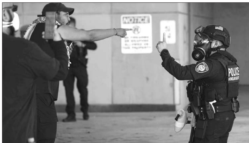
▲ En septiembre, un tribunal federal de apelaciones dictaminó que el uso de la ley por parte de Trump para la detención de migrantes era ilegal, aunque sigue la disputa en juzgados.

Fort Bliss, una extensa base militar en el desierto de El Paso, Texas, donde se retuvo a japoneses, japoneses-estadunidenses, italianos y alemanes durante la Segunda Guerra Mundial, fue reconvertida en una instalación para la represión contra