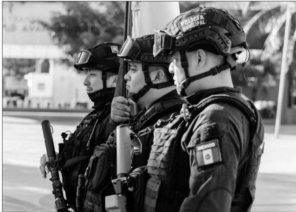
▲ Entre las acciones contempladas para el fortalecimiento de la seguridad en el municipio se encuentra el equipamiento total del C4, con la meta de que esté operando 100 por ciento durante el segundo trimestre de 2027.

“Entendemos que las necesidades son muchas, pero el recurso es limitado. Lo que tenemos que ha-