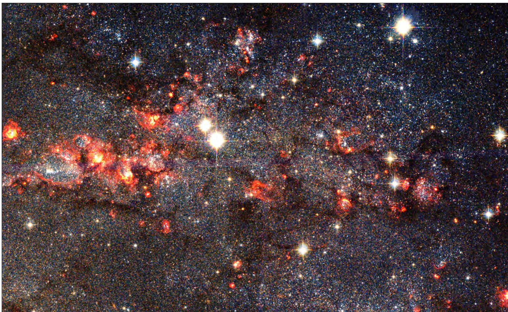
▲ La galería de objetos celestes captados por el Hubble pertenecen a una colección conocida por los astrónomos aficionados como el catálogo Caldwell.