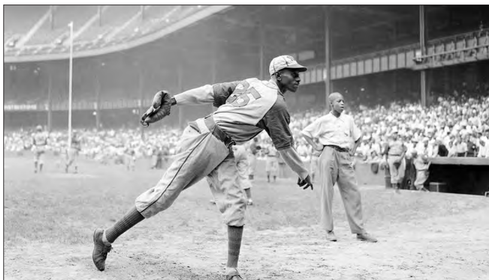
▲ En esta foto del 2 de agosto de 1942, el lanzador de los Monarchs de Kansas City, Leroy Satchel Paige, se prepara antes de un partido contra los New York Cuban Stars, de las Ligas Negras.

MLB señaló que consideró las recomendaciones