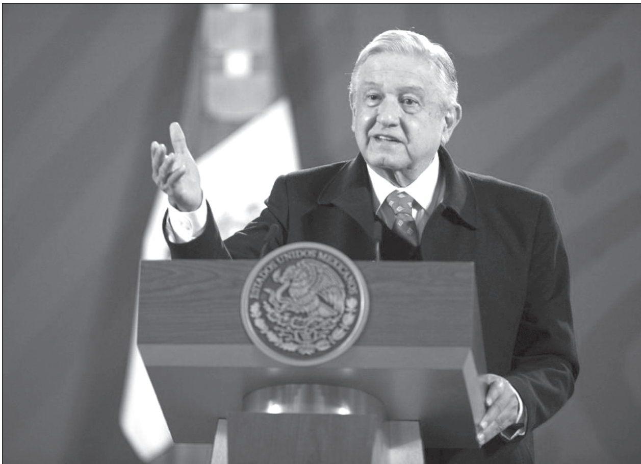
▲ El manejo de la vacunación, según acusan gobernadores de la Alianza Federalista y el Partido Acción Nacional, obedece a criterios políticos y no científicos.

Mientras más manos se tengan para aplicar la vacuna, señaló, más pronto saldremos adelante y más vidas se podrían salvar, pues además no hay ningún impedimento legal para que los gobiernos de los estados puedan comprar y aplicar vacunas.