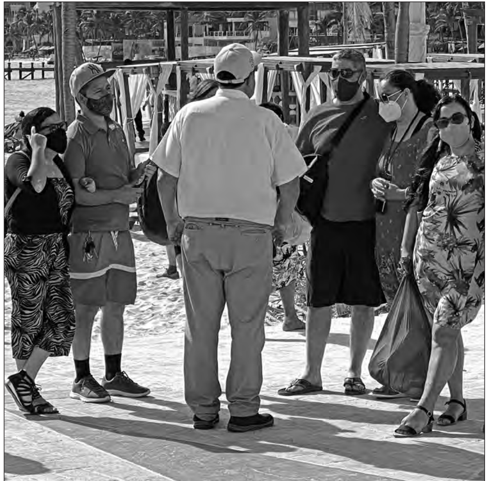
▲ El gobierno del estado aplicará 10 mil pruebas rápidas en las colonias con mayor índice de contagios en todo el estado.