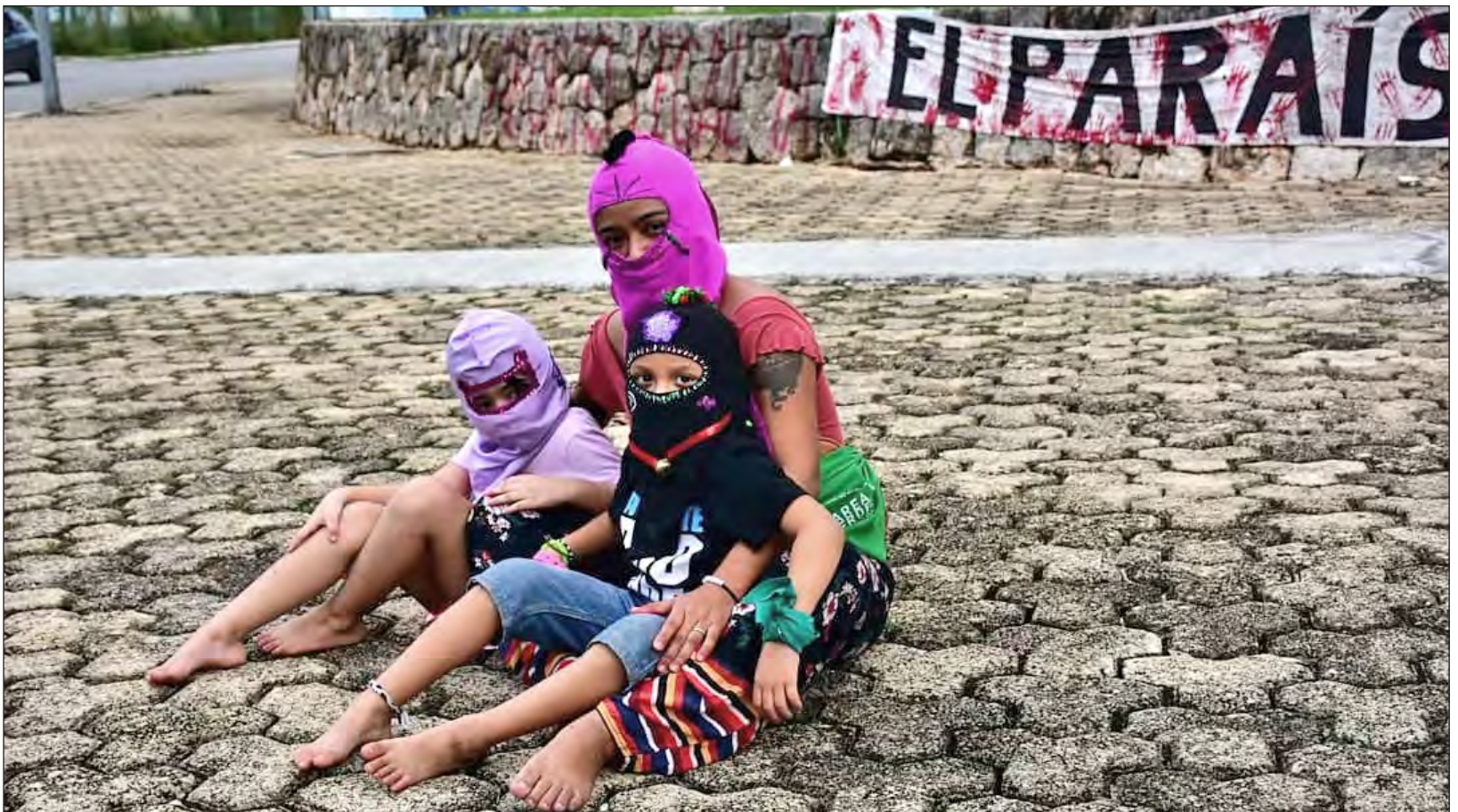
▲ Las colectivas narraron las diferentes acciones que han realizado por los derechos humanos de las mujeres, incluida la toma pacífica del Congreso del Estado.

La FMOPDH, la CNDH y la ONU-DH recordaron la importancia de las medidas precautorias o cautelares como instrumentos para evitar la consumación o agravamiento de las violaciones de derechos humanos e insistieron en que la solicitud de estas medidas por parte de los organismos públicos de derechos humanos debe ser recibida por las autoridades como un aporte para la identificación de situaciones de riesgo para la plena vigencia de los derechos humanos.