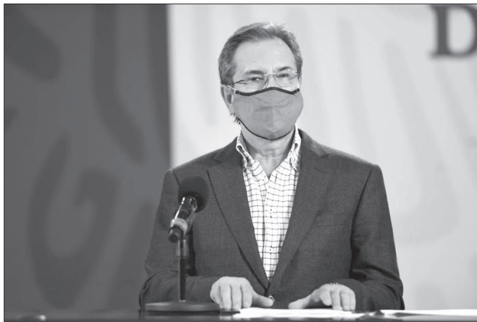
▲ El nombramiento deberá ser ratificado por el Senado de la República y recibir el beneplácito del gobierno de Estados Unidos.

"He dado instrucciones al secretario de Relaciones Exteriores, Marcelo Ebrard, para que se le considere como embajadora eminente, agradecerle sus servicios, sobre