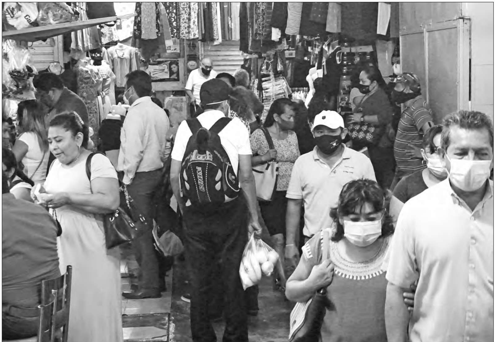
▲ Ahora es responsabilidad de la gente tomar cartas en el combate al COVID, pero se requiere una sociedad muy madura.