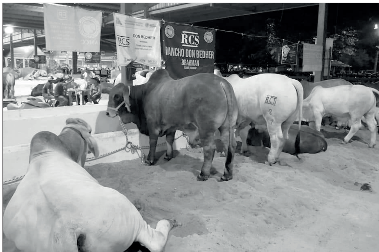
▲ Uno de los factores que afectó a los ganaderos fue la cancelación de ferias y exposiciones, ya que éstas son motivo de mayores ventas de animales.

Según el Servicio Nacional de Sanidad, Inocuidad y Calidad Agroalimentaria (Senasica), el pronóstico de venta para este 2020 hasta el mes de noviembre era de 32 mil 873 toneladas, incluso esto representaba una cifra mayor a lo vendido en el mismo período de 2019, que fue de 32 mil 648.