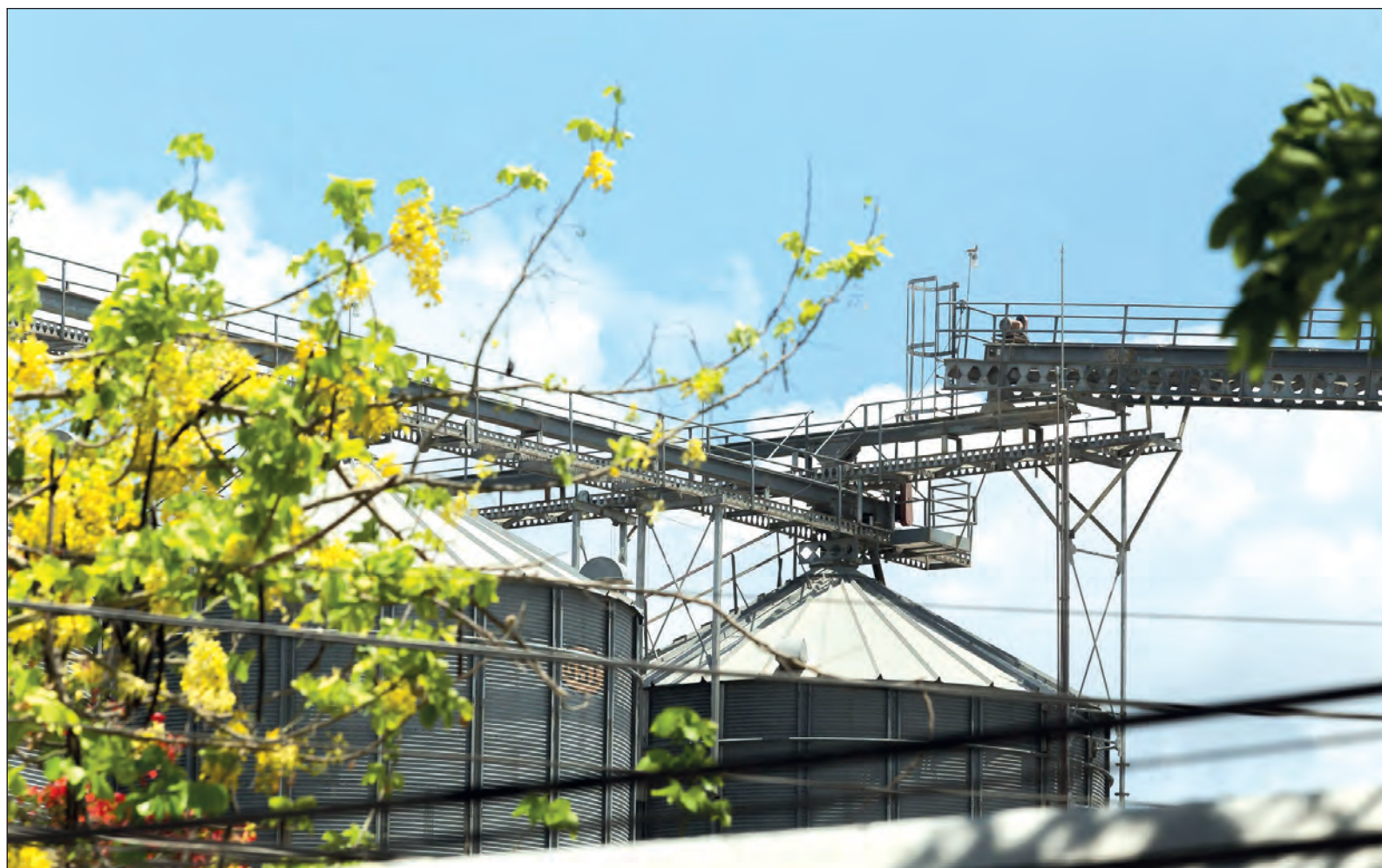
▲ Del molesto ruido que emite la harinera están al tanto los responsables, también las autoridades estatales, sin embargo no hay propuestas para solucionarlo.