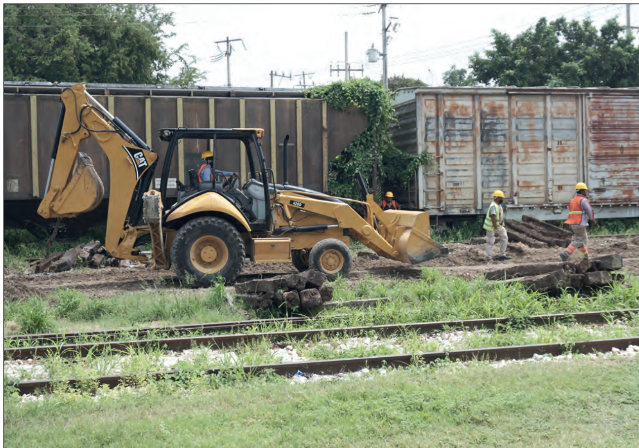
▲ El Presidente supervisará los avances de la construcción del Tren Maya en el tramo 2, de Campeche, y 3 y 4, en Yucatán.

En el año, a pesar de la pandemia, López Obrador ha visitado en tres ocasiones al sureste, en los meses de mayo, junio y octubre, siempre por