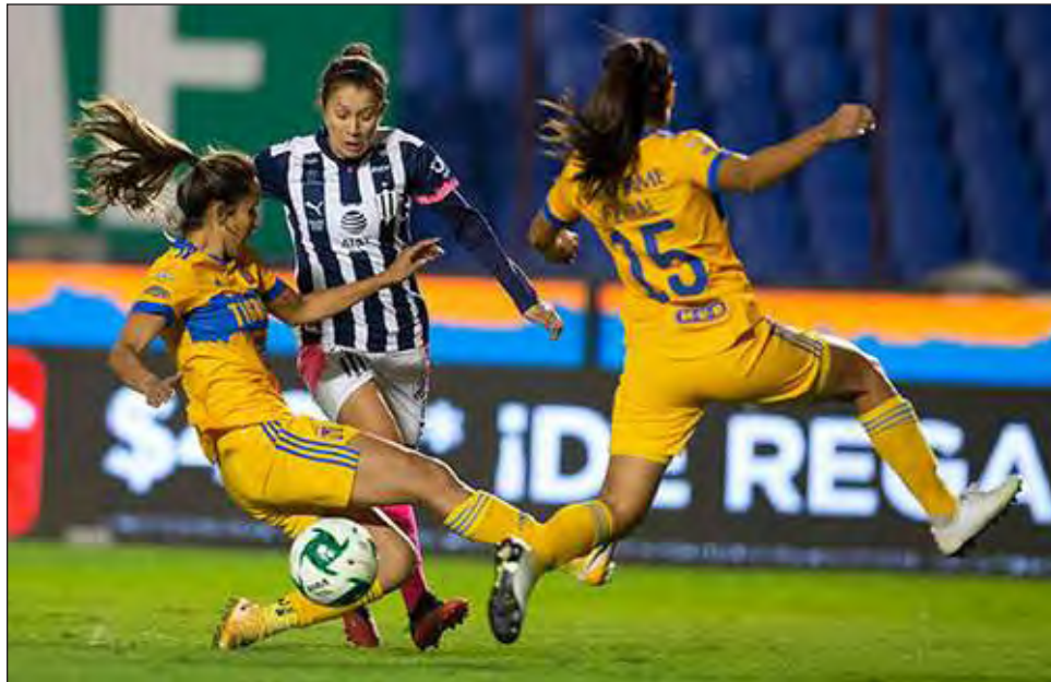
▲ Las universitarias obtuvieron su tercer título de la Liga Mx Femenil, tras superar a Rayadas en una emocionante serie de tiros penales.

El equipo varonil de los felinos, dirigido por Ricardo Ferretti, también dio una alegría a sus seguidores al superar anteayer 4-0 al NYC FC y avanzar a las semifinales de la Liga de Cam-