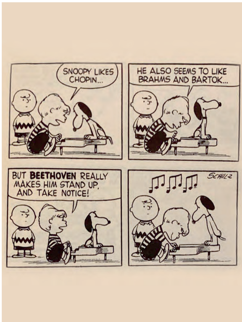
▲ El cumpleaños de Beethoven fue motivo de varias tiras de la historieta Peanuts , un motivo de fiesta para el niño Schroeder, prodigio del piano. Ilustración Charles Schulz

En el ámbito internacional, la Fundación para el Renacimiento de la Cultura Clásica