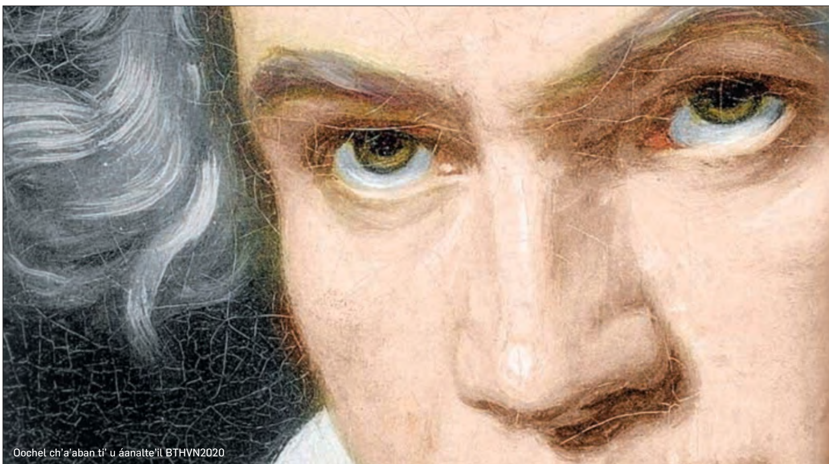
Oochel ch'a'aban ti' u áanalte'il BTHVN2020

▲ U kaajil Bonn, u lu'umil Alemania yéetel yóok'ol kaabe' tu k'iimbesajo'ob ka'ap'éeel siiglo yéetel uláak' táanchúumuk síjik Ludwig van Beethoven. Kex tumen yaan u k'oja'anil COVID-19e' ki'imak óolta'abij; k'iimbesaje' tak 2021 u ts'o'okol.