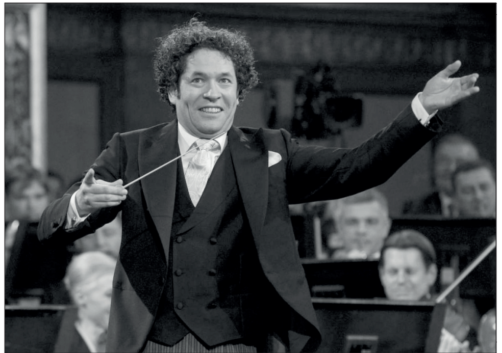
▲ En América, Gustavo Dudamel anunció un maratón en Youtube, con las nueve sinfonías de Beethoven interpretadas por la Sinfónica Simón Bolívar.

En Berlín, la orquesta de la ciudad, una de las mejores del orbe, preguntó más audaz: ¿Qué amas de Beethoven? ¿Qué te gustaría conversar si pudieras sentarte a tomar un café con él? También, lanzó la