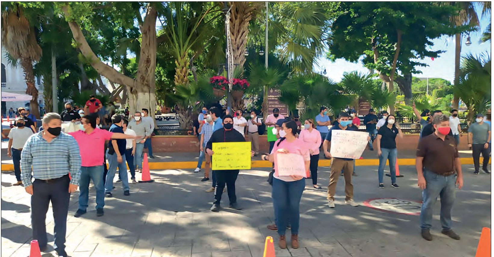
▲ La protesta de los banqueteros afectó el tráfico cinco cuadras alrededor de la Plaza Grande, causando la molestia de conductores particulares y usuarios de los taxis colectivos.