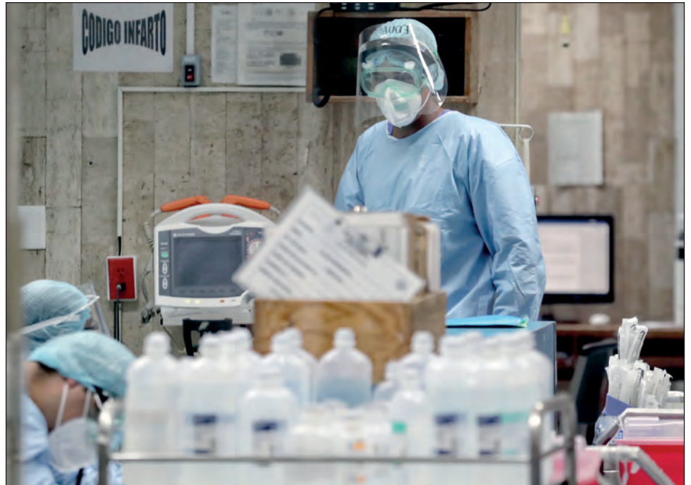
▲ En el estado, los servicios públicos de salud cuentan con dos mil 828 camas, de las cuales 578 fueron destinadas para personas enfermas por COVID-19.

Sobre el número de camas de estos dos hospitales llenos, la dependencia estatal registra que en el Hospital