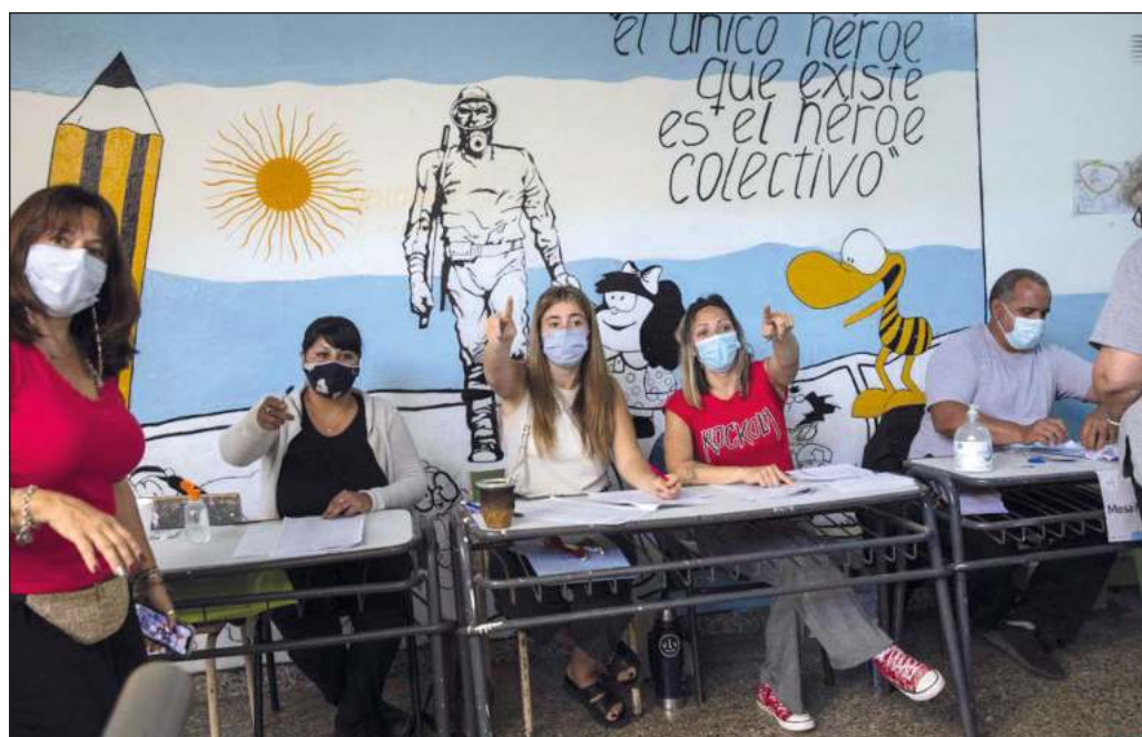
▲ Con una participación superior al 67 por ciento, la principal formación opositora al gobierno de Alberto Fernández obtuvo 41.53 por ciento de los sufragios.

El resultado electoral es preocupante para la nación austral porque el “cambio” ofrecido por las derechas no es más que la vuelta al neoliberalismo puro y duro cuya restauración fracasó estrepitosamente durante el mandato de Macri (2015-2019) y llevó al país a una aguda crisis económica y social. Pero es también inquietante para la región, en la medida en que el debilitamiento del gobierno progresista argentino dificulta los esfuerzos de las sociedades latinoamericanas para la superación definitiva de ese modelo, la plena recuperación de las soberanías y la reactivación de un proceso de integración regional a todas luces necesario.