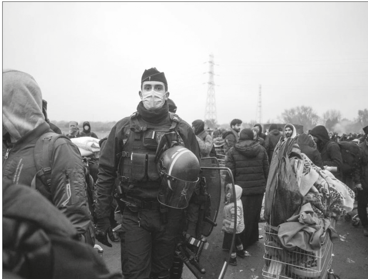
▲ El alcalde de Grande-Synthe dijo que había cerca de mil 500 migrantes, en su mayoría kurdos.

Además, el Gobierno británico ha implementado un sistema de inmigración muy rígido tras el Brexit. La ministra del Interior británica, Priti Patel, quiere que a los migrantes les resulte más difícil solicitar asilo a su llegada al país europeo