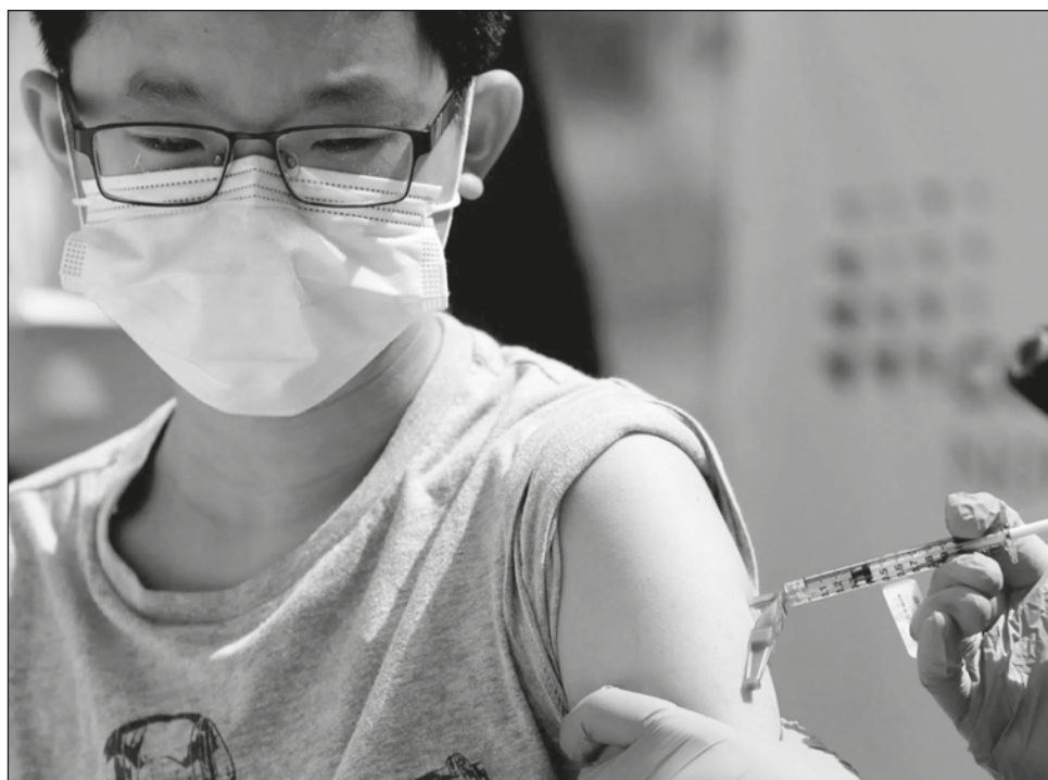
▲ Según el gobierno federal, el sector de 10 a 14 años presenta una muy baja mortalidad por el nuevo coronavirus.

“Abrimos próximamente niñas, niños y adolescentes de 15 a 17 años, aun sin comorbilidades. Este es el elemento nuevo; explicaremos cuál es la lógica científica detrás de ello”, explicó durante la conferencia de prensa en Palacio Nacional.