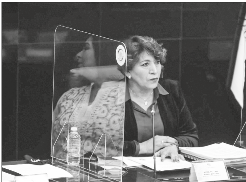
▲ Las autoridades de educación investigan las causas del no retorno a las aulas, que puede ser por miedo, cuestión económica o por la pérdida de los padres.