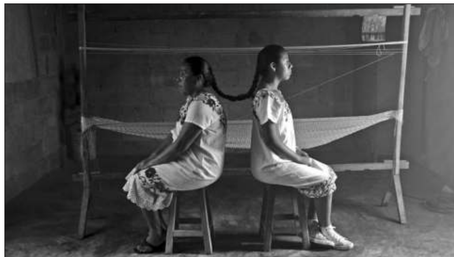
▲ Ahora hay fotógrafos que miran la vida cotidiana de sus pueblos incluso desde un punto de vista fantástico, desde la creatividad.

“En otros países me ven como indígena, pero aquí en mi país no, porque no hablo maya. En Mérida, el proceso