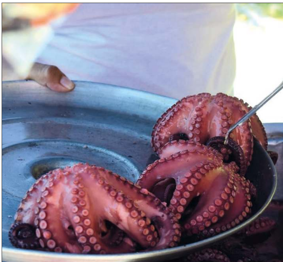
▲ En la Tercera Muestra Gastronómica del Pulpo Maya podrán degustarse exquisitos platillos hasta el 29 de noviembre, en ocho restaurantes de Río Lagartos.

Esto representa 295 por ciento encima del pulpo vulgaris, del cual han capturado poco más de 5 mil toneladas.