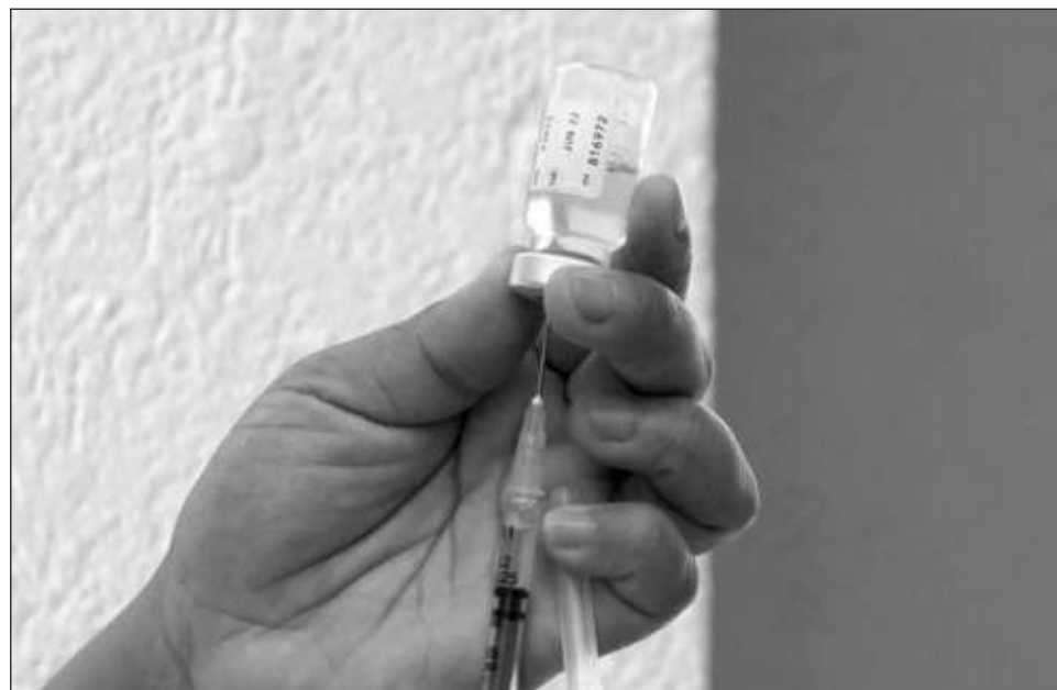
▲ Según el subsecretario de la corporación, hasta el momento no han habido Policías muertos por el nuevo coronavirus en la entidad.

“En un trabajo conjunto con la Secretaría de Marina, a los elementos de la PEP del Carmen les fue aplicada la vacuna contra el Covid-19, logrando de esta manera, que el destacamento este protegido y preparado para