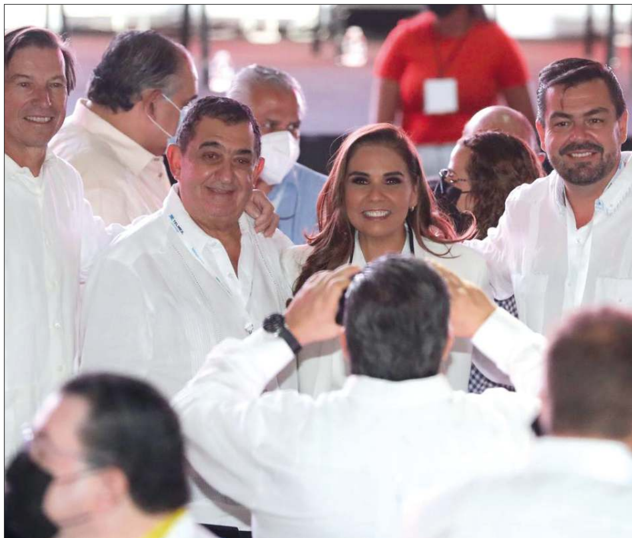
▲ De acuerdo con la alcaldesa de Benito Juárez, Mara Lezama, el aeropuerto de Cancún ya registra un promedio de 500 operaciones diarias; números similares a la época prepandemia.

Mara Lezama afirmó que han estado hablando con el director general del Fondo Nacional de Fomento al Turismo (Fonatur), Rogelio Jiménez Pons, de la posibilidad de un autódromo para Cancún: "aunado al Tren Maya vienen proyectos que sin duda son importantes para la ciudadanía".