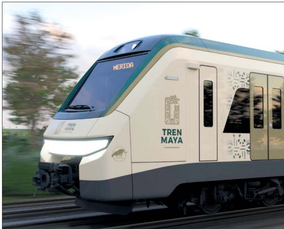
▲ El diseño expuesto es un homenaje a la estética visual de la región.

En el pabellón de Fonatur y sus empresas filiales se presentarán ante visitantes e inversionistas el Proyecto Prioritario Tren Maya y los demás productos turísticos de la dependencia. Además, se ofrecerán las oportunidades de comercialización en los Centros Integralmente Planeados (CIPs) como Ixtapa, Huatulco y Los Cabos, entre otros.