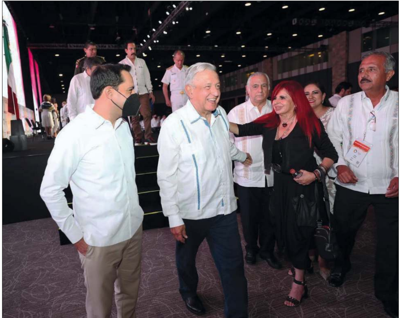
▲ Te'e k'iino'oba', táan u beeta'al u noj meyajil Tianguis Turístico 2021, le beetike' tu péetlu'umil Yucatán kóoj u jala'achil u noj lu'umil México, Andrés Manuel López Obrador, je'el bix chíikpajal te'e oochela', tu tséel u jala'achil Yucatán yéetel x jala'achil Kaanpech, Layda Sansores San Román. Oochel Twitter @MauVila

Jala'ache' tu k'a'ajsaj te'e jueves ku talaa', yaan u much'ikubáaj yéetel u jala'achil Estados Unidos, Joe Biden yéetel u yáax ministroil Canadá, Justin Trudeau ti'al u xak'altiko'ob u moka'aañil koonol tu'ux táaka'an le óoxp'eel noj lu'umo'obo'.