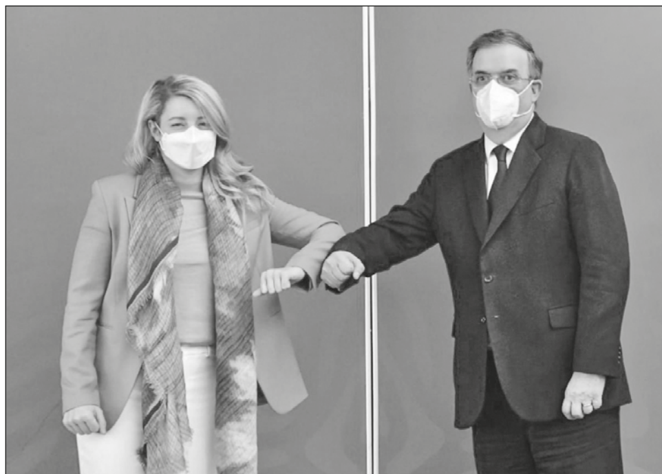
▲ Mélanie Joly, canciller de Canadá, se encuentra en México para participar en una mesa redonda con empresarios líderes de su país y una reunión con representantes de comunidades indígenas.

También discutieron de los preparativos para la Novena Cumbre de Líderes de América del Norte, que se realizará este jueves 18 de noviembre en Washington.