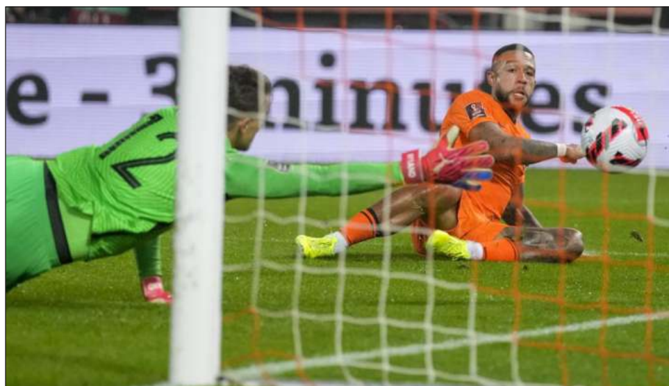
▲ Memphis Depay anota el segundo gol de Holanda en la victoria 2-0 ante Noruega, en las eliminatorias mundialistas.

Los ucranianos, que quedaron invictos al empatar seis de sus ocho partidos del Grupo D, prepararon al segundo sitio, por encima de Finlandia, que quedó eliminada tras caer por 2-0 en