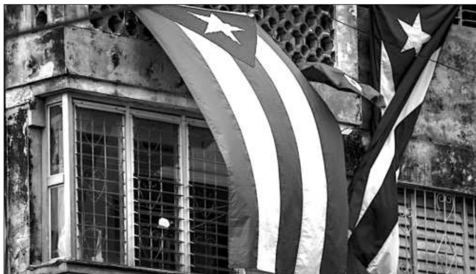
▲ Pese a que la manifestación programada para el 15 no se llevó a cabo, Archipiélago pidió mantener las protestas en contra del gobierno hasta el 27 de noviembre.

“El gobierno cubano ha respondido a nuestros reclamos como lo hace una dictadura: militarización extrema de las calles, más de 100 activistas sitiados, detenciones arbitrarias, desapariciones forzadas, actos de repudio, violencia, amenazas, coacción y discursos de odio”, escribió el grupo en su página de Facebook. “El recrudecimiento de la represión contra la ciudadanía y los manifestantes pacíficos no es ni será aceptada”.