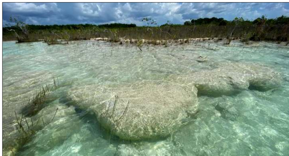
▲ El texto aborda la necesidad de que en Bacalar haya un esquema legal de protección nacional e internacional.

"Estamos creando la mayor destrucción que ha habido. Hay biólogos como Raúl Montenegro que le dieron el premio alternativo Nobel, y él dice que hemos fracasado como especie, que nuestros antecesores vivos, vivieron más