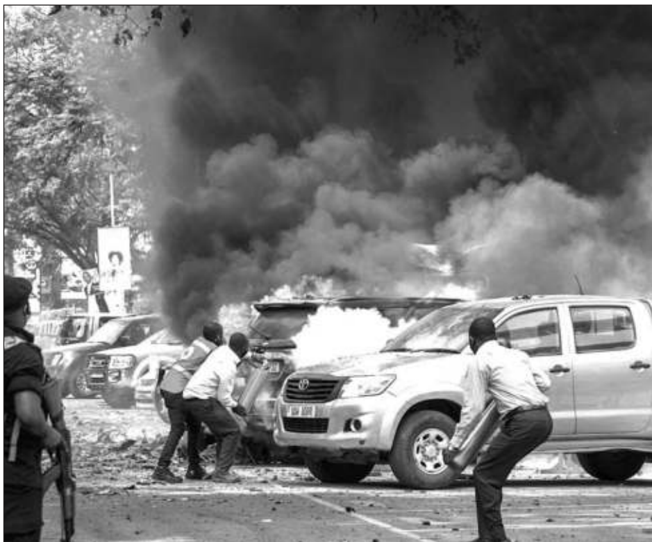
▲ El de ayer fue el sexto ataque extremista que golpea a Uganda en los últimos dos meses.

De acuerdo con el comunicado del EI, el primer atacante, identificado como Abu Sabr al Ugandi, “hizo detonar una mochila bomba cerca del puesto de control de la sede de la Policía”, mientras que los otros dos suicidas “hicieron explotar sus dos mochilas bombas que llevaban en una moto en las cercanías del Parlamento”.