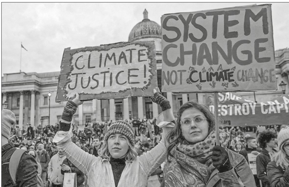
▲ Putting narrow national interests ahead of the interests of humanity has been the hallmark of many leaders.

SOME PROGRESS WAS made, notably the agreement by many countries to preserve forests and to reduce methane emissions, but not enough was agreed to that would being temperature rises to a maximum of 1.5° C by 2030. Not enough was done to hold the developed world to commitments made during the past decade to help developing countries mitigate climate change and make the investments required to address