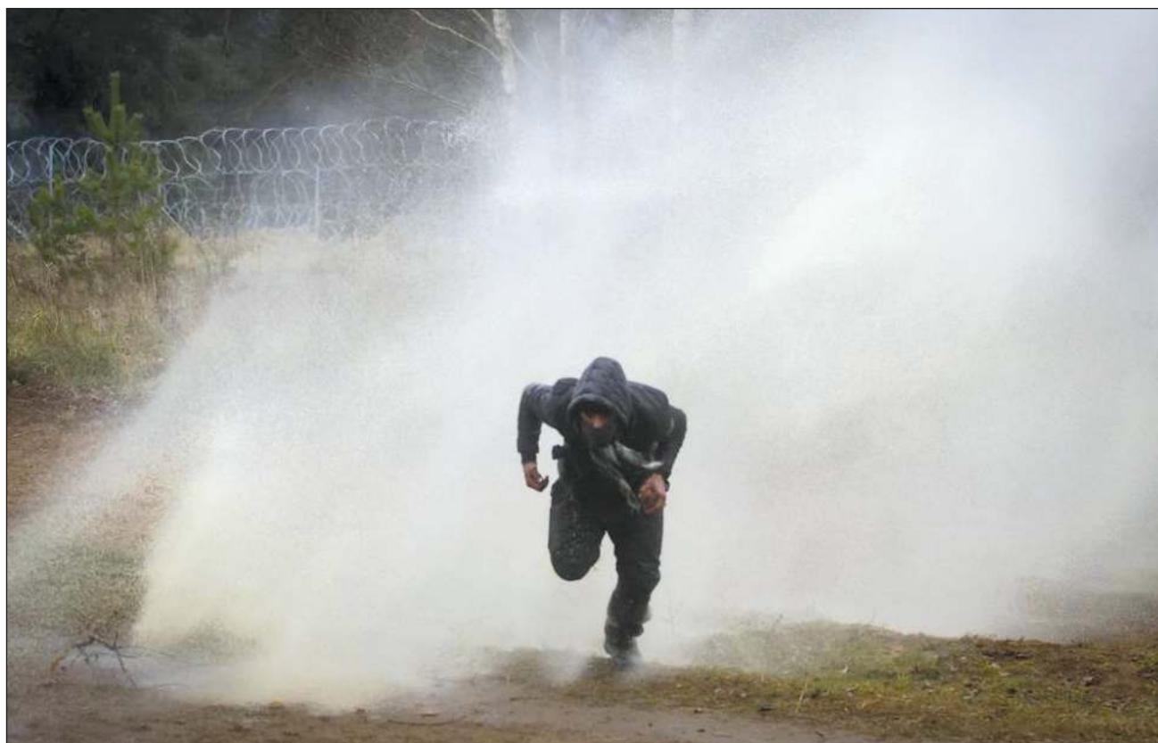
▲ Cerca de dos mil personas se encontraban en campamentos improvisados en la frontera, pero se cree que apenas un centenar participó de los ataques a las fuerzas polacas en el cruce cerca de Kuznika.

Los sucesos significaron una escalada durante la tensa crisis en la frontera oriental de la Unión Europea. Los países occidentales acusan al presidente bielorruso, Alexander Lukashenko, de usar a los migrantes para desestabilizar el bloque de 27 naciones en represalia por las sanciones al régimen autoritario; Bielorrusia lo niega.