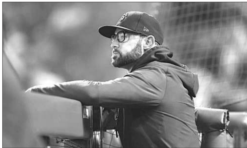
▲ Gabe Kapler condujo a San Francisco al mejor récord de las Grandes Ligas.

Quizás ése fue otro ejemplo de que Cash y Tampa Bay van a la vanguardia en