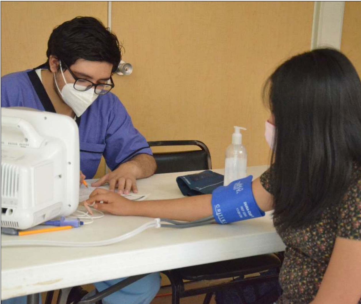
▲ La logística de aplicación de la vacuna estará a cargo nuevamente de la Secretaría de Bienestar.