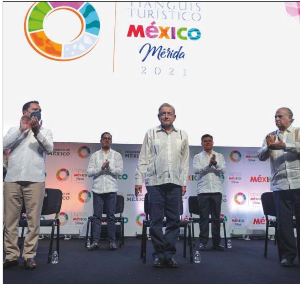
La presente edición del Tianguis Turístico es la más planeada y organizada, según destacó Mauricio Vila Dosal, gobernador anfitrión.

Resaltó la belleza arqueológica de Calakmul, Campeche, como atractivo turístico que detonará a partir del Tren Maya, y puso a Yuca-