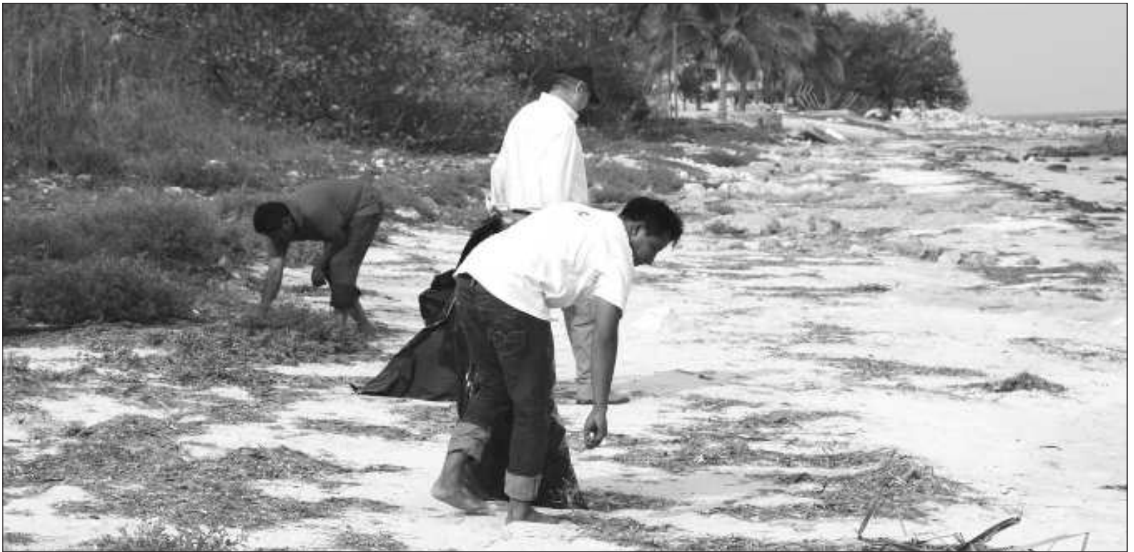
▲ La actividad arrancará del hotel Kore hasta el kilómetro 7 de la carretera costera Tulum-Boca Paila a las 7 horas del 19 de octubre.