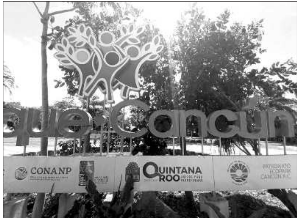
▲ Como parte de la ruta Top 5 se inauguró el Museo de los Desechos no Desechos, el paseo de México desconocido y el área de parkour, que se suma a los 15 jardines ya existentes en el Parque Cancún.

Actualmente suman 150 mil visitantes, que de mo-