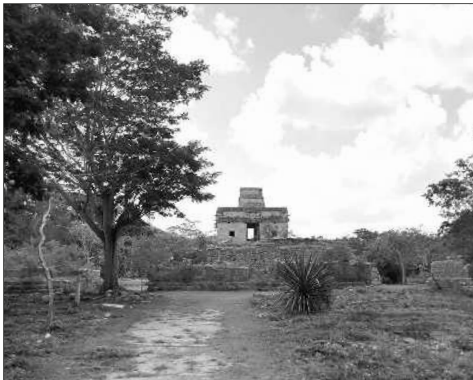
▲ La zona arqueológica de Dzibilchaltún cerró al público el pasado 30 de enero en el marco de la aplicación del Promeza, programa derivado del Tren Maya.

Dijo que entre las obras pendientes está el Museo y el