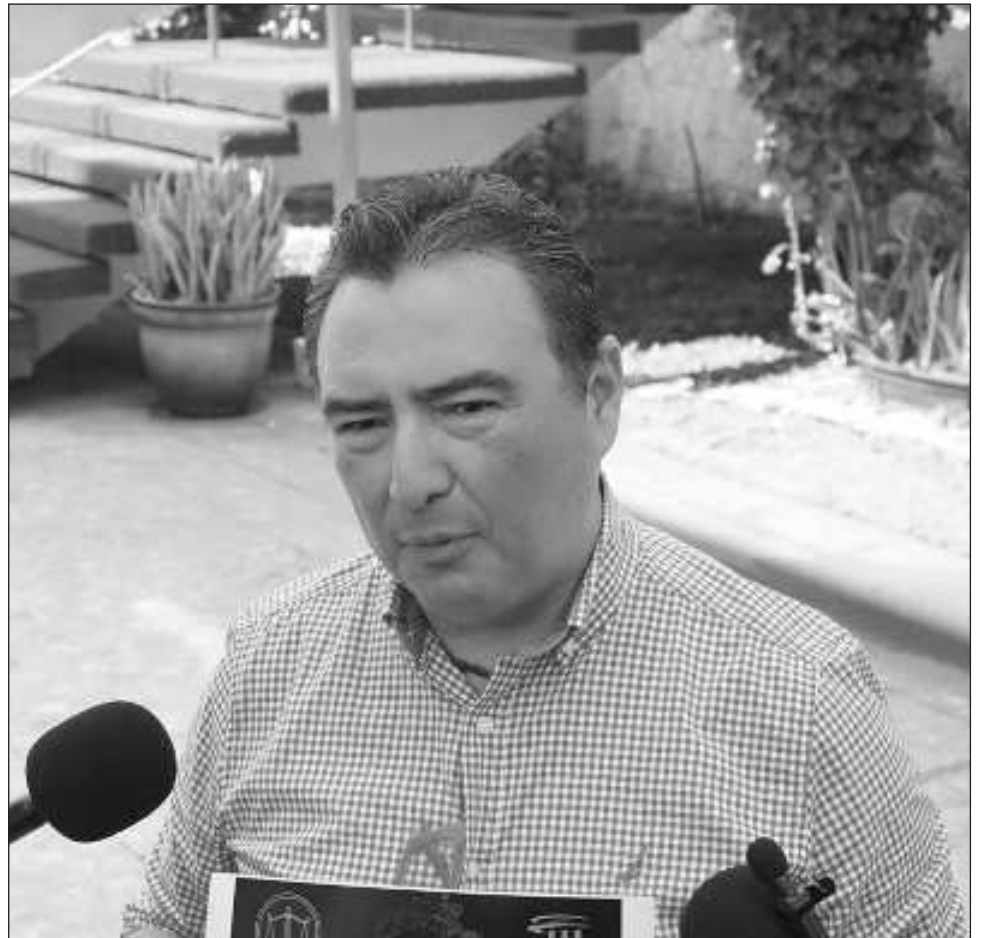
▲ El regidor exigió “que se informe cuáles son los tramos de responsabilidad y acciones a ejecutar, para poder evaluar y medir sus resultados en beneficio de la gente”.

y mucho menos sin darle garantías a los ciudadanos con convenios en lo oscuro, queremos que se aclare la forma de operación de este convenio y sus atribuciones, pues de no cumplirse podría incluso exigirse la cancelación del servicio”, finalizó.