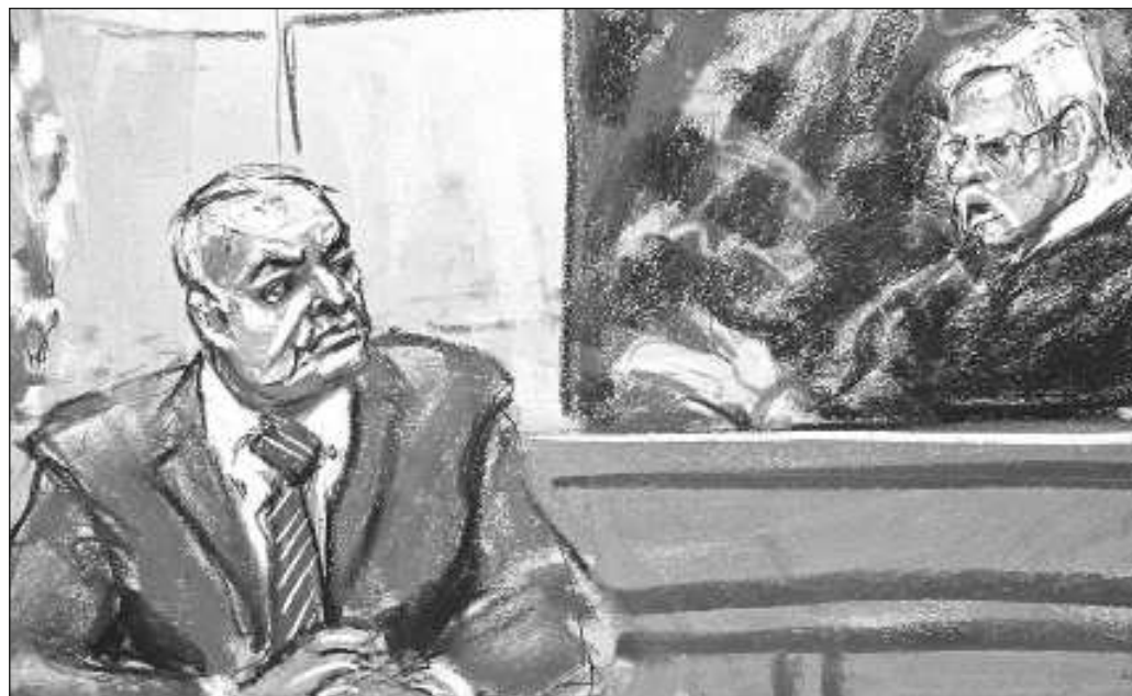
▲ Lo que estaba a juicio eran las maniobras del mexicano para introducir la cocaína y otras sustancias desde México; no en manos de quién quedaba toda esa mercancía.

En el proceso García Luna, la sentencia no es el final. Más de cuatro años de juicio, pero todavía es preciso detenerse y analizar qué se dijo, quién lo dijo, y sobre todo lo que no se dijo. Los silencios son también motivados por el interés, por algo que se intenta proteger. Habrá para quien la pena impuesta resulte insuficiente y que posiblemente en dos décadas, si es que le reducen la condena, alguien exigirá que se le juzgue en México, algo que la legislación actual permite, pero que a lo mucho conducirá a una prisión domiciliaria, por la edad que tendrá entonces el ex secretario calderonista. Faltaría ver si los intereses políticos de entonces serán proclives a promover la extradición y un nuevo juicio.