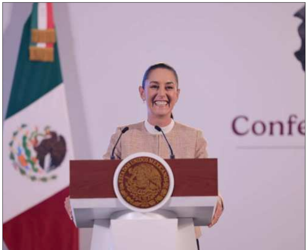
▲ La Presidenta anunció que este fin de semana realizará su primera gira por el sureste de México y visitará los estados de Tabasco, Campeche y Yucatán. En el caso de la tierra del

Mayab , será el próximo domingo 20 de octubre en Puerto Progreso alrededor del mediodía. Los detalles de su recorrido serán revelados más adelante.