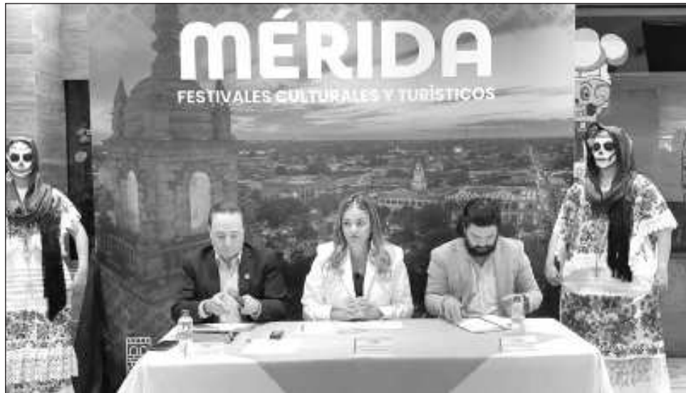
▲ Ante medios nacionales en Ciudad de México, la alcaldesa destacó que eventos como el Festival de las Ánimas, La Noche Blanca, el Mérida Fest y el Marat'hon de la ciudad promueven la identidad cultural y la calidez que distingue a las y los meridianos.

“De cada 100 pesos que se generan en Mérida, 11 son del turismo, por lo que es un factor de construcción de justicia social”.