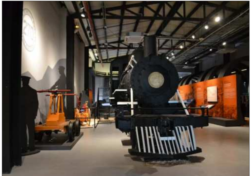
▲ El recinto alberga cinco salas permanentes y una temporal en donde se disfrutarán experiencias sensoriales, como un recorrido a bordo de una locomotora.

Además, los domingos, las personas con residencia yucateca entran gratis.