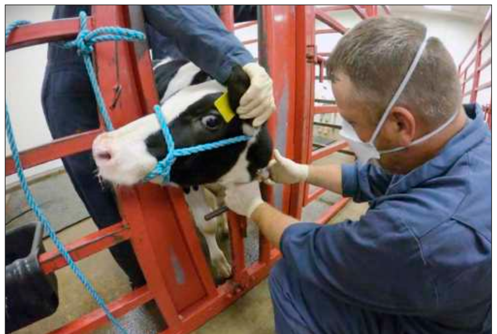
▲ Frente a millones de pájaros infectados y fallecidos a nivel mundial en las últimas dos décadas por H5N1, los casos en humanos siguen siendo raros, según la autoridad.

En general, "la OMS recomienda la vacunación a mujeres embarazadas, niños menores de cinco años, personas de más de 65, con condiciones médicas crónicas y trabajadores sanitarios", recordó Tedros, quien subrayó que muchos países ofrecen al mismo tiempo vacunación contra los virus de la gripe y Covid-19.