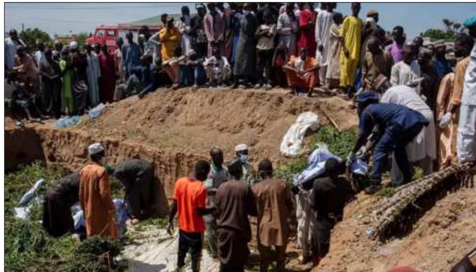
▲ Tras el accidente ocurrido en la localidad de Majia, los residentes se agolparon en torno al vehículo para recoger el combustible derramado, informó el portavoz de la policía, Lawan Shiisu Adam.

Tras el accidente ocurrido en la localidad de Ma-