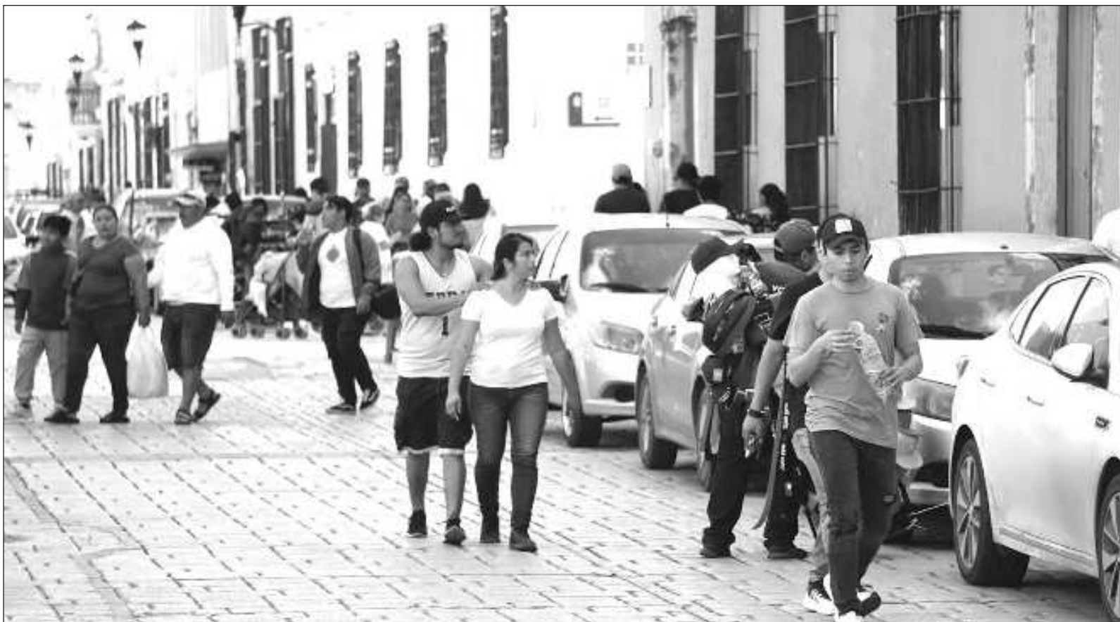
▲ “Se convirtió en un buen negocio, en una gran industria (...) Casi todos tienen un lugar para extraer néctar del juego democrático”.

Si la ideología dominante generó la circunstancia actual, ¿por qué no construir nuevos escenarios con nuevos agentes sociales en nuevos emprendimientos? La intuición de comenzar a pensar distinto puede simplificarse a imposibilidad. Quizá es tiempo de magnificarla como la más grande disputa en términos del concepto sociedad.