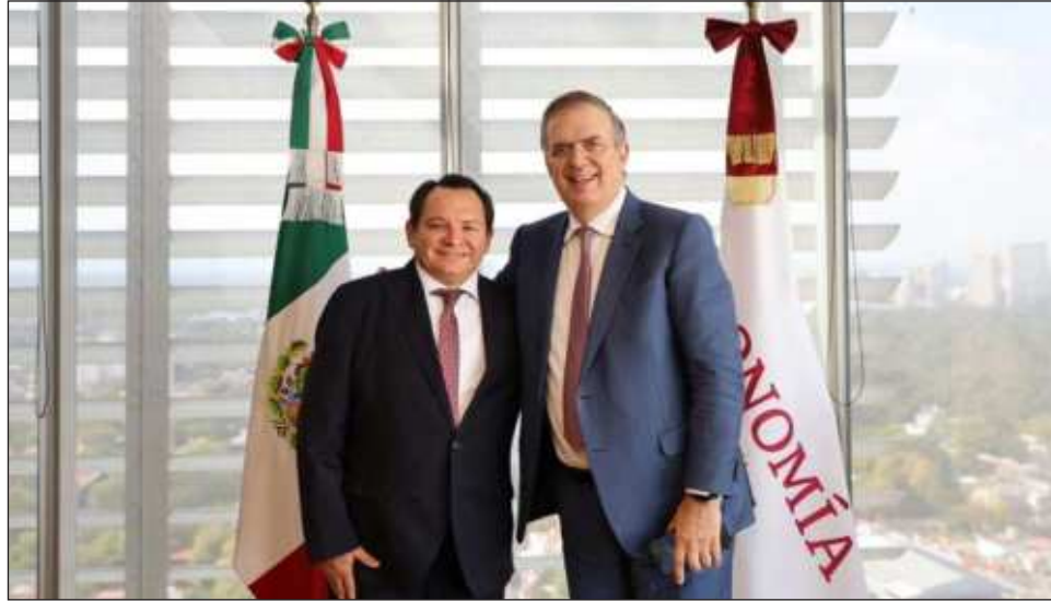
▲ El gobernador Joaquín Díaz Mena se reunió en la CDMX con Marcelo Ebrard y Mario Delgado, secretarios federales de Economía y Educación Pública, respectivamente.

"El Renacimiento Maya es una visión de futuro para Yucatán, que busca transformar nuestro estado a través de la generación de oportunidades, el fortalecimiento