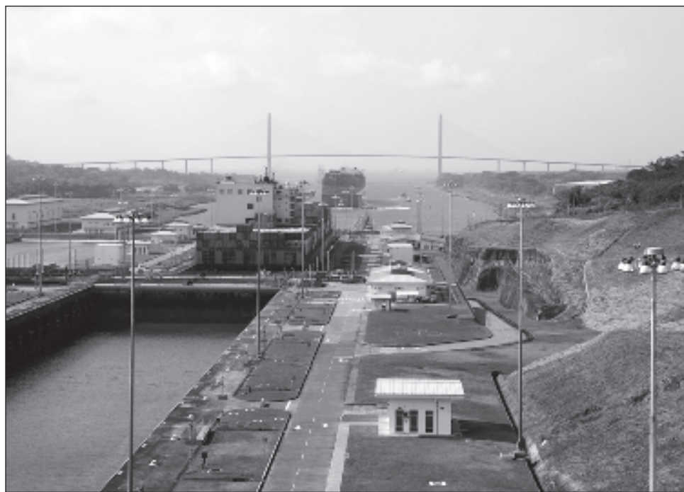
▲ La ruta panameña proyecta un ingreso récord de 5 mil 623 millones de dólares en 2025, cuando esperan el paso de 13 mil 900 barcos con 520 millones de toneladas de carga.

La mayoría de embarcaciones que cruzaron el canal en el último año fueron portacontenedores (2 mil 773), quiniqueros (mil 808), ga-