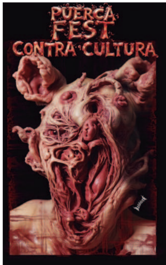
▲ El proyecto contracultura del artista yucateco u666o se llevará a cabo este viernes en la galería Amorcito Puerco; habrá una sesión de poesía y una obra electroacústica.

“Niego toda la corrupción cultural y no quiero ser parte de ello... No soy una persona que puedan censurar, soy contestatario, mientras más me quieran censurar más voy a atacar, no me gusta que censuren mi trabajo y mis ideas”.