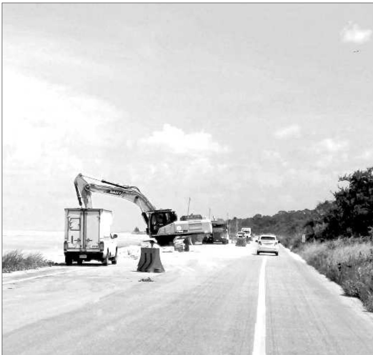
▲ Los trabajos -de carácter extraordinario- para el mantenimiento carretero dieron inicio a la altura de Nuevo Campechito, en la península de Atasta y en el kilómetro 107, en el municipio de Champotón.