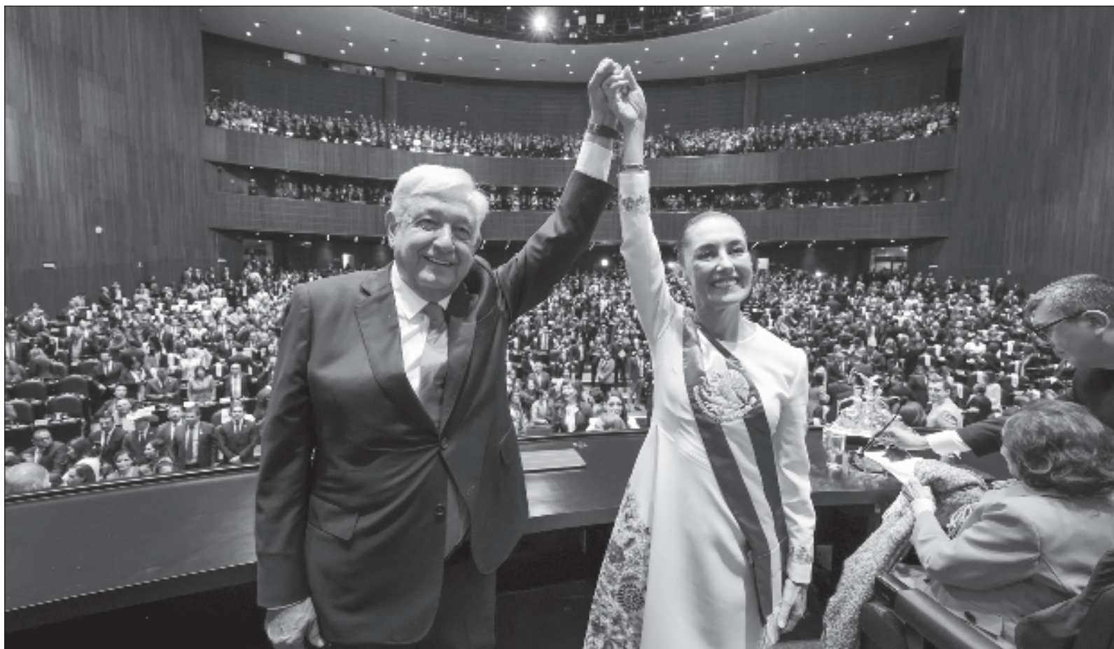
▲ Sin credibilidad y la confianza del pueblo, además del fortalecimiento de la interconectividad y el acceso masivo a la información, el PRIAN ya no pudo retener el poder en 2018 y fueron derrotados ampliamente en las elecciones (...) aun así éste, no cambió”.