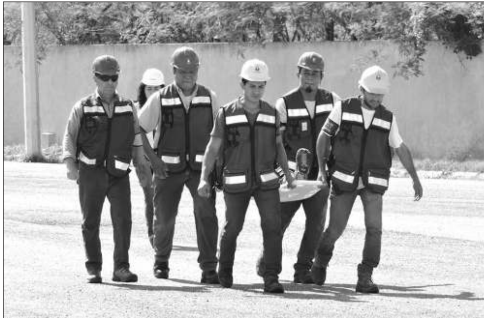
▲ La convocatoria está abierta para que los trabajadores, residentes u ocupantes de todo tipo de inmuebles, tanto del sector público como privado, así como familias y personas en particular.

Tanto Prociyv a nivel estatal como el Gobierno de México, mediante la Secretaría de Seguridad y Protección Ciudadana y la