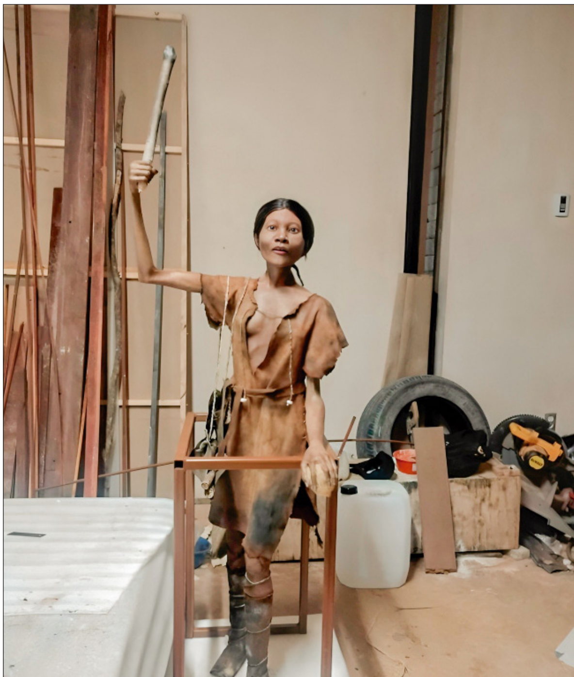
▲ “Hemos dedicado mucho esmero a la confección de cada accesorio que acompaña a Naia. Desde el principio, sabíamos que el nivel de detalle debía ser altísimo, ya que queríamos que todo en ella hablara de su tiempo”. En la fotografía: reconstrucción de Naia.

HEMOS DEDICADO MUCHO esmero a la confección de cada accesorio que acompaña a Naia. Desde el principio, sabíamos que el nivel de detalle debía ser altísimo, ya que queríamos que todo en ella hablara de su tiempo. Para sus zapatos, utilizamos cuerda de henequén, un material que era común en aquella época. Pero no nos bastaba con usarlo tal cual: lo desarmamos