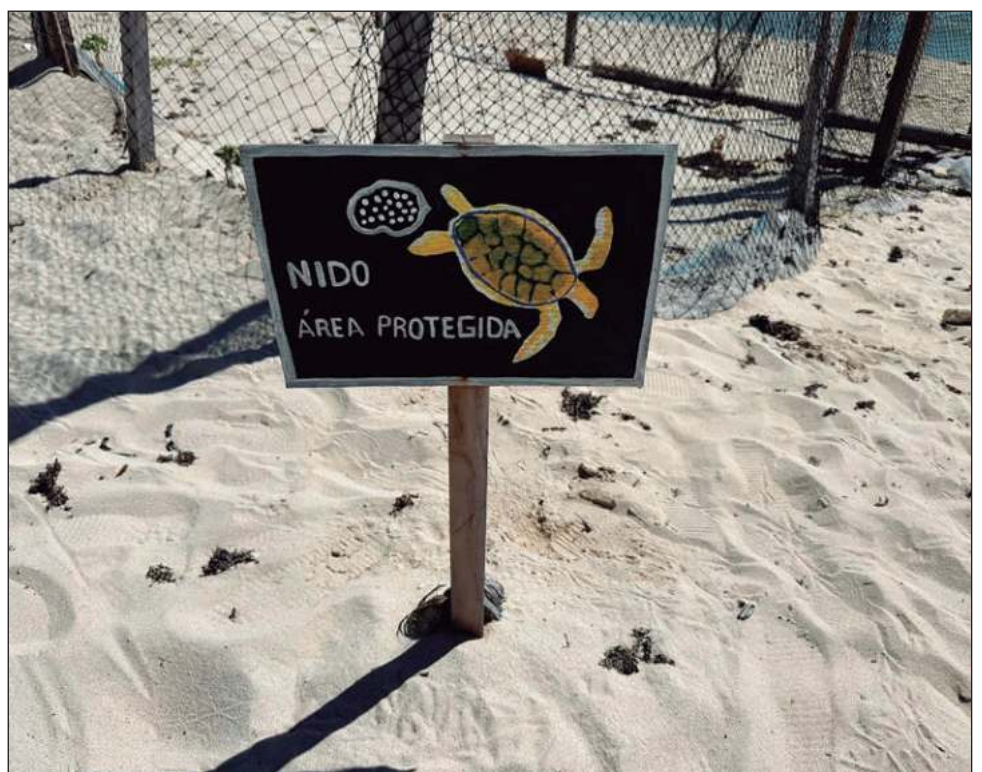
▲ El sector empresarial, principalmente hoteleros y restauranteros, tienen personal calificado sobre las acciones pertinentes en este periodo de anidación.

Indicó que las casas ubicadas a lo largo de las costas han contribuido en gran medida a la preservación.