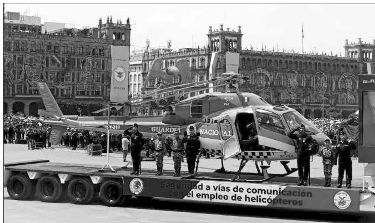
▲ Antes del inicio del desfile, Ojeda y Sandoval tomaron la palabra. Hicieron un balance sobre las acciones de las instituciones a su mando a lo largo de este sexenio, despidieron a López Obrador y dieron la bienvenida a la próxima Presidenta.

"Las y los mexicanos estamos listos para tener como Presidenta a la primer mujer en nuestra historia; en tanto, la Secretaría de Marina y Armada de México celebra el hecho y otorga la demostración de respeto y subordinación a quien será nuestra coman-