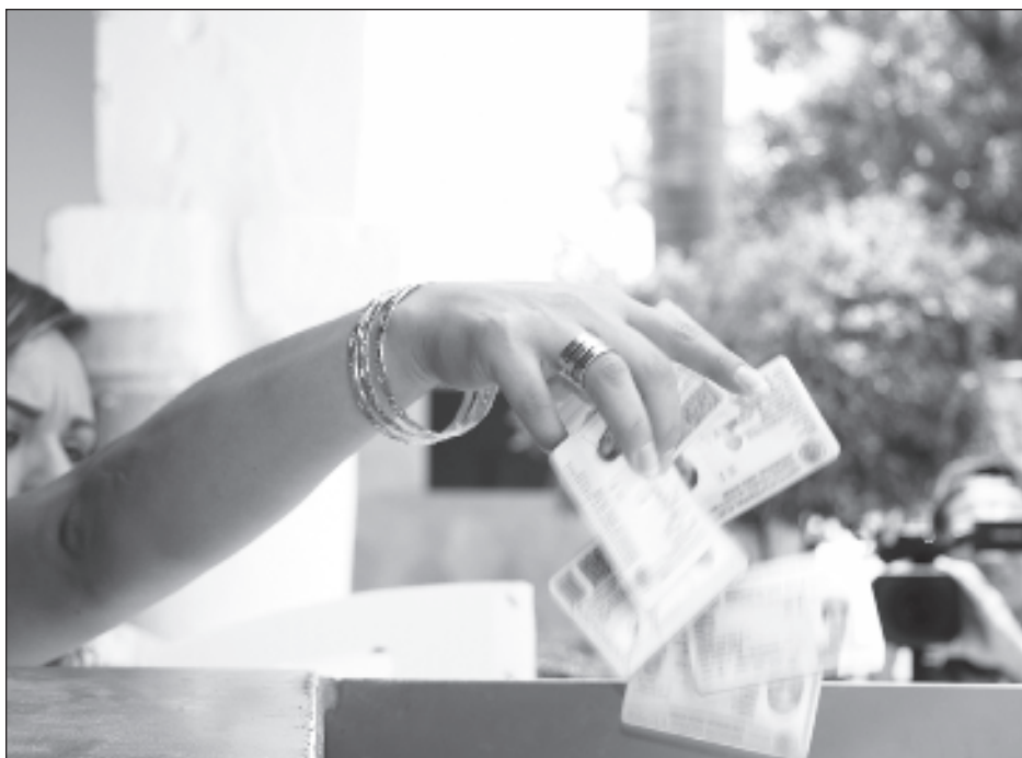
▲ Es importante que los ciudadanos que aún cuenten con una credencial de elector 2023 acudan al módulo más cercano para la renovación de la misma.

El funcionario electoral recordó que para cualquier tipo de trámite es necesario presentar en original tres documentos: acta de nacimiento, comprobante de domicilio y una identificación con fotografía.