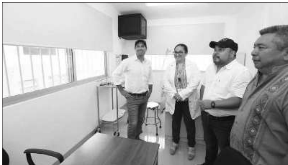
▲ El gobernador Mauricio Vila Dosal sostuvo que "seguiremos mejorando la salud y la calidad de vida de las familias hasta el último día".

"Estaremos haciendo una gira de aquí hasta que terminemos la administración por los 140 Centros de salud, despidiéndonos y agradeciendo a las y los yucatecos por la confianza entregada,