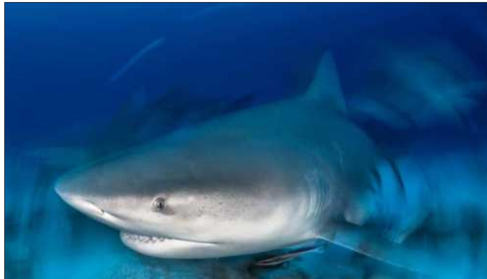
▲ Se contará con la presencia de la comunidad científica en foros públicos gratuitos, presenciales y virtuales y se realizarán campañas y acciones en torno a la vida marina y a los tiburones.

Este mes temático forma parte de la agenda estatal desde 2021, en la que la Secretaría de Ecología y Medio Ambiente (Sema) colabora con la organización en apoyo al posicionamiento del tiburón como especie