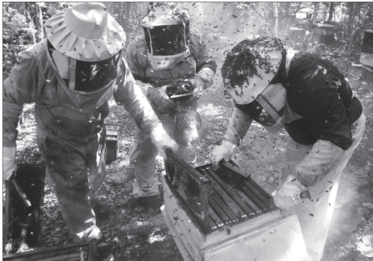
▲ La vinculación de la muerte masiva de las abejas con fumigaciones agrícolas de todo tipo en la región maya de Los Chenes se suma a la larga lista documentada por apicultores en años anteriores y en este 2024.

El comunicado establece que 56 por ciento de los sitios cerca de las colmenas conte-