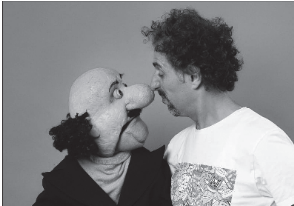
▲ El comediante Ayman Nahas es uno de los artistas árabes en Israel o Jerusalén. Este que asegura enfrentar creciente hostilidad y acoso. Su teatro depende de subsidios otorgados por el gobierno, "al igual que 99% de los espacios culturales" en Israel, por lo que teme la suspensión de fondos.

Su teatro depende de subsidios gubernamentales, "al igual que 99 por ciento de los espacios culturales" en Israel, afirma, pero teme que le corten los fondos, como ocurrió en 2015 con Al Midan, otro teatro en la ciudad árabe-judía de Haifa, luego de