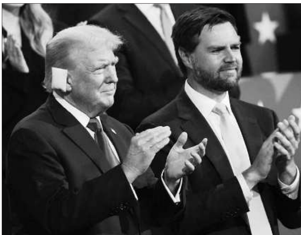
▲ El magnate llegó al encuentro con una oreja vendada y un halo de héroe indisputable.

Con este factor en mente, hay elementos para pensar que, de concretarse una segunda presidencia del millonario republicano, Estados Unidos podría experimentar un temible viraje al oscurantismo conservador, un nuevo ciclo de destrucción de libertades y derechos y un abandono aun mayor de los sectores más desprotegidos de la sociedad.