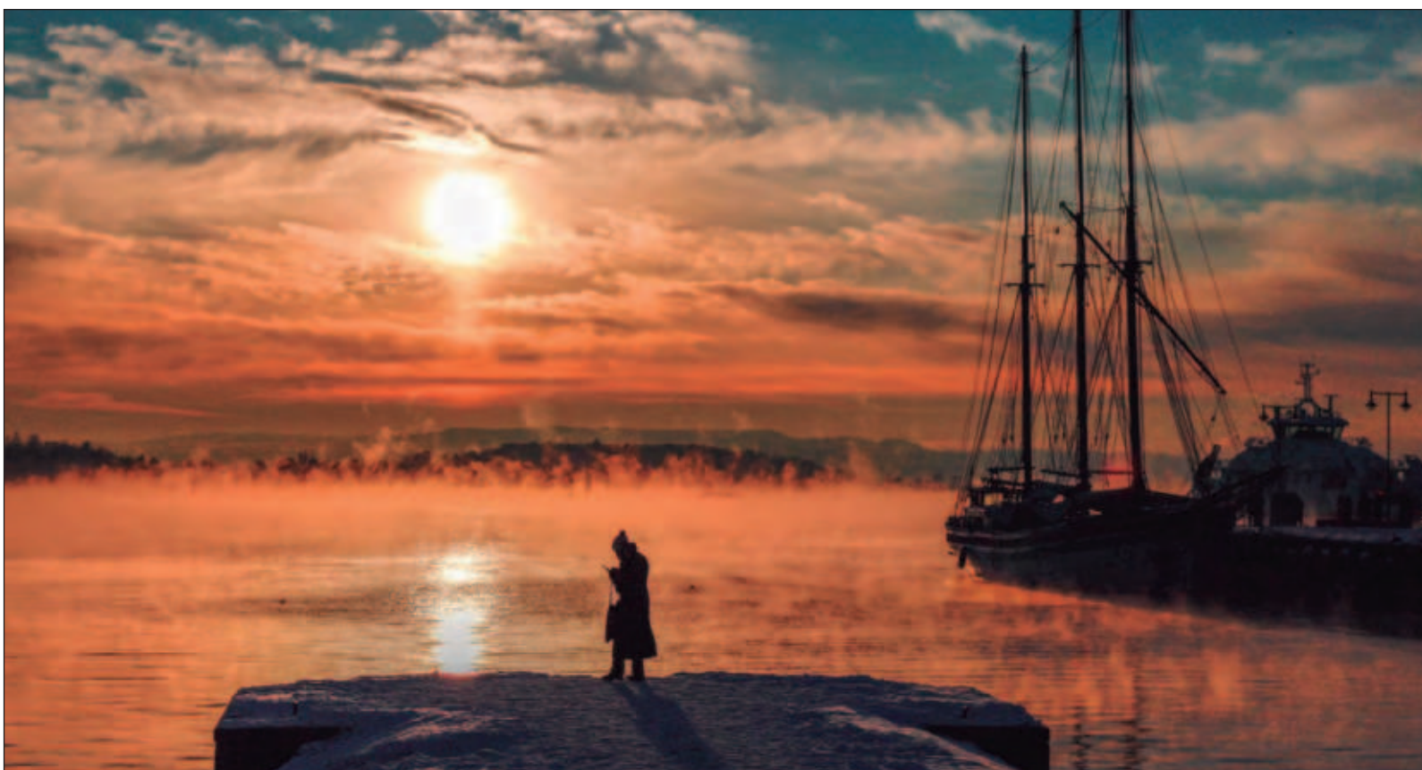
▲ "La lectura de la canción vista obtusamente como una pieza de tema amoroso nos ciega a lo que está detrás y nos impide conmovernos hasta las lágrimas, tal y como ahora me sucede al terminar este texto. No hay salida: estamos condenados a la soledad, a la desesperanza y a la aniquilación".