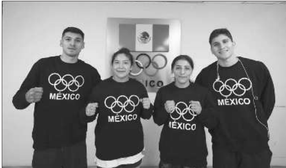
▲ La selección nacional de boxeo que asistirá a los Juegos Olímpicos viajó a Mulhouse, Francia, para un último campamento de preparación antes de viajar a París.

“Y siempre les apoyamos, a toda la delegación, entrenadores, a todos los deportistas; y ahora estábamos preocupados, también para