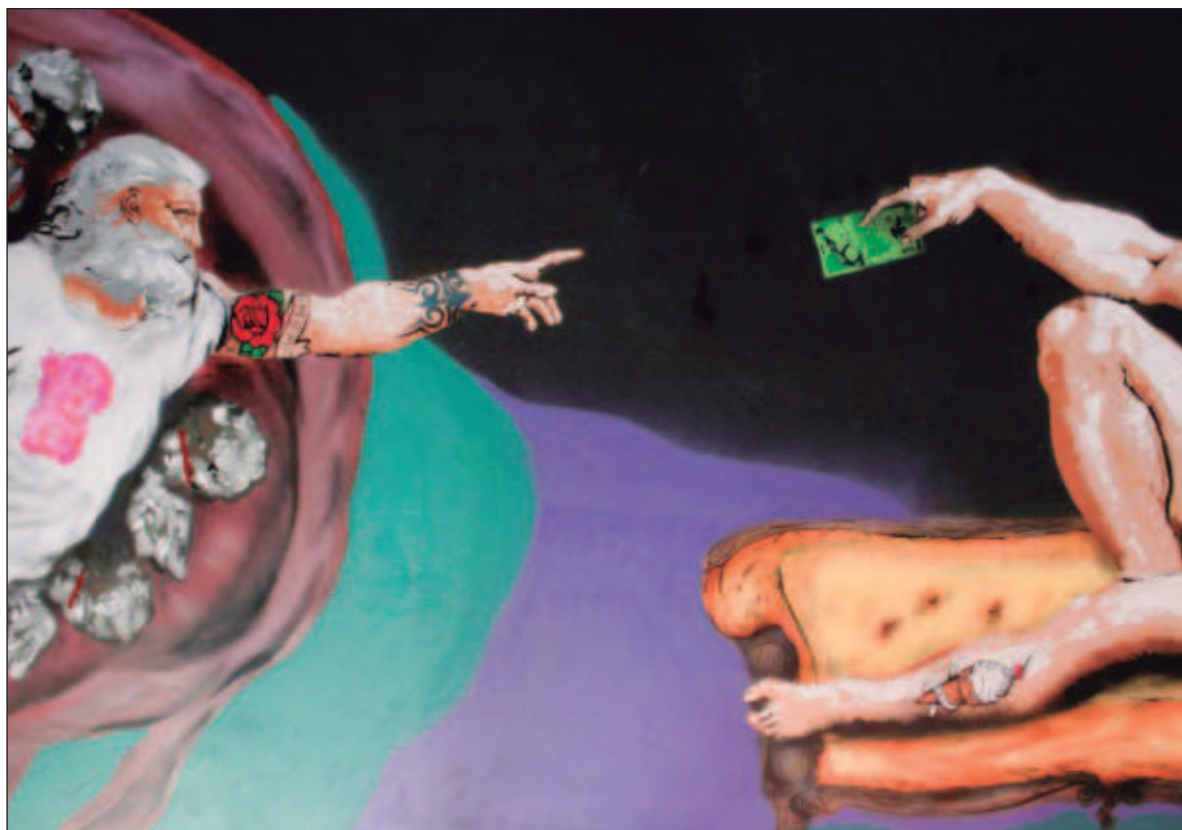
▲ “La creación de la Secretaría de Ciencia, Humanidades, Tecnología e Innovación conlleva múltiples retos. El mayor de ellos: generar políticas de ciencia que permitan transitar de una sociedad kitsch a una verdadera sociedad del conocimiento”.