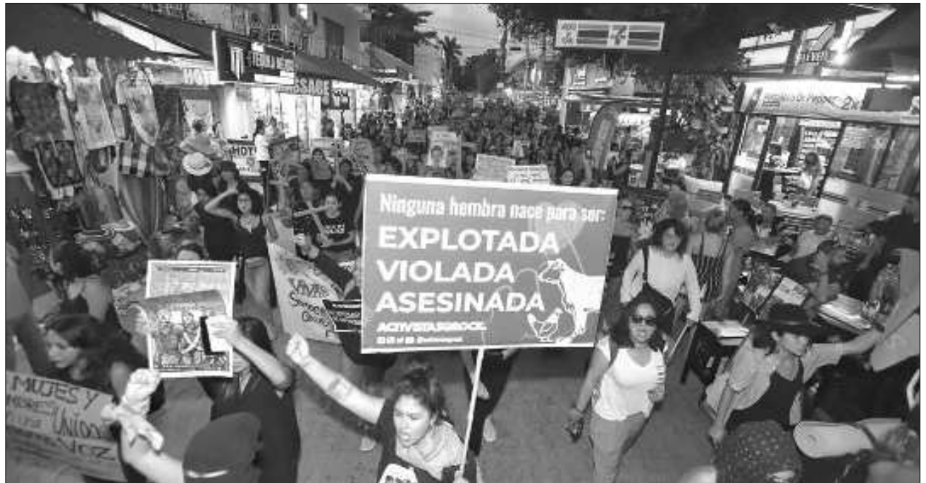
▲ La semana pasada, en Cancún, estudiantes de secundaria acusaron a un maestro de acoso sexual; en Isla Mujeres, elementos de la Guardia Nacional fueron denunciados por violar a una adolescente y una infante fue privada de su libertad.

El 11 de julio un policía municipal fue detenido por exhibicionismo sexual a dos jóvenes en la supermanzana 216. Hubo reacción inme-