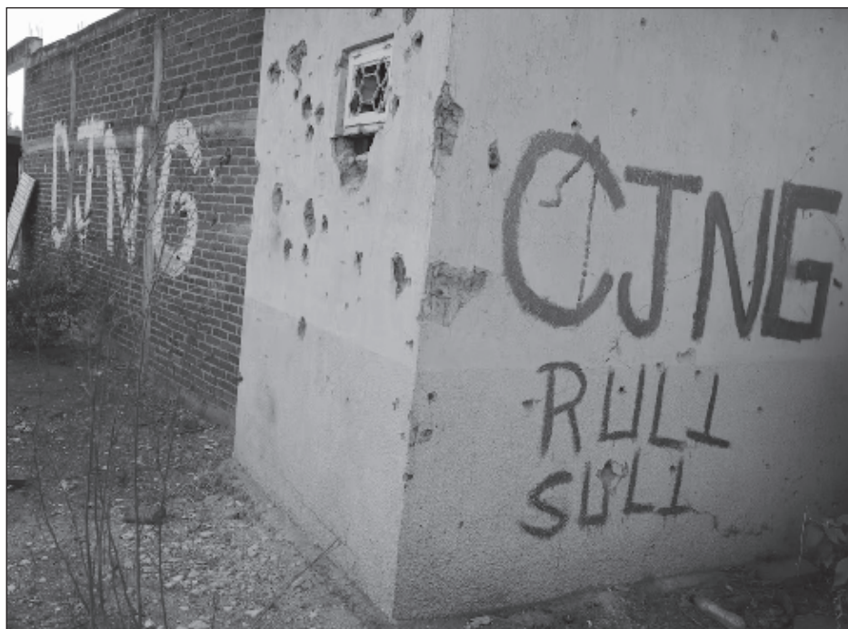
▲ El Departamento del Tesoro señaló que los tres acusados están basados en Puerto Vallarta y ayudan a CJNG en actividades fraudulentas con multipropiedades.

Las sanciones contra los contables y empresas han sido coordinadas con el gobierno mexicano, incluida. Como consecuencia de las sanciones estadounidenses de este martes, todos los bienes y propiedades de los implicados que se encuentren en Estados Unidos quedan bloqueados.