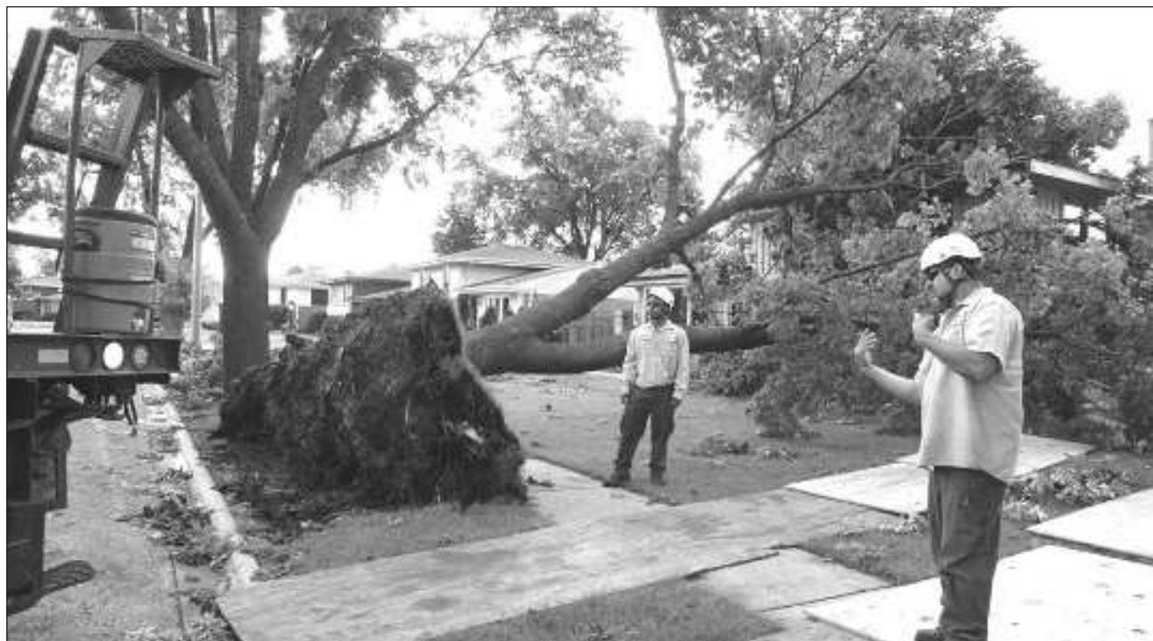
▲ De acuerdo con el Servicio Meteorológico Nacional, las tormentas avanzaron hacia el este, hacia la parte norte de Illinois y el área de Chicago, donde se emitieron alertas de tornado y se produjeron intensas lluvias.

Se produjeron varios informes de tornado, pero la principal preocupación la constituían otros vientos perjudiciales, dijo Roger