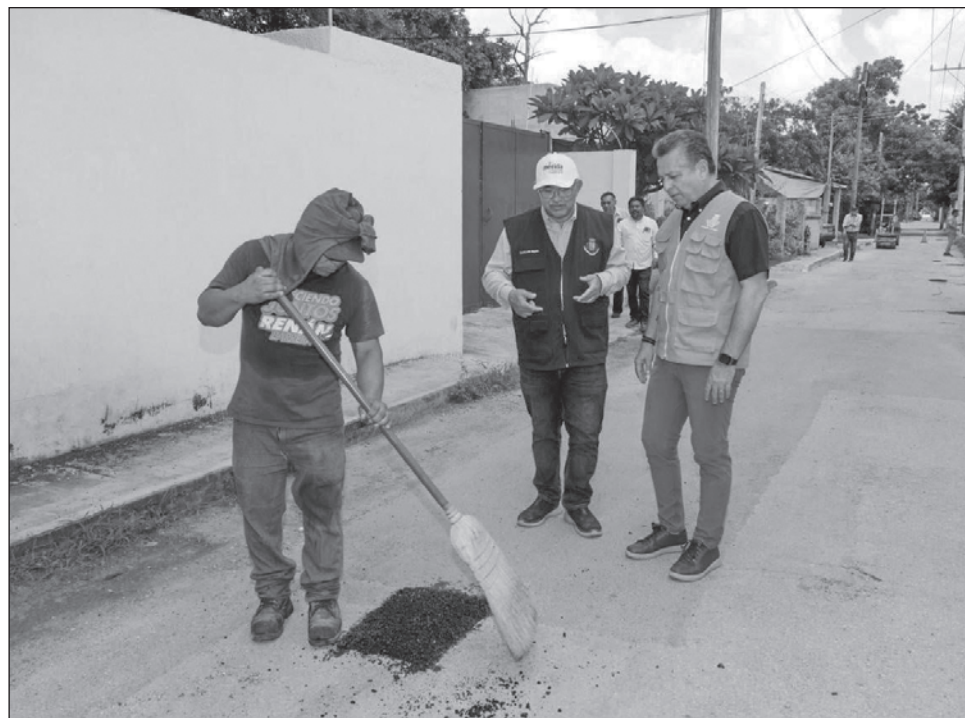
▲ Los cambios en las calles permitirán agilizar la circulación.

Ruz Castro mencionó que la participación ciudadana es indispensable para conservar en buen estado las vialidades y los servicios