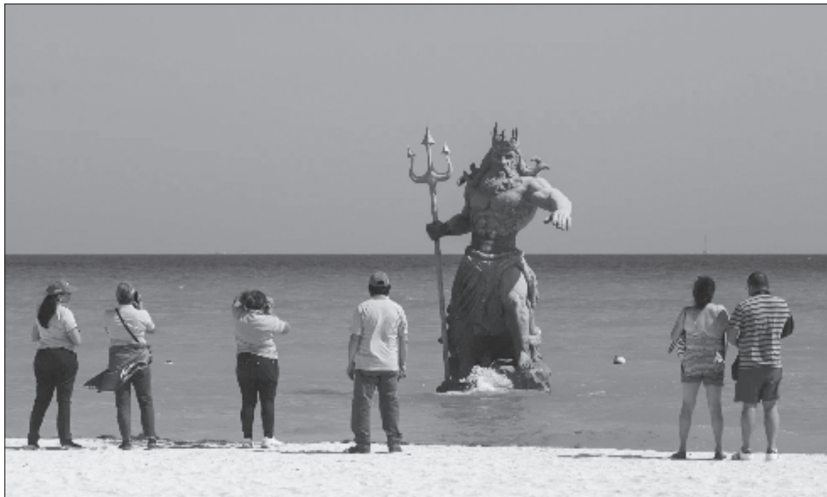
▲ "La proliferación de memes que enfrentan a Poseidón con Chac, y los chistoretas acerca del poder de uno y otro para evitar huracanes, o abatir su impacto, además de desencadenar algunas sesudas reflexiones acerca del respeto a los valores culturales de los pueblos originarios, y la sumisión de las autoridades convencionales al colonialismo eurocéntrico".

Creo que la crítica a la actuación de la autoridad ambiental