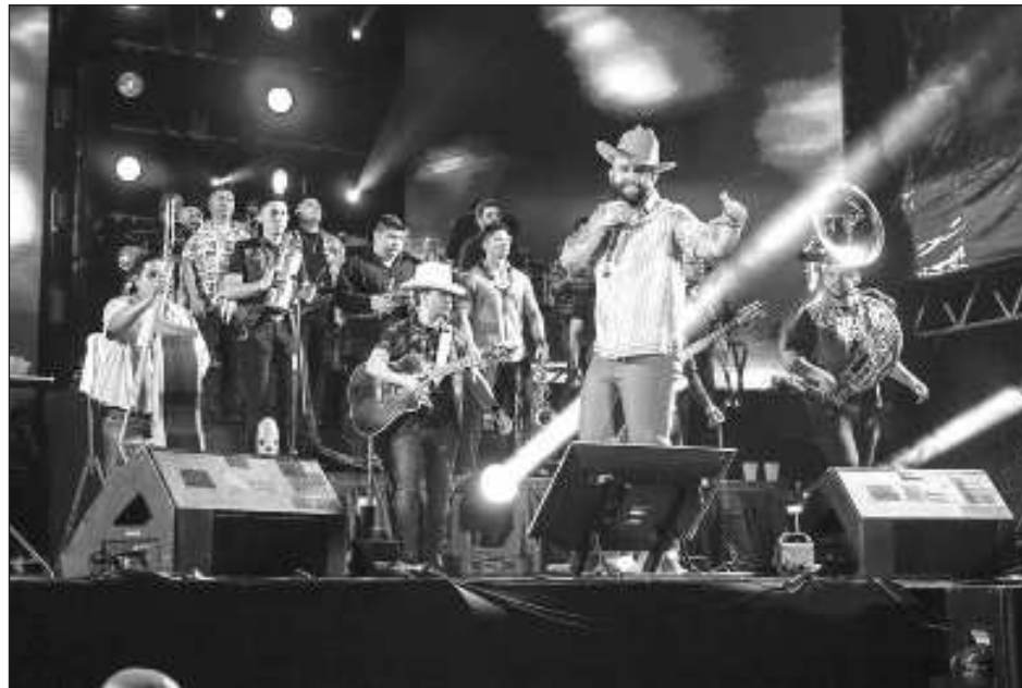
▲ El artista y compositor sonorenses cantó la noche del lunes sus mayores éxitos ante más de 25 mil personas reunidas en la plaza 28 de Julio.