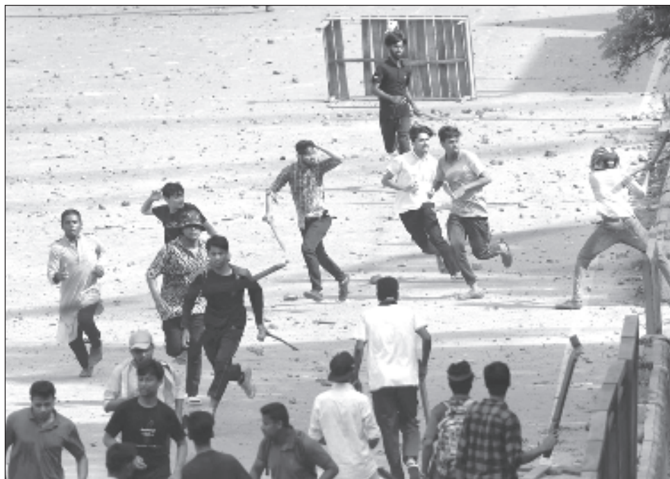
▲ De acuerdo con los reportes de la prensa local, los enfrentamientos dejaron un saldo de tres muertos, dos eran estudiantes y el tercero un transeúnte.

Los manifestantes alegan que esas cuotas son discriminatorias y que la selección debe basarse en méritos. Algunos incluso señalan que el sistema actual beneficia a grupos que apoyan a la primera