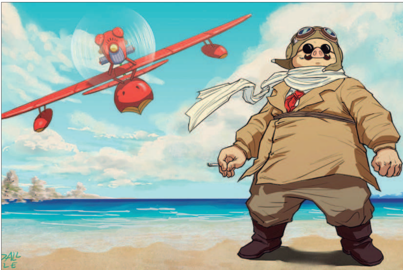
▲ “Nadie sabe quién desempolvó al personaje y cómo su frase ‘Mejor cerdo que fascista’ se convirtió en trinchera y metralla. Sin embargo, su nueva defensa del cielo ha sido igual o más efectiva que la que realizó en la víspera de la pesadilla de la II Guerra Mundial”. Foto Fotograma