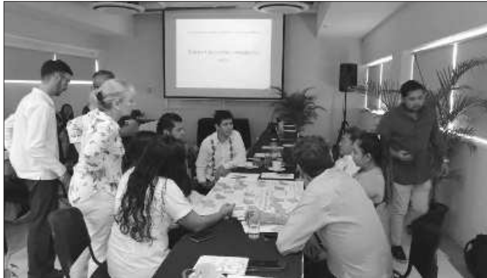
▲ Lo que se pretende con el turismo regenerativo es dar un paso más a lo que, de alguna manera, se conocía como sustentable, que era solamente el cuidado del espacio.

Lo que se pretende es trabajar en sectores muy espe-