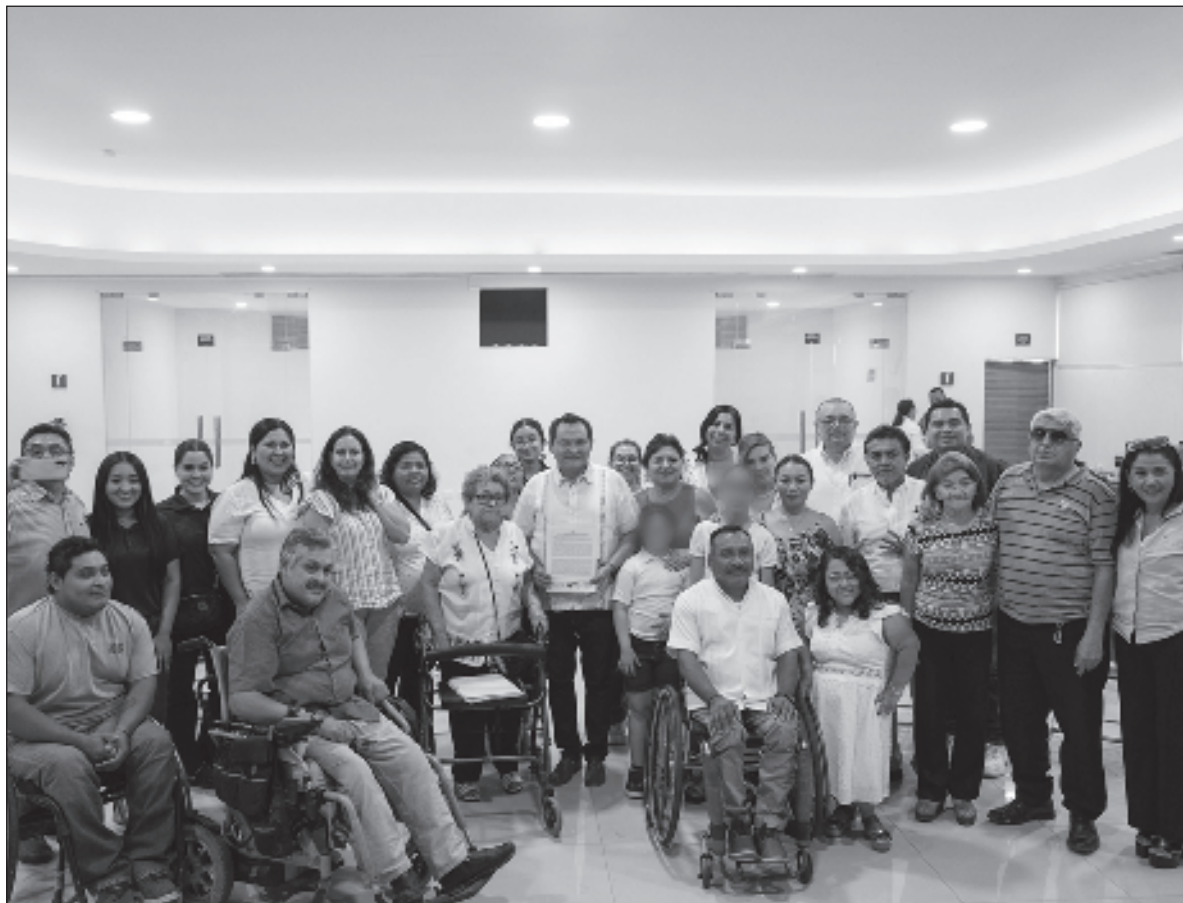
▲ “La reunión se llevó a cabo en la CMIC, con la participación de todos los candidatos convocados, en donde representantes del COCSY realizaron siete solicitudes específicas”.

TAMBIÉN SE TRATÓ el 4. Acceso al deporte al arte y cultura; 5. Acceso a un trabajo digno, sin límites de estereotipos, 6. Los cuidadores de las PCD, visibilizarlos, apoyarlos y dignificarlos y finalmente, 7. El fortalecimiento del Instituto para la Inclusión de Personas con Discapacidad (IPEDEY), el cual es considerado un logro de las asociaciones civiles yucatecas, quienes, en un ejercicio de gobernanza similar, durante las elecciones anteriores, lograron comprometer a los candidatos a su creación, siendo un organismo que trabaja de manera transversal con todas las instituciones públicas y privadas, en pro de la inclusión de las PCD, y que a opinión de la Coalición de Organizaciones de la Sociedad Civil de