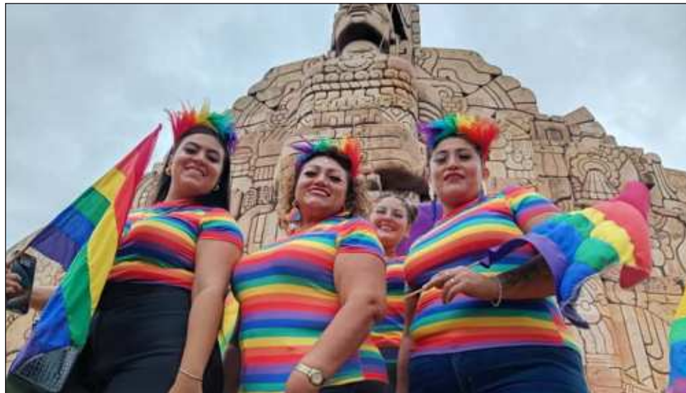
▲ Entre la lluvia y música animada, parejas, familias, amigos, gente joven y personas mayores, convivieron y compartieron el colorido de esta celebración.

En carros alegóricos, comparsas, con pancartas de todo tipo, en pos de la libertad sexual, los manifestantes se dieron lugar para expresar consignas políticas, manifestaciones de