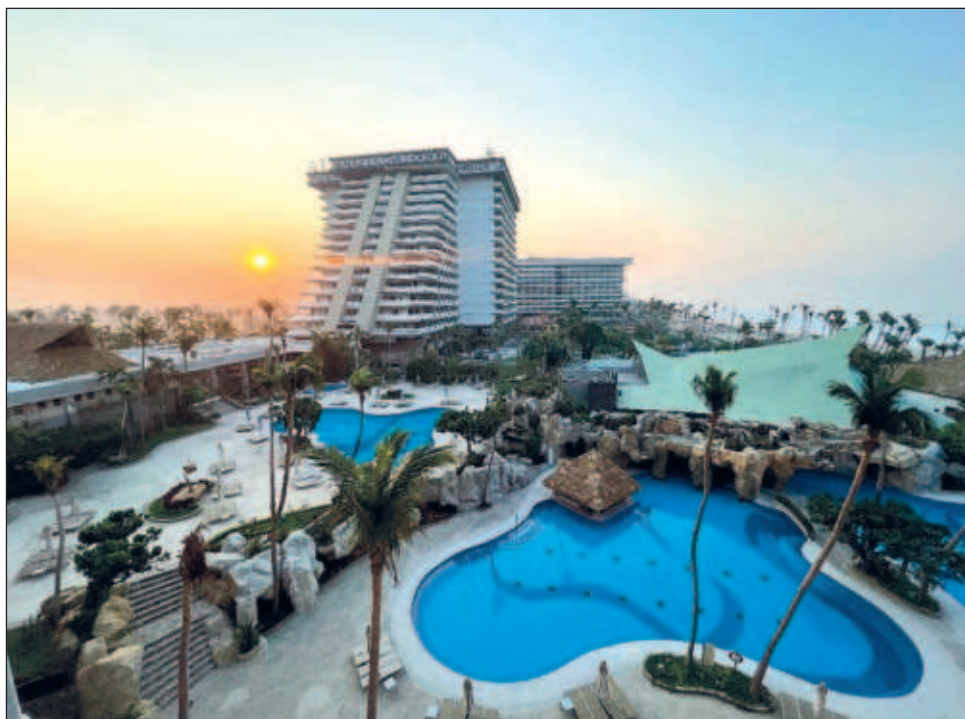
▲ De acuerdo con la Secretaría de Turismo, en las ciudades se registraron 15 millones 500 mil turistas en cuartos de hotel, mientras que los centros de playa recibieron a 11 millones 600 mil.

De acuerdo con la información, informó que, en el primer cuatrimestre del año, los destinos de ciudad registraron una ocupación hotelera de 52.4 por ciento, mientras que los centros de playa alcanzaron un nivel de ocupación de 70.4 por ciento.