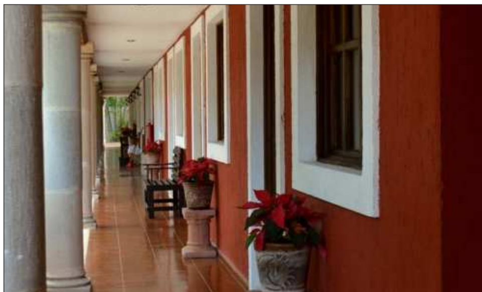
▲ Por años los empresarios hoteleros quisieron instalarse en las zonas donde operarán los Hoteles Tren Maya, cerca de las zonas arqueológicas de Edzná en la capital, y Calakmul, pero ahora la apuesta será el que se venda correctamente lo que se ofrece en las ciudades.

“Claro, teniendo esos hoteles es casi seguro que el turismo decida hospedarse directamente en ellos, quie-