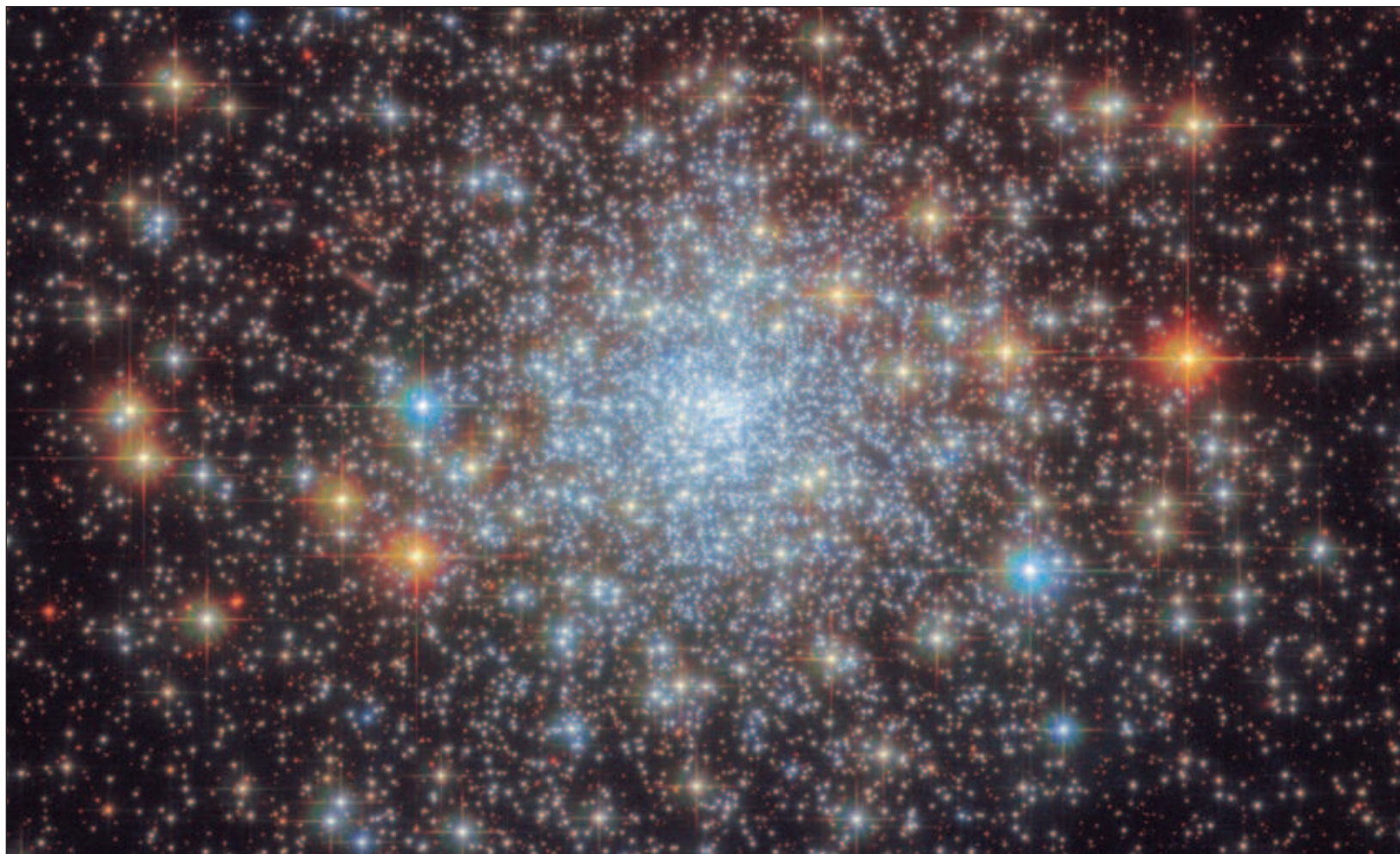
▲ De acuerdo con el estudio publicado en Astronomy & Astrophysics , las estrellas S son sorprendentemente jóvenes y su presencia es desconcertante, ya que según las teorías populares, uno esperaría que sólo hubiera estrellas viejas y tenues en las inmediaciones del agujero negro supermasivo.

"Esto significa que existen constelaciones estelares específicas preferidas. La distribución de ambas variantes estelares se asemeja a un disco, lo que da la impresión de que el agujero negro supermasivo obliga a las estrellas a asumir una órbita organizada", dijo Peisker.