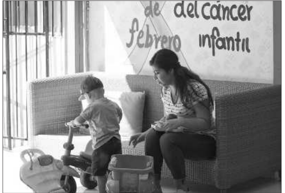
▲ Los signos y síntomas de sospecha de cáncer que se pueden identificar son: fiebre sin causa aparente, mareo, dolor de cabeza, moretones, sangrado de la nariz, dolor de huesos, luz blanca en uno o ambos ojos, crecimiento de abdomen, bolitas en cuello, axila e ingles.

Los tipos de cánceres más frecuentes en este grupo de edad son las leucemias, osteosarcoma, linfomas y tumores del sistema nervioso central. Asimismo, los signos y síntomas de sospecha que