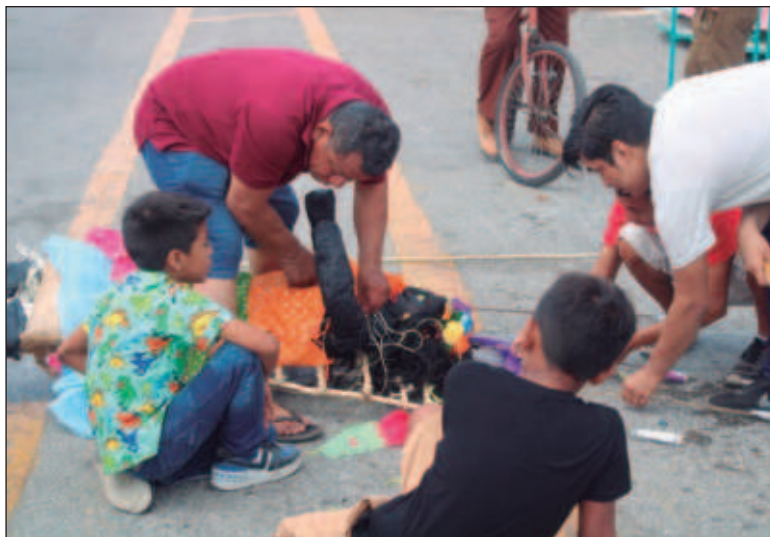
▲ La figura de la Boxita se rellena con petardos y otros explosivos para que pueda ser quemada frente a la iglesia.

Esta muñeca se quema el domingo posterior al jueves de Corpus Christi para alejar los malos aíres y las desgracias del pueblo. Para realizar su quema se lleva a cabo una serie de rituales organizados por la familia Chay, quienes por al menos cuatro generaciones han asumido la responsabilidad de seguir con la tradición. El sábado al medio día la Boxita es paseada por las calles de Hunucmá y acude a visitar a sus madrinas , mujeres que donaron los materiales para la realización de la figura y quienes la velarán todo el día antes de ser presentada en la iglesia del pueblo. Ese mismo sábado a las 8 de la noche los jaraneros o bailarines se reúnen en la casa de la última madrina que recibió a la Boxita para llevarla entre música de charanga, cohetes y baile hasta la iglesia principal. Este "paseo" de la Boxita