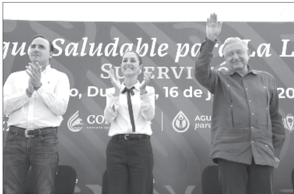
▲ En el segundo acto conjunto con López Obrador, la virtual presidenta electa consideró que este primer recorrido entre ambos es expresión del humanismo del movimiento.

Ante miles de laguneros que recibieron de manera