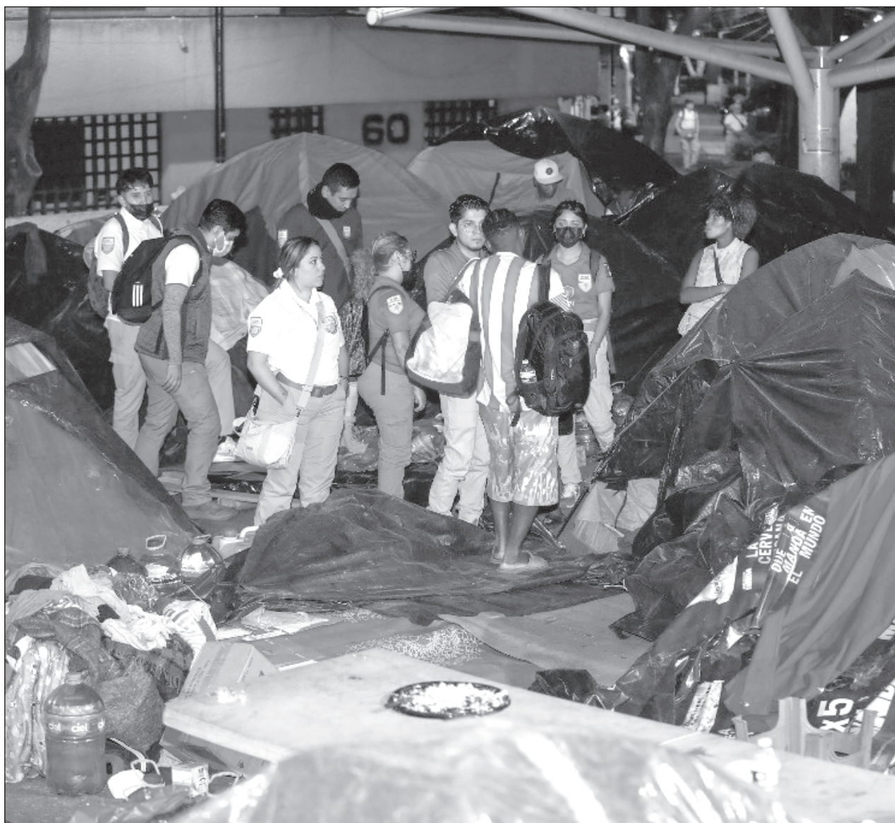
▲ Los datos del Instituto Nacional de Migración señalan que 738 mil 270 de estas personas han sido hombres que viajan solos y 362 mil 979 eran mujeres adultas no acompañadas; 154 mil 291 son núcleos familiares.

Apuntó que como Oficina del Alto Comisionado trabajarán con todas las autoridades, "tanto con las actuales, hasta el 30 de septiembre, como con quienes designe la nueva presidenta. Trabajaremos con todas las autoridades. También con las nuevas autoridades de aquellos estados en las que hubo elecciones y con las que vienen trabajando en periodos anteriores. El compromiso del Alto Comisionado es trabajar con todas las autoridades".