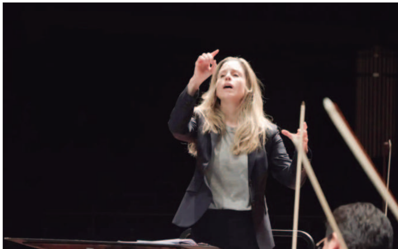
▲ Como directora huésped de la Orquesta Sinfónica Nacional, la estadounidense Tara Simoncic triunfó en su debut el viernes pasado en el Palacio de Bellas Artes, con el programa conformado por El príncipe Igor , de Alexander Borodin, la suite del ballet Billy the Kid , de Aaron Copland, y la Séptima Sinfonía de Antonín Dvorák, esta última la que mayor impacto y reconocimiento causó en la audiencia.

Para este concierto, se acordó que la mitad del programa fuera dancístico y la otra sinfónico, comentó Tara Simoncic a La Jornada en el camerino del Palacio de Bellas Artes, minutos antes de esta primera actuación en México, la cual se repitió ayer.