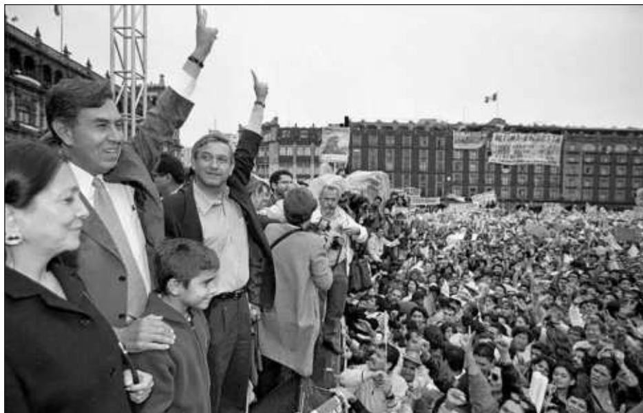
▲ Candidato por tercera vez en 2000, Cuauhtémoc Cárdenas acepta que falló en el debate y errores en su estrategia de campaña. La derrota nacional se compensa con la victoria en el Distrito Federal, donde López Obrador se convierte en jefe de Gobierno.

En 2018, el PRD aportó un millón 600 mil sufragios al panista Ricardo Anaya, y apenas conservó el registro. Seis años después apenas alcanzó 1.8