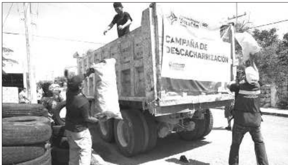
▲ La campaña comprende 263 colonias, 230 mil 720 viviendas, 44 comisarías y colonias aledañas a la periferia de la capital, con una cobertura de 11 mil 536 ha.

El titular de la Secretaría de Salud de Yucatán (SSY), Mauricio Sauri Vivas, hizo un llamado a la ciudadanía, para que eliminen los cacharros tales como: botellas, latas, llantas, cubetas, envases y diversos recipientes que son utilizados por los mos-