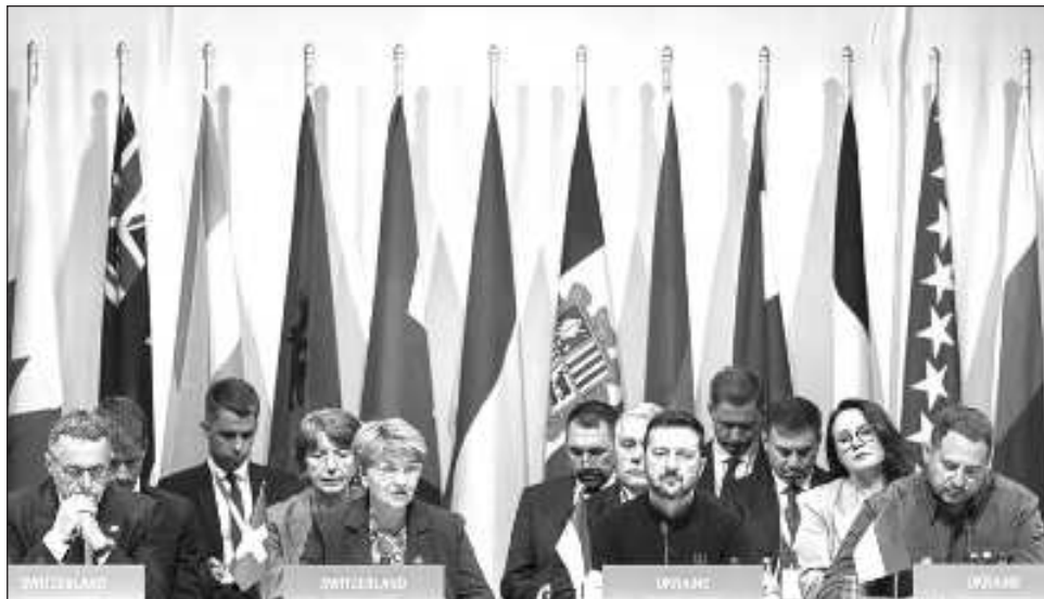
▲ El acuerdo firmado por 78 naciones concluyó dos días de sesiones en Burgenstock, Suiza, un evento que fue marcado por la ausencia de Rusia, país que no fue invitado.

Diversos expertos estaban atentos para ver cuáles países se sumaban al comunicado final.