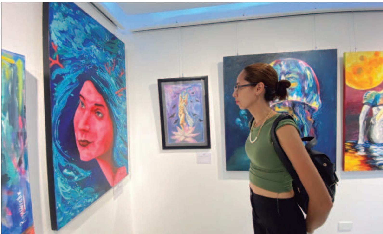
▲ “La transformación social implica necesariamente la transformación cultural y artística, sin que importe cuál afecta a la otra y de dónde viene una y a dónde va la otra”.