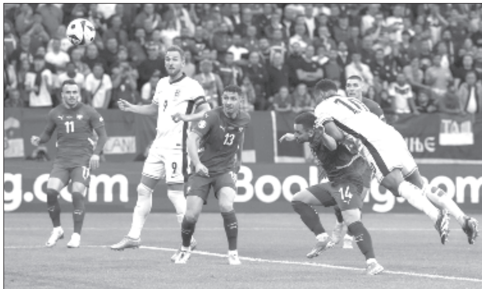
▲ Jude Bellingham anota el gol con el que Inglaterra se impuso a Serbia en Gelsenkirchen.

Con el número 10 en la camiseta que alguna vez lució Wayne Rooney, el versátil mediocampista se elevó para cabecear un centro de Bukayo Saka. Se plantó frente a la tribuna para hacer la pose firme con los brazos abiertos de par en par, una celebración que los hinchas del Madrid adoran