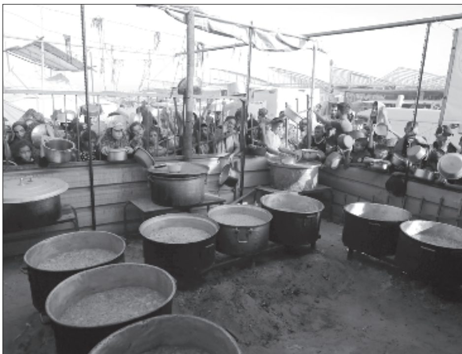
▲ La "pausa" anunciada, que afecta a una zona de unos 12 kilómetros de carretera en la zona de Rafah, dista mucho del alto el fuego que reclama la comunidad internacional.

Entre sus demandas se encuentra, también, la de un servicio militar igualitario, después de que legisladores israelíes accedieran a tramitar un proyecto de ley para apuntalar la tradicional exención militar de estudiantes judíos ultraortodoxos.