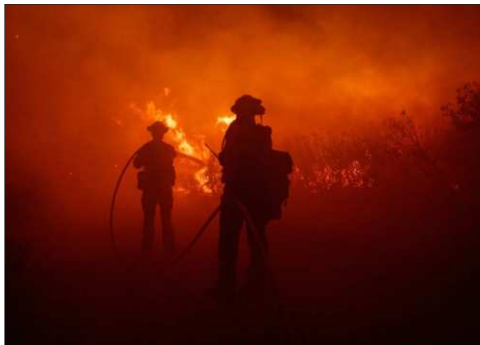
▲ El incendio, denominado Point Fire, estaba contenido apenas en un 2 por ciento. No se reportaron heridos. La causa aún estaba bajo investigación según las autoridades.