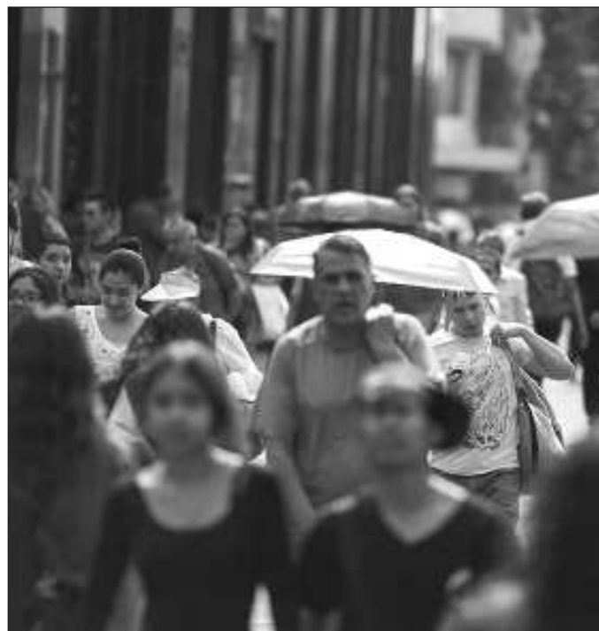
▲ El punto central de la encuesta, entonces, es medir el grado de conocimiento general acerca de uno de los tres Poderes de la Unión.

Entonces, el ejercicio no merece ser calificado de “simula-