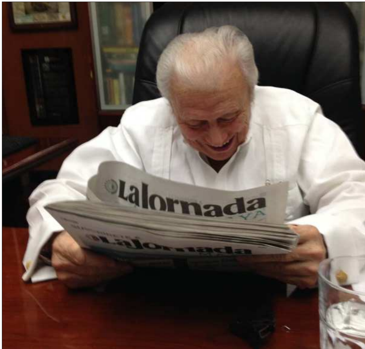
▲ Su muerte es el preludio de la extinción de una especie. El fin de una forma de hacer periodismo impreso diario. “Hay que ser jodedor”, me dijo el día que le llevé el primer ejemplar de La Jornada Maya .

Periodista, comunista, socialista, marxista, leninista, guerrillero, cacique, líder e iniciado, demandó al Estado mexicano por haberle destruido su imprenta y se enfrentó al gobierno que lo encarceló por editar Por qué? , la revista que se convirtió en el icono de una verdad. Luego se exilió en Cuba en los años 70.