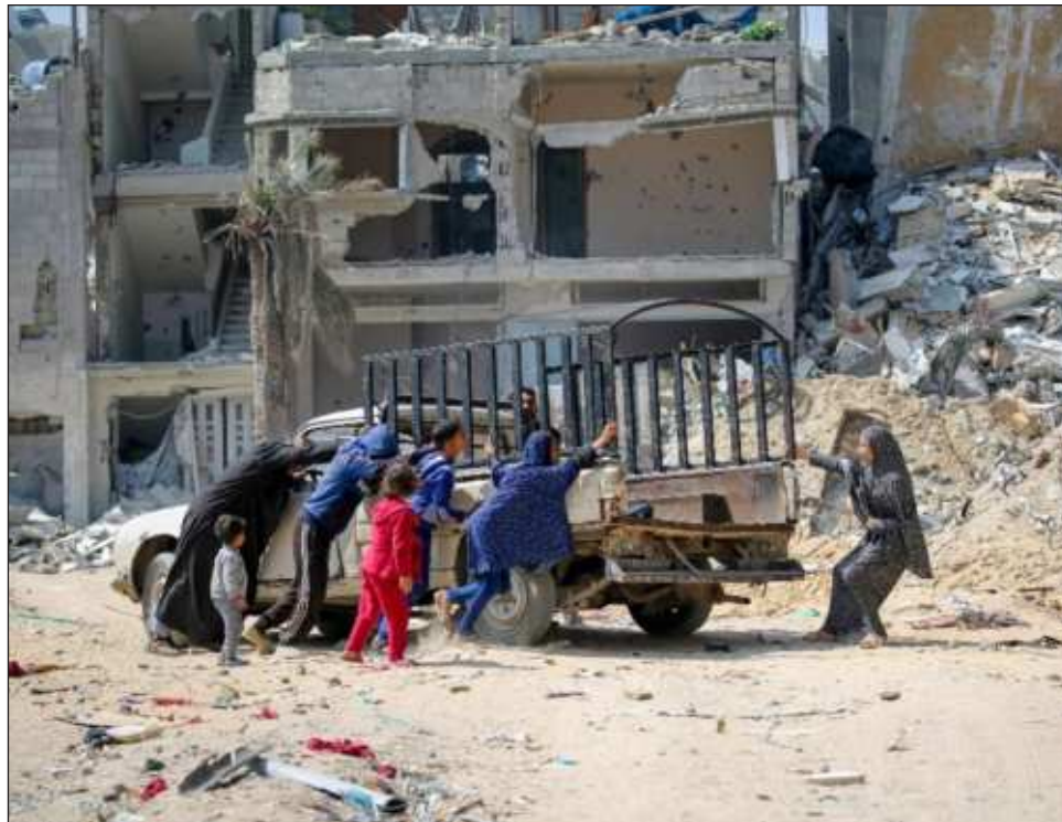
▲ Con al menos 70 niños heridos cada día, la Unicef urgió a “que aumente el número de evacuaciones médicas para que puedan recibir la atención médica que necesitan”.

“Sus cuerpos hechos añicos y sus vidas fracturadas son una prueba de la brutalidad que les fue impuesta”, recalcó Ingram, que hizo hin-