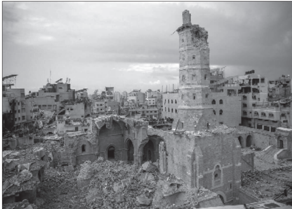
▲ Tanto en Israel como en los Territorios Palestinos, los descubrimientos arqueológicos se utilizan a menudo para justificar las reivindicaciones de los dos pueblos enfrentados.

En Gaza, dirige una red de 40 arqueólogos formados para excavar el suelo, reconstruir el pasado en tercera dimensión y preservar el pa-