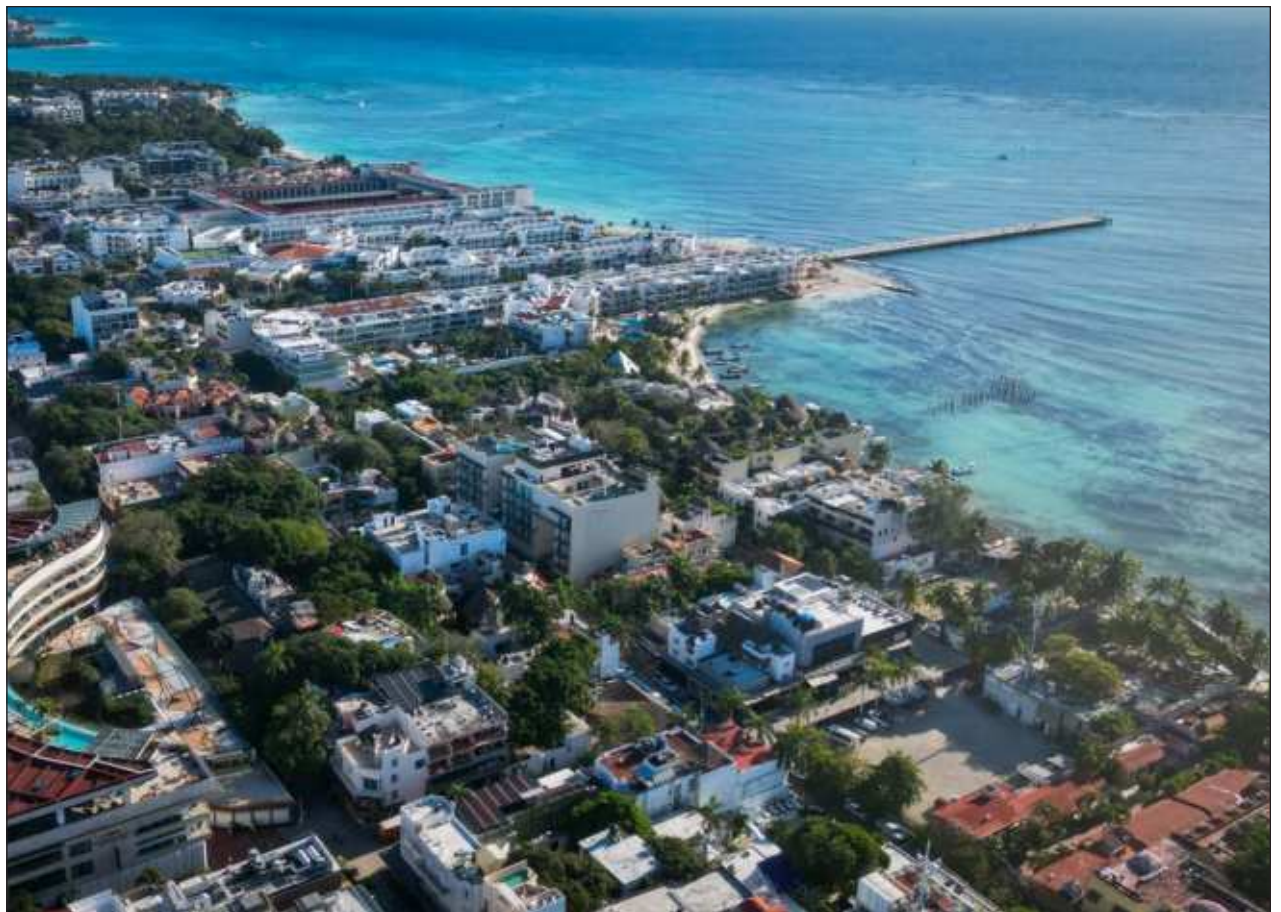
▲ Hay cerca de 400 proyectos en venta entre Tulum, Playa del Carmen y Cancún, que tienen la modalidad de renta vacacional, situación que en Campeche no ha despegado y en Mérida sí, pero en menor medida.

Mientras que en Mérida y Campeche al no haber tanto turismo es más difícil que los arrendadores opten por cambiar de giro, puesto que prefieren tener arrendadores que mes con mes sigan pagando su mensualidad.