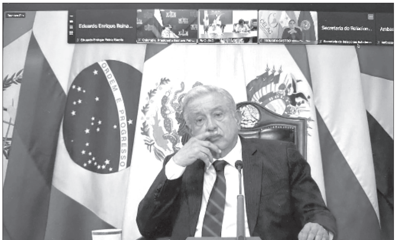
▲ En cumbre virtual extraordinaria, el presidente Andrés Manuel López Obrador recordó que México busca que Ecuador sea suspendido de las Naciones Unidas y lo declare responsable de violaciones al derecho internacional.

Ralph Gonsalves, primer ministro de San Vicente y las Granadinas, dijo que su gobierno “deplora de manera inequívoca las acciones del gobierno ecuatoriano” y agregó que su nación apoya todas las medidas pacíficas adoptadas por México para hacer valer sus derechos.