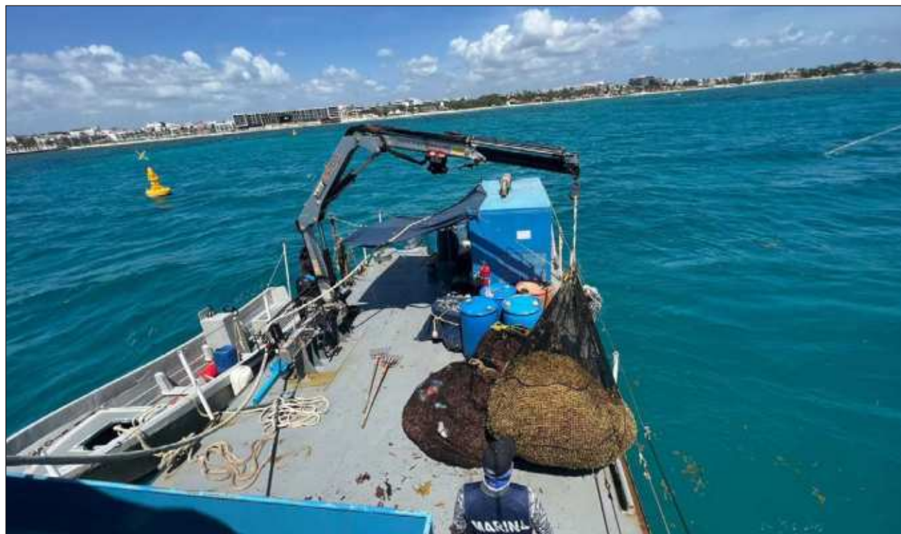
▲ Para realizar las labores de contención y recolecta se utilizan cuatro barredoras y tractores, 22 embarcaciones menores, 11 buques sargaceros costeros y un buque sargacero oceánico; los marinos colocarán ocho mil 650 metros de barrera.

Cabe destacar que el semáforo de la Red de Monito-