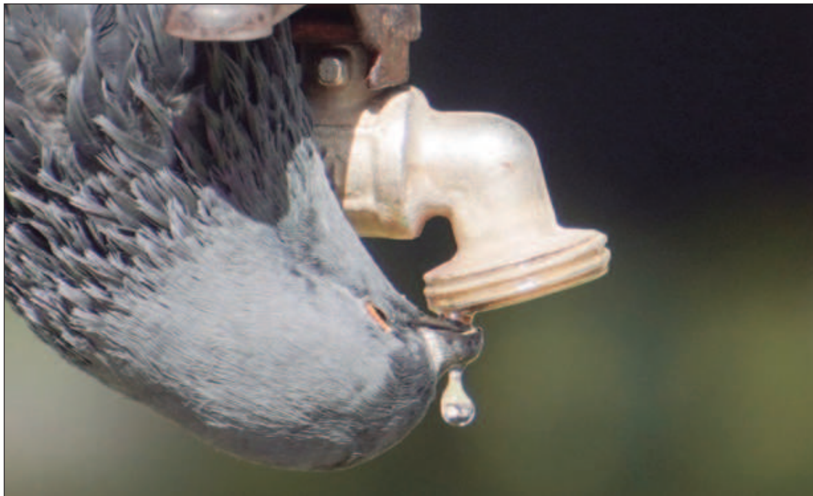
▲ "En la medida en que la atención a la emergencia climática sea el parámetro que norme el diseño de la política nacional, generará cambios relevantes que determinarán la seguridad alimentaria, el acceso a la salud".

Pero definir una política climática eficaz, capaz de determinar un cambio significativo en el curso que sigue el funcionamiento de la nación, de modo que resulte más acorde a las exigencias que impone el medio ambiente, contribuya a mitigar las causas que aceleran en cambio climático global, y nos permita adaptar nuestras formas de