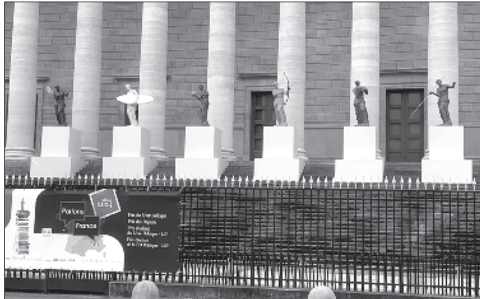
▲ La Asamblea Nacional francesa expone esculturas de la Venus de Milo practicando deportes olímpicos. La justa será inaugurada en París el 26 de julio.

La seguridad y la transportación son los asuntos que más preocupan al acercarse