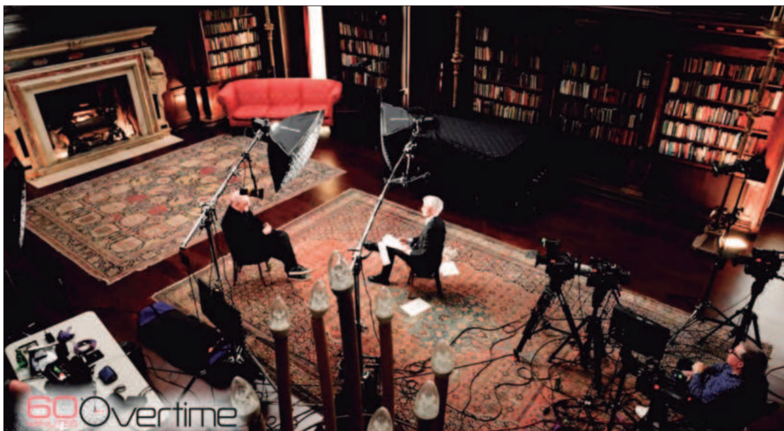
▲ “La publicación de estas traumáticas memorias son, en sí, una proeza (...) una de las secuelas del atentado era la imposibilidad de escribir”.