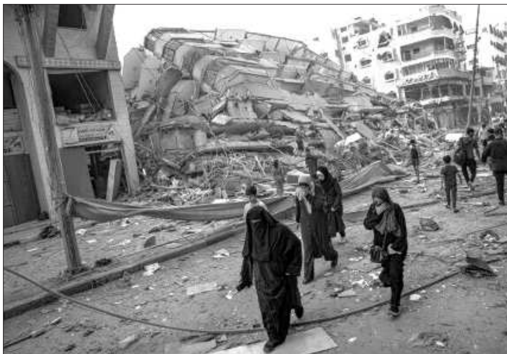
▲ Se encuentra en marcha un plan de exterminio consistente en aniquilar al mayor número posible de palestinos y obligar al resto a huir a fin de completar la ocupación colonial iniciada hace más de 70 años.

Y está claro que ambas tareas serán irrealizables mientras Washington, sus aliados y sus satélites sigan brindando su apoyo incondicional a Tel Aviv.