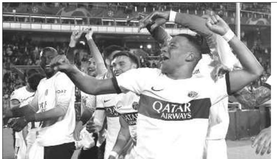
▲ Kylian Mbappé y el PSG golearon al Barcelona y lo eliminaron de la Liga de Campeones.

El ex delantero del Barcelona, Ousmane Dembélé, y Vitinha también anotaron