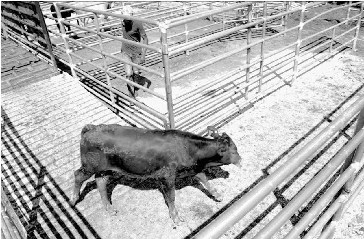
▲ De 10 casos registrados durante 2019, la unión ganadera contabilizó 18 en el año pasado.