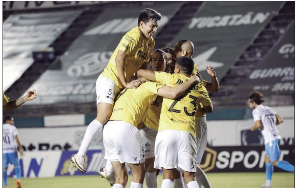
▲ Los astados sólo tienen una derrota. El único equipo sin revés en lo que va del torneo en la Liga de Expansión son los Cimarrones.

Después de un inicio arrollador de los yucatecos, el partido cayó en un bache que para los 30 minutos en el reloj tenía el juego entrapado en media cancha. El primer tiempo acabó con empate a cero en el marcador y el arranque del segundo ocurrió con los mis-