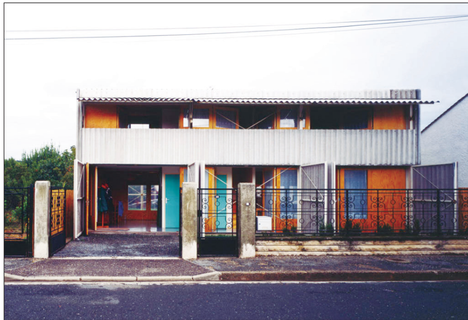
▲ Anne Lacaton y Jean-Philippe Vassal saltaron a la fama tras la construcción de la Maison Latapie , en Floirac: una vivienda espaciosa y muy barata.

Vassal y Lacaton, “logran esto a través de un poderoso sentido del espacio y materiales que crean una arquitectura tan fuerte en sus formas como en sus con-