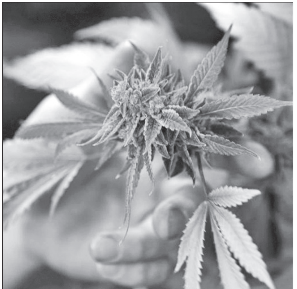
▲ El diputado federal Sergio Mayer invitó a los mexicanos a participar en el evento internacional para "eliminar paradigmas" sobre la planta.

"Informémonos, eliminemos paradigmas porque México necesita alternativas de desarrollo social y económico", dijo Sergio Mayer.