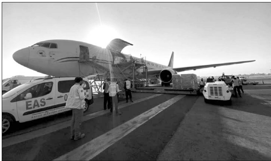
▲ El de ayer fue el décimo primer embarque de vacunas que Pfizer envía al país.

Durante la ceremonia de recepción en el aeropuerto capitalino, y en breve enlace con el presidente Andrés Manuel López Obrador, Svarch recordó a la población que la inoculación en el país es gratuita y aseguró que todas las vacunas que ha recibido el gobierno federal "son de calidad, seguras y eficaces. Hay que comunicar a la población que esté atenta. La vacuna no se vende y es gratuita".