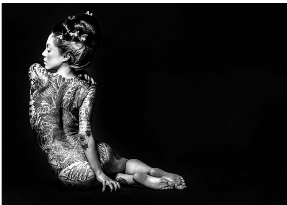
▲ La galería muestra expresiones artísticas que han sido restringidas en línea.

En el caso de Griselda Triana, después del asesinato de su esposo, Javier Valdez, en Sinaloa, en 2017, lo más doloroso fue ver la soledad de sus libros. En Casa Refugio se abrió un memorial con parte de sus ejemplares personales, fotografías, su gorra de los Pumas, sus poemas escritos en los cafés, plumas de La Jornada (donde fue corresponsal), ejemplares del semanario Ríodoce que fundó, los libros que publicó y su botella de whisky sin terminar.