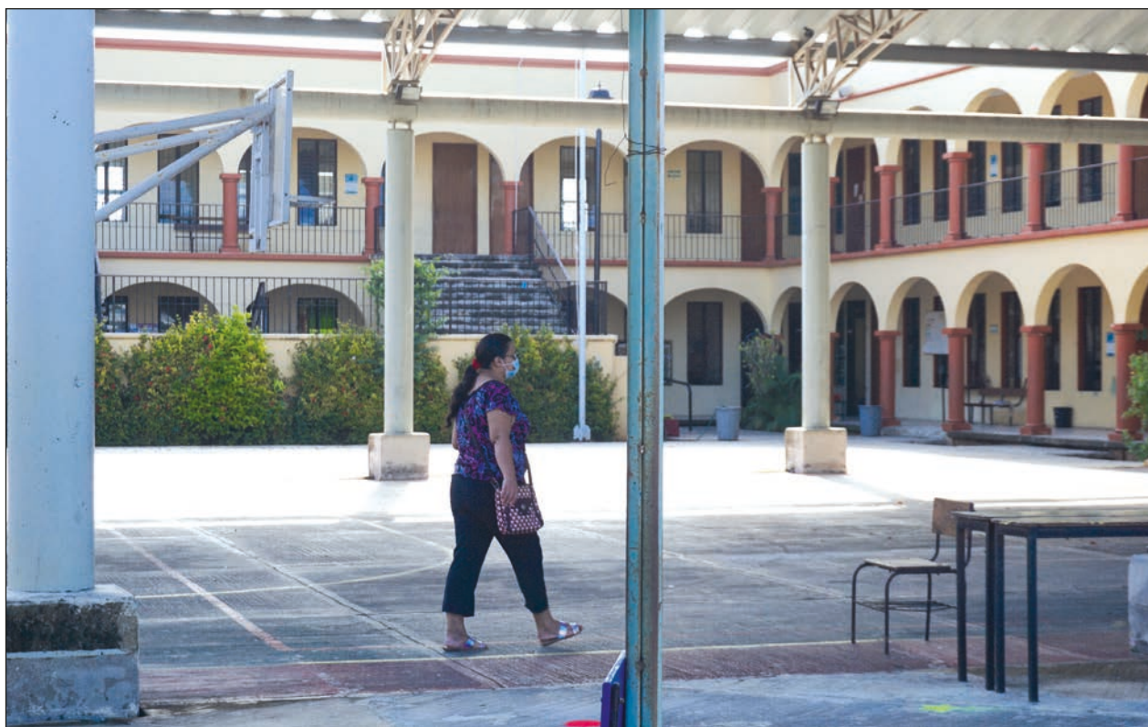
▲ El 14 de marzo de 2020, la SEP acordó iniciar la suspensión de clases.

La sexta considera maximizar el uso de los espacios abiertos; en la séptima, la suspensión de cualquier tipo de ceremonias que generen congregaciones en la escuela; como octava, se establece la detección temprana, donde con un solo enfermo en la escuela, ésta se cerrará por 15 días; y la novena, apoyo socioemocional para docentes y estudiantes.