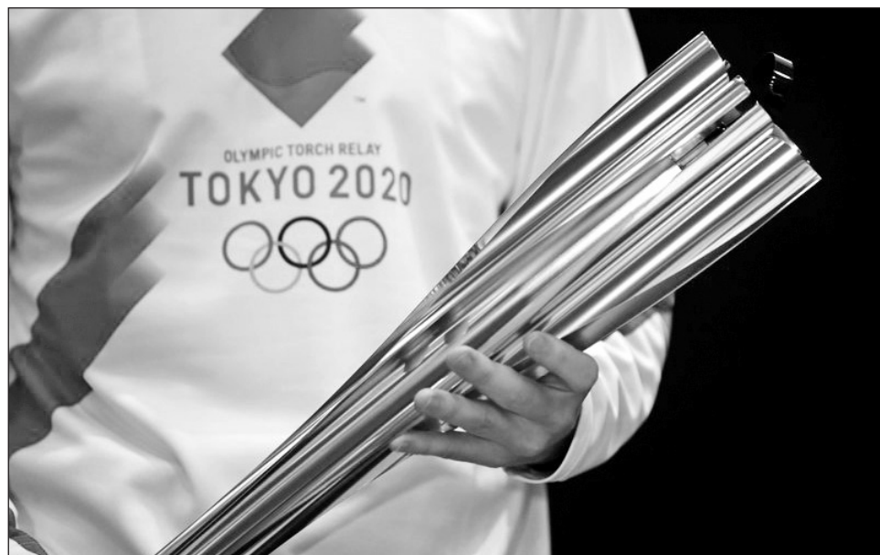
▲ El relevo de la antorcha olímpica comenzará la próxima semana en Japón.

El relevo recorrerá las 47 prefecturas de Japón y presenta un riesgo de transmisión del virus, especialmente debido a que gran