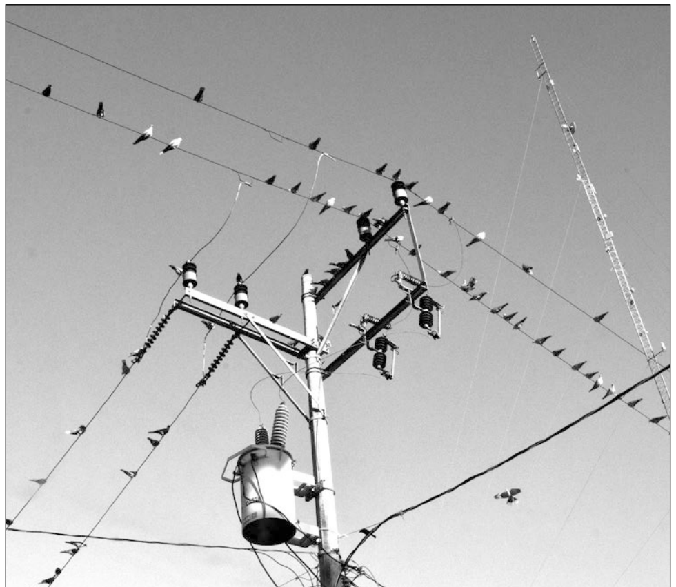
▲ La CFE pidió a la población mantenerse informada mediante los canales oficiales.

El departamento de Comunicación de la paraestatal en Yucatán, confirmó que dicha información es falsa, y llamó a la población mantenerse informada de los canales oficiales de la Comisión.