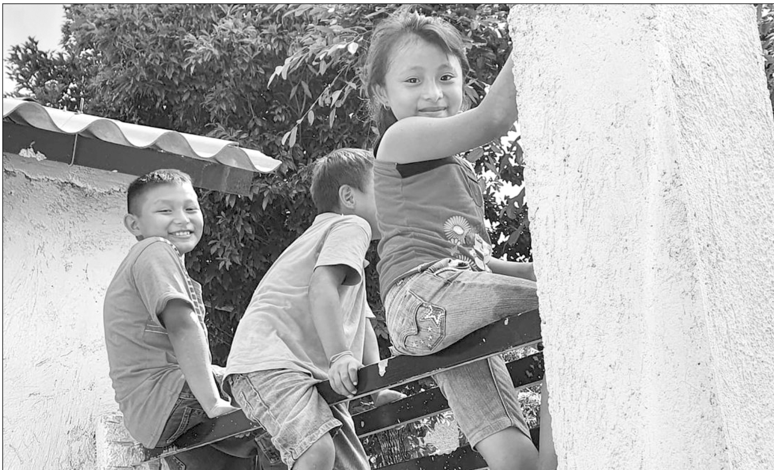
▲ La naturaleza positiva de ser "acomedido" se logra porque la cultura permite a los niños participar en diferentes actividades; no los restringe, aunque aparentemente no hagan bien las cosas.