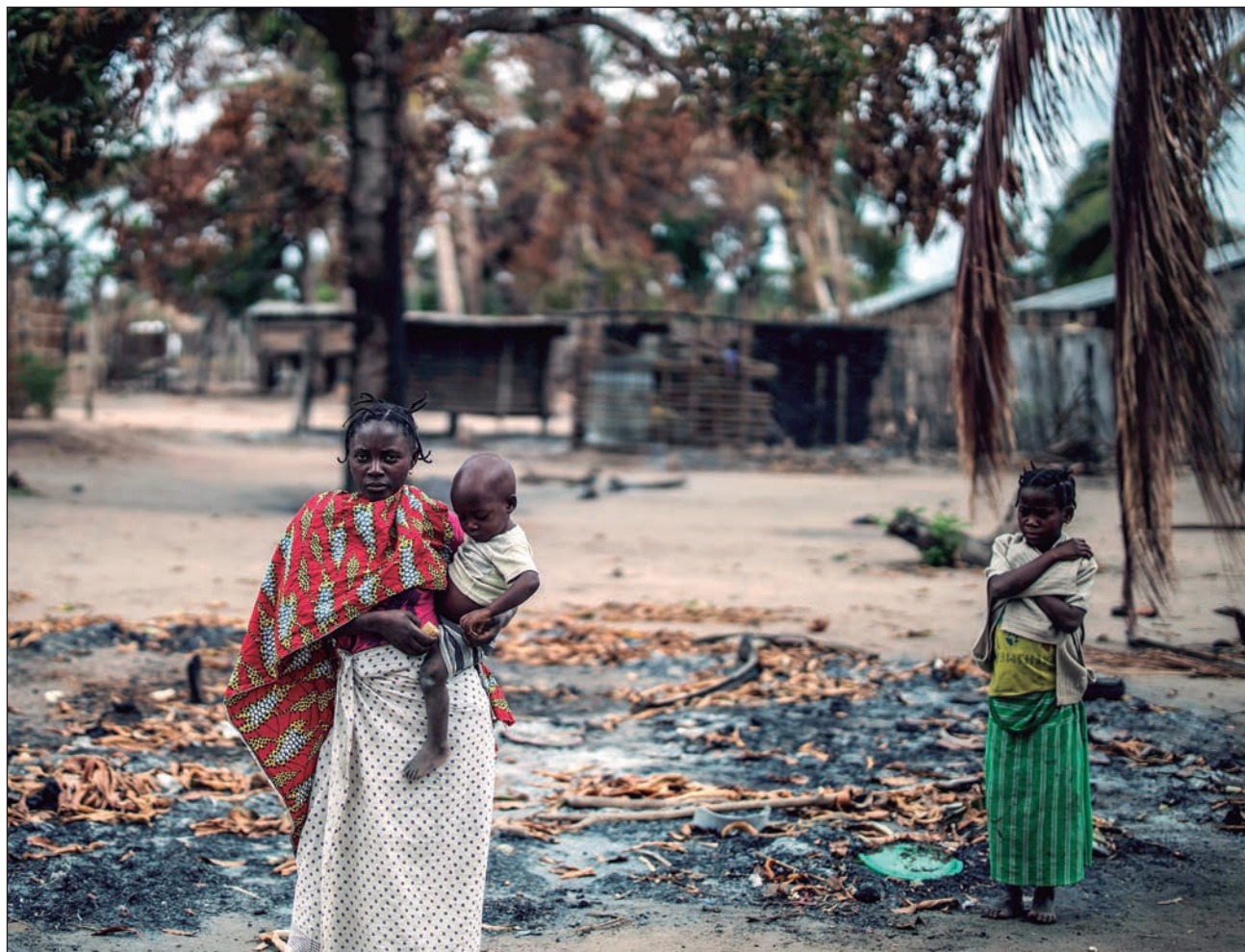
▲ Desde 2017, el norte de Mozambique, la región más pobre del país africano, ha estado sumido en la violencia debido al descubrimiento de yacimientos de petróleo en Cabo Delgado.

“Huímos a casa de mi padre en otra aldea, pero unos pocos días después los ataques empezaron también allí. Mi padre, los niños y yo pasamos cinco días comiendo plátanos y bebiendo agua de banano hasta que logramos un transporte que nos trajera aquí”, reveló desde la casa de uno de sus hermanos.