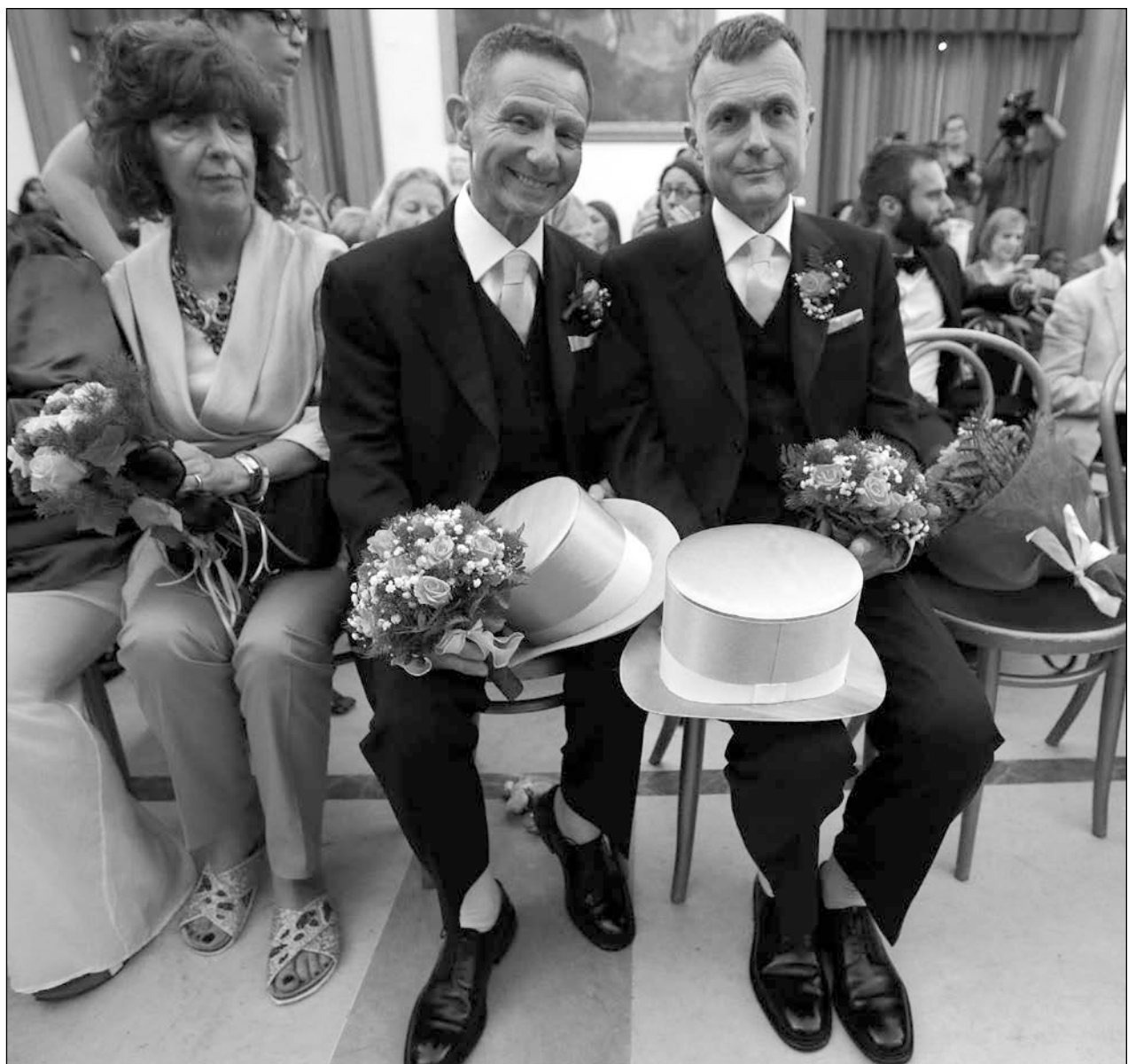
▲ Diversos religiosos afirmaron que los comentarios emitidos ayer por la Santa Sede señalan una recaída de la Iglesia Católica a tiempos que esperaban ya hubieran sido superados con el pontificado de Francisco.

Fundada en 2006 por nueve sacerdotes, la iniciativa dice que ahora tiene alrededor de 350 miembros de las filas de la Iglesia oficial y más de 3 mil seguidores laicos.