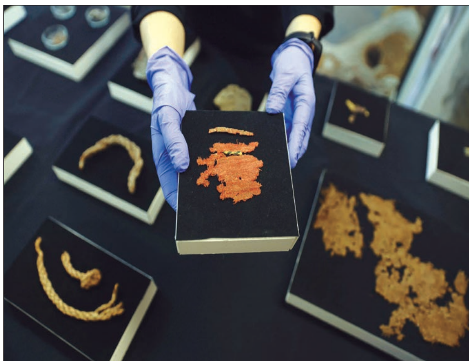
▲ Las nuevas piezas pertenecen a una serie de fragmentos de pergamino hallados en un lugar llamado “La cueva del horror”.

Las piezas fueron halladas durante una operación de la Autoridad de Antigüedades de Israel en el desierto de Judea para encontrar manuscritos y otros artefactos para evitar un posible saqueo.