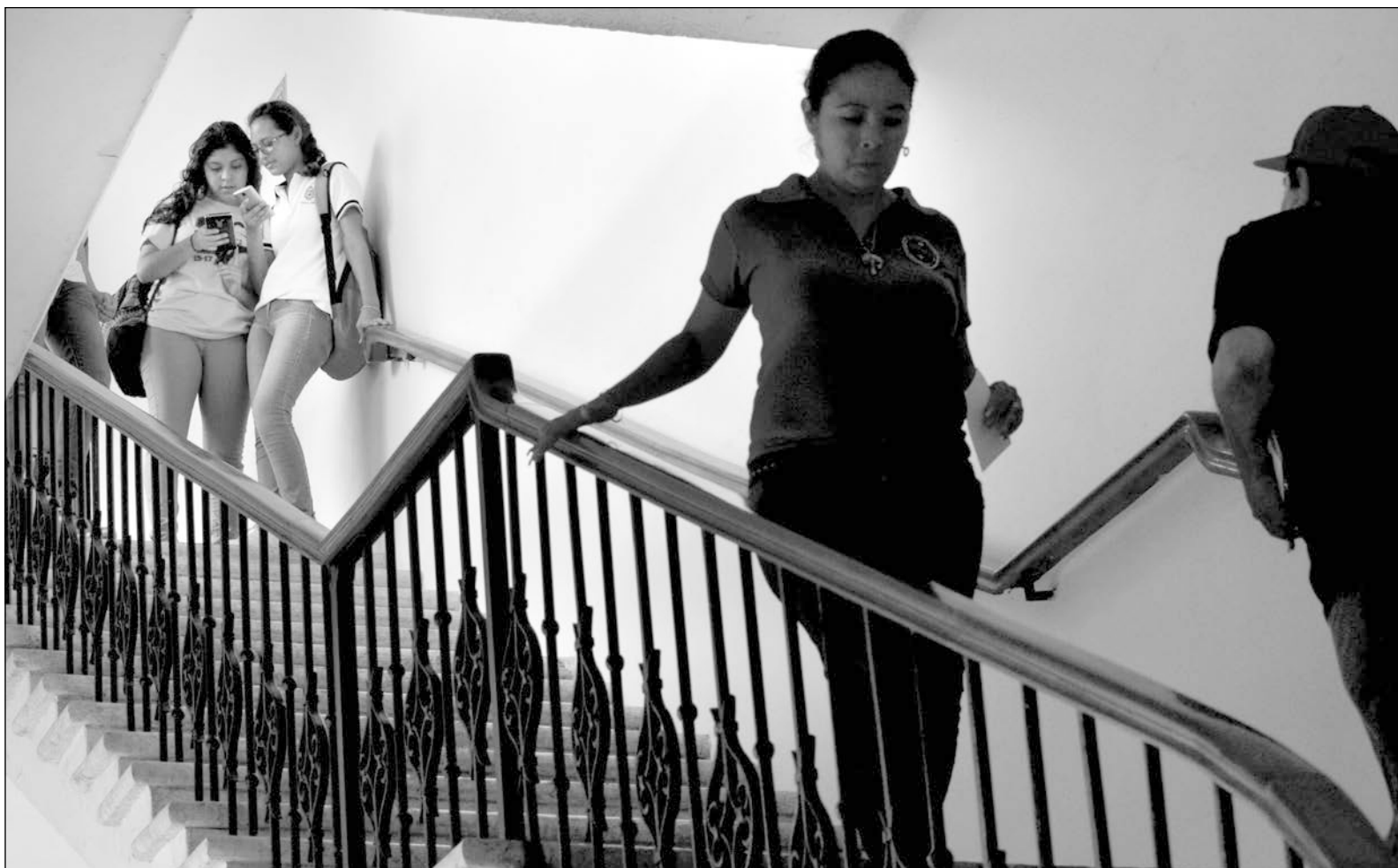
▲ La educación tradicional, que aún prevalece en los sistemas educativos nacional y estatales, sigue priorizando la acumulación de conocimientos a través de la memorización.