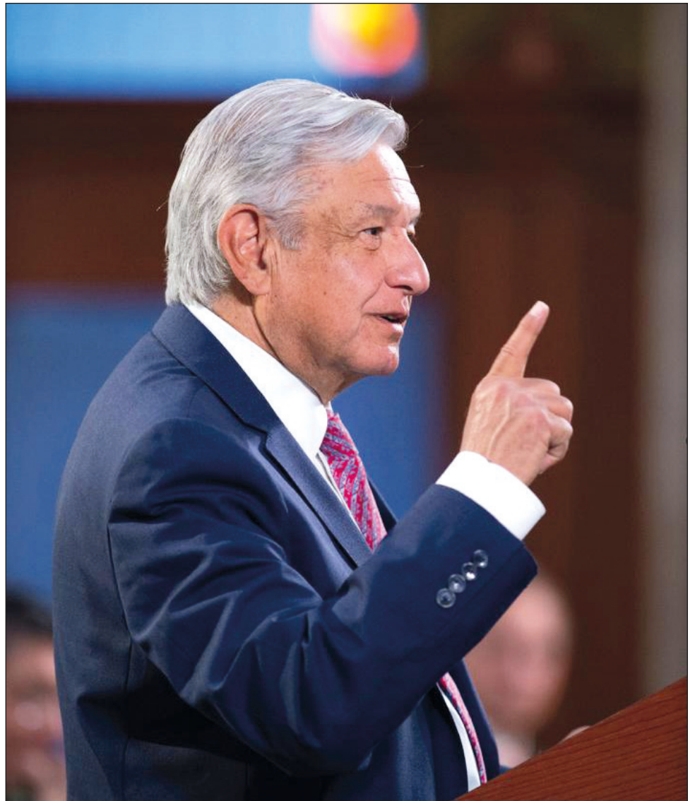
▲ Los campechanos tendrán la última palabra para aceptar el regreso a clases, que sería el próximo 4 de abril, planteó el Presidente en su conferencia diaria.

Mencionó que de acuerdo con estudios nacionales e internacionales, las escuelas no son amplificadores de la transmisión, pero estos sitios deberán ser seguros.