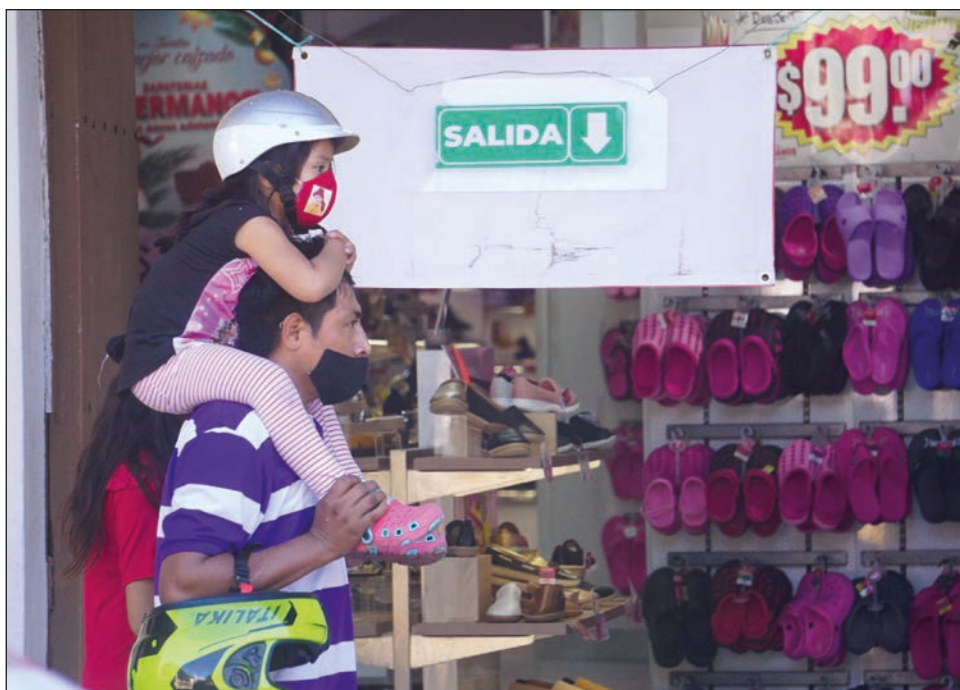
▲ El regreso a clases presenciales, según propuso el presidente López Obrador, debe darse dependiendo de que los estados ingresen a semáforo verde.

Hasta que esto no se garantice, según expuso, deben continuar con las clases virtuales; aunque recaló que muchas personas no tienen acceso a su educación por no contar con las herramientas necesarias, como celulares, computadora, televisión, ni recursos para