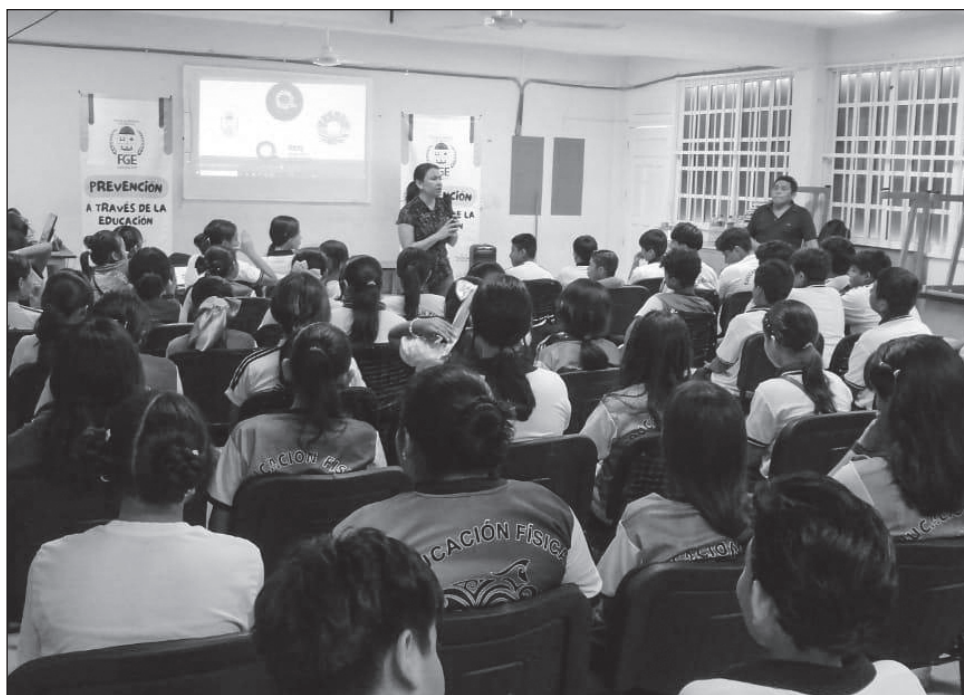
▲ Del 8 de noviembre del 2024 al 30 de noviembre del 2025, con el programa se atendieron a 94 mil 490 personas y se realizaron visitas a 85 centros educativos.