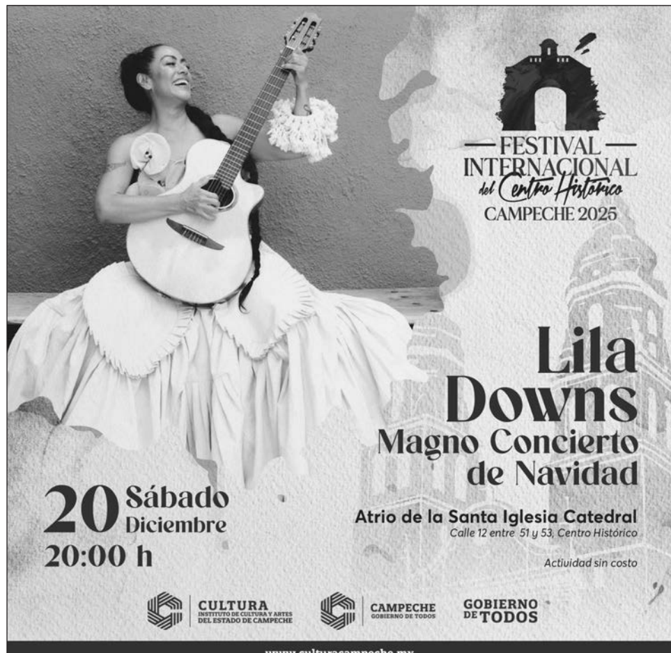
▲ El momento más esperado llegará el sábado 20 de diciembre a las 20 horas, cuando el Atrio de la S.I. Catedral se ilumine con el Magno Concierto de Navidad con la presentación artística de Lila Downs, intérprete reconocida internacionalmente.

El martes 16 de diciembre a las 20 horas, el Teatro Francisco de Paula Toro recibirá al Grupo Nematatlin, Ballet Folclórico de Puerto de Veracruz de la Universidad Veracruzana, que celebrará las tradiciones mexicanas con un