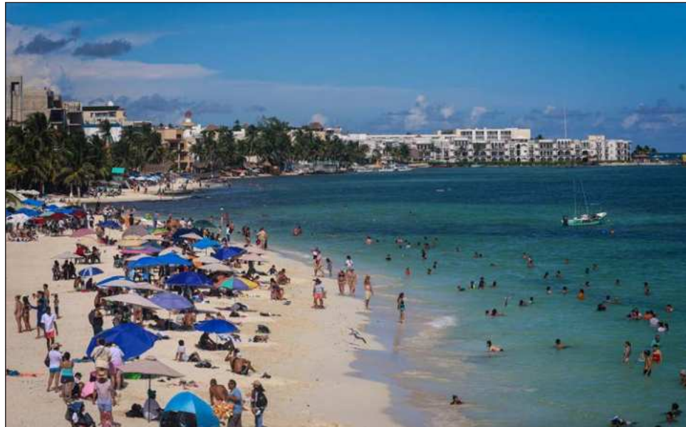
▲ El periodo vacacional de fin de año comprenderá del 20 de diciembre de 2025 al 11 de enero de 2026, es uno de los más relevantes para la actividad turística.

La funcionaria federal dio a conocer que, para el periodo vacacional de fin de año, se estima la llegada de 4.96 millones de turistas nacionales y extranjeros a cuartos de hotel, lo que representa un incre-