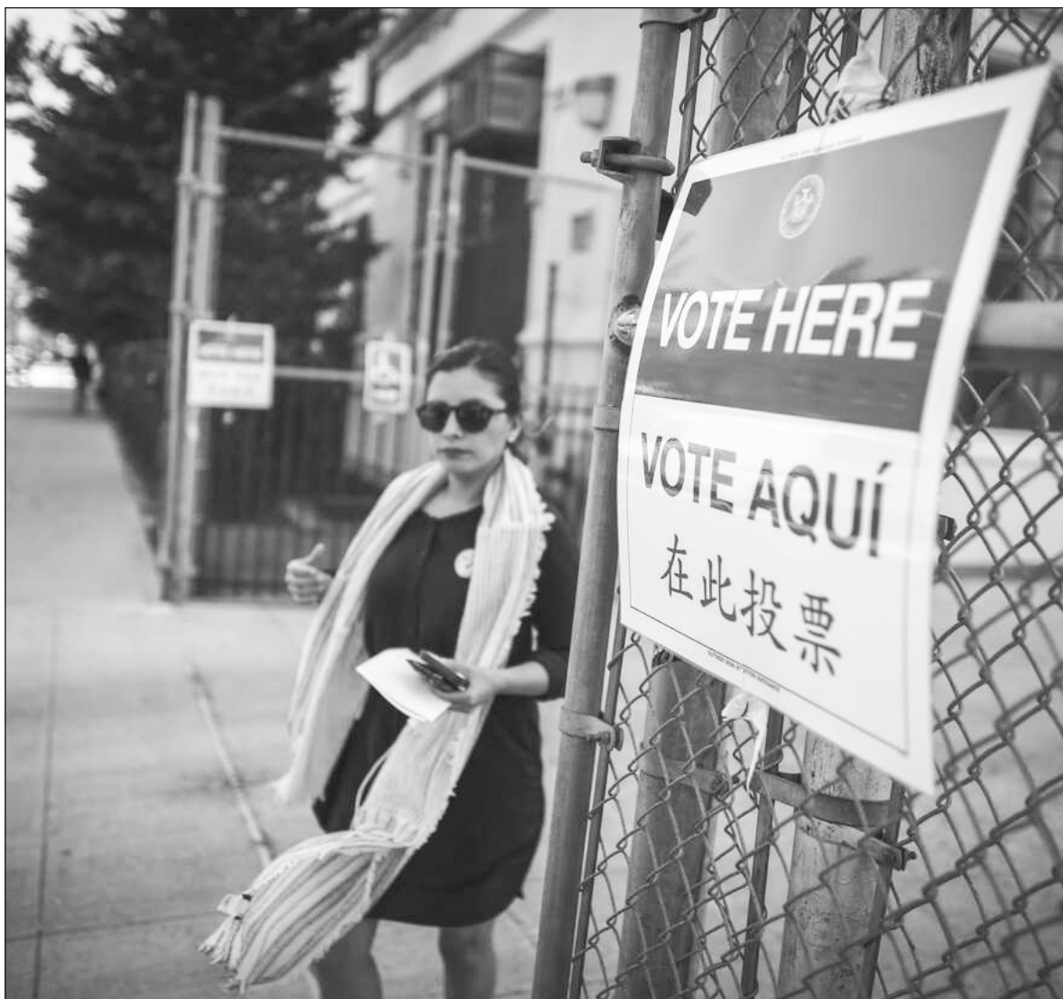
▲ Los votantes latinos están ahora igualmente repartidos entre los partidos Demócrata y Republicano.

CON O SIN latinos, la mayoría prefiere las políticas de Trump a las de Biden: señal ominosa (sic) para los demócratas más allá de 2022 ( Daily Mail , 12/12/21). En un intervalo de 52 años, la demografía, en particular la de los mexicanos –más de 62 por ciento de los latinos–, ha propinado un dramático vuelco en los dos principales estados del Colegio Electoral y con los dos primeros PIB: California y Texas, lo cual fue epitomizado por el último presidente demócrata en Texas, Johnson (periodo 1963-1969) y los dos últimos presidentes republicanos en California, Nixon (1969-1974) y Reagan (1981-1989). En la democracia posmoderna, la demografía es destino.