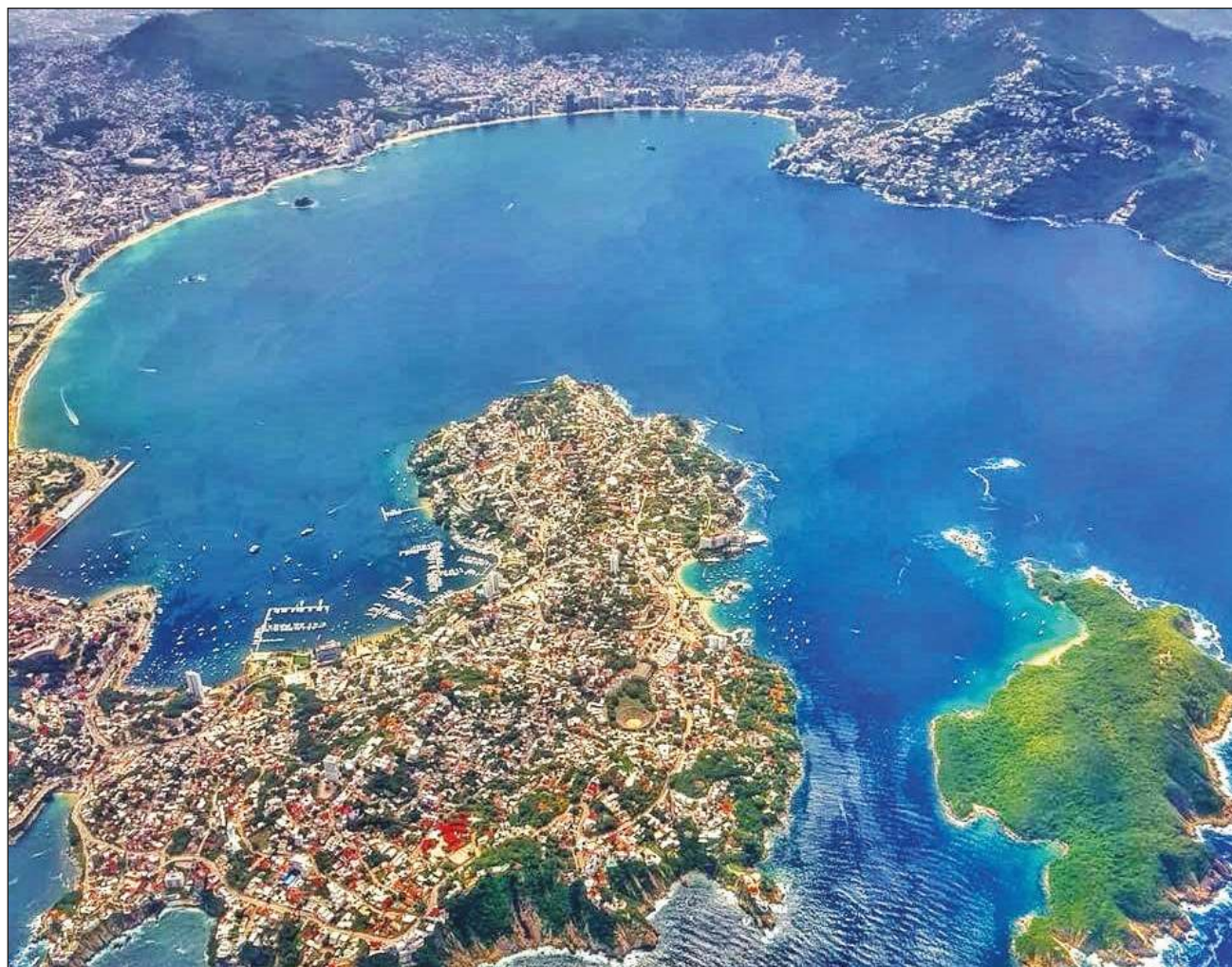
▲ Los historiadores locales de Acapulco no se ponen de acuerdo en las fechas exactas del comienzo de la historia del puerto.

Entre otros objetivos, Cortés quería encontrar un punto entre los océanos que sirviera para llegar a las ahora conocidas como islas Molucas, un archipiélago de Indonesia que en el siglo XVI se le denominó islas de las Especias debido al gran número de plantas aromáticas de la zona. A partir de entonces, las islas se convirtieron en un punto estratégico del comercio de especias entre Asia y América.