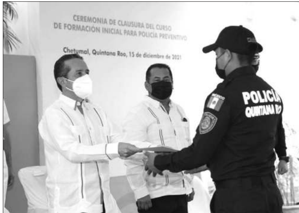
▲ Carlos Joaquín encabezó la ceremonia de clausura del Curso de Formación Inicial para Policía Preventivo.

En el evento, el gobernador Carlos Joaquín enfatizó