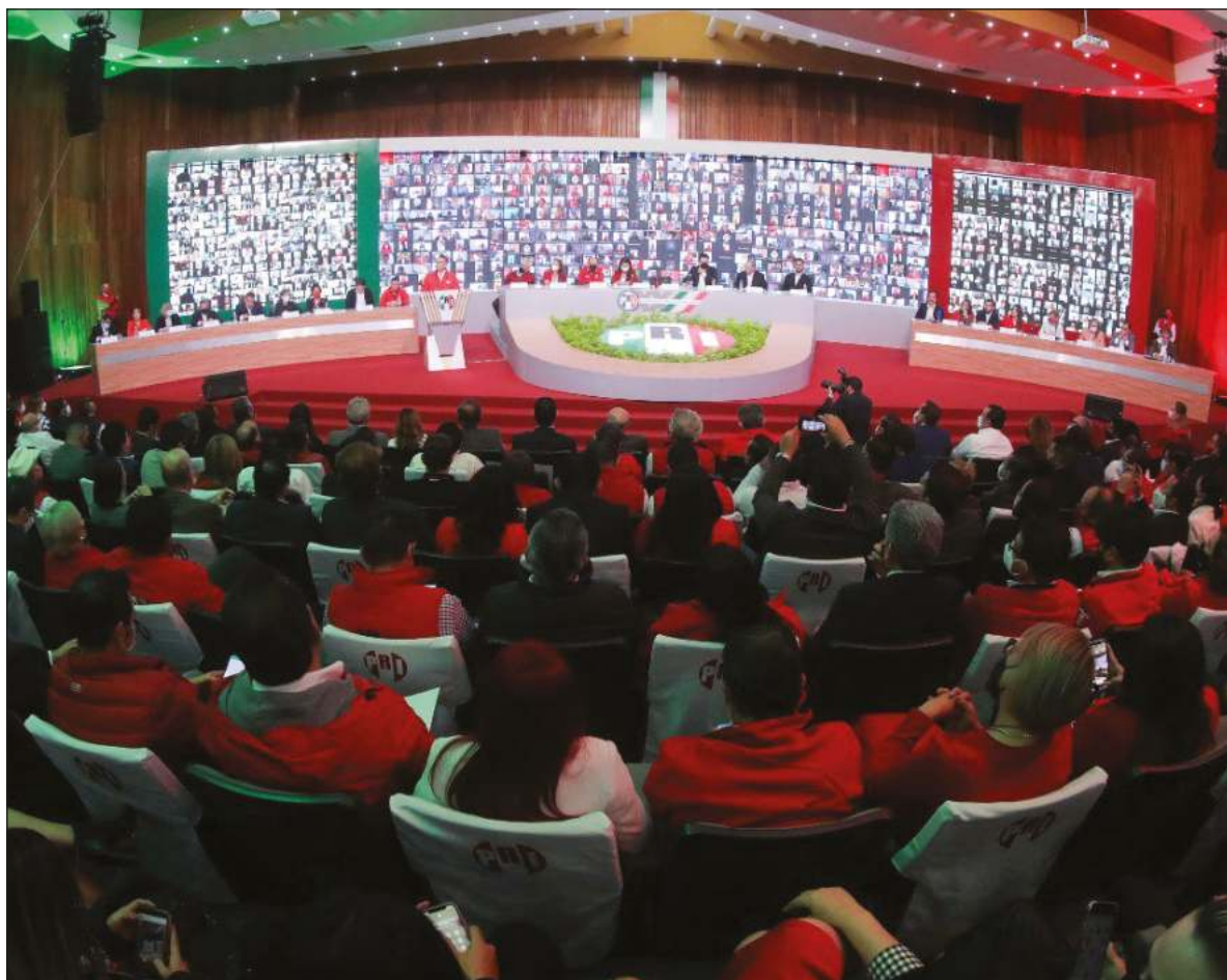
▲ La coalición Va por México dejó fuera de su primer anuncio a Oaxaca (pues esperan cerrar tratos unitarios más adelante), donde el muratismo se ha pasado ostentosamente al flanco obradorista.