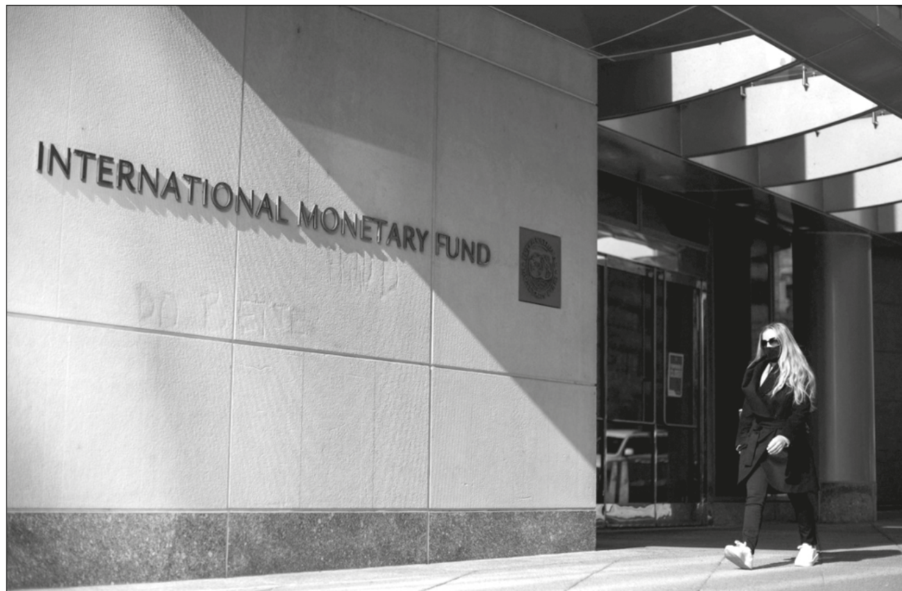
▲ Para los especialistas, si los gobiernos no hubieran actuado ante la crisis producida por la pandemia, las consecuencias económicas y sociales habrían sido devastadoras.

La acumulación de esta deuda pública es la consecuencia directa de dos crisis económicas mayores: la crisis financiera mundial de 2008 y la pandemia de coronavirus.