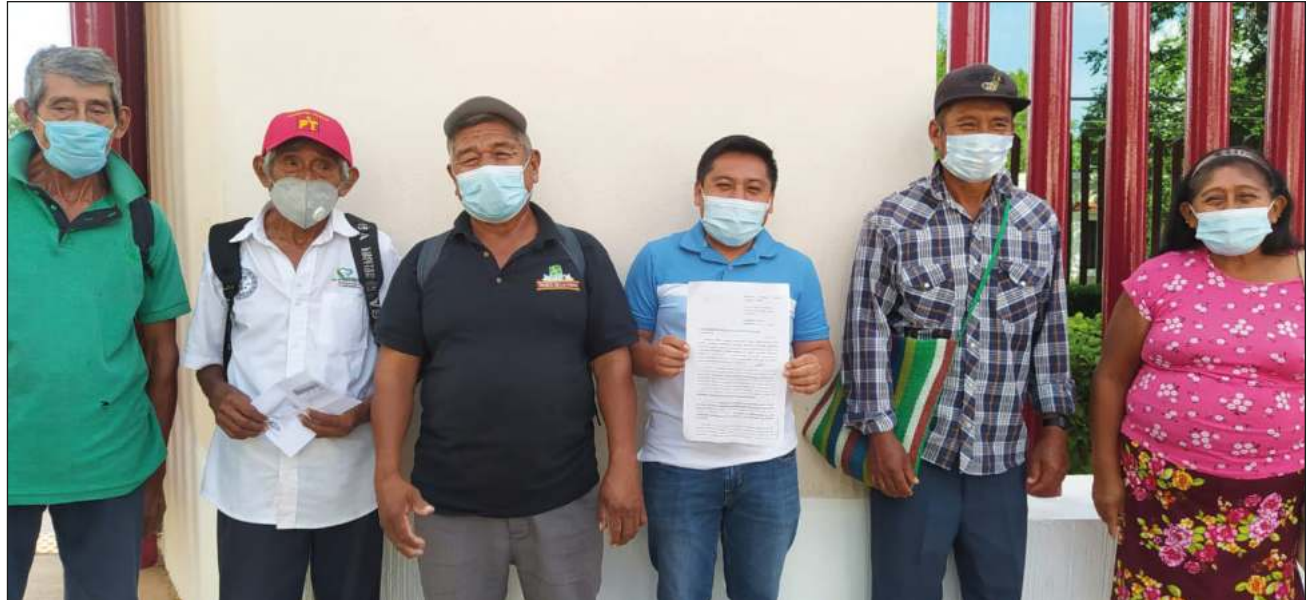
▲ Kajnáalo'obe' tu tselajo'ob tak pool u yáax beetmajo'obe' tu ya'aljo'ob "beey táan u tselko'ob yáax t'aan u beetmajo'obe' táan u jets'iko'obe' mix juntéen yanchaj legal táakmuk'tajil ti'al u ya'aliko'ob ma' ki'imak u yóolo'ob yéetel u meyajil chimes k'áak'", a'alab tumen juntúuli'.

Ichil ba'ax tu ya'alaj xane', kajnáalo'obe' tusa'abo'ob bin úuchik u ts'aabal siibalo'ob ti'ob yéetel uláak'o'obe' ch'a'ab u fiirma, ba'ale': "Bejla'e' taal u ya'alo'ob ti' juese' uts u yilko'ob u meyajta'al chimes k'áak', ts'o'okole' ku luk'sko'ob xan takpool tu beetajo'ob yéetel tu ya'alajo'obe' yaan u táakmuk'tiko'ob tuláakal ba'al'.