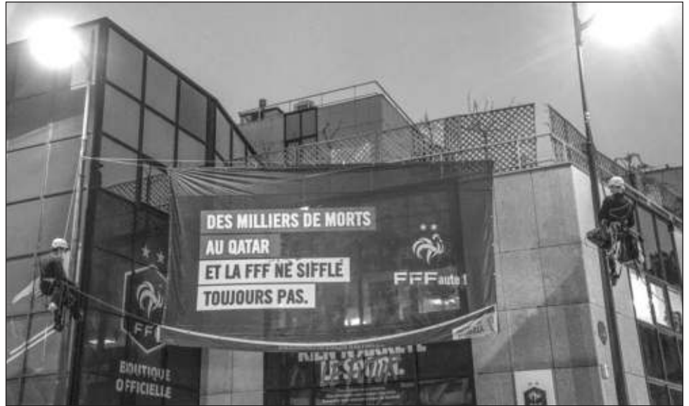
▲ Activistas de Amnistía Internacional colocan un cartel en las oficinas de la Federación de Fútbol de Francia pidiendo que atiendan las violaciones a derechos de los trabajadores migrantes que laboran en Qatar en la preparación a la Copa Mundial.

Los trabajadores no tienen permitido formar sindicatos para pelear de manera colectiva por sus derechos, además de que no hay justicia para ellos y la compensación por abusos sigue siendo escasa, permitiendo que los patrones exploten a sus empleados con impunidad, aseguró Amnistía en su