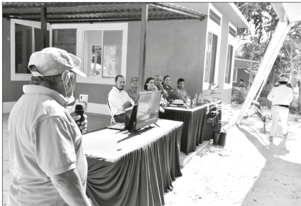
▲ Después de 20 años viviendo en el derecho de vía del ferrocarril, los vecinos de Pixoyal desconfiaban de la propuesta de tener una casa digna, nueva y propia.

Pixoyal es el primer ejido donde entregan casas por relocalización. Campeche fue la zona urbana donde primero entregaron otras nueve, de las que Javier Granados, subdirector de Operación y Seguimiento de la Comisión Nacional de Vivienda (Conavi), dijo fueron compradas ante la premura e insistencia de los pobladores del barrio 4 Caminos, y