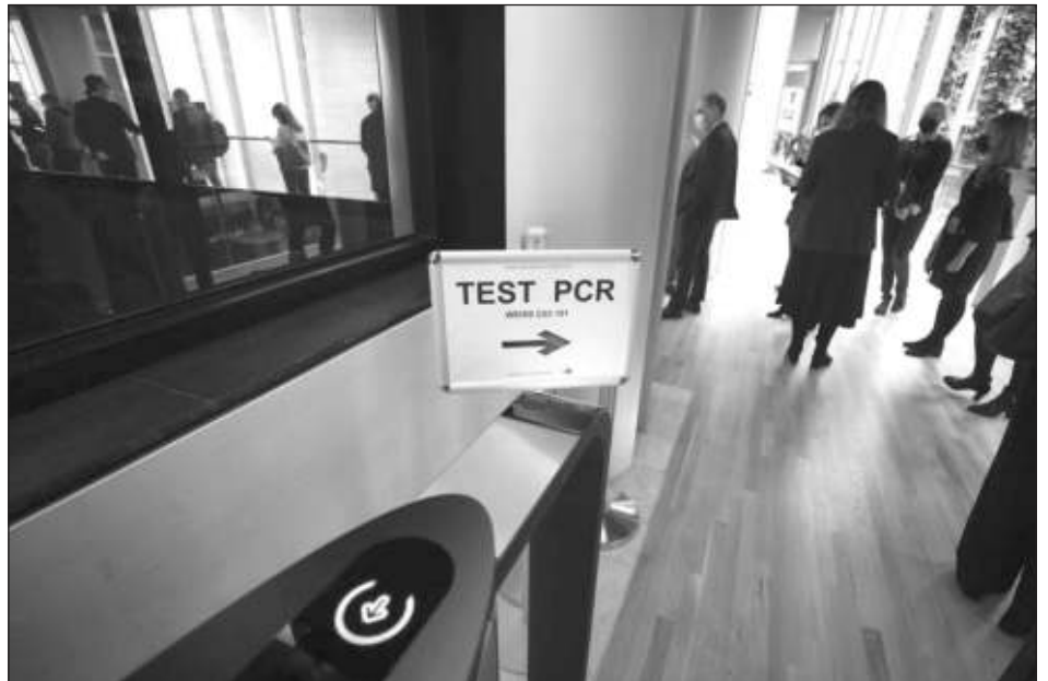
▲ Lo más importante ahora es aumentar lo más rápido posible el número de personas vacunadas en el continente, declaró la presidenta de la Comisión Europea, Ursula von der Leyen.

"Durante el año que termina, hemos trabajado duro