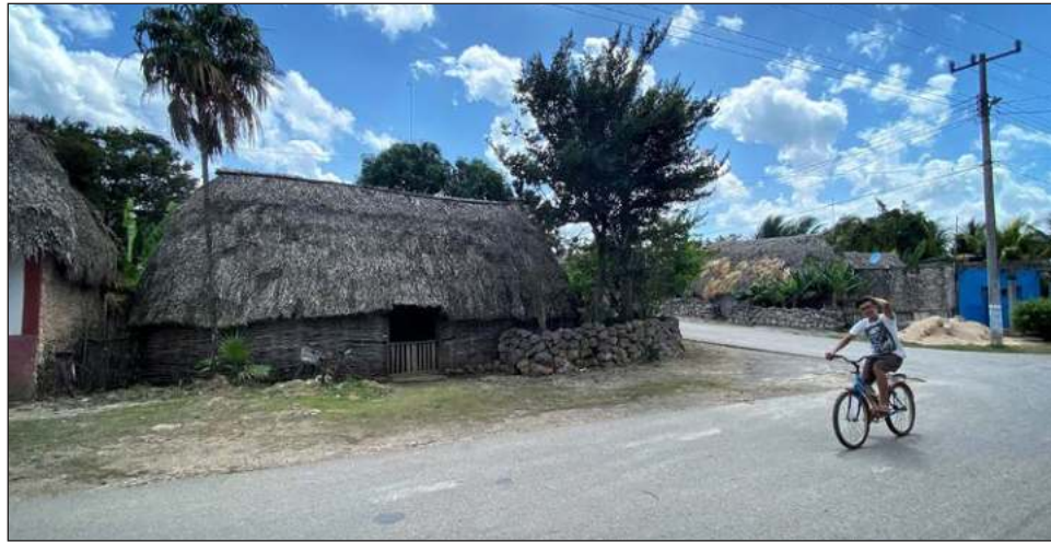
▲ Para mayo la humedad se mantuvo hasta la primera semana, y luego de ello una pequeña sequía.

El 12 de febrero de este año se dieron a conocer los resultados de las cabañuelas que transcurrieron en los primeros días de enero de 2021. En ello se arrojó la prevalencia de un clima húmedo desde mediados de enero y durante febrero, marzo y abril, cuando en efecto hubo lluvias en gran parte del territorio.