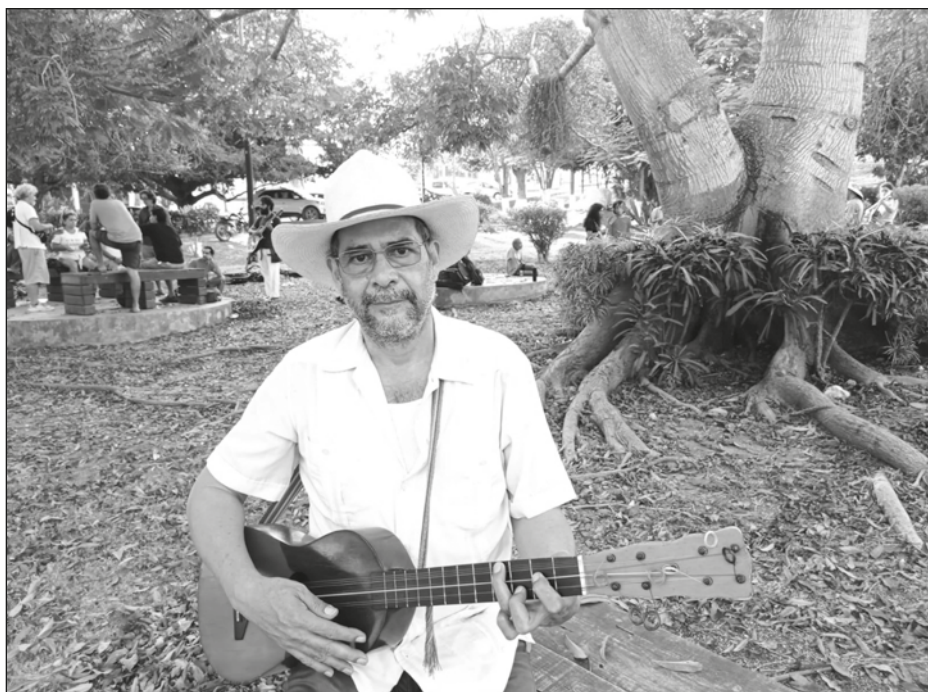
▲ En sus 44 años de trayectoria, Mono Blanco y sus integrantes se han convertido en embajadores del son jarocho a nivel mundial.

“Es como si hubiésemos vuelto a 1990. Se muere Abimael diciendo ‘los problemas no se han resuelto todavía’. Aunque ya no nos matamos, lo cual es un gran paso adelante, los debates, las luchas y los abismos sociales aún son los mismos.”