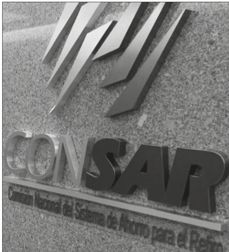
▲ Los mayores frenos para la 4T se encuentran en el Poder Judicial y el gobierno paralelo compuesto por organismos autónomos.