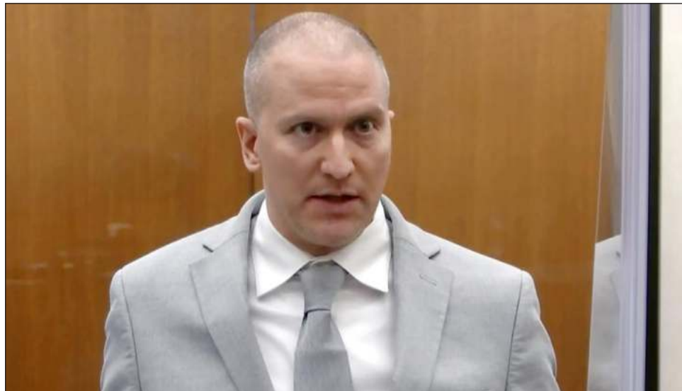
▲ Bajo las leyes penitenciarias de Minnesota, si Derek Chauvin mantiene buena conducta, cumpliría cerca de 15 años de su condena tras las rejas.

Los cargos federales incluyen que Chauvin privó a Floyd de sus derechos al presionar su cuello cuando estaba esposado sin resistirse al arresto y al no