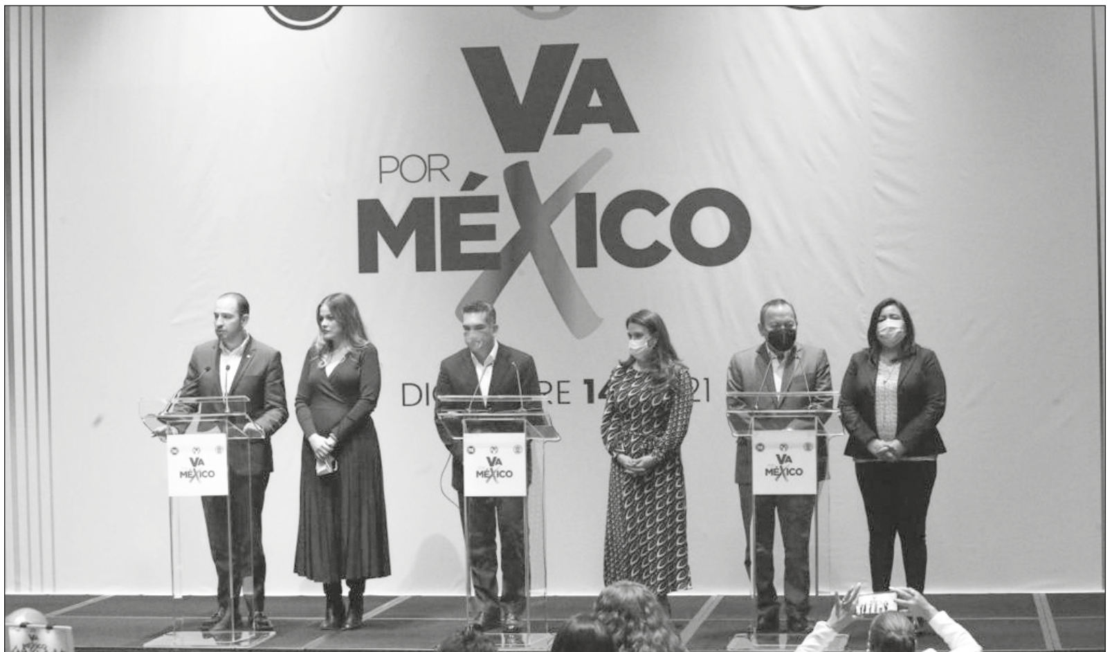
▲ Los neoliberales mexicanos no han sabido reaccionar adecuadamente al rechazo de las mayorías.