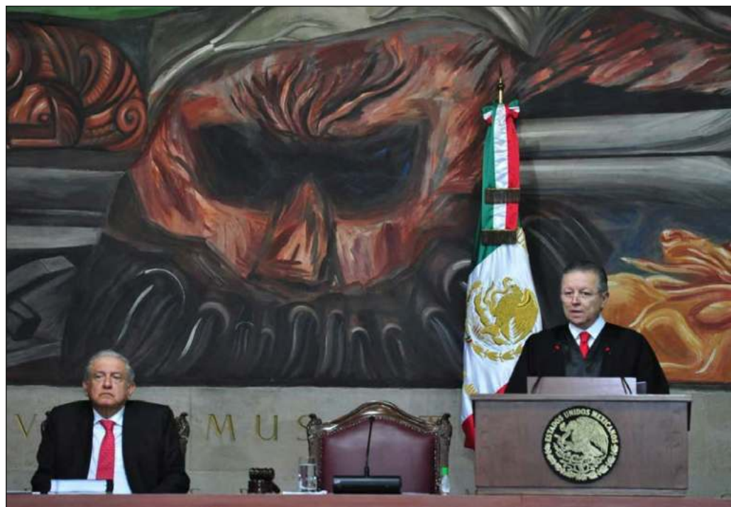
▲ Las instrucciones del Presidente a su gabinete para agilizar la realización de las obras prioritarias se mantienen vigentes hasta que la SCJN resuelva su constitucionalidad.

Es necesario recalcar que la idea de que el documento supone un intento de sustraer los proyectos prioritarios al escrutinio público no proviene del contenido del acuerdo, sino más bien de una campaña de golpeteo político y mediático: el texto publicado en el Diario Oficial de la Federación no menciona en ninguna de sus líneas la reserva de información, y mucho menos sugiere que pudiera implementarse “sin cumplir con los supuestos que las leyes respectivas prevén para ese efecto”.