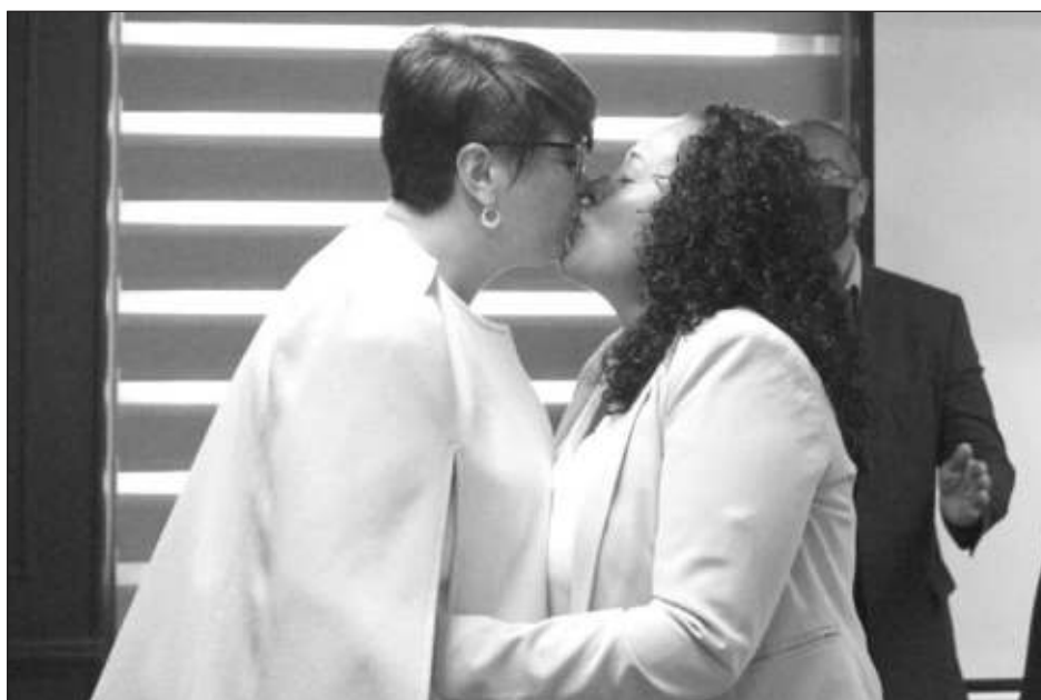
▲ Autoridades reportaron que en sus oficinas se llevó a cabo el primer matrimonio lésbico en todo el estado.

El pasado 12 de noviembre entró en vigor la reforma al Código Civil del Estado de Querétaro que avala que define al matrimonio como una institución en la que establecen un vínculo jurídico dos personas y no exclusivo entre un hombre y una mujer.