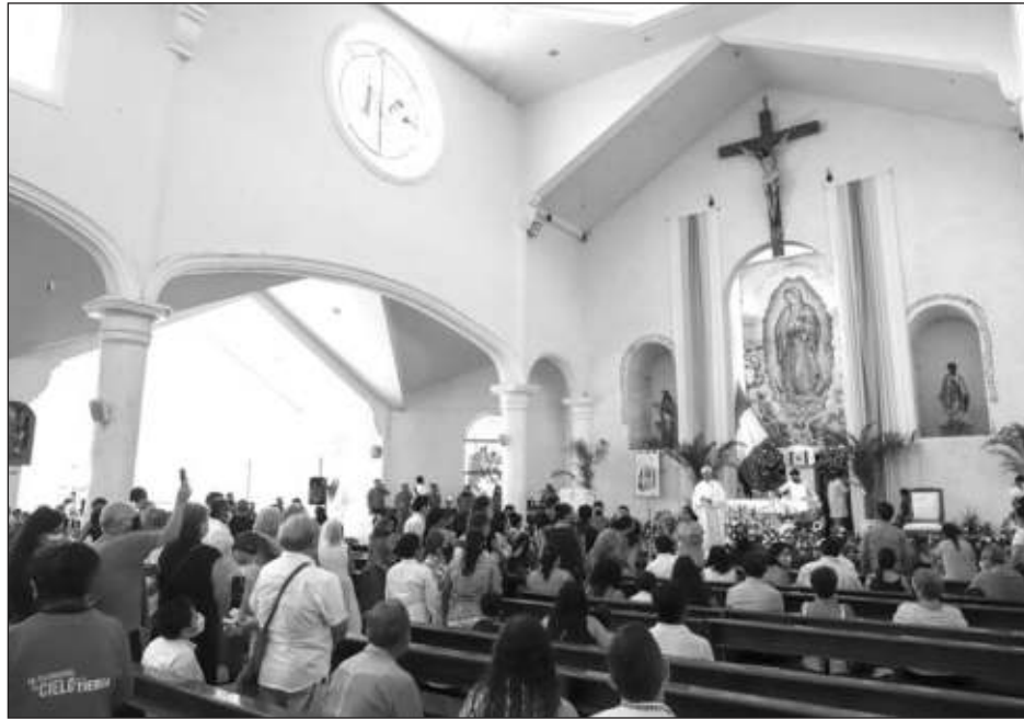
▲ En la entidad prevalece el semáforo verde, el cual contempla los servicios religiosos al 80 por ciento de su capacidad.

Lo anterior en virtud de que se prevé que prevalezca el semáforo en verde, aún en primera etapa, el cual contempla los servicios re-