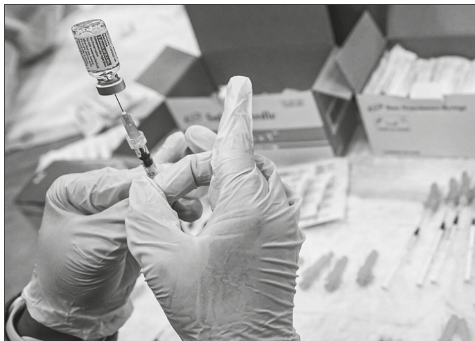
▲ Hay naciones que no quieren donar sus dosis tan rápido como podrían debido a la incertidumbre del momento en el que nos encontramos, dijo el director de la alianza Gavi.

"Lo que estamos viendo con la variante ómicron es pánico en muchos países, que ha llevado a una aceleración de las dosis de refuerzo tanto en el número de personas que las han recibido como en los plazos para administrarlas", explicó Berkley a The Associated Press.