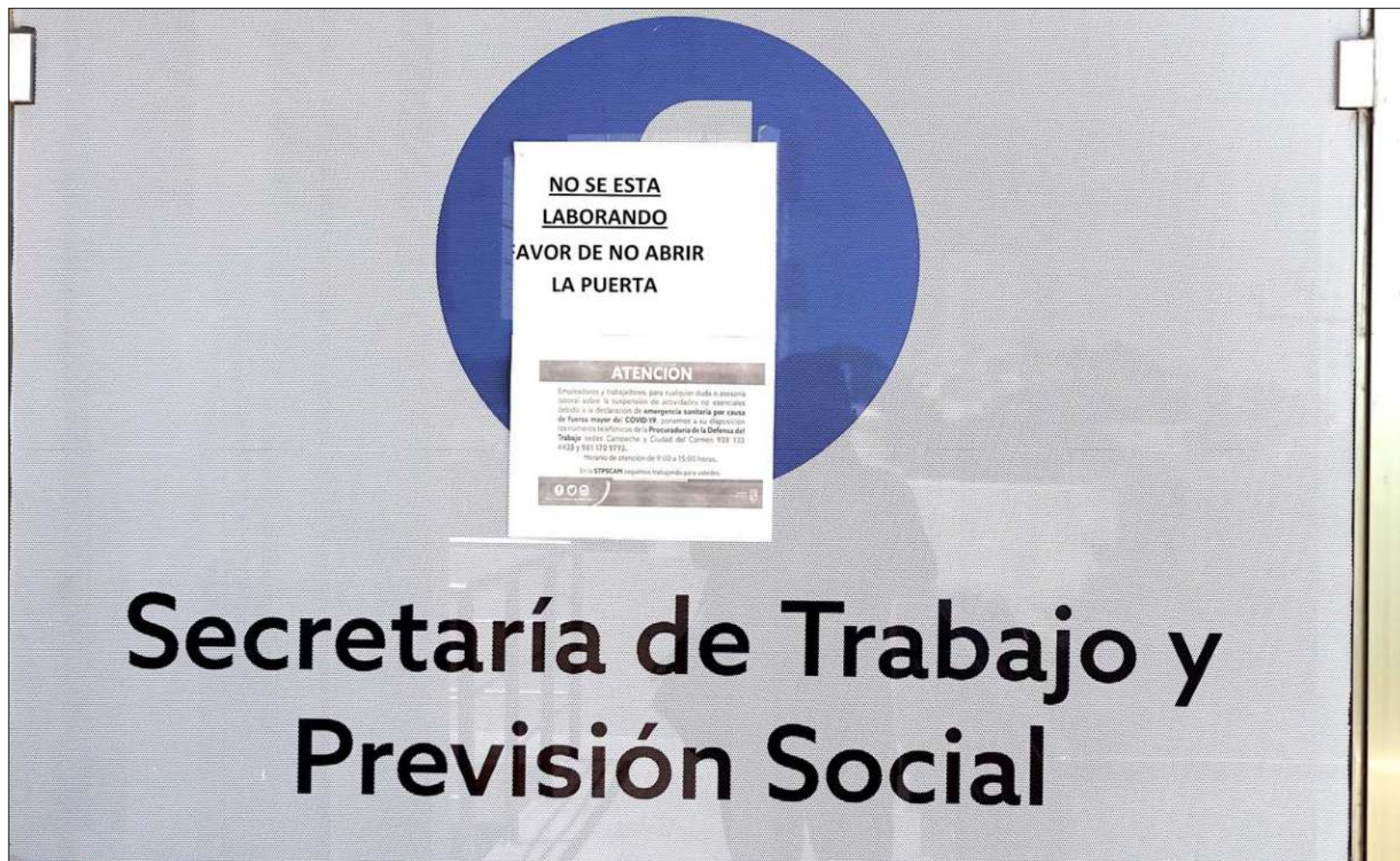
▲ Desde febrero de 2017 se publicaron diversas disposiciones en materia de justicia laboral para desaparecer gradualmente las juntas locales y federales de conciliación y arbitraje.