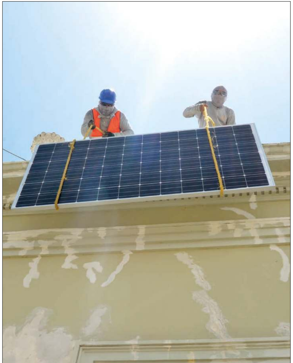
▲ Comerciantes se ven afectados por aumento de servicio eléctrico.

"Todo esto será para cubrir los pagos de luz e impuestos, por lo que la ganancia será poca. Hay buenas expectativas, pero también fuertes pagos", concluyó.