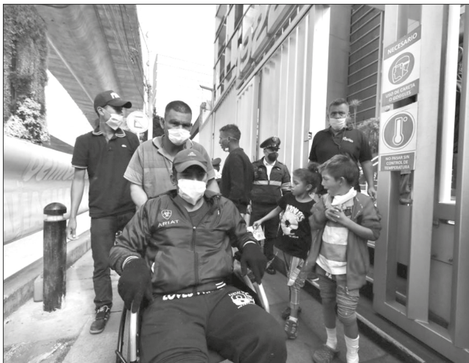
▲ Los migrantes piden claridad en el ofrecimiento de visas humanitarias que les hace el Instituto Nacional de Migración, ya que ignoran el valor jurídico de dichos documentos.

Mujica pidió a las autoridades federales, en particu-