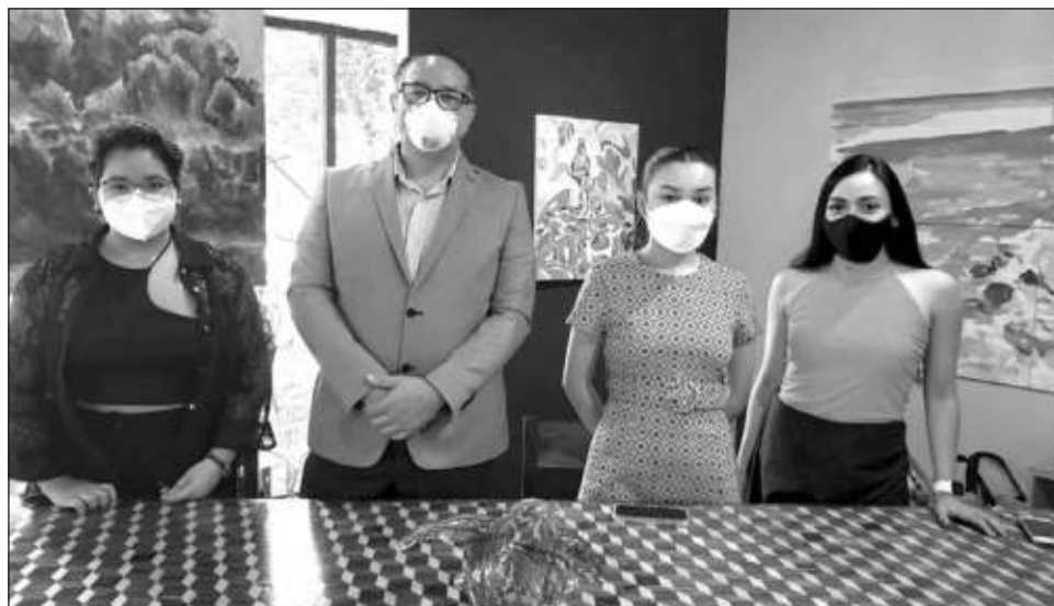
▲ Debido a la pandemia, estudiantes deciden lanzar un video para mostrar sus diseños.

“Siempre hemos procurado que los estudiantes trabajen en entornos reales y tengan una experiencia real en toda la ejecución de lo que es una pasarela” mencionó el director de la Escuela de Diseño de la Universidad Modelo, Cristian René