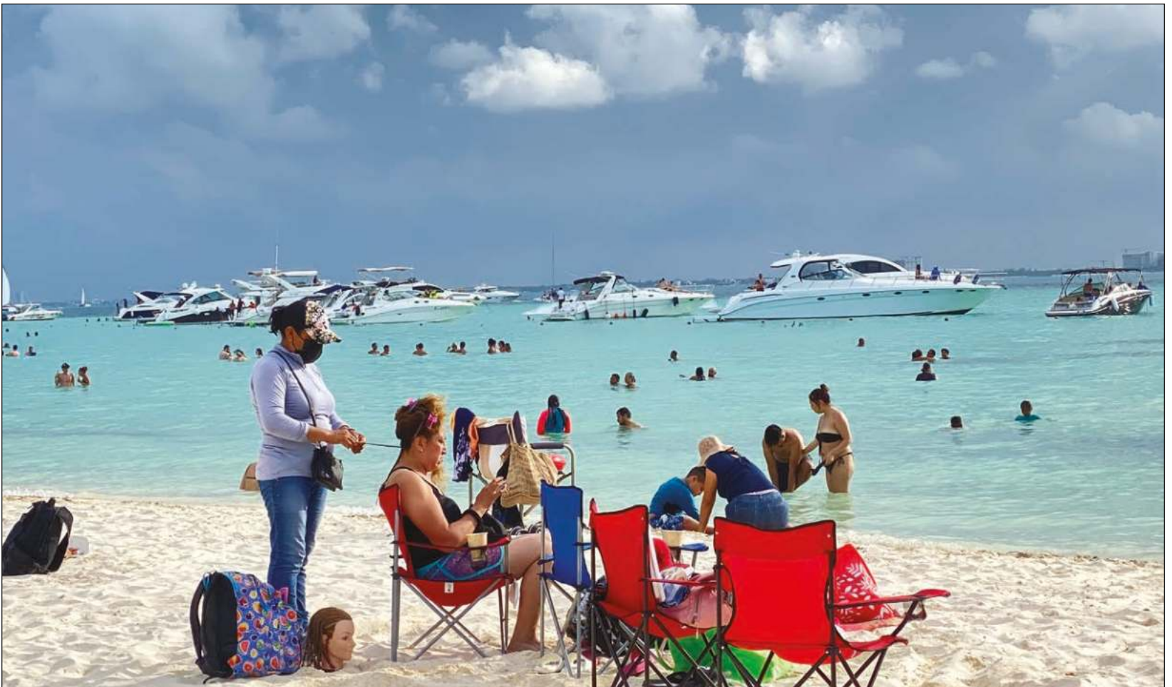
El turismo es una industria sin “chimeneas”, pero contamina. En México, representa 8.5% del PIB nacional.