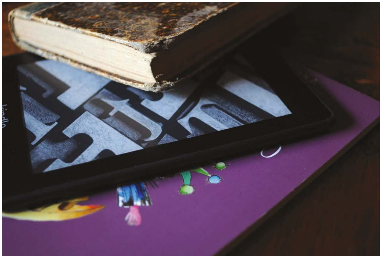
▲ El libro en físico ha surcado contra viento y marea, manteniéndose a pesar de la censura y las dictaduras.