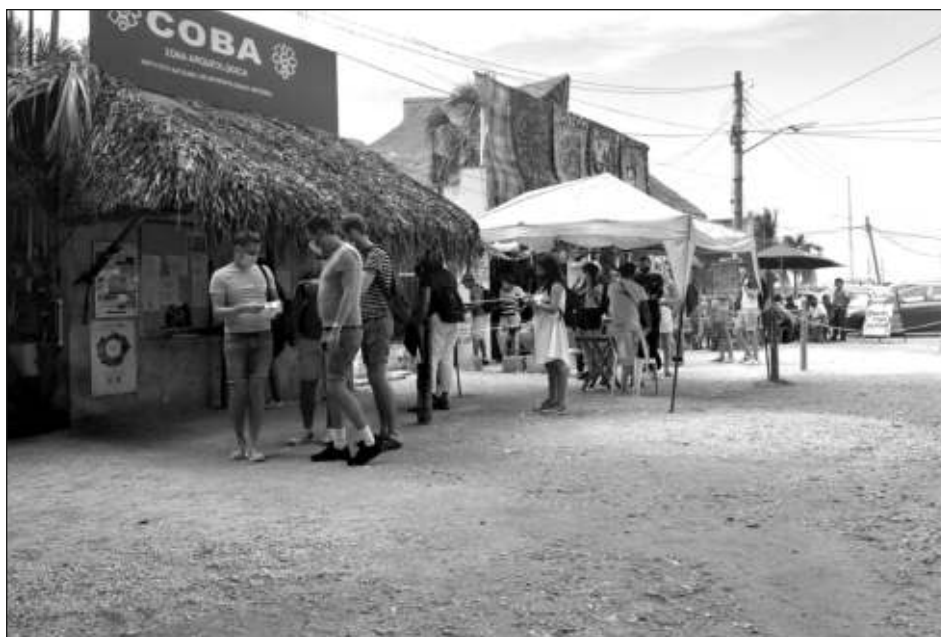
▲ El nuevo cobro de 100 pesos es adicional al que actualmente realiza el INAH, que es de 80 pesos.

Sobre si se presentaron dudas o quejas, aclaró que no tuvieron problemas con los turistas, dado que fue anunciado con anticipación a los touroperadores que traen visitantes a la zona.