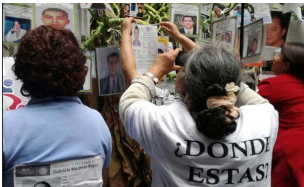
▲ Frente a los casi 100 mil casos reconocidos, hay apenas 35 sentencias por desaparición, con lo que la impunidad se erige en un doble agravio contra las víctimas.

Cabe hacer votos porque la visita del CED redonde en avances palpables en la localización de las personas desaparecidas y en la detección, denuncia y erradicación de las redes criminales que han hecho de nuestro país la nación latinoamericana más golpeada por este flagelo. En la consecución de estos propósitos deben participar las autoridades de los tres niveles y de los tres poderes de gobierno, pues sin su concurso será imposible cerrar la que probablemente sea la mayor herida del México contemporáneo.