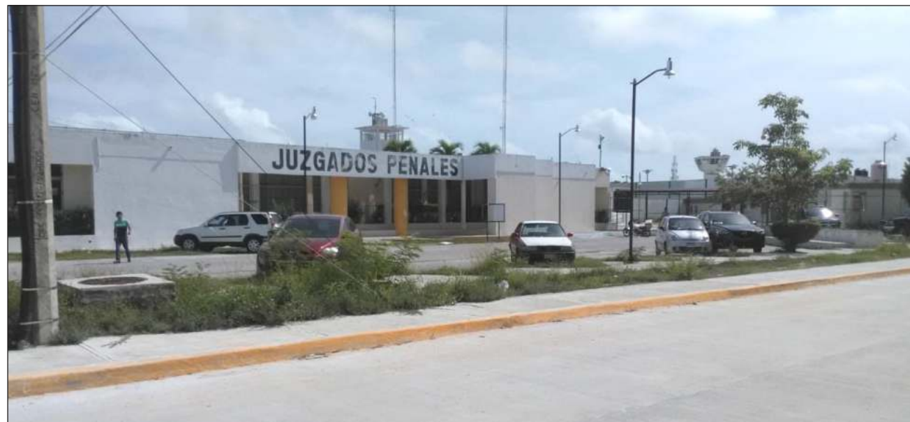
▲ En opinión de los litigantes, en los juzgados puede haber mayor control sanitario en la apertura de horarios que el que se da en restaurantes y bares.

“Nos parece ilógico que mientras los restaurantes y bares de la isla cuenten con horarios ampliados y con la autorización de aforos de hasta cien por ciento,