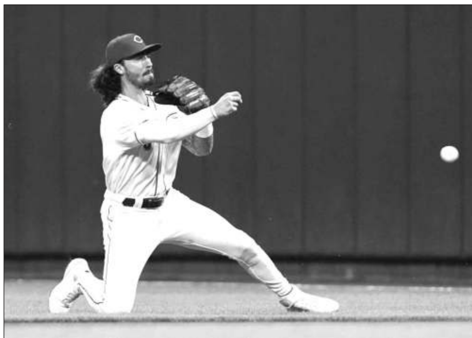
▲ Jonathan India, segunda base de los Rojos, fue nombrado Novato del Año en la Liga Nacional.

Pero Arozarena no jugó lo suficiente en la campaña regular de 2020 para perder su estatus de novato, por lo que fue elegible para recibir el premio este año. Siguió su impresionante actuación en los playoffs con una temporada increíble en 2021, ter-