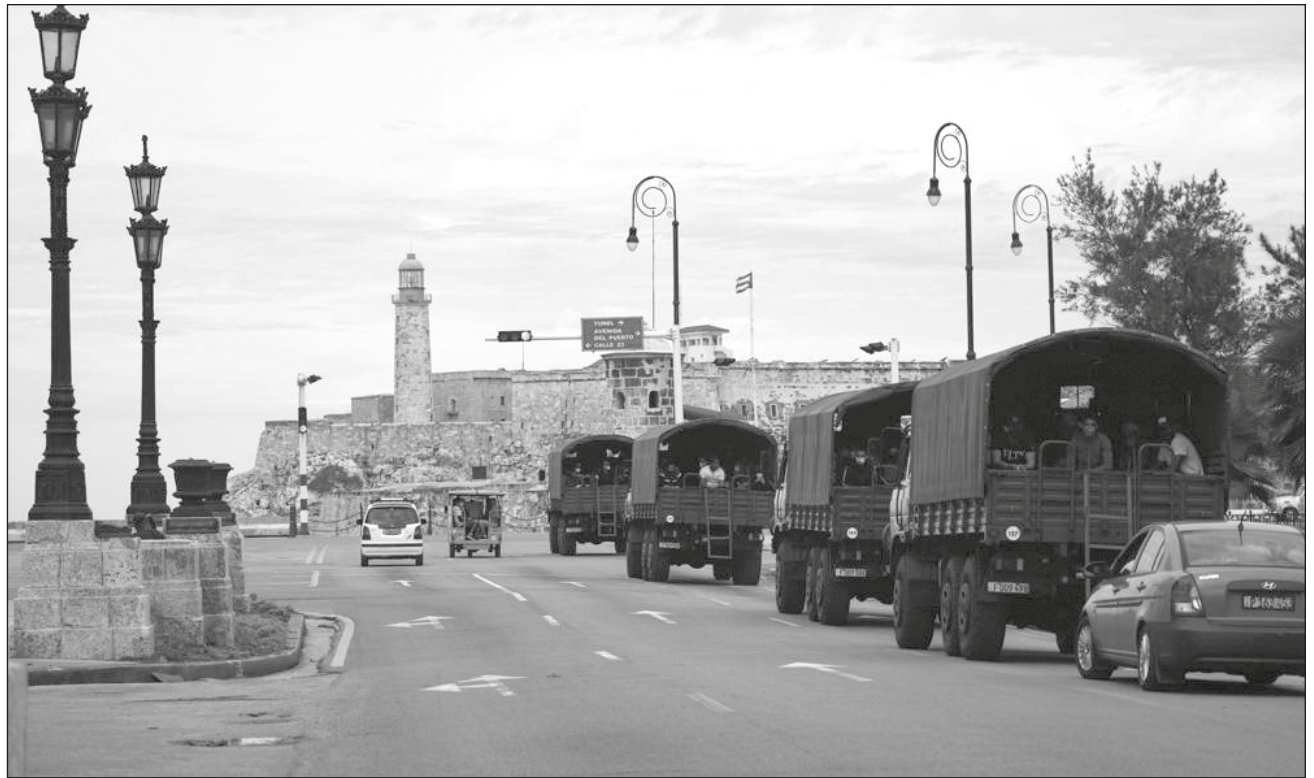
▲ La calles del Malecón, el punto acordado para las manifestaciones en contra del gobierno, lucieron vacías durante la jornada de ayer.

Las protestas realizadas el 11 y 12 de julio fueron las primeras en contra del gobierno