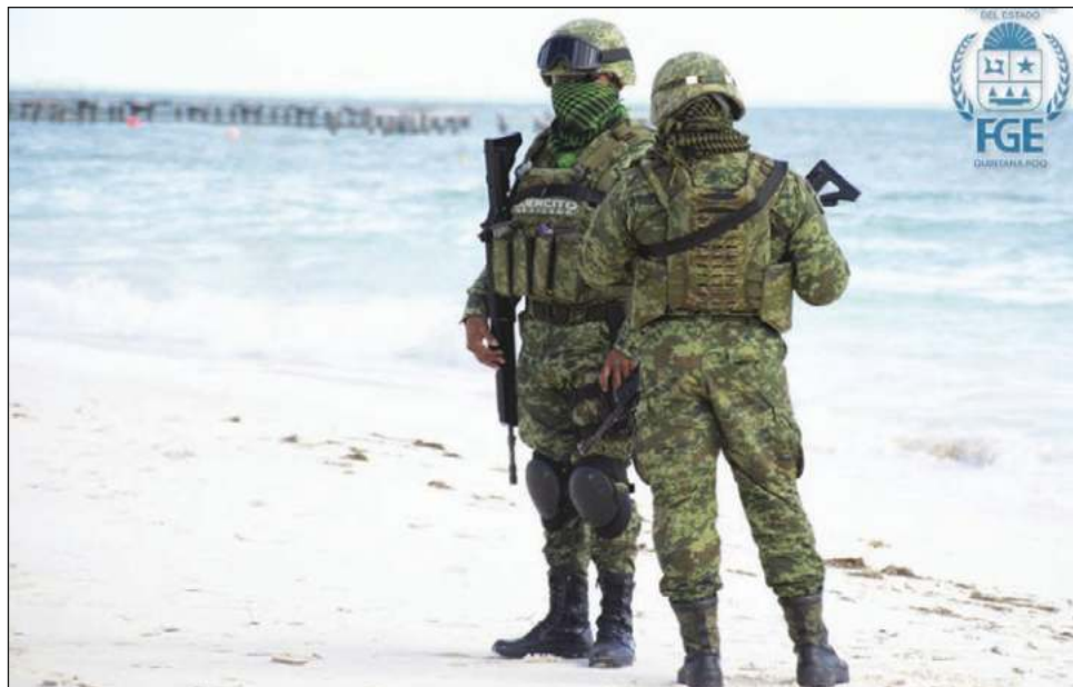
▲ En los últimos años, las playas se han convertido en un foco rojo en cuestión de inseguridad, ya que han sido tomadas por miembros de la delincuencia organizada.

Insistió que a través de las mesas de seguridad y