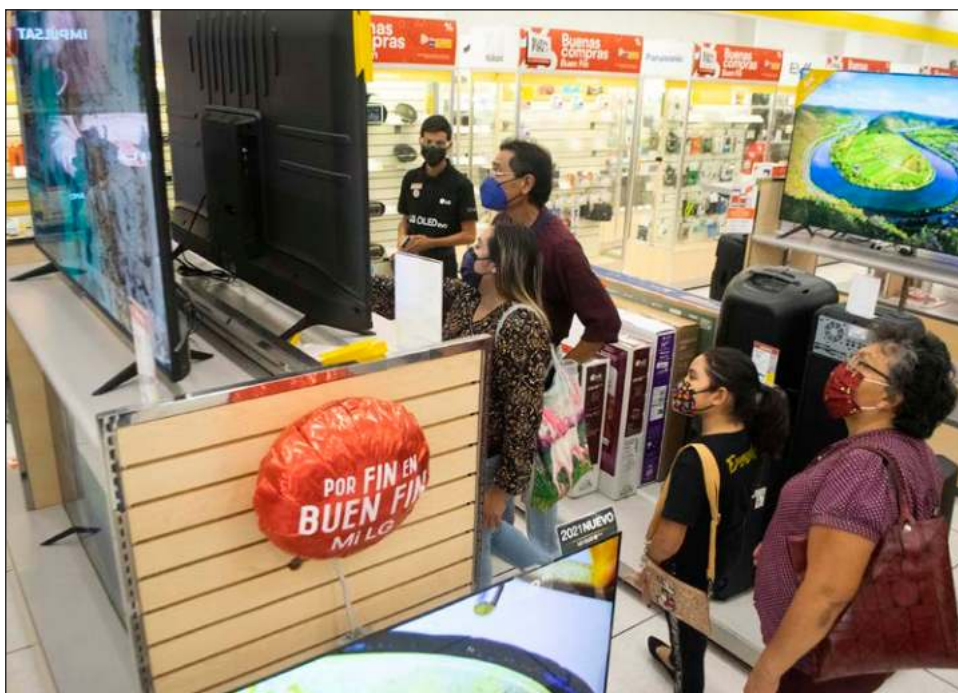
▲ La plataforma Quién es Quién en los Precios acumula 182 mil consultas con motivo de El Buen Fin, más del doble de las realizadas durante 2020.

“Ahorita el rey de las ofertas falsas ha sido Chedraui. Las croquetas de perro, por ejemplo, las subió 27 por ciento en la semana del Buen Fin y luego las puso en oferta 25 por ciento de descuento; al final están dos por ciento más caras las croquetas que antes del Buen Fin. Digo, pues ¿qué son esos cotorreos? Le suspendimos su promoción. No es a fuerza. Si no quieren una oferta, no la pongan, pero no digan mentiras, y menos suban dos por ciento el producto”, manifestó.