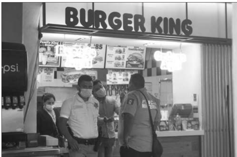
▲ Empleados ven extraño el robo ante la cantidad de patrullaje en el lugar.

Al lugar acudieron elementos de la Policía Ministerial, luego de que agentes acordonaron el restaurante de comida rápida para realizar las pesquisas correspondientes al caso. También acudieron los representantes y gerente de la empresa, pero no quisieron hablar de lo ocurrido.