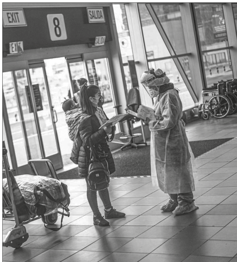
▲ Según las autoridades, “ningún ciudadano tiene derecho a contagiar a otro del nuevo coronavirus en Perú”.

“Si uno viaja en un ómnibus interprovincial y tiene que viajar varias horas con una persona que se sienta al lado, tienes el derecho a tener menos posibilidades de que te contagien”, dijo