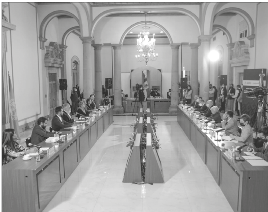
▲ El Comité para la Desaparición Forzada de la Organización de las Naciones Unidas visitó México por primera vez.

El mandatario vuelve al país el viernes 19 pues al siguiente día encabeza la conmemoración del aniversario de la Revolución Mexicana.