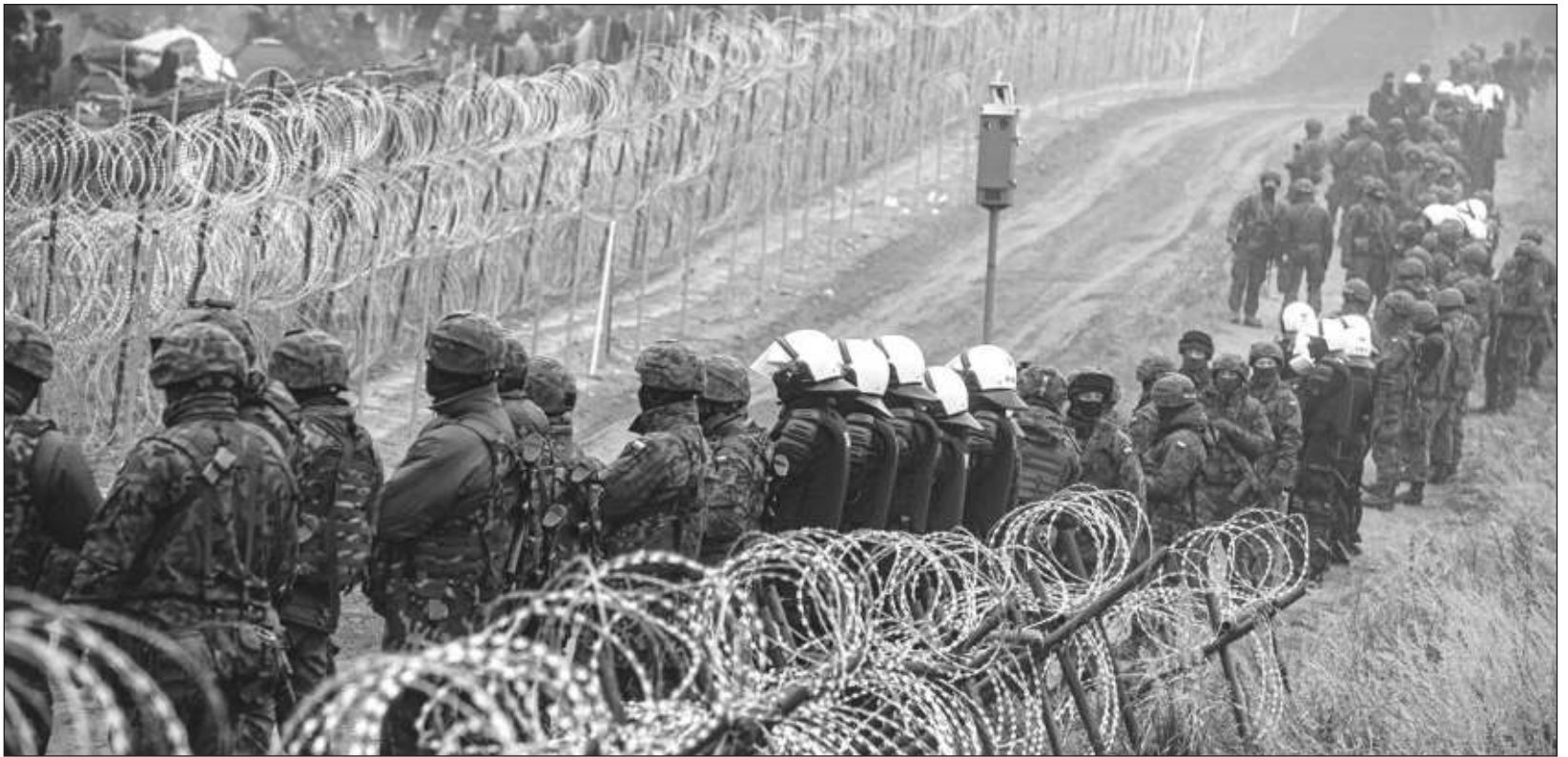
▲ El nuevo muro costará 407 millones de dólares y tendrá una longitud de 180 kilómetros, más o menos la mitad de la frontera entre ambas naciones.