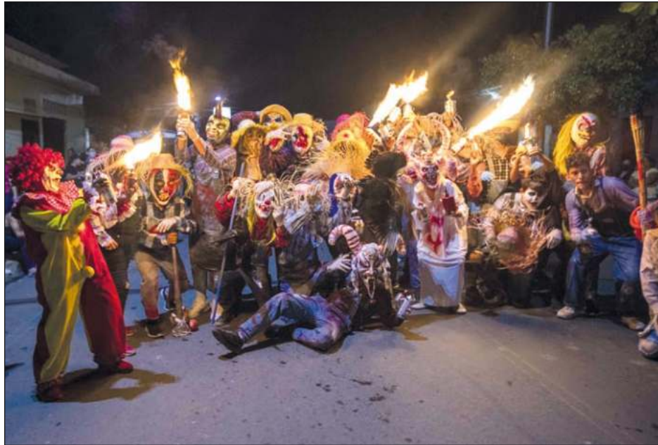
▲ Los Agüizotes es como el inframundo nicaragüense, donde desfilan diablos, brujas y otros personajes de los mitos y leyendas de la época de la Colonia española.

Los Agüizotes, que se celebra el último viernes de octubre, este año se trasladó a la segunda semana