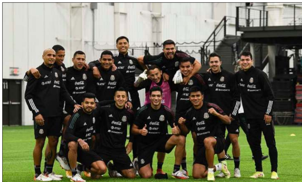
▲ El Tricolor intentará recuperarse hoy en Canadá del golpe que recibió en territorio estadounidense.

"El estadio no es fácil para nadie, pero nosotros hemos estamos preparándonos para este día", dijo el lateral y extremo que brilla en el Bayern Múnich de