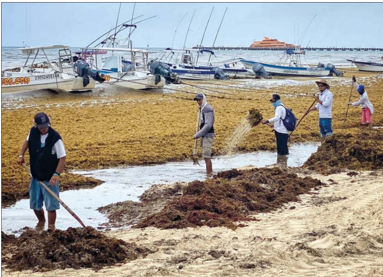
▲ El mal manejo del sargazo viola los derechos humanos a un medio ambiente sano, al agua y a la salud.

"Por un lado estamos capacitando, acompañando y certificando a los hoteles pero por otro lado estamos yendo a recolectarles todos sus residuos. Por ejemplo, actualmente de los 80 hoteles que hay en la zona costera ya 40 están trabajando con nosotros, con el acompañamiento que dura un año para obtener esta certificación", sostuvo.