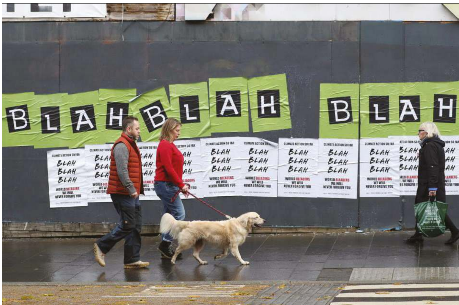
▲ Parece que prevalecieron los criterios económicos sobre los argumentos de científicos y organizaciones de la sociedad civil.