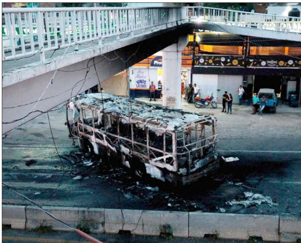
▲ El Presidente insinuó que incorporaría las reuniones de gabinete y conferencias de prensa mañana los fines de semana para combatir la manipulación informativa.

"Fue de los fines de semana con menos homicidios. Sin embargo, por la propaganda, la percepción es otra. Tiene que ver con el interés de quienes llevaron a cabo estas acciones. Quema de vehículos, quema de Oxxos."