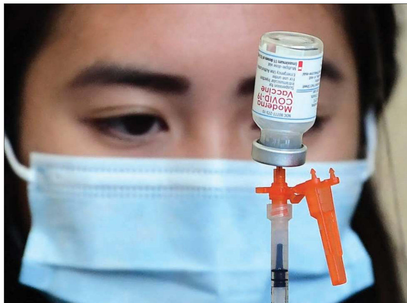
▲ La FDA dijo que ya no estaba considerando autorizar un segundo refuerzo de coronavirus para todos los adultos, sino que se centraría en vacunas renovadas para el otoño que apuntan a las subvariantes virales más nuevas.

“Lo que esta vacuna (combinada) nos brinda es una herramienta afilada en nuestro arsenal para ayudarnos a protegernos contra esta enfermedad a medida que el virus continúa evolucionando”, dijo la doctora June Raine, directora del regulador de medicamentos y atención médica de Gran Bretaña.