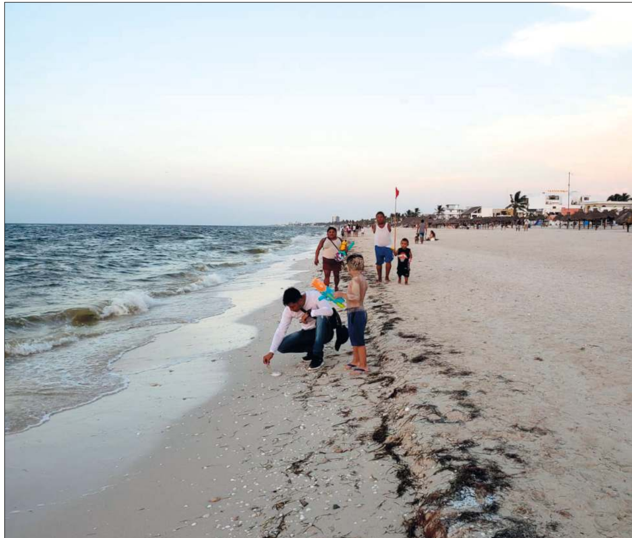
▲ Por la marea roja, no es recomendable introducirse al mar, ni consumir los peces que llegan a la playa.

La marea roja, de casi 40 kilómetros de extensión, llegó al municipio costero de Progreso, el cual no dejó