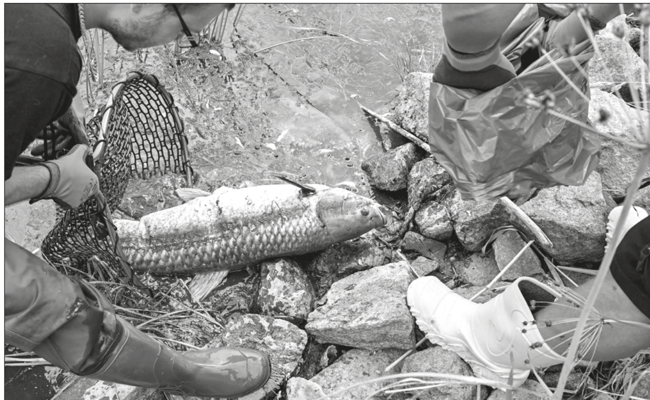
▲ La semana pasada se retiraron 10 toneladas de peces muertos del río Oder, que corre desde Chequia hasta la frontera entre Polonia y Alemania antes de desembocar en el Mar Báltico, y se pidió a la población que no nadara ni tocara el agua.

El gobernador del estado de Brandeburgo, que hace frontera con Polonia a lo largo del río Oder, cri-