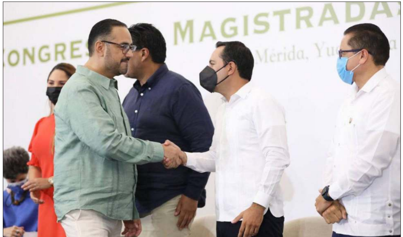
▲ El gobernador de Yucatán destacó que las y los magistrados tendrán la oportunidad de reflexionar y participar también en mesas de trabajo sobre la democracia en el país que, según aseguró, en el estado tiene la mayor participación.

La magistrada de la Sala Superior del Tribunal Electoral del Poder Judicial de la Federación, Janine M. Otálora Malassis, comentó que