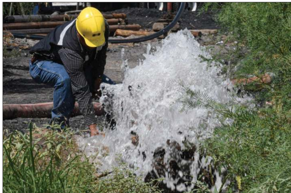
▲ Para el desagüe de El Pinabete se tienen 14 bombas con un total de 990 caballos de fuerza, aunque el ingreso aproximado de agua es de dos litros por segundo.

Durante la conferencia presidencial de este lunes, Velázquez detalló que hasta ayer los niveles de inundación en la mina alcanzaron en el pozo dos, 38.49 metros; en el tres, 41.04; y en el cuatro, 38.15 metros; esto está