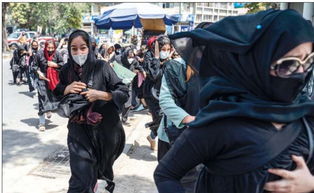
▲ El fin de semana, en vísperas del primer aniversario de la caída de Kabul, una manifestación de mujeres fue disuelta violentamente frente al Ministerio de Educación de Afganistán.

Ante esta circunstancia desesperada, es necesario que la voz del mundo se alce contra el martirio que padecen las afganas.