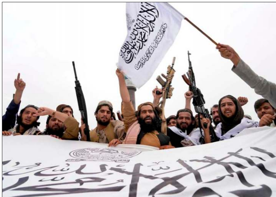
▲ Los talibanes aprovecharon la atención del aniversario para reclamar el elusivo reconocimiento de la comunidad internacional; prometieron que el suelo afgano no será usado contra otros países.

El primer ministro del Gobierno interino, el mulá Hassan Akhund, fue el primero en celebrar en un comunicado la