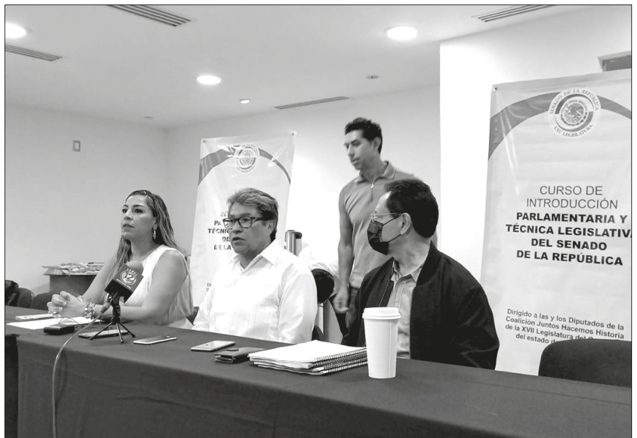
▲ En Cancún, el senador morenista presentó los detalles del Curso de Introducción Parlamentaria y Técnica Legislativa del Senado de la República, dirigido a las y los diputadas de la coalición Juntos Hacemos Historia de la XVII Legislatura.