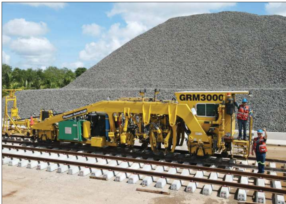
▲ Se resolvió el recurso de un ciudadano, que solicitó información en PNT.

“El recurso hoy (lunes) expuesto podríamos llamarlo de seguimiento al interés de la sociedad por transparentar todo lo relacionado con el Tren Maya, donde las autoridades responsables han faltado en su entrega. Respecto a este proyecto se han solicitado desde manifestaciones del impacto ambiental (...) entre otros”, señaló la comisionada Julieta Del Río, responsable de analizar este caso.