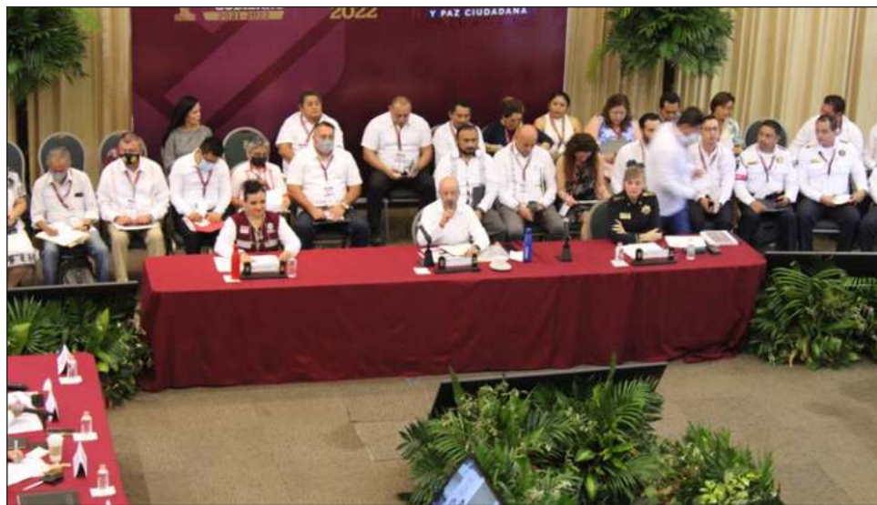
▲ Este lunes, como parte de la glosa del primer informe de Layda Sansores San Román, comparecieron los titulares de las Secretarías de Protección y Seguridad Ciudadana, Protección Civil y la Fiscalía General del Estado, que conforman la Misión 2 del gabinete estatal.