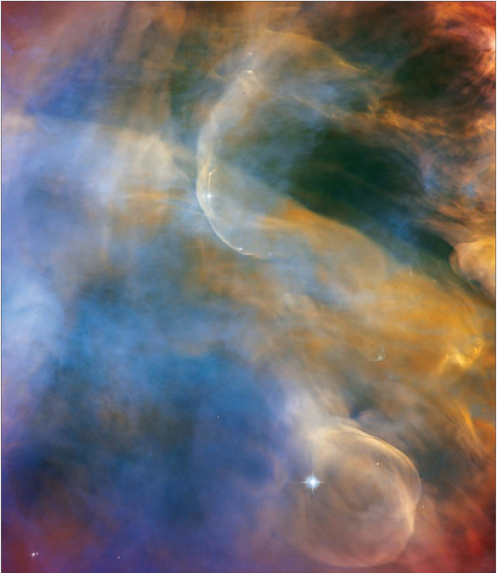
▲ Este paisaje de nubes celestiales del Telescopio Espacial Hubble de la NASA/ESA captura la colorida región de la Nebulosa de Orión que rodea al objeto Herbig-Haro HH 505. Los objetos Herbig-Haro son regiones luminosas que ro-

dean a las estrellas recién nacidas que se forman cuando los vientos estelares o emanaciones gaseosas de estas estrellas infantiles crean ondas de choque que impactan con el gas y el polvo cercanos a altas velocidades.