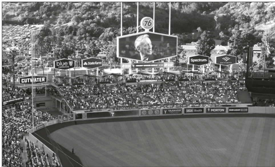
▲ La pantalla gigante del Dodger Stadium muestra la imagen del fallecido locutor Vin Scully, durante un homenaje previo a un juego el pasado viernes 5.

Los primeros dos conjuntos en cada circuito no disputarán la primera ronda. El tercer preclasificado enfrentará al sexto