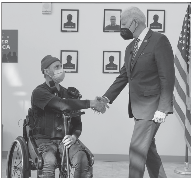
▲ "The president Biden and his party must unite and go for the Republicans' jugular rather than for each other's".

POST-COVID INFLATION is a global phenomenon, as are high gasoline prices. Demand is too high; labor is tough to get, and goods are unavailable. While it is not 100% Biden, all governments and central banks bear responsibility for poor monetary policy and for not acting quickly enough to cut spending and raise interest rates.