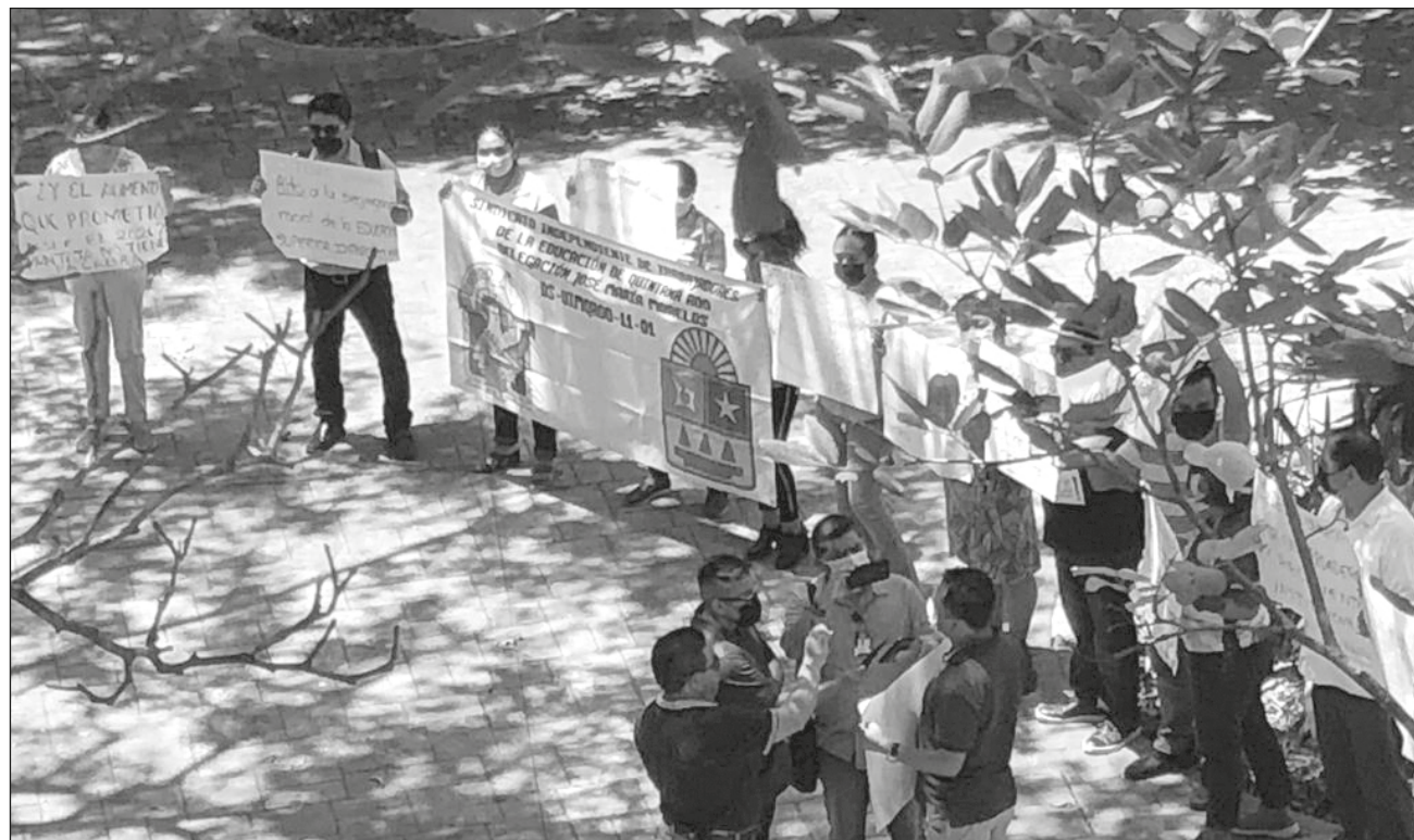
▲ “La Uimqroo está de lucha” y “Maestros luchando, estamos enseñando” fueron algunas de las consignas que corearon los manifestantes en las instalaciones de la casa de estudios, en el municipio de José María Morelos.

Solicitan también la participación de personal de alto cargo en el gobierno para revisar y firmar las condiciones