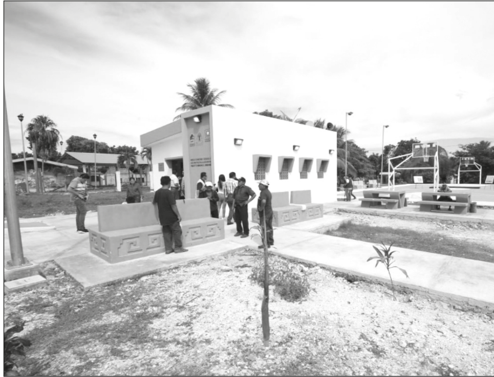
▲ En la comunidad La Pimientita, autoridades estatales y municipales supervisaron la construcción del módulo comunitario y cancha de usos múltiples.

Este evento se realizó en la Universidad Intercultural Maya de Quintana Roo, con