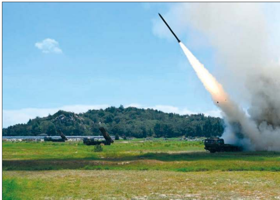
▲ China ha enviado aviones de combate y buques militares al otro lado de la línea central del estrecho de Formosa, que ha sido por mucho tiempo una separación entre las regiones.

Los ejercicios chinos de las dos semanas anteriores hicieron que Taiwán pusiera a su ejército en alerta, aunque la población los recibió principalmente con actitud