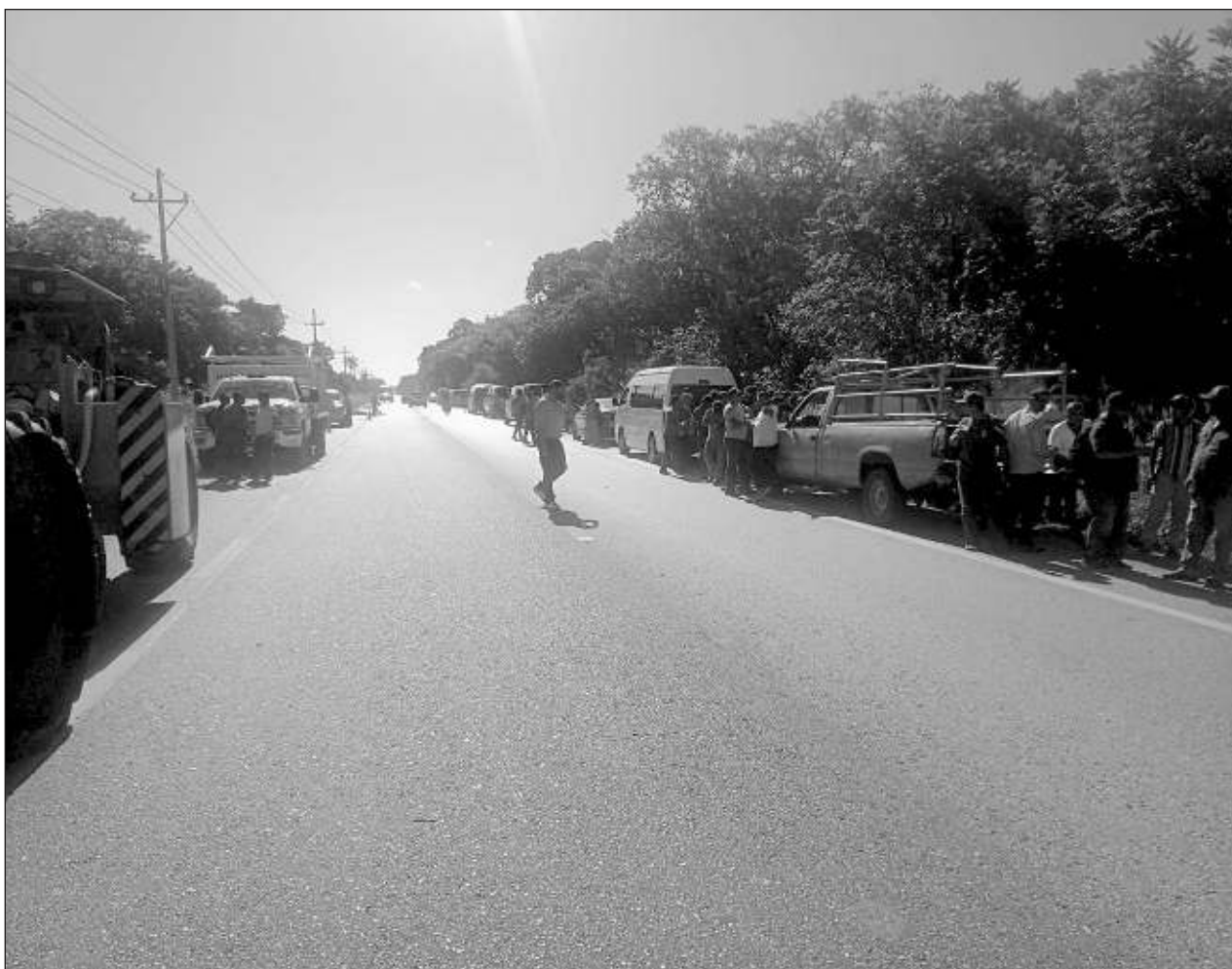
▲ Aproximadamente 30 personas, vecinas de la península de Atasta, bloquearon la carretera del Golfo, alegando que la empresa Constructora Sangor desplaza la mano de obra local, cuando la zona tiene un alto índice de desempleo.