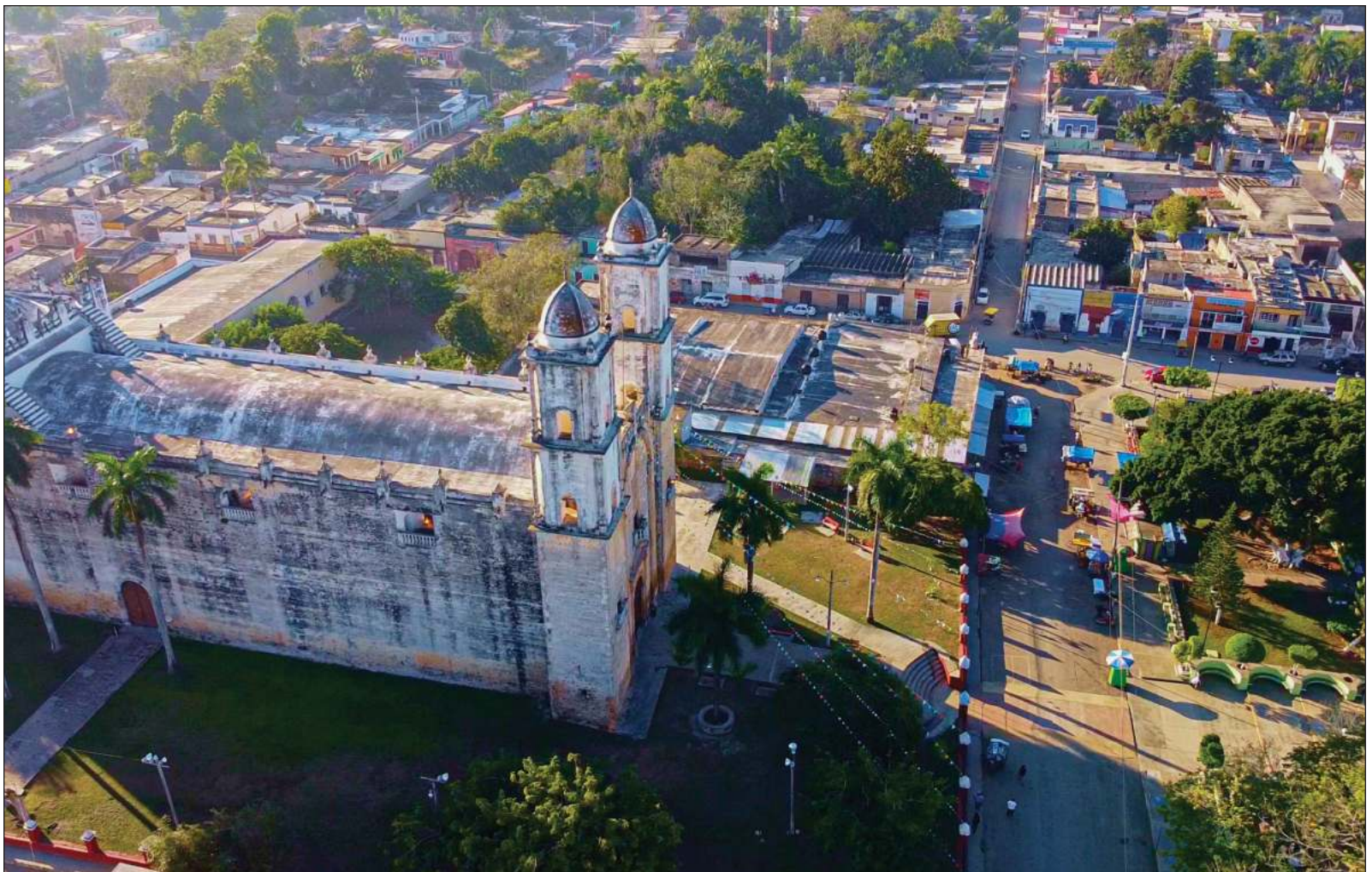
▲ Peto tiene “una población cuya historia se asocia con la llamada Guerra de Castas, pero en época previa constituyó la parcialidad de un señorío prehispánico y luego un lugar de encomienda, figura institucional que acentuó el despojo implantado con la presencia de conquistadores europeos”.