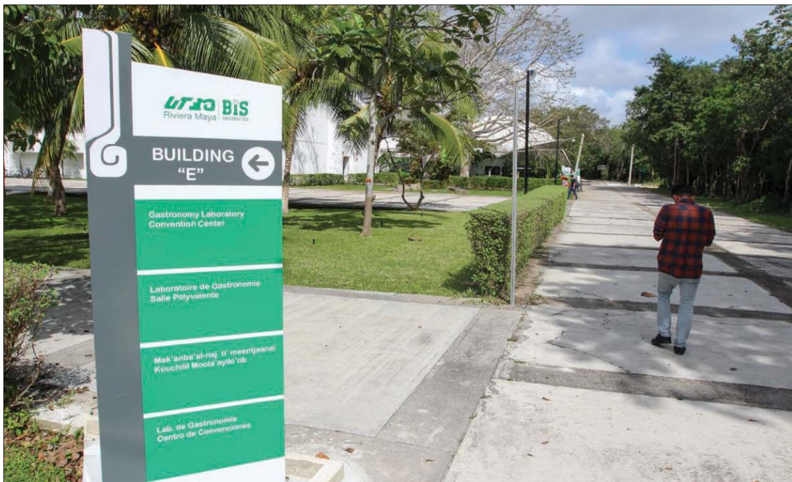
▲ “¿Es la educación el elemento más importante para el desarrollo cuando la situación financiera del estado no pasa por sus mejores momentos?”