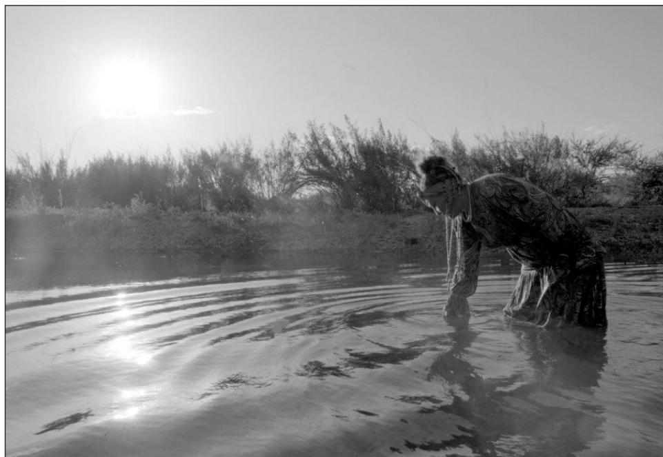
▲ La serie Diáspora , es relatada en siete capítulos con fotografía en blanco y negro.

La dirección y producción ejecutiva de la serie