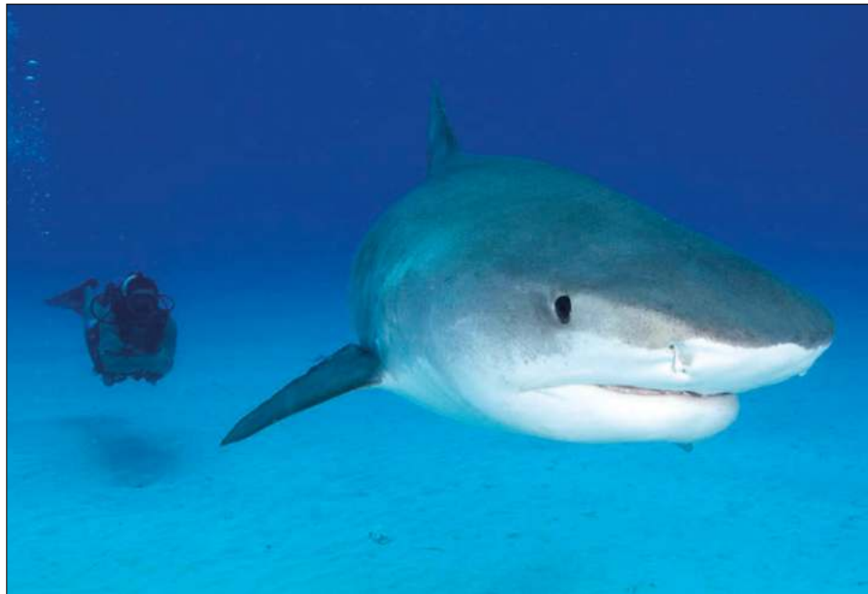
▲ La estrategia de aprovechamiento tiene como objetivo frenar la pesca de tiburón en Quintana Roo y generar alternativas y acciones para su aprovechamiento sustentable.

La sinergia entre los pescadores de Isla Mujeres