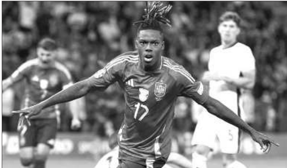
▲ Nico Williams celebra tras anotar el primer gol de España en la final de la Eurocopa.

“Probablemente este es el torneo más difícil que ha logrado la selección sin ninguna duda”, dijo Rodri. “Se hablaba de que el lado