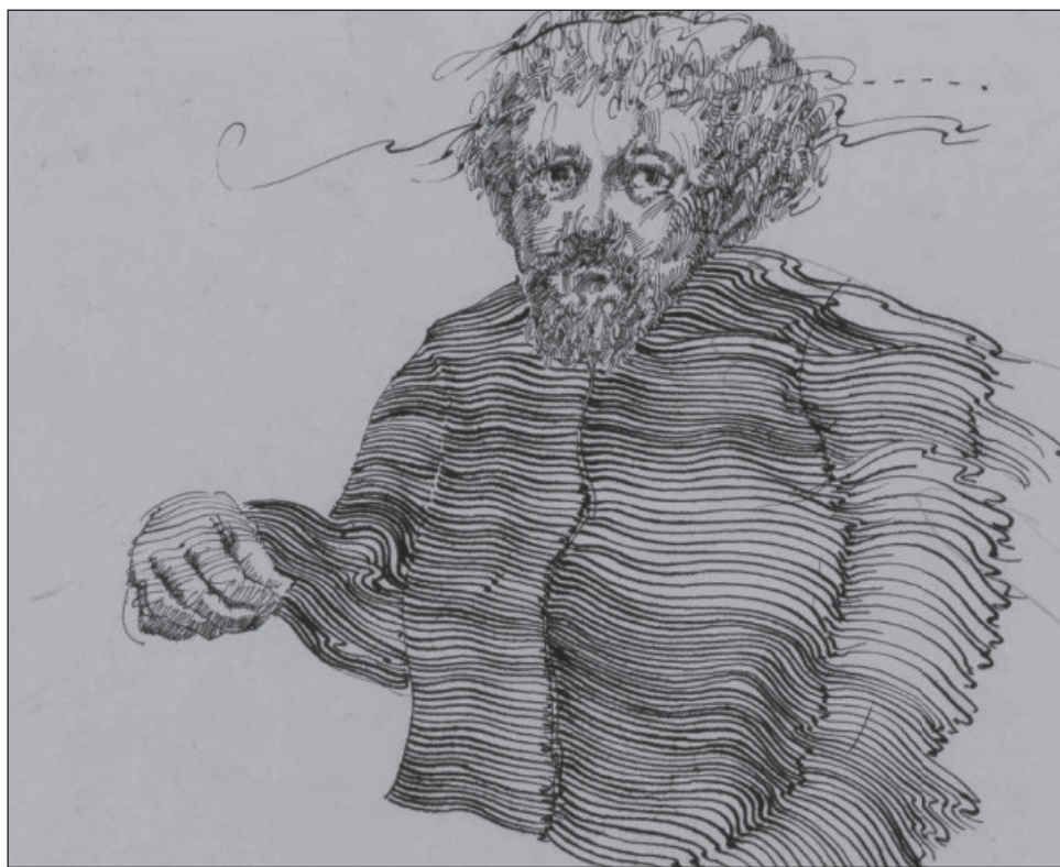
▲ Los 46 dibujos realizados entre finales de la década de 1960 y principios de los 70.