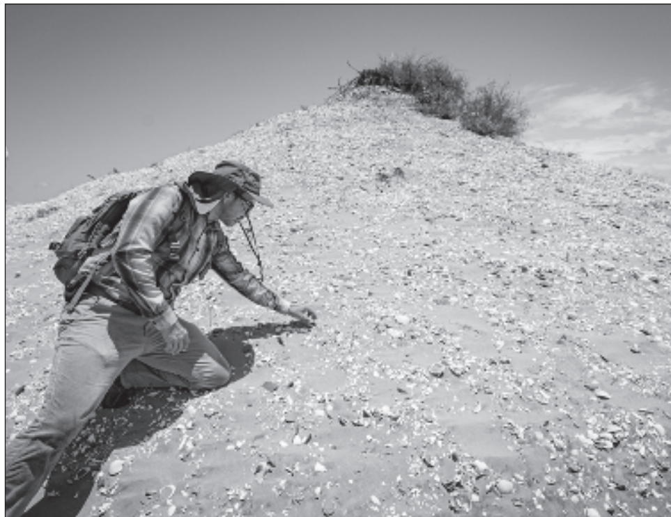
▲ El edil Ahumada Quintero manifestó que buscará el respaldo del gobernador Rubén Rocha Moya para que se destinen recursos con el fin de respaldar la iniciativa y dar relevancia a los trabajos arqueológicos que servirán para localizar más sitios.

En su exploración en el sitio costero localizó vestigios que podrían ser urnas funerarias, fragmentos de cerámica de barro y grafiada (grabados bajo relieve), algunos con las característica del Sitio 117 de Chorohui, de tipo bicromática y policroma, que datan de 700 a 1400 dC y con características de los pueblos de Sonora, de Mesoamérica y sur de Estados Unidos, donde los pobladores permanecieron hasta la llegada de los españoles.