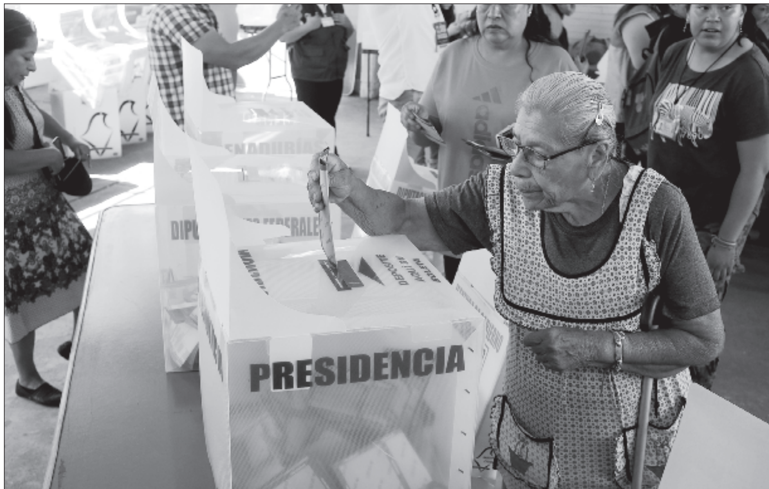
▲ "Cuando se captura la percepción de la mayoría de los votantes, es seguro que habrá un cambio de partido político en el gobierno".