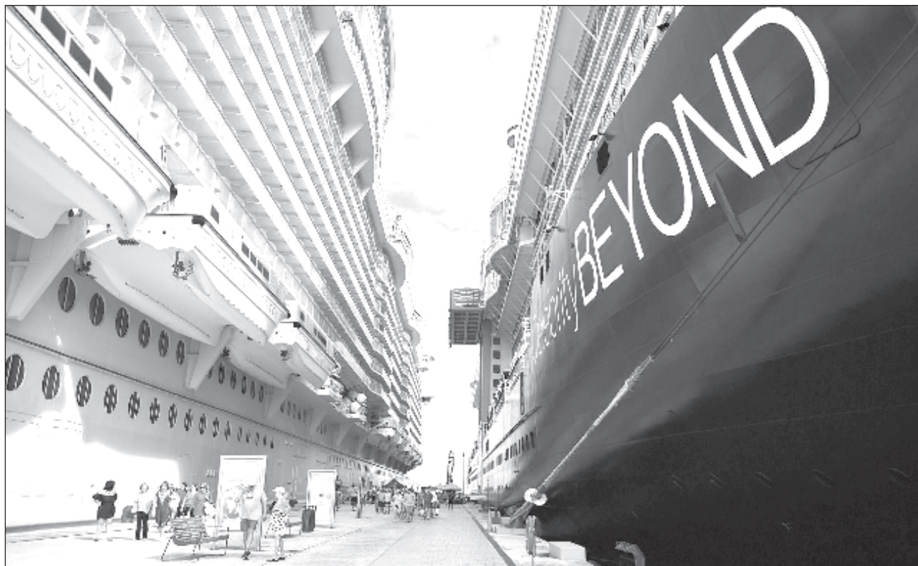
▲ La Sedetur destacó el incremento de 16.9 por ciento en la llegada de cruceristas durante abril de 2024.