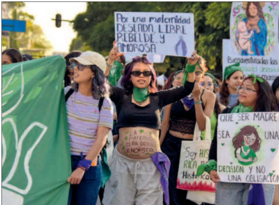
▲ Con 29 votos a favor, siete en contra y cuatro abstenciones, el estado se convirtió en el número 14 del país en legalizar la interrupción del embarazo.

La decisión fue recibida con júbilo por parte de feministas que se congregaron fuera del palacio legislativo, donde recordaron que la despenalización responde a una lucha histórica.