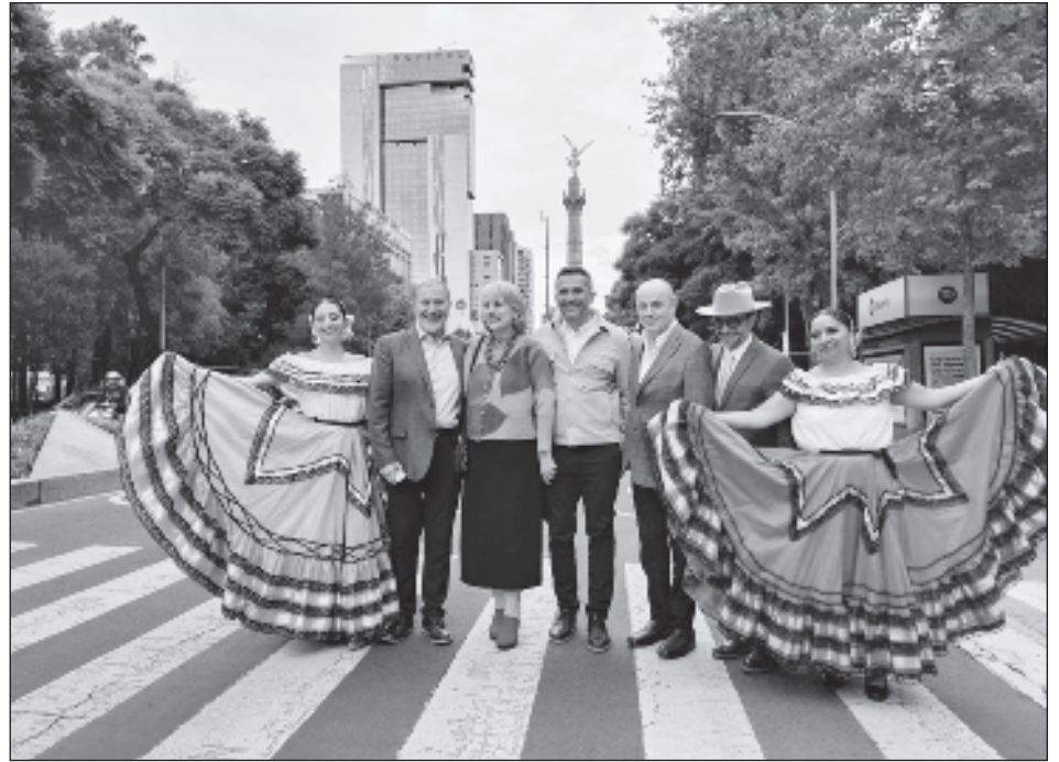
▲ En el marco de este festival, el stand de Campeche ofreció una exhibición representativa de las artesanías locales y una guía detallada de la oferta turística disponible.

El stand de Campeche en este festival ofreció una exhibición representativa de las artesanías locales y una guía detallada de la oferta