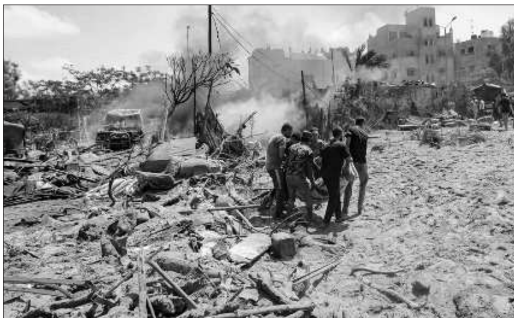
▲ Las fuerzas de ese país indican a la población los sitios en los que pueden encontrar amparo seguro y una vez que tales lugares están plétóricos de refugiados, los bombardean.

Cuando el Tercer Reich perpetró el genocidio contra los judíos de Europa, la mayor parte de la opinión pública mundial ignoraba el hecho. Hoy, en cambio, el exterminio de los palestinos en su propia tierra se realiza ante la mirada de todo el planeta; los ataques devastadores a edificios habitacionales, escuelas, hospitales, campos de refugiados y grupos de personas en plena calle se difunden en textos, fotos y videos, a veces incluso en tiempo real, y no sólo por los habitantes de Gaza, sino también por reportes de los grandes medios internacionales. Y si los horrosos crímenes de la Alemania nazi son una vergüenza indeleble para la humanidad, con mayor razón puede decirse lo mismo de la aniquilación en curso de la población palestina por el régimen israelí.