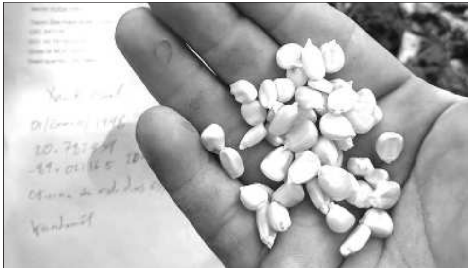
▲ El colectivo Maíz Criollo Kantunil busca garantizar alimento a las próximas generaciones.

“Conocimos el Banco de Germoplasma del Cimmyt, que tiene resguardadas muchas colectas de maíz de todo el mundo y de todas las varie-