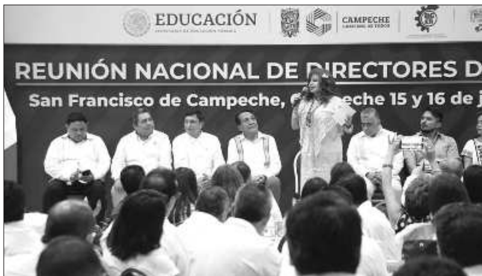
▲ La gobernadora de Campeche puntualizó que “hemos trabajado duro para llegar a la posición de ahora, y la oposición quiere recuperar lo que le arrebatamos, por eso los convoque a ponerse la camiseta y llevar el proyecto de la Cuarta Transformación a las aulas”.

Agradeció que en ese entonces, fue el gremio magisterial quien tomó la decisión de impulsar a López Obrador