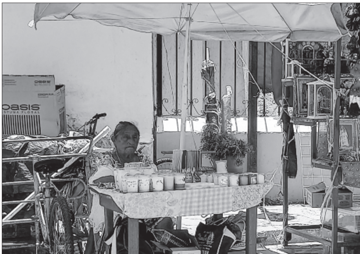
▲ Que estas líneas sirvan para visibilizar a las personas que se dedican a vender “k’exitos”. Su trabajo es crucial para la religiosidad popular en la península, ya que sirven para agradecer los favores recibidos.

LA PALABRA “K’EXITOS” , viene de la voz k’eex, que en lengua maya quiere decir trueque, cambio, permuta, canje o exvoto de acuerdo a lo que nos dice el Diccionario Maya Cordemex. Estos “k’exitos” son ofrecidos a las entidades sagradas, ya sean santos, vírgenes o cruces, en virtud del prestigio de que gozan como hacedores de milagros. En otras palabras, las personas creyentes se sirven de los “k’exitos” para solicitar un favor, protección o milagro. De tal manera que al ofrecer a la imagen venerada un k’eex con forma de pierna, la persona está pidiendo se le conceda recuperar la salud de esa parte del cuerpo; si el objeto de intercambio tiene la figura de un animal, el creyente pide la bendición para los animales del solar o de su propiedad.