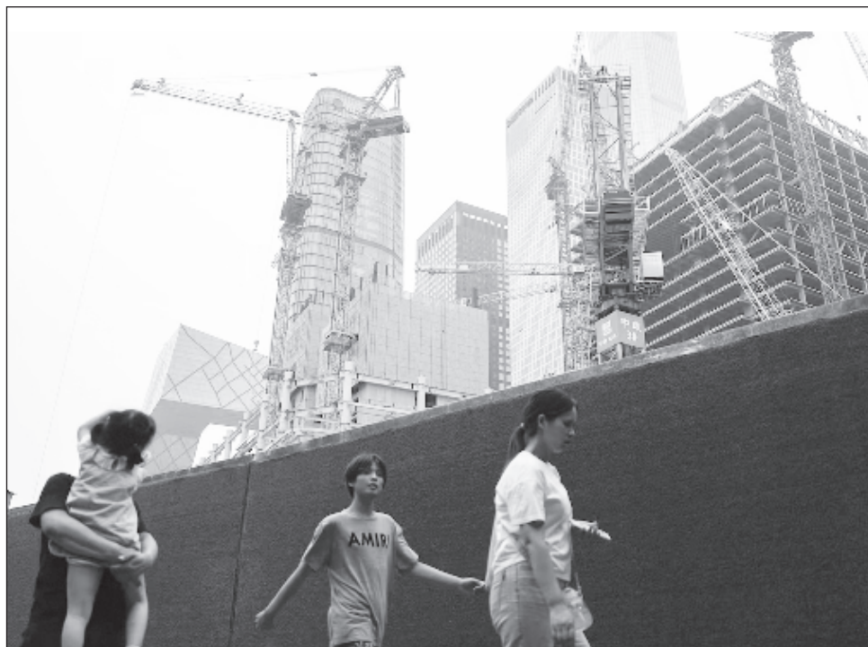
▲ China, la segunda mayor economía mundial, enfrenta una crisis de endeudamiento de su sector inmobiliario aunado con un consumo débil, una población que envejece y tensiones comerciales con Occidente.

“El PIB subió 5,3% interanual en el primer trimestre y 4,7% en el segundo trimestre”, anunció en un