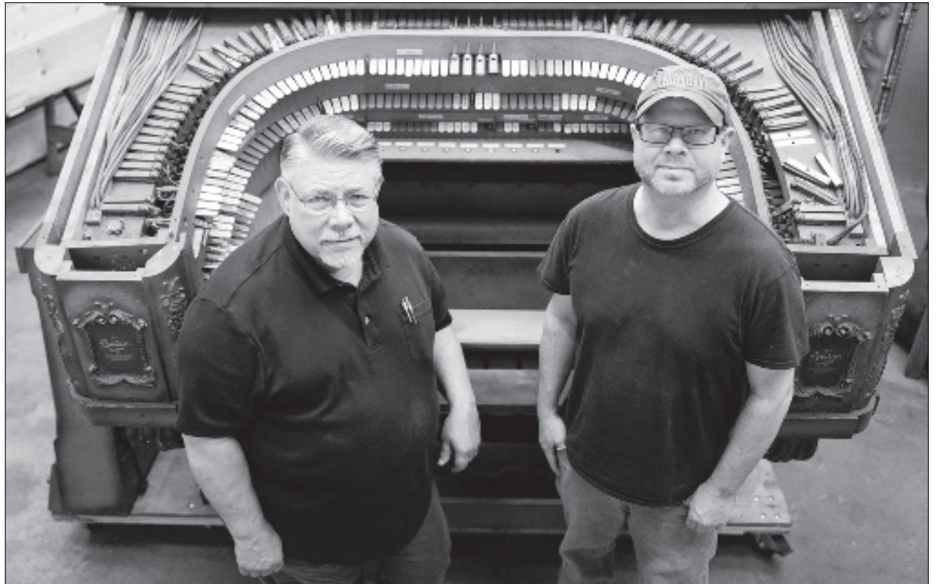
▲ El enorme instrumento, que contenía partes de más de dos metros, había sido desmantelado hasta su rescate en una subasta luego de comprarlo por unos 3 mil 500 dólares; lo desarmaron y permaneció sin ensamblarse unos 40 años.

El Barton Opus disfrutó de una buena acústica en el Teatro Hollywood, según la Sociedad del Teatro de Órgano de Detroit. Los recintos de esa ciudad en ese momento, la época dorada de la industria automotriz