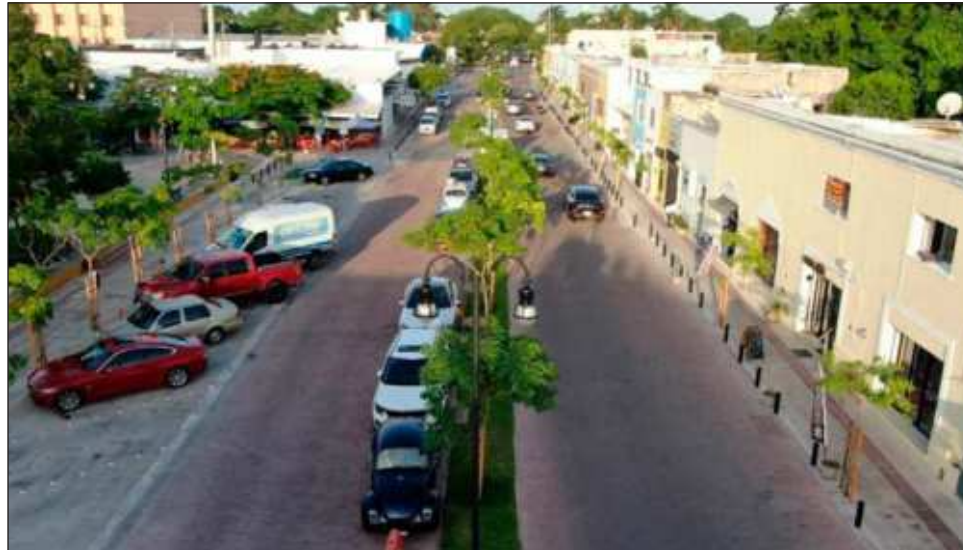
▲ El gobernador Mauricio Vila agradeció el apoyo y la paciencia de los locatarios y vecinos, quienes han respaldado las labores de construcción.

Vila Dosal dijo que este proyecto comenzó con el