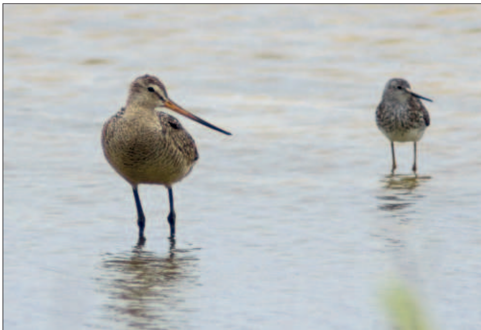
▲ La especie Limosa fedoa se distingue por su largo pico curvado hacia arriba, de color rosa con punta negra, que le permite acceder a alimentos inaccesibles para otros playeros.

Añadió que de acuerdo con el maestro en ciencias Luis Sauma-Castillo, experto en aves playeras en la península, el Picopando canelo se reproduce en el verano en Canadá y los Estados Unidos, migrando hacia el sur durante el invierno, llegando hasta las