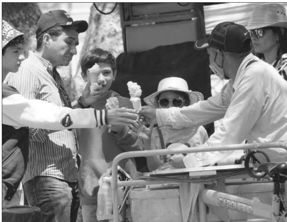
▲ En cuanto a los daños a la salud, la dependencia federal menciona que se han acumulado 670 casos, de los cuales 411 (61.3 por ciento) han sido golpes de calor.

En cuanto a los daños a la salud, la SSa menciona que se han acumulado 670 casos, de los cuales 411 (61.3 por ciento) han sido golpes de calor. La cifra equivale a un aumento de 90 por ciento con respecto a lo ocurrido a la misma fecha del año pasado, cuando fueron 58 personas afectadas y ningún deceso.