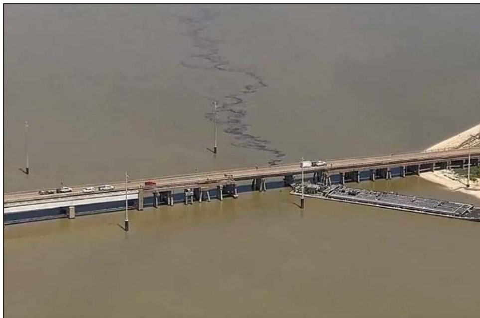
▲ El accidente del miércoles arrojó a un hombre fuera del barco y al agua, pero se recuperó rápidamente y no resultó herido, dijo la Oficina del Sheriff del condado de Galveston.

El puente que conduce a Pelican Island, al norte de Galveston, “fue golpeado por la barcaza alrededor de las 9:50 horas cuando un remolcador que salía marcha atrás de Texas International Terminals, un operador de almacenamiento de combustible al lado del puente, perdió el control de dos barcazas que empujaba”, detalló David Flores, superintendente de puentes del Distrito de Navegación del Condado de Galveston. “La corriente era muy mala y la marea estaba alta. Lo perdió”, dijo Flores.