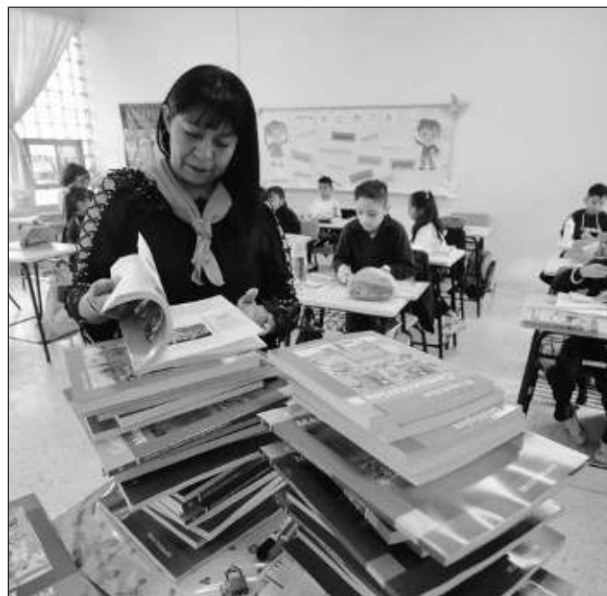
▲ No se trata de regresar a los coscorrónes, reglazos, nalgadas y golpes con el borrador, pero sí reconocer que los docentes trabajan de la mano con las familias.

Pero en México, el magisterio es una fuerza políticamente organizada y como tal es parte del engranaje corporativo del Estado mexicano. El día del maestro es parte del santoral político durante el cual se anuncian basificaciones y aumentos al salario, con retroactivo al 1 de enero. No deja de ser una injusticia hacer esperar casi seis meses al gremio,