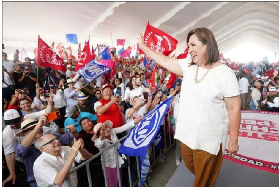
▲ La hidalguense encabezó esta el acto en Boca del Río, a un costado de esta playa veracruzana, en el acto hubo más de tres mil asistentes, la mayoría del PRI.

La hidalguense encabezó esta el acto en Boca del Río, a un costado de esta playa veracruzana. En el acto hubo más de tres mil asistentes, la mayoría profesores en activo o ju-