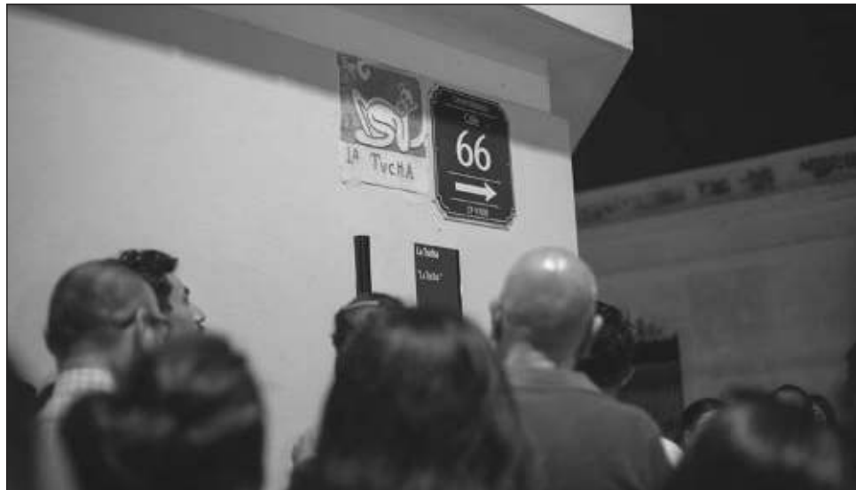
▲ El viernes la cita es a las 7 y a las 9 de la noche a partir del paso peatonal de la Calle 43, donde las actrices compartirán un repaso de los sucesos más importantes.

Este 24 de mayo se retoman estos recorridos agre-