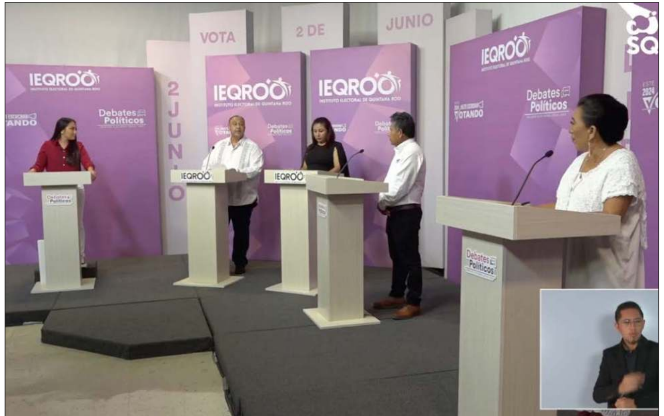
▲ Las candidaturas a las diputaciones locales y presidencias municipales del estado intercambiaron ideas desde Chetumal en lo que fue el primero de los debates organizados por el Instituto Electoral de Quintana Roo. Foto captura de pantalla

A las 19 horas fue el turno de los aspirantes a la