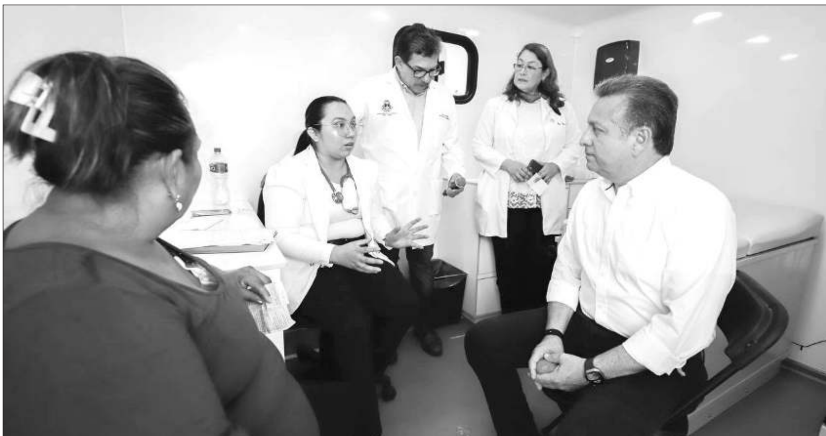
▲ El alcalde Alejandro Ruz recorrió la Feria de la Salud y saludó a ciudadanos que acudieron a realizarse estudios de presión, peso y talla.