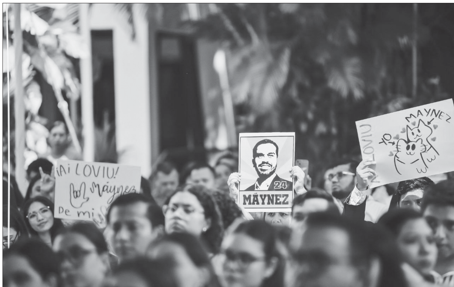
▲ "El mérito de Álvarez Máynez ha sido mantener la mesura por encima de los aspavientos y el estruendo".