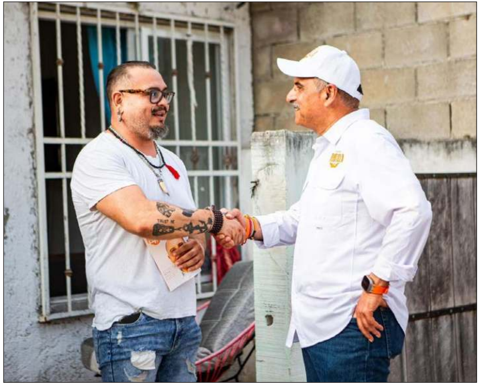
▲ El aspirante de Movimiento Ciudadano a la presidencia municipal de Tulum realizó una visita casa por casa en el fraccionamiento Guerra de Castas.

Las ciudadanas y ciudadanos, externó el candidato, se quejaron de la inseguridad, de los pésimos servicios municipales y del abandono en que se encuentran los pequeños parques del fraccionamiento.