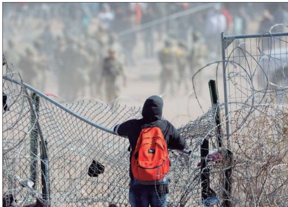
▲ La diversidad de los migrantes cruzando la frontera con EU es cada vez más grande. En 2000, los mexicanos conformaban 90% del total. Hoy día son sólo una tercera parte.

Lo que ha cambiado es el perfil de los mexicanos que buscan salir de su país. En años previos, la gran mayoría de connacionales encontrados por la Patrulla Fronteriza de Estados Unidos eran adultos viajando solos. Pero hoy día, las familias y menores de edad no acompañados son una creciente porción del total. De hecho, el número de familias mexicanas cruzando a Estados Unidos en marzo de 2024 fue más que el triple del número que cruzó en 2022. Aunque Isacson comentó que no conocía las razones específicas de este cambio tan marcado, dijo que agrupaciones humanitarias en la frontera reportan que un número abrumador de estas