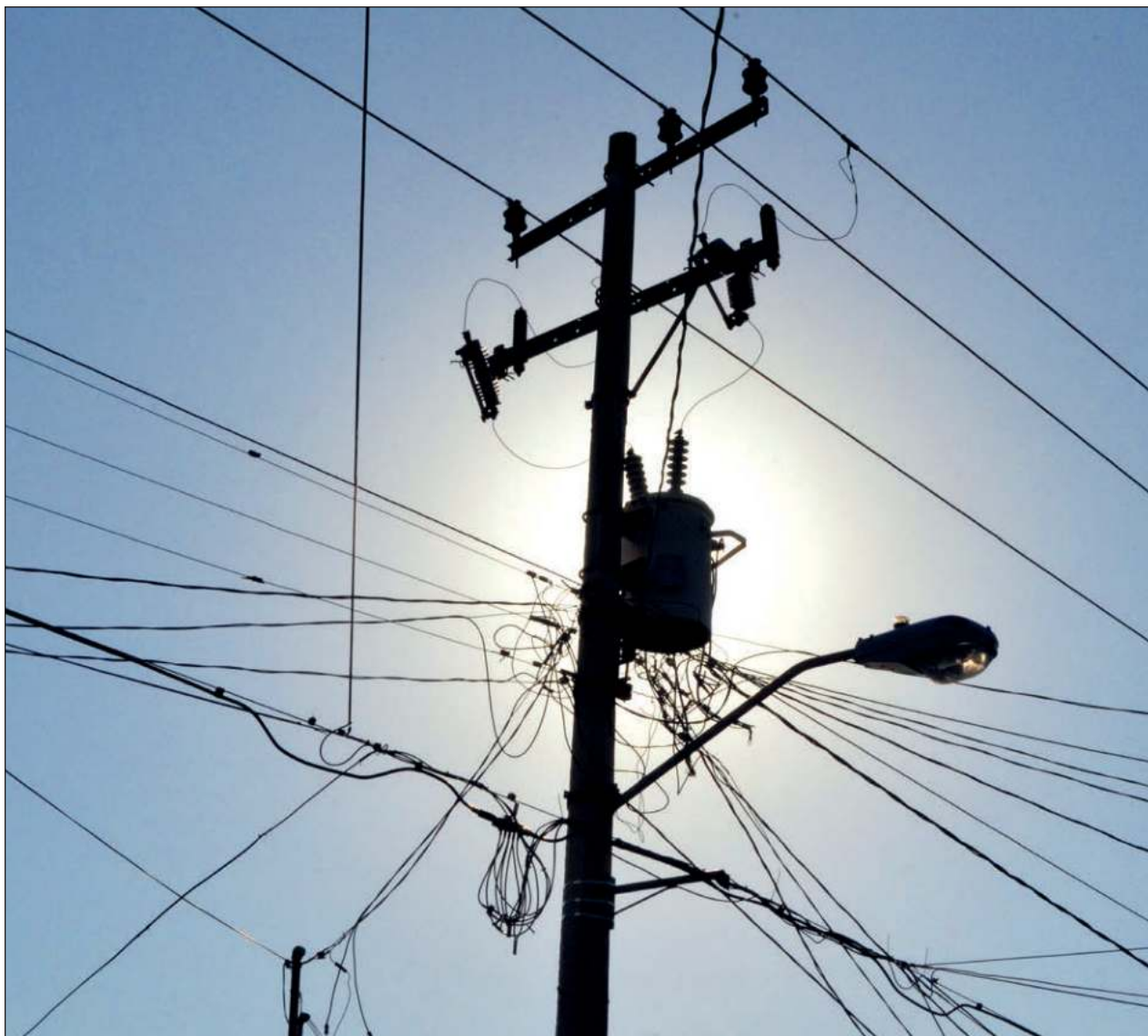
▲ Las constantes fallas en el servicio eléctrico de Carmen han provocado que vecinos inconformes bloqueen calles y avenidas de la isla, generando conflictos viales e inconformidad de los terceros afectados.

Destacó que trabajarán en una propuesta de modernización de aulas para evitar estos temas y tener a los pequeños en instalaciones adecuadas.