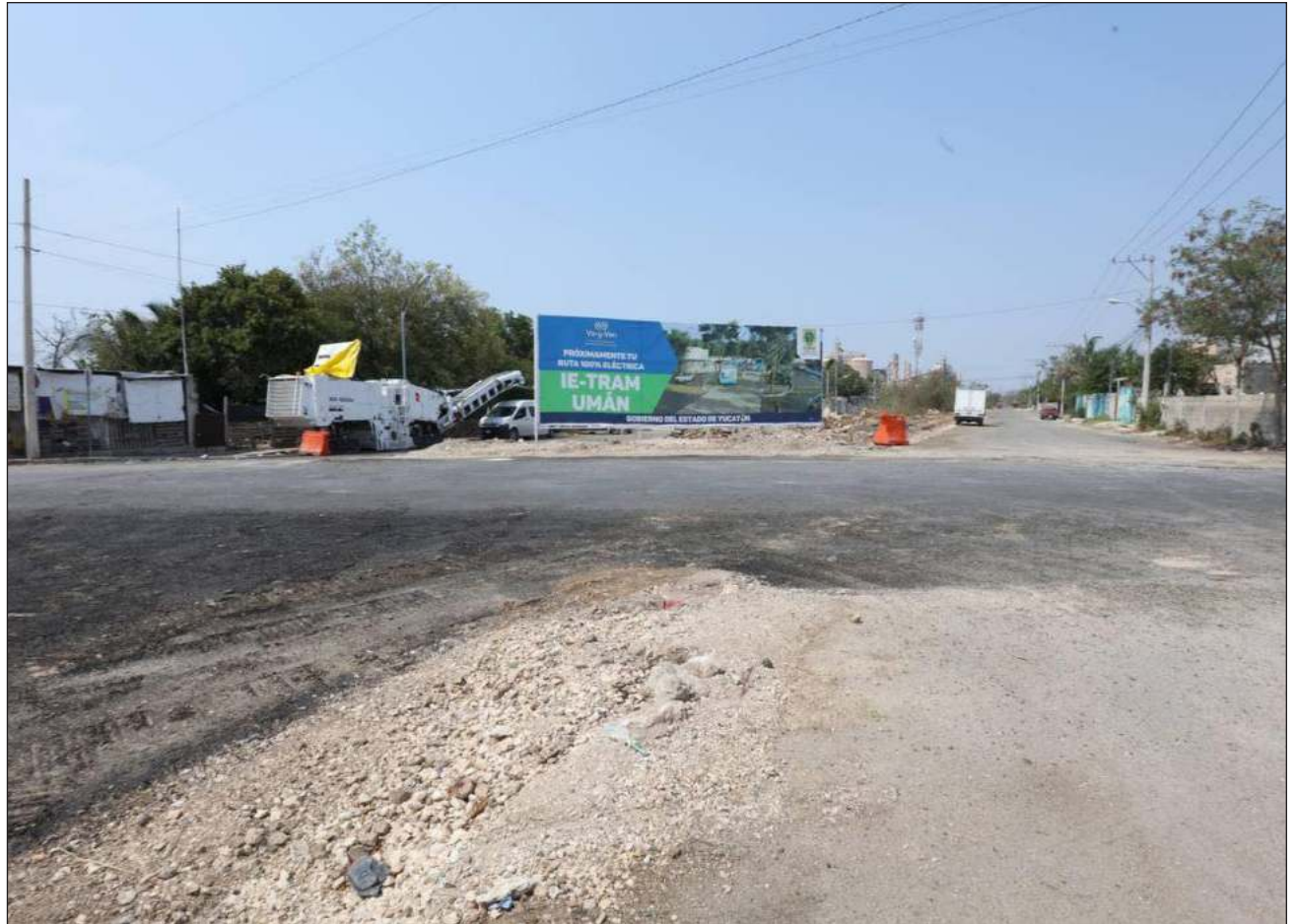
▲ El Instituto de Infraestructura Carretera de Yucatán informó que ya se comenzó esta obra que correrá desde la calle 128 de la colonia Ciudad Industrial hacia el Anillo Periférico, paralela a las antiguas vías del ferrocarril.

Aunado a ello, se mejorará la eficiencia del transporte público al liberar el tránsito y reducir las emi-