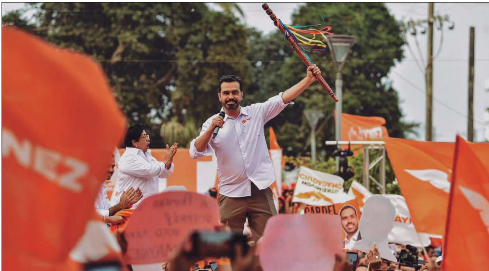
▲ "El siempre tramposo Alito ofrendaría sus cargos a fin de que el citado Álvarez Máynez cumpliera su propuesta-garlito de declinar a favor de Xóchitl Gálvez".