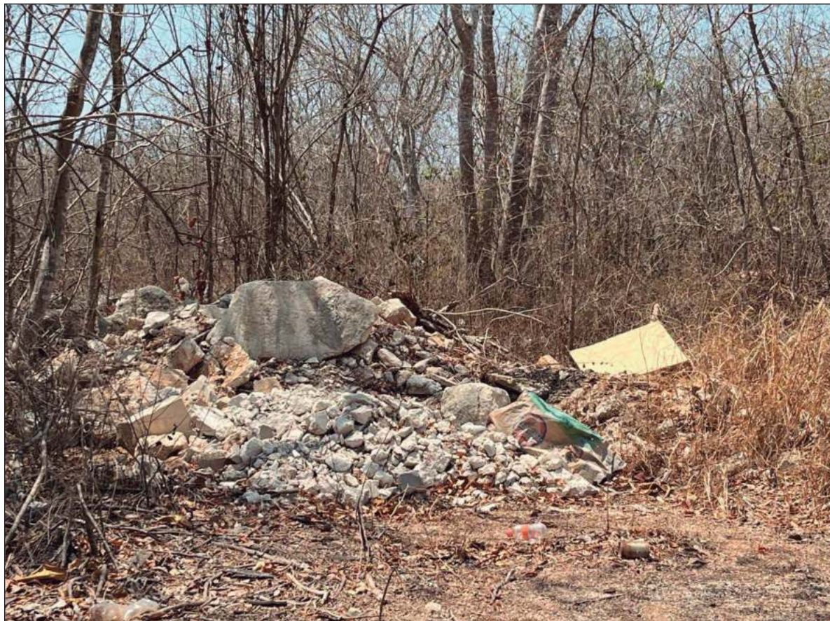
▲ “Existen desechos en estas comisarías, que no deberían encontrarse en estos terrenos baldíos, ya que tenemos un sistema de recolección de basura concesionado que es bastante eficiente”.

Por otra parte, están los desechos de los alimentos de los trabajadores de la construcción, como platos desechables, también de EPS, bolsas plásticas en las que se les entregan estos platos con los alimentos. Además, consumen alimentos chatarra, salados y dulces y refrescos, todos los anteriores