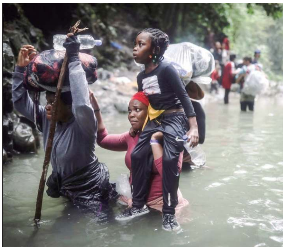
▲ De acuerdo con la Unicef, de esos 30 mil menores de edad, cerca de 2 mil llegaron a Panamá solos o separados de sus familias, el triple que en el primer cuatrimestre de 2023.

El Tapón del Darién, una frontera selvática de 266 km de longitud y 575 mil hectáreas de superficie, se ha convertido en los últimos años en