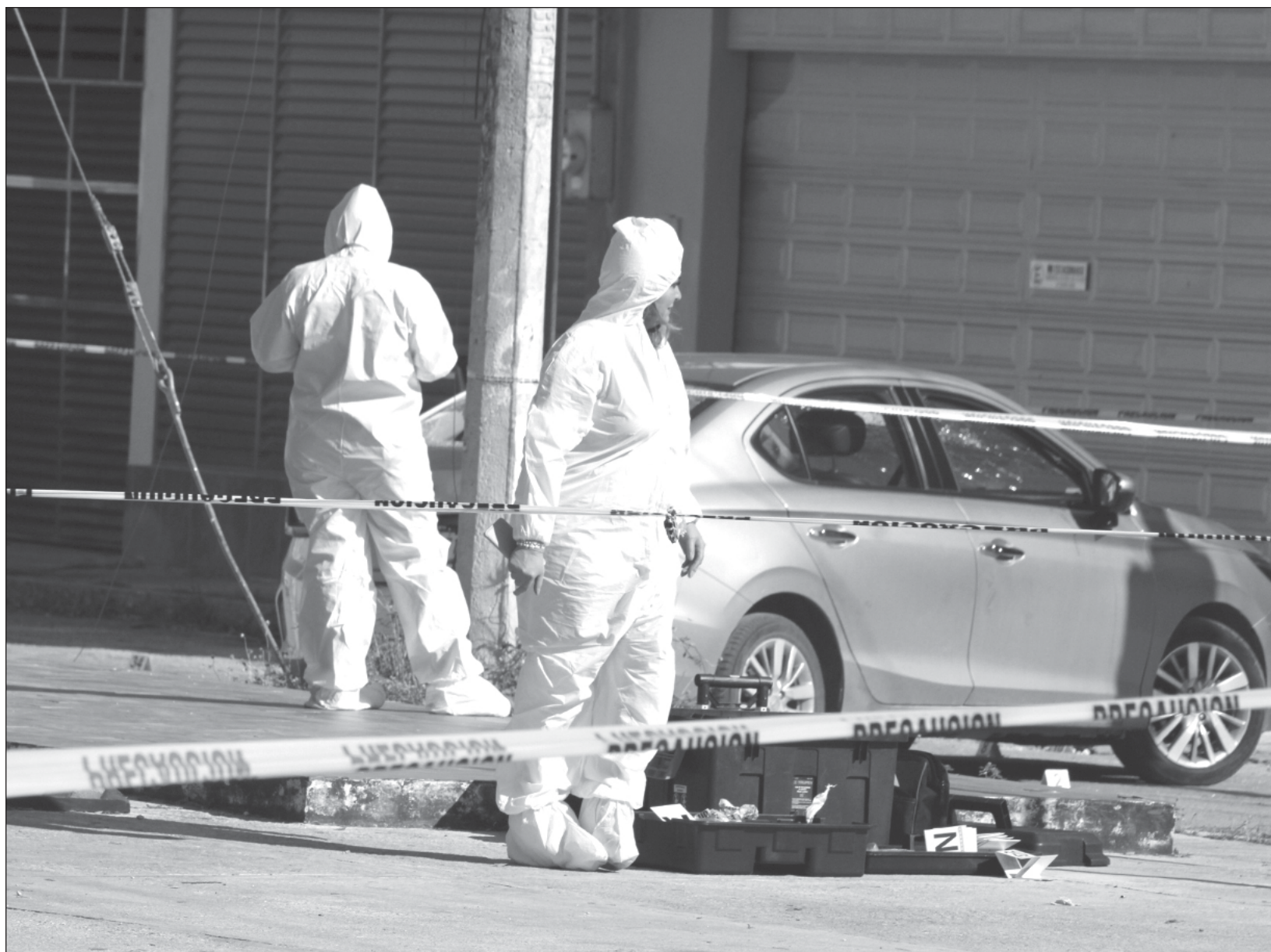
▲ A nivel nacional hubo una disminución en feminicidios, robo a casa habitación y a transporte, pero aumentó 4.5% la incidencia delictiva total.

A nivel nacional hubo una disminución en feminicidios, robo a casa habitación y a transporte, pero hubo un aumento de 4.5 por ciento en la incidencia delictiva total, el mayor aumento fue en homicidios dolosos, de 7.4 por ciento, lo que representó 2 mil 622 muertes.