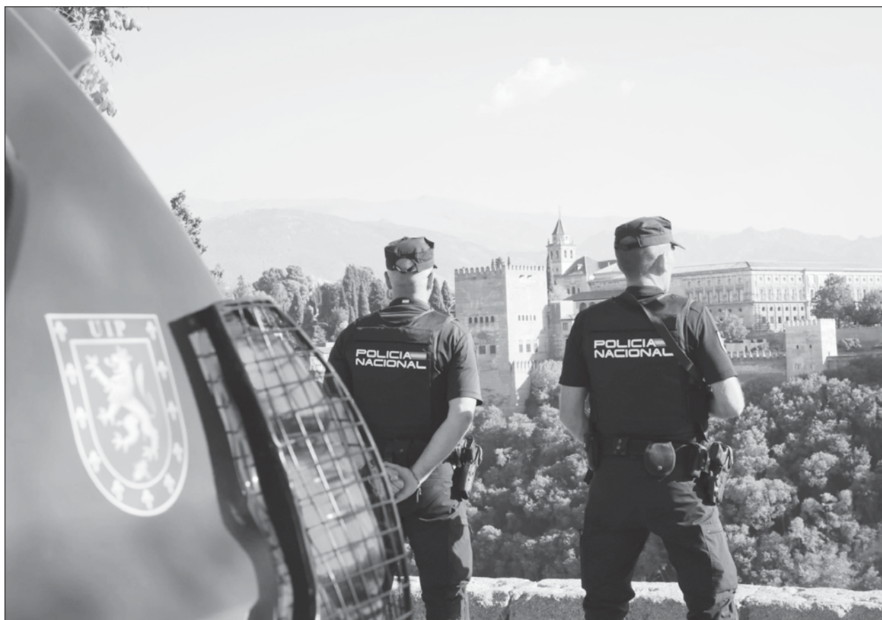
▲ Según dieron a conocer en un comunicado, los agentes españoles consideran que a partir de esta intervención se da por "desarticulada" la infraestructura en España del cártel mexicano.

Se observaron fuertes disparidades regionales: mientras que en los estados de Nebraska, Kansas y Maine se registró un descenso de las muertes de 15 por ciento más, en los estados de Washington, Alaska y Oregón, todos ellos situados en el oeste de EU, se vio un aumento de 27 por ciento.