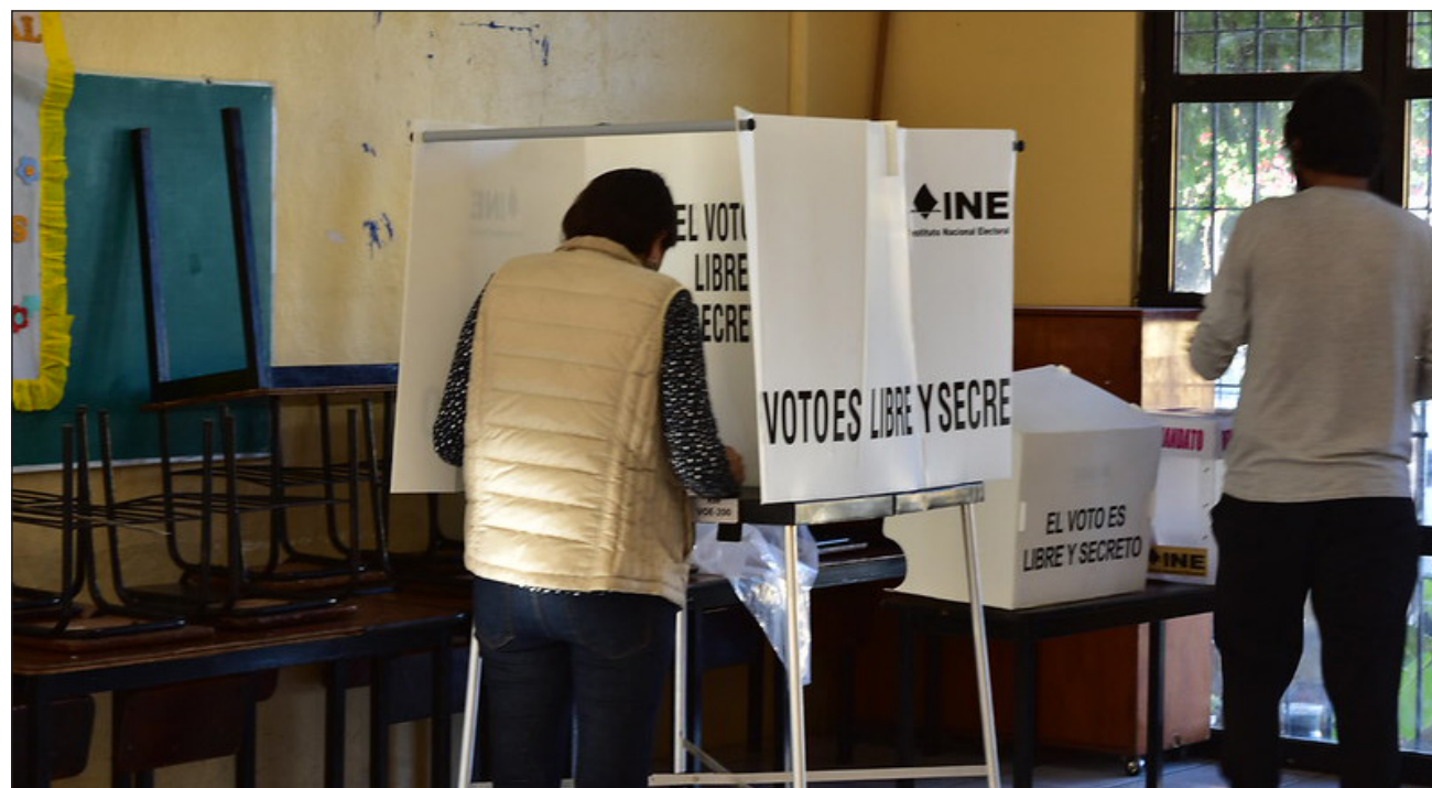
▲ La candidata a diputada por el PAN, subrayó que “en todas las comunidades del séptimo distrito, los pobladores coinciden en la necesidad de mejorar los servicios de salud, pues hay carencias en los medicamentos e insumos, y en algunos otros lugares faltan médicos”.

Bajo ese argumento, aseguró que de ganar, una de sus primeras propuestas será la creación del Seguro Popular Campechano, que ofrecerá los servicios mé-