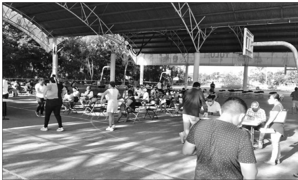
▲ Este martes aplicaron a personas de 30 a 39 años de edad la tercera dosis de refuerzo del fármaco AstraZeneca.

Indicó que también estarán aplicando vacunas de refuerzo a personas mayores de 40 años en adelante que no recibieron la tercera dosis en jornadas pasadas. "Hoy la jornada empezó a