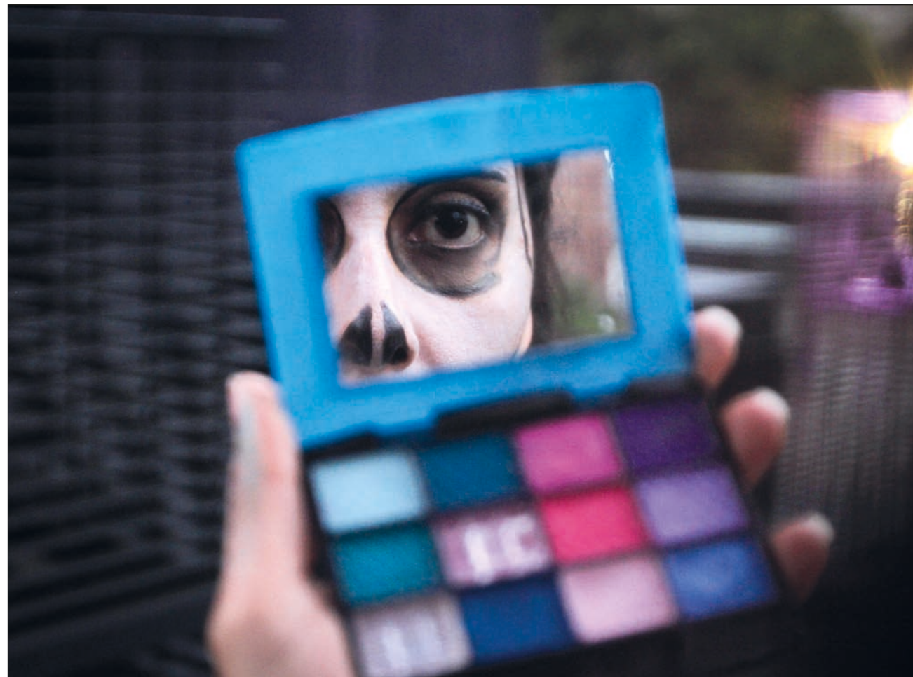
▲ Se piensa que Yucatán es muy seguro porque tiene pocos homicidios en la vía pública, en comparación con otros estados del país, sin embargo, la violencia ocurre dentro de las casas y afecta más a las mujeres.

“Sí es una cifra alarmante, sobre todo pen-