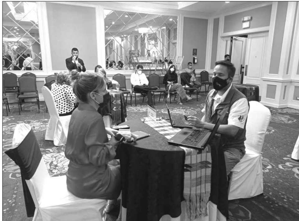
▲ Mediante una rueda de negocios, touroperadores de ambos destinos intercambiaron contactos para fomentar el turismo entre Mérida y la Ciudad de Guatemala.

La semana pasada se realizó un viaje de familiarización entre ambos destinos, que forman parte de la nueva ruta aérea Mérida-Guatemala que TAG Airlines inaugurará en abril próximo. En él, tanto los empresarios