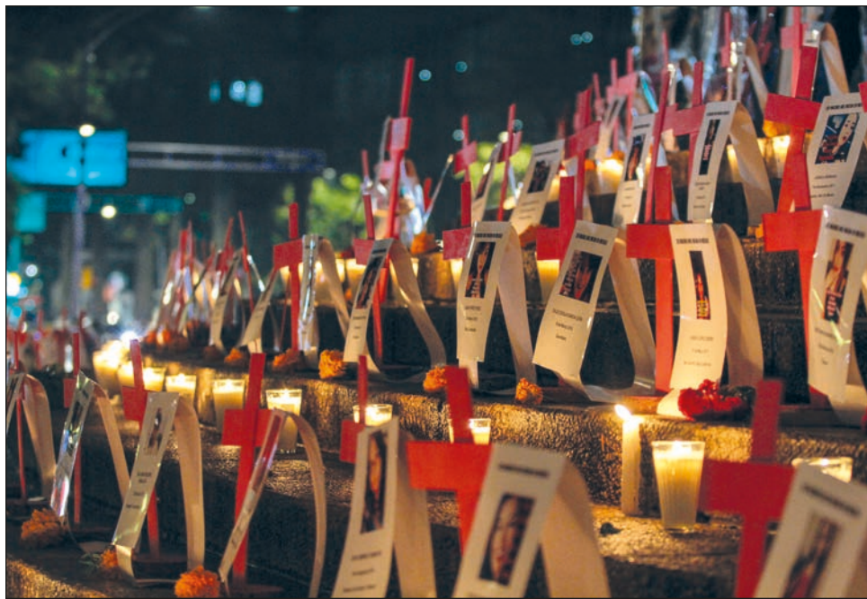
▲ Ichil xaak'al beeta'an tumen u múuch'kabil Data Cívicae', ila'abe' u 1.8 por siientoil kolele' yaan Méxicoe' tí' kaja'an tu lu'umil Yucatán, le beetike' ku múuch'ul u 4.25 por siientoil tí' tuláakal ko'olel saatal ich mexikoil lu'um.

Montserrat Pérez tu ya'alaj xane', kéen jo'op'ok u beeta'al xookil yóok'lal le