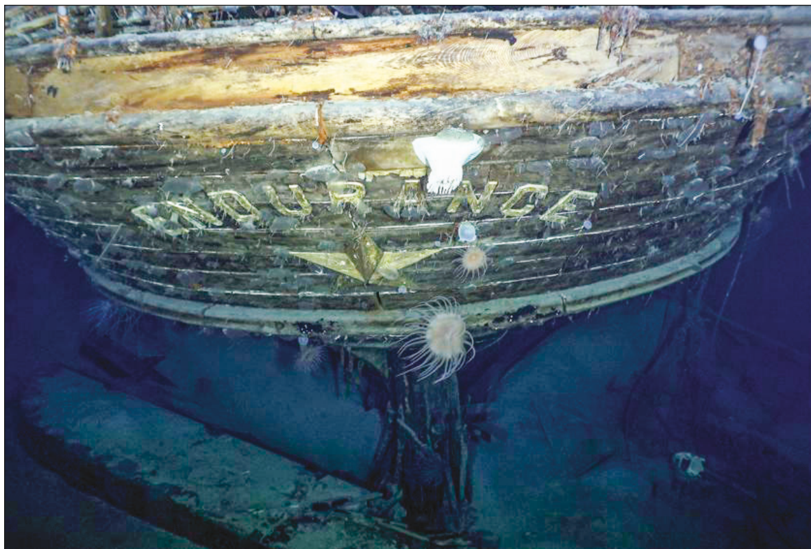
▲ El Endurance , danzando con las corrientes submarinas, recorrió unos 7.5 kilómetros desde el punto del que se hundió, hace ya un siglo.

Después de navegar cientos de kilómetros, arañando ya su destino —y la gloria— el hielo se convirtió en infranqueable barrera y aprisionó con sus heladas garras al barco y a su tripulación. Pasaron meses en esa cárcel helada, de inhóspita blancura, esperando el salvoconducto del sol y el deshielo, lo que la providencia les negó. En la oscuridad total sólo el “Señora Chippy” podía ver, con sus eléctricos ojos amarillos, que aún se acercaba lo más difícil de la misión. El barco tenía una tripulación de 28 hombres, y había 69 perros, todos destinados a tirar trineos. En ese naufragio helado, una san bernardo tuvo una camada de cuatro. Mientras los animales nacían, la presión del hielo