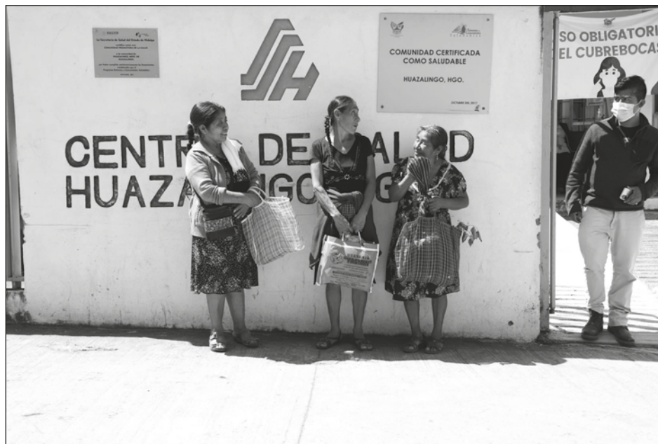
▲ La población indígena tiene derecho a recibir el servicio médico en su lengua y el Estado debe garantizar el acceso a traductores.

“En los hospitales generales y regionales del Estado, que traten población indígena, se deberá garantizar, de manera progresiva, la asistencia de cuando menos un traductor de las lenguas náhuatl, hñahñu, otomí, tepehua, tenek y pame dentro de las áreas de atención médica y trabajo social que