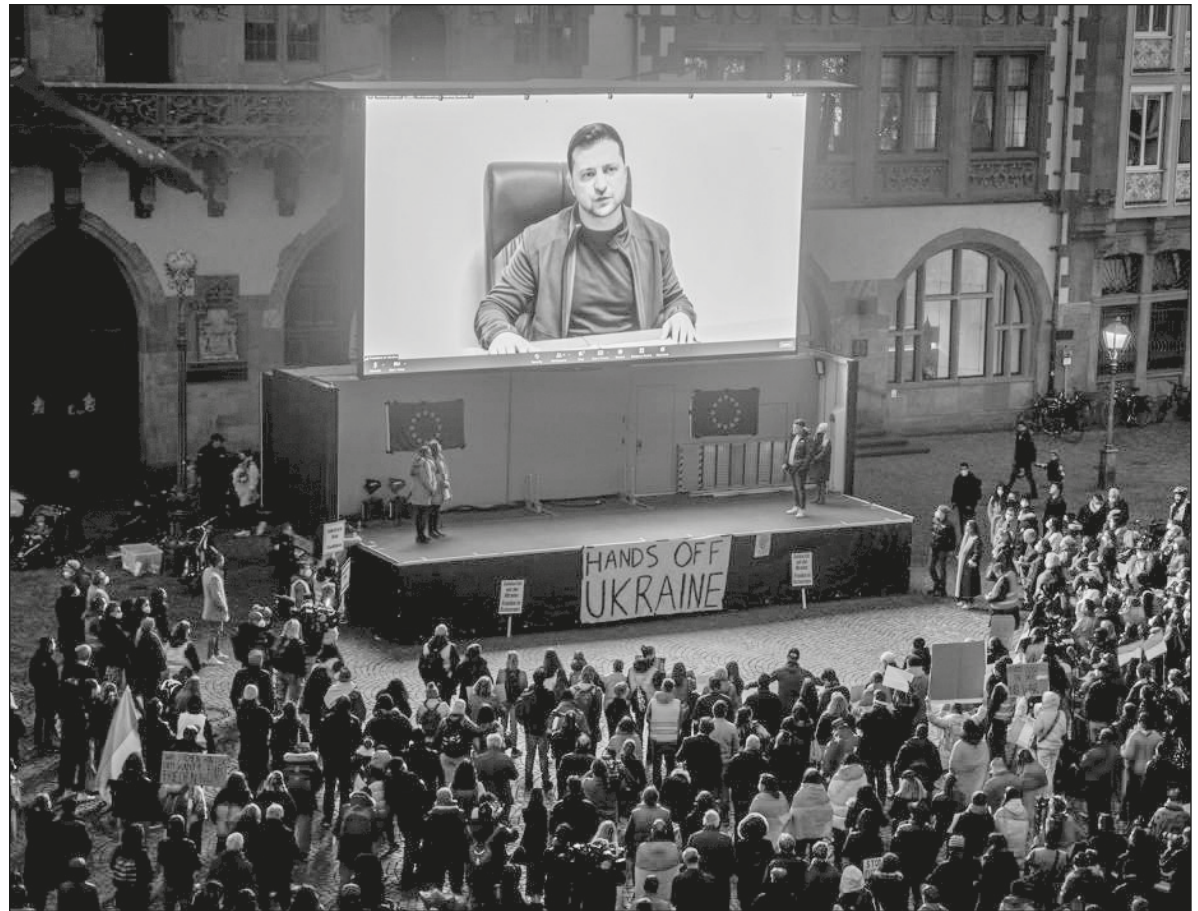
▲ In a world of fake news, Zelensky has managed to touch the emotions of a worldwide audience.

A TRAINED ACTOR , director, and scriptwriter, Zelensky appears to have been born for this moment in his country's history. One commentator referred to him