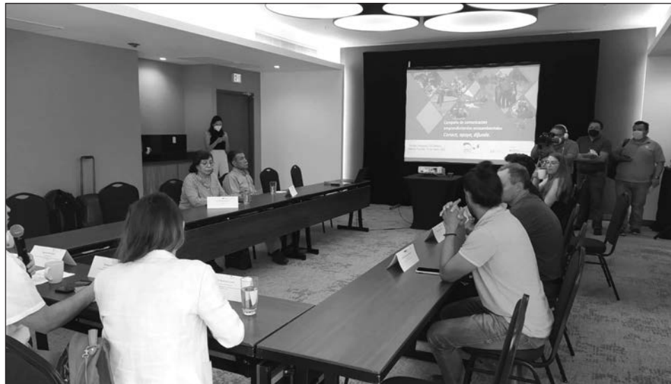
▲ Este martes 15 de marzo, representantes de cinco proyectos sociales de diversas partes del país, participaron en el taller: Comunicar la acción climática para un financiamiento sostenible .

Este martes 15 de marzo, representantes de cinco proyectos sociales de diversas partes del país, participaron en el taller: Comunicar la acción climática para un financiamiento sostenible: ¡Conoce la campaña de emprendimientos socioambientales! , organizado por la Alianza Mexicana Alemana de Cambio Climático de la Cooperación Alemana