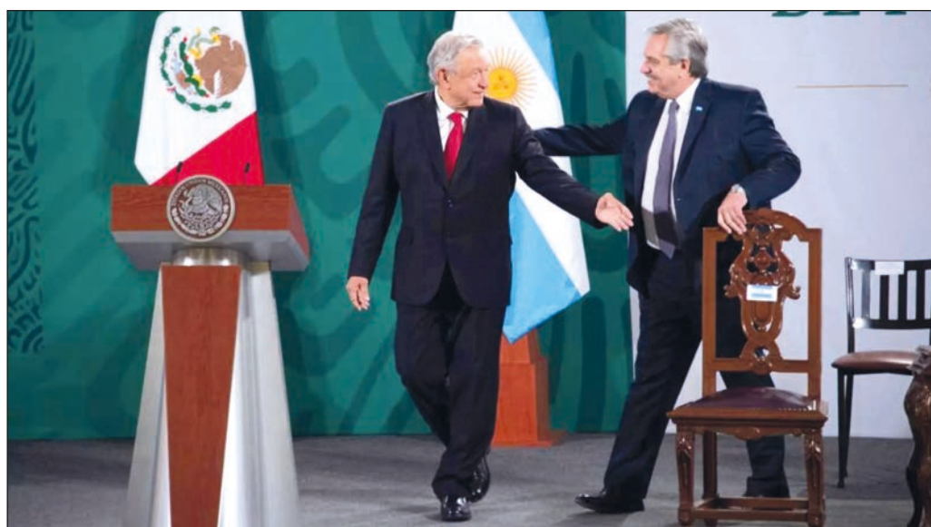
▲ Hoy día parece imprescindible retomar el impulso integrador regional, liderado por México, Brasil y Argentina, para introducir un aliento democratizador y de justicia social.

En lo inmediato, y por muchas razones, cabe esperar que el veterano líder obrero brasileño logre alcanzar de nueva cuenta la presidencia de su país y las tres mayores economías latinoamericanas sean encaminadas por gobiernos progresistas.