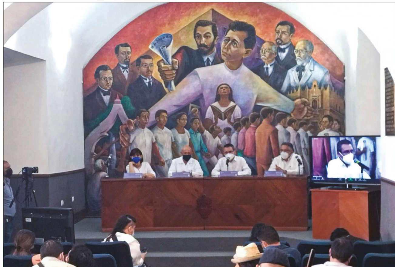
▲ Las actividades presenciales se llevarán a cabo en el Centro Cultural Universitario de la UADY y en otras sedes que se darán a conocer próximamente.

Como es costumbre, durante la Filey se entregarán los premios Excelencia en las Letras José Emilio Pacheco, en colaboración con UC-Mexica-