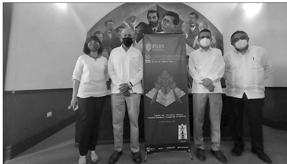
▲ La Secretaría de Cultura apoyará con los espacios a su cargo como la biblioteca Manuel Cepeda Peraza y el Teatro Peón Contreras.