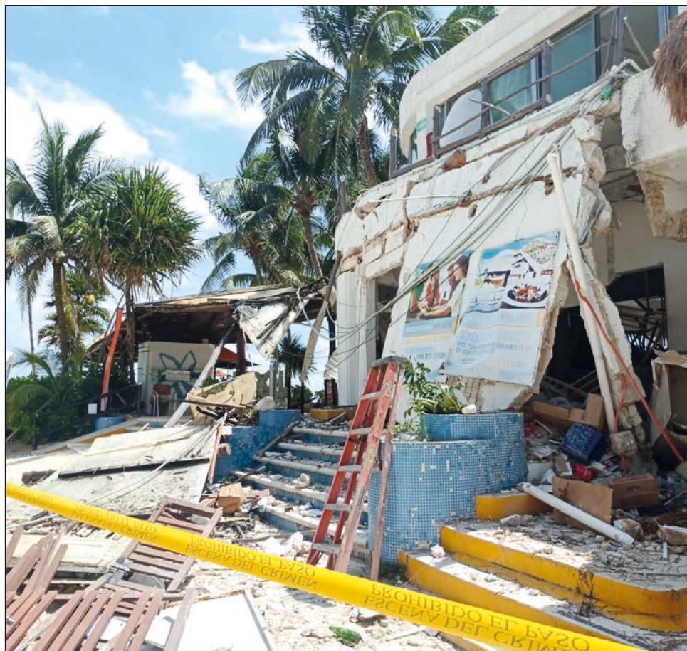
▲ Alguien dejó abierta la llave de gas de uno de los hornos de la cocina, lo que ocasionó la detonación que dejó dos muertos y una veintena de heridos.

“Todo apunta a que fue un error humano por la acumulación de gas en el área de la cocina, alguien dejó abierta la llave del gas o no cerró bien alguna válvula de gas del horno y quedó contenido esa cantidad de gas que generó la explosión al abrir o provocar la reacción en cadena”, precisó.