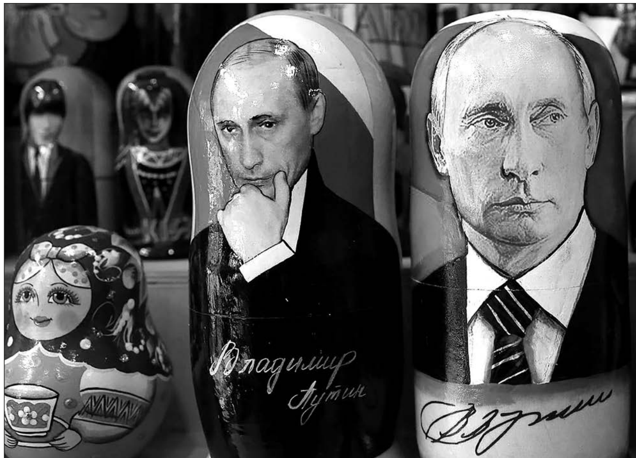
▲ El anuncio de Moscú se dio a conocer durante el pleno extraordinario que celebra la Asamblea Parlamentaria del Consejo de Europa en el que se va a someter a votación una declaración para instar a Rusia a retirarse.

Una cumbre de la OTAN programada desde hace mucho tiempo en Madrid en junio analizaría los cambios de largo plazo en la alianza.