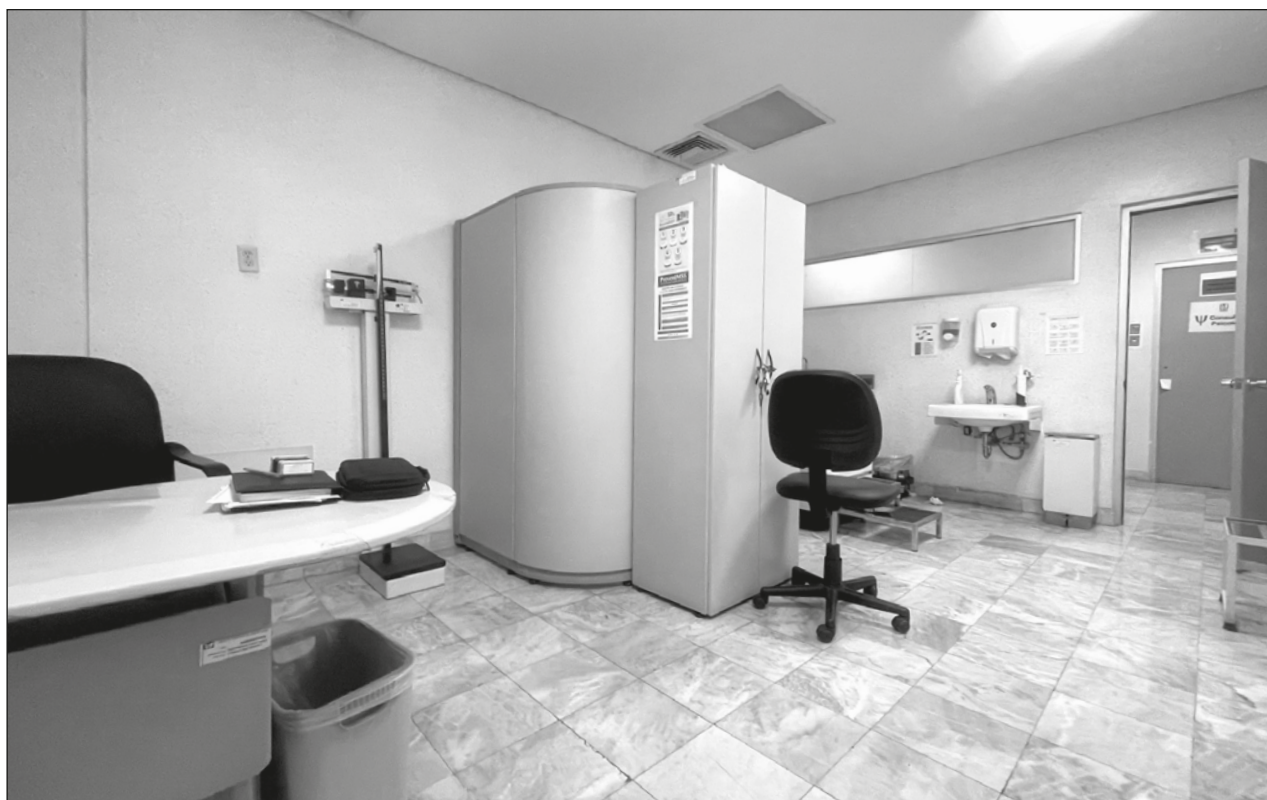
▲ El objetivo del plan es garantizar la atención en salud a la población abierta.

Tan sólo para la compra de vacunas Covid, añadió, el país ha invertido 45 mil millones de pesos.