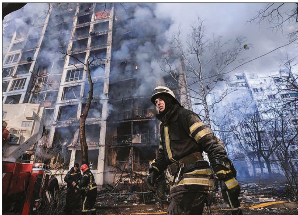
▲ Rusia incrementó sus bombardeos sobre Kiev el martes, devastando un edificio de apartamentos y otros inmuebles.

Los ataques golpearon un distrito occidental de