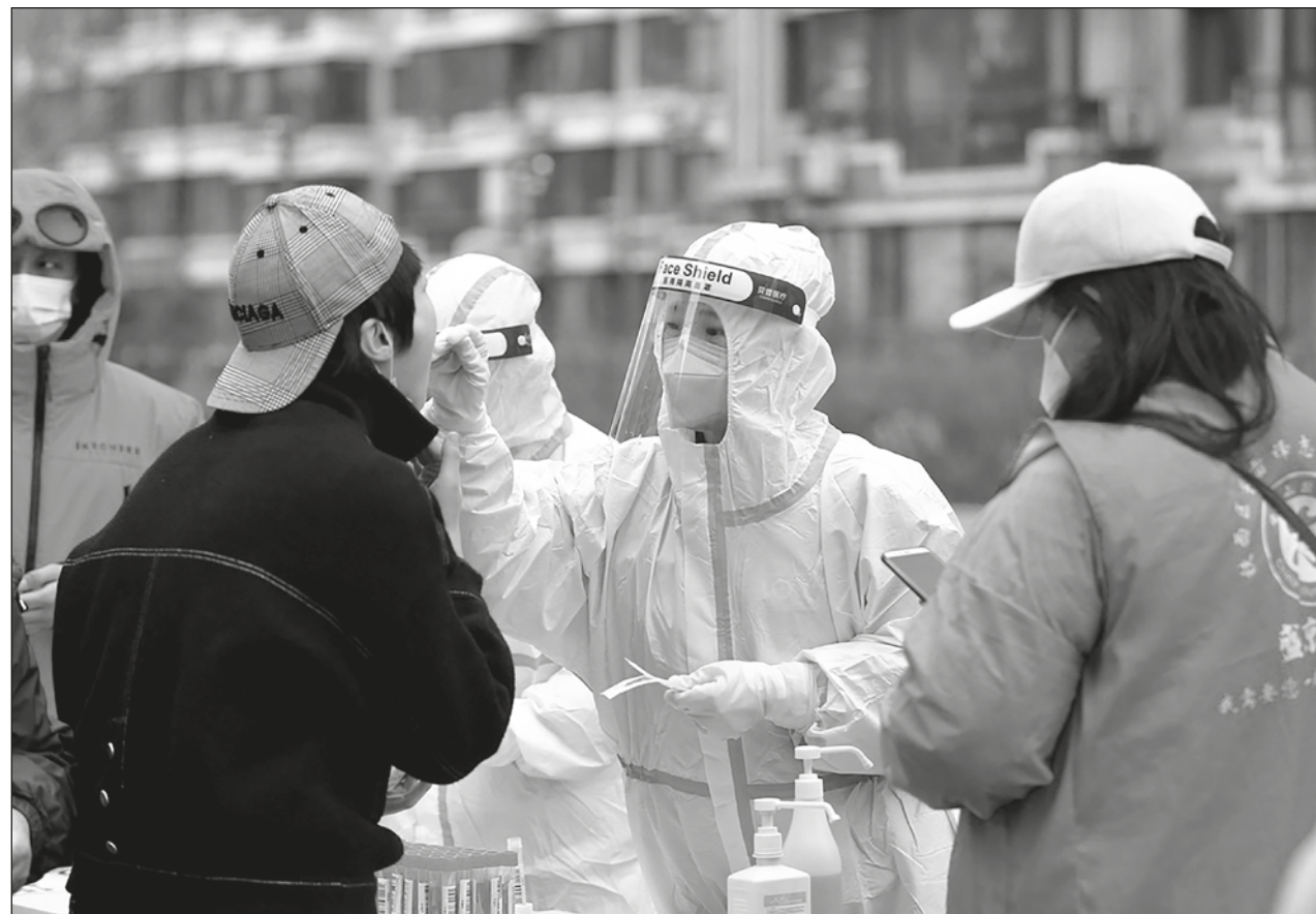
▲ Bajo la estrategia china de Cero Covid hasta el brote mínimo es enfrentado con medidas severas.

En total, el país registró alrededor de 120 mil casos de Covid-19 y 4 mil 636 muertes. La última víctima mortal de la enfermedad se remonta oficialmente a principios de 2021.