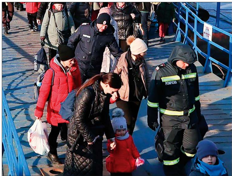
▲ El Danubio se abre paso por 10 naciones rompiendo fronteras, esas que los refugiados añoran transitar para sentirse a salvo.

Miles escapan ante el creciente temor de que