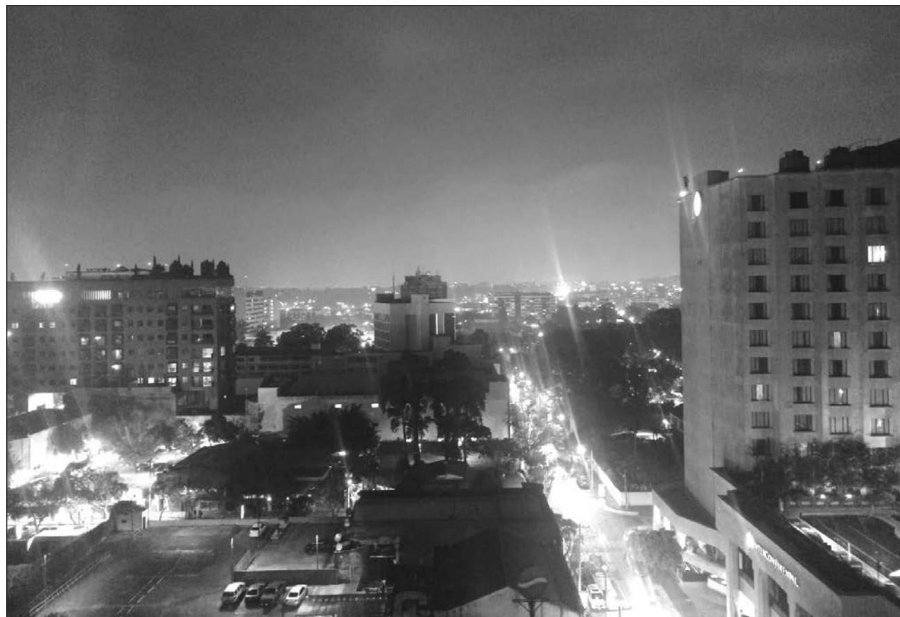
▲ México es el segundo socio comercial de Guatemala, detrás de Estados Unidos y representa entre el 30 y 40% de las importaciones de ese país.

“Nos ha sorprendido gratamente la gran respuesta a la reactivación de los vuelos