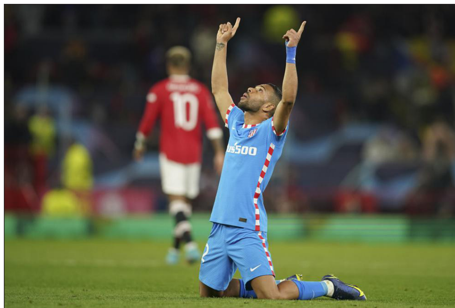
▲ El brasileño Renán Lodi, del Atlético de Madrid, luego de marcar ante el Manchester United, en el duelo de ayer de los octavos de final de la Liga de Campeones.

no estaba jugando, pero todo ha cambiado ahora y estoy muy contento con eso", afirmó Lodi, lateral izquierdo de 23 años. "Mi papel es difícil, pero lo estoy aprendiendo".