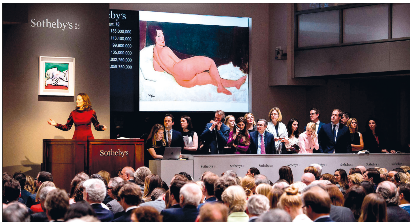
▲ El arte contemporáneo representa ahora 20 por ciento del mercado en comparación con el 3 por ciento en 2000.

TikTok se une así a la lista de los socios oficiales de la 75 edición del festival, como el joyero Chopard (que fabrica la Palma de Oro), los coches BMW y el gigante del lujo Kering.