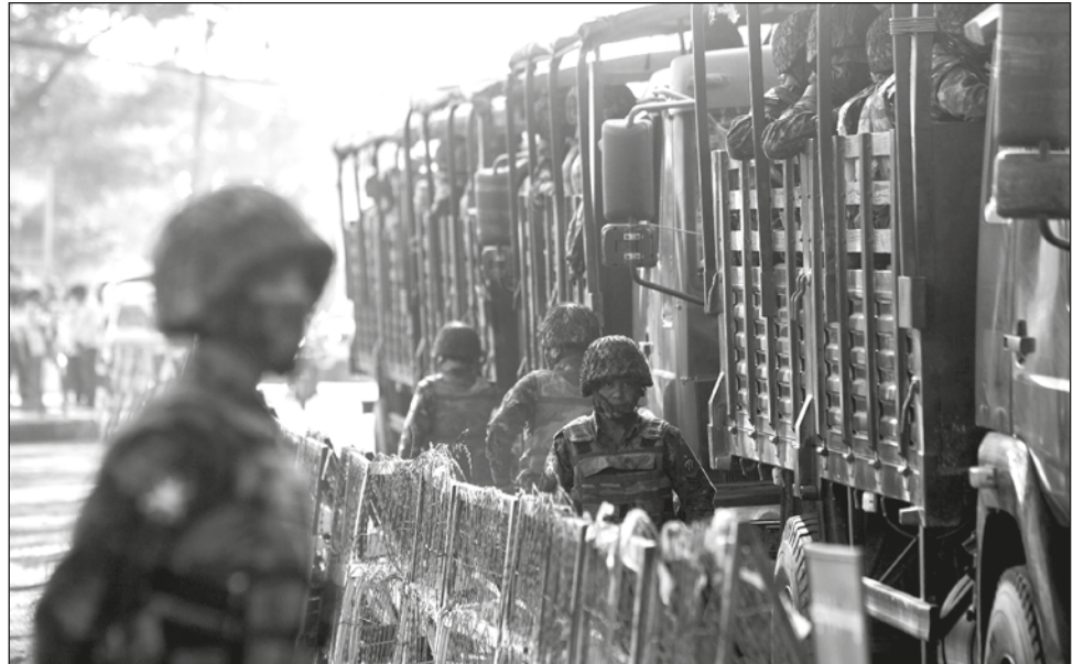
▲ Según lo publicado en el informe de la ONU, muchas víctimas recibieron disparos en la cabeza, fueron quemadas hasta morir, torturadas o usadas como escudos humanos.

El informe de la ONU dijo que se basó en entrevistas con decenas de víctimas de abuso y testigos, cuyos rela-