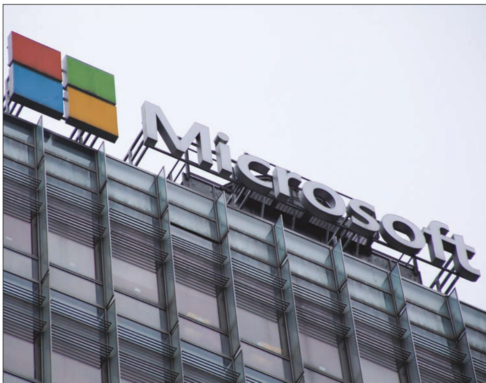
▲ La población rusa experimenta cada día más los efectos directos de Putin al invadir a Ucrania.

Asimismo, Microsoft se comprometió a incrementar la ciberseguridad de Ucrania y está trabajando proactivamente para que sus funcionarios se defiendan de las incursiones informáticas rusas.