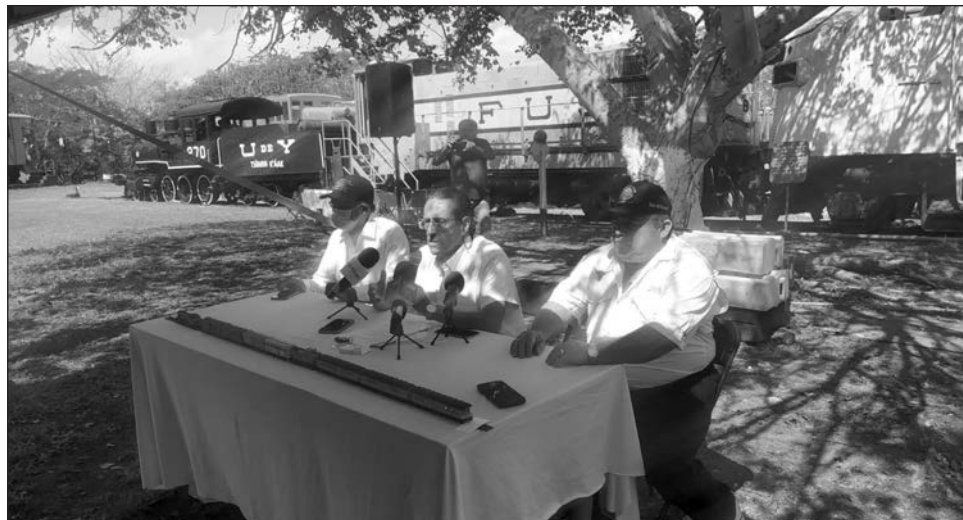
▲ En el marco de sus 23 años de fundación, encargados del Museo de los Ferrocarriles de Yucatán dieron a conocer la importancia de financiar este tipo de espacios históricos.

Esperan que se pueda destinar algún recurso de esta obra u otras para preservar esta memoria histórica, de lo contrario hay incertidumbre sobre su conservación, reconocieron. “Sería un gran error no tomarnos en cuenta en cualquier pro-