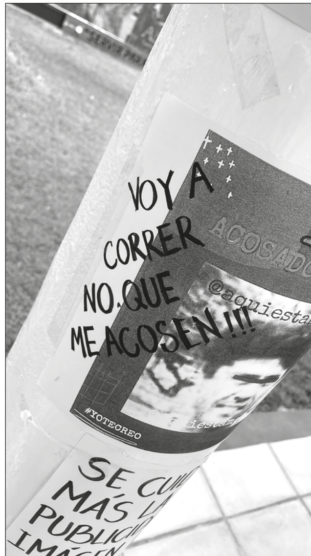
▲ El plantel asegura que ya solicitó la suspensión del profesor mientras se hacen las averiguaciones. Foto alumnas

Compartió que el comité que preside se creó en el marco de la nueva administración -en octubre pasado- y cuenta con personal que fue votado. Será el día de mañana cuando sesione ese organismo para tomar una decisión al respecto.