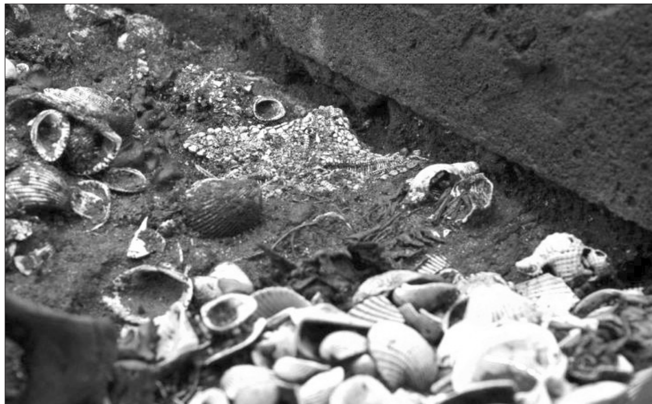
▲ La propia ubicación de la ofrenda, en la sexta etapa constructiva del Templo Mayor, la sitúa en una fecha cercana al año 1500, momento de transición entre los reinados de Ahuizotl y Moctezuma Xocoyotzin.

El INAH explicó que entre los vestigios arqueológicos investigados desde 2019, a través del Proyecto Templo Mayor (PTM), están elaboradas ofrendas en las que los mexicas combinaron elementos terrestres como una figurilla de copal y el cuerpo de un jaguar armado con un atlatl -propulsor de dardos-, junto a organismos marinos: