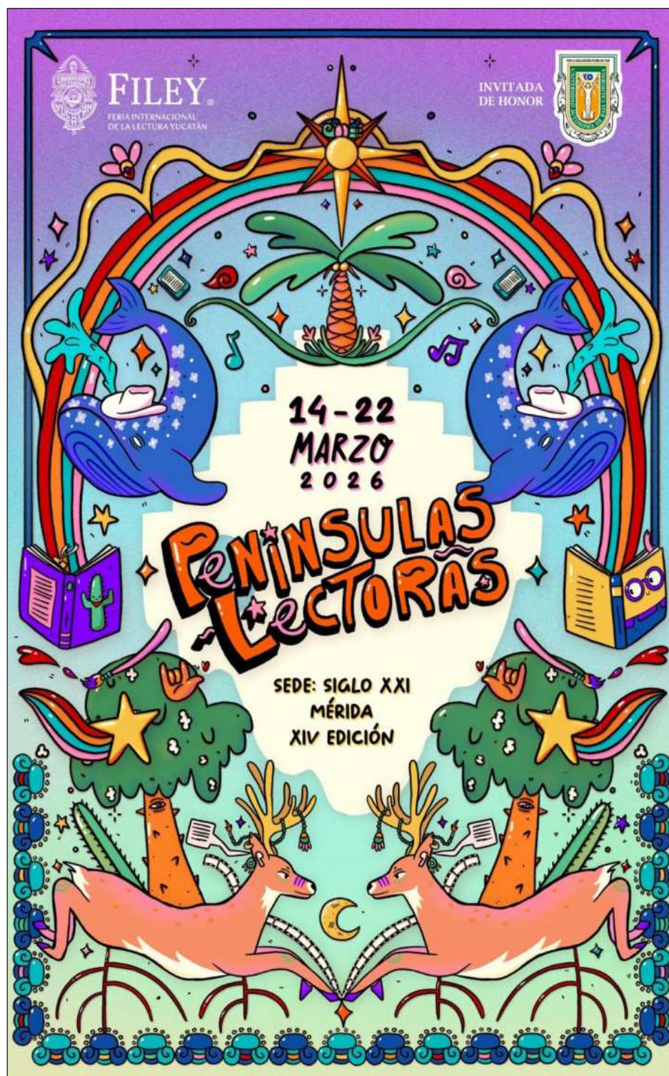
▲ "Se proyecta la participación de mil 694 artistas en esta gran fiesta de la cultura".

"Con 13 ediciones celebradas y rumbo a la décimo cuarta, la Feria Internacional de la Lectura Yucatán, la feria de la UADY, se llevará a cabo nuevamente a partir del próximo 14 de marzo y hasta el domingo 22. Así, a lo largo de nueve días el Centro de Convenciones y Exposiciones Yucatán Siglo XXI se convertirá en un espacio de encuentro para la lectura, el arte, el conocimiento y la alegría del aprendizaje". "En el marco de la Feria Internacional de la Lectura