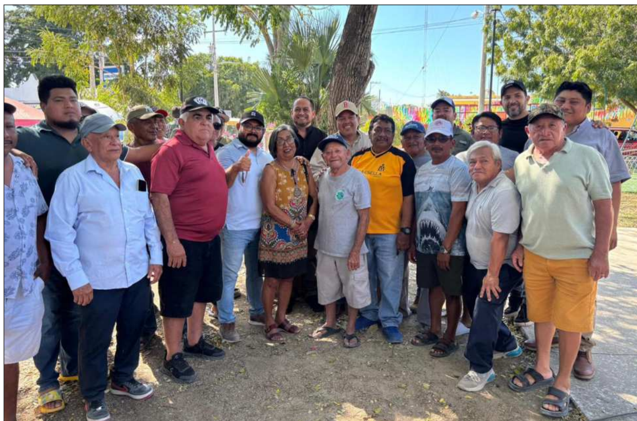
▲ Tras el acercamiento con las autoridades estatales, los manifestantes del grupo de campesinos de Sierra Papacal accedieron a reabrir el bombeo de agua potable y acordaron continuar con el diálogo durante los próximos días.

Como medida de presión, los ejidatarios realizaron el cierre de 10 pozos de agua potable que abastecen a las comisarias progresañas de