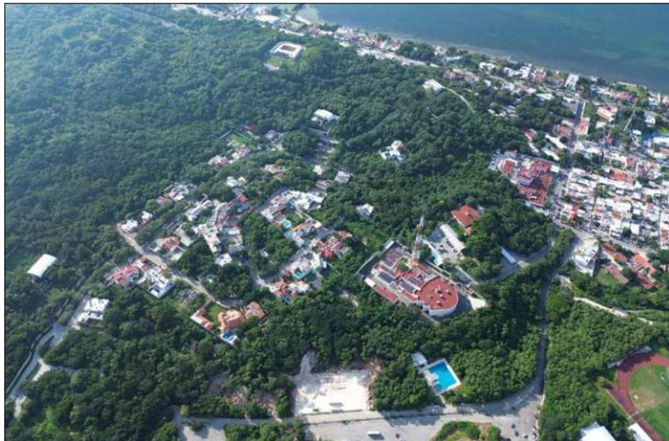
▲ La gobernadora Layda Sansores confirmó que la Universidad Nacional Rosario Castellanos es un hecho y destacó la recuperación de tierras que pertenecían a los campechanos.

Ya se realizó la expropiación y está publicado en el Periódico Oficial del Estado; el Registro Público de la Propiedad y del Comercio