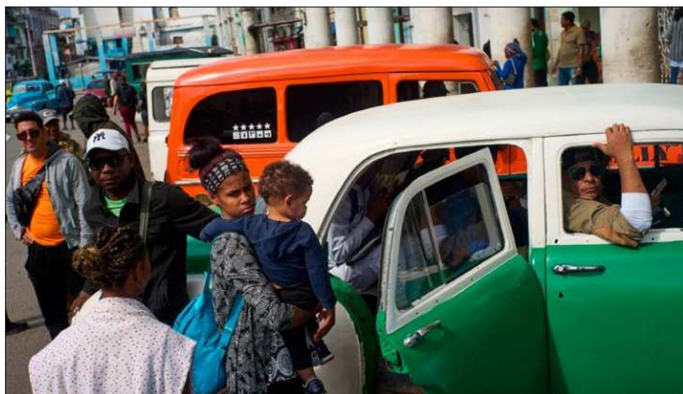
▲ Hay que “diversificar las maneras de crear y producir, las alternativas para resistir la agresión. Tenemos que cambiar; el pueblo quiere preservar la Revolución”, detalla González Jiménez.

“La caída del bloque provocó desabastecimiento.