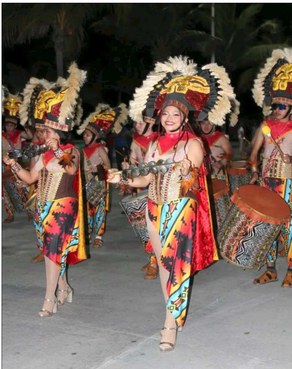
▲ Comparsas, batucadas y carros alegóricos animaron el arranque; reportan saldo blanco.

Las autoridades de seguridad reportaron que hasta el momento se mantiene saldo blanco en esta celebración del Carnaval Carmen 2026.