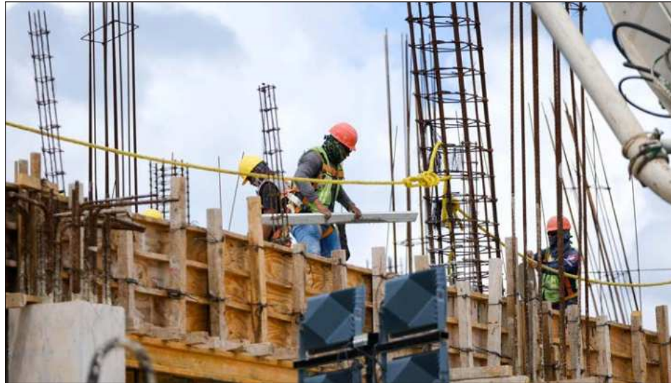
▲ Para 2025, Canadevi estima cerrar con ocho mil créditos otorgados a través de programas tradicionales de Infonavit y otros cuatro mil por parte de la banca.

Para 2025, Canadevi estima cerrar con ocho mil créditos otorgados a través de programas tradicionales de Infonavit y otros cuatro mil por parte de la banca, lo que mantiene la demanda en niveles similares al año anterior y a lo que se suman las Viviendas del Bienestar.