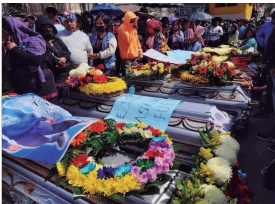
▲ El sábado hombres armados atacaron un destacamento militar, una estación policial, cortando carreteras y secuestrando buses, lo que dejó al menos cinco muertos.

“La opción más justa es que las cosas ‘se queden como están’”, argumentó Zelensky.