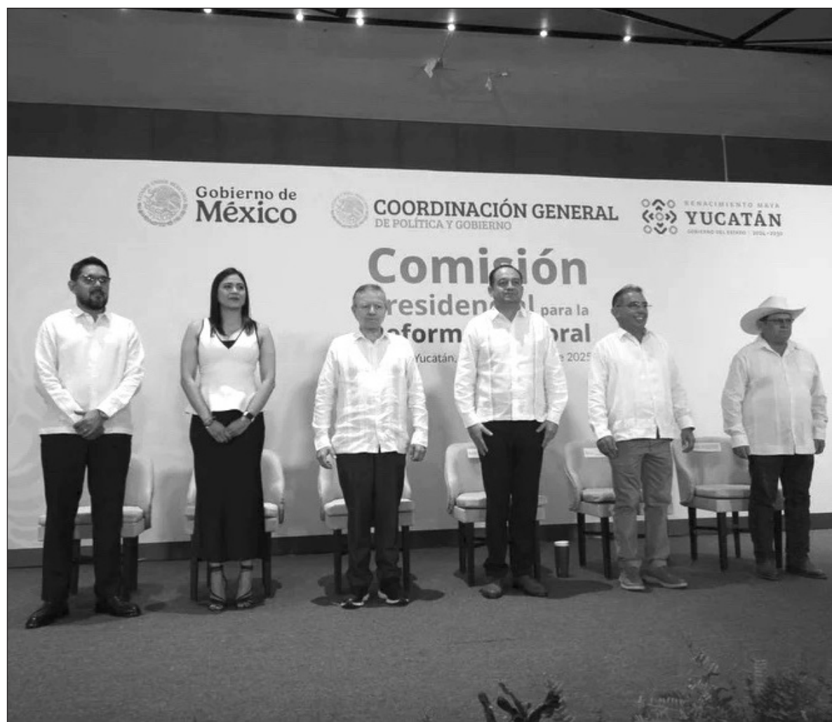
▲ "La ciudadanía tiene el deber de velar porque la reforma conduzca a un sistema más justo y democrático".

ESTE CONTEXTO ES relevante porque los cambios en el sistema de partidos mexicano suelen ir acompañados de reformas electorales profundas. Por ejemplo, la reforma de 1946 nacionalizó los procesos electorales al asignar a la Comisión Federal de Vigilancia Electoral la organización y vigilancia de las elecciones. Además, en 1946 se refundó el partido del régimen (el PRM) para integrar a las principales fuerzas revolucionarias del país en un nuevo partido nacional: el PRI. La combinación de la centralización de la organización electoral y la consolidación de un partido oficial de alcance nacional dio pie a un sistema de partido hegemónico, en el