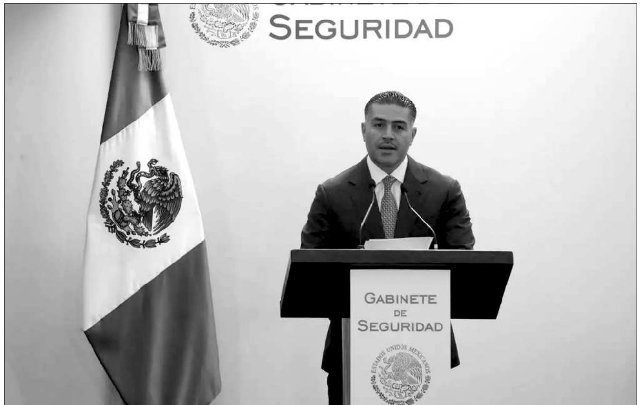
▲ García Harfuch recalcó que dicho sujeto ha mencionado “que tiene un vínculo y que trabaja directamente para un líder delincuencia”.

“La investigación inició por denuncias específicas por extorsión que no están vinculadas a ningún sindicato, es una denuncia directa, es una extorsión directa desde cobrarle a empresarios, agricultores, pozos de agua, hay varios delitos que se están investigando, pero ninguno está relacionado como tal con un sindicato, o con un vínculo político”, contestó García Harfuch.