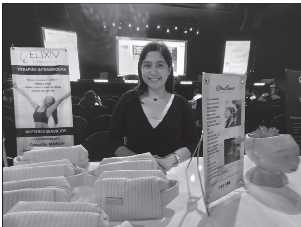
▲ Para Andrea López, analista de Oneline Beauty Clinic, lo primordial al hablar de medicina estética es ofrecer servicios de calidad, que den resultados reales y seguros.

Aseguró que tienen pacientes desde hace más de ocho años que regresan a la