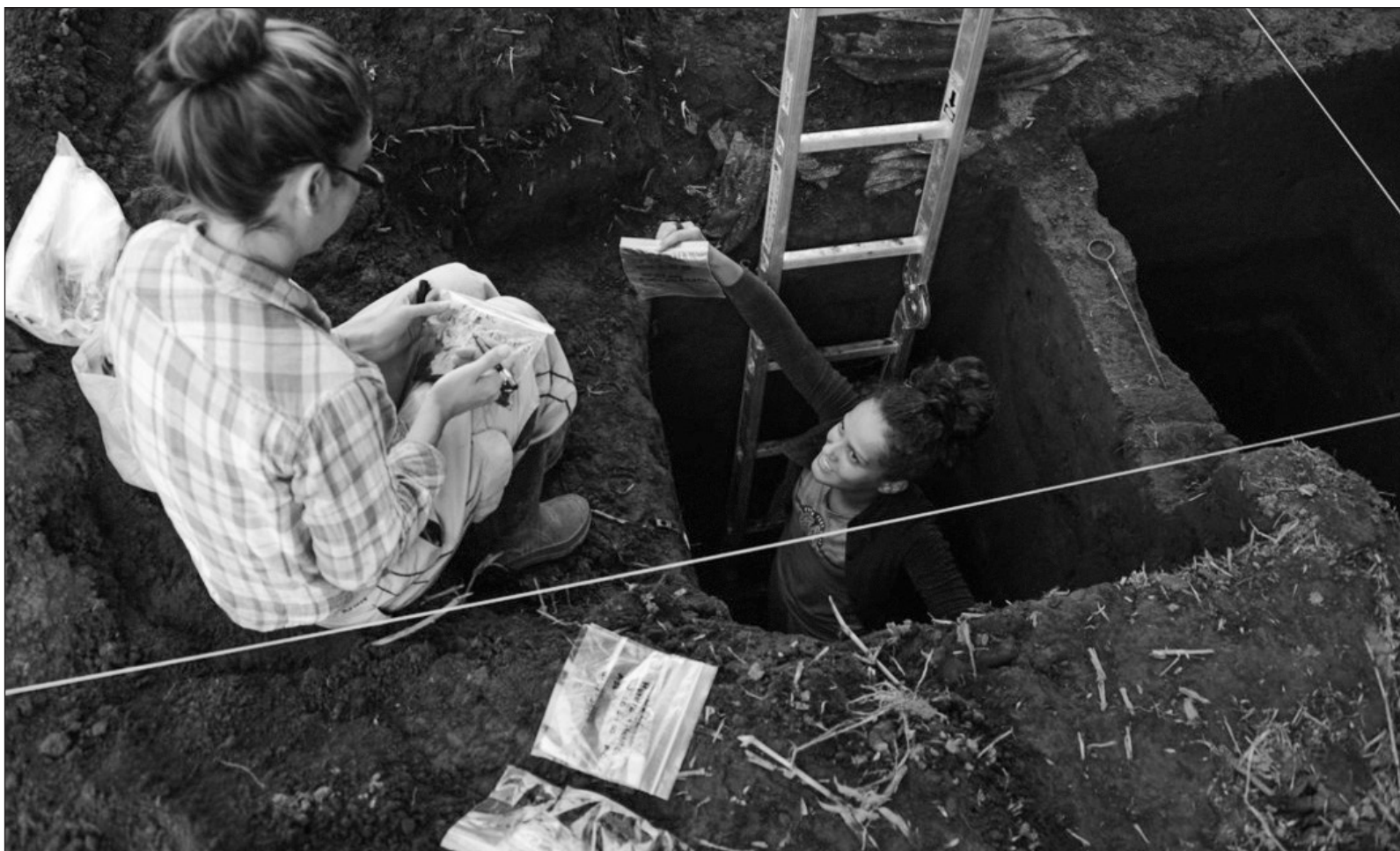
▲ “La experiencia del trabajo de campo es única, enfrenta al investigador a una serie de retos que van más allá de dormir en el piso”.

Todo esto facilita el trabajo, pero no te libera del síndrome de la página en blanco, si quieres hacer un trabajo personal y original para aportar algo nuevo y diferente.