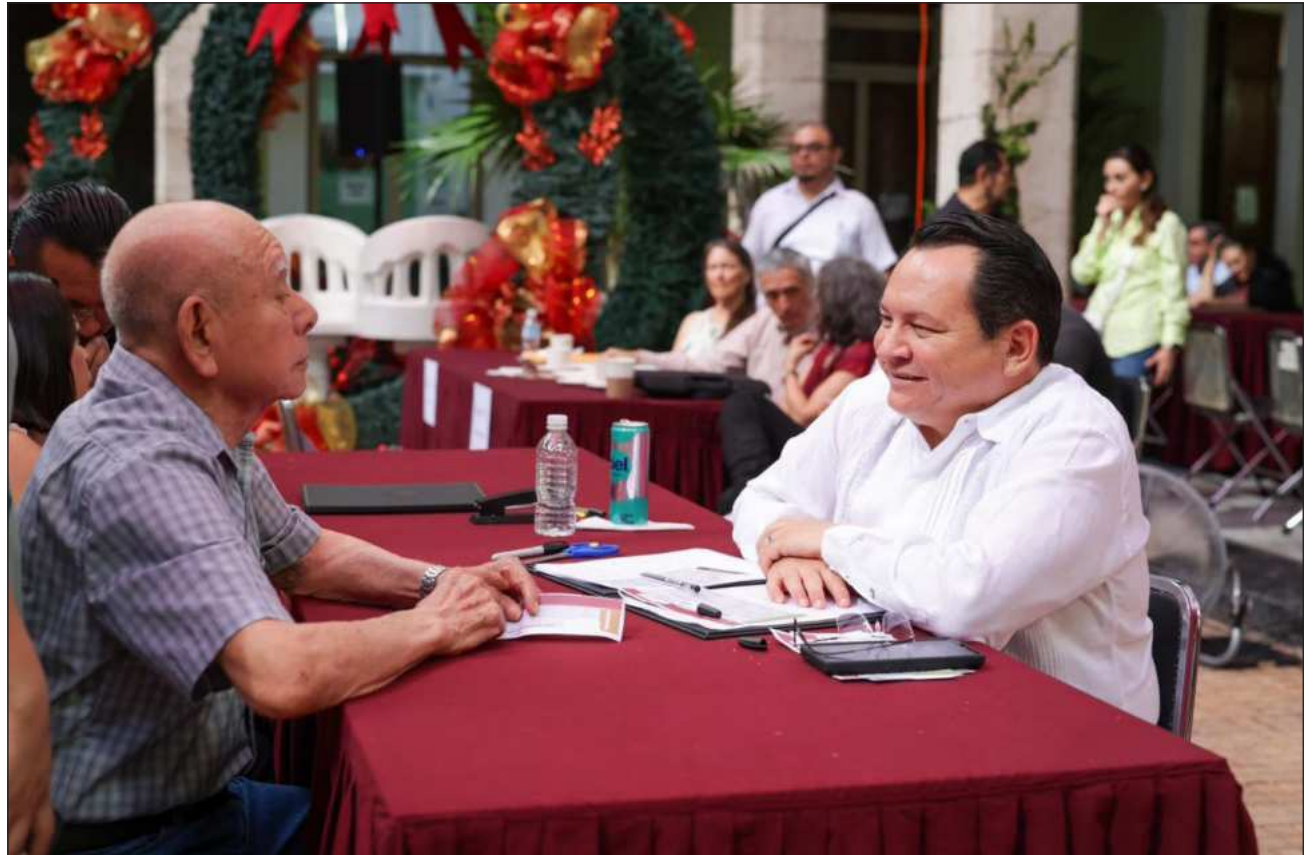
▲ El gobernador sostuvo que “este gobierno pone en el centro de las decisiones lo que la gente nos plantea; muchas acciones que hoy están en proceso de construcción o ya en marcha han salido de estas audiencias ciudadanas.

Asimismo, señaló que su gobierno trabaja en obras de gran magnitud para el desarrollo de Yucatán, con el objetivo de generar empleos bien pagados, y también impulsa iniciativas como Mujeres Renacimiento, que respalda a las madres autónomas, así como Juventudes Renacimiento, con la cual se busca reducir la desigualdad y, al mismo tiempo, apoyar que las y los jóvenes con-