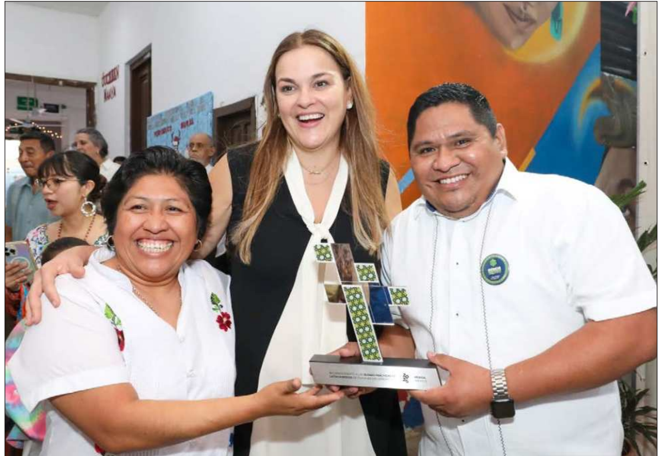
▲ La Unesco reconoció al Instituto para el Fortalecimiento de la Cultura Maya del ayuntamiento de Mérida por la campaña Mérida Ta Wéetel; la distinción incluye un apoyo económico de mil 500 dólares.

"Cuando tenemos identidad, cuando tenemos raíces,