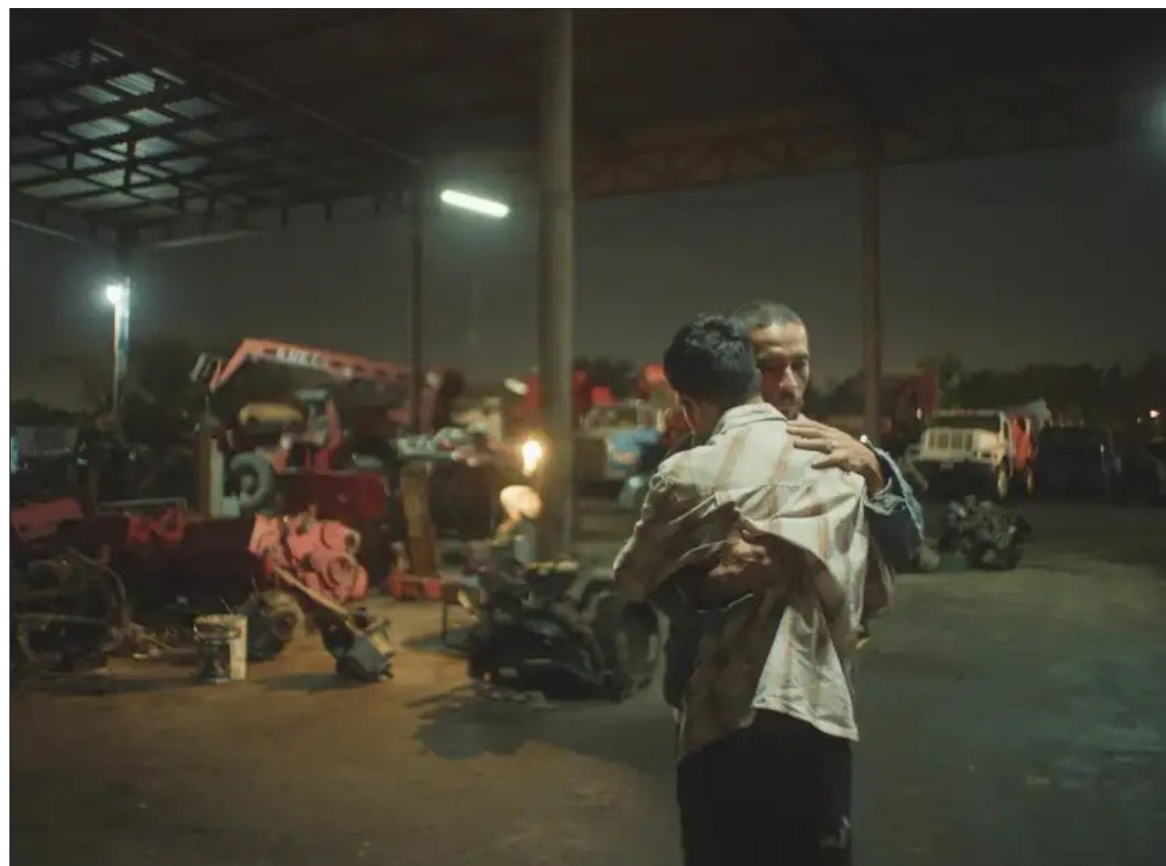
▲ En esta edición del festival cinematográfico, la cita audiovisual contó con una selección de 222 obras en exhibición de 42 países, entre los que destacan, además de Cuba, México, Argentina, Brasil y Colombia.

En otros galardones, en postproducción, Aracne DC y Tauro Digital entregaron