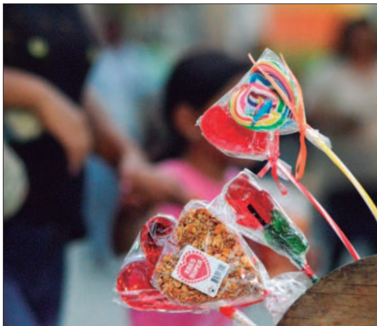
▲ “Los jóvenes no tienen un entorno que los favorezca y se llenan de tacos, tortas o fritangas. En México, sólo 33 por ciento de quienes tienen diabetes logran un buen control de su enfermedad”.

—Sí, y que tomen decisiones en favor de sí mismos y se protejan. No solamente es la alimentación sino lo que va junto con ella: la convivencia, reconocer al otro como alguien que puedo cuidar y me puede cuidar y que entre todos cuidemos de nuestra salud. Ésta se vuelve un asunto de la comunidad,