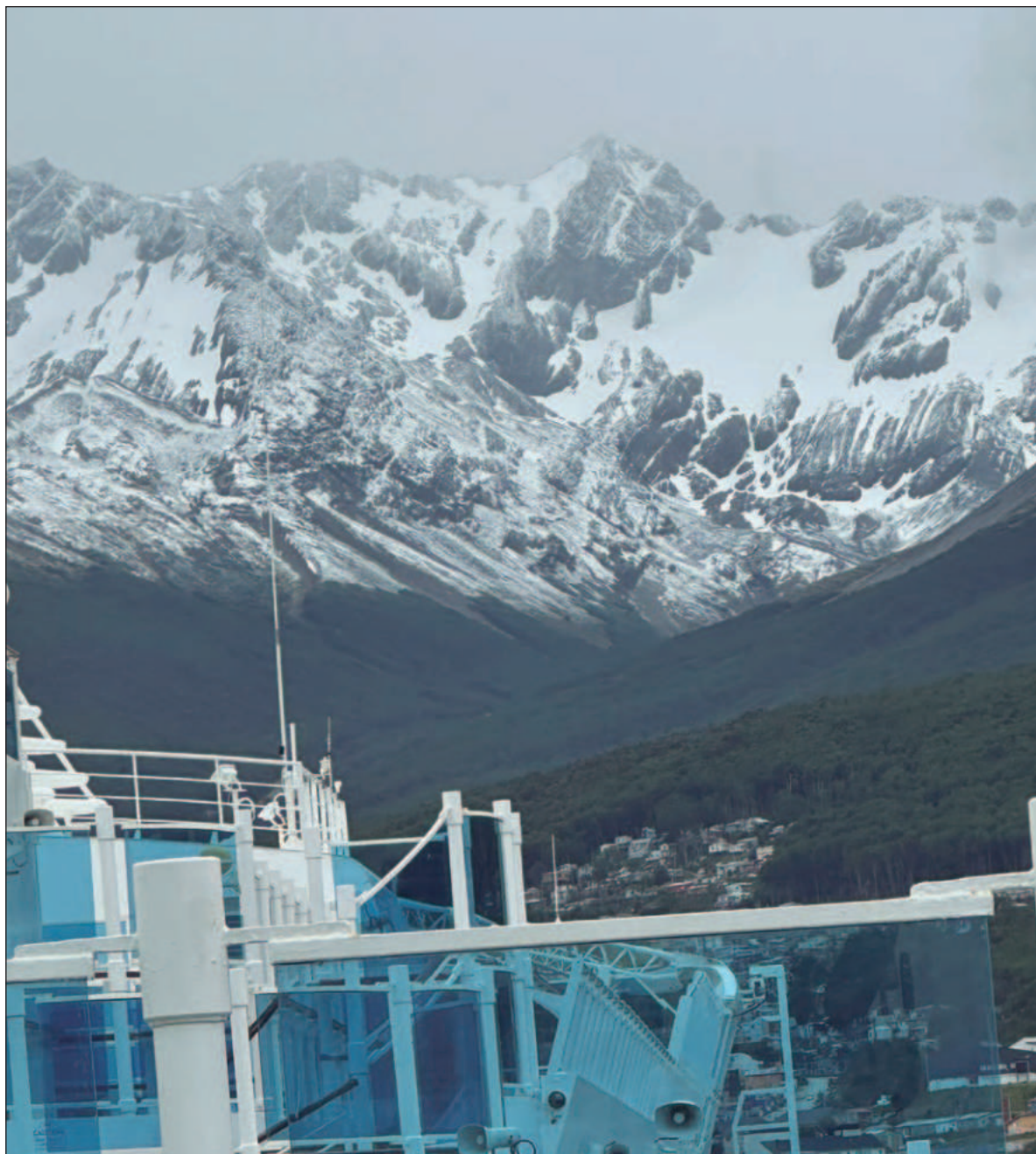
▲ “Mi hamaca y mi península de Yucatán están a más o menos 11 mil 500 kilómetros. Tan lejos, que aquí apenas van en primavera, cosa que niegan los copetes blancos de las montañas que nos observan navegar”.

El crucero está cumpliendo mi objetivo de cerrar mi novela Mi abuela tenía razón . Lo curioso es que descubro la poca comprensión de que elija quedarme encerrada en mi cabina, profundizando en los detalles del texto a bajarme del barco para ir al mercado a comprar regalitos. Al escribirlo veo que es la misma historia que la de