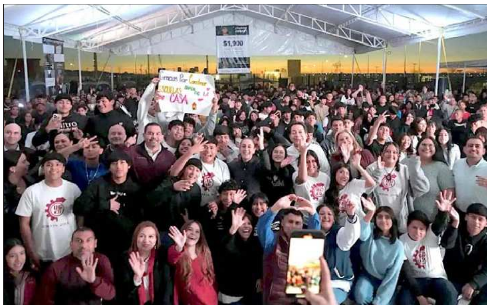
▲ Durante su gira por esa entidad, la jefa del Ejecutivo visitó ese plantel de bachillerato, como parte del proyecto de su administración para ampliar la matrícula en ese nivel de estudios.

En la ciudad fronteriza también inauguró, en un emotivo encuentro se dijo en un comunicado emitido anoche, el segundo Centro LIBRE, donde ante niñas, jóvenes y mujeres de to-