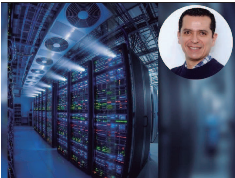
▲ La máquina tendrá tanto procesadores como GPU; estos últimos fueron inventados para los videojuegos, pero pueden aprovecharse para el uso de datos. Imagen hecha por Gemini y ATDT

Asimismo, hay modelos de fractales que se planean implementar en datos fiscales, pues son cerca de 45 mil millones de datos fiscales que hay que analizar.