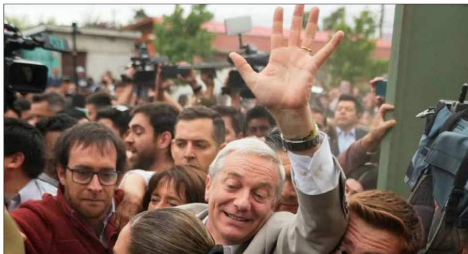
▲ José Antonio Kast agradeció las palabras de felicitación de Gabriel Boric y adelantó confiar en que "esta sea una transición muy ordenada, respetuosa".

"Usted ha sido electo presidente de la República de Chile y, por lo tanto, de todos los chilenos y chilenas", dijo Boric, quien reconoció que Kast obtuvo "un triunfo claro" respecto a su contendiente. "Y eso usted sabe, es una gran responsabilidad que hay que abordar con