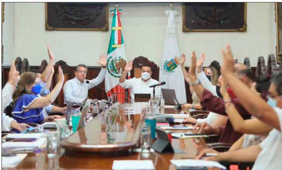
▲ En sesión ordinaria aprobaron la firma de convenio con la empresa Reciclajes Electrónicos del Sur S.A. de C.V. , con la finalidad de optimizar el acopio de residuos sólidos.

En materia de infraestructura urbana, el cabildo de Mérida autorizó que se destinen recursos fiscales para los trabajos de rehabilitación de las canchas de tenis de la colonia Miguel Alemán a fin de brindar espacios dignos para la comunidad deportiva.