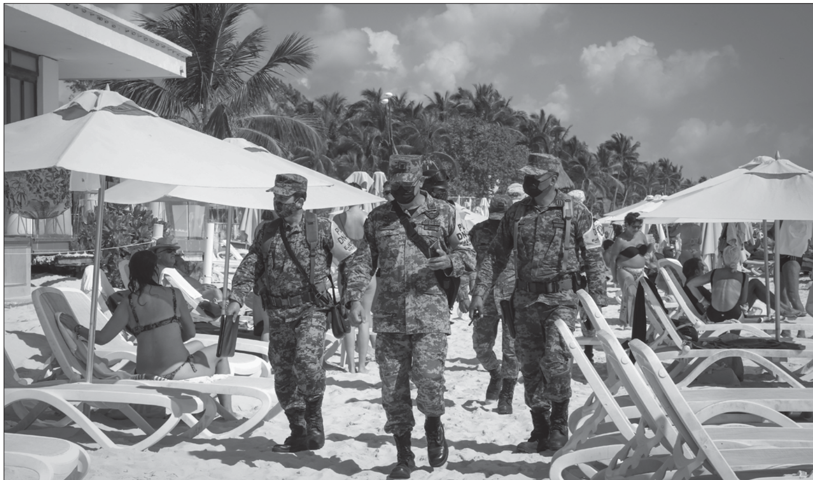
▲ "Es necesario crear un marco jurídico para que las responsabilidades (de las Fuerzas Armadas) estén perfectamente delimitadas".