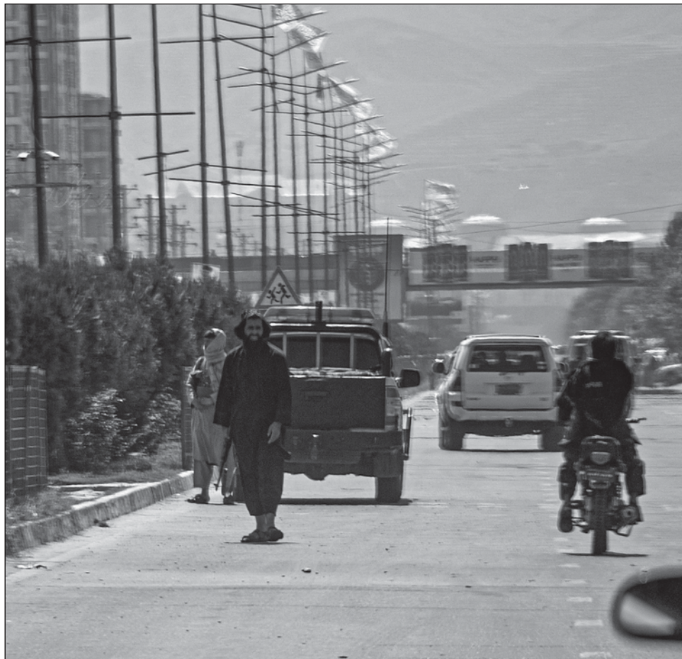
▲ El nuevo fondo gestionará 3.5 millones de dólares de reservas de Afganistán, congelados en Estados Unidos desde que los talibanes llegaron al poder en agosto de 2021.

Esta decisión ocurre después del fracaso de las negociaciones entre los talibanes y la administración estadounidense para desbloquear unos 7 mil millones de dólares congelados desde hace 13 meses en Estados Unidos.