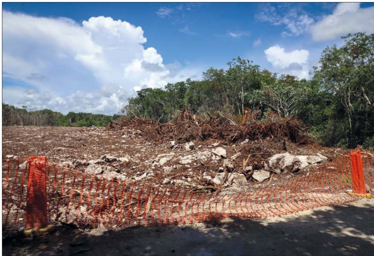
▲ El presidente de México, Andrés Manuel López Obrador, señaló que “la decisión es que donde haya ríos subterráneos se opte por hacer desvíos o puentes, viaductos, segundos pisos” para no afectar la biodiversidad.

—Quisimos ayudar. Ellos tienen sus terrenos atrás (de la zona de playa). Tienen dos mil metros de playa y atrás 10 kilómetros. Como la carretera pasa muy cerca de la orilla, el planteamiento fue: córrase; estaban acostumbrados a mandar. Increíble el poder de esta gente. En toda esta zona se ha permitido la destrucción con impunidad. Ahí está la destrucción de Calica y nadie se opuso. Los permisos se