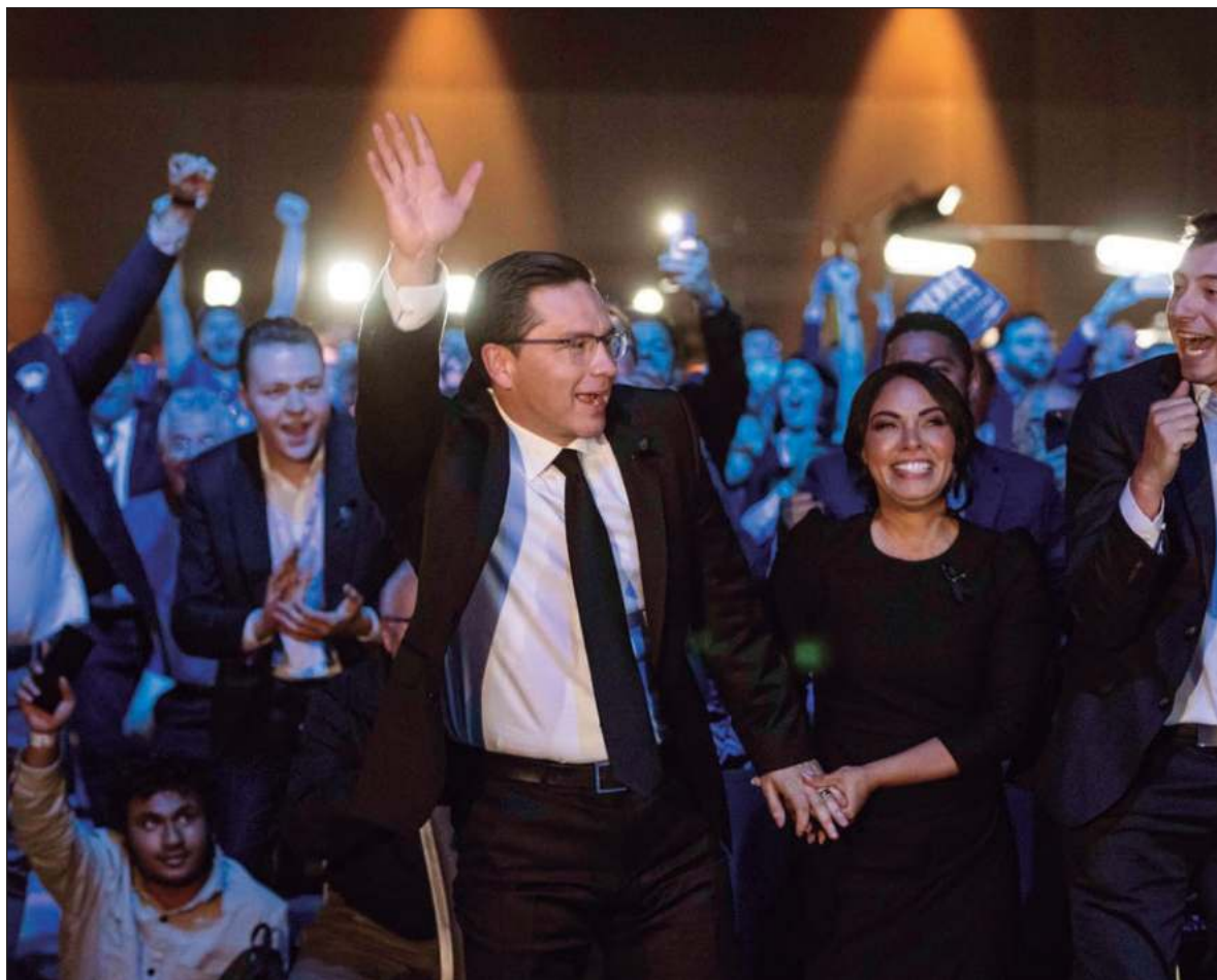
▲ "If Mr. Poilievre concentrates on everyday bread and butter issues, he may well seduce a good number of Canadians who don't care so much about the past as they do about the present and the future".

HE IS AN excellent communicator, speaks in simple language and easy to understand concepts, and he connects with his audience.