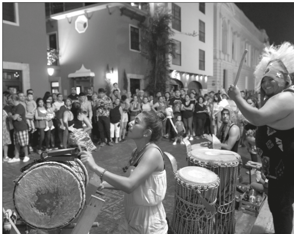
▲ Para La Víspera , se buscará que los meridianos tengan una experiencia más personal con la ciudad, recorriéndola a pie, en bicicleta o calesa.

“Estamos tratando de definir una personalidad diferente a la del viernes y en un futuro definir la personalidad de los domingos. No sabemos cómo le vamos a llamar. Si la Noche Blanca continúa expandiéndose, su futuro es que el viernes sea Víspera y domingo un after ”.