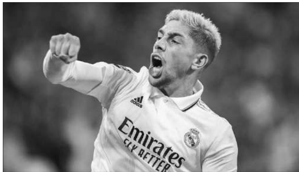
▲ El uruguayo Federico Valverde, tras anotar ayer el primer tanto del Real Madrid.

Los visitantes generaron buena parte de las oportunidades en los albores del cotejo del Grupo F en el Estadio Santiago Bernabéu. "La vigilancia defensiva era importante, lo mejor del Leipzig son las