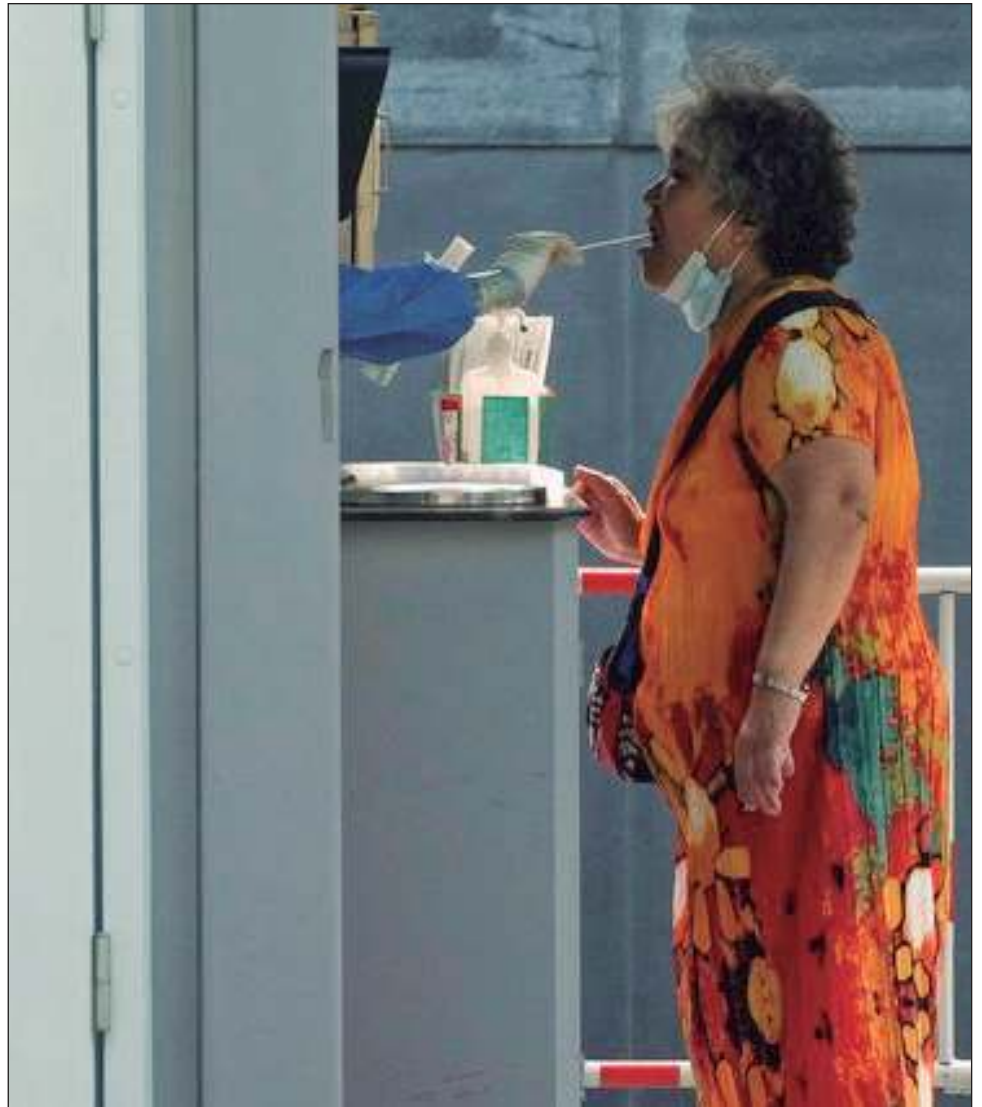
▲ Según el último informe de la OMS, el número de casos descendió 12 por ciento en la semana del 29 de agosto al 4 de septiembre respecto a la semana precedente.

Al 4 de septiembre, la OMS contabilizaba más de 600 millones de casos oficialmente confirmados - una cifra que se presume muy inferior a la real, lo mismo que el número oficial de decesos: 6.4 millones de muertos en todo el mundo.