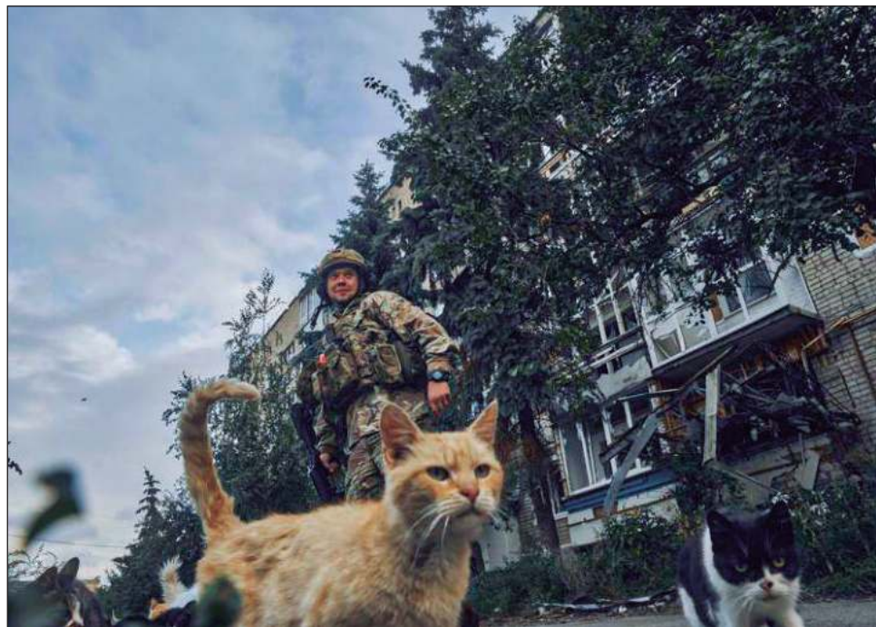
▲ A su retirada, las fuerzas rusas dejaron una maltrecha ciudad, con cientos de edificios de apartamentos tiznados por el fuego y agujereados por la artillería.

“Fuerzas ucranianas mantienen ataques localizados por tierra o amenazan posiciones rusas tras el Río Oskil”, indicó el instituto.