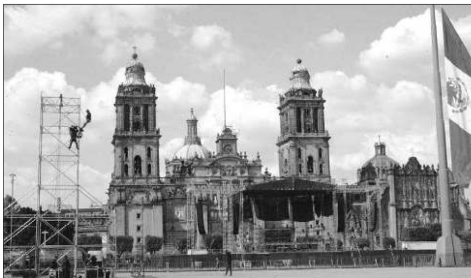
▲ La pandemia de Covid-19 obligó a dos años de fiestas patrias virtuales; es decir, sin que sea posible una concentración de personas en las plazas del país.

Son los invitados, e invitó a la gente, nada más es cosa de que haya lugar. Pienso que van a estar muchos, porque