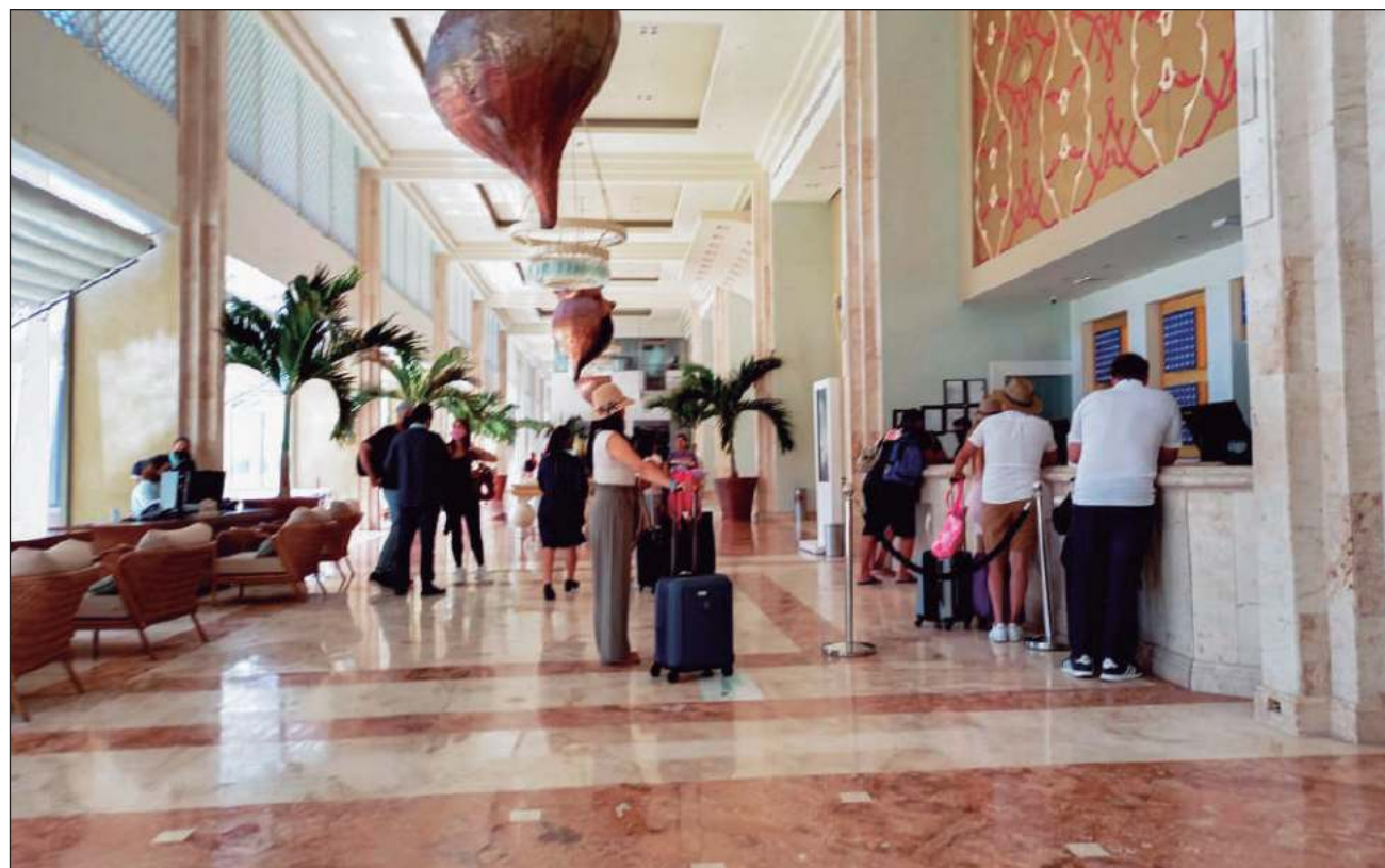
▲ Cancún es el destino favorito a nivel nacional y más favorecido por la llegada de turismo.

Este aumento de visitantes es consecuencia de la conectividad aérea, que se mantiene con promedios de 450 operaciones diarias, pero que para el fin de semana estaría rebasando las 500; a la par, hay otros sectores relacionados con el turismo, que también percibirán un aumento en sus