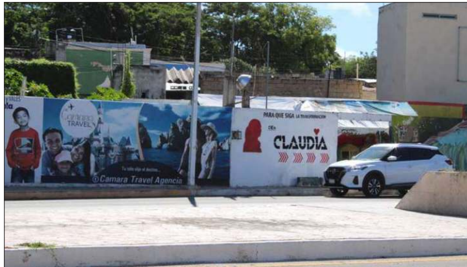
▲ Perfiles políticos opositores acusaron que a simple vista se encuentran lonas, bardas pintadas y espectaculares en alusión a la jefa de Gobierno de la Ciudad de México.