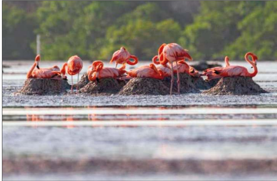
▲ En abril, observaron que la anidación había comenzado y, desde allí, decidieron proteger el área para no perturbar el proceso natural, pues había alrededor de 700 nidos.

En San Crisanto, actualmente, hay disponibilidad de alimento y agua dulce, así