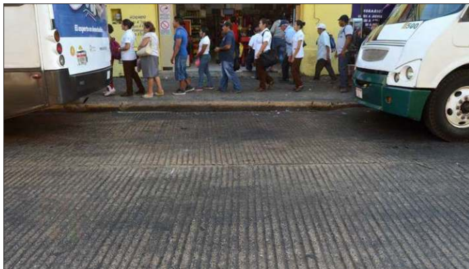
▲ La reubicación de paraderos comenzó este miércoles y concluirá el domingo.

Los filtros de seguridad e ingreso para quienes acudan la noche del jueves 15 a la Plaza Grande estarán en los cruces de las calles 63 con 58, 60 con 65, 65 con 62, 63 con 64 y 62 con 59.