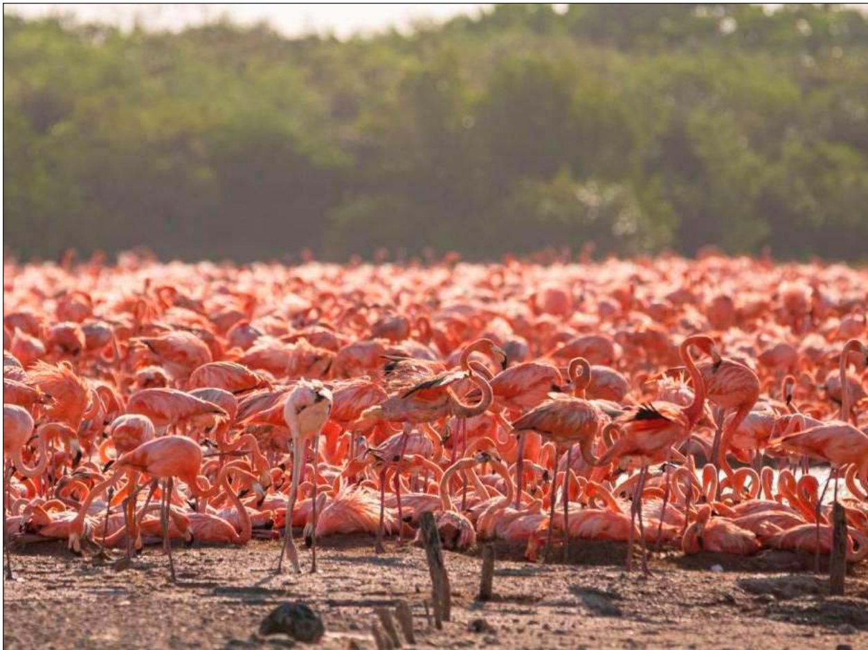
▲ Te'e ja'ab', le ch'íich'a', k'uch e'el ta'ak tu jaalik le k'áak'náabo', tumen ma' páatchaj u bin tu'ux suuka'an yook'lal le seen cháak taan u k'áaxalo'. Americano meek' koje', juntúul ba'alche' suuk u yantal te'e lu'uma',