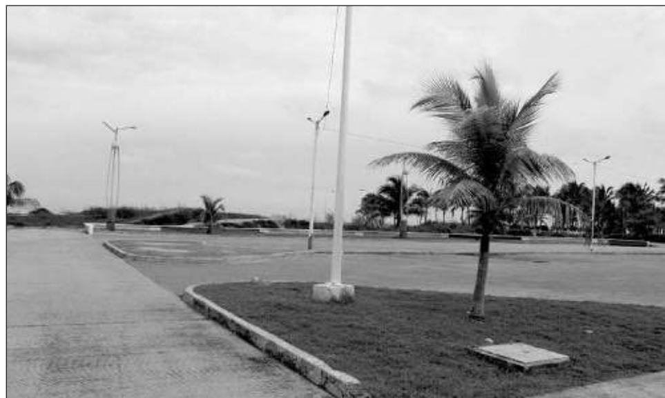
▲ El centro comercial proyectado se construir  en terrenos actualmente empleados como pista de motocross, aunque  sta se trasladar  a las proximidades del desarrollo.

Explic  que estos terrenos se encuentran ubicados en la zona que actualmente se usa como pista de motocross, misma que de acuerdo con