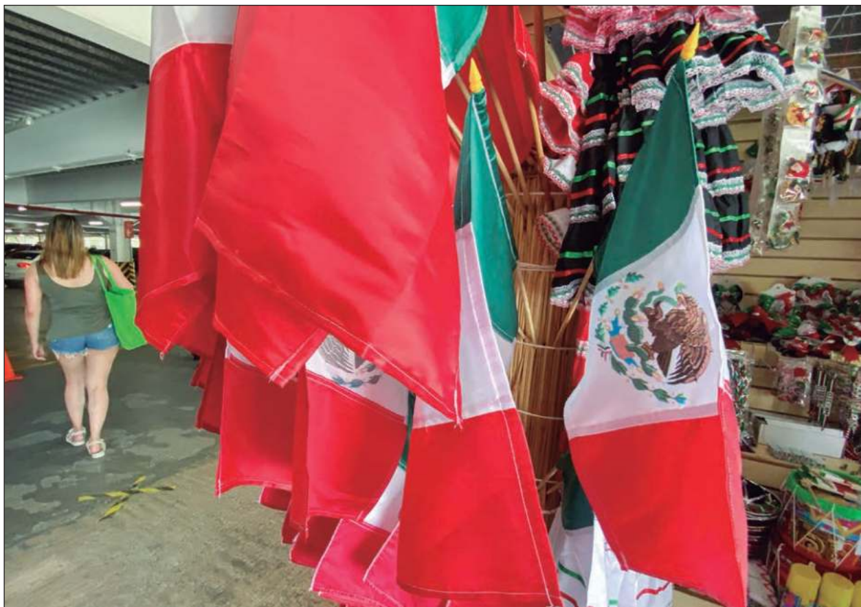
▲ La pandemia del Covid-19 modificó muchas de las festividades patrias.

Comentó que los elementos a su cargo, así como otras dependencias municipales, estatales y federales, desplegarán un dispositivo de seguridad coordinado tanto en el evento público del grito como en los alrededores, así como para el desfile del viernes 16 de septiembre.