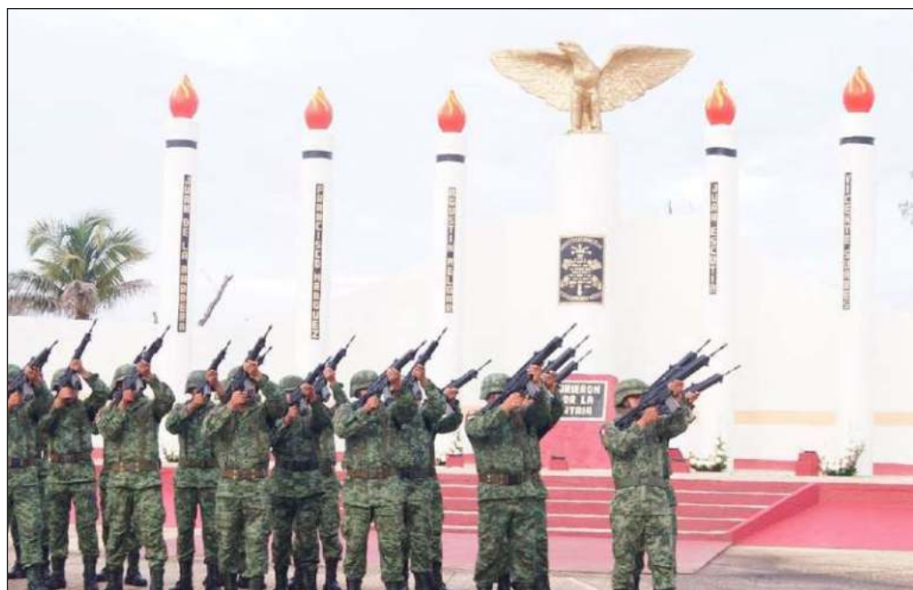
▲ La presencia del Ejército, Marina y Guardia Nacional se concibe como un esfuerzo en lo inmediato para asegurar el estado de derecho y salvaguardar a la población.

Por lo mismo, el plazo fijado ahora no puede ser visto como inamovible, sino sujeto al grado de eficiencia y operatividad alcanzado por la Guardia Nacional de aquí a 2029.