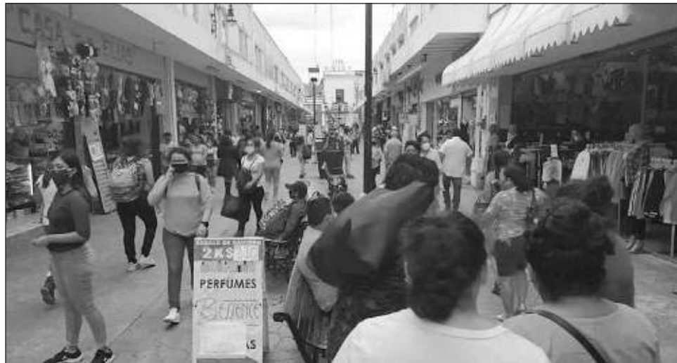
▲ Los negocios participantes en el programa Mujeres Seguras cuentan con una placa en su exterior, que los identifica como un lugar que cuenta con personal capacitado para ofrecer atención y acompañamiento en caso de situaciones de violencia.

El objetivo de este proyecto es brindar a las mujeres, mediante acciones afirmativas, espacios seguros para su desarrollo integral, basadas en la Ley General de Acceso de las Mujeres a una Vida Libre