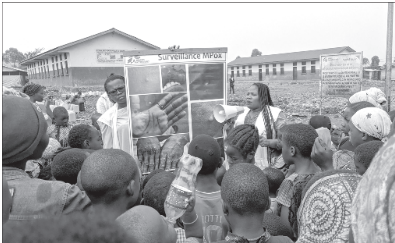
▲ El director de la OMS, Tedros Adhanom Ghebreyesus, expresó su preocupación por “la detección y la ampliación rápida del mpox en la RDC occidental, su detección en países vecinos y el potencial de una ampliación más amplia en África y más allá.

El número de casos en lo que va del 2024 superó el total del año pasado, con más de 14 mil diagnósticos y 524 muertes, según puso en mani-