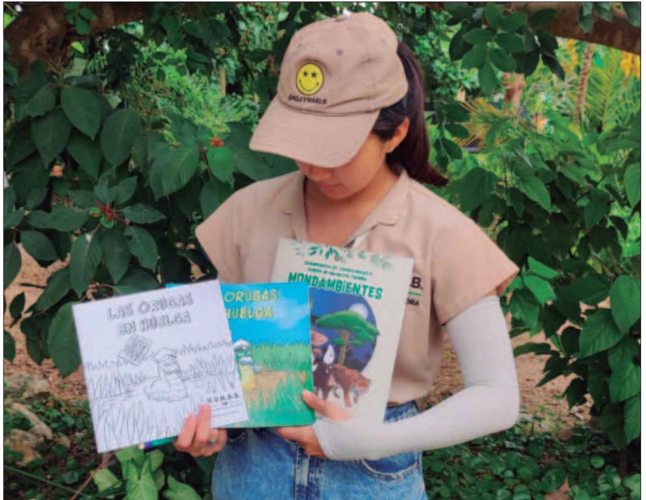
▲ El diplomado ambiental Héroes de la abuela Tierra , con duración de dos años, se realiza en el parque HUNAB Ceiba Pentandra, el cual tiene una extensión de una hectárea y tiene áreas como el jardín botánico.

“A los maestros les ofrecemos un set de capacitación ambiental para que desarrollen competencias”