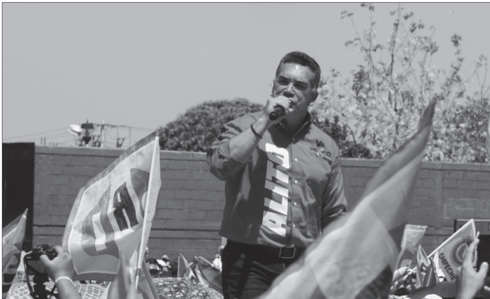
▲ "Moreno asumió la dirigencia nacional del PRI derechista en 2019, a partir de entonces entraron en un tobogán y pasaron de 12 gubernaturas a dos, de casi siete millones de militantes a poco más de un millón. En la presidencial de 2018 obtuvieron 9.2 millones de votos, este año 5.7 millones".