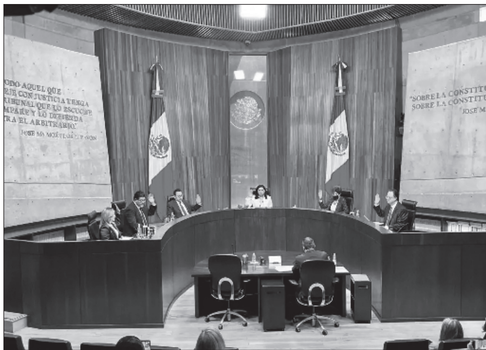
▲ Por unanimidad, la Sala Superior del Tribunal Electoral del Poder Judicial de la Federación declaró este miércoles la validez de la elección presidencial de 2024.

Al colmar también los requisitos constitucionales