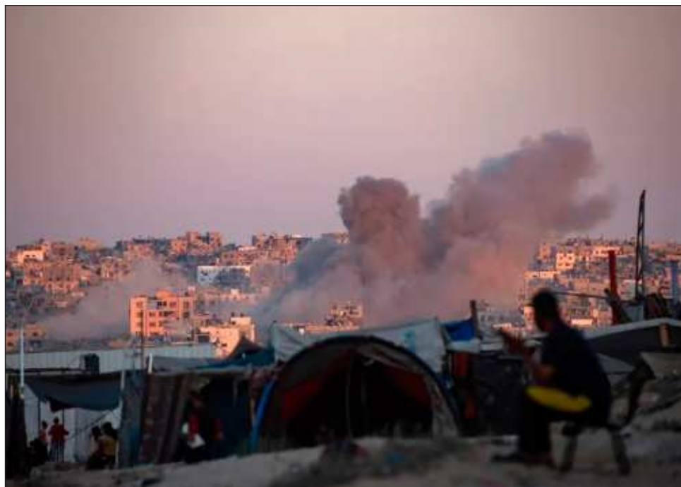
▲ Representantes de Hamas no confían en Estados Unidos como mediador y ponen en duda su asistencia. Israel dijo que el discurso de Biden no era totalmente coherente.

David Barnea, el jefe del Mosad, la agencia de inteligencia exterior de Israel, participará en las conversaciones junto al jefe del Shin Bet, la agencia de seguridad interior israelí. Un asesor especial de Netanyahu, formará también parte de las negociaciones, solicitadas por los mediadores Qatar, Estados Unidos y Egipto.