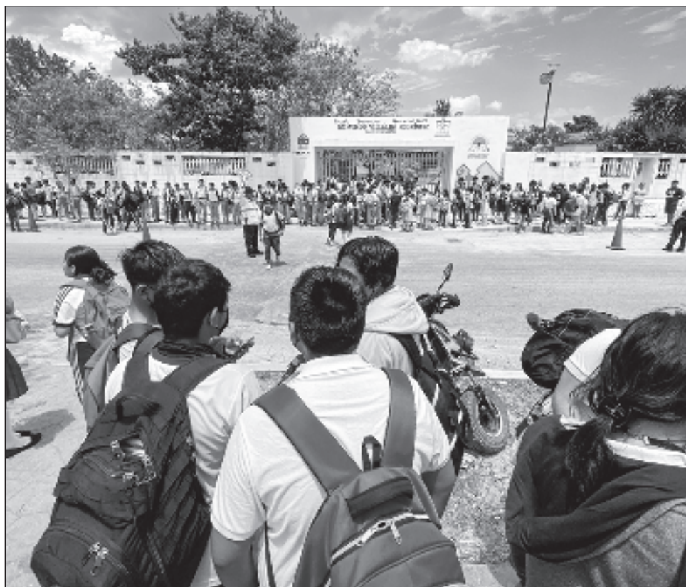
▲ La convivencia escolar: el desafío de ser, hacer y estar bien , elaborado por la Mejoredu, destaca que los contextos socioeconómicos que enfrentan los adolescentes impactan su desempeño.

Por lo general, esas situaciones responden, desde su percepción, a factores ubicados fuera del espacio escolar. Sin embargo, también pueden ser originadas por causas asociadas a las prácticas que tienen lugar dentro del plantel o bien por una combinación de ambas, destaca la comisión.