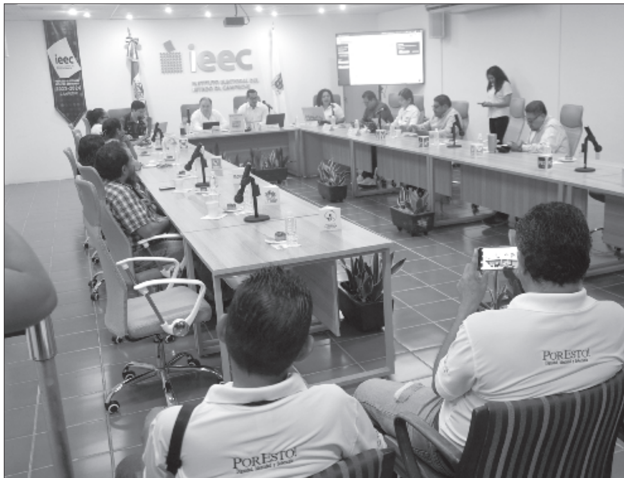
▲ Loreto Verdejo señaló que el proceso de investigación que consideró “va muy avanzado, las órdenes de aprehensión están pronto a liberarse, y como hemos dicho desde el principio, la justicia llega tarde o temprano”.

Finalmente, Verdejo Villacís recalcó que no puede dar mucha información por el debido proceso, así como para no alertar cómo, cuándo y dónde se darán conocer los detalles relacionados con este tema.