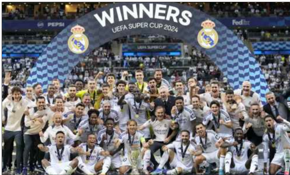
▲ Jugadores y personal del Real Madrid, tras conquistar la Supercopa de la UEFA.

El uruguayo Federico Valverde abrió el marcador tras un pase de Vinicius a los 59 minutos para encaminar al