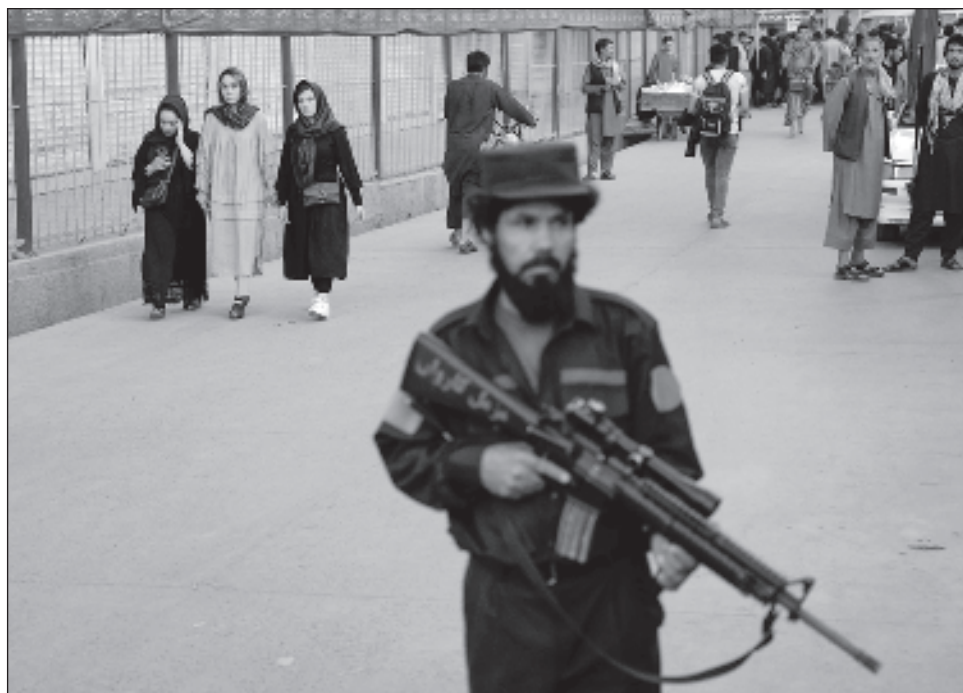
▲ Reporteros Sin Fronteras, que tiene su sede en París, señaló que el gobierno talibán “encarcela a los reporteros como si fueran delincuentes, bajo falsos pretextos”.

RSF, que tiene su sede en París, señaló que el gobierno talibán “encarcela a los reporteros como si fueran delincuentes, bajo falsos pretextos” y que, aunque a