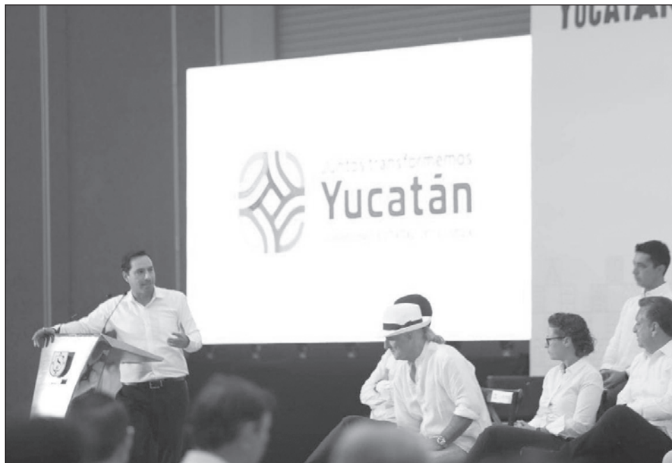
▲ En lo que va de la presente administración, se han logrado asegurar 45 mil millones de pesos en inversión turística a través de 300 proyectos.