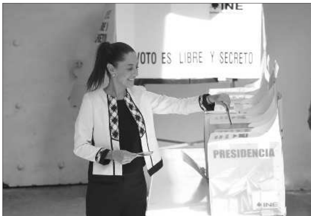
▲ Los casi 36 millones de ciudadanos que votaron por ella la convierten en la primera mujer no sólo en llegar a la Presidencia, sino que también llega con un muy alto grado de legitimidad.

Las matemáticas, y ahora la ley, son el soporte de la legitimidad de Claudia Sheinbaum como presidenta electa. Los casi 36 millones de ciudadanos que votaron por ella la convierten en la primera mujer no sólo en llegar a la Presidencia de México, sino que también llega con un muy alto grado de legitimidad. La misma asistencia a las urnas es la expresión de que a los mexicanos les resulta irrelevante que una mujer encabece el Ejecutivo federal, y eso siempre será positivo. Sin duda es un gran paso en la lucha de las mujeres por sus derechos políticos, y también señal de que hay muchas esperanzas depositadas en ella.