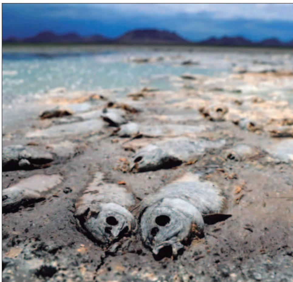
▲ La laguna de Bustillos, la laguna de Encinillas y la laguna Fierro pasaron de ser robustos cuerpos de agua a pequeños charcos rodeados de peces agonizantes o podridos.

Chihuahua, el estado más grande, es de los más afectados con sequía excepcional