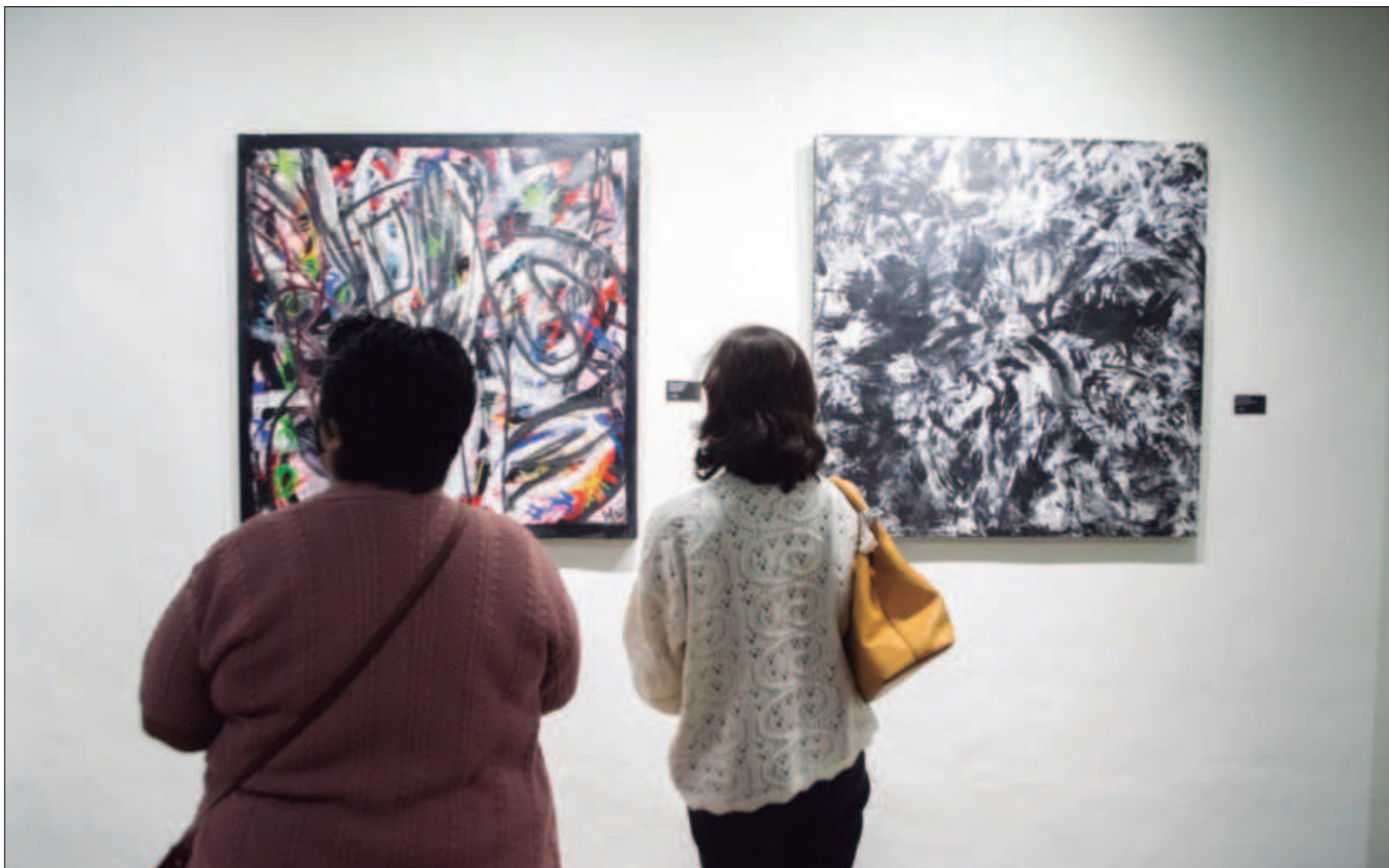
▲ “En la propuesta ha sido integrado un documento que permite vislumbrar fundamentalmente el enfoque que debe tener la gestión cultural; ha sido desarrollado el enfoque que está orientado hacia la cultura y el arte comunitario, aunque sin menoscabo de las individualidades”.