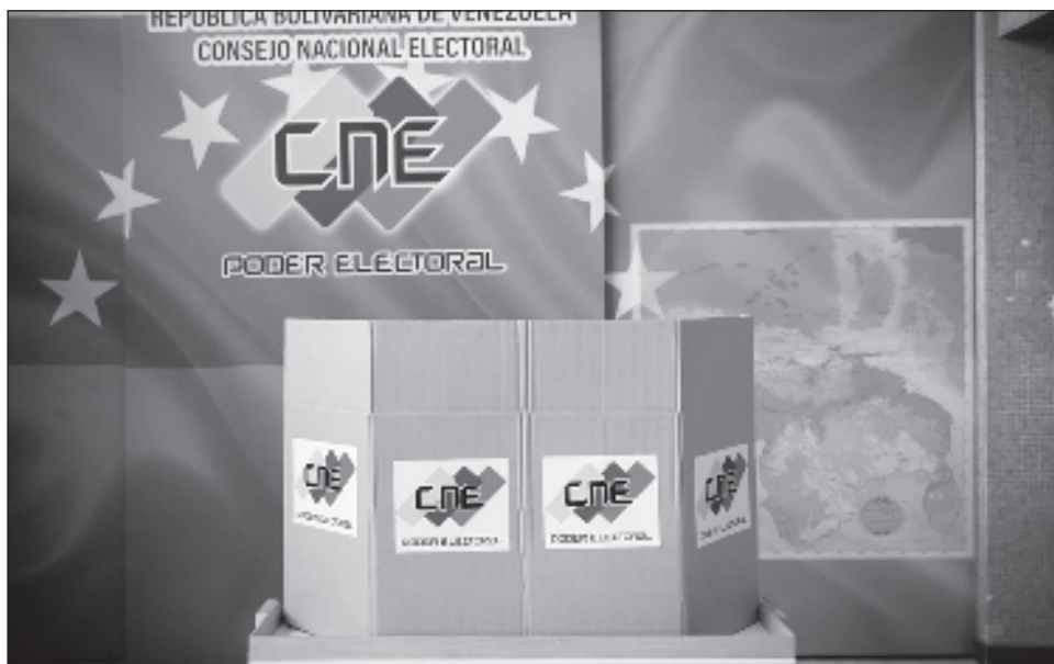
▲ El reporte era en principio privado para el secretario general Antonio Guterres, pero la ONU hizo público una versión preliminar en la que sostiene que el CNE “no cumplió con las medidas básicas de transparencia e integridad que son esenciales”.

El CNE -que aún no publicó el desglose de los resultados mesa por mesa- insistió en que su sistema fue blanco de un “ciberataque terrorista”: su sitio web sigue caído más de 15 días después de los comicios. “A pesar del retraso en el proceso de