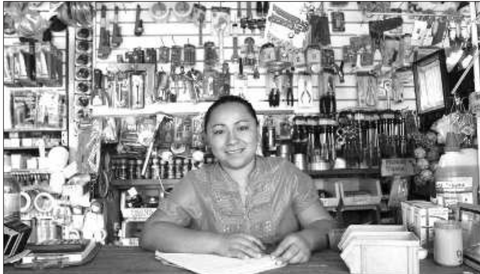
▲ El crecimiento registrado fue superior al presentado en el contexto nacional, que fue de 0.1%, posicionando a la entidad en el sexto lugar del país con mayor incremento.

Durante el periodo enero-junio de 2024, Yucatan