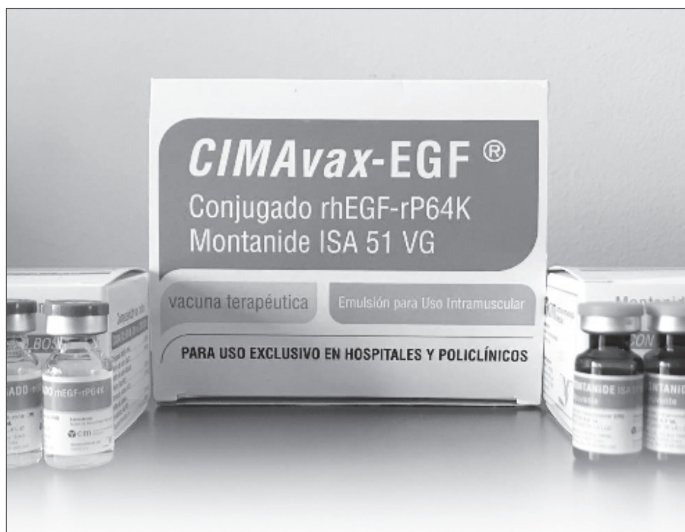
▲ Según sus desarrolladores, la vacuna Cimavax es una modalidad terapéutica cuyo mecanismo de acción consiste en la estimulación del sistema inmune del paciente.

El pasado 12 de julio, el Ministerio de Salud de esa nación europea, a través de su Centro Pericial y de Pruebas