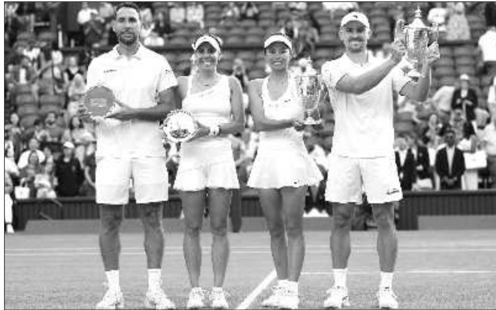
▲ Su-Wei Hsieh, segunda a la derecha, y Jan Zielinski, a la derecha, sostienen sus trofeos en alto mientras celebran tras derrotar a Santiago González, a la izquierda, y a Giuliana Olmos en Wimbledon.

Pese a mejorar un poco con el transcurso del en-