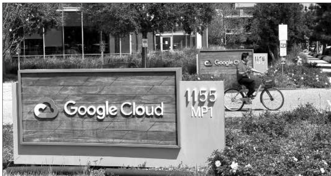
▲ La firma Wiz, fundada en Israel y con sede en NY, trabaja con múltiples proveedores de servicios; ofrece soluciones de ciberseguridad basadas en la nube con detección de amenazas en tiempo real y respuestas basadas en inteligencia artificial.

Si Alphabet sigue adelante con la compra, se trataría de un raro ejemplo de una gran empresa tecnológica que intenta una megaoperación en medio de un