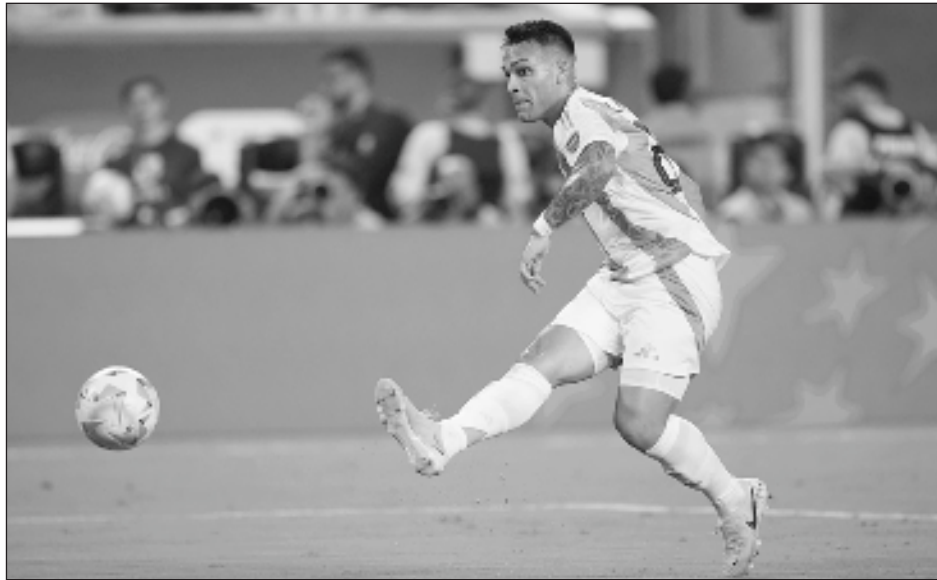
▲ Lautaro Martínez anota el gol del título 16 para Argentina en la Copa América.

Para Messi, que sufrió el final del partido compungido desde el banco, fue su sexto título con Argentina