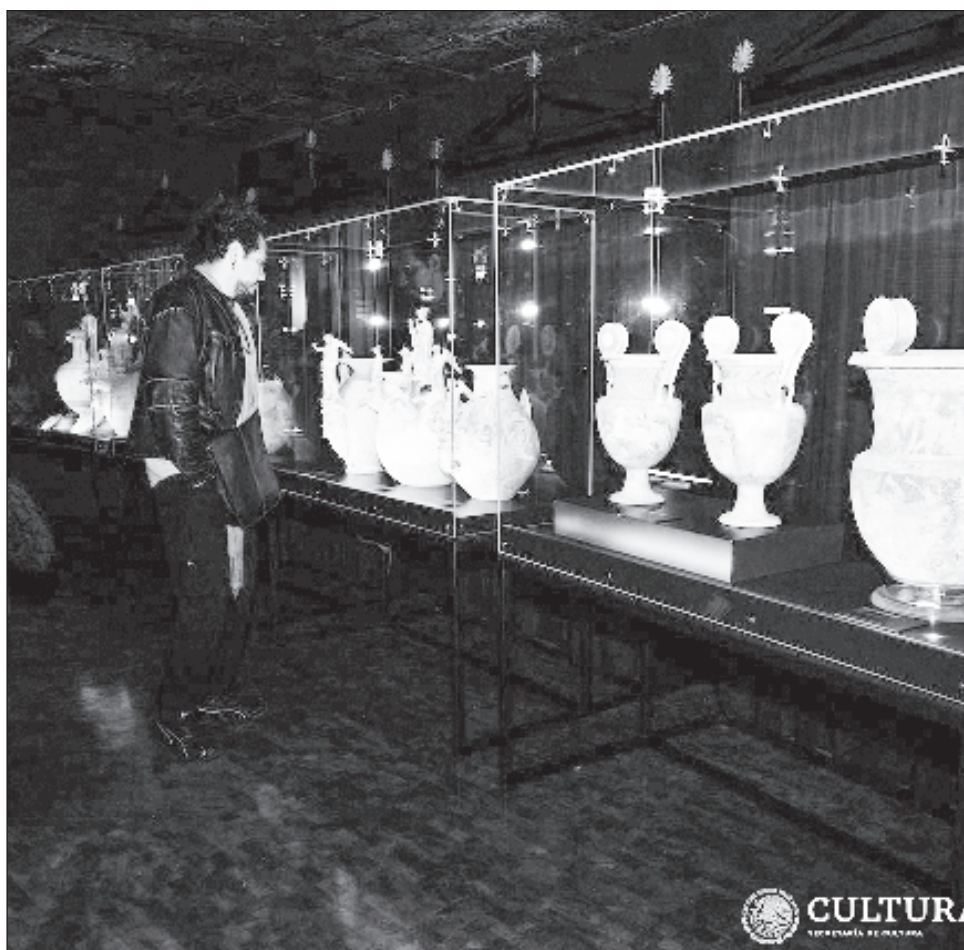
▲ Las piezas arqueológicas, que datan del siglo IV al III aC, ofrecen un acercamiento al estilo de vida de la cultura dauna, de la Italia prerromana.

La entrada a la exposición, que permanecerá hasta el 25 de agosto, es gratuita.