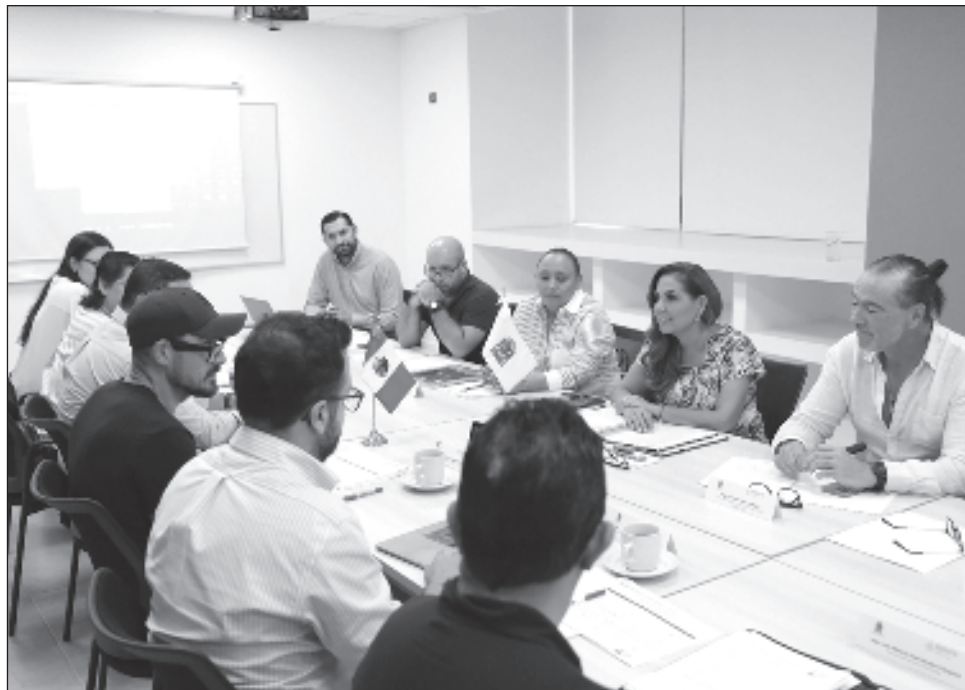
▲ La gobernadora Mara Lezama y el titular de la Sedatu, Román Meyer, instalaron juntos el Comité de Regularización de la colonia Luis Donald Colosio.

Informó que habrá cinco módulos de regularización y