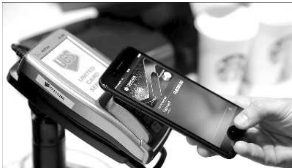
▲ De acuerdo con el Reporte global de fraudes 2024 , elaborado por Visa, en lo que corresponde al sector de pagos, los comerciantes han ampliado las ofertas de aceptación.

Se detalla que nueve de cada 10 mexicanos acostumbra usar efectivo en sus gastos diarios, mientras 16 por ciento usa tarjeta de débito, 4 por ciento tarjeta de crédito y solo 2 por ciento pagos electrónicos o transferencias por medio del Sistema de Pagos Electrónicos Interbancarios (SPEI).