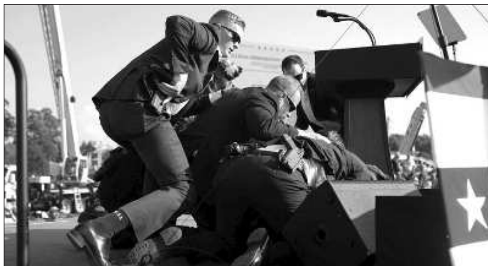
▲ El virtual candidato presidencial republicano dijo que la parte superior de su oreja derecha fue impactada en el tiroteo, sin embargo, sus asesores indicaron que Trump estaba "de buen ánimo".

"Supe inmediatamente que algo andaba mal porque escuché un zumbido, disparos e inmediatamente sentí la bala atravesando la piel", aseveró en una publicación en su red social Truth Social. "Hubo mucho sangrado".