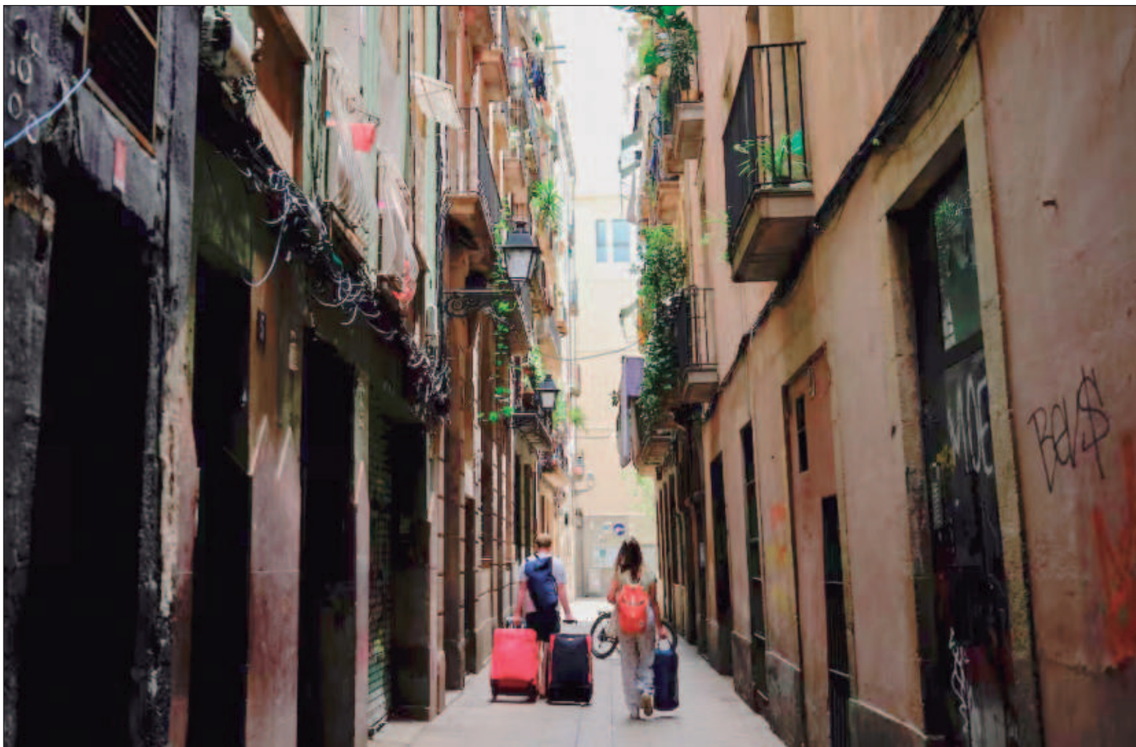
▲ "Una medida pionera a nivel mundial. Cada vez son más las ciudades que se están sumando a poner freno al turismo excesivo y descontrolado".