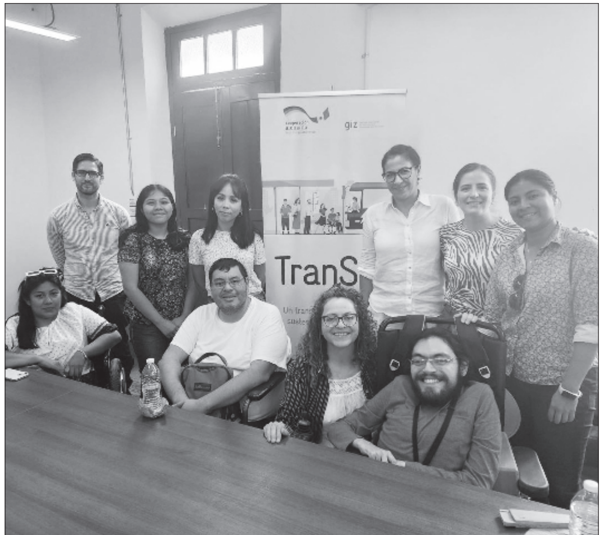
▲ “Nos parece muy acertada la convocatoria que la ATY hizo a mujeres y personas con discapacidad para compartir sus vivencias al utilizar el servicio que ofrece el Va y Ven (...) y que nutrirán el proyecto TransSIT”.

EN EL CASO de las mujeres, asistimos dos estudiantes, una de licenciatura y otra de posgrado, así como una trabajadora y una cuidadora primaria, quienes coincidimos en que nuestros patrones de viaje tienen un fuerte componente de género, pues en compa-