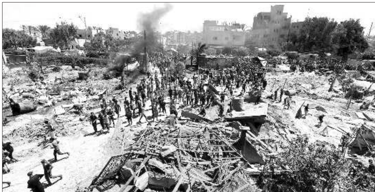
▲ Hamas señaló que se está dispuesto "a retomar las negociaciones" cuando el Estado judío "muestre seriedad para concluir un acuerdo de alto el fuego" y liberar a los rehenes en Gaza a cambio de prisioneros palestinos en Israel.

La Defensa Civil del territorio indicó que 15 personas murieron en el ataque.