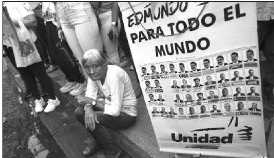
▲ La líder opositora María Corina Machado subrayó que “esto lejos de intimidarnos lo que ha dado es mayor energía y organización. Esto no lo para nadie”.

“Estamos viendo una escalada en la represión con la detención de activistas de distintos partidos políticos, miembros de nuestros comandos de campaña a nivel municipal e incluso parroquial, pero además de personas que lo único que han hecho es ofrecernos sus servicios”, dijo a periodistas María Corina Machado, líder de la oposición junto al can-