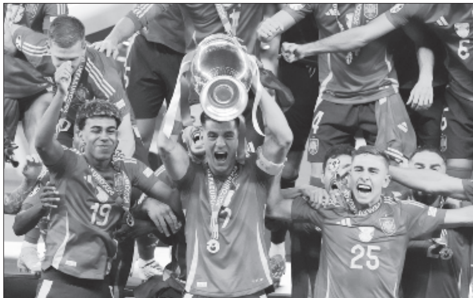
▲ El capitán español Álvaro Morata alza el trofeo de campeones de la Eurocopa en Berlín.

"Hemos sufrido como animales. No somos conscientes de lo que hemos logrado y lo que se está viviendo en España. Hemos hecho historia", dijo Williams. "Campeones de Europa y ahora por el mundial (de 2026)".