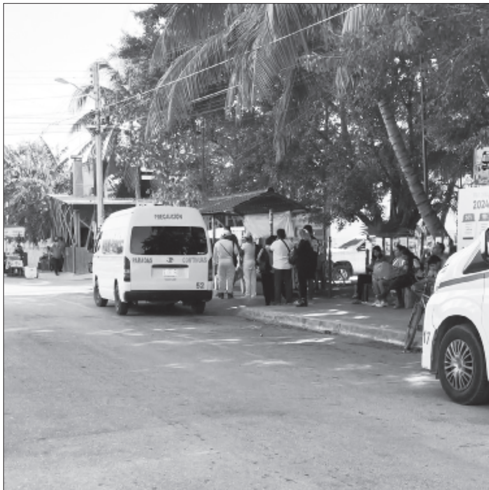
▲ Actualmente, hay entre 50 y 60 unidades dando el servicio urbano en colonias como Tumbenká, Ya'ax Tulum, Xul Há, Las Palmas y Ejido, entre otras.

“Yo creo que con base en el desarrollo y crecimiento que tenemos como municipio, y sobre todo como ciudad, es necesario reorganizar el servicio con las camionetas que tenemos. Recordemos que son transportes colectivos locales con un precio bastante económico, tomando en cuenta el tema del alza del combustible, de las refacciones, mantenimientos, llantas y lo que conlleva el tener una operación unidades, sería nada más reorganizar esas rutas y volver a estructurar todas en conjunto con las autoridades”, acentuó.