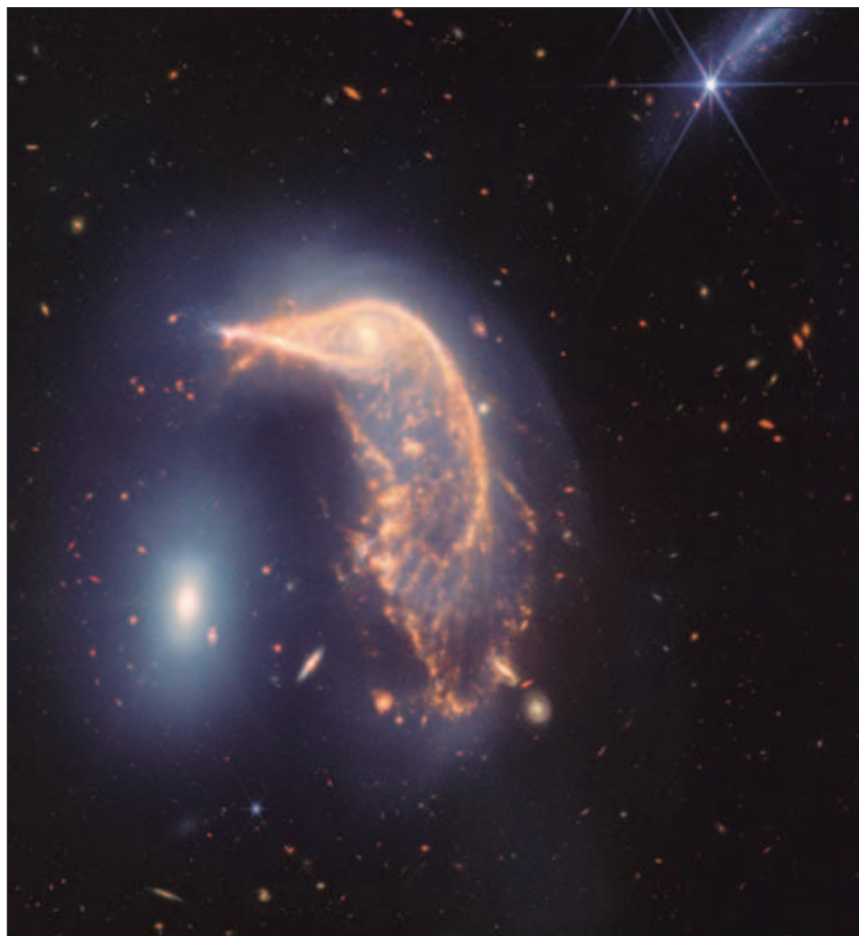
▲ La interacción en curso de las galaxias el Pingüino y el Huevo, conocidas colectivamente como Arp 142, se puso en marcha entre 25 y 75 millones de años atrás.

Como todas las galaxias espirales, el Pingüino todavía es muy rico en gas y polvo. La "danza" de las galaxias atrajo gravitacionalmente las áreas más delgadas de gas y polvo del