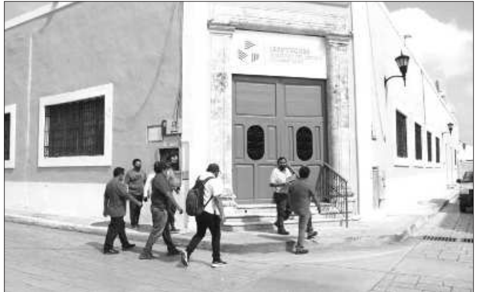
▲ Si el ISSSTECAM accede a otorgar los 800 préstamos, cada empleado sólo podría acceder a créditos por 6 mil 250 pesos, es decir, menos de 30 por ciento que se habría solicitado.

Por el contrario, si el ISSSTECAM accede a otor-