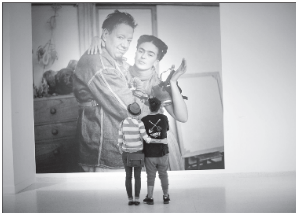
▲ Kahlo aún conecta y conmueve. Enmudece a espectadores en museos. Mantiene el interés de los fanáticos que llevan su imagen en bolsos, camisetas y gorros.

Kahlo, en cambio, se siente cercana. En obras como El venado herido , que