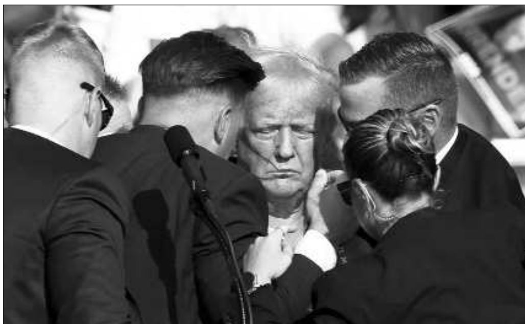
▲ Partidarios del republicano señalaron a “la izquierda” y “al comunismo” como puntos de origen de la agresión, en lo que constituye un reflejo del discurso trumpiano.

A lo que puede verse, pues, el condenable atentado de Butler puede acelerar el curso de la sociedad estadounidense hacia un abismo de violencia descontrolada y generalizada. Ojalá que no sea el caso.