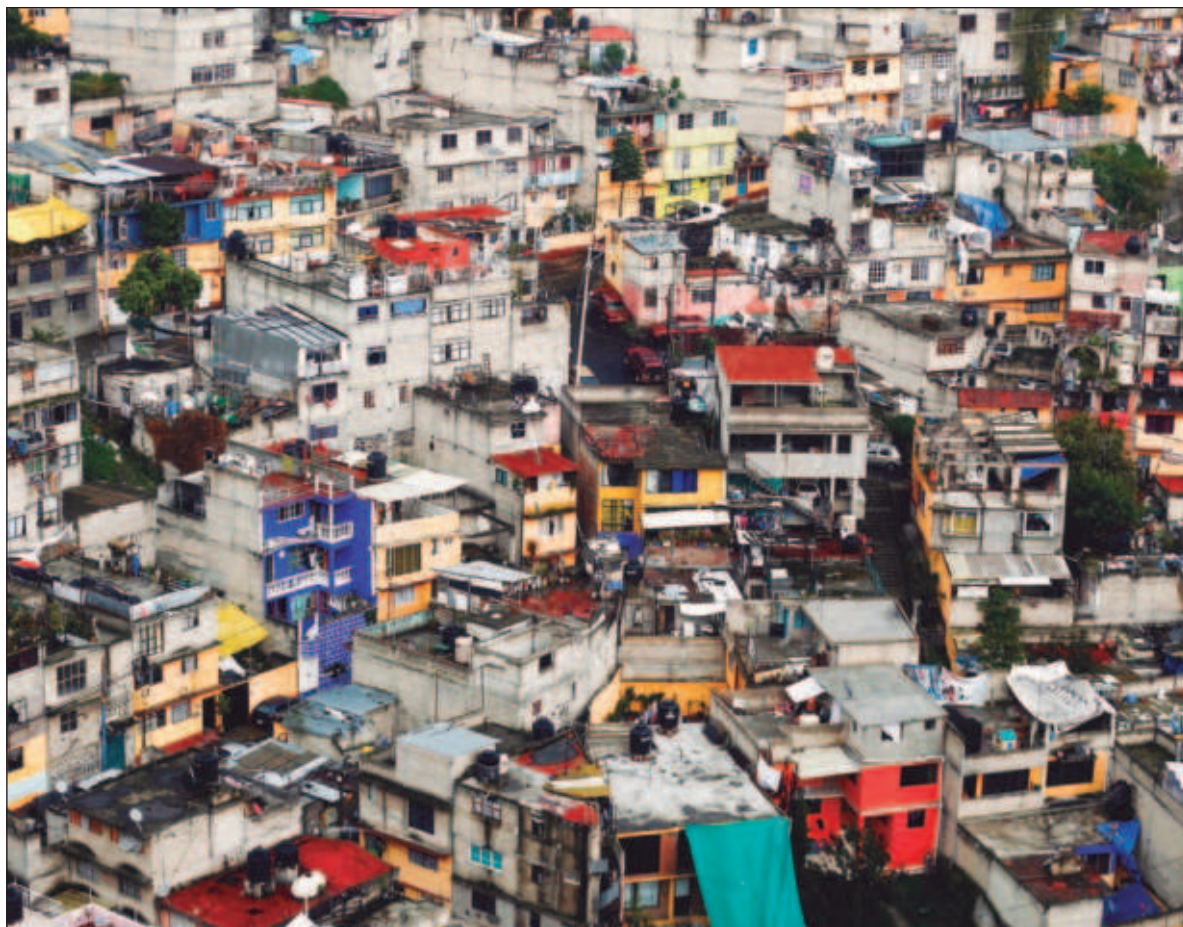
▲ "Esa agenda global, aprobada en 2015 por 193 estados miembros de Naciones Unidas, busca erradicar la pobreza en todas sus formas y construir sociedades más inclusivas, equitativas, sostenibles y en paz".

El primero es la pluralidad de voces que se suman. Además del informe nacional, México habrá presentado 35 informes de gobiernos locales sobre la Agenda 2030 antes de que finalice el año, posicionándose como uno de los líderes mundiales en estos ejercicios de rendición de cuentas.