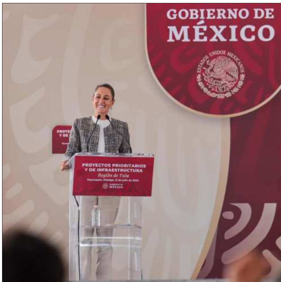
▲ El presidente López Obrador expresó su satisfacción por el triunfo de Sheinbaum porque con ello se garantiza la continuidad de los programas sociales.

“Y también, y muy importante, el ejercicio de auditorías, porque lo que dice es que la corte emitió una jurisprudencia que dice, en contra de lo que dice la ley, que la Auditoría Superior de la Federación, no tiene competencia para realizar auditorías a los órganos del Poder Judicial de la Federación”, dijo.