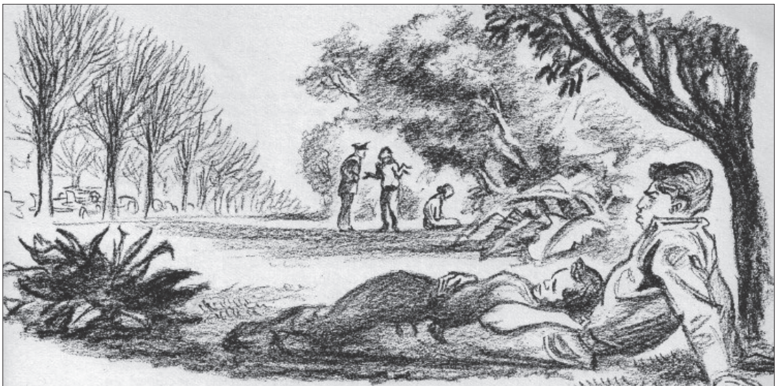
▲ “A pesar de tantos sinsabores, Chapultepec no ha dejado de ser el refugio de los novios (...) Llegan los estudiantes con sus libros bajo el brazo, la pícaro secretaria descende del Cadillac del jefe y los señores ya grandes declaran: ‘Yo, cuando quiero descansar de la agitación, de la rutina, voy a Chapultepec’”.

Al irse los deportistas, toca el turno de los colegiales que canjean el pupitre por un tronco de árbol. Preparan el examen final entre los rayos de sol que se filtran en las ramas de los más altos ahuehuetes. Casi todos escogen la calzada de los Filósofos, al lado de la fuente de don Quijote. Al rato, transfieren su buena voluntad a una barca de remos... Sólo las sombras van diciendo las horas... En las orillas del lago, los niños juegan a los bandidos. Sus brazos son fusiles imaginarios y se balacean con la voz desde posiciones estratégicas entre las cuevas de hormigón: “Ta-ta-ta-ta-tá. ¡Ya te maté! ¡Cáete tramposo!” Junto al agua se detienen las muchachas vestidas de colores encendidos y tobilleras rocanroleras. Sonríen a los estudiantes remeros y hasta contestan a sus llamados. Pero apenas se acercan a la orilla para invitarlas a dar una vuelta, las muchachas se alejan envueltas en su gran meneo de faldas y de pequeñas risas.