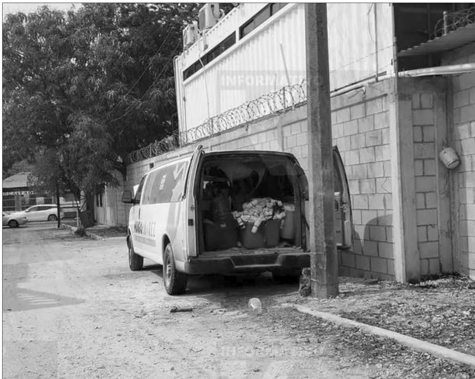
▲ Estos hechos ponen en alerta a la población ante el clima de violencia que pudiera registrarse en la jornada electoral del 2 de junio.