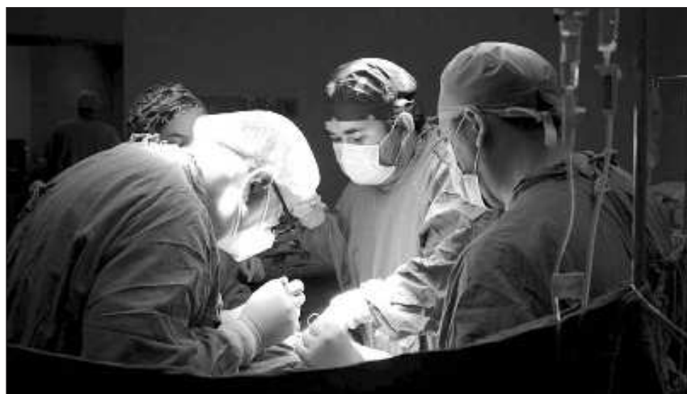
▲ En esta procuración infantil se obtuvieron hígado y dos riñones, se trasladaron vía aérea a Toluca y después a la Ciudad de México, a fin de realizar los trasplantes a niños en lista de espera del Cenatra.

El pequeño superhéroe, como le dejaban ver sus padres, era el niño más carismático de la familia, tenía siete años cumplidos y en la emergencia que presentó fue trasladado a la clínica más cercana donde se confirmó el accidente cerebrovascular hemorrágico.