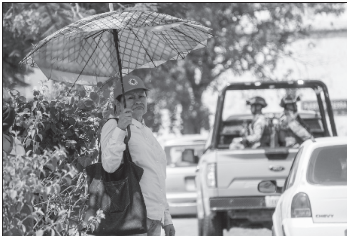
▲ "Las propuestas para mejorar la calidad de vida de las mujeres en condición de pobreza se centraron en mantener o aumentar los programas sociales, con preponderancia en las transferencias monetarias condicionadas".

POR EJEMPLO, ACTUALMENTE los salarios de las servidoras públicas de los centros de atención (rosas