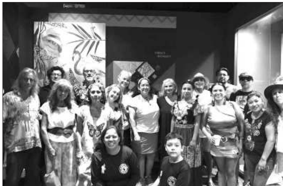
▲ En el Primer Festival por el Día Internacional de la Tierra habrá, entre otras actividades, exposiciones pictóricas, talleres, conciertos, rally y concursos.

"Esta es la primera edición de este festival, esperamos que este hermanamiento de diferentes organizaciones, colectivos e instituciones comprometidas con el arte y la cultura de manera personal y consciente se hagan cada vez más grande. Uno de los objetivos del festival es ge-