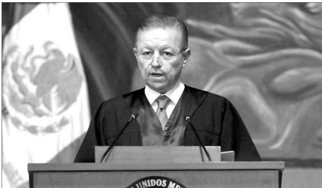
▲ Arturo Zaldívar ya no está obligado tampoco a declarar su patrimonio, por lo cual la Corte no está facultada, en el caso del ministro en retiro y ex presidente del máximo tribunal, a "proponer al titular de la contraloría lineamientos para llevar a cabo investigaciones de oficio".

Los integrantes de la Corte consultados por La