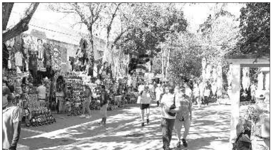
▲ En esta temporada vacacional destacó la preferencia de turistas por artículos que les permitan disfrutar de actividades al aire libre de manera más cómoda y segura.