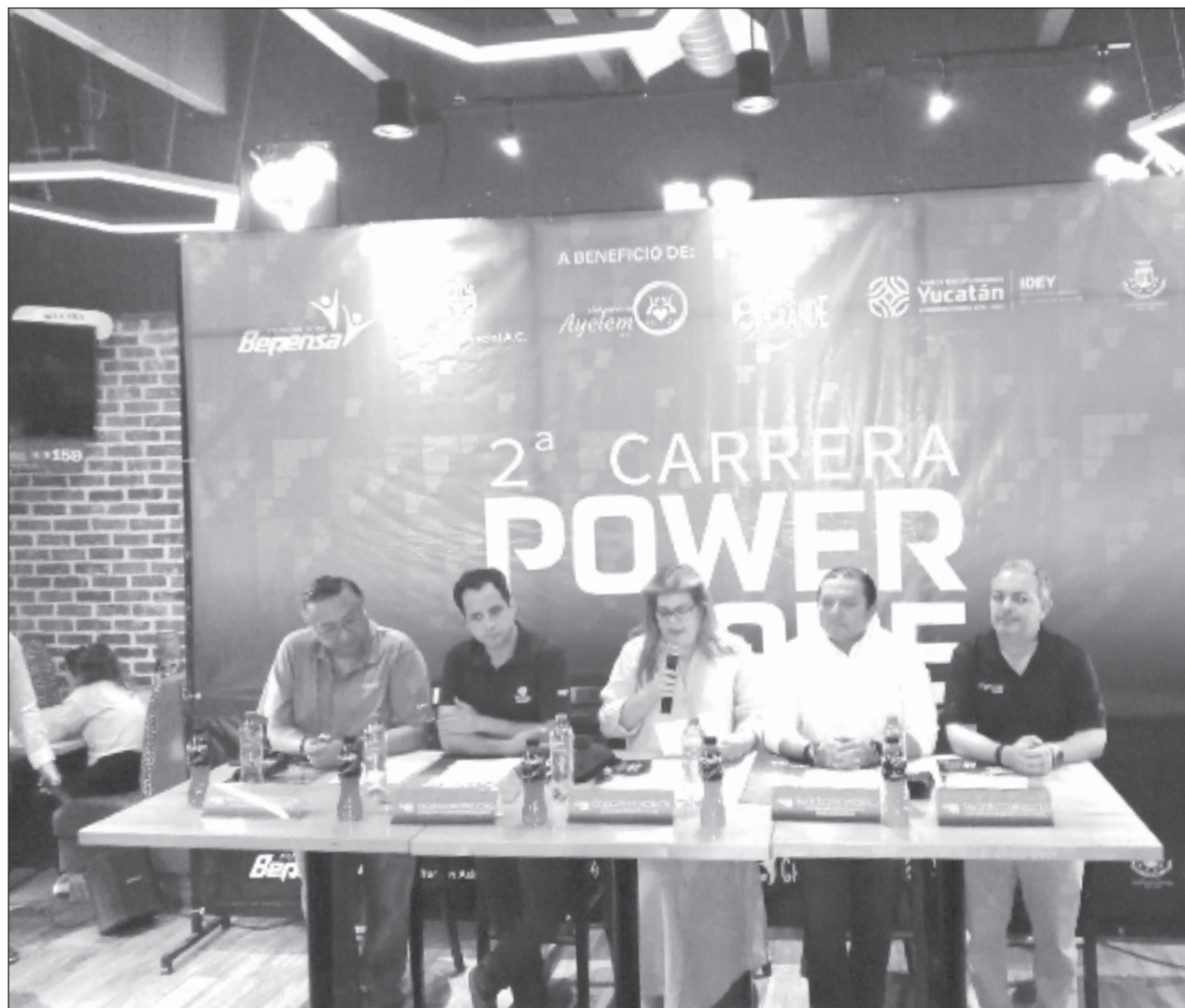
▲ La carrera con causa, que se llevará a cabo a lo largo de la Avenida 128, apoyará a las asociaciones civiles Club Especial Ayelem, Institución Asistencial A.C. y al programa Ser Grande de Fundación Bepensa.