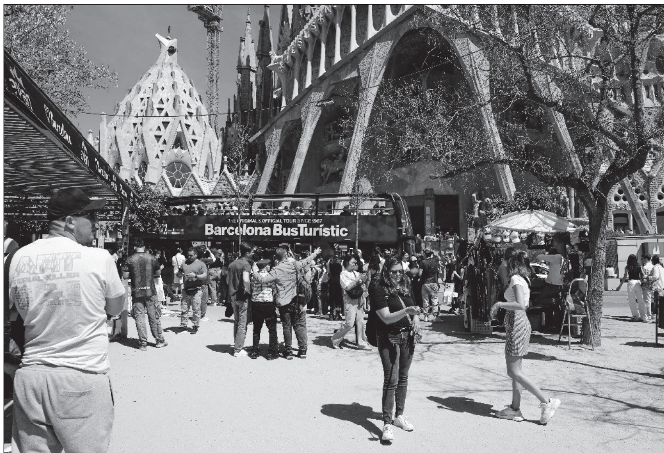
▲ El fenómeno de montaviajes consiste en que empresas turísticas en Internet ofrecen a los usuarios un viaje de muy buen costo, y una vez que las personas realizan algún pago, en su mayoría virtuales, las supuestas firmas desaparecen.

Algunas firmas tecnológicas han anunciado herramientas para prevenir este tipo de delitos