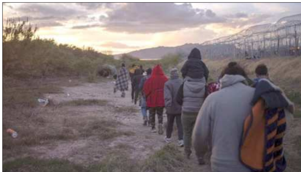
▲ En los núcleos familiares había 17 personas de Colombia (ocho de ellas niñas, niños y adolescentes), siete personas de Bolivia (dos de ellas niñas, niños y adolescentes) y nueve de Brasil.

En los núcleos familiares había 17 personas de Colom-