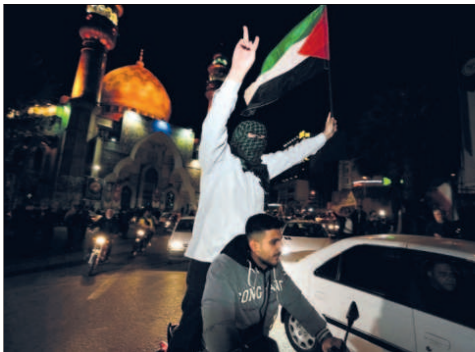
▲ En el transcurso de las dos últimas semanas, las autoridades iraníes afirmaron su voluntad de “castigar” a Israel tras la muerte de siete Guardianes de la Revolución.

Pocas horas antes del ataque contra Israel, Irán capturó en el estrecho de Ormuz un portacontenedores “vinculado” a Israel con 25 tripulantes a bordo, hecho calificado por Estados Unidos como un “acto de piratería”.