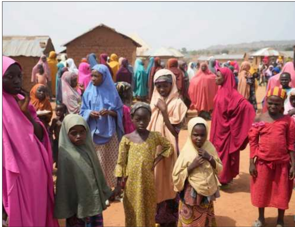
▲ Poco después del secuestro de Chibok hace una década, 57 niñas lograron escapar y más de un centenar fueron rescatadas o liberadas luego de que los islamistas llegaron a acuerdos con las autoridades.

El ejército reforzó su presencia en el lugar y la escuela donde fueron secuestradas las 276 niñas en 2014, que reabrió sus puertas en 2021, está ahora protegida