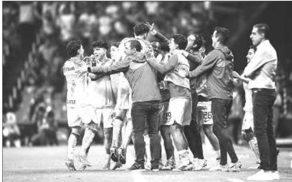
▲ Las Águilas arrasaron con el Toluca para regresar al primer lugar