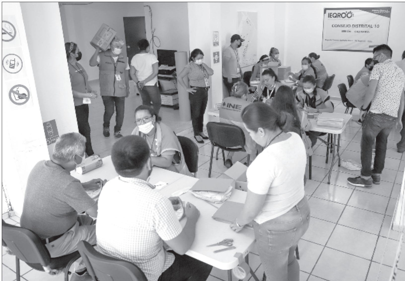
▲ El Instituto Electoral de Quintana Roo entregó las respectivas constancias que acreditan como candidatos oficiales a los contendientes y se declaró listo para el proceso, también organizará debates públicos entre candidatos, siempre y cuando existan solicitudes por escrito.

La Dirección de Partidos Políticos del Ieqroo indicó que organizará debates públicos entre candidatos, siempre y cuando existan solicitudes por escrito de cuando menos dos candidatos a un mismo cargo de elección popular; el plazo para la recepción de las solicitudes será dentro de los cinco días posteriores al inicio del periodo de campaña.