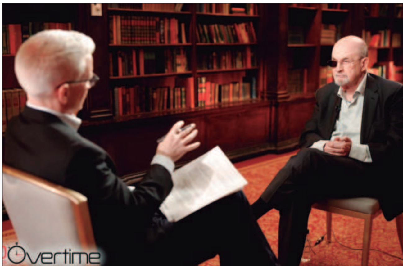
▲ El ataque contra el novelista ocurrió el 12 de agosto de 2022, minutos antes de que presidiera una charla en el auditorio de la Institución Chautauqua, en Nueva York: perdió la vista de un ojo y una mano quedó incapacitada. Foto captura de pantalla

Algunas de sus obras más sobresalientes son Hijos de la medianoche , El último suspiro del moro , Joseph Anton y Quijote .