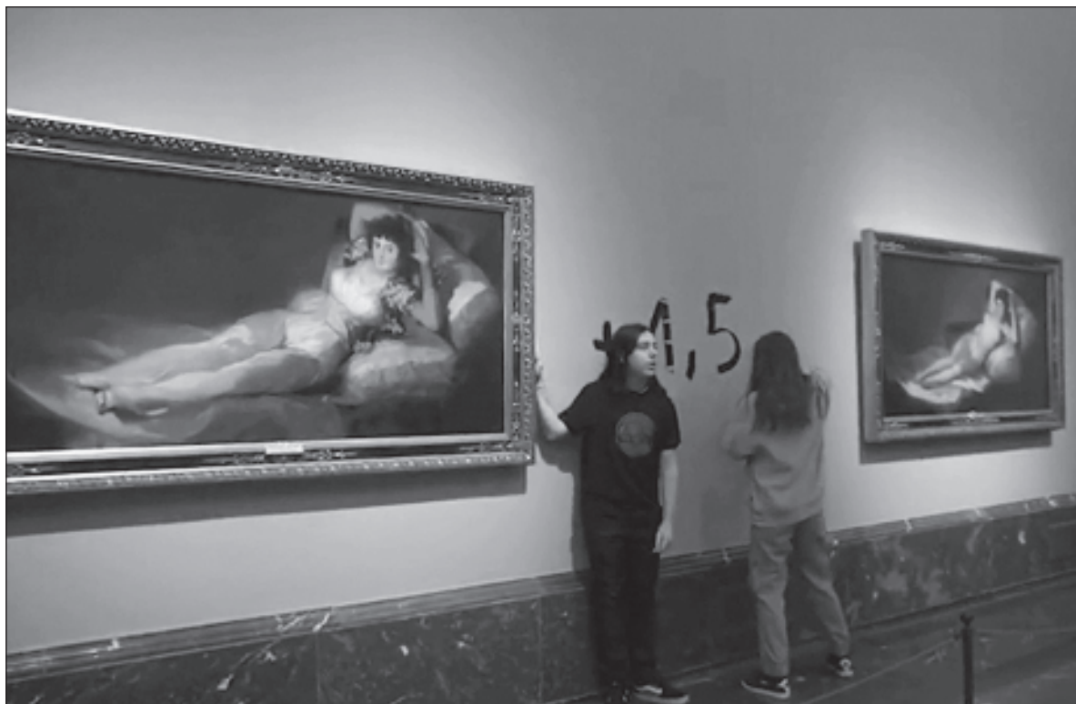
▲ “Detener a dos periodistas por fotografiar una protesta junto a dos Goyas en el Museo del Prado es una medida totalmente desproporcionada. Deben quedar ya en libertad y que prevalezca el derecho a la información”.