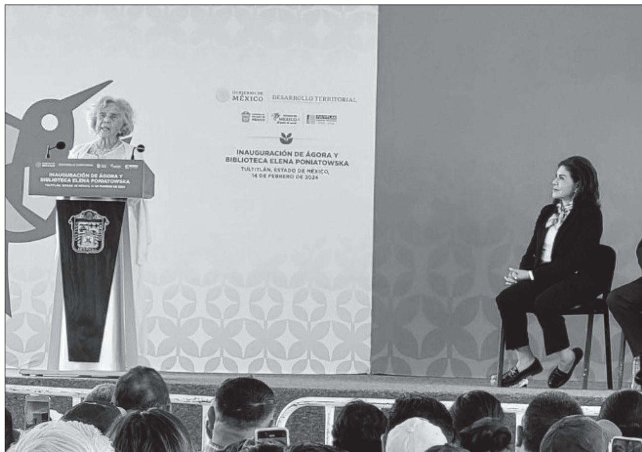
▲ Durante su discurso en la inauguración del Centro Cultural la escritora destacó su gusto por los libros: “los vivo, los respiro, me despiertan (...) desde su primera página me hará sentir que soy la mujer mejor acompañada del mundo”.

“Leo a Gabriel García Márquez, y Aureliano Buendía me cubre con sus pescaditos de oro de su imaginación. Leo los Muros de Agua de José Revueltas, y aprendo del combate del combate de un pescador en un mar embravecido. Leo a Rosario Castellanos y a través de 291 páginas me enseñan todo lo que las mujeres deberíamos saber sobre el desamor. Leo a Hermann Bellinghausen y entiendo a mi época, así como Guillermo Bonfil me hizo comprender al México profundo, el México Prehispánico y José Emilio Pacheco a la Ciudad de México. Leo a Carlos Monsiváis, y sé que