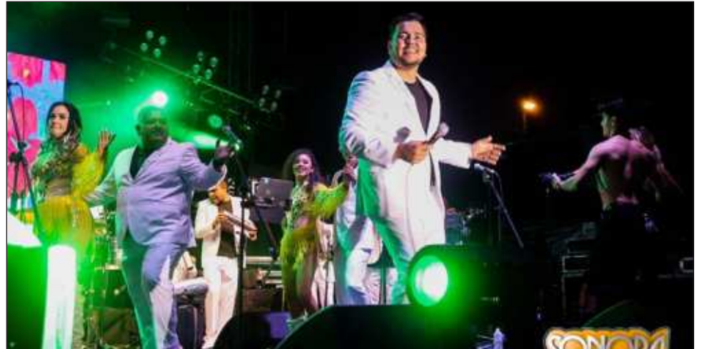
▲ La cartelera de la fiesta del Caribe incluye las presentaciones de reconocidos grupos como La Sonora Dinamita, Tierra Sagrada y La Trakalosa.

Habrán de 10 a 15 carros alegóricos, entre escuelas, dependencias y también empresas cerveceras, de refrescos y botanas, para amenizar este evento.