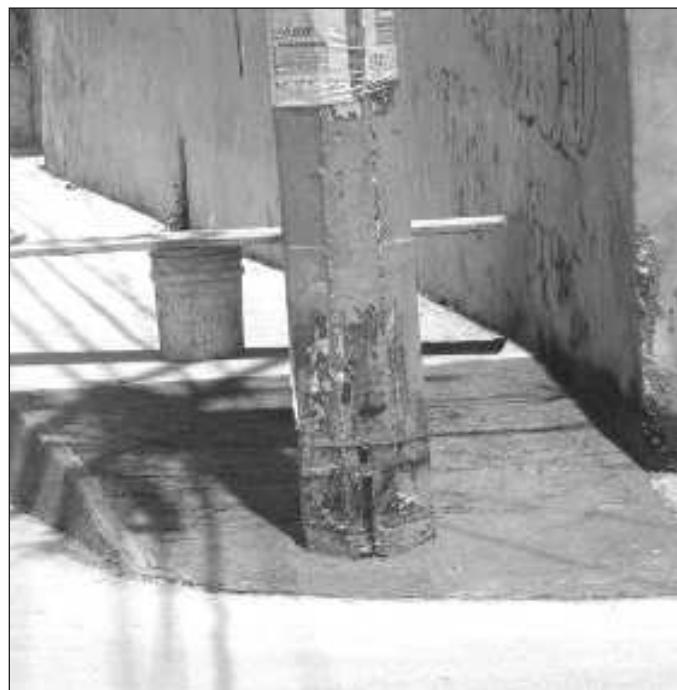
▲ La inclusión y la calidad de vida inician cuando la oportunidad de acceder y disfrutar del espacio público es para todos, independientemente de su condición de discapacidad.

Resulta muy distinto hablar de oficinas y sitios públicos accesibles para quienes requieren de un apoyo para desplazarse. Aquí suele haber adelantos, o podemos hablar de un piso mínimo en el cual hallamos rampas