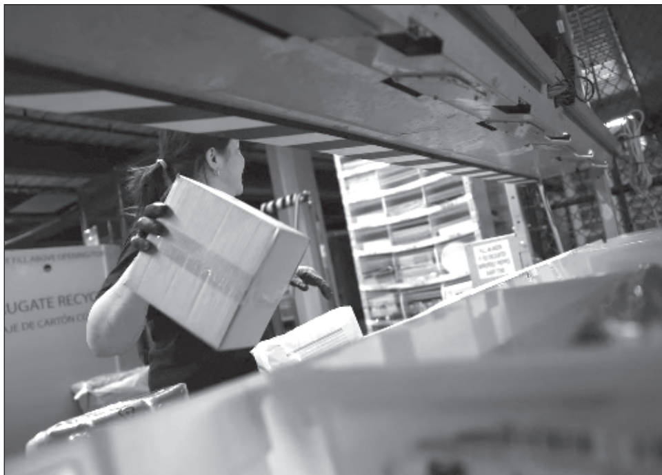
▲ Los proyectos de empresas como FedEx, Uber y Mercado Libre, beneficiarán a 13 mil 900 mujeres, más de 5 mil 100 jóvenes y más de mil 360 miembros de comunidades indígenas.