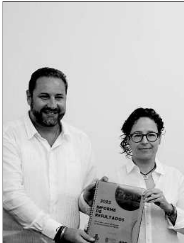
▲ Al inicio de la administración municipal, el porcentaje de turismo nacional y extranjero que llegaba al estado era de 8%, cifra que ahora en día asciende al 19%.