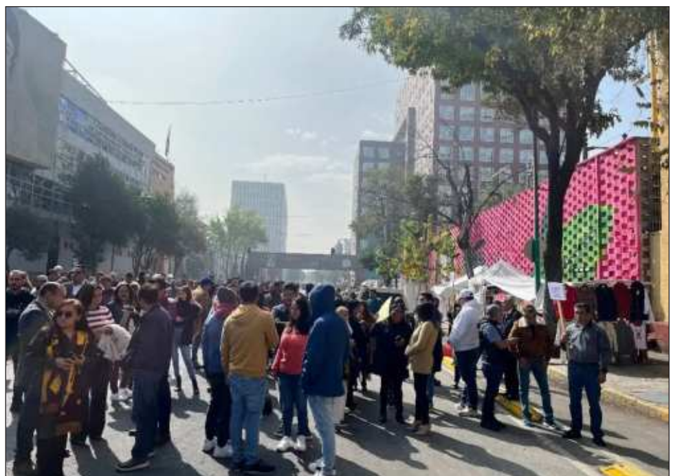
▲ El jefe de Gobierno de la Ciudad de México, Martí Batres, reportó saldo blanco en la capital del país, luego de dos microsismos registrados el miércoles con intervalo de un minuto y epicentro en La Magdalena Contreras.

El primero ocurrió a las 06:42 horas con una magnitud de 2.8 y el segundo a las 06:43 de magnitud 1.8 en la región norte de dicha alcaldía. Ambos se percibieron en algunas colonias de esa demarcación.