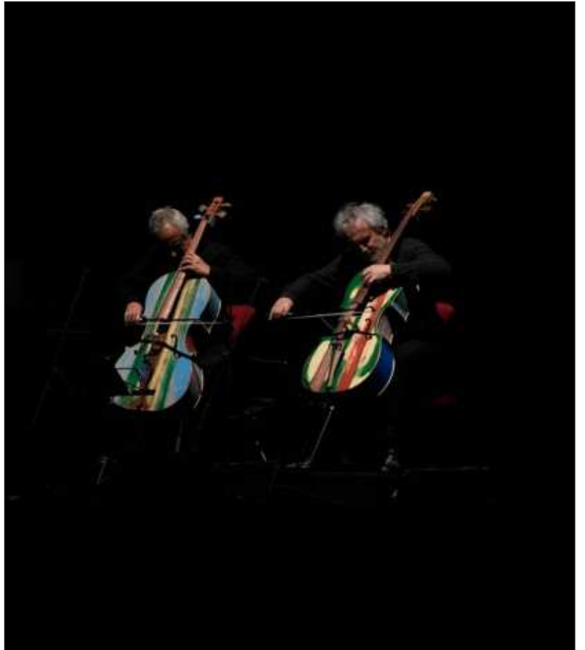
▲ Violines fabricados con la madera de barcos de migrantes que llegaron a la isla italiana de Lampedusa resuenan en el teatro de La Scala de Milán, en un homenaje para dar voz a quienes murieron ahogados