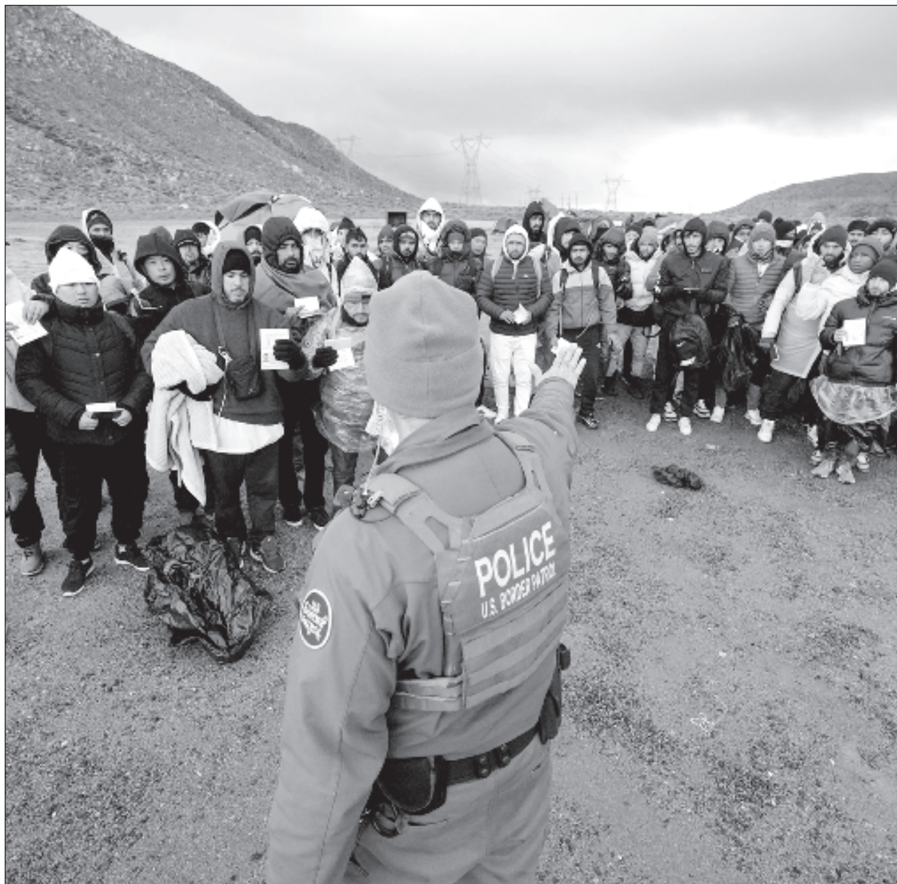
▲ En enero la patrulla fronteriza interceptó a migrantes y solicitantes de asilo 124 mil 220 veces entre puertos de entrada, "una disminución de 50%" respecto al mes anterior (249 mil 785), afirma en un comunicado divulgado el martes.

"La mayoría de las personas interceptadas en la frontera suroeste durante los últimos tres años han sido deportadas, devueltas o expulsadas", afirma el comunicado.