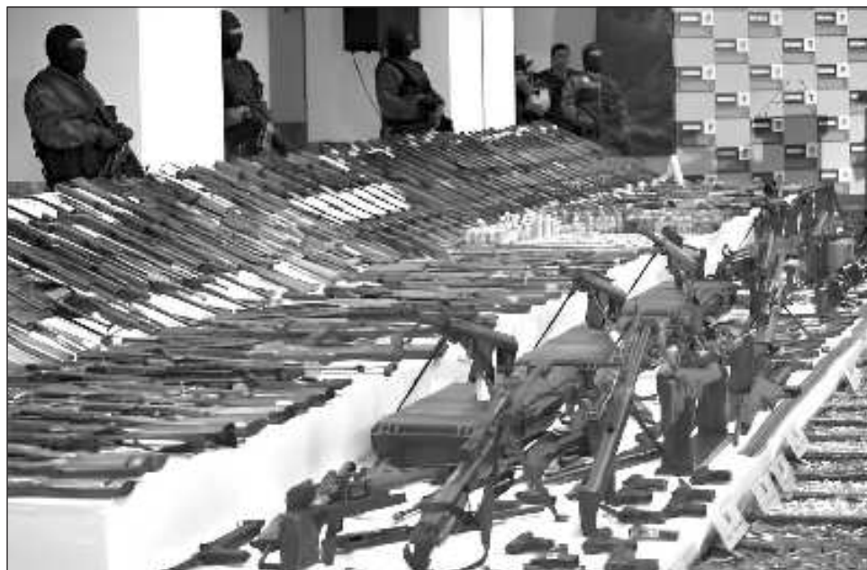
▲ Desde EU provienen 70% de las armas que utiliza el crimen organizado en México.

Y agregó: “la mitad de las armas que ingresan desde Estados Unidos, de ese 70 por ciento que vienen de allá, provienen de Texas, ¿qué me responde a esto el gobernador de Texas? Hay que estar informando. Siempre va a haber esas balandronadas que van a intervenir y tomar medidas unilaterales. No hay que tomarlas muy en serio porque