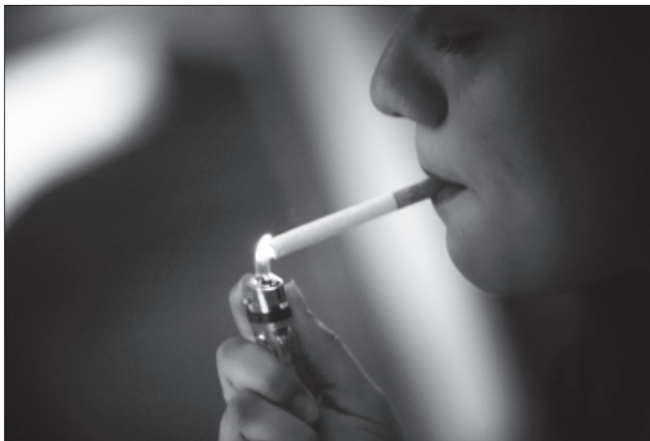
▲ La pesquisa destaca un factor hasta ahora ignorado: el sistema inmune adaptativo, que se construye con infecciones, permanece dañado durante años tras fumar.

Agregó el titular de Canal 22 que las humanidades sonarán mucho en estas emisiones y que los programas de José Gordon conllevan siempre un amor por el país y la conciencia de la relación de la ciencia con el arte, y con los científicos que nos presenta de una manera cercana.