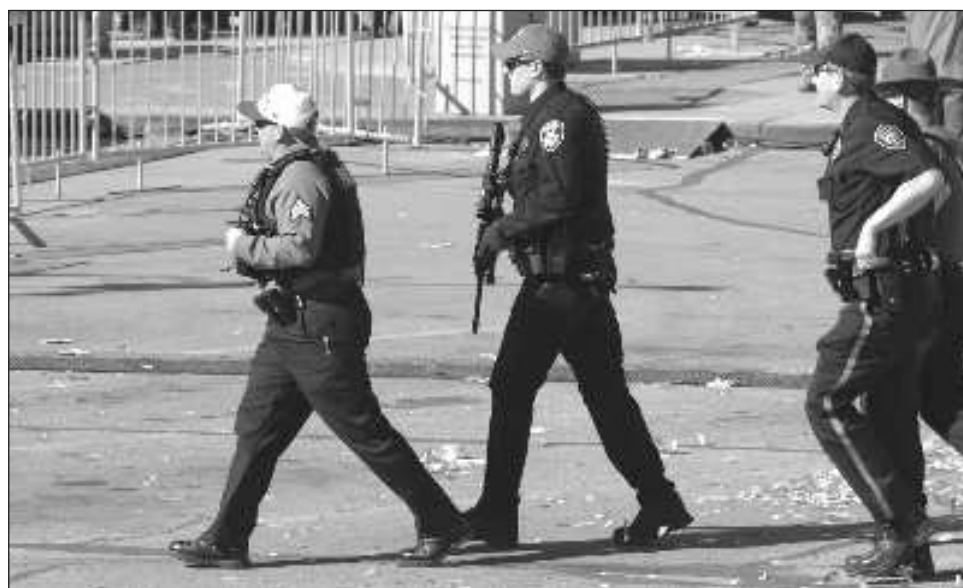
▲ Policias arriban a Union Station tras el tiroteo en el desfile por el campeonato de los Jefes.

Medios locales dieron a conocer que un número importante de víctimas podrían ser menores de edad, ya que el Hospital Infantil Mercy recibió a una docena de pacientes.