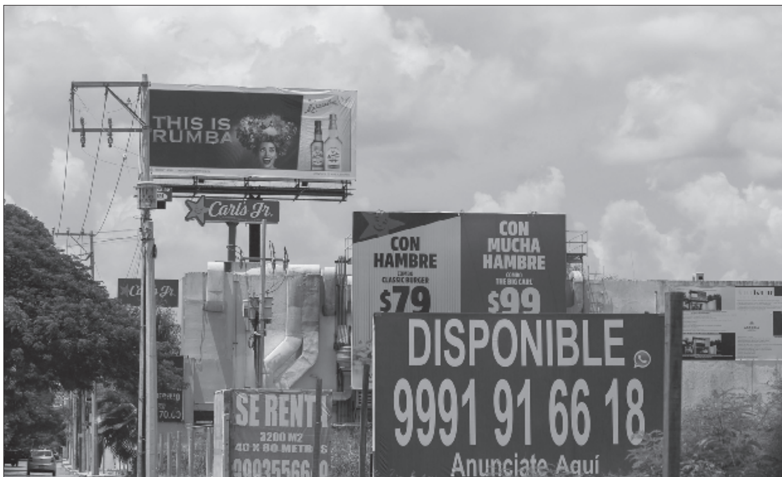
▲ “El juicio de la historia es implacable y con toda la información que se tiene, la mayoría de quienes han gobernado nuestro país, salen reprobados por sus hechos y los resultados de sus acciones (...) por eso es necesario conocer la historia de vida verdadera de quienes tienen las candidaturas”.