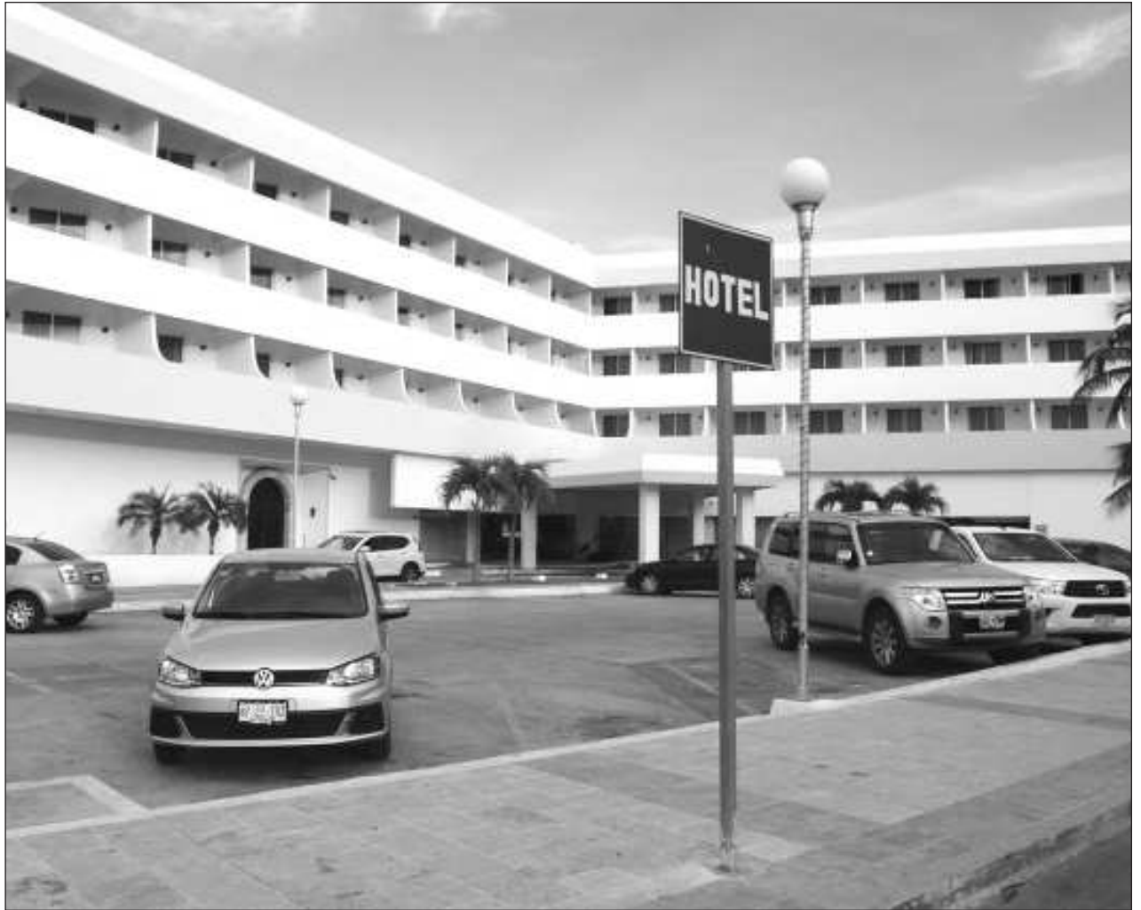
▲ Los moteles de la ciudad reportaron movimiento de leve a regular por el 14 de febrero.

Los vinculados a proceso realizarán firmas periódicas, pagarán una fianza de 5 mil pesos y no podrán salir del estado y menos del país si no es con autorización de un juez, además que no pueden acercarse a los testigos que aportarán información para determinar el grado de culpabilidad o no.