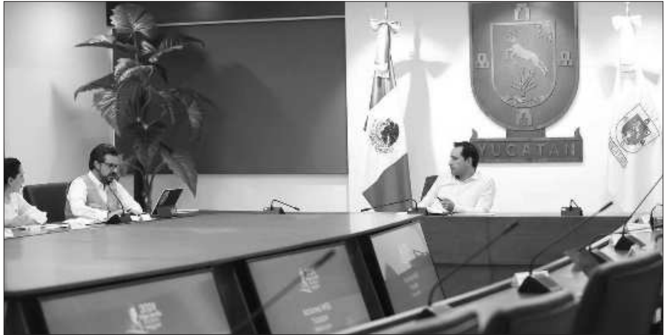
▲ El mandatario reiteró la voluntad del gobierno del estado de seguir trabajando juntos en el impulso de obras y programas que acerquen la salud a toda la población. Foto Redes Mauricio Vila

Vila Dosal reiteró la voluntad del gobierno del estado de seguir trabajando juntos en el impulso de obras y programas que acerquen la salud a toda la población, principalmente en el interior del estado. Recordó que desde hace un año se trabaja en la remodelación de los 140 Centros de Salud que hay en el estado, a los cuales también se les han incorporado servicios de ultrasonido, análisis clínicos, dentista y atención psicológica. Además, para garantizar que nadie se quede sin recibir atención, se amplió el hora-