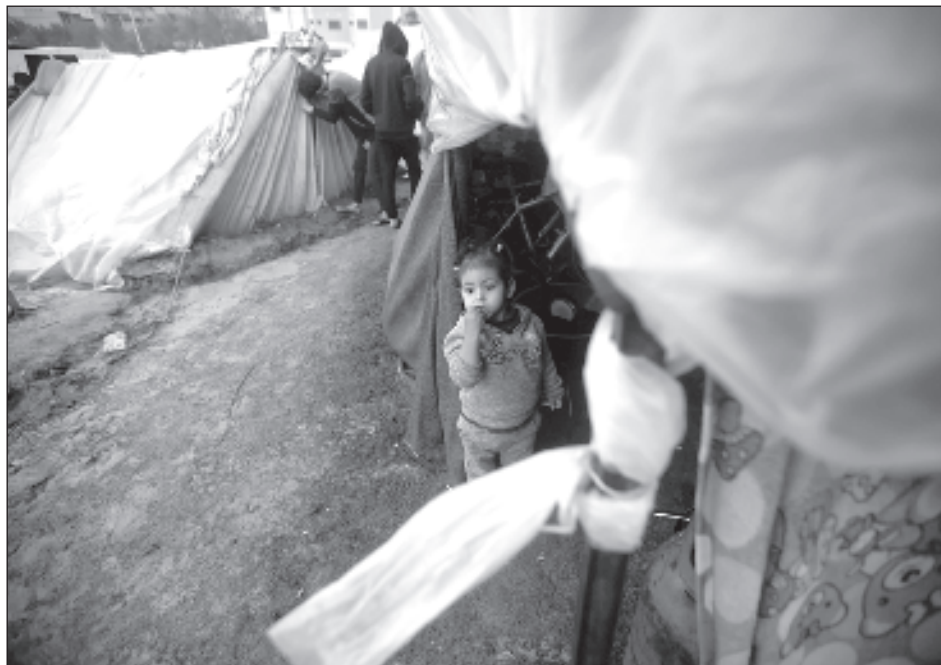
▲ La OMS advirtió el domingo que el sistema de salud de Gaza “está de rodillas y colapsando” por los ataques israelíes que han dejado 18 mil 400 muertos.

El anuncio se produjo más de dos meses después del inicio de la guerra entre Israel y Hamas en Gaza en un momento en que las organizaciones internacionales humanitarias alertan de las terribles condiciones de vida en este territorio palestino.