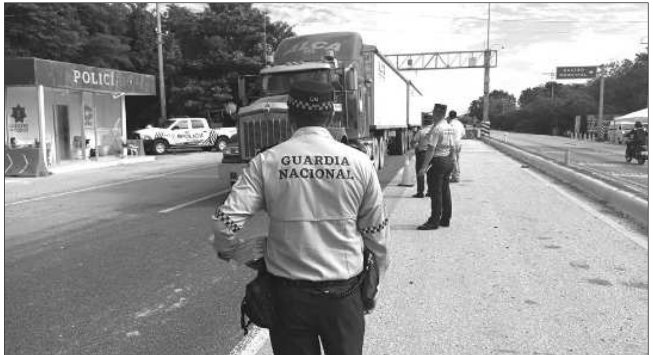
▲ Tras destacar la reducción de amenazas criminales, el presidente Andrés Manuel López Obrador anunció que todos lo están coordinando en la zona militar del estado para desplegar la seguridad en toda la zona del Estado de México.

Por su parte, el general secretario de la Defensa Nacional, Luis Cresencio Sandoval dijo que se tiene desplegada en Texcatitlán una compañía de la Guardia Nacional y ya se revisa la adquisición de un terreno para la construcción de un cuartel. Con ello se pretende una presencia permanente de entre 500 y mil elementos, por lo pronto hay 650 elementos del ejército y la