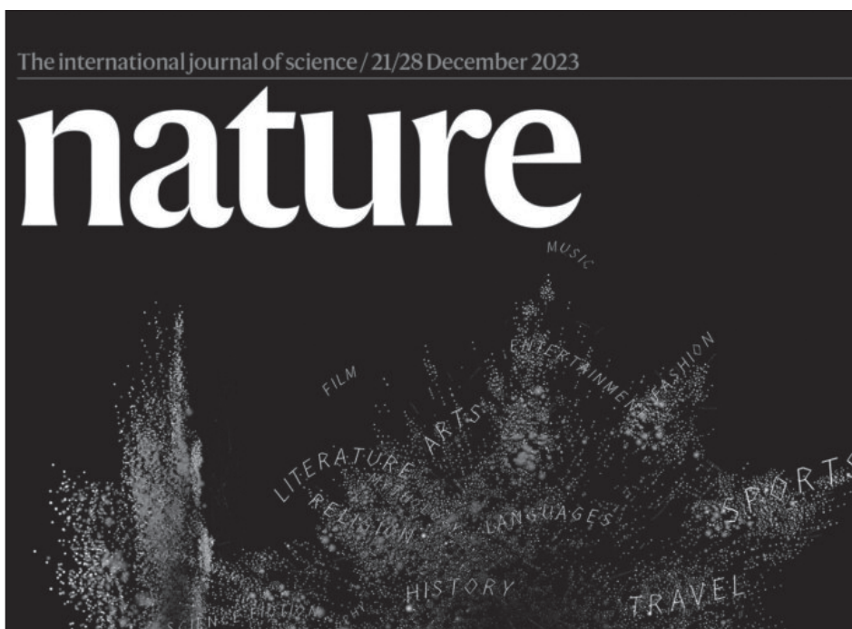
▲ Aunque ChatGPT no es una persona "hemos ampliado nuestra lista para reconocer la profunda manera en que la inteligencia artificial generativa está alterando el desarrollo y el progreso de la ciencia".

Además de catalogar cada tipo celular, los investigadores han resuelto qué áreas del cerebro contienen qué tipos de células, lo que ha dado lugar a hallazgos reveladores.