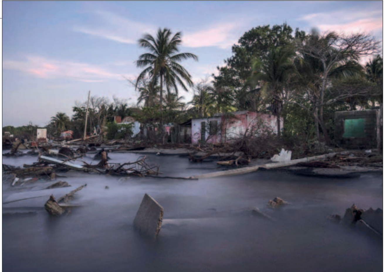
▲ U chíikulal wíinike' ts'o'ok u beetik ka jelpajak ba'ax táan u yúuchul yéetel kuxtal lu'um.

Xaak'ale' jóok'sa'ab tu winalil septiembre ti' u ja'abil 2023, ts'o'oke' ts'o'okili' u yantal 38 k'iino'ob tu'ux piitmáan 1.5°C u téemperaturail yóok'ol kaab ichil preindustrial k'iino'ob, ts'o'oke' le je'elo' unaj u xuul u yantal tumen beey je'ets'ik tumen Convención de las Naciones Unidas sobre el Cambio Climático (CMNUCC). Ka'ach' ti' le uláak' ja'abo'obo', le je'elo' jump'éeel ba'al “ma' jach suuka'an u yúuchuli”, ts'o'okili' ma'ili' okok u ja'abil 2000e' “mix juntéen yáax úuchuki”.