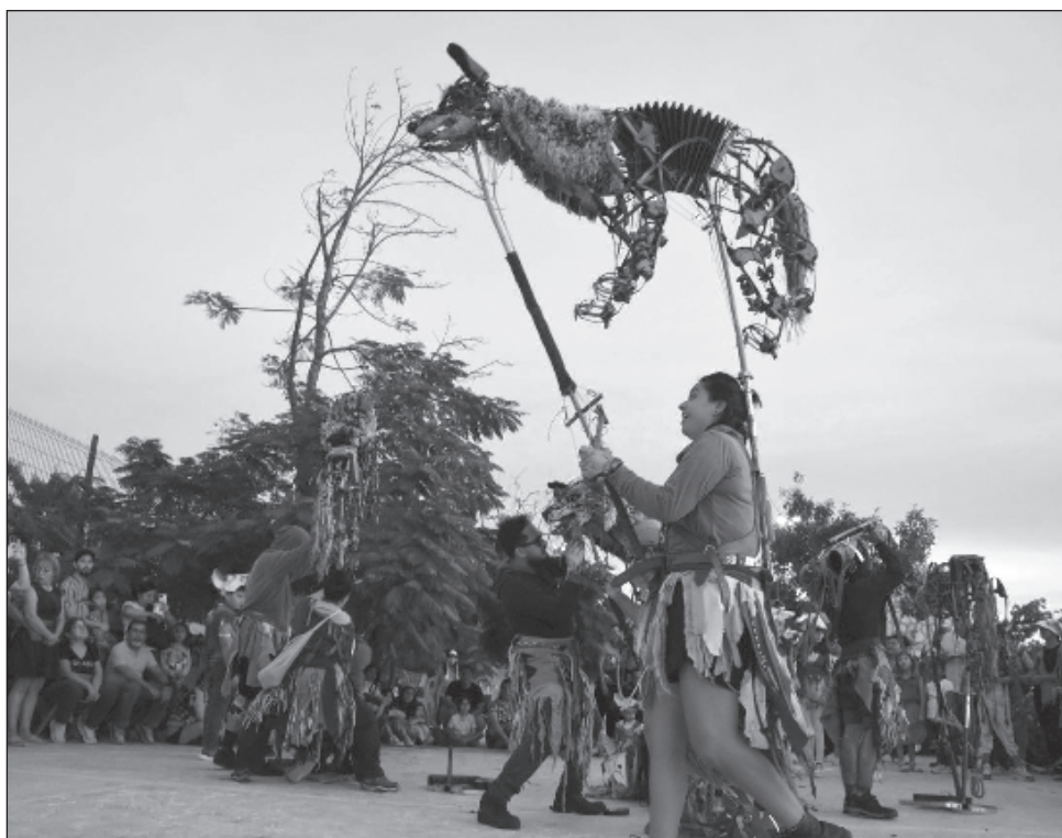
▲ El montaje trata sobre una manada de lobos en cacería.

DE LA REDACCIÓN SAN FRANCISCO DE CAMPECHE