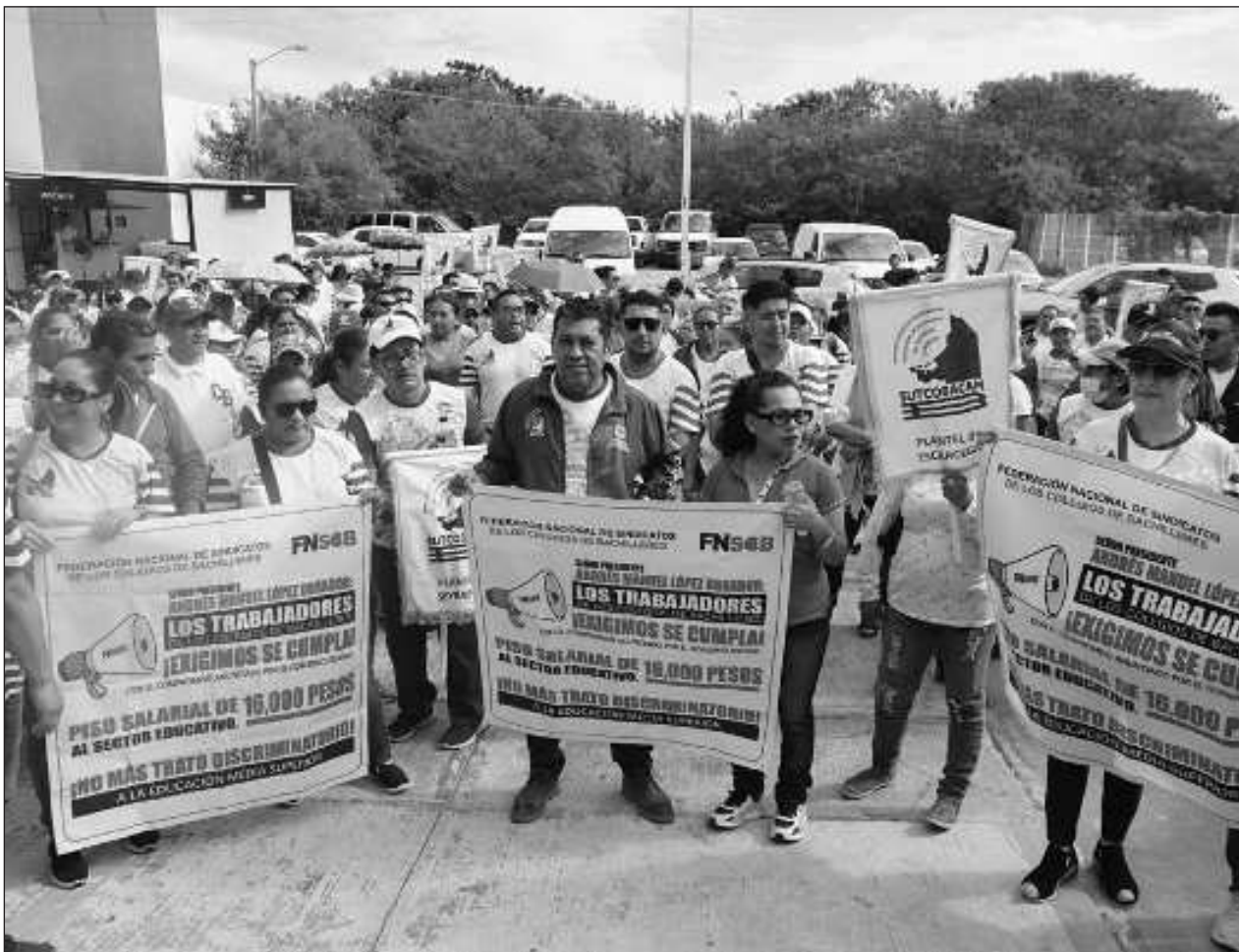
▲ Los manifestantes reconocieron que es la Federación la instancia que debe liberar los recursos para el pago oportuno, pero destacaron que si el gobierno estatal no presiona a través de la Seduc, entonces a ellos no les tocaría este retroactivo.