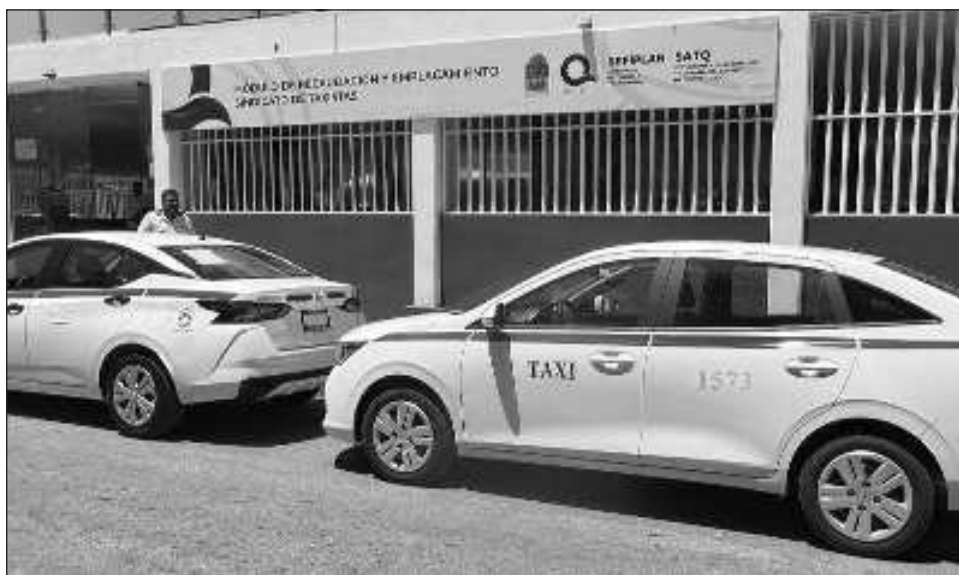
▲ Los taxistas locales han tenido un enfrentamiento directo con la plataforma Uber desde que la empresa comenzó a operar en Cancún.

El titular de Imoveqroo aseveró que en todo caso si Uber así lo desea, podrá solicitar los permisos para ambos tipos de plataforma y