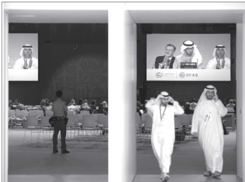
▲ La primera acción señalada en la declaración es “triplicar la capacidad energética renovable” y “duplicar la eficiencia energética media” de aquí a 2030.

Ocho años después del Acuerdo de París de lucha contra el cambio climático, la comunidad internacional dice que hay que prepararse para dejar atrás las fuentes de energía que le han permitido el mayor crecimiento económico de la historia.