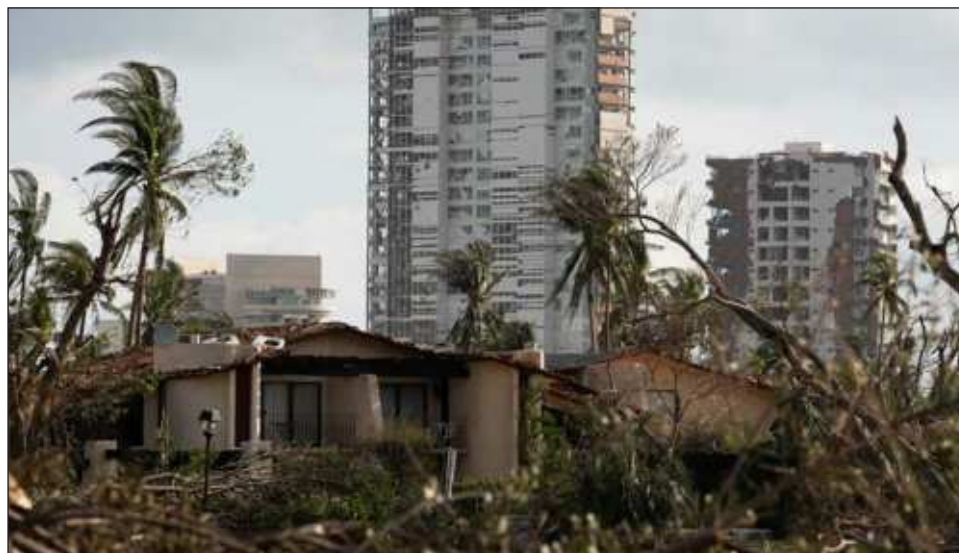
▲ Del total de solicitudes tras Otis, 59% corresponden a pólizas del seguro de daños, es decir, se tienen 13 mil 827 viviendas con reporte por daños, lo que representa 9 mil 388 millones de pesos.

“Tenemos un avance cercano a 90 por ciento del reporte de todos los riesgos asegurados que tenemos en Acapulco por Otis, de acuerdo con el inventario que tenemos en estadística, por lo que todavía faltaría 10 u 11 por ciento a grosso modo .