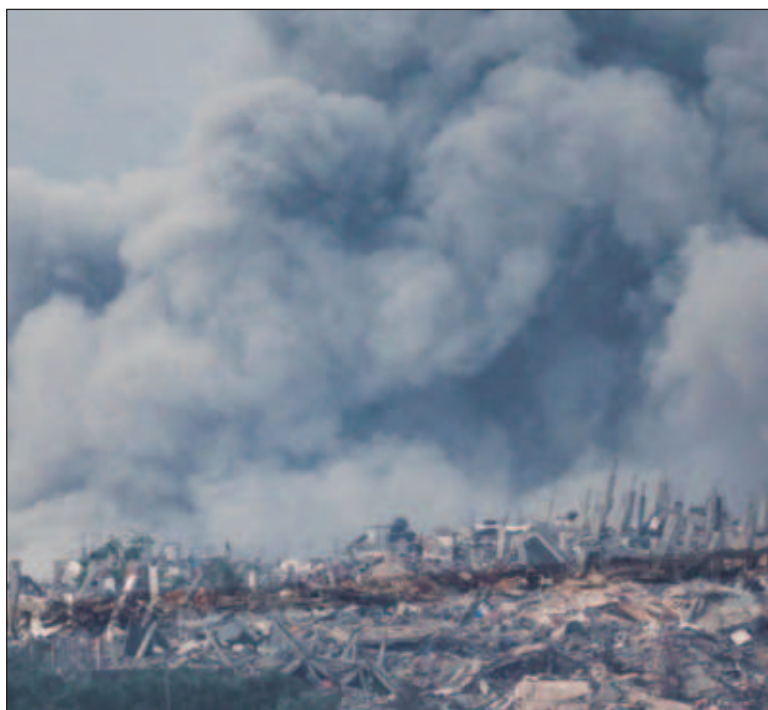
▲ "Israel has retaliated by vowing to wipe out Hamas. This has proven difficult and tragic, since Hamas terrorists use civilians, schools, and hospitals as human shields - leaving no possible result other than the deaths of thousands of Palestinians".

ISRAEL HAS RETALIATED by vowing to wipe out Hamas. This has proven difficult and tragic, since Hamas terrorists use civilians, schools, and hospitals as human shields - leaving no possible result other than the deaths of thousands of Palestinians trapped in the territory. Some argue that