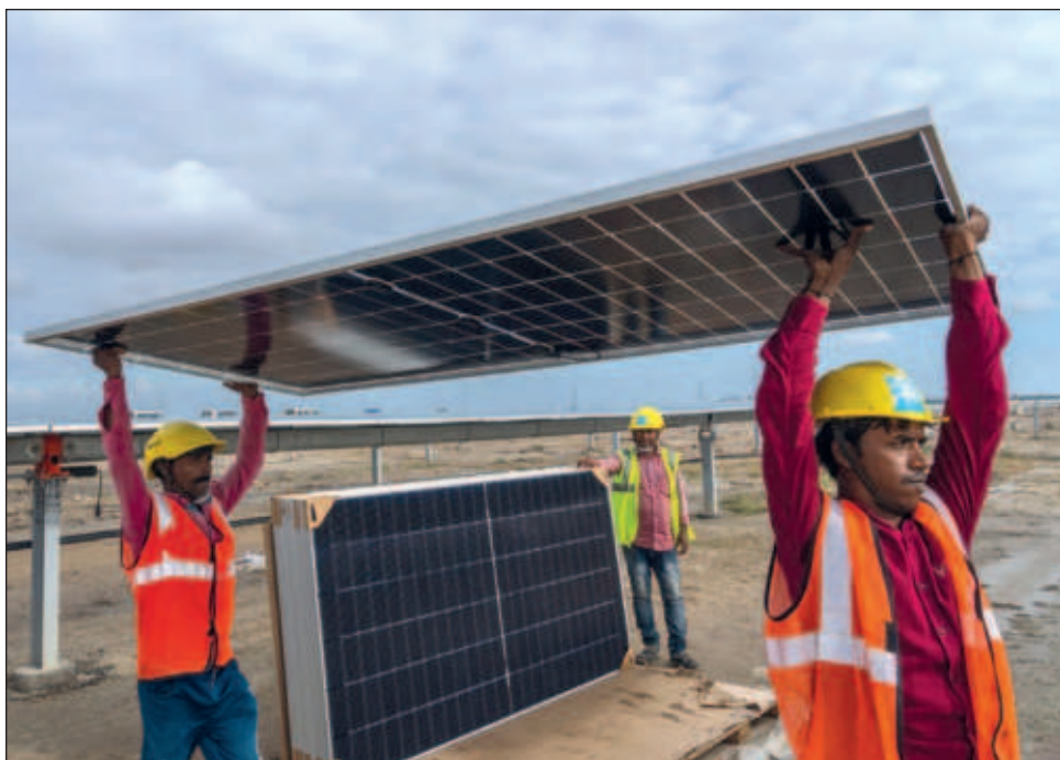
▲ La Agencia Internacional de Energía reconoció el "importante resultado que establece claramente el objetivo de abandonar los combustibles fósiles".

Los detractores de Sultán al Jaber le "deben disculpas", consideró el ministro danés del Clima, Dan Jørgensen, el miércoles tras el acuerdo final, elogiando su "transparencia".