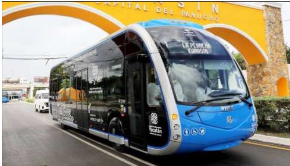
▲ Las unidades, que forman parte del Sistema de Transporte Va y Ven, darán servicio en dos rutas: Paseo 60-La Plancha-Teya y Mejorada-La Plancha-Kanasín.

La primera ruta saldrá de Paseo 60, donde se ubica una gran cantidad de hoteles, llega a La Plancha y avanza con rumbo a Teya, para conectar con la estación del Tren Maya en esa localidad. Su vocación es principalmente turística, pero está abierta al público en general