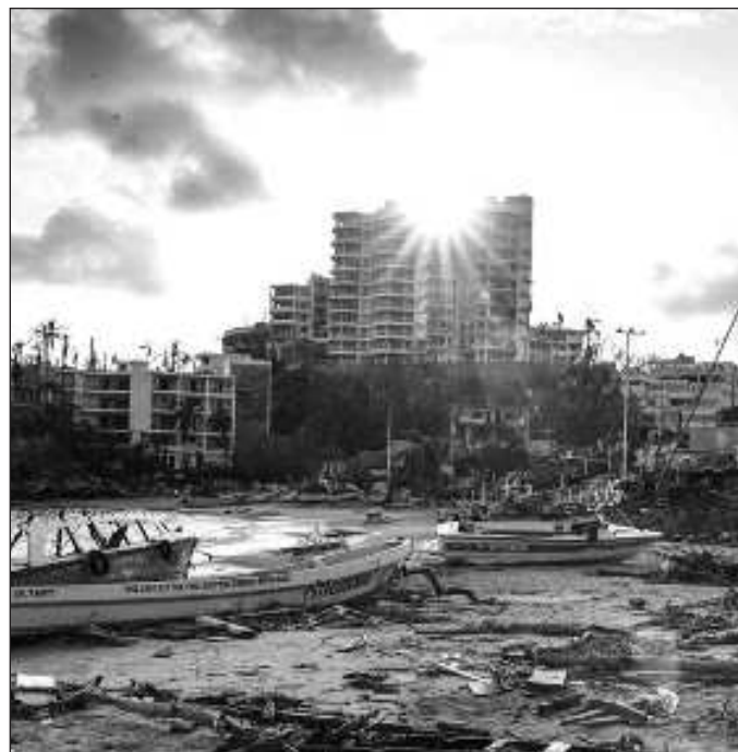
▲ Este milenio está marcado por los superhuracanes, enormes ciclones con vientos superiores a los 250 kilómetros por hora.

Por supuesto, uno de los factores que hacen que Wilma y Otis sean los fenómenos meteo-