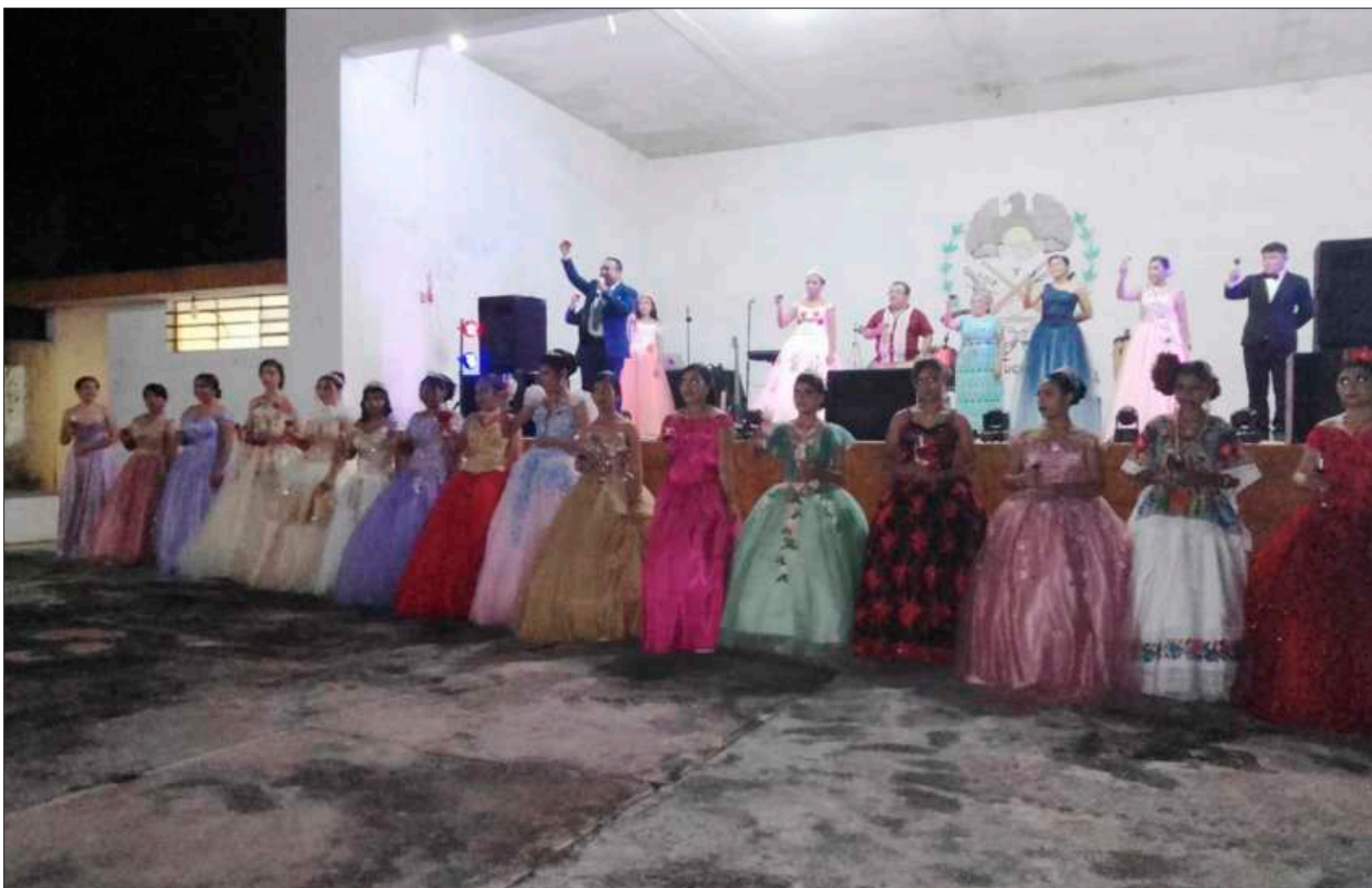
▲ Este 9 de diciembre tuvo lugar el baile de debutantes de la Sociedad Coreográfica, Deportiva y Cultural Luz y Unión, de Sucilá, Yucatán, donde participaron 16 jóvenes.