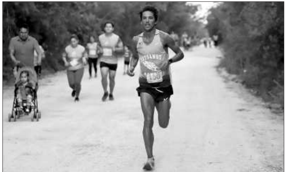
▲ La "carrera se llevará a cabo en el corazón de la selva maya y como ya es costumbre, daremos la bienvenida a todos los corredores de todas las edades y capacidades, incluso acompañado de sus mascotas", detalló en un comunicado la empresa Río Secreto.

Las categorías son: Tortuga (tres kilómetros), Coatí