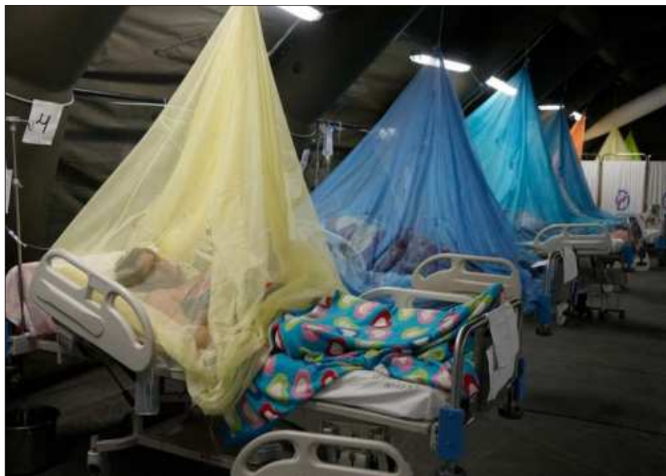
▲ En América y el Caribe se han reportado de más de 4 millones de casos en lo que va de año, superando el récord anterior establecido en 2019.

"Las enfermedades transmitidas por vectores, espe-