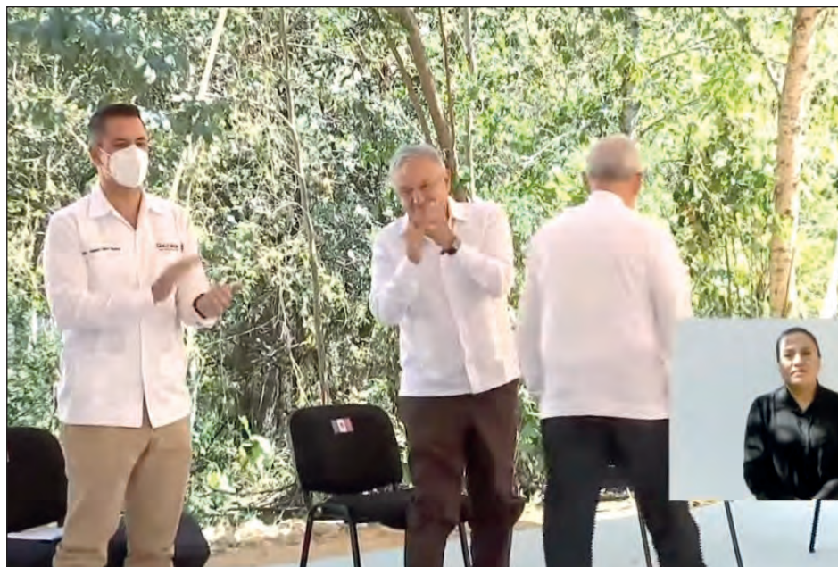
▲ El presidente Andrés Manuel López Obrador inauguró el camino número 58 en las comunidades indígenas de Oaxaca.

Al respecto, el gobernador de la entidad, Alejandro Murat, informó que se ha incrementado la producción de