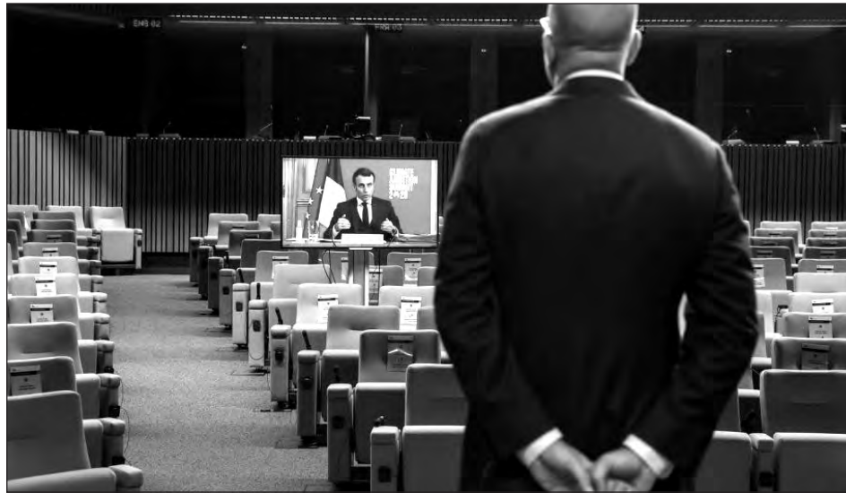
▲ Si no cambiamos de rumbo, nos podríamos dirigir hacia un aumento catastrófico de la temperatura media este siglo, señaló António Guterres, secretario general de la ONU.

Guterres hizo hincapié, en plena crisis por el COVID-19, en que el mundo ahora es 1.2 grados más caliente que durante la época preindustrial, y que si no cambia de rumbo, podríamos alcanzar un aumento