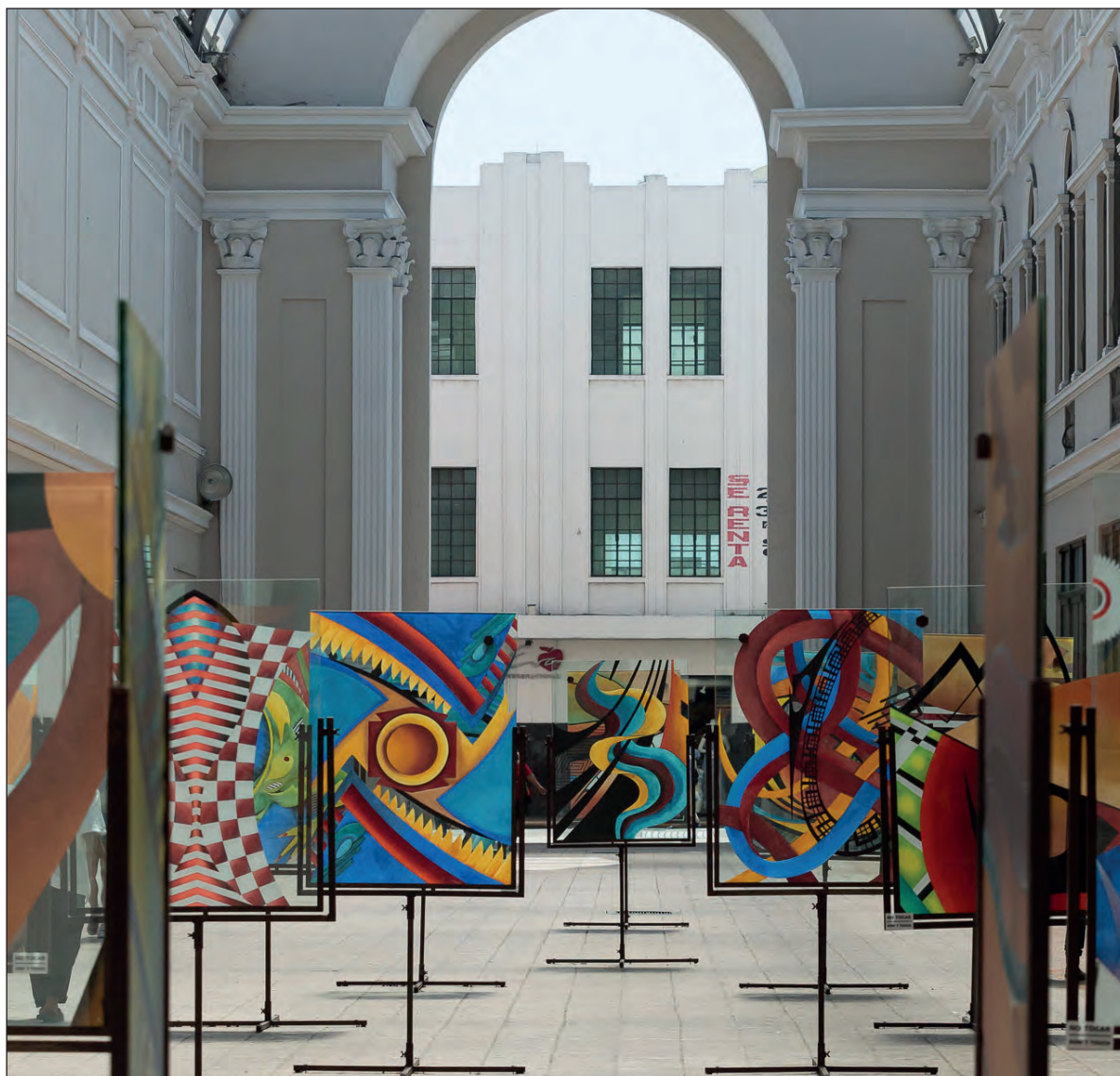
▲ El Macay opera programas de divulgación cultural destinados a la población en general, artistas, gestores, estudiantes, y llega a los municipios de Yucatán a través de Xiimbalarte .

En este sentido, el Macay ha logrado alcanzar una diversidad de objetivos debido al carácter interdisciplinario de sus actividades: las exposiciones han permitido lograr el propósito no sólo de exhibir muestras de arte contemporáneo, sino también de promover la apreciación estética y fomentar la educación artística mediante recorridos guiados. En cuanto a las investigaciones, éstas han favorecido la obtención de contenidos nuevos para su divulgación posterior.