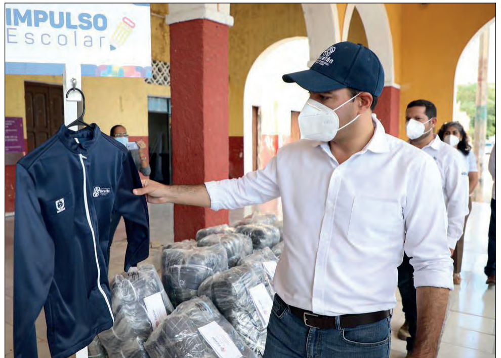
▲ Las prendas abrigadoras serán entregadas a más de 211 mil pequeños yucatecos.

Asimismo, se explicó que las chamarras se distribuirán a los padres de familia de cada escuela manera ordenada y cumpliendo los protocolos sanitarios ante la pandemia del coronavirus, tal y como se hizo con los paquetes de útiles escolares, en fechas y horas que establecerán los docentes de cada plantel educativo. En Homún se beneficia a 807 estudiantes con igual número de prendas.