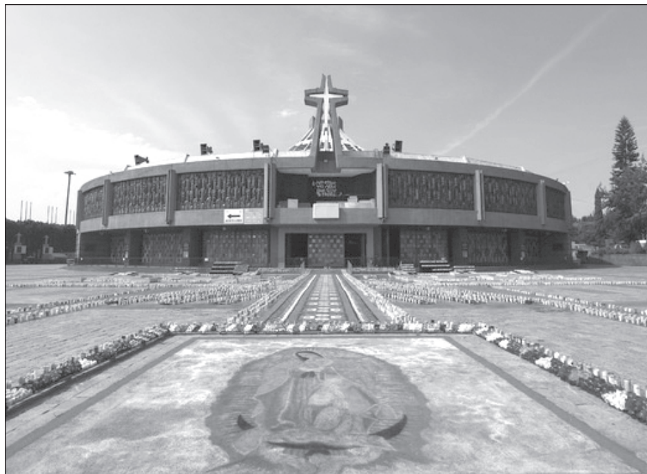
▲ Aspectos de la Basílica de Guadalupe, el Día de la Virgen.