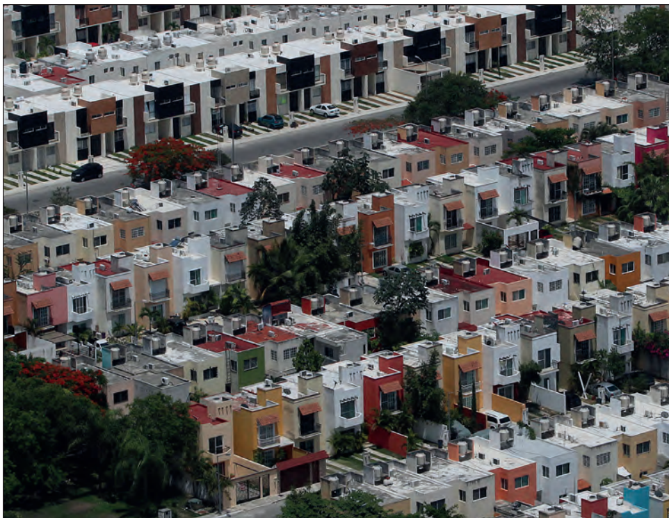
▲ El crecimiento de lo construido por el hombre se observa notablemente a partir de la década de 1950, cuando los materiales de construcción como el hormigón y los agregados se volvieron ampliamente disponibles.