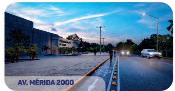
AV. MÉRIDA 2000