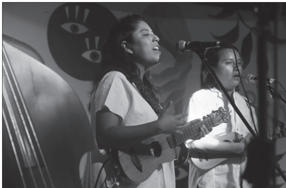
▲ Como el año pasado, el encuentro incorpora tres ejes: académico, pedagógico y artístico.