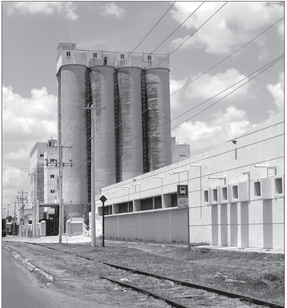
▲ La contaminación auditiva del Centro Histórico es una constante en los últimos años, aunque en este caso proviene de la industria.