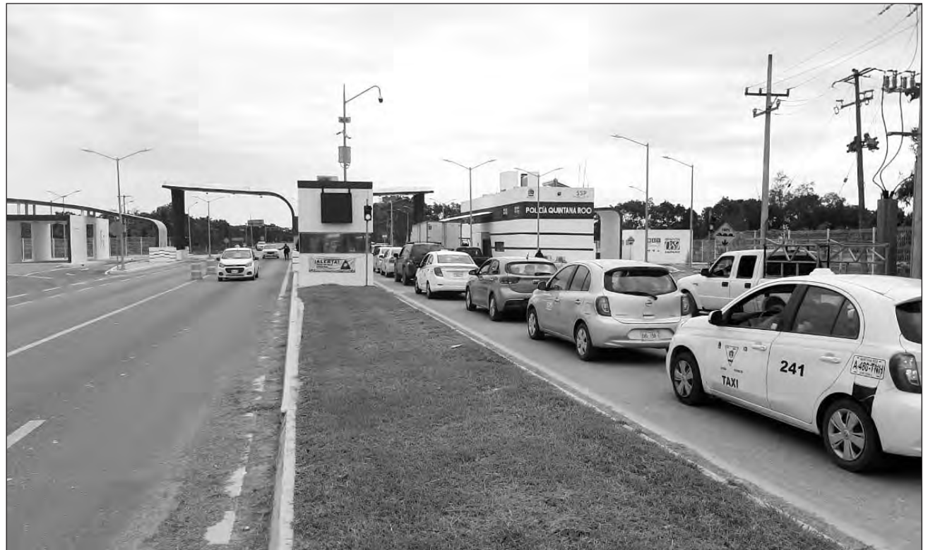
▲ La reactivación de filtros y cierre de calles y avenidas ocasionaron largas filas de vehículos.