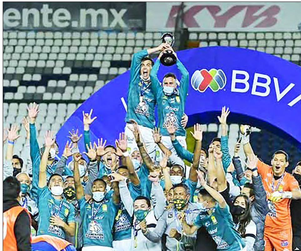
▲ El León celebra la obtención de su octavo campeonato.

Pero en la batalla entre los dos mejores de la fase regular se notó la diferencia de ocho puntos que hubo entre los rivales. Los dirigidos por Ignacio Ambriz sacaron un empate a uno del Olímpico Universitario,