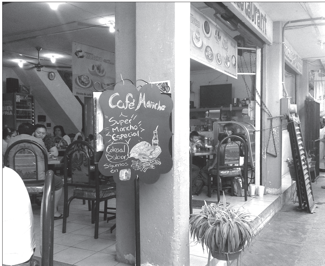
▲ La pandemia del COVID-19 se ha llevado muchas cosas, como uno de los corazones y almas del Bazar García Rejón y del Centro de Mérida.

Las personas de la tercera edad que a diario visitaban el lugar, para platicar y tomar café, se han quedado sin su espacio de convivencia. La pandemia del COVID-19 se ha llevado muchas cosas, como uno de los corazones y almas del García Rejón y del Centro de Mérida.