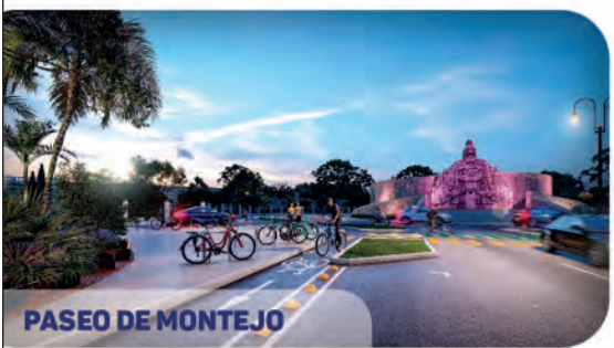
PASEO DE MONTEJO