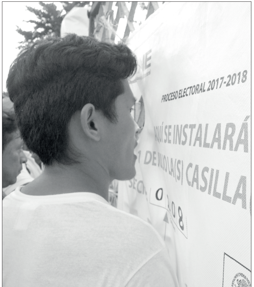
▲ El consejo local del INE tuvo una demanda de más de 2 mil 780 interesados.

Para el distrito 3 de Benito Juárez se aplicarán 595 exámenes el sábado 12 de diciembre en un horario de 10 y 13 horas. Finalmente, el distrito 4 (también de Benito Juárez) tendrá 919 exámenes para aplicar los días 12 y 13 de diciembre. El sábado 12 será en los horarios de 10, 13 y 17 horas y el domingo a las 11 horas.