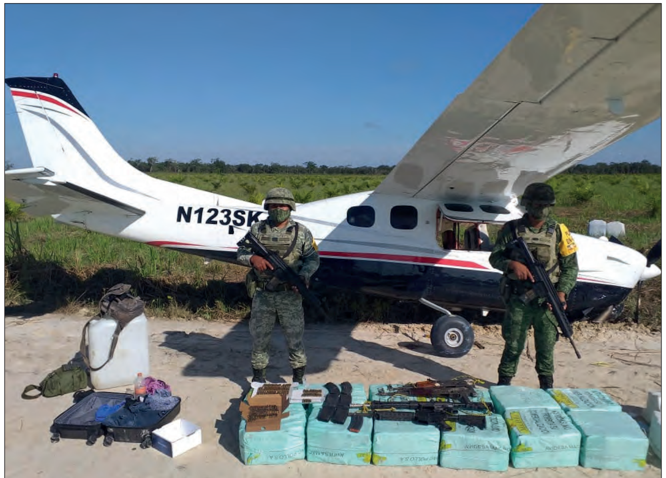
▲ Elementos del Ejército localizaron la aeronave antes de que pudiera ser descargada.

Durante la presente administración, la Sedena ha logrado asegurar 81 aeronaves ilícitas, que transportaban en conjunto 11 toneladas de cocaína.