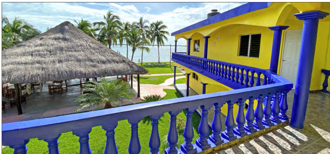
▲ Tan sólo en Cancún existen 15 mil lugares en renta a través de alguna de estas plataformas que operan de manera clandestina.

"Hay muchas situaciones que nunca se van a compa-