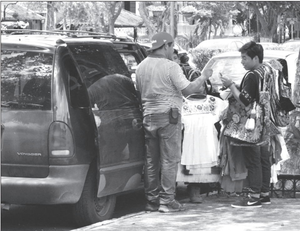
▲ La propuesta va encaminada a brindar el derecho a una vida en familia.