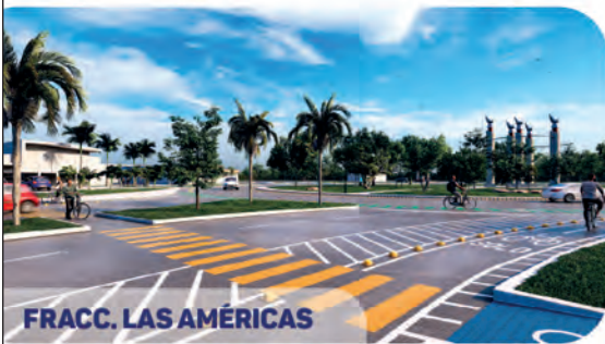
FRACC. LAS AMÉRICAS