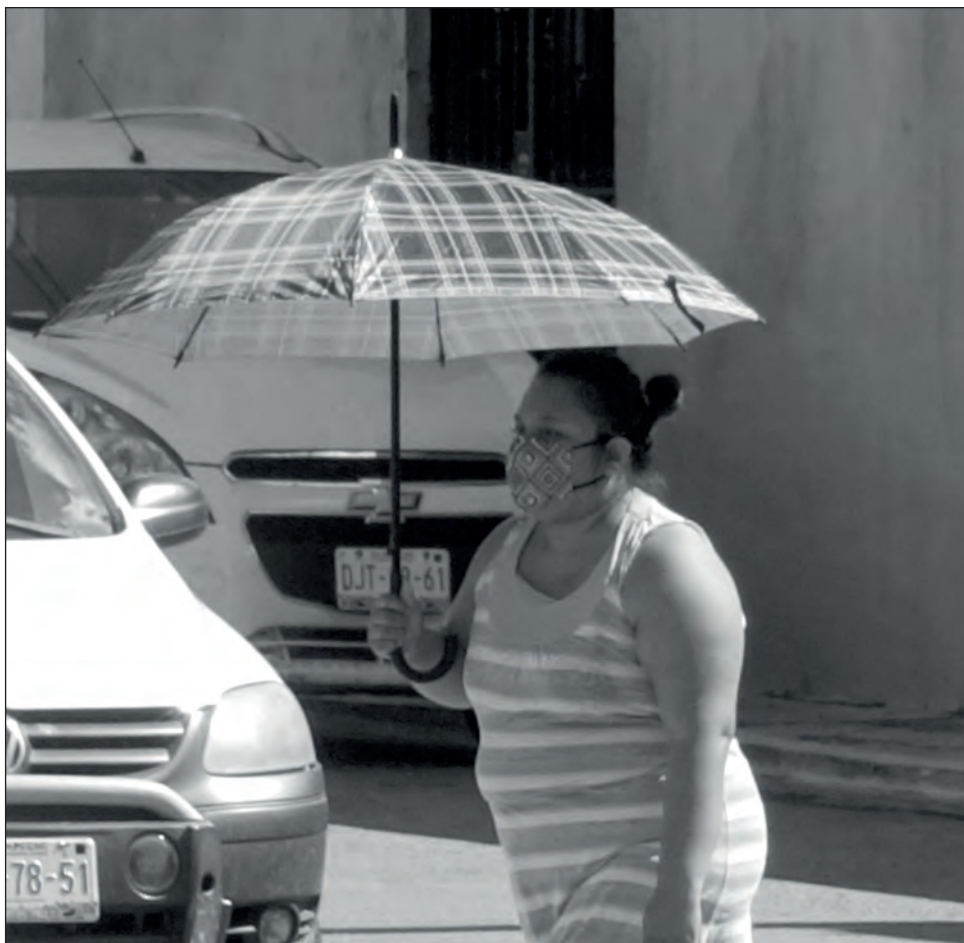
▲ Entre julio y septiembre, el IMEC atendió a 4 mil 378 mujeres y 130 hombres por violencia de género.

En el mismo tenor, colectivos como la Red de Mujeres y Hombres por una Opinión con Perspectiva de Género (REDMyH) destacaron que en estudios de campo e investigaciones recientes hechas en municipios como Tenabo, Hecelchakán, Calkiní, Hopelchén y Calakmul, han notado un "terrible" funcionamiento de las vicefiscalías, así como de los agentes encargados de la procuración de justicia respecto a la perspectiva de género.