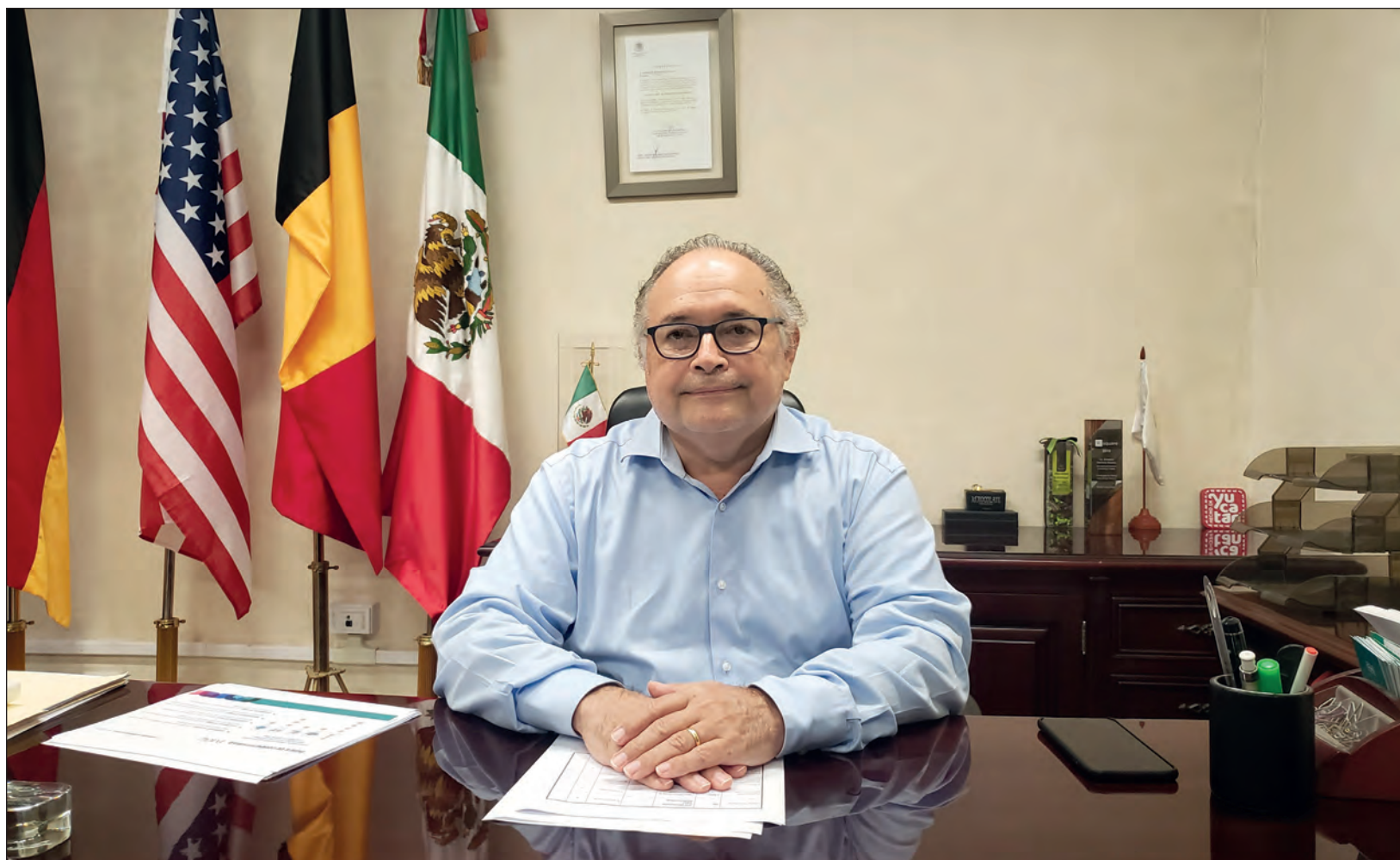
▲ Lo que ha mantenido a Yucatán en los últimos meses ha sido la agroindustria y la manufactura. El secreto de la entidad es que tiene industria y agroindustria, indicó el secretario de Fomento Económico y Trabajo.