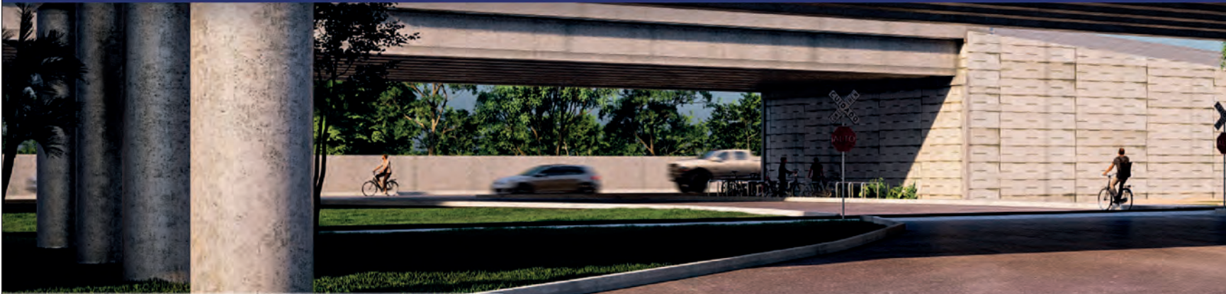
DISTRIBUIDOR VIAL DZUNUNCÁN

La pandemia del coronavirus nos ha exigido trabajar más juntos que nunca en acciones que cuiden la salud de la población. Por eso, estamos trabajando en conjunto Gobierno del Estado y Ayuntamiento de Mérida para mejorar la movilidad.