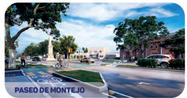
PASEO DE MONTEJO