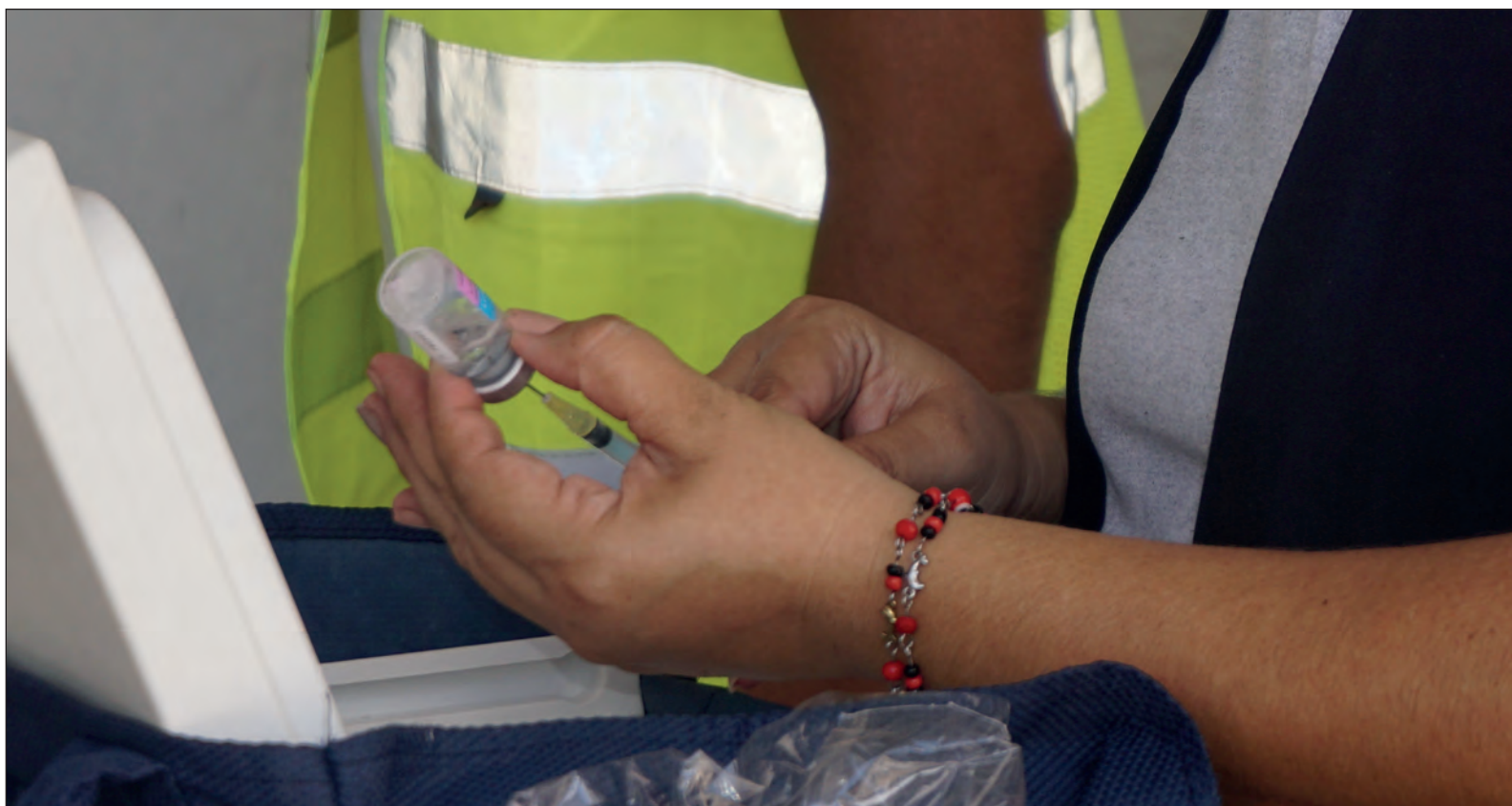
▲ En México será el personal de salud que está en contacto con pacientes de COVID-19 el que recibirá la inmunización entre diciembre de 2020 y junio de 2021.