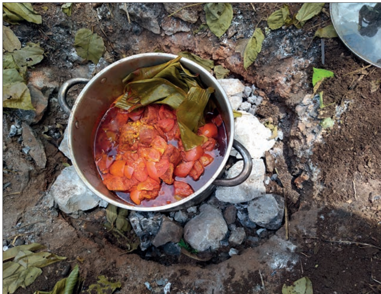
▲ Entre lo que más piden para comer los visitantes a Yaxunah se encuentra la cochinita pibil, pero la oferta gastronómica es amplia, con opciones vegetarianas o veganas.

En un recorrido por Yaxunah, organizado por la Secretaría de Fomento Turístico de Yucatán (Sefotur), se pudo constatar los muchos atractivos que posee: desde vestigios arqueológicos, su cenote y otras maravillas naturales, hasta artesanías elaboradas con cuerno de toro y manjares preparados por cocineras mayas.