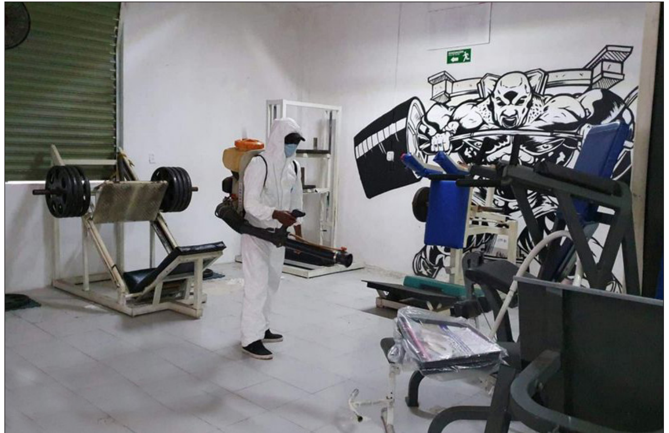
▲ Para poder abrir sus puertas, los propietarios de los gimnasios tuvieron que cumplir con el trámite de certificación y desinfección de sus instalaciones.