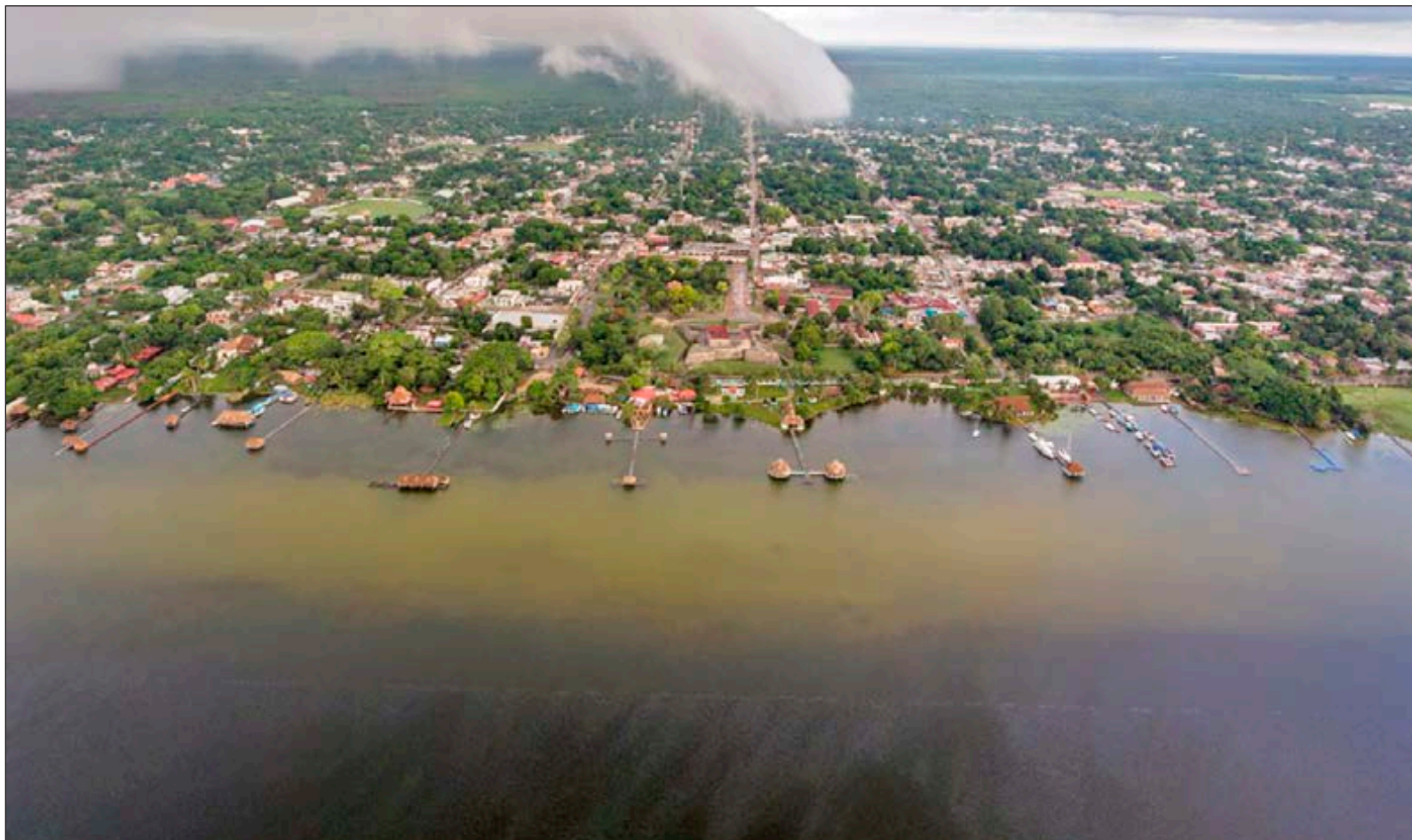
▲ Actualmente, los siete tonos de azul de la Laguna de Bacalar se han oscurecido, mutando a café y verde.