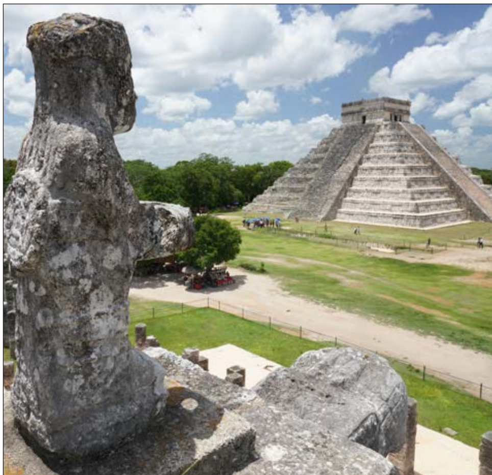
▲ La zona arqueológica de Chichén Itzá podrá recibir visitantes hasta el 22 de septiembre, junto con Dzibilchaltún.