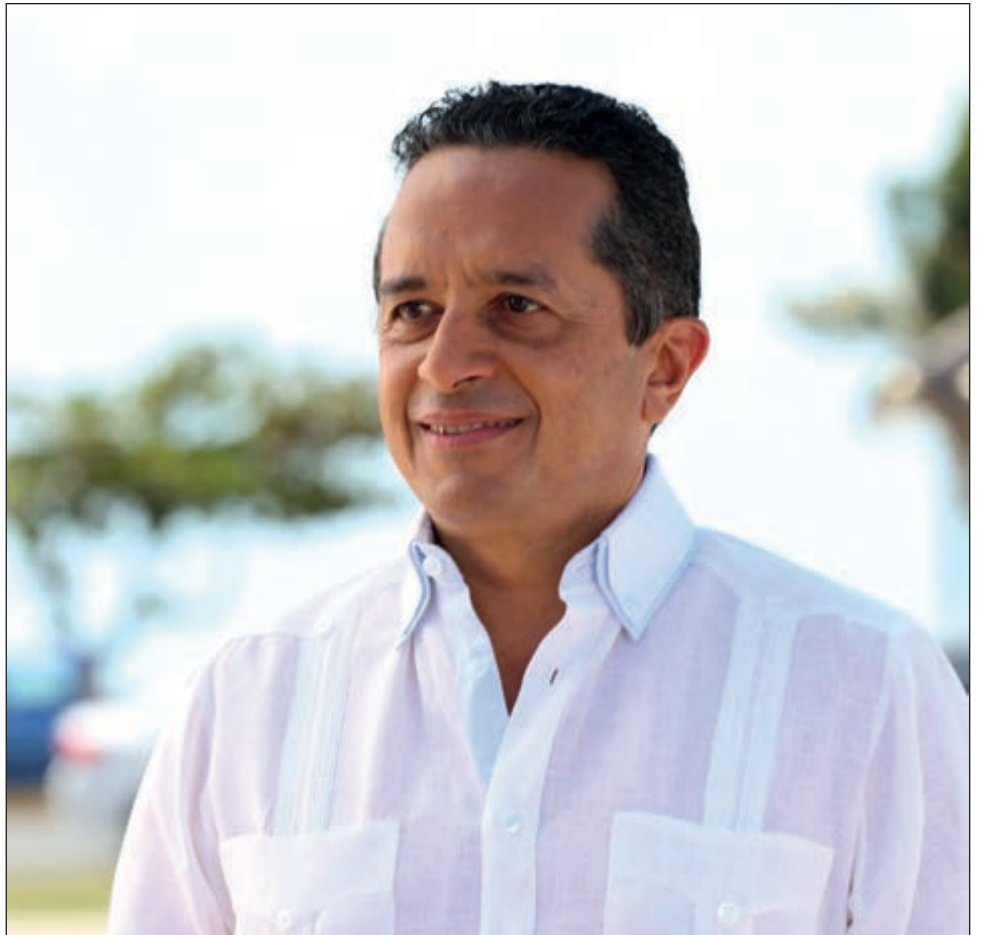
▲ La encuestadora Mitofsky, en el mapa de aprobación a gobernadores publicado en su boletín de agosto, destaca que Quintana Roo tiene una alta aprobación en favor del titular del Ejecutivo.

Según esta encuestadora, de enero a agosto, Carlos Joaquín ha crecido de la posición 28, en la que se encontraba en enero, a la 9, en agosto. Entre abril y mayo, tuvo el más rápido crecimiento, en el ranking, al cambiar de la posición 23 a la 10 entre los gobernadores con mayor aprobación.