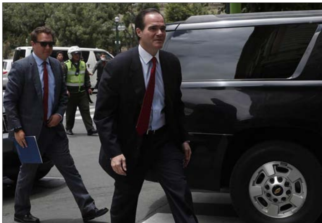
▲ Con sus asegunes, el BID ha permitido desempantantar algunos proyectos necesitados de fondos, situación que puede cambiar con la llegada de Claver-Carone.

Esto puede cambiar con la asunción de Claver-Carone, un anticastrista de la línea dura ahora ligado a la administración de Donald Trump, y a quien se le vincula estrechamente con el rechazo a los planes aperturistas de EU hacia Cuba, así como de la aplicación de sanciones contra el gobierno venezolano de Nicolás Maduro. En la última etapa del proceso, la mayoría de los países del área respaldaron al candidato estadounidense, a pesar de los esfuerzos previos realizados por México, Argentina, Costa Rica y Chile para que la elección en el BID fuera pospuesta hasta que pasara la pandemia, con la esperanza de potenciar a algún postulante latinoamericano. La votación se llevó a cabo a puertas cerradas y por vía telemática y, por lo pronto, analistas estadounidenses señalan que una de las tareas que emprenderá seguramente el flamante presidente del organismo financiero será “minimizar la presencia de China en la región”.