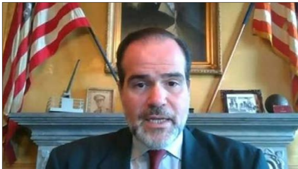
▲ El ultraconservador candidato de Washington, Mauricio Claver-Carone, ganó la presidencia del BID.

Claver-Carone ocupaba el cargo de director del Consejo Nacional de Seguridad para el hemisferio occidental en la Casa Blanca y ha sido un prominente promotor del embargo contra Cuba y uno de los principales estrategas en el diseño de política para buscar un cambio de régimen tanto en la isla como en Venezuela.