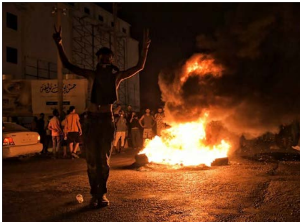
▲ Según fuentes oficiales, un grupo que protestaba en Bengasi atacó el edificio de la sede del gabinete y le prendió fuego para luego huir.

Al menos cinco personas resultaron heridas de acuerdo con testigos y una fuente del hospital central de la ciudad.