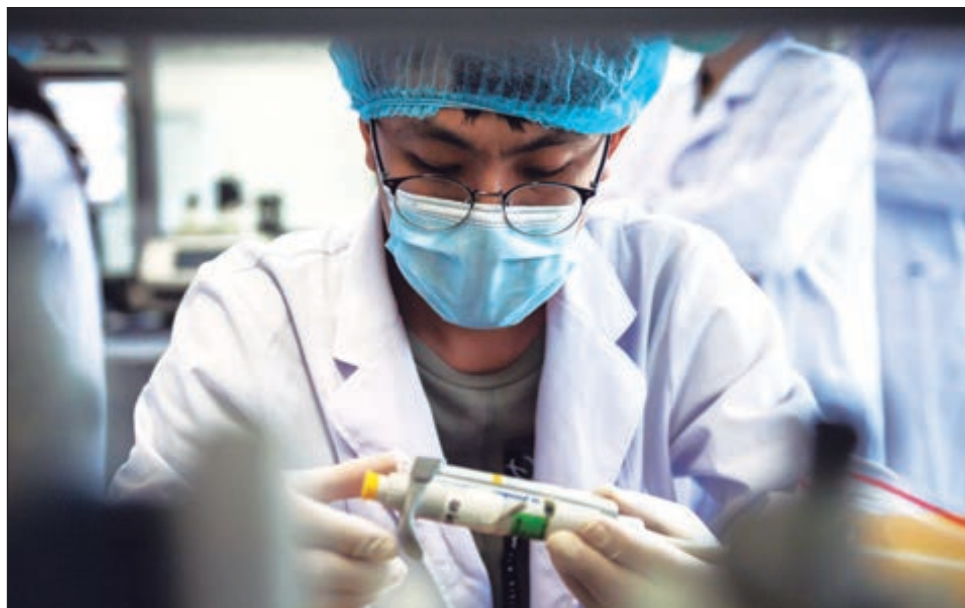
▲ El acuerdo con la OMS no limita que México pueda conseguir más biológicos vía compras con desarrolladores o farmacéuticas.

En la conferencia vespertina en Palacio Nacional, detalló que están por concretarse los términos del acuerdo económico para participar en Covax, luego de que hace dos