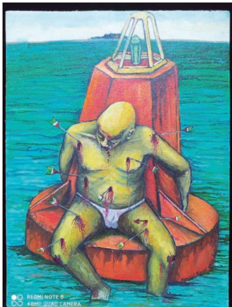
▲ Los estigmatizados, más que metáforas, son seres tangibles que han sido traídos a este mundo. Imagen Daniel Rosel

Daniel ha extraído los estigmatizados de sus propios sueños, y los ha hecho emerger con aspectos pandémicos ajenos a los que han caracterizado a la epidemia que este mundo sufre en estos tiempos. Tales aspectos están concentrados en su forma grotesca, en su actitud desencantada y su proyección espiritual irreplicable. Son seres estigmatizados en otro mundo, personajes pandemizados en