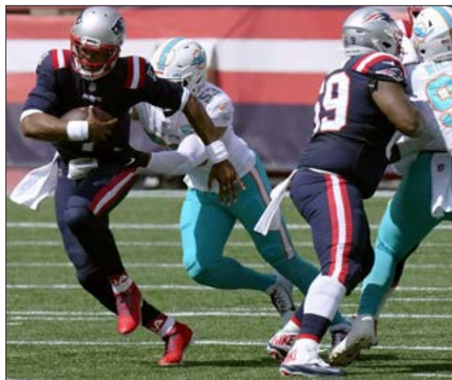
▲ Cam Newton fue un gran reto que no pudo superar la reforzada defensiva de los Delfines.

En el duelo más esperado de la jornada de apertura, Drew Brees superó a Brady en duelo de futuros inmortales y los Santos mostraron por qué están entre los favoritos para conquistar el Súper Tazón al vencer 34-23 a los Bucaneros de Tampa Bay, en Nueva Orleans. Brees lanzó para 160 yardas