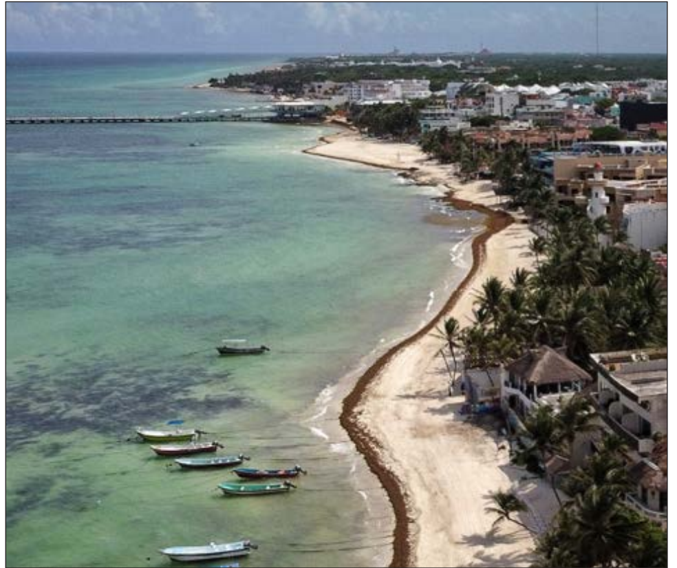
▲ Se estima que hay 35 millones de toneladas de sargazo flotando en el área del Mar Caribe y el Océano Atlántico central.

Distinguió entre dos tipos de arribazones: la marea dorada, que son masas flotantes de sargazo en mar abierto, las cuales “traen vida, son refugio de tortugas e incluso tienen fauna endémica, si se quedarán en el océano el problema no sería grave, el problema es que llegan a las costas”. Está también “la