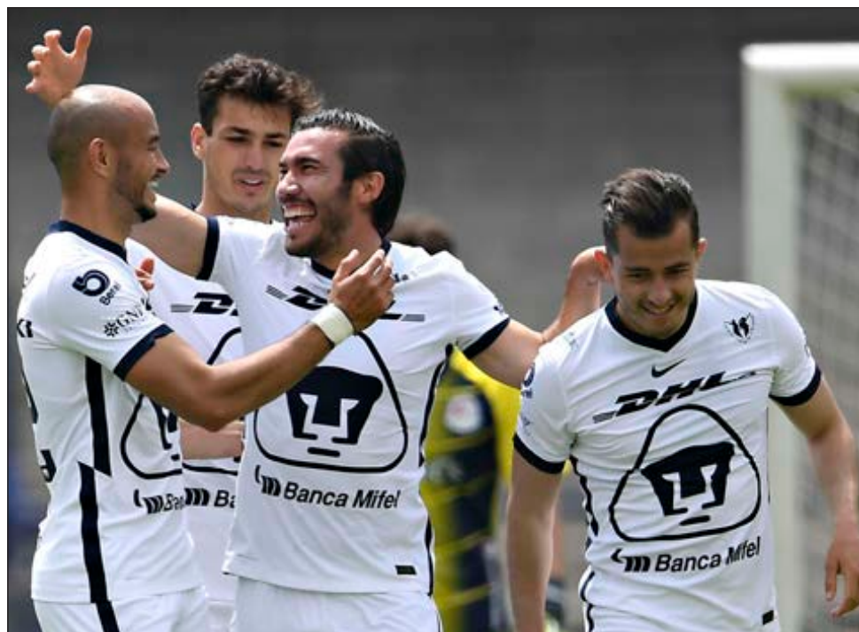
▲ Los felinos están incontenibles en la Liga Mx.