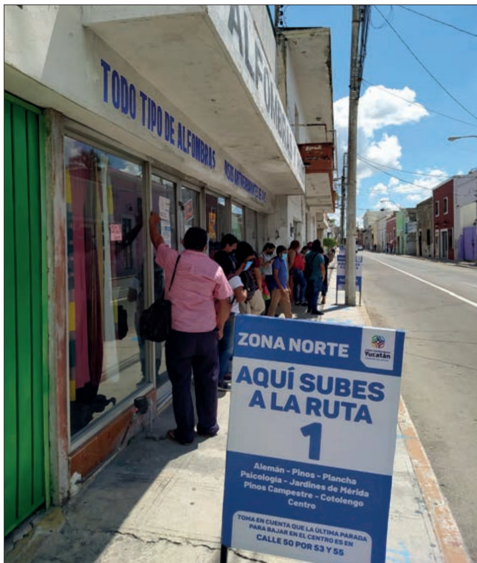
▲ Algunos usuarios no creen que el plan reduzca los contagios porque la gente hace filas y no mantiene la sana distancia.

Reynold, un joven de 20 años, expresó que le convenía más tomar su camión en la Catedral, porque ahora tendrá que caminar más, “pero está bien porque finalmente nos vamos a adaptar; ahora el Centro está más vacío, va a