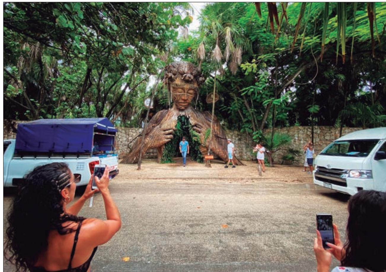
▲ El comportamiento de los viajeros ha cambiado y optan por estancias más largas.

De acuerdo con el reporte mensual de la Asociación de Hoteles de Tulum, agosto cerró con 21.01% de ocupación, desglosada de la siguiente manera: hoteles todo incluido, 16.78%; la zona Akumal-Muyil-Tankah, 15.49%; Parque Nacional Tulum,