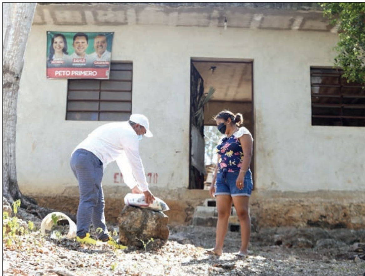
▲ Las acciones sin coherencia, la falta de estrategias y decisiones coordinadas entre municipios vecinos, no hacen sino agudizar la incertidumbre social y la percepción de que se habita en una emergencia sin control.

Cuando el problema se trata de un desastre global como la pandemia por COVID-19, la gobernanza operaría a modo de redes de ac-