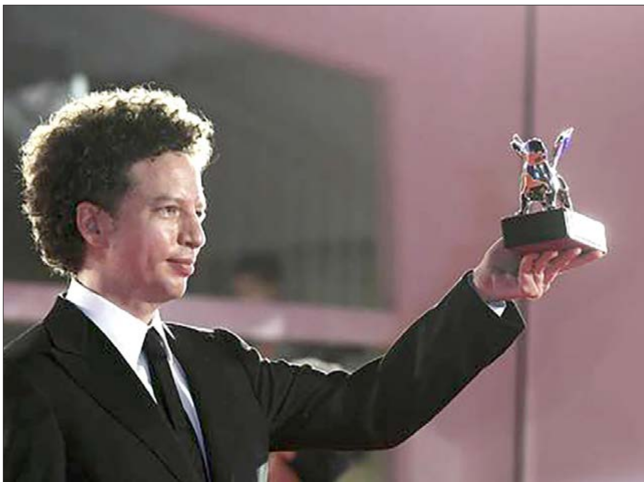
▲ El realizador mexicano, Michel Franco, dijo que hizo este filme para que las cosas cambien e invitó a tener confianza en el futuro.

Chloé Zhao, primera mujer en 10 años en ganar el León de Oro, con Nomadland