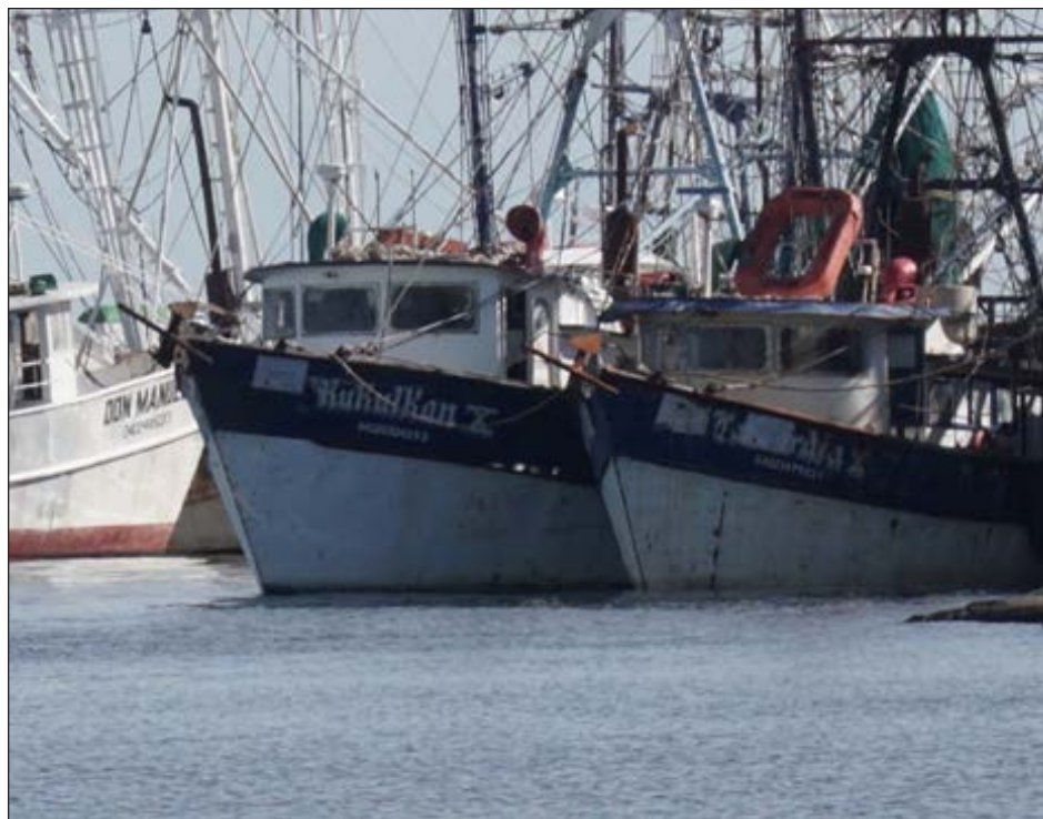
▲ Según los pescadores, los empresarios sólo quieren llevar 30 embarcaciones camaroneras a Tamaulipas, cuando hay 86 autorizadas.

Agregó que pese a no haber sido convocados para embarcarse, están preparándose para salir a la mar. La molestia de cientos de pescadores fue