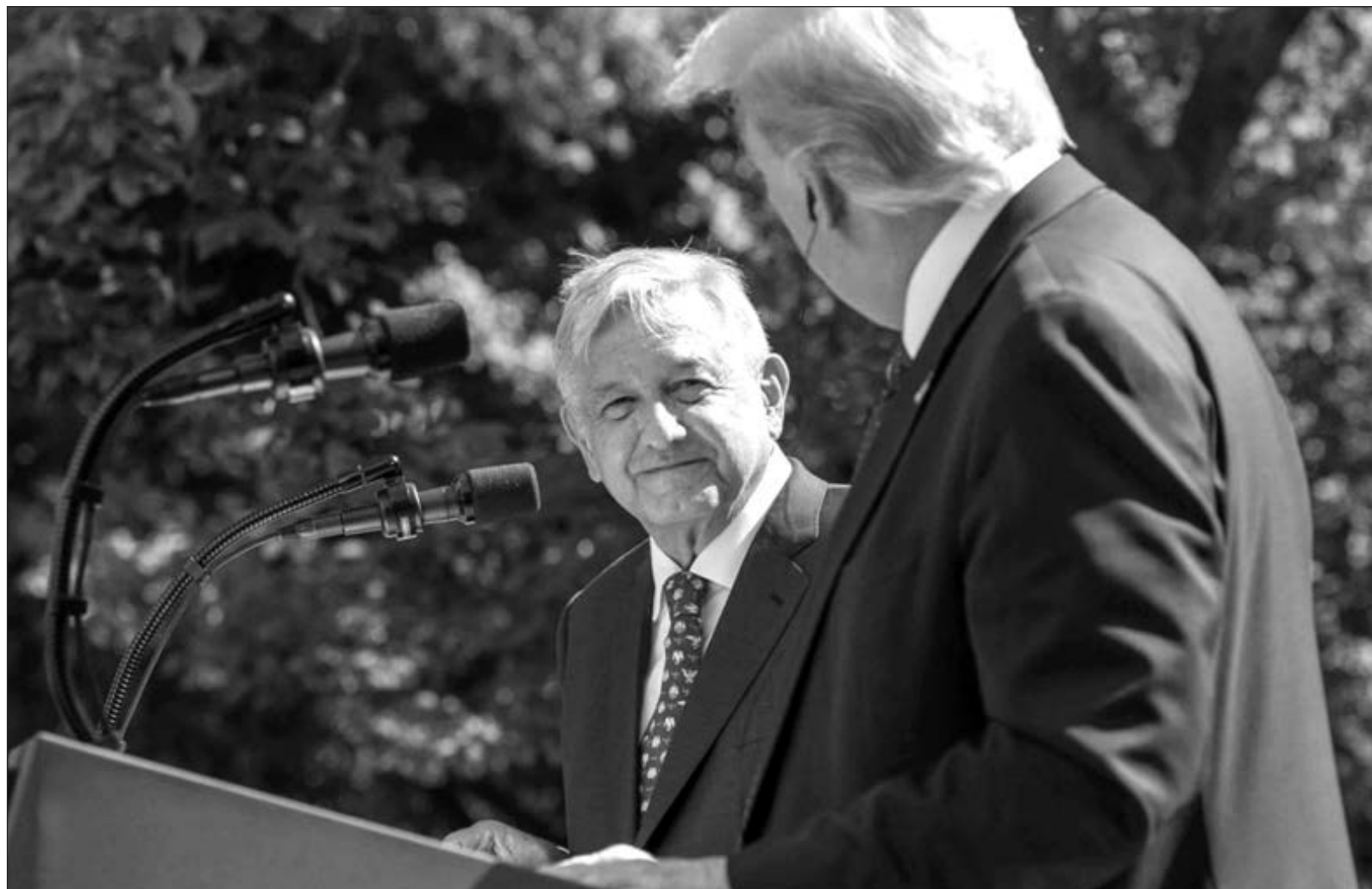
▲ ¿Qué fue lo que realmente pasó en Washington la semana pasada? ¿A quién le convenía ese encuentro? ¿Alguien ganó?