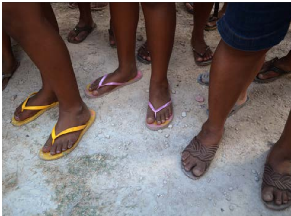
▲ En la mayoría de los municipios de los tres estados de la península se ha registrado por lo menos un fallecimiento por COVID-19.

En Yucatán, sólo dos de los los municipios más pobres registran muertes por esta enfermedad: en Chikindzonot, que ocupa el segundo lugar en pobreza, con 83 por ciento de su población en esta condición, han ocurrido