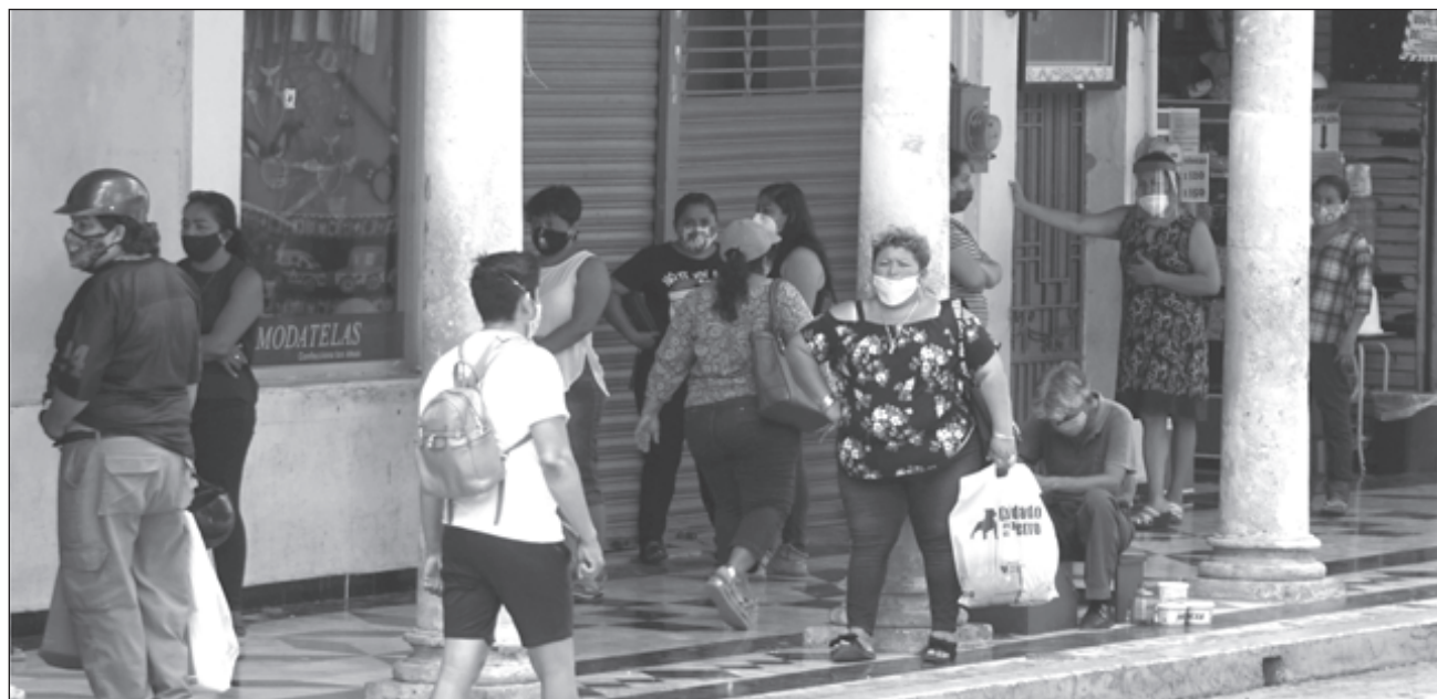
▲ La reapertura de algunas actividades económicas pareciera una invitación a relajar las medidas preventivas. En la imagen, aspecto del centro de la capital de Campeche.

“En estos momentos, con la apertura de algunas actividades económicas en el estado y el municipio de Carmen, pareciera que es una invitación a relajar las medidas de seguridad. Sin embargo, es todo lo contrario, ya que son tiempos de reforzar nuestras acciones de prevención para lograr la disminución en los casos nuevos”, apuntó el directivo.