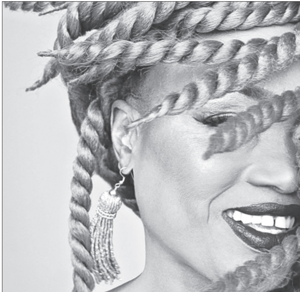
▲ La belleza de la música está en que si es rítmica y las personas bailan, se comprende, afirma la también llamada voz de África .

Sangaré sigue siendo una vocera en contra de la poligamia, incluso es famosa por interpretar una de sus canciones sobre el tema frente