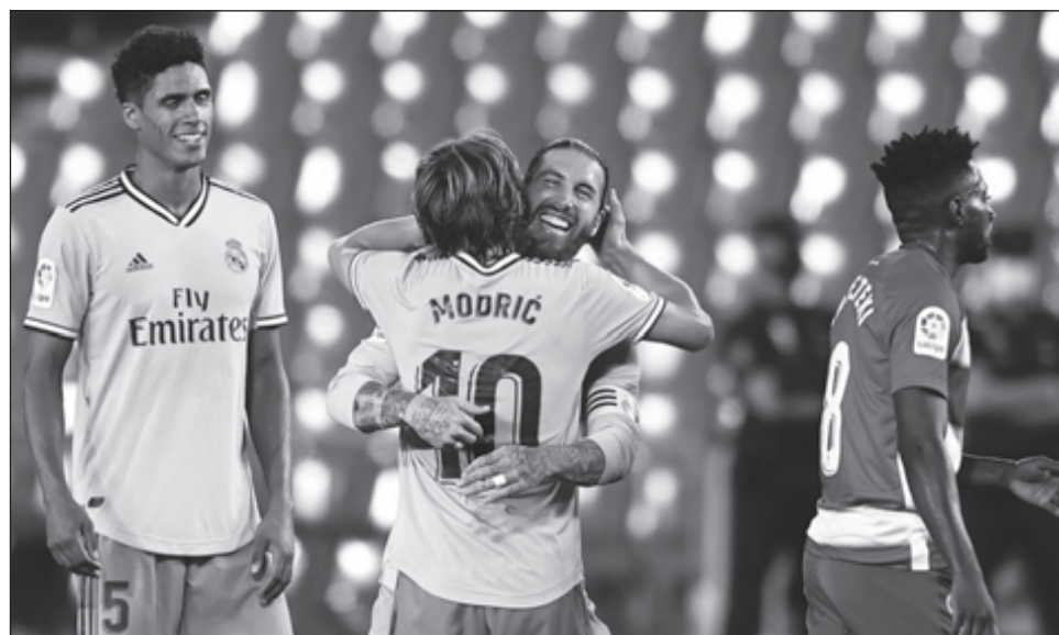
▲ Con su novena victoria consecutiva, el Real Madrid se colocó a un paso de su título 34 en la Liga de España.

Los merengues tienen la posibilidad de alzar el título este jueves si vencen al Villarreal, sin importar lo que haga el cuadro culé ante el Osasuna en la penúltima jornada.