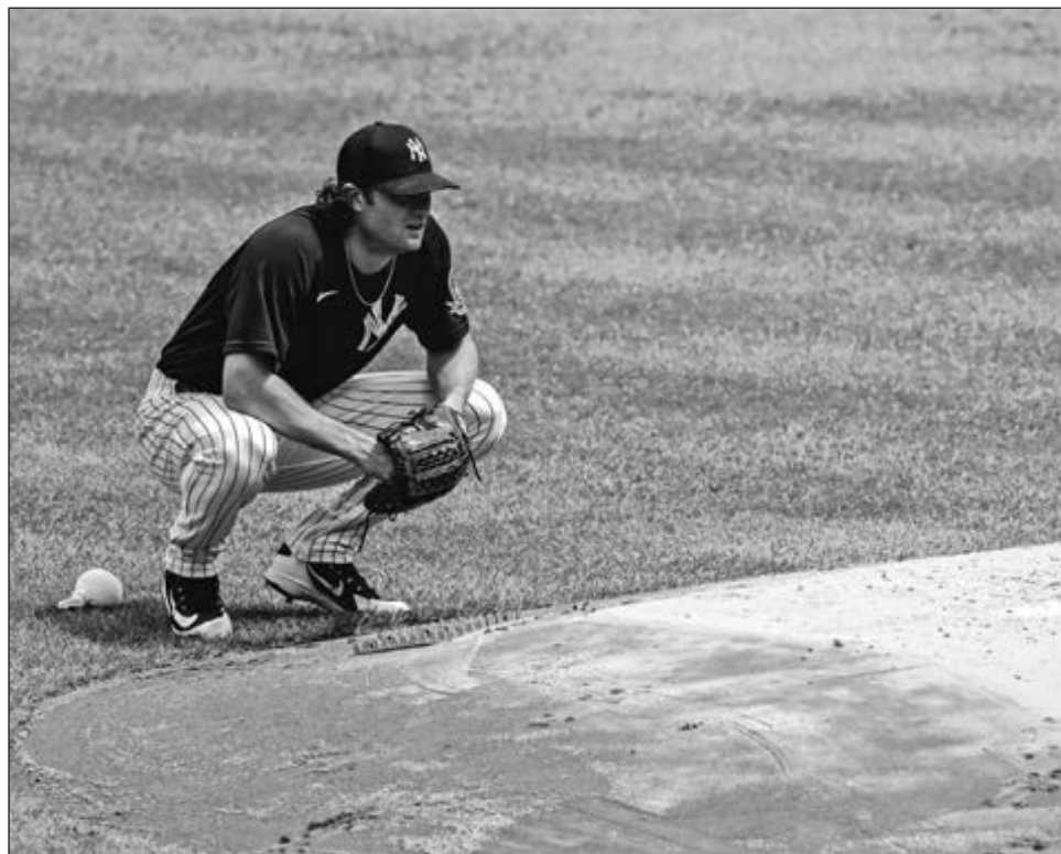
▲ El yanqui Gerrit Cole se alista para enfrentar a Max Scherzer y a los campeones Nacionales, en la noche inaugural, en Washington, el próximo día 23.

Según el mánager de los Yanquis, Aaron Boone, la recta de Cole lució mejor que en su primera salida del campamento de verano, sobre todo los pitcheos que estuvieron en la parte alta de la zona de straits. El timonel afirmó que Cole "probablemente" lance en