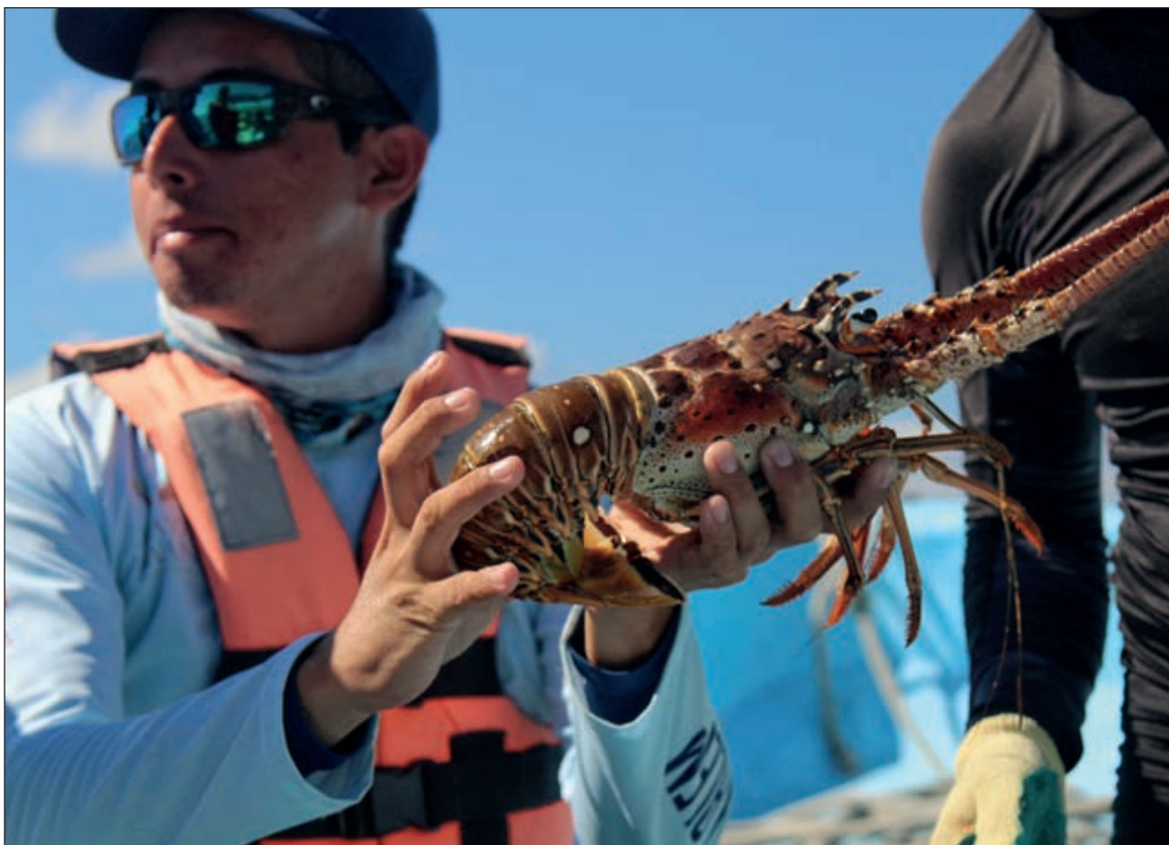
▲ Más del 90 por ciento de la langosta que se produce está dirigida al mercado de exportación y de hoteles y restaurantes.

“Si los mercados están colapsados, debemos empezar a pensar en opciones sustentables”: Comepesca