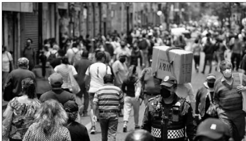
▲ Todos los sectores de la administración pública del país deben ser corresponsables para el tratamiento de la enfermedad y la información al respecto, dijo Olga Sánchez Cordero.

“Debe haber una corresponsabilidad muy clara para que se puedan tomar políticas y estrategias claras y precisas. Nosotros dependemos de la información que están subiendo las entidades federativas en estos temas”.