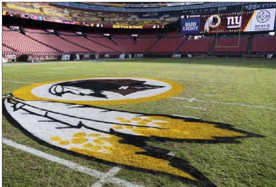
▲ El equipo de la NFL en Washington está por cambiar de nombre.

"Como un niño que creció (en el área de D.C), siempre serán #HTTR (las siglas del grito de batalla 'Hail to the Redskins') pero ansioso por lo que viene en el futuro", tuiteó el quarterback Dwayne Haskins.