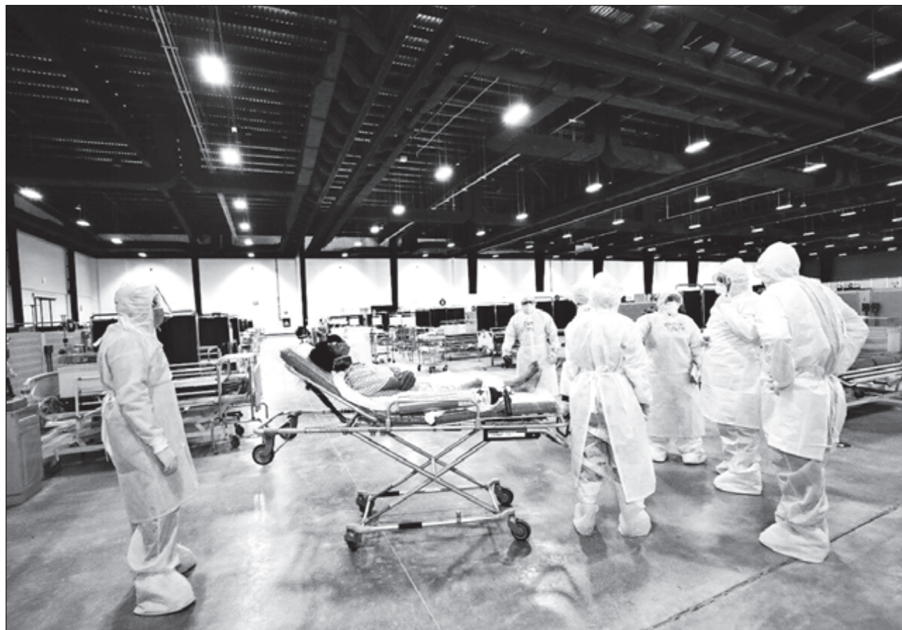
▲ El nosocomio habilitado recibirá únicamente pacientes que se encuentren en recuperación, remitidos de los hospitales COVID.

El nosocomio temporal recibió ayer a sus primeros dos pacientes, ambos hombres. El primero de 78 años, originario de Mérida, fue trasladado del Hospital Regional de Alta Especialidad de la Península de Yucatán (HRAEPY), que depende del gobierno federal, y el otro de 53 años, también de Mérida, llegó proveniente del Hospital General "Dr. Agustín O'Horán". En el transcurso del día llegaron más pacientes transferidos desde diferentes hospitales.