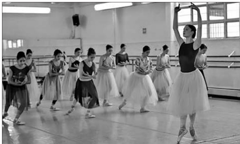
▲ Si el próximo año no resurgen los contagios, pensaremos en hacer montajes de gran formato, refirió el codirector de la Compañía Nacional de Danza.

"Planeamos los primeros pasos para cuando se pueda regresar a los salones; por