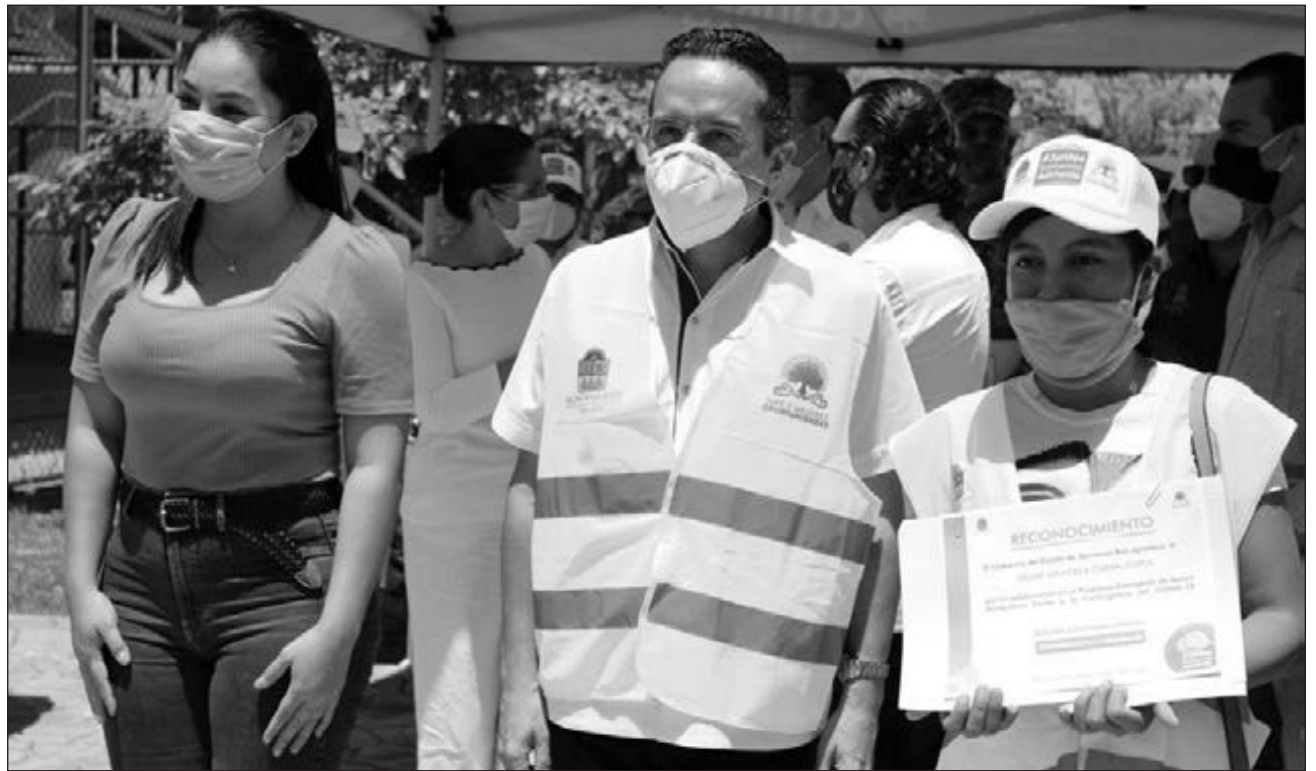
▲ Durante un recorrido por la Supermanzana 247, el gobernador Carlos Joaquín supervisó la implementación de los protocolos de sanidad en la entrega de alimentos.

Por la pandemia, en Quintana Roo se registraron 84 mil empleos perdidos