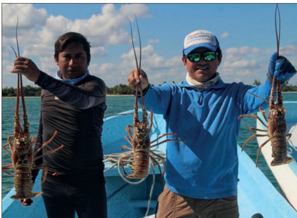
▲ El precio de la langosta viva ha caído significativamente en el transcurso de un año.

“El año pasado estaba a 350 pesos y este año la langosta viva está a 250. Los precios