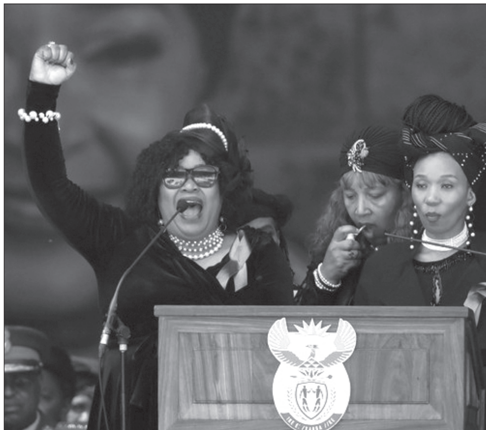
▲ Zindzi Mandela, militante anti-apartheid e hija menor de Nelson Mandela, falleció a los 59 años.