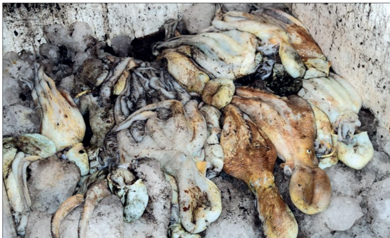
▲ La pesca de pulpo ha oscilado, en las últimas tres temporadas, entre 30 y 34 mil toneladas, de las cuales sólo el 30 por ciento se consume en el mercado nacional.

El también financiero de la Confederación Mexicana de las Cooperativas Pesqueras aseguró que otro ingrediente que se agrega a este oscuro pa-