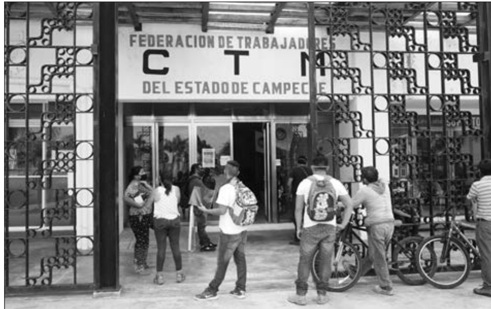
▲ En esta capital se formaron largas filas de aspirantes a trabajar en el Tren Maya, con riesgo de propagar el nuevo coronavirus.

Por ello mencionó que en reunión con comisarios municipales de algunos poblados y comunidades, resolvieron aumentar los puntos