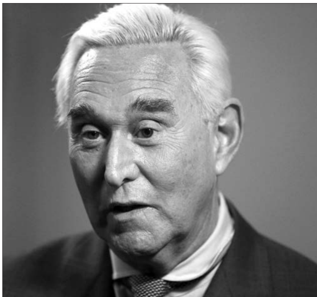
▲ Stone queda en una suerte de limbo jurídico, pues su culpabilidad no está a discusión. Simplemente es un criminal con permiso presidencial para permanecer en libertad.

El peligro evidente reside en la normalización de esta clase de acciones despóticas y abiertamente contrarias al espíritu de las leyes y de la justicia. El episodio, en suma, consolida la construcción, por parte de Trump, de una presidencia cínica.