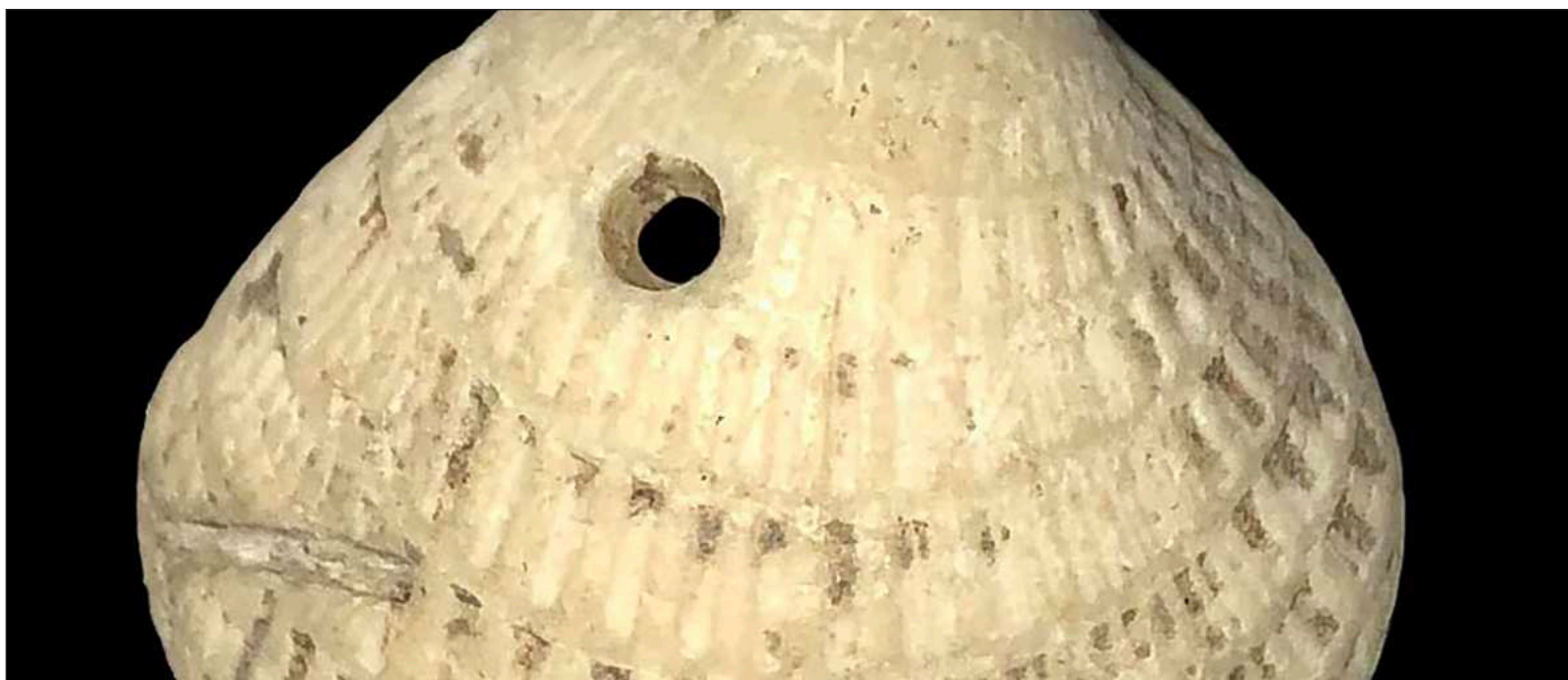
▲ “El análisis con microscopio revela uno de los secretos mejor guardados de los mayas”. En la imagen, concha marina con perforación cónica.

*Profesor investigador del Centro INAH Yucatán. cristian_hernandez@inah.gob.mx