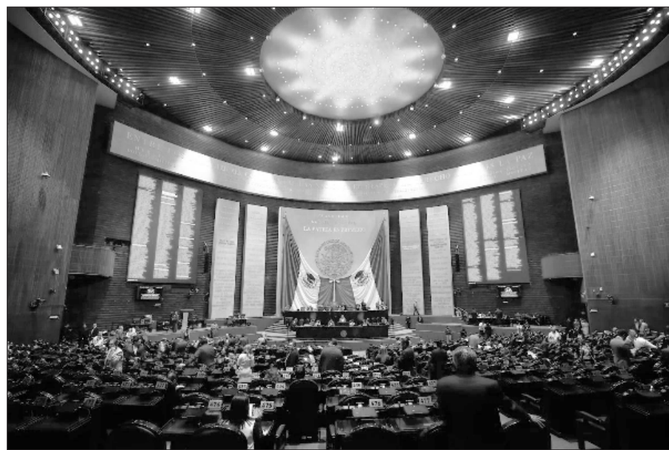
▲ Morena en San Lázaro realizó un desglose de las donaciones recibidas por grupos autorizados y los gastos que reportan. Según datos públicos del SAT, 63 por ciento de dichas organizaciones del país se dedican a actividades asistenciales.

En tanto, la SHCP registró aportaciones en especie por 47 mil 75 millones en territorio nacional, que se