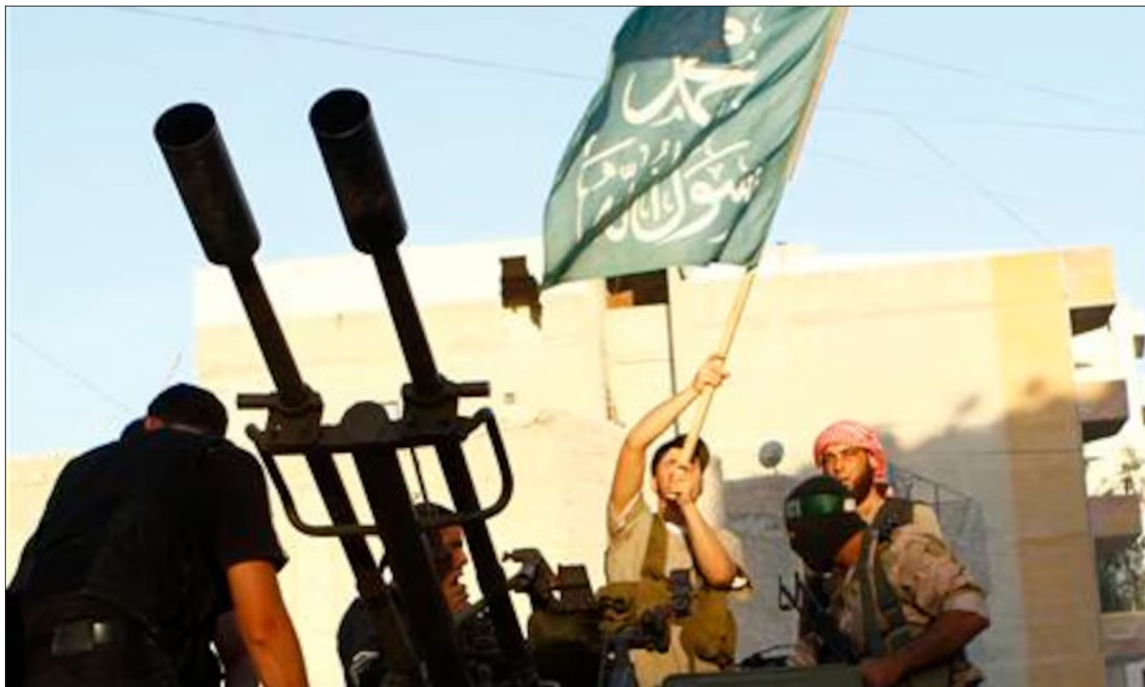
▲ Lafarge fomentó un sistema que prevía pagos para asegurar que los empleados y las mercancías pudieran pasar por los puestos de control.

Pese a los millones desembolsados, la fábrica de Jalabiya fue finalmente evacuada por Lafarge de forma urgente y en la más absoluta imprevisión el 18 de septiembre de 2014, ante el avance del EI. Al día siguiente, cayó en manos de los yihadistas.