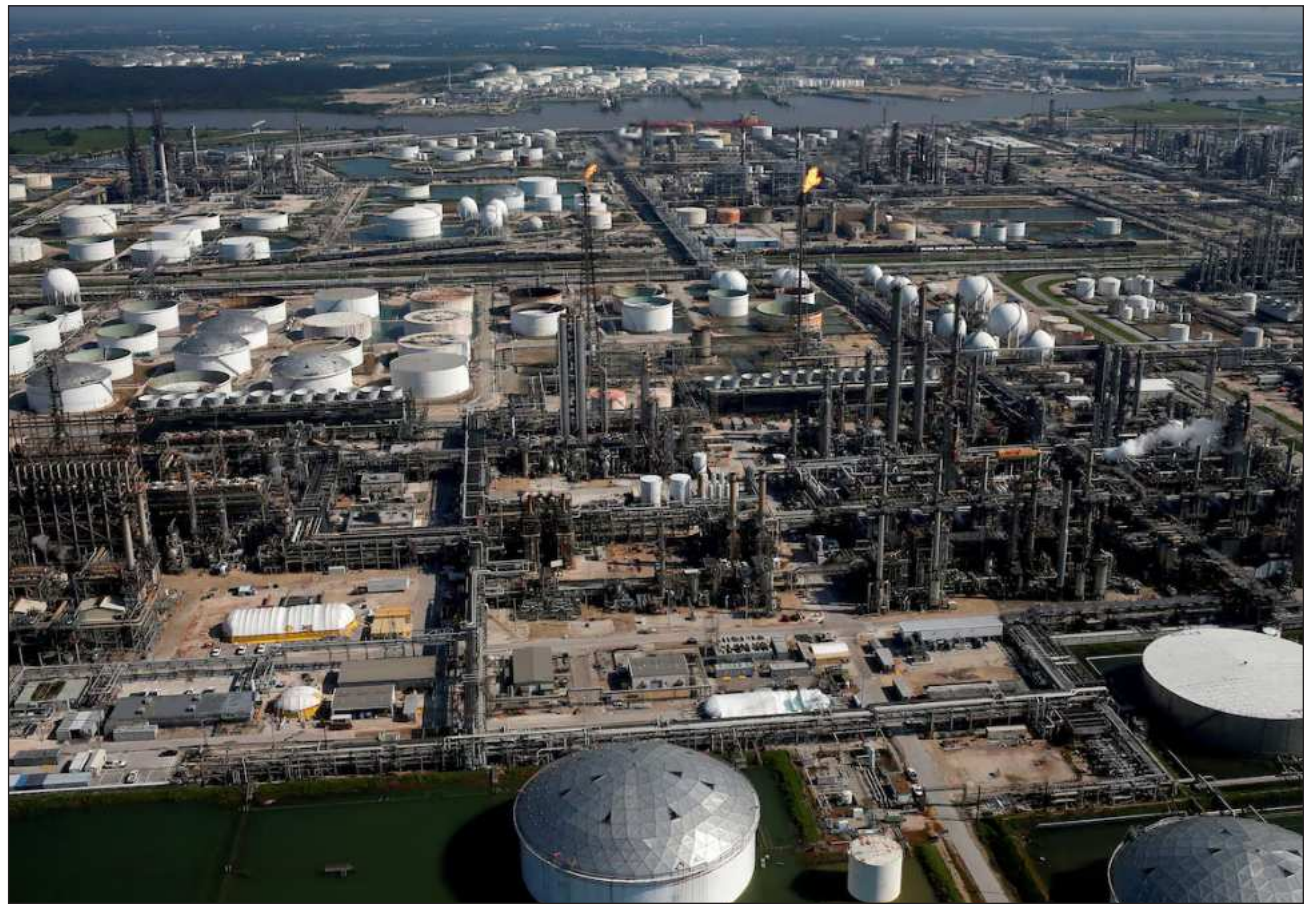
▲ Pemex destacó en su comunicado que mantiene estrecha comunicación con la Guardia Costera de los Estados Unidos (USCG por sus siglas en inglés), y actualmente no hay impacto en el canal de navegación.

Asimismo, apuntó que mantiene comunicación con la Guardia Costera de Estados