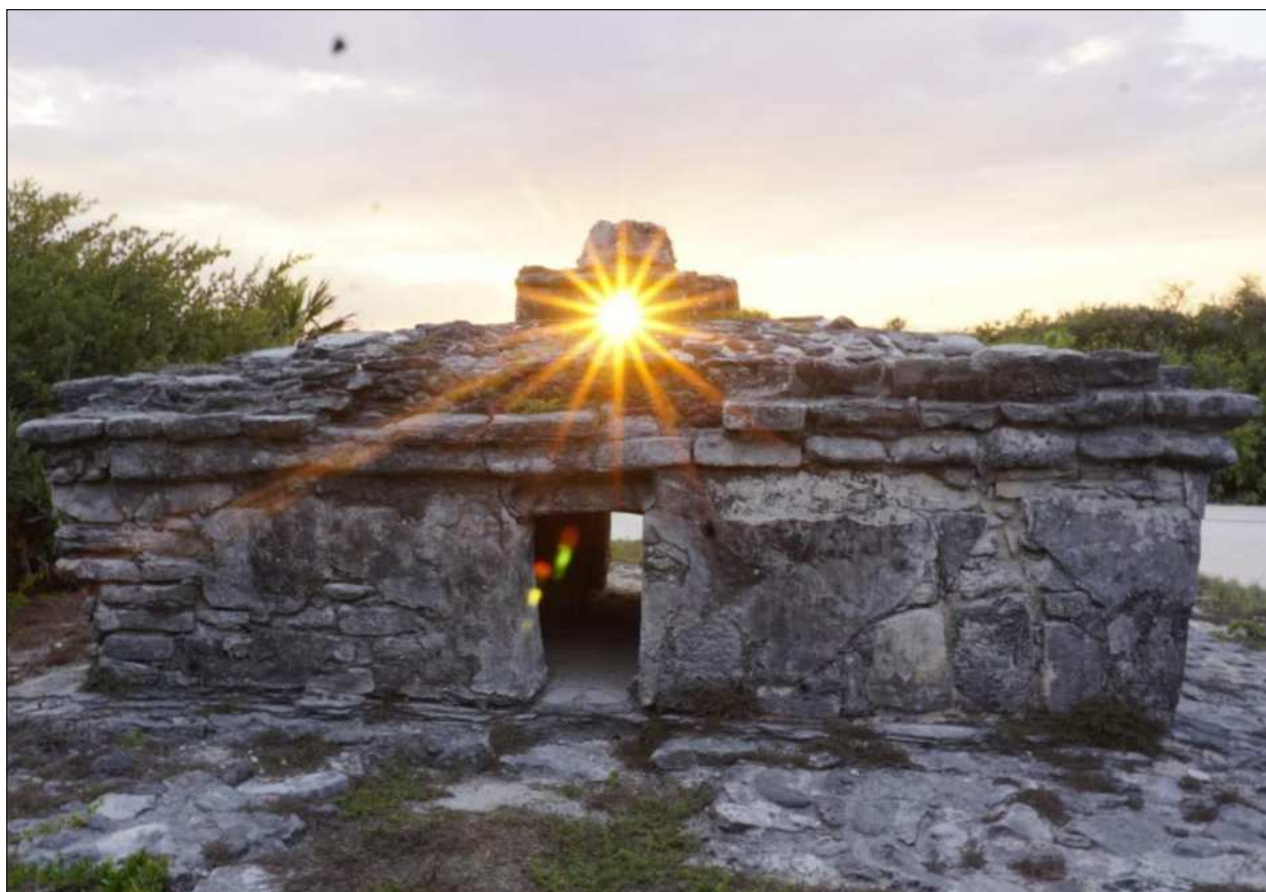
▲ La FPMC invita a la comunidad a participar en el evento arqueoastronómico que se registrará la tarde del próximo jueves 16 de abril a las 18 horas en el vestigio maya conocido como El Caracol, ubicado en el Parque Ecoturístico Punta Sur.