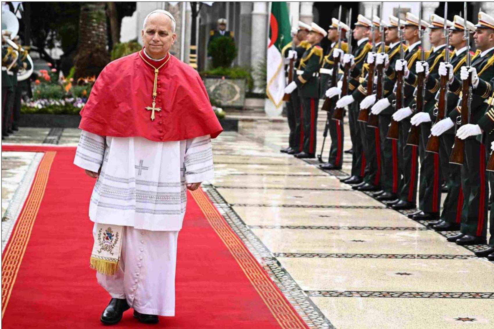
▲ “El papa León XIV, primer estadounidense en ser nombrado pontífice en la historia, quien en su primer discurso al cuerpo diplomático el 9 de enero de 2026, abogó por una ‘paz desarmada y desarmante’”.

En realidad, el discurso del papa (con el embajador estadounidense ante el Vaticano presente) fue demolidor con el gobierno de Trump, sin citarlo formalmente: “En nuestro tiempo, la debilidad del multilateralismo es motivo de especial preocupación a nivel internacional. La diplomacia que promueve el diálogo y busca el consenso entre todas las partes está siendo sustituida por una diplomacia basada en la fuerza, ya sea por parte de individuos o de grupos de aliados. La guerra vuelve a estar de moda y el entusiasmo bélico se extiende. Se ha roto el principio establecido tras la Segunda Guerra Mundial, que prohibía a los países utilizar la fuerza para violar las fron-