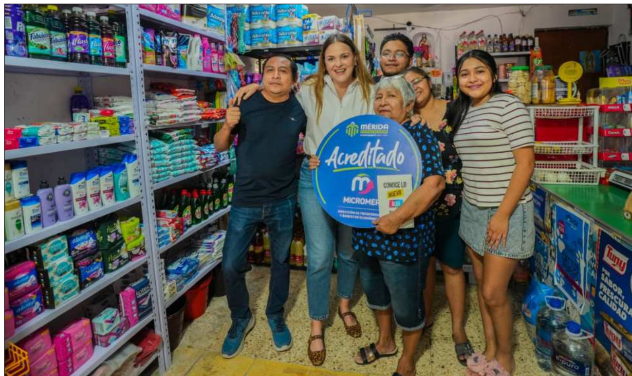
▲ Para acceder a los créditos, antes se requería más documentación; actualmente, con la agilización de procesos y simplificación de requisitos bastará con presentar el pago del predial del año en curso.