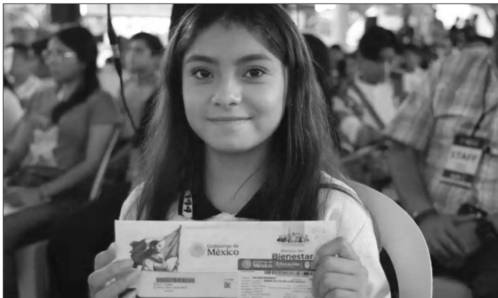
▲ Los pagos se depositarán directamente en la tarjeta del Banco del Bienestar.

Por su parte, la beca Jóvenes Escribiendo el Fu-