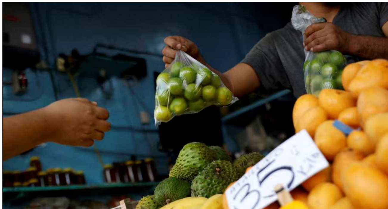
▲ Las líneas de pobreza extrema por ingresos superó la inflación general anual (4.59%), al ubicarse 3.4 y 3.5 puntos porcentuales por encima en el ámbito rural y urbano, respectivamente.

En ambos ámbitos, el incremento se explica por el incremento del jitomate