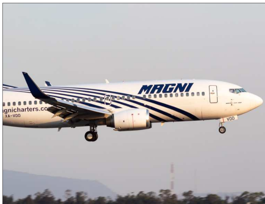
▲ Magnicharters, propiedad de Grupo Aéreo Monterrey S.A., tiene la obligación de resolver la situación creada, tras abandonar a miles de pasajeros en distintos aeropuertos.