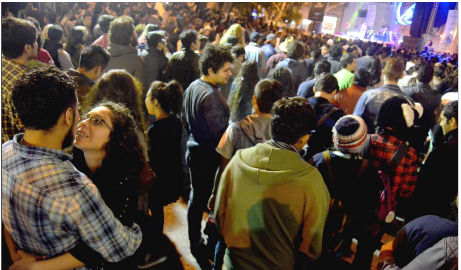
▲ "Finlandia encabeza la lista como el país con el mayor índice de felicidad. Costa Rica se ubica en cuarto lugar. México descendió dos lugares".