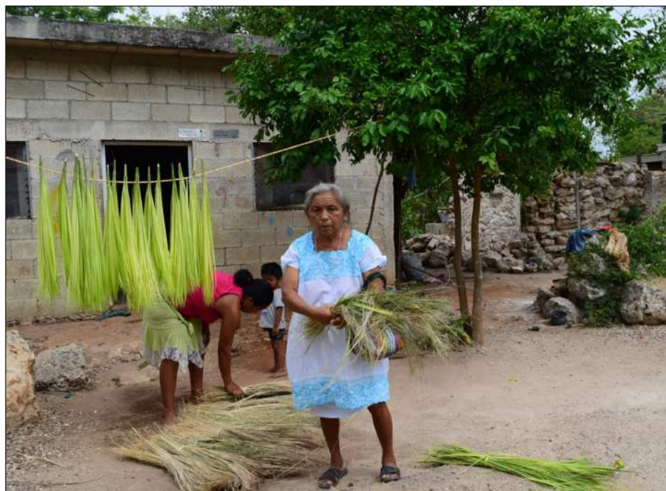
▲ Los ejidos y comunidades rurales representan 50.7 por ciento del territorio nacional

Es “preocupante”, dice, que a poco más de 30 años de la reforma al artículo 27 Constitucional y la promulgación de la Ley Agraria, la explotación de intereses privados, la corrupción, la falta de erario público, descoordinación institucional,