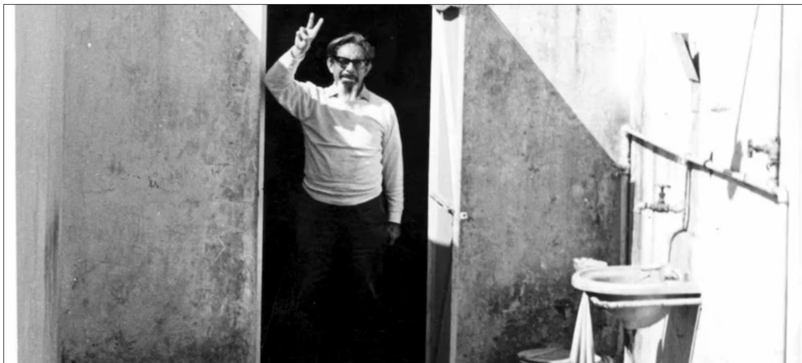
▲ "Revueltas murió viviendo, tal como únicamente pueden hacer quienes vienen a este mundo envueltos en cenizas."