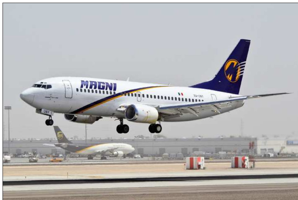
▲ El compromiso de las autoridades estatales es permanecer en el sitio de los hechos hasta que la problemática se resuelva por completo para cada viajero.

En busca de soluciones, relató, mantuvo una comunicación constante con el secretario de Infraestructura Comunicaciones y Transportes a nivel federal, y ella acudió de manera inmediata al aeropuerto a localizar a los pasajeros, porque incluso no se contaban con listas para saber quiénes son y cómo localizarlos.