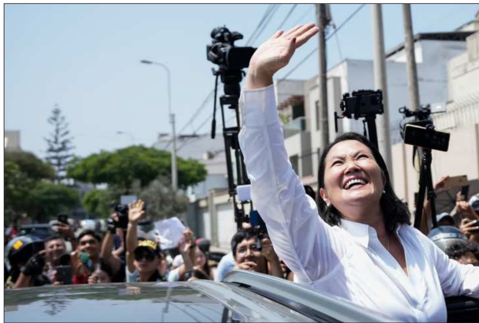
▲ Según el último conteo, Fujimori encabeza la votación, con 16,94% de los votos.

Así como en estos lugares de Lima, la votación se extendió en forma excepcional este lunes en mesas de votación en los consulados