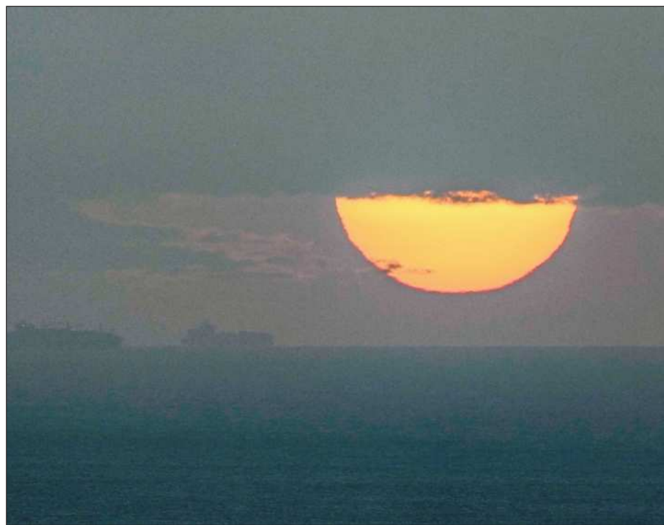
▲ El anuncio del bloqueo volvió a disparar los precios del petróleo en todo el mundo.

“Hemos recibido una llamada de la otra parte. Les gustaría llegar a un acuerdo.