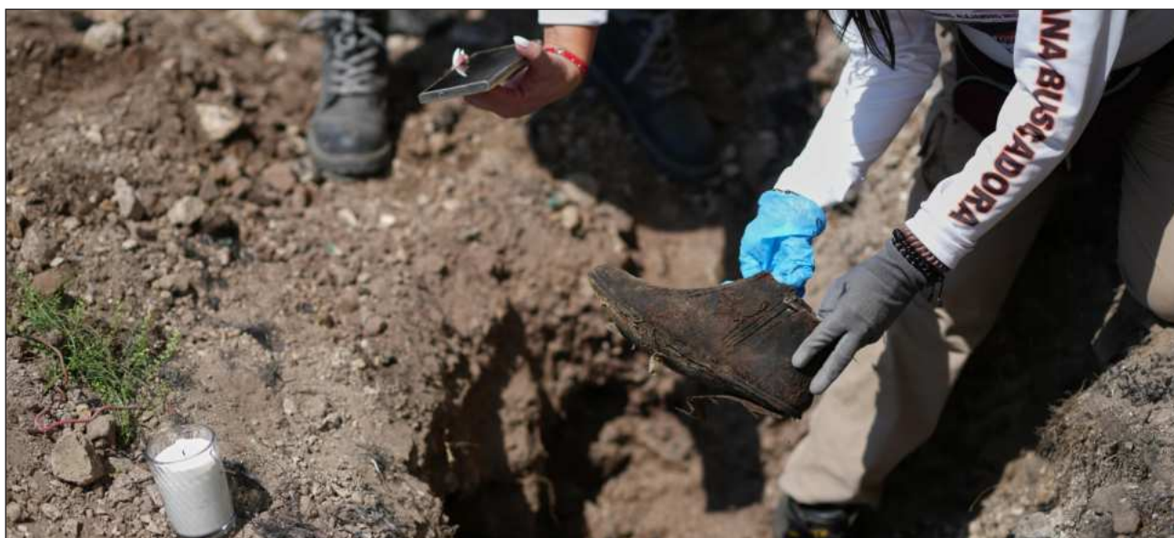
▲ La presidenta Claudia Sheinbaum comentó en su conferencia que le van a explicar al Alto Comisionado de la ONU todo el conjunto de acciones para apoyar a las familias, para buscar una atención integral del problema, buscar la justicia y alcanzar la verdad.

SEP proyecta inversión histórica en becas, más de un billón de pesos al 2030