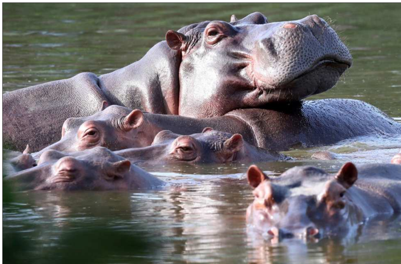
▲ Los hipopótamos colombianos tienen malformaciones debido a la endogamia, como una registrada en su boca, de acuerdo con la ministra de Ambiente del país, Irene Vélez. Campañas de sacrificio y esterilización son difíciles y caras, agregó.

Los hipopótamos colombianos tienen malformaciones debido a la endogamia, como una registrada en su boca, según Irene Vélez.