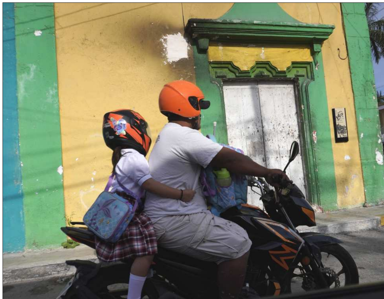
▲ Las autoridades consideran que la participación de los padres de familia en las actividades de vigilancia y seguridad, permiten conocer a tiempo la presencia de personas inusuales en las instalaciones educativas.

Este lunes, durante la revisión de los planteles