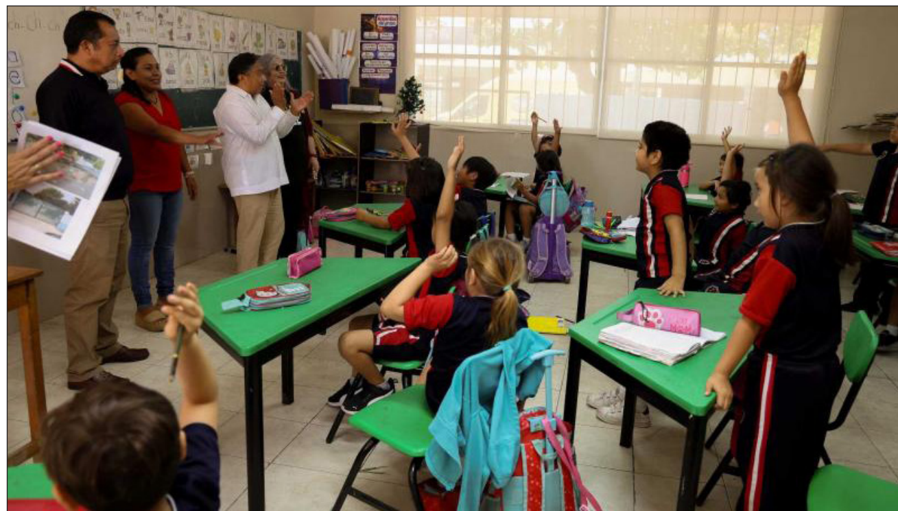
▲ En total, 3 mil 730 escuelas de Educación Básica y 463 planteles de Educación Media Superior retomaron actividades en todo el estado, garantizando la continuidad de los procesos educativos de niñas, adolescentes y jóvenes.

Durante el periodo de receso escolar, se realizaron