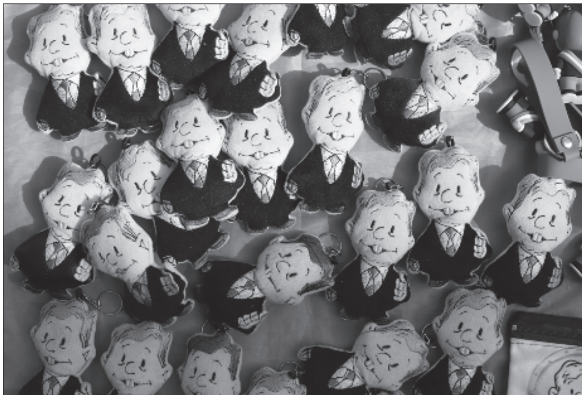
▲ "Esta circunstancia obliga a que muchas de las decisiones que pone en marcha el ejecutivo, o que proponen los órganos legislativos, terminan por desencadenar procesos que acaban en las salas de la SCJN".

Por otra parte, esta circunstancia obliga a que muchas de las decisiones que pone en marcha el ejecutivo, o que proponen los órganos