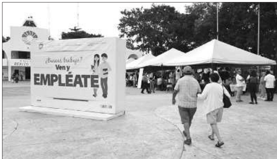
▲ El programa Ven y Empléate se ha convertido en una estrategia que beneficia tanto a las empresas como a los buscadores de empleo.

En el último año el sector inmobiliario ha incrementado su demanda de trabajadores