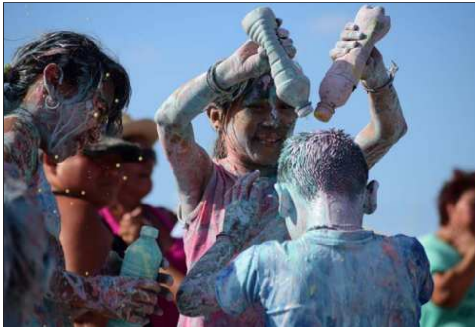
▲ Cronista de la ciudad señaló que antes ocurrían batallas campales entre barrios tradicionales, mientras que este martes la población apenas comenzó a juntarse por la tarde.

Resaltó que poco a poco la malicia de algunas perso-