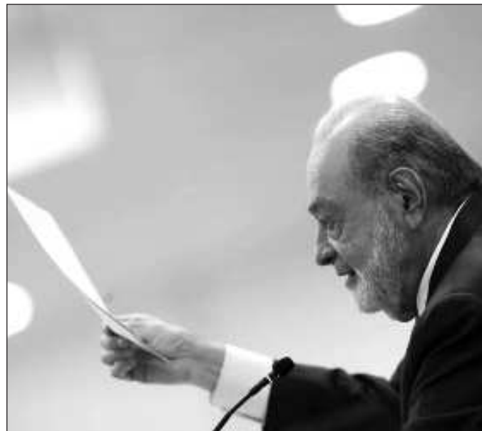
▲ Difícilmente podrá decirse que Slim ha llamado a “la cargada”, pero es una voz a la que todos los empresarios escuchan atentamente.

El reconocimiento de que existen diferencias entre el