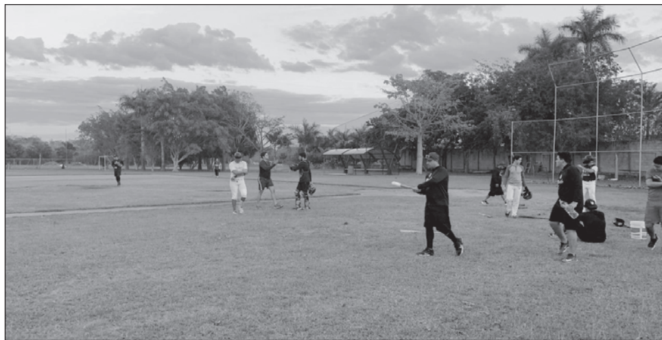
▲ El campo de la Universidad Modelo, donde harán pretemporada los Leones, durante una práctica de la novena de esa institución que compite en la Liga Meridana.