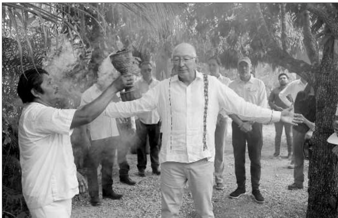
▲ El embajador Ken Salazar reconoció que A'aktun Jaleeb encarna la visión y los resultados que busca Alianza Mundo Maya México, porque las personas de la comunidad brindan una experiencia integral que va más allá del ecoturismo.