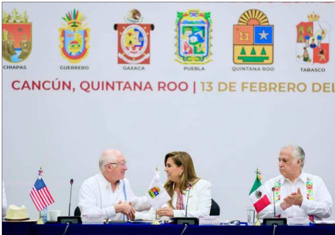
▲ Al Octavo Encuentro de Gobernadoras y Gobernadores del Sur Sureste y la Embajada de EU, que se llevó a cabo en Cancún, acudió Miguel Torruco, titular de la Sectur, en representación del presidente Andrés Manuel López Obrador.

Este memorándum de entendimiento, propuesto por la gobernadora de Quintana Roo, Mara Lezama Espinosa, y firmado en conjunto con gobiernos de Veracruz, Guerrero, Tabasco, Oaxaca, Puebla, Chiapas, Campeche y Yucatán, permite concretar avances en crecimiento y desarrollo económico, seguridad, educación, inclusión social y medio ambiente con el gobierno de EU a través de su embajada en México.