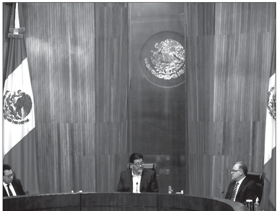
▲ Reyes Rodríguez fue forzado a renunciar a la presidencia del Tribunal Electoral del Poder Judicial de la Federación, por exigencia de tres de sus cuatro colegas.

De tal manera, añadió el depuesto presidente, la legitimidad de las y los juzgadores es una que se construye, día a día, mediante el ejercicio de la función jurisdiccional.