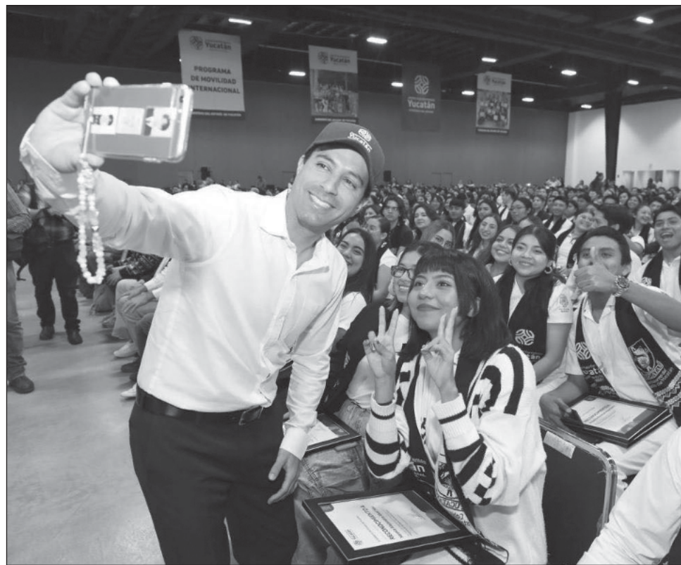
▲ La mayoría de los 500 beneficiados por el Programa de Movilidad Internacional 2024 son mujeres y jóvenes que habitan en el interior del estado.

“Estamos dirigiendo en la modalidad de posgrados, más de medio millón de pesos por cada uno de los 5 estudiantes, y yo siempre digo que no estamos gastando sino invirtiendo en lo más preciado que tenemos, que es nuestro capital humano y nuestros jóvenes, quienes son los que van a construir el futuro de Yucatán en los próximos 20 o 30 años y esta es la mejor inversión que